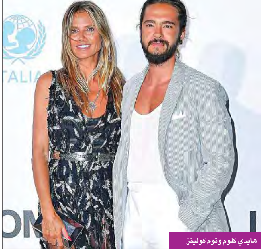
هايدي كلوم وتوم كوليتز

الجديد توم كولينز، كما حضرت الحفل أيضاً النجمة نيكول شيرزينغر وميشال رودريغيز وغيرهن. وحققت ريتا أورا قفزة نوعية في أعمالها خلال الأعوام الثلاثة الماضية، وشهدت أغنياتها رواجاً كبيراً وكلياتها نسب مشاهدة مرتفعة جداً. وكانت أورا قد بدأت الغناء في سن صغيرة جداً، وفي عام 2004 ظهرت في الفيلم الإنكليزي «Spivs»، ومن ثم بدأت تظهر في الحفلات الموسيقية، إلى جانب فنانين مشهورين أمثال كريغ ديفيد، تينشي سترابندر، وجايمس موريسون، ولاحقاً