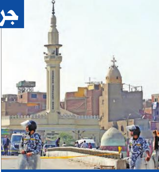
شريطان في محيط كنيسة العذراء بشبرا امس الأول

أثار مقتل الأنبا إبيفانيوس، رئيس دير الأنبا مقار بوادي النطرون، جلاً عما يدور داخل الكنيسة المصرية، وهيجه هذا الحادث خلافات كانت قد خفتت برحيل الأنبا متى المسكين عام 2006، حيث كان الأنبا القليل إبيفانيوس لتلميذه الأقرب، وواجه انتقادات حادة من قبل غالبية المتنمذفين داخل الكنيسة المصرية بسبب ذلك. واعتقد البعض أن الخلاف الفكري بين البابا شنودة الثالث، والأب متى المسكين انتهى، برحيلهما، إلا أنه لم يرحل معهما، فهو خلاف بين نهجين أحدهما تحديدي والأخر محافظ، وربما واقعة مقتل الأنبا إبيفانيوس نتيجة لبعض ما حدث أثناء ذلك الخلاف الذي امتد لنحو 40 عاماً. ويمثل فكر متى المسكين خطأ إصلاحياً متميزاً ومعايير غالب الخط الكنسي الأرثوذكسي السائد، على خلاف باقي جيله ومنهم زميله، آنذاك، الأنبا شنودة. ومنذ عام 1954 حتى نهاية السبعينيات