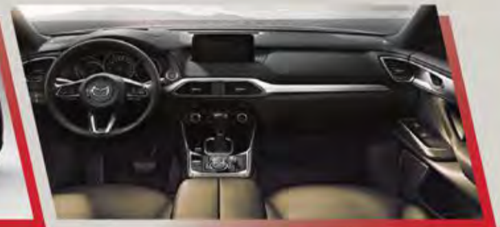
مقصورة رحبة غاية في الفخامة