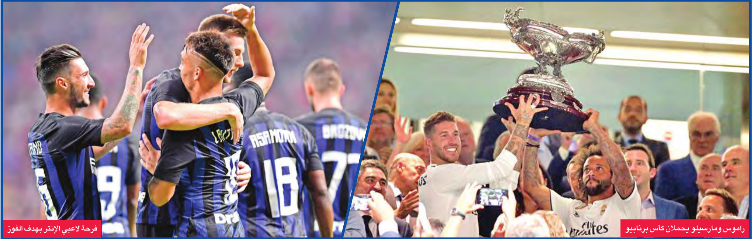
فرحة لاعبي الإنتر بهدف الفوز