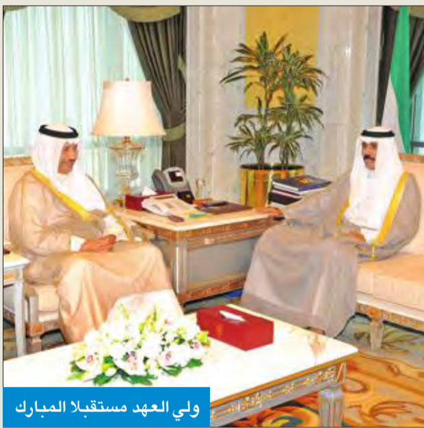
ولي العهد مستقبلاً المبارك

استقبل سمو ولي العهد الشيخ نواف الأحمد بقصر السيف، صباح أمس، رئيس مجلس الوزراء سمو الشيخ جابر المبارك. واستقبل سموه أيضاً نائب رئيس مجلس الوزراء وزير الخارجية الشيخ صباح الخالد، ثم نائب رئيس مجلس الوزراء وزير الداخلية وزير الدفاع بالإنابة الشيخ خالد الجراح. كما استقبل سمو ولي العهد الشيخ سالم العبدالعزير.