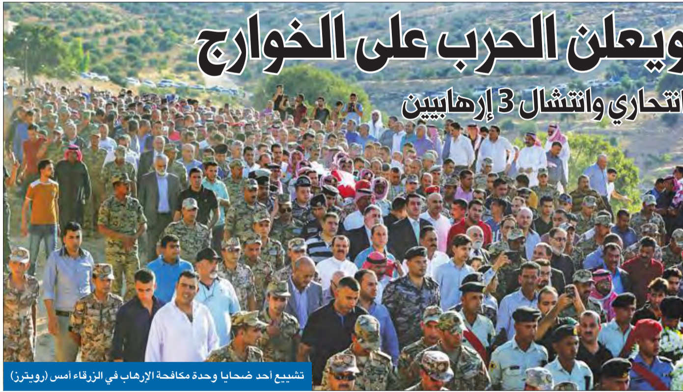
تشجيع احد ضحايا وحدة مكافحة الإرهاب في الزرقاء أمس

مقتل 5 من الشرطة وهدم مبنى فجره انتحاري وانتشال 3 إرهابيين