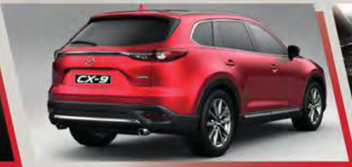
تصميم فريد بخطوط عصرية