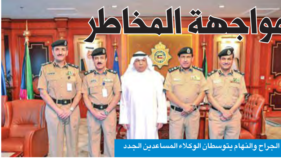
الجراح والنهام يتوسطان الوكلاء المساعدين الجدد

وأضاف أن رجال الأمن هم العيون الساهرة على أمن هذه الأرض الطيبة، والدرع الواقية في مواجهة التحديات والمخاطر والتصدي لكل من تسول له نفسه العبث بأمن البلاد، متمنيا لهم التوفيق والنجاح في أداء المسؤوليات المنوطة بهم. وبدورهم، أعرب الوكلاء عن تقديرهم للثقة السامية، معاهدين الله أن يكونوا على العهد والولاء والانتماء للقيادة السياسية العليا، وعلى استمرار الجهود لرفع شأن الكويت وشعبها الوطني.