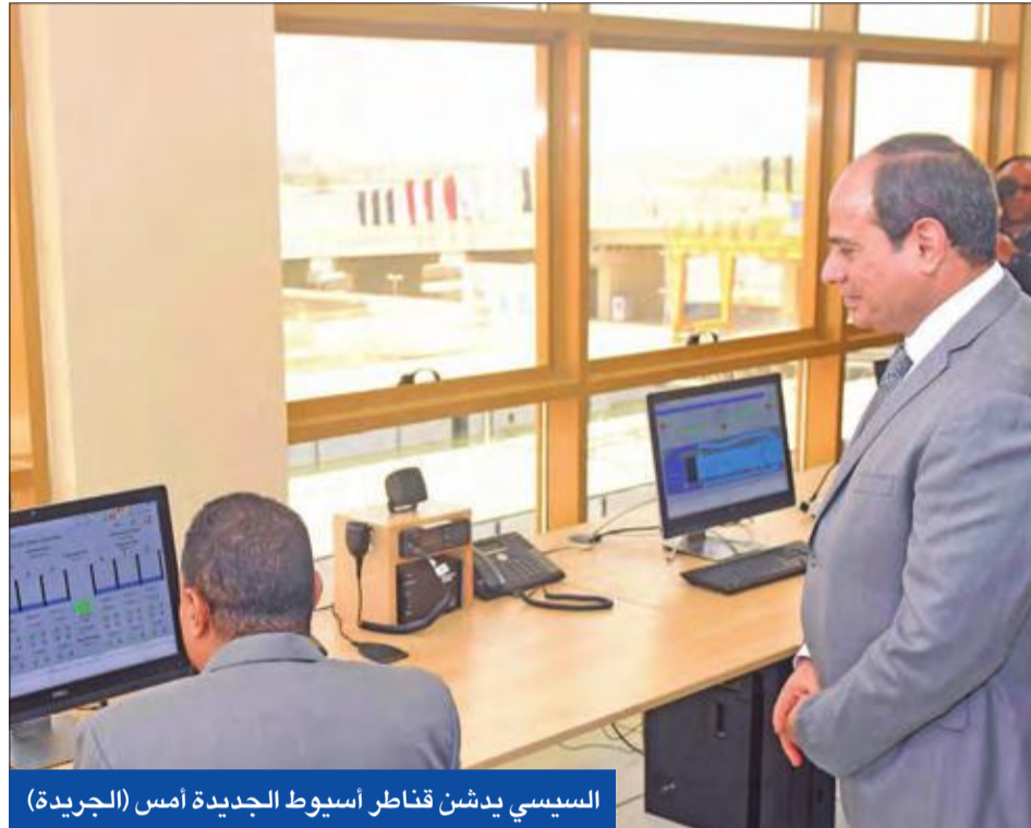
السياسي يفتتح قناطر أسبوط الجديدة أمس

وأكدت وزارة التعليم العالي والبحث العلمي صدور قرار رسمي بمنع الاختلاط في الجامعات المصرية، مع بداية العام الدراسي الجديد 2018/2019 وتخصيص 3 أيام للبنين و3 أيام للبنات في الأسبوع. وأوضح الوزير أن تلك الأنباء غير صحيحة على الإطلاق، وأكدت أنه لم يصدر أي قرار رسمي من الوزارة أو المجلس الأعلى للجامعات خاص بمنع الاختلاط البنين والبنات وتخصيص أيام معينة لحضور كل منهما للجامعة. وذكرت أن الجامعات المصرية ملتزمة بالأعراف والتقاليد الجامعية المعمول بها عالميا، ويتم التعامل الفوري من جانب رؤساء الجامعات مع أي خروج عن الأعراف الجامعية.