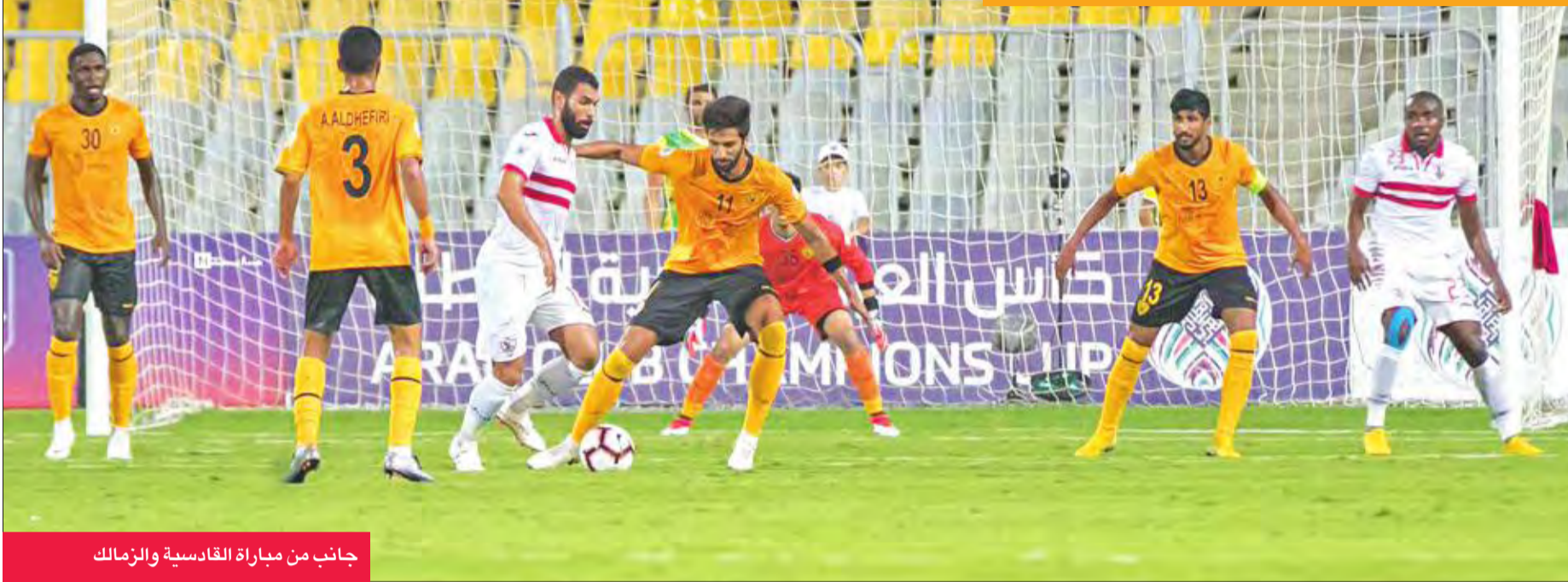
جانب من مباراة القادسية والزمالك