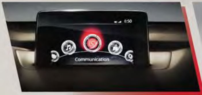
شاشة عرض معلومات تعمل باللمس