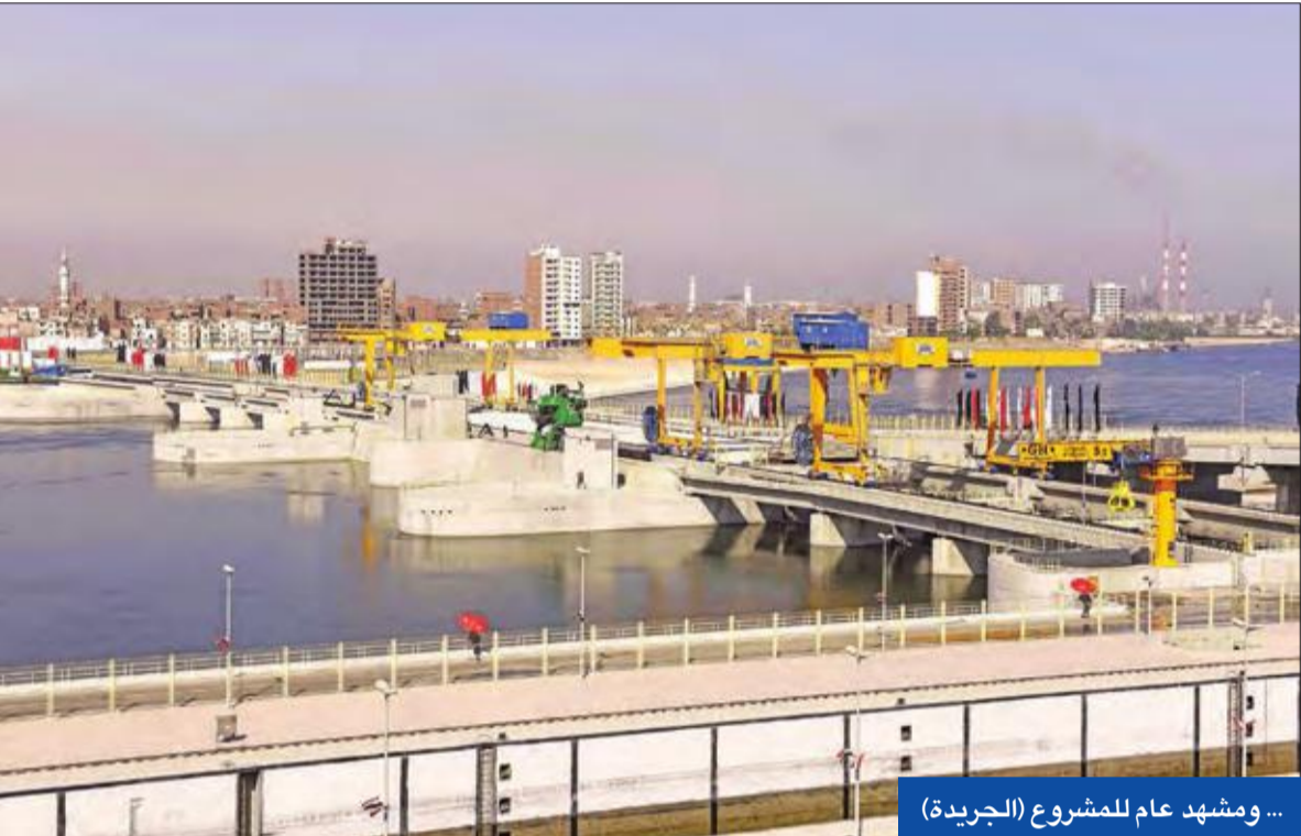
... ومشهد عام للمشروع (الجريدة)

وأكدت وزارة التعليم العالي والبحث العلمي صدور قرار رسمي بمنع الاختلاط في الجامعات المصرية، مع بداية العام الدراسي الجديد 2018/2019 وتخصيص 3 أيام للبنين و3 أيام للبنات في الأسبوع. وأوضح الوزير أن تلك الأنباء غير صحيحة على الإطلاق، وأكدت أنه لم يصدر أي قرار رسمي من الوزارة أو المجلس الأعلى للجامعات خاص بمنع الاختلاط البنين والبنات وتخصيص أيام معينة لحضور كل منهما للجامعة. وذكرت أن الجامعات المصرية ملتزمة بالأعراف والتقاليد الجامعية المعمول بها عالميا، ويتم التعامل الفوري من جانب رؤساء الجامعات مع أي خروج عن الأعراف الجامعية.