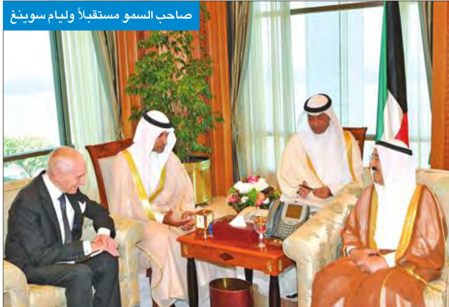
صاحب السمو مستقبلاً وليام سوينغ

استقبل صاحب السمو أمير البلاد الشيخ صباح الأحمد بقصر السيف، صباح أمس، سمو ولي العهد الشيخ نواف الأحمد.