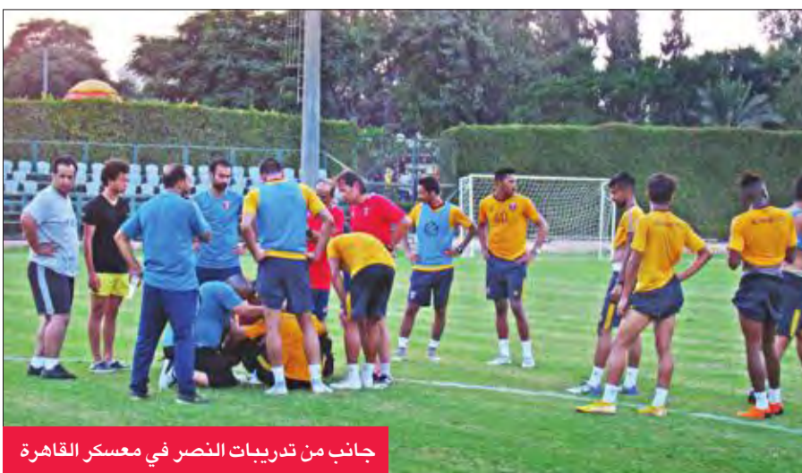
جانب من تدريبات النصر في معسكر القاهرة