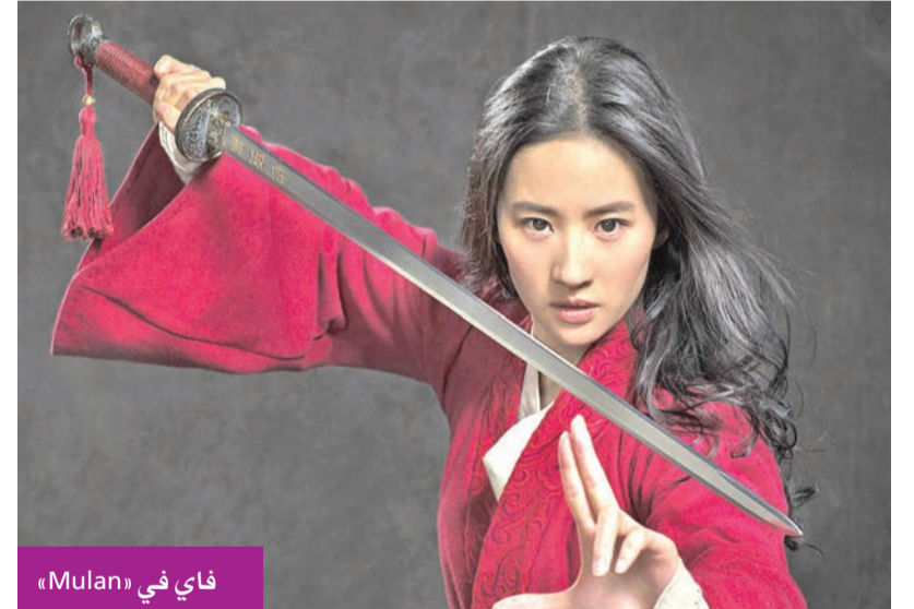
فاي في «Mulan»

من المقرر أن يمثل الممثل التركي كيفانوش تاليتوغ أمام القضاء، بسبب شكوى ضده متعلقة بكلبه. وفي تفاصيل القضية، أن مواطناً تركيا قام برفع شكوى ضد كيفانوش، بعد أن نشر الأخير صورة له برفقة كلبه، من فصيلة "بيتبول" الممنوعة في تركيا. وأثارت صورته هذه ردود فعل سلبية تجاهه، ما اعتبره البعض تحدياً منه للقوانين التركية التي تحرم إدخال هذه الكلاب إلى البلد أو بيعها أو حتى تربيتها منزلياً، لأنها من أشرس الأنواع وأكثرها خطورة. وبحسب صحيفة "Takvim" التركية، فإن مقدم الشكوى اعتبر أن كيفانوش خالف القانون، وتستوجب معاقبته بمصادرة الكلب، ودفع الغرامة المالية التي ينص عليها القانون.