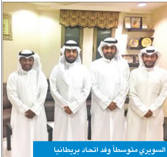
السوري متوسطاً وفد اتحاد بريطانيا

نظراً لما في ذلك من تحقيق مصلحة جموع الطلبة الكويتيين الدارسين في المملكة المتحدة، لاسيما أننا جميعاً نعرف مدى ما وصلت إليه تكاليف المعيشة هناك من ارتفاع كبير جداً جعل غالبية الطلبة يعانون الضغوطات المالية عليهم.