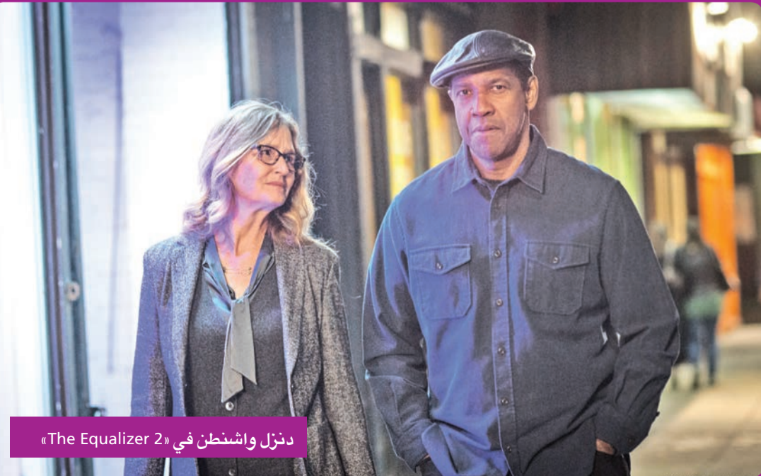
دنزل واشنطن في «The Equalizer 2»

أبدى الممثل الأميركي السينمائي الشهير دنزل واشنطن تفهمه لإعلان نجم هوليوود روبرت ريدفورد «81 عاماً اعتزاله التمثيل». وقال واشنطن، البالغ من العمر 63 عاماً في تصريحات صحافية: «إنك مضطر لفعل ذلك، فإذا لم تذهب بنفسك لن يكون وجودك مؤثراً... سأعزل التمثيل في سنه أيضاً». وكان ريدفورد أعلن أخيراً اعتزاله التمثيل عقب صدور فيلمه الحركي الكوميدي الجديد «الرجل العجوز والسلاح».