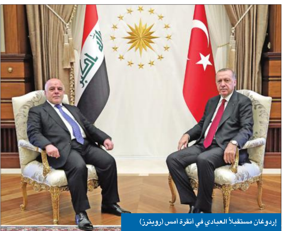
إردوغان مستقبلاً العبادي في أنقرة أمس

لعل الأشهر الثلاثة الماضية كانت أصعب فترة مرت على رئيس الحكومة العراقية حيدر العبادي، إذ انتقل من موقع القائد المنتصر في حرب كبيرة على تنظيم داعش، إلى فائز ثالث في انتخابات مايو، ثم إلى رجل مغضوب عليه بشدة في تظاهرات لم تتوقف منذ يوليو الماضي؛ احتجاجاً على نقص الطاقة والفساد الإداري والركود الاقتصادي، لكنه يسترجع اليوم شيئاً من التضامن الشعبي، بسبب موقف أثار غضب الإيرانيين في ملف العقوبات الأميركية. وانشغل العراقيون طوال الأيام الماضية بموقف العبادي الصريح، الذي أعلن خلاله الالتزام الكامل بالعقوبات الجديدة ضد إيران، وتوقف البنك المركزي العراقي عن ضخ ملايين الدولارات التي