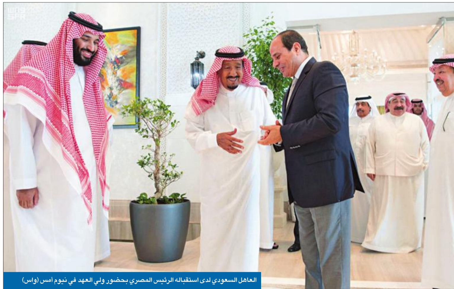
العاهل السعودي لدى استقباله الرئيس المصري بحضور ولي العهد في نيوم أمس (واس)

وتزامناً مع تفقد وزير الداخلية رئيس لجنة الحج الأمير عبدالعزيز بن نايف جاهزية القطاعات المشاركة في مهمة أمن الحج، كشف أمير مكة رئيس لجنة الحج المركزية الأمير خالد الفيصل أرقاماً جديدة حول موسم الحج وأعداد الحجاج، مشيراً إلى التعامل مع 87 مكتباً من المكاتب الوهمية المخالفة لللائحة.