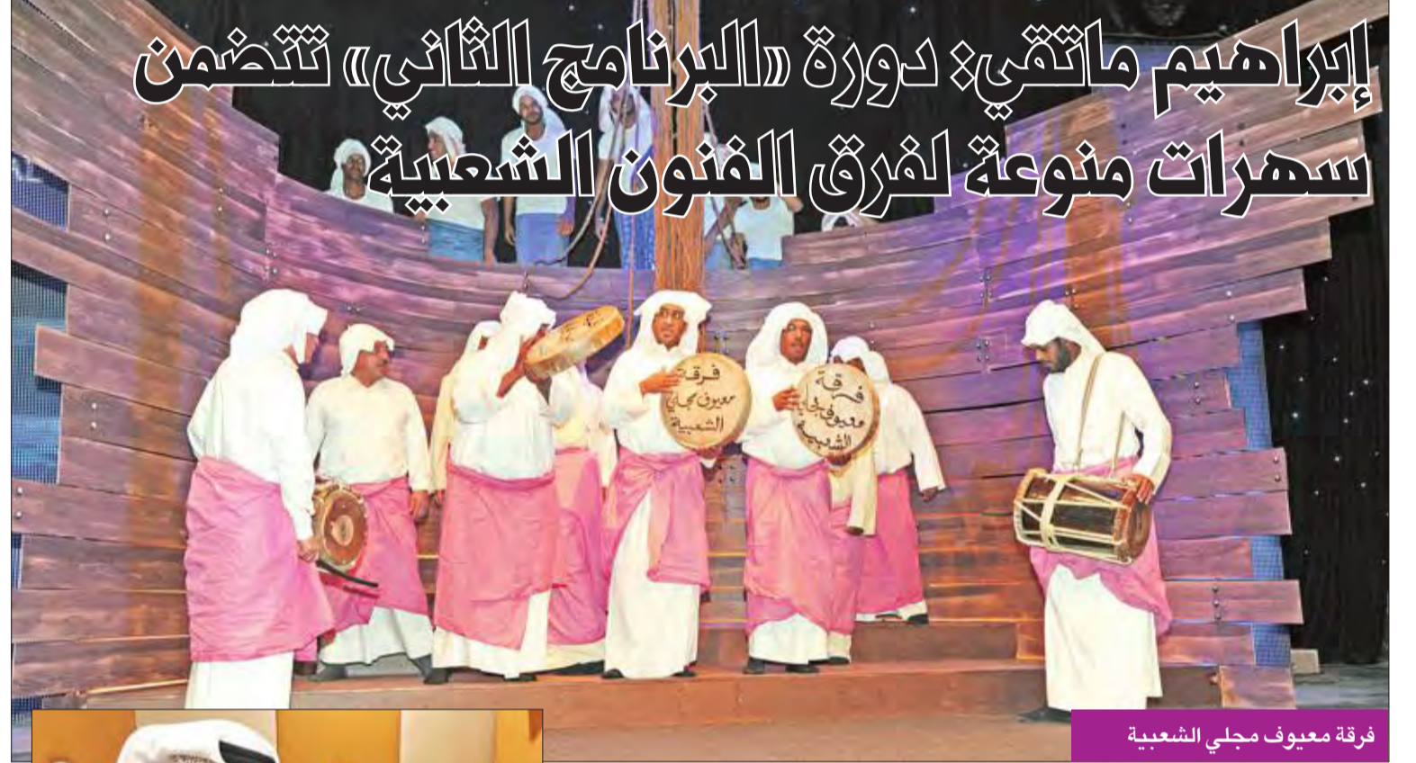
فرقة معيوف مجلي الشعبية

نجاح جديد يُضاف إلى مسيرة الفنانة نانسى عجرم، حيث فاز فيديو كليب «ومعك» بجائزة عالمية جديدة كأفضل عمل غنائي مصور، في مهرجان Queen Palm International Festival، بعد منافسة بين كليات لأهم النجوم العالميين. وكان فيديو كليب «ومعك» تم اختياره رسمياً كأفضل عمل مصور بين 30 فيديو كليب على مستوى العالم في مهرجان «Clipped Music Video Festival» في أستراليا، كما تصدر قائمة «أفضل عمل مصور»، وحصدت عنه المخرجة ليلي كنعان على جائزة «أفضل مخرجة» في مهرجان «International Music Video Competition» في الولايات المتحدة الأمريكية. يُذكر أن أغنية «ومعك» من كلمات محمد رفاعي، الحان محمد يحيى، وتوزيع هادي شرارة، والكليب من إخراج ليلي كنعان.