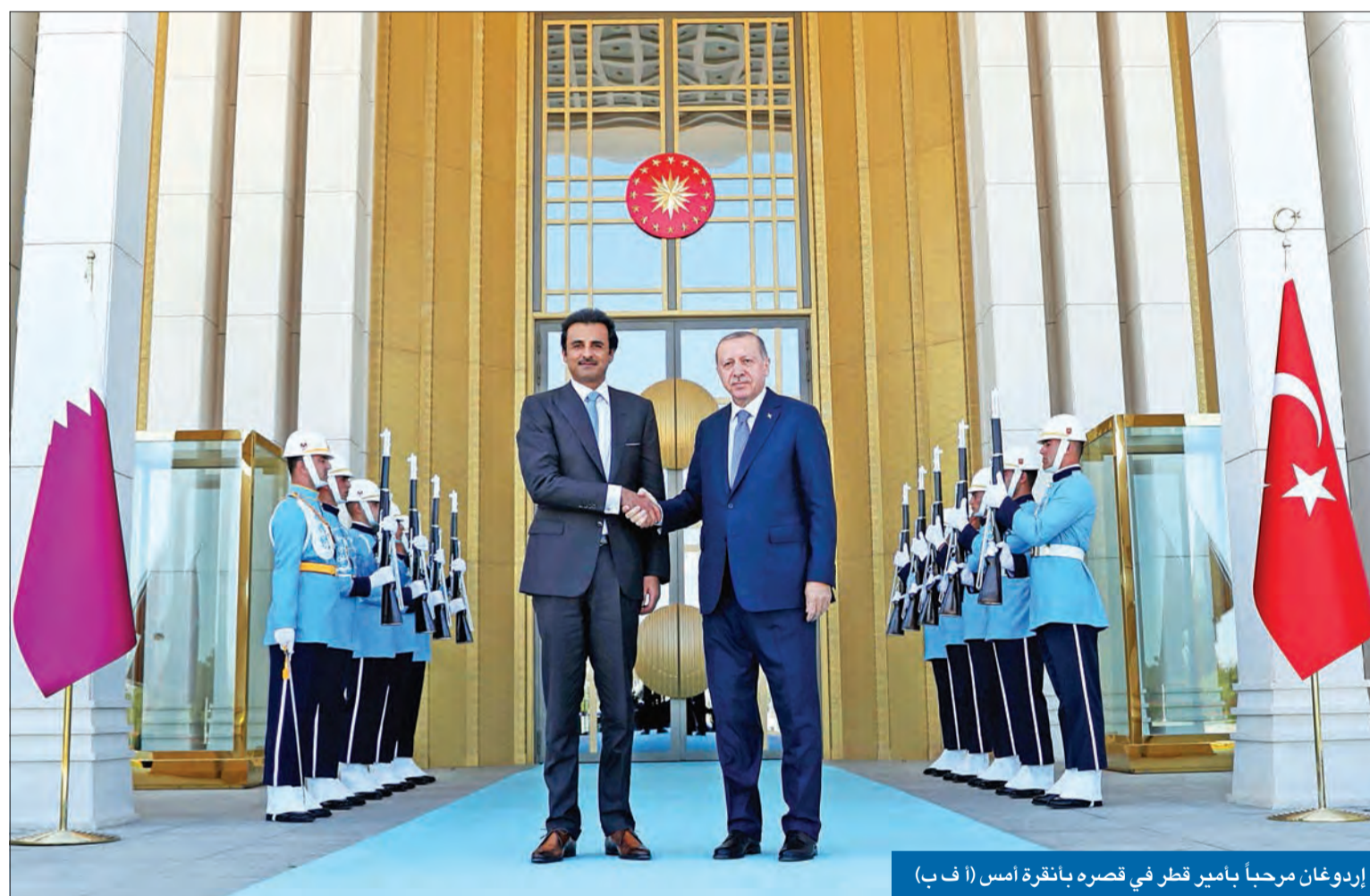
إردوغان مرحباً بأمير قطر في قصره بأنقرة أمس (أ ف ب)

أنقرة ترد على العقوبات الأميركية وترفض إطلاق القس... وترامب مُحبط