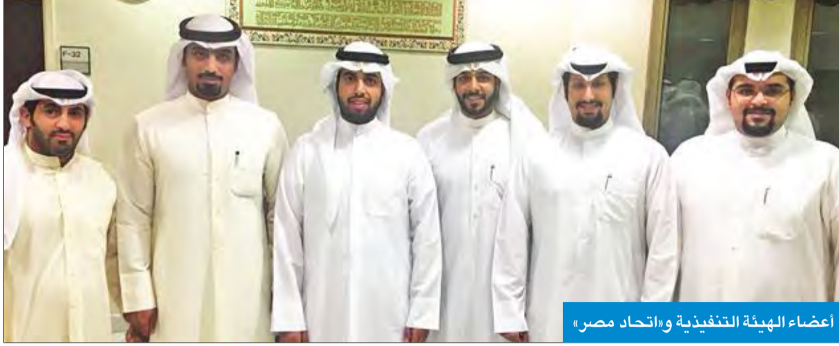
أعضاء الهيئة التنفيذية و«اتحاد مصر»

الرشيدي: توحيد الجهود بشأن القضايا الطلابية المشتركة في الأفرع