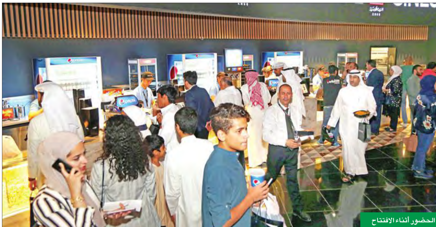
الحضور أثناء الافتتاح

على ريادة قطاع صناعة السينما والترفيه في دولة الكويت والخليج العربي.