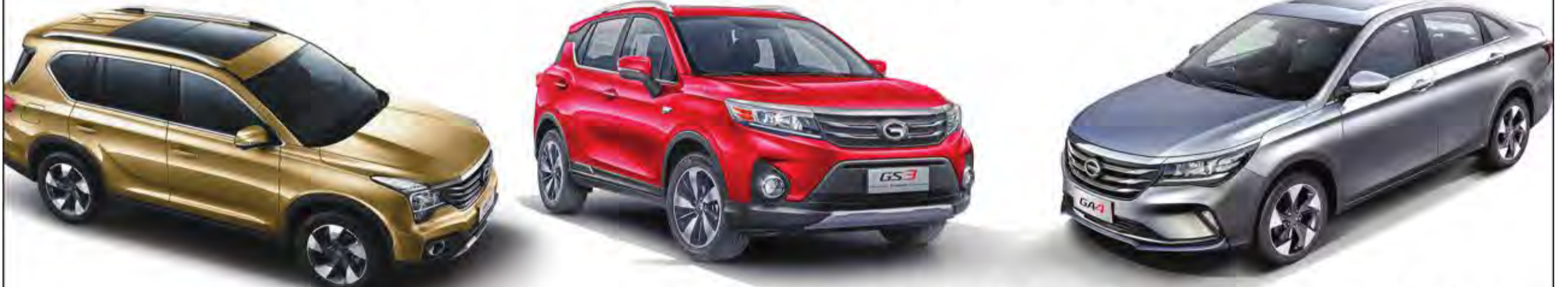
موديلات جديدة ستطرح في المنطقة قريباً GS3, GA4, GS7, GM8