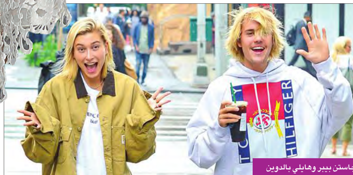
جاستن بيبير وهايلى بالدوين

انتشرت في الآونة الأخيرة شائعات عن تدهور العلاقة بين المغني جاستن بيبير وعارضة الأزياء هايلى بالدوين، وتضاربت الأخبار حول مصير هذه العلاقة التي توثقت عقب إعلان الخطبة في يوليو الماضي. وفي هذا الإطار، أكدت تقارير إعلامية أن علاقة الثنائي منتهكة ومستقرة بنسبة كبيرة، بينما تؤكد تقارير أخرى اقتراب إعلان انفصال هايلى بالدوين وجاستن بيبير.