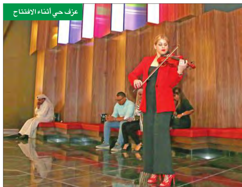
عزف حي أثناء الافتتاح

«سينسكيب» المنتشرة في أنحاء دولة الكويت، وهي إضافة تربة إلى عالم الترفيه بـ «الكوت مول» والواقع ضمن مشروع الكوت في منطقة الفحيحيل. وتوفر «سينسكيب الكوت مول» تسع صالات جديدة كلياً تحتضن 1586 مقعداً، إضافة إلى مقاعد «Premium» المصممة لتوفير أعلى درجات الراحة والرفاهية، علاوة على