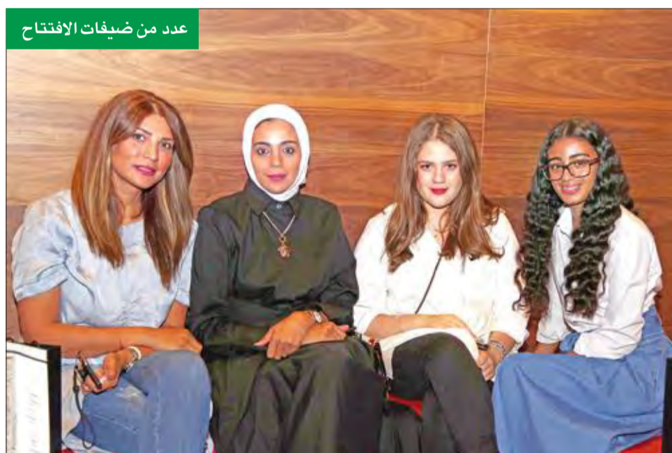
عدد من ضيفات الافتتاح

العلامة التجارية الجديدة تساهم في تطوير استراتيجية الشركة