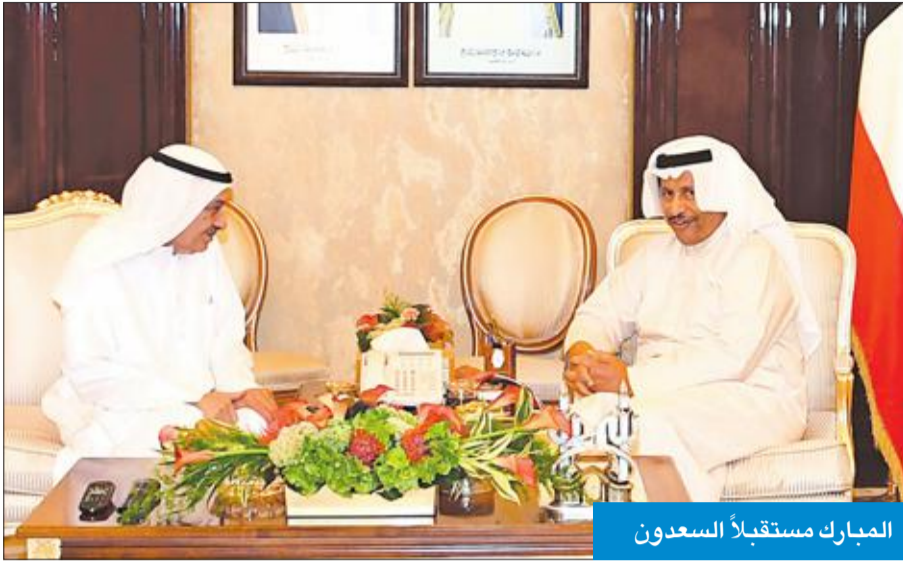
المبارك مستقبلاً السعدون

استقبل رئيس مجلس الوزراء سمو الشيخ جابر المبارك، في قصر بيان، أمس، الباحث الفلكي عادل السعدون، حيث أهدى إلى سموه نسخاً من إصداراته «موسوعة الأوائل الكويتية» و«قرية الشعبية» وكتاب «الجامع اللطيف في علم البحر» للنوخذة محمد المرزوق.