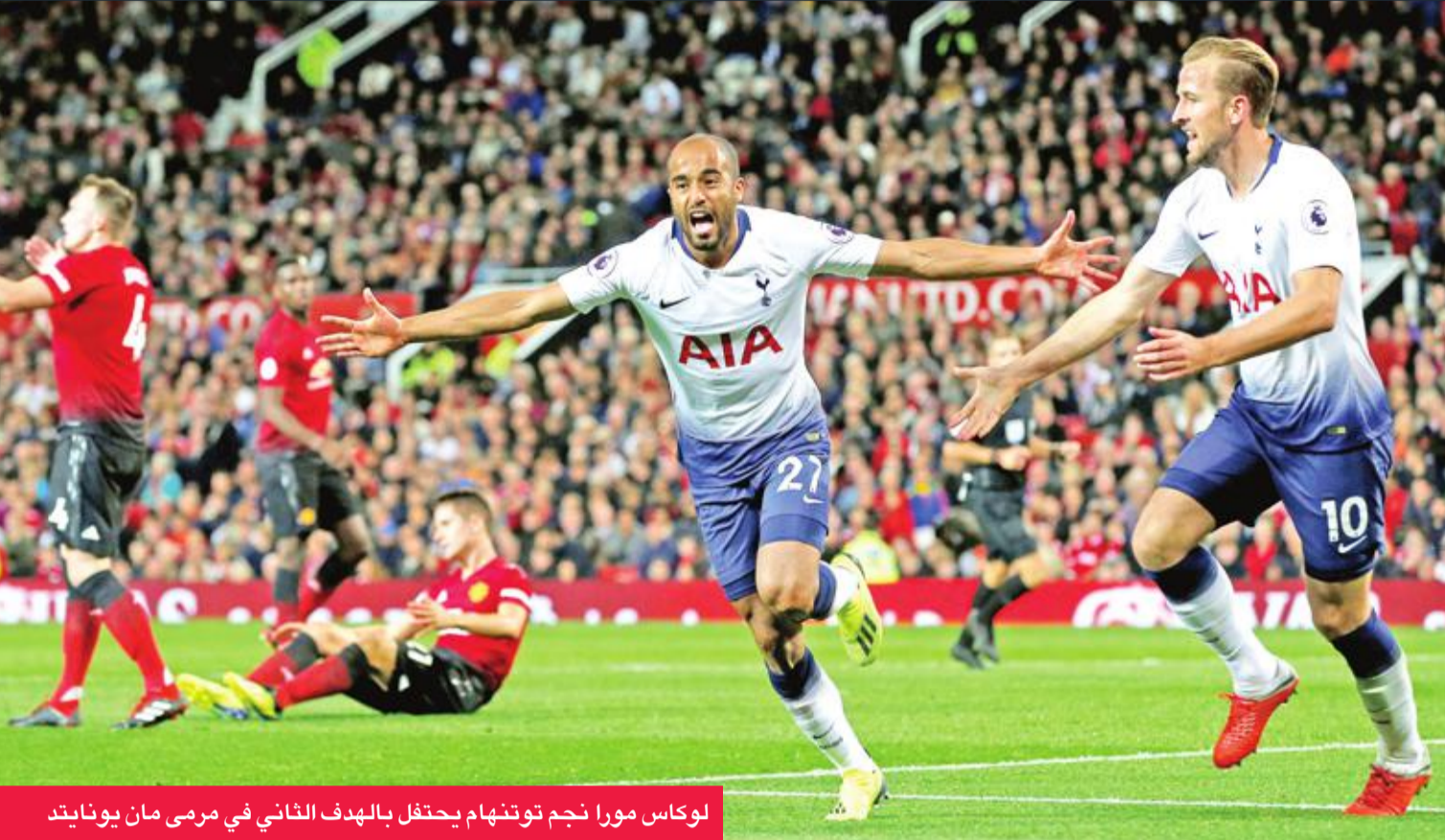
لوكاس مورا نجم توتنهام يحتفل بالهدف الثاني في مرمرى مان يونايتد

دك توتنهام هوتسبر، أمس الأول، شباك مضيفه مانشستر يونايتد الإنجليزي بثلاثية نظيفة على ملعبه أولد ترافورد في ختام المرحلة الثالثة من الدوري الإنجليزي الممتاز لكرة القدم، مكمدا إياه خسارته الثانية تواليا ومشرا باب الأسئلة حول أزمة النادي ومدربه البرتغالي جوزيه مورينيو. وكند توتنهام، الذي فشل في التسجيل في زيارته الأربع الأخيرة إلى أولد ترافورد، مورينيو أقسى خسارة له على أرضه في مختلف المسابقات (بحسب شركة "أوبتا" للأحصاءات الرياضية)، ليزيد من معاناة المدرب الذي يخوض موسمه الثالث مع الشياطين الحمر.