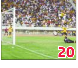
بداية «منطقية» لـ «المنار»