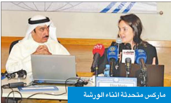
ماركس متحدثاً أثناء الورشة

عقد مشروع الهجرة العادلة الإقليمي في الشرق الأوسط، التابع لمنظمة العمل الدولية، بالتعاون مع وكالة «كونا»، أمس، ورشة عمل لتدريب الصحفيين على إعداد تقارير متخصصة عن قضايا اليد العاملة الوافدة، بدعم من الوكالة السويسرية للتنمية والتعاون. وأكدت الخبيرة الفنية في مشروع الهجرة العادلة في الشرق الأوسط -المكتب الإقليمي للشرق الأوسط لمنظمة العمل الدولية إيزاب ماركس، في كلمة لها خلال افتتاح الورشة، تعزيز أوجه التعاون مع الكويت، ومنها التواصل مع الصحافة الكويتية وتوضيح سبل عمل المنظمة. وقالت ماركس إن من مهام منظمة العمل الدولية تعزيز العمل وحقوق العاملين وخلق فرص العمل لهم وضمان حقوق العمالة، كذلك توسيع حماية العمالة في العالم. وأوضحت أنه من الضروري مخاطبة أرباب العمل وكذلك العاملون الوافدون من خلال