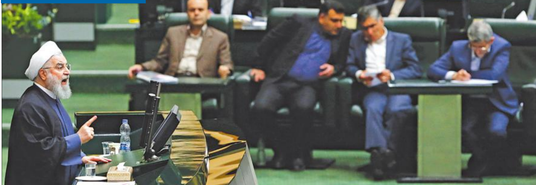
روحاني يفند استجوابه أمس (بي بي سي)

ضغط على القضاة لعرقلة تحالف المعتدلين... وإغراق السوق بعملة مزيفة