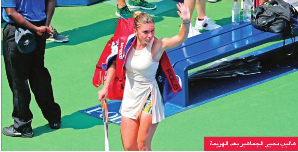
هاليب تحيي الجماهير بعد الهزيمة

على حساب الصربي نوفاك ديوكوفيتش، وقال: «هذا أمر رائع! المرة الأخيرة التي لعبت فيها هنا كانت في المباراة النهائية لنسخة 2016. وكنت أعرف جيداً أنني سأخوض مباراة صعبة».