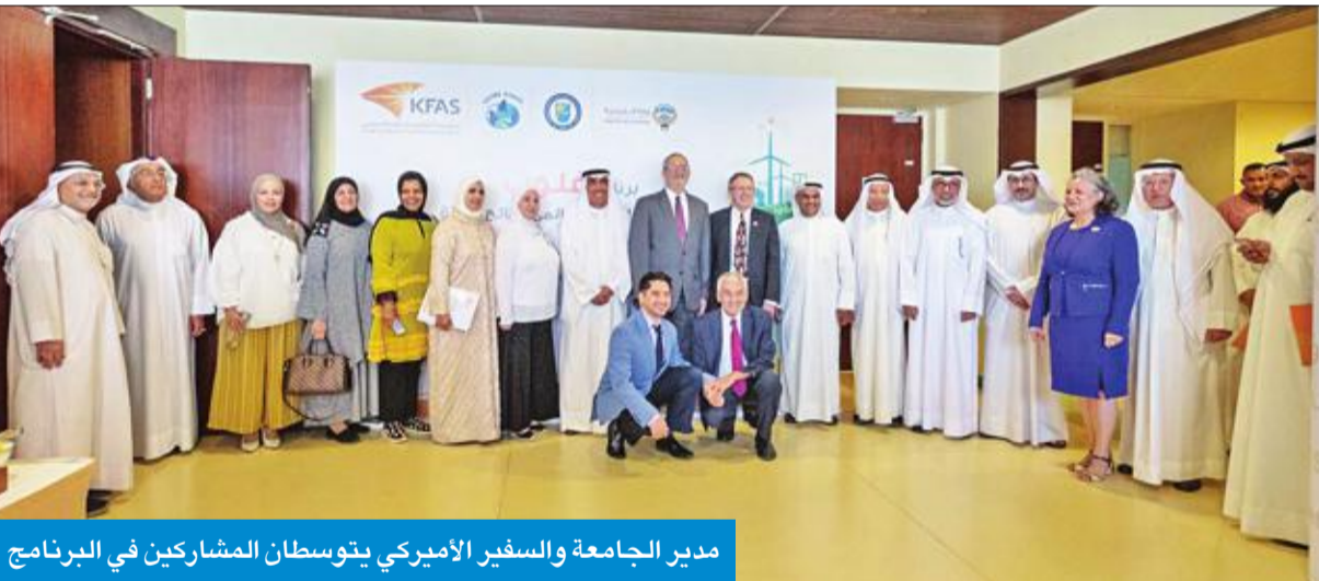
مدير الجامعة والسفير الأميركي يتوسطان المشاركين في البرنامج

والمواطنين العاملين معاً، نحو فهم أفضل لبيئة الأرض محلياً وإقليمياً وعالمياً، وللحفاظ على استدامتها وتحسينها، مبيناً أن مهمة البرنامج هي تعزيز تدريس العلوم وتعلمها، وتحسين المعرفة حول الريادة البيئية، وتشجيع البحث العلمي.