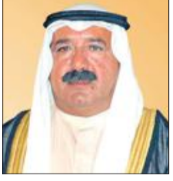
ناصر الصباح يشيد بجهود اللعابين في الدورة الآسيوية