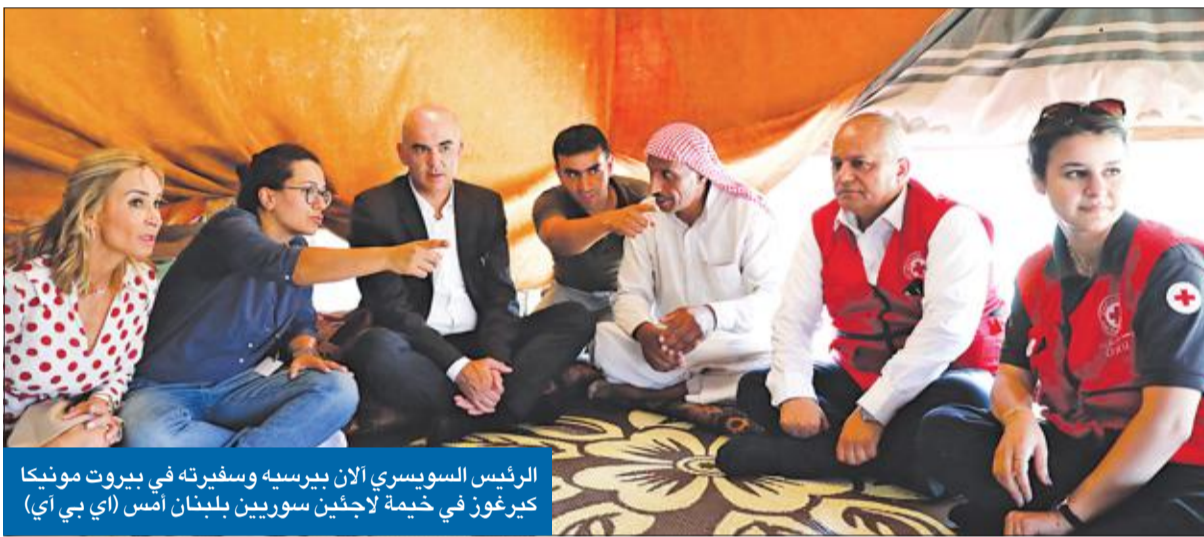
الرئيس السويصري الآن بيرسيه وسفيرته في بيروت مونكا كيرغوز في خيمة لإجئين سوريين بلبنان أمس (بي بي سي)

توصية غرينبلات وكوشنير تبدأ بالحزب في الداخل والخارج وتستهدف جميع تعاملاته الاقتصادية ● البيت الأبيض يضغط لنزع سلاحه وخنق إيران وأذرعها بالمنطقة... ومنع أي مغامرة تجاه إسرائيل ● رسالة من ترامب إلى عون أكدت استيائه من تصرفات الرئيس اللبناني ومواقفه