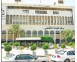
«التميز»: لا يجوز للبنوك الإسلامية المطالبة بفوائد التأخير