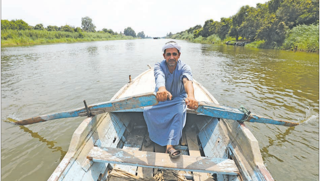
مصري يجوب بقاربه نهر النيل في الجزيرة أمس الأول

لاديس أبابا، ويحفظ أمن مصر المائي. وأكد مركز معلومات مجلس الوزراء المصري، أمس، أن هناك اهتماما كبيرا خاصة بضرورة التوصل إلى اتفاق عاجل بين مصر وإثيوبيا والسودان في ملف سد النهضة وقواعد تشغيله، وتنفيذ الاتفاقيات الموقعة بين الدول الثلاث.