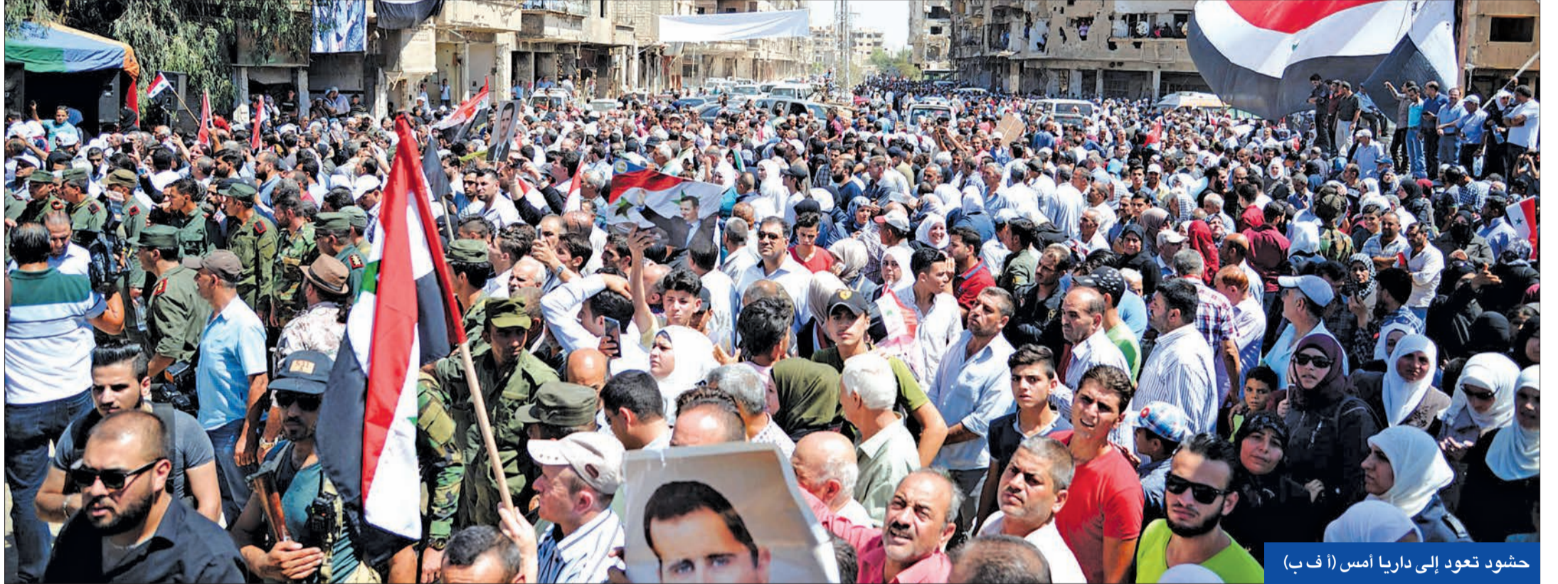
حشود تعود إلى داريا أمس

● مجلس الأمن يجتمع والحشد العسكري يتواصل ● «البتاغون» جاهزة لأي أمر ● حاتمي يتفقد قاعدة التدخل بحلب