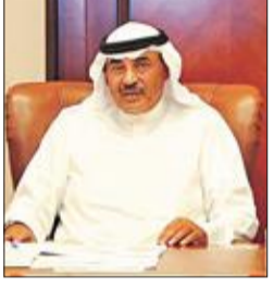
الخالد يستعرض استراتيجية تطوير «مجلس التعاون»