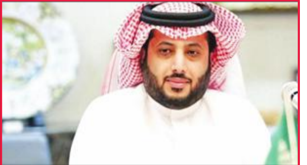
تركي آل الشيخ

شدد المستشار التركي آل الشيخ رئيس مجلس إدارة الهيئة العامة للرياضة السعودية، على أنه لن يُسمح لأي ناد بالمشاركة في الدوري السعودي لكرة القدم دون وجود مدرب وطني ضمن جهازه الفني.