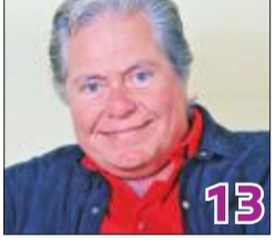
حسين فهمي: وافقت على «الكوبيسين» فور قراءة السيناريو