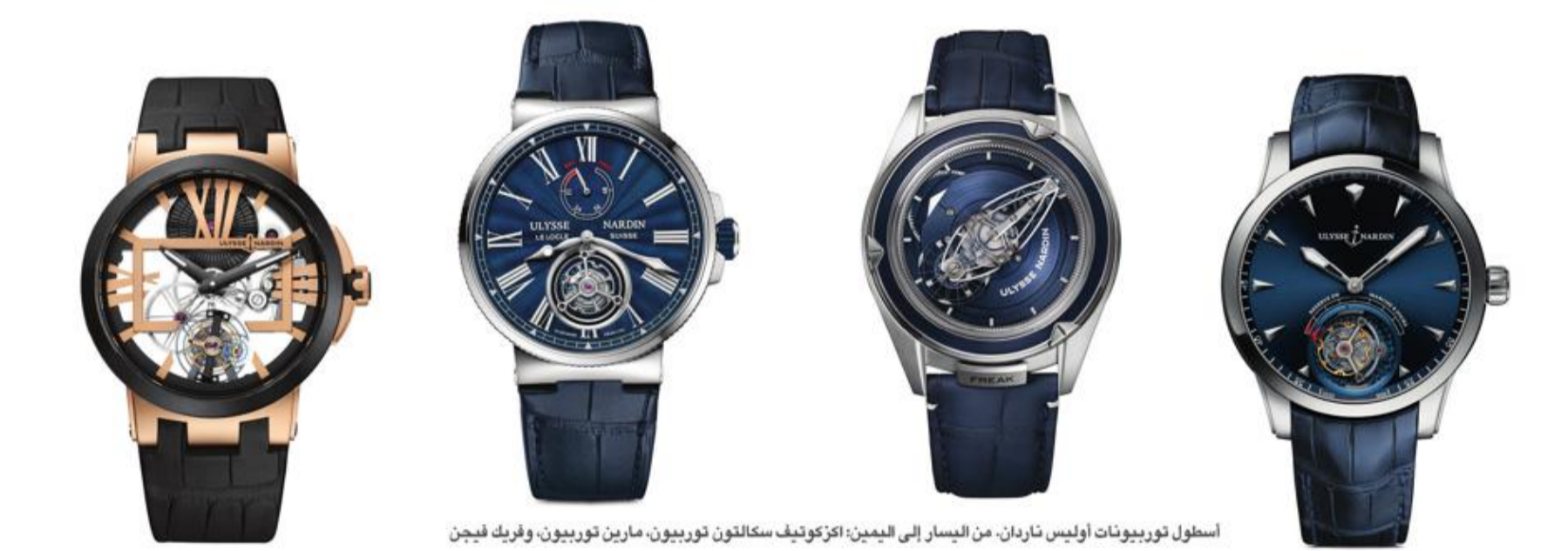
أسطول توربيونات أوليس ناردان، من اليسار إلى اليمين: إكزوتيف سكالتون توربيون، مارين توربيون، وفريك فيجن