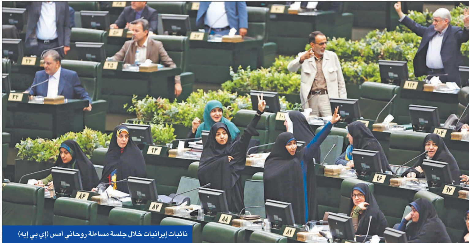
نائبات إيرانيات خلال جلسة مساءلة روحاني أمس

فشل الرئيس حسن روحاني أمس، في اجتياز جلسة مساءلة هي الثانية في تاريخ إيران بعدما أعرب نواب "الشورى" عن عدم اقتناعهم بـ 4 من 5 أسئلة أجوبة قدمها رداً على 5 أسئلة تتمحور حول الفساد والركود، في حين يحسم البرلمان إمكانية إحالة رد الرئيس إلى القضاء للنظر في ارتكابه مخالفات قانونية الأحد المقبل.