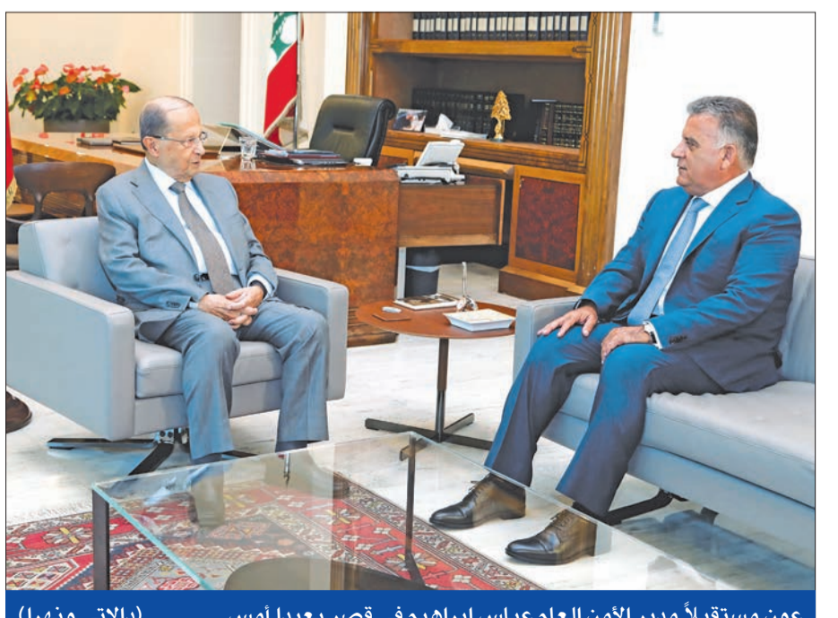
عون مستقبلاً مدير الأمن العام عباس إبراهيم في قصر بعهدا أمس

بيروت - الجريدة. ينتظر اللبنانيون حلول الأول من سبتمبر لتكثف طبيعة الخطوات الرئاسية، التي سيقدم عليها رئيس الجمهورية ميشال عون لوضع حد للشلل الحكومي الذي يضرب البلاد. ومع أن زوار القصر الجمهوري لم يكشفوا طبيعة هذه الخطوات، إلا أن عون يعاود التفكير بجداولها بعد الحلحلة التي ظهرت خلال اليومين الماضيين على خط تاليف الحكومة. ومن المتوقع أن يزور رئيس الحكومة المكلف سعد الحريري بعهدا، قبيل انقضاء الأسبوع، إضافة إلى سواها من اللقاءات التي بقيت بعيدة من الإعلام، أعادت عقارب ساعة تاليف الحكومة إلى الدوران، وهذا من شأنه أن يدفع في اتجاه الخروج من المستنقع الذي تندرج إليه الأوضاع السياسية والاقتصادية والمعيشية، والتي بدأت جميع الأطراف تتلمس دفتها وخطورة استمرارها». وتابع: «يجري الحريري قبل الزيارة جولة مشاورات سريعة يضع بعدها مسودة صيغة تلزم نوابته التشكيلية، حكومة وحدة وطنية ثلاثية تضم المكونات السياسية وتشكل وفق معيار واحد، ينجحها مع عون الذي وبعد الاتفاق عليها يوقعها، على أن تبدأ آنذاك مهلة الثلاثين يوما لوضع البيان الوزاري». في موازاة ذلك، خيم العيد 73 للامن العام على الحراك الداخلي. وفي السياق نفسه، اعتمت وزير الداخلية نهاد المشنوق مناسبة زيارته المديرية العامة مهنتا، أمس للحديث عما يحكي في شأن معبر نصيب، فقال: «منذ بداية الأزمة السورية فتحنا كل المعابر من دون أن نشترط، والكلام عن شروط لفتح معابر لا يجوز ولا يعبر عن الشعب السوري، فنحن لم نشترط ولم نمنع على أحد، ولا يجوز اشتراط التفاوض السياسي لفتح أي معابر».