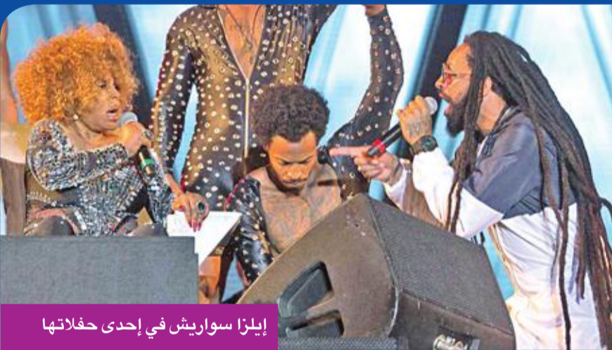
إيلزا سواريش في إحدى حفلاتها

تشعر المغنية البرازيلية الشهيرة إيلزا سواريش (81 عاماً)، بأنها أكثر شباباً من أي وقت مضى، مع الانطلاق بجولة مرتبطة باليومها الجديد.