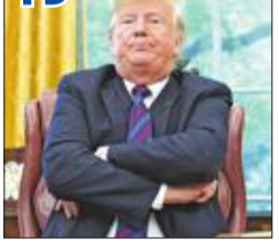
ترامب يخضع وينكس العلم لماكين... ويتهم «غوغل» بالتلاعب