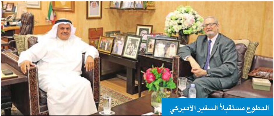
المطوع مستقبلاً السفير الأميركي

وأضاف المطوع، «سنواصل التزامنا بأن يكون القطاع الخاص الكويتي خير سفير لتوطيد العلاقات الاقتصادية والتجارية بين الدول، وننتطلع إلى مزيد من التعاون المشترك مع شركات تجارية رائدة في الولايات المتحدة، وأود أن أعتد هذه الفرصة لاتقدم بجزيل الشكر للسفير سيلفرمان على هذه الزيارة على أمل أن نرحب به مجدداً في الشركة لبحث المزيد من العلاقات والمصالح المتبادلة».