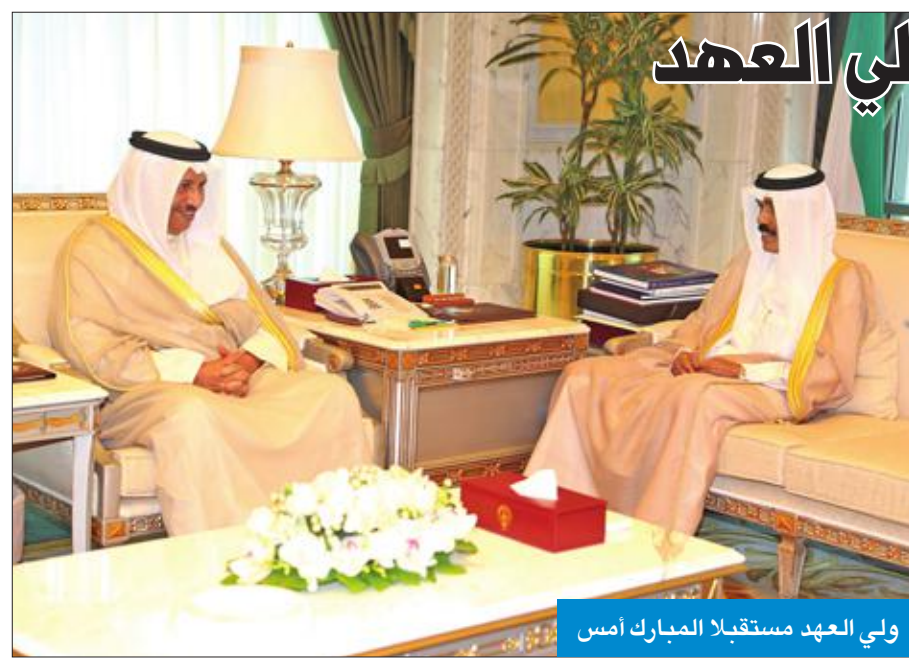
ولي العهد مستقبلاً المبارك أسس

استقبل سمو ولي العهد الشيخ نواف الأحمد بقصر السيف صباح أمس، رئيس مجلس الأمة مرزوق الغانم. واستقبل سموه أيضاً رئيس مجلس الوزراء سمو الشيخ جابر المبارك، ثم نائب رئيس مجلس الوزراء وزير الداخلية الشيخ خالد الجراح. كما استقبل نائب رئيس مجلس الوزراء وزير الدولة لشؤون مجلس الوزراء أنس الصالح.