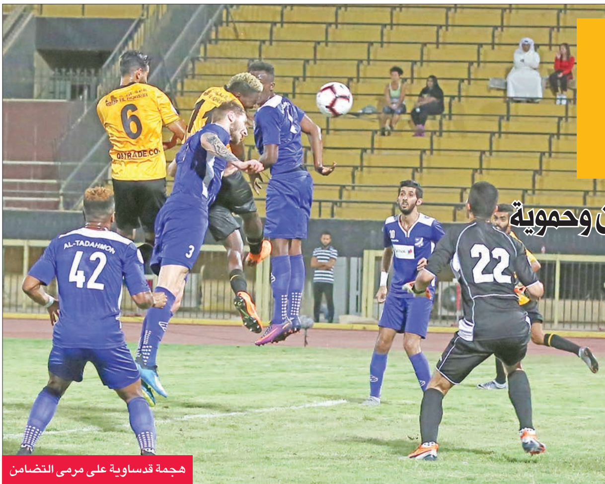
هجمة قدساوية على مرمى التضامن

الجهان الفني كل الملاحظات من أجل بناء خطته، التي تستهدف الفوز في المباراة. وحصد النقاط الثلاث، لافتاً إلى أن الإصفر قادر على زيادة مستواه في المباريات المقبلة. جدير بالذكر أن القادسية، راقب الزمك المصري في مباراة أمس، أمام المقاولون العرب في مسابقة الدوري المصري، ودون