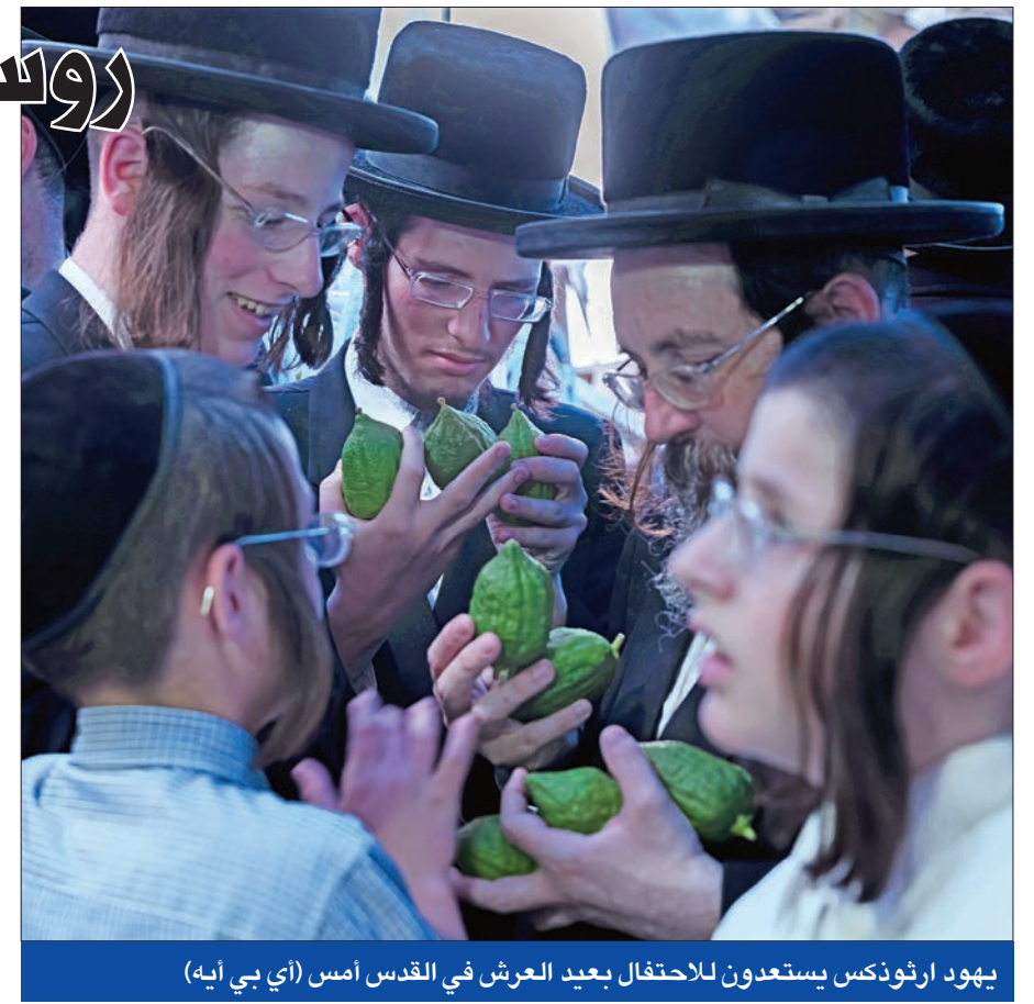
يهود ارتوذكس يستعدون للاحتفال بعيد العرش في القدس أمس

اتهم المتحدث باسم وزارة الدفاع الروسية إيغور كوناشينكوف، أمس، تل أبيب بتضليل موسكو، وحملها المسؤولية الكاملة عن إسقاط الطائرة «إيل 20» قرابة شاطئ اللاذقية الأثنيين الماضي، في تطور قابله وزير الدفاع الإسرائيلي أفيدور ليبرمان بتأكيد استمرار شن العمليات ضد الوجود العسكري الإيراني في سورية، رغم الحادث المأساوي مع الطائرة الروسية. وفي مؤتمر خاص لكشف ملامسات حادث اللاذقية، وصف كوناشينكوف سلوك الطيارين الإسرائيليين بأنه «إهمال إجرامي، وعدم مهنية»، مؤكداً أنهم اختبؤوا وراء الطائرة الروسية من الصواريخ السورية، وواصلوا هجماتهم باللاذقية، بعد سقوط الطائرة، ومصرع 15 عسكرياً روسياً. وذكر كوناشينكوف أن الجانب الإسرائيلي تأخر في إخلاء منطقة الحادث مدة طويلة حتى بعد وقوع الحادث، وعرض المصادرة في البحث عن الطائرة الروسية بعد 50 دقيقة، موضحاً أنه لم يبلغ الروس في الوقت المناسب بموعد شن غاراته، بل قدم معلومات مغلوطة مسجلة بأنه استهدف