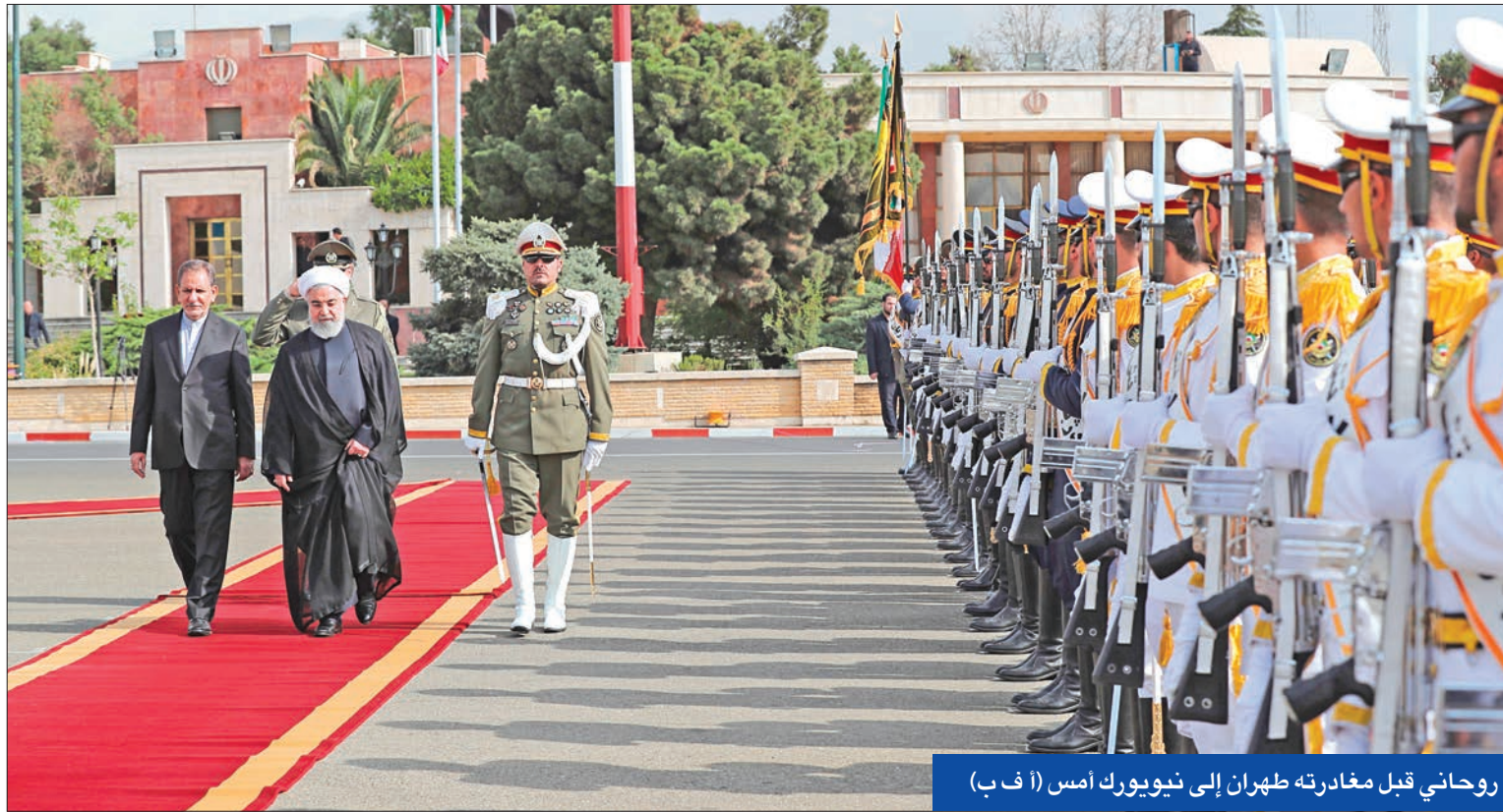
روحاني قبل مغادرته طهران إلى نيويورك أمس (أ ب)

«الحرس الثوري» يتعهد برد «مमित»... وروحاني يتهم واشنطن بمحاولة إثارة الاضطرابات