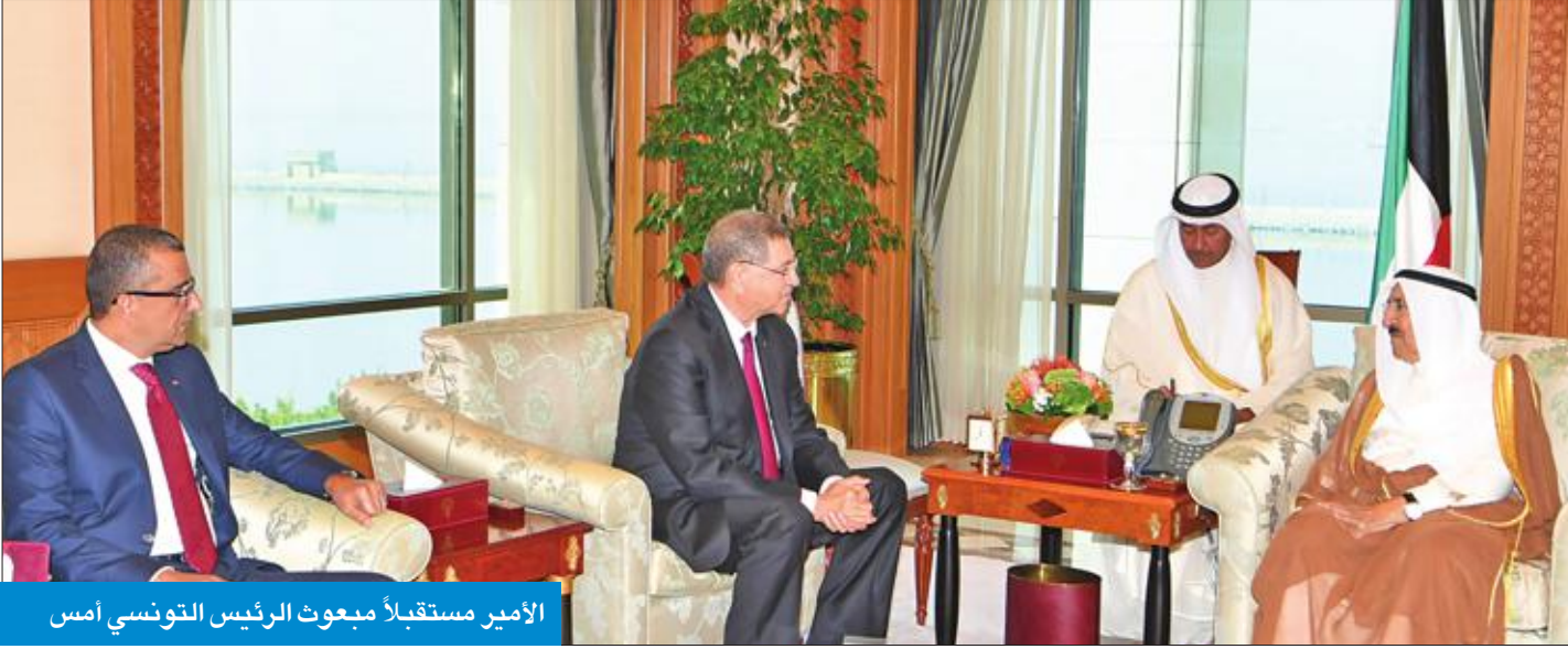
الأمير مستقبلاً مبعوث الرئيس التونسي أسس

في مدينة الأهواز الإيرانية، ما أودى بأرواح عدد من الأبرياء وإصابة آخرين.