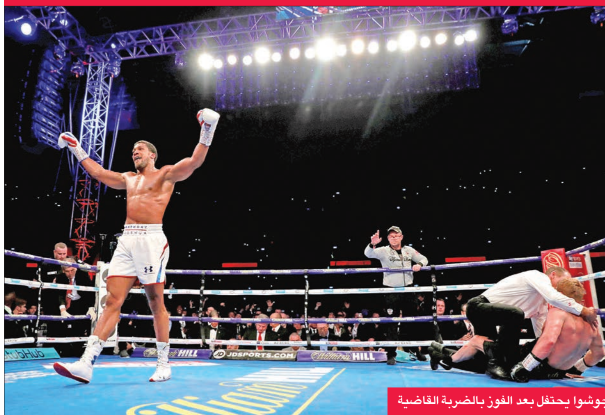
جوشوا يحتفل بعد الفوز بالضربة القاضية

حافظ البريطاني أنطوني جوشوا على ألقابه في رابطة الملاكمة العالمية والاتحاد الدولي للملاكمة ومنظمة الملاكمة الدولية للوزن الثقيل، بعد فوزه بالضربة القاضية على الروسي الكسندر بوفتكين، أمس الأول، على استاد ويمبلي في لندن. وأزعج بوفتكين منافسه جوشوا في بداية النزال، لكن الملاكم البريطاني استعاد مستواه المعهود في الجولة السادسة، حيث لُقّن منافسه الروسي (39 عاماً) سلسلة من الضربات القاسية والمتنوعة، ثم حسم النزال لاحقاً بالضربة القاضية في الجولة السابعة.