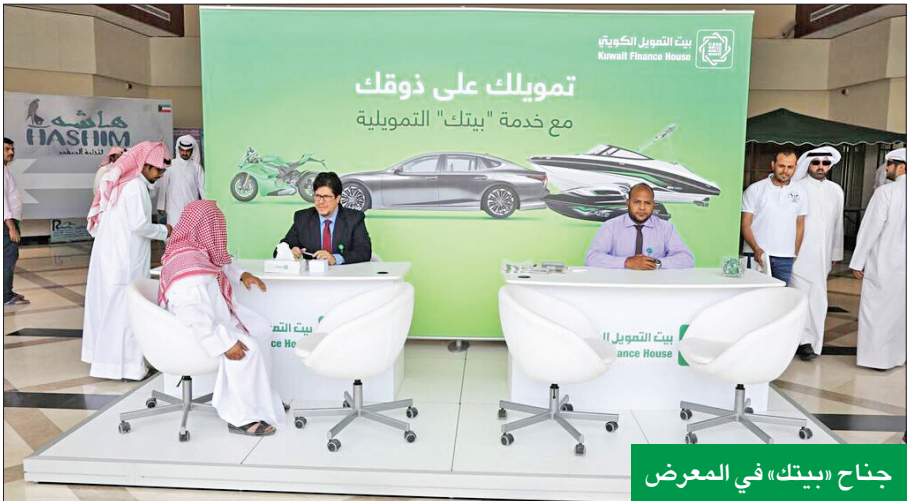
جناح «بيتك» في المعرض

ومن بين المزايا التي يقدمها «بيتك» من خلال الحملة، صفر أرباح على السيارات الجديدة ضمن مجموعة مختارة مقدمة من الوكيل من أنواع «إيفنتي جي إي سي وفورد ولكزس»، إضافة إلى أسعار تنافسية على مجموعة متنوعة من السيارات ضمن منتج التاجير مع الصيانة على أنواع «تويوتا، كيا، نيسان، جي إم سي»، وكذلك على السيارات المستعملة، والتأجير مع المواعدة بالتملك.