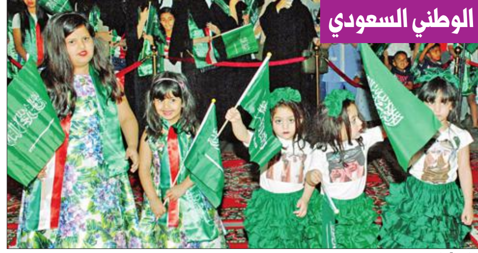
مشاركة الأطفال في الاحتفال