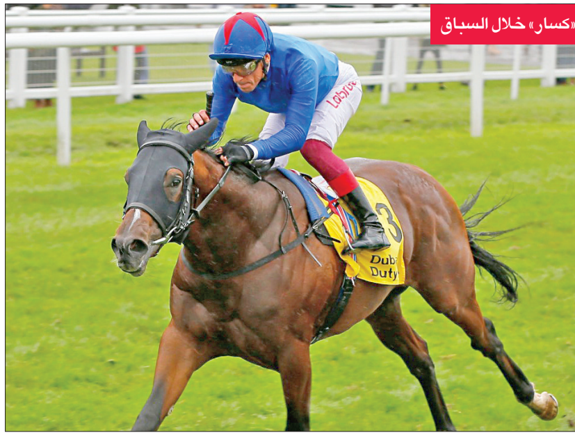
«كسار» خلال السباق

وقالت بليسكوفا عقب المباراة: «أنا سعيدة، لأنني لم أضطر لخوض مجموعة ثالثة. ناغومي لعبت بشكل جيد على مدار البطولة، لكنني اعتقد أنها كانت مرهقة اليوم». وتعد هذا اللقب الـ1 في مسيرة بليسكوفا، التي ستصعد من المركز الثامن للسابع في التصنيف العالمي للاعبات التنس المحترفات الذي سيصدر اليوم (إفي).