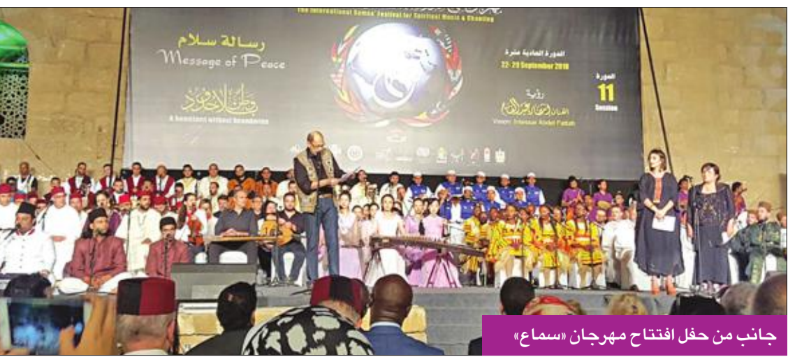
جانب من حفل افتتاح مهرجان «سماع»

مثل: قمة الغوري وشارع المعز ومجمع الأديان، وكذلك ساحة الهناجر بالأوبرا، وميدان روكسي، وممر بهلر وسط المدينة. ويتزامن موعد المهرجان في كل عام مع اليوم الدولي للسلام، الذي تكررته الأمم المتحدة في 21 سبتمبر لاجل حل الخلافات والنزاعات الدولية، وتشجيع النهج السلمي في حل المشكلات القائمة.