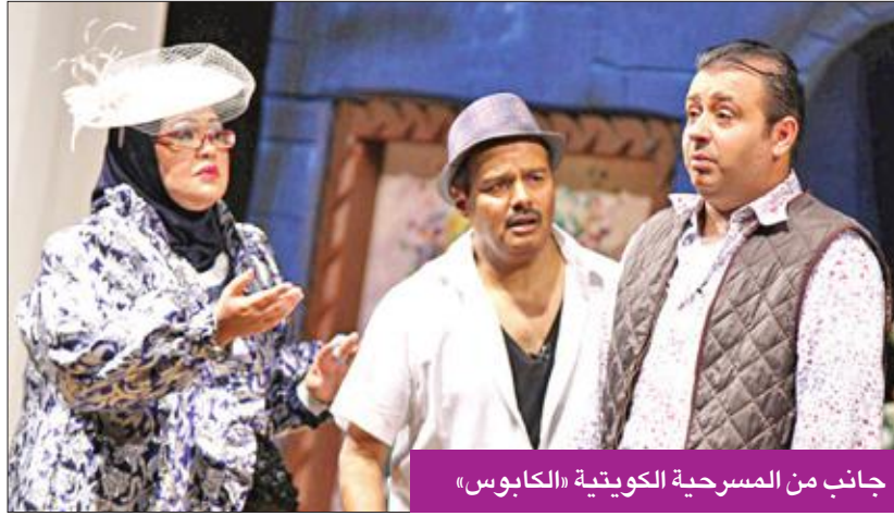
جانب من المسرحية الكويتية «الكابوس»

بضخها في الحياة العملية إلى يومنا هذا». ولفت الرباح إلى «أن دولة الكويت تسير بنهج رعاية الشباب من خلال توفير بيئة مستمرة لصفقات والطاقات والاستفادة منها، إذ أطلقت مهرجان الكويت المسرحي تحت رعاية المجلس الوطني للثقافة والفنون والآداب، وإحاطاً به عدداً من المهرجانات المختلفة مثل المهرجان العربي للمسرح الطفل ومهرجان «ليال مسرحية كوميدية»، وهذا ساهم في تطوير الحركة المسرحية وإنعاشها وساعد الجهات الأخرى بإنشاء مهرجان أيام المسرح للشباب تحت رعاية الهيئة العامة للشباب وهو بوابة العبور نحو الاحتراف، وأيضاً دور المعهد العالي للفنون المسرحية بإنشاء المهرجان الأكاديمي المسرحي ويختص بالجانبي