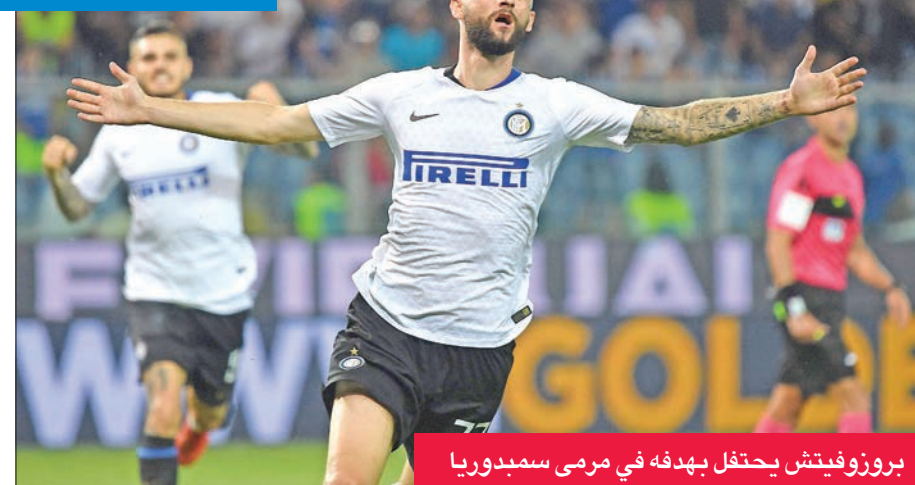
بروزوفيتش يحتفل بهدفه في رمي سبيدوروا