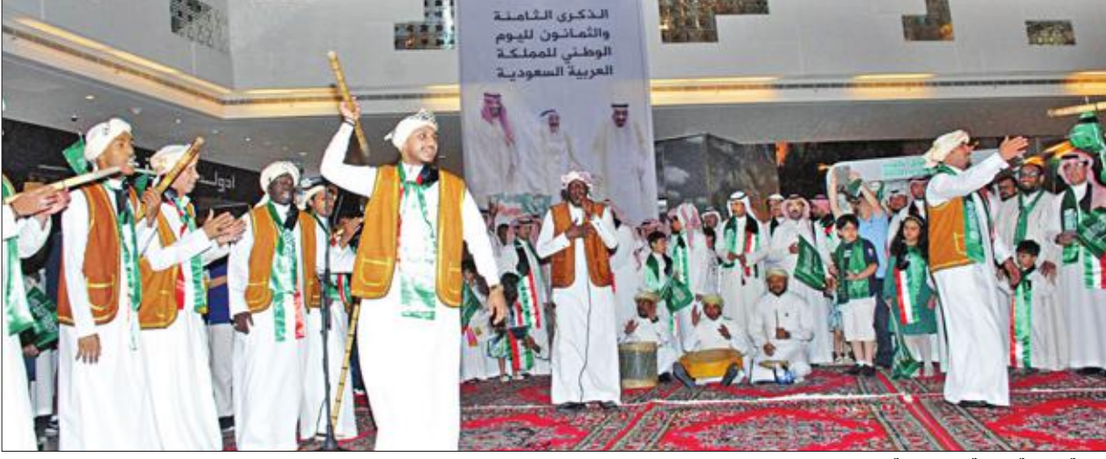
وصلة شعبية للفرقة الموسيقية