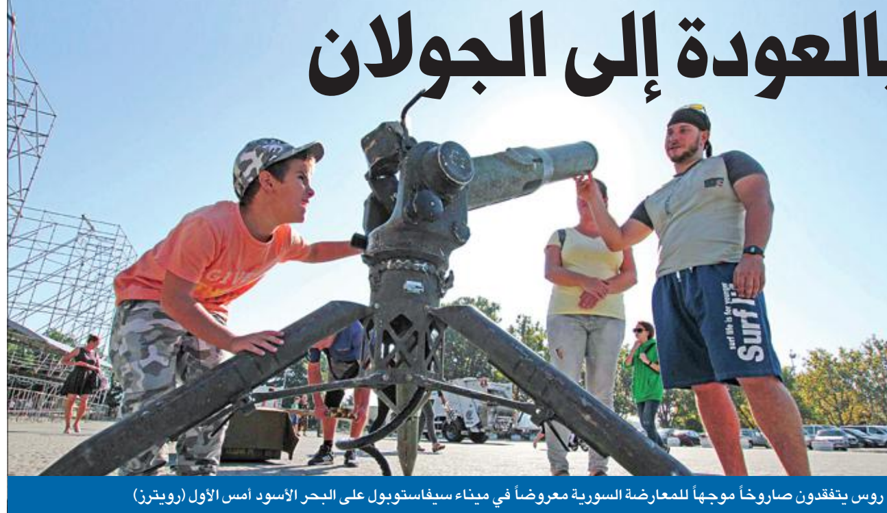
روس يتفقدون صاروخاً موجهاً للمعارضة السورية معروضاً في ميناء سيفاستوبول على البحر الأسود أمس الأول

أكدت مصادر رفيعة المستوى في الحرس الثوري الإيراني لـ «الجريدة» أن موسكو أبلغت طهران أنها لم تعد مُضرة على العمل بالاتفاق الذي عقده مع الولايات المتحدة وإسرائيل لإبعاد القوات المسلحة الموالية لإيران وأسلحتها الثقيلة عن خط فصل القوات بين إسرائيل وسورية في الجولان، وذلك بعد حادث إسقاط الطائرة الروسية. وقالت المصادر إن طهران بدأت بالفعل دراسة نشر القوات الموالية لها مجدداً بمحاذاة خط وقف إطلاق النار بين سورية وإسرائيل في الجولان، لكنها أشارت إلى أن إيران وسورية نشرتا في المنطقة نحو 10 آلاف جندي سوري، نصفهم على الأقل من العلويين، لتفادي خرق الاتفاق الروسي- 02