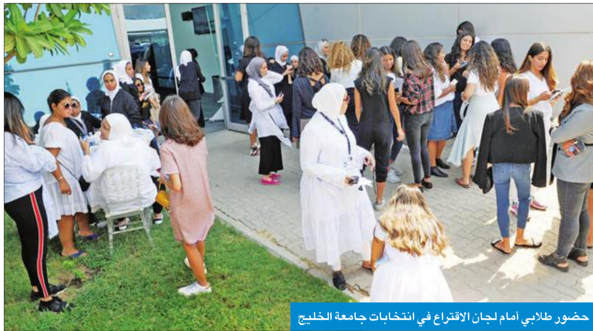
حضور طلابي أمام لجان الاقتراع في انتخابات جامعة الخليج

السابقة حصل تفاعل كبير بين الإدارة الجامعية والرابطة، وهو مثمر وناجح، ونتمنى أن تستمر الرابطة الجديدة بنفس النهج، ويقدموا اقتراحات تخدم المجددين بشكل خاص.