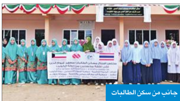
جانب من سكن الطالبات

افتتحت «الرحمة العالمية»، بجمعية الإصلاح الاجتماعي، سكناً لطالبات معهد قيوم الدين، الذي يُعد مدرسة أهلية إسلامية تدرس المنهج الشرعي والأكاديمي الحكومي في ولاية سونكلا بتايلند، ويُنظر أن يستفيد منه أكثر من 128 طالبة من غير القادرات على تحمّل تكاليف التعليم. وقال رئيس مكتب إندونيسيا والفلبين وتايلند في «الرحمة»، عبدالله العجمي، في تصريح صحفي، إن السكن سيوفر بيئة آمنة ومناسبة للفتيات تحافظ عليهن، وتعينهن على الإقبال على طلب العلم. وأوضح أن معهد قيوم الدين، الذي أنشأته «الرحمة» في ولاية سونكلا بتايلند، يدرس فيه نحو 370 طالبا وطالبة، مشيراً إلى أن المعهد يقوم بتدريس العلوم الشرعية، والمنهج الأكاديمي الحكومي، لكنه يعاني عدم وجود مسكن داخلي للطالبات.