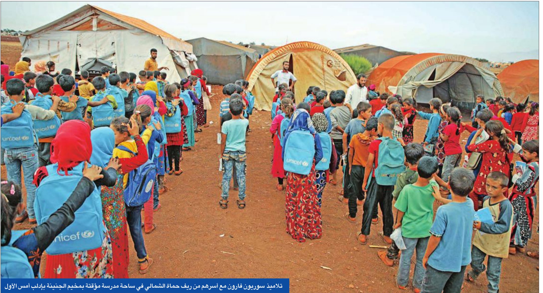
تلاميذ سوريون فارون مع أسرهم من ريف حماة الشمالي في ساحة مدرسة مؤقتة بمخيم الجنيينة بإدلب أمس الأول

الإيرانيون يحصلون على امتياز بناء محطة كهرباء بـ 460 مليون دولار في اللاذقية