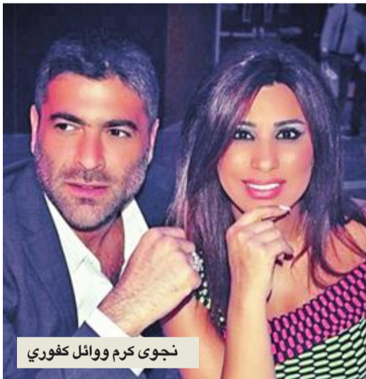
نجوى كرم ووائل كفوري

عبر حسابها الخاص على موقع «تويتر»، وجهت الفنانة نجوى كرم رسالة إلى النجم وائل كفوري أثنت فيها على حلوله ضمن برنامج وفاء الكيلاني «تخاريف».