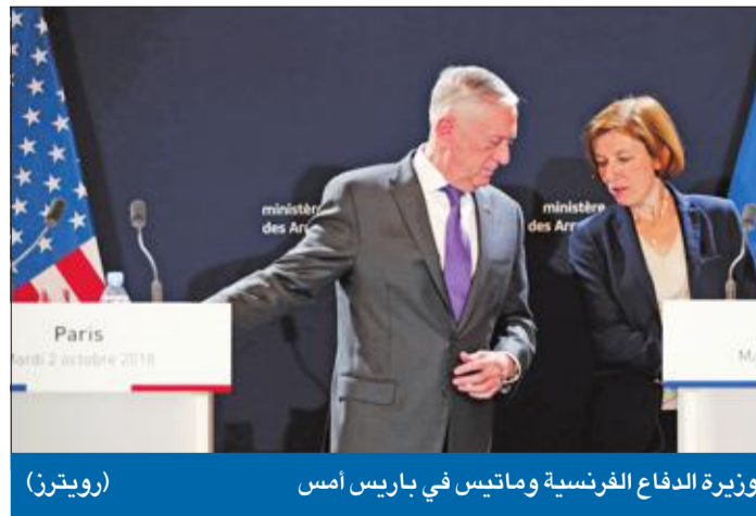
وزيرة الدفاع الفرنسية وماتيس في باريس أمس

أجرى وزير دفاع الولايات المتحدة جيمس ماتيس، أمس، محادثات في فرنسا لإقناعها بإبقاء قواتها الخاصة في سورية إلى جانب التحالف الدولي تحت قيادة واشنطن، بعدما أطلع المسؤولين الفرنسيين على التصور الأميركي التفصيلي لحل الأزمة السورية، وخلال أول زيارة لباريس منذ توليه منصبه مطلع عام 2017، جدد ماتيس، في مؤتمر صحفي مشترك مع نظيره الفرنسية فلورنس بارلي، اقتراحه تشكيل قوة أمنية مدربة جيداً للدفاع عن المدنيين السوريين، والحيلولة دون عودة ظهور تنظيم داعش مجدداً. وبيّن ماتيس أن بلاده ضغفت وجودها الدبلوماسي في سورية مع تقليص العمليات العسكرية، مؤكداً أنه في الأيام المقبلة «سنرى أنه يتسنى للجهد الدبلوماسي أن يترسخ»، حذر من أن المعركة مع «داعش» في آخر معاقله بسورية ما زالت صعبة، والقضاء الكامل على التنظيم «سيستغرق بعض الوقت».