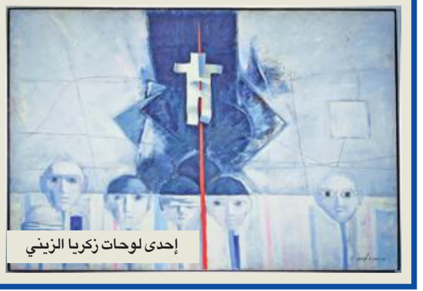
إحدى لوحات زكريا الزيني

الزيني، حاصل على دبلوم كلية الفنون الجميلة في القاهرة (قسم التصوير) عام 1960، ودبلوم أكاديمية الفنون الجميلة في البنديفة (قسم التصوير) عام 1964، ودبلوم أكاديمية الفنون الجميلة برافنا (قسم التصوير الجداري) عام 1966.