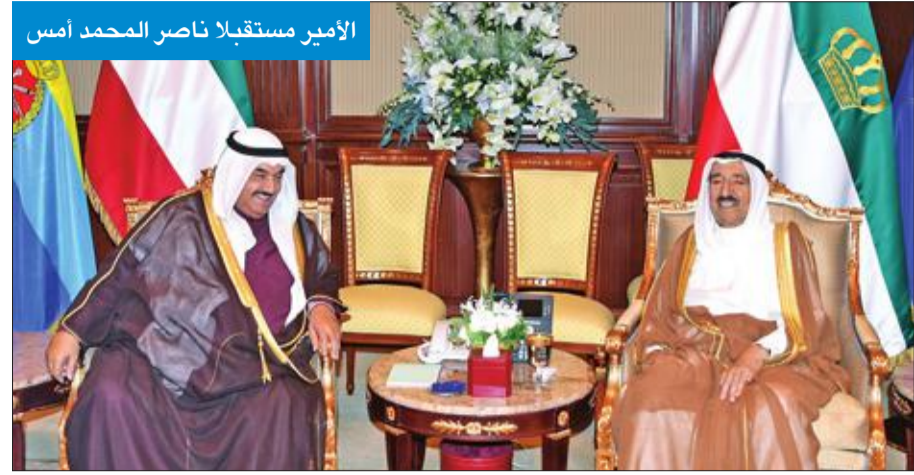
الأمير مستقبلاً ناصر المحمد أمس فيها سموه عن خالص تهانیه بمناسبة العيد الوطني لبلاده، متمنياً له موفور الصحة وبعث سمو ولي العهد الشيخ نواف الاحمد ورئيس مجلس الوزراء سمو الشيخ جابر المبارك ببرقيات ماثلة.

استقبل صاحب السمو أمير البلاد الشيخ صباح الأحمد بقصر بيان صباح أمس سمو الشيخ ناصر المحمد. وفي مجال آخر، بعث صاحب السمو ببرقية تعزية إلى خادم الحرمين الشريفين الملك سلمان بن عبدالعزيز ملك المملكة العربية السعودية الشقيقة عبر فيها سموه عن خالص تعازيه وصادق مواساته بوفاة المغفور لها الأميرة نورة بنت تركي بن عبدالله سائلاً سموه المولى تعالى أن يتغمدها بواسع رحمته ويسكنها فسيح جناته، وأن يلهم الأسرة المألقة الكريمة جميل الصبر وحسن التحرز. وبعث سموه ببرقية تهنئة إلى رئيس جمهورية غينيا الصديقة ألفا كوندي عبر