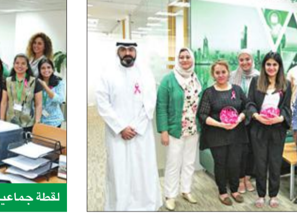
جانب من المشاركة

بتزامن مع المبادرة العالمية للتوعية بسرطان الثدي، التي انطلقت في أكتوبر 2006، وتهدف إلى توعية النساء حول