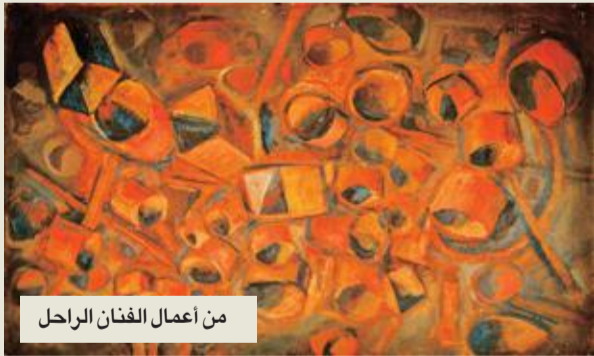
من أعمال الفنان الراحل

بحدث فني مهم تشرق من جديد أعمال الفنان التشكيلي الرائد زكريا الزيني، عبر افتتاح معرضه المرتقب اليوم الأربعاء 3 أكتوبر، في غاليري «سفر خان» في القاهرة، بحضور نخبة من أساتذة وفناني ومحبى الفن التشكيلي، ويستمر عرض الأعمال الخاصة بالفنان الراحل حتى 24 أكتوبر الجاري.