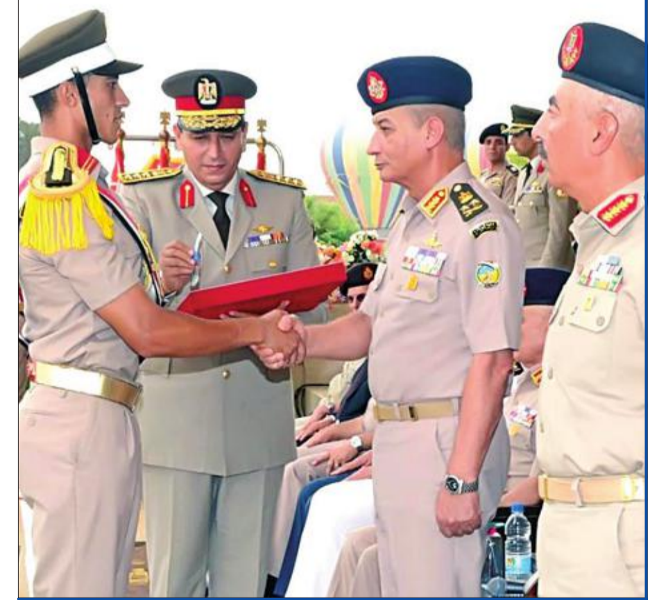
وزير الدفاع الفريق أول محمد زكي مكرماً أحد الطلاب خلال احتفال بتخرج دفعة جديدة بكلية الضباط الاحتياط في القاهرة أمس الأول (المشهد العسكري)

بعد خمس سنوات من المداوات القضائية، أصدرت محكمة جنائبات القاهرة، أمس حكمها على 739 متهماً من قيادات وأنصار جماعة الإخوان المسلمين في قضية "فض اعتصام رابعة العدوية"، وقضت بالإعدام شنقاً لـ 75 متهماً على رأسهم عدد من قيادات الجماعة، هم محمد البلتاجي وعصام العريان ووجدي غنيم وعاصم عبدالماجد وعبدالرحمن البر 47 متهماً بالسجن المؤبد، والتحريض على القتل وارتكاب أعمال العنف. كما قضت بمعاقبة 15 متهماً بالسجن المشدد وعصام سلطان. والسجن المشدد 374 عاماً لـ 22 متهماً حداثا بمعاينة 22 متهماً حداثا بالسجن 10 سنوات ومعاينة 215 آخرين بالسجن المشدد 5 سنوات واتقضاء الدعوى بحق خمسة