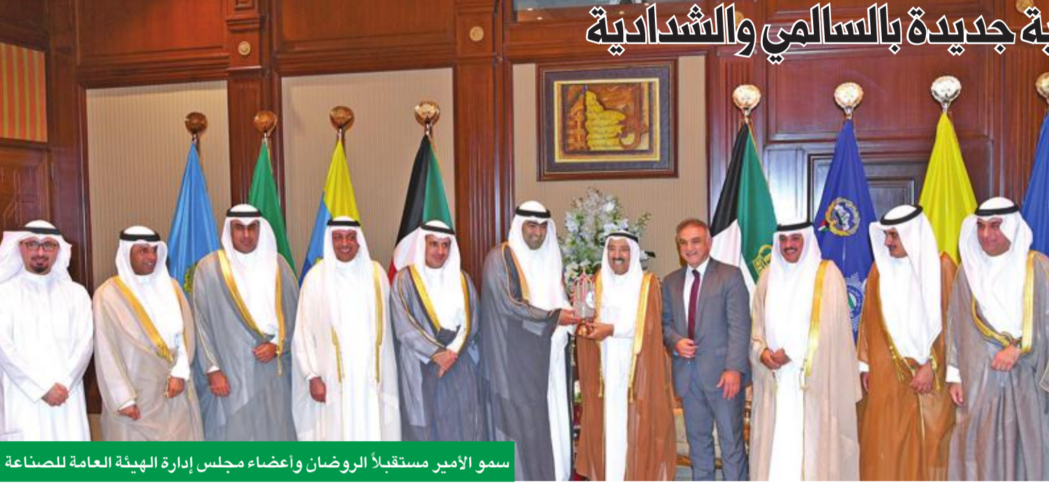
سمو الأمير مستقبلاً الروضان وأعضاء مجلس إدارة الهيئة العامة للصناعة

إلى عدم إعطاء موافقة للمنتفع الأصلي بالتقدم لطلب موافقة جديدة لنفس النشاط مدة 5 سنوات من إصدار الترخيص الأساسي، مع عدم التحويل أو البيع إلا بحد معين 3 سنوات من الإنتاج الفعلي.