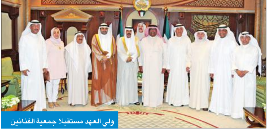
ولي العهد مستقبلاً جمعية الفنانين

استقبل سمو ولي العهد الشيخ نواف الأحمد، بقصر بيان، أمس، سمو الشيخ ناصر المحمد. واستقبل سموه، كذلك، وزير الإعلام وزير الدولة لشؤون الشباب محمد الجبري، ورئيس وأعضاء مجلس إدارة جمعية الفنانين الكويتية. ثم استقبل