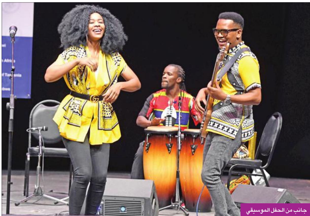
جانب من الحفل الموسيقي

وحرصت الفرق خلال الحفل على تقديم موسيقى تعبر عن هويتها وتاريخها وجذورها. واستهلّت "مجموعة طرب زنجبار" من جمهورية تنزانيا فقرتها، وأضفت أجواء جميلة، فعملت صيحات الجمهور المتعشش للفن الإفريقي. بشار إلى أن "طرب زنجبار" هي مجموعة من المعلمين والطلبة من أكاديمية "دول داو" للموسيقى. تأخرت بطاقة غرب المحيط الهندي العظيمة في التعبير الثقافي، وقدمت برنامجاً متنوعاً يعجب أي جمهور متذوق للفن الصوتي العربي والإفريقي. وتتألف موسيقى تنزانيا من خليط من الأنماط والتأثيرات المستعارة من جميع أنحاء المحيط الهندي، ويمثل هذا الخليط الإبداعي في موسيقى الطرب، وهو الصوت الوطني للجزر والمعروف أن موسيقى الطرب