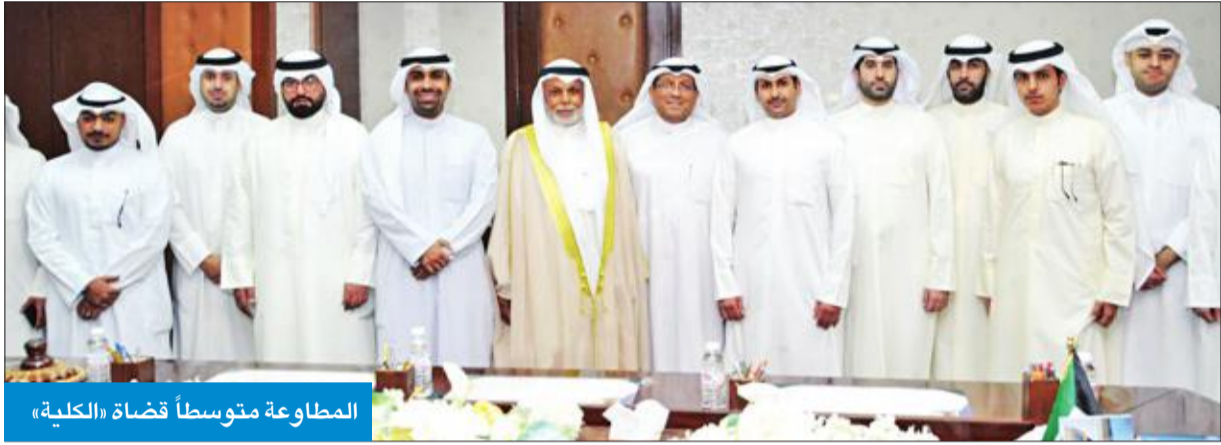
المطاوعة متوسطاً قضاة «الكلية»

بمناسبة صدور قرار المجلس الأعلى للقضاء بنقل عدد من وكلاء النيابة إلى القضاء أدى 24 قاضياً اليمين القانونية أمام رئيس المجلس الأعلى للقضاء يوسف المطاوعة. ويأتي ذلك كخطوة لتعزيز قدرات المحكمة الكلية بالعناصر الشابة من رجال القضاء، وتنفيذاً لمنهجية تكويت القضاء التي يتبناها المجلس الأعلى للقضاء. وسيستند إلى القضاة الجدد العمل في الدوائر الثلاثية بالمحكمة، حتى يستفيدوا من خبرات زملائهم الأقدم، فضلاً عن اسناد بعض الدوائر الجزئية. وقد تم حلف اليمين بحضور رئيس المحكمة الكلية المستشار الدكتور عادل بورسلي.