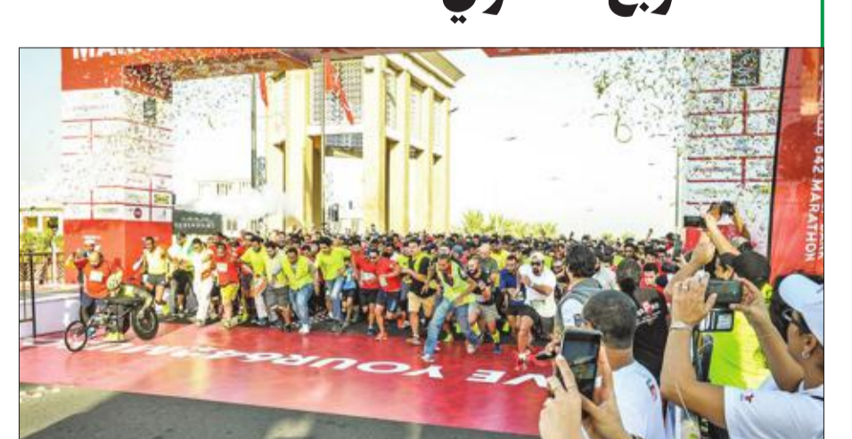
جانب من عملية السحب

وتم إعلان الفائز على الهواء مباشرة في 26 سبتمبر المنقضي، عبر برنامج ديوانية البياقوت والأنصاري على إذاعة راديو نبض الكويت 88.8 إف إم، تحت إشراف مؤسسة التدقيق «إرنست أند يونغ».