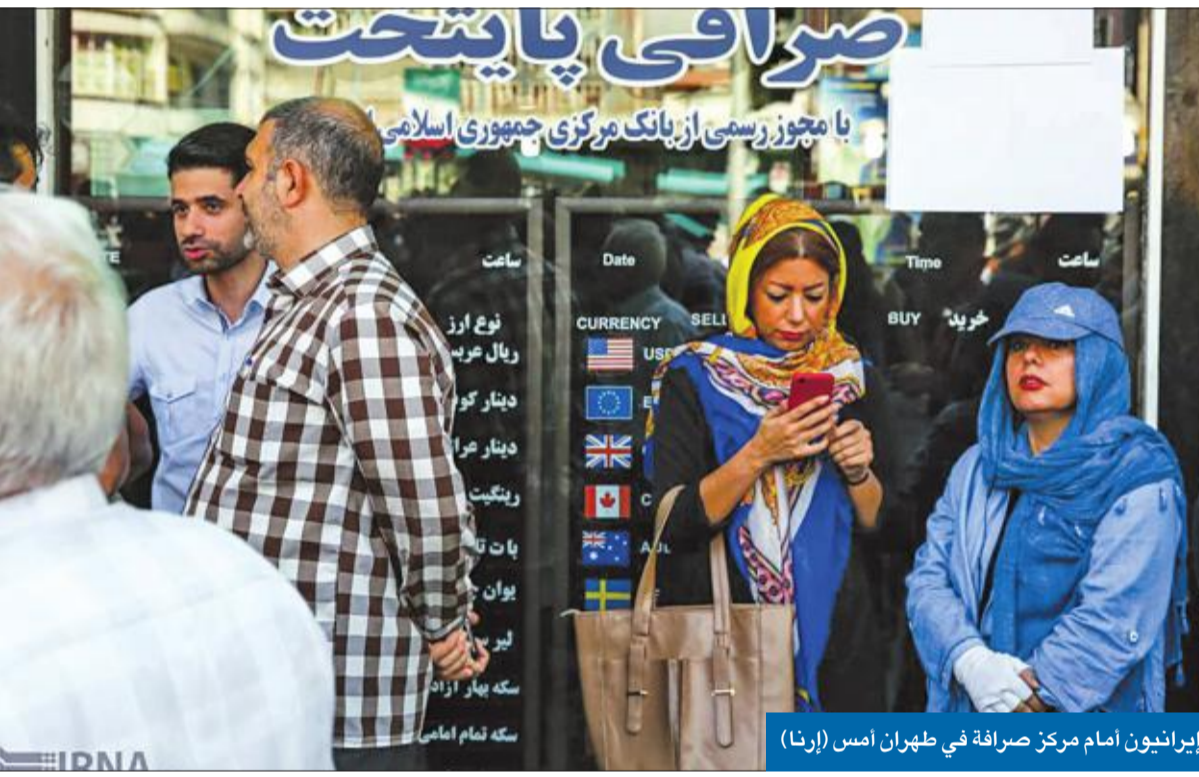
إيرانيون أمام مركز صرافة في طهران أمس