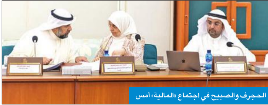
الحجرف والصبيح في اجتماع «المالية» أمس

الشرق- شارع أحمد الجابر- أبراج العوضي- الدور السابع، تلفون: 22456777 - فاكس: 22456183