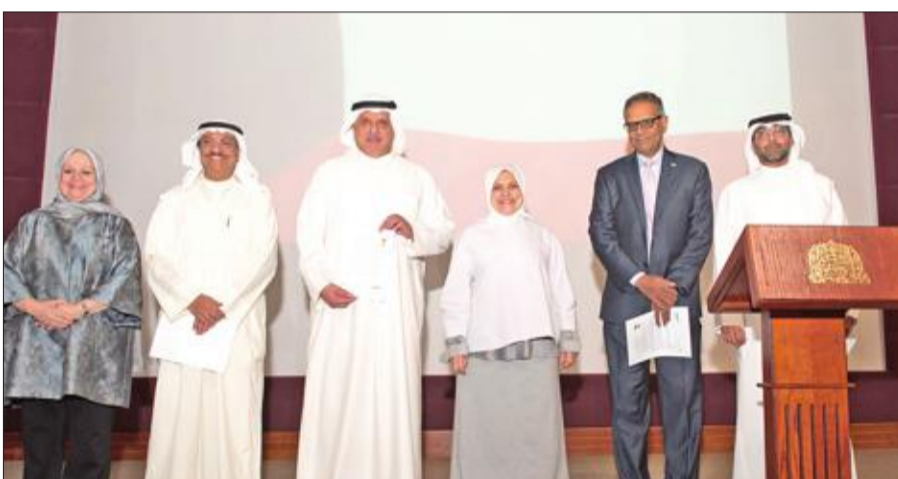
لقطة جماعية عقب التوقيع

مبادئ تمكين المرأة خلال احتفال من تنظيم الأمانة العامة للمجلس الأعلى للتخطيط والتنمية، والأمم المتحدة، وجامعة الكويت، مركز دراسات وأبحاث المرأة في الجامعة. وحضر الفعالية العديد من قيادات الجهات الحكومية والمؤسسات الخاصة التي أيدت هذه المبادرة.