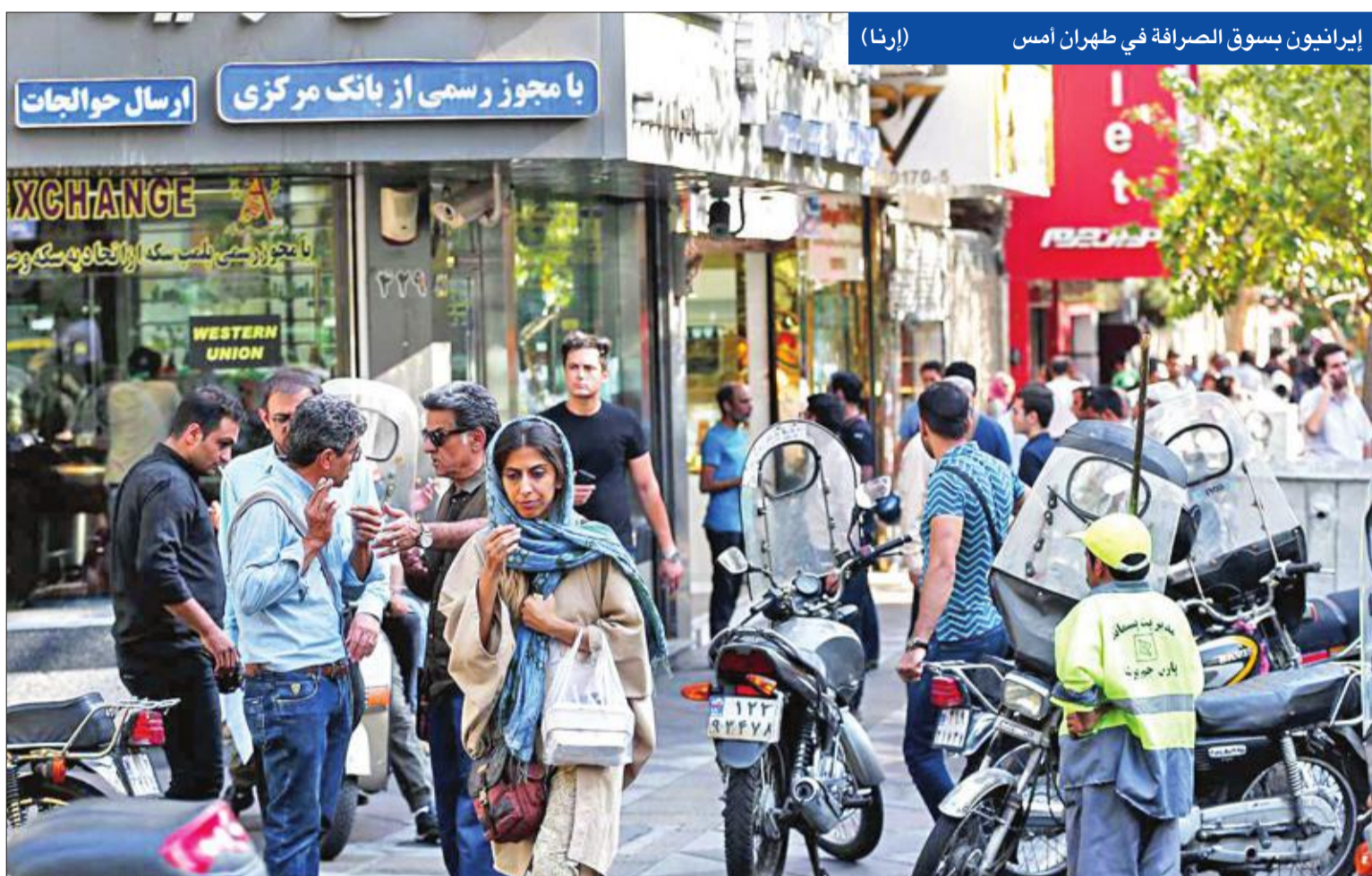
إيرانيون يسوق الصرافة في طهران أمس

«الوكالة الذرية» تتفي اتهامات تنتهاهوا لطهران... وإعدام فتاة كردية وسط تنديد وانتقادات