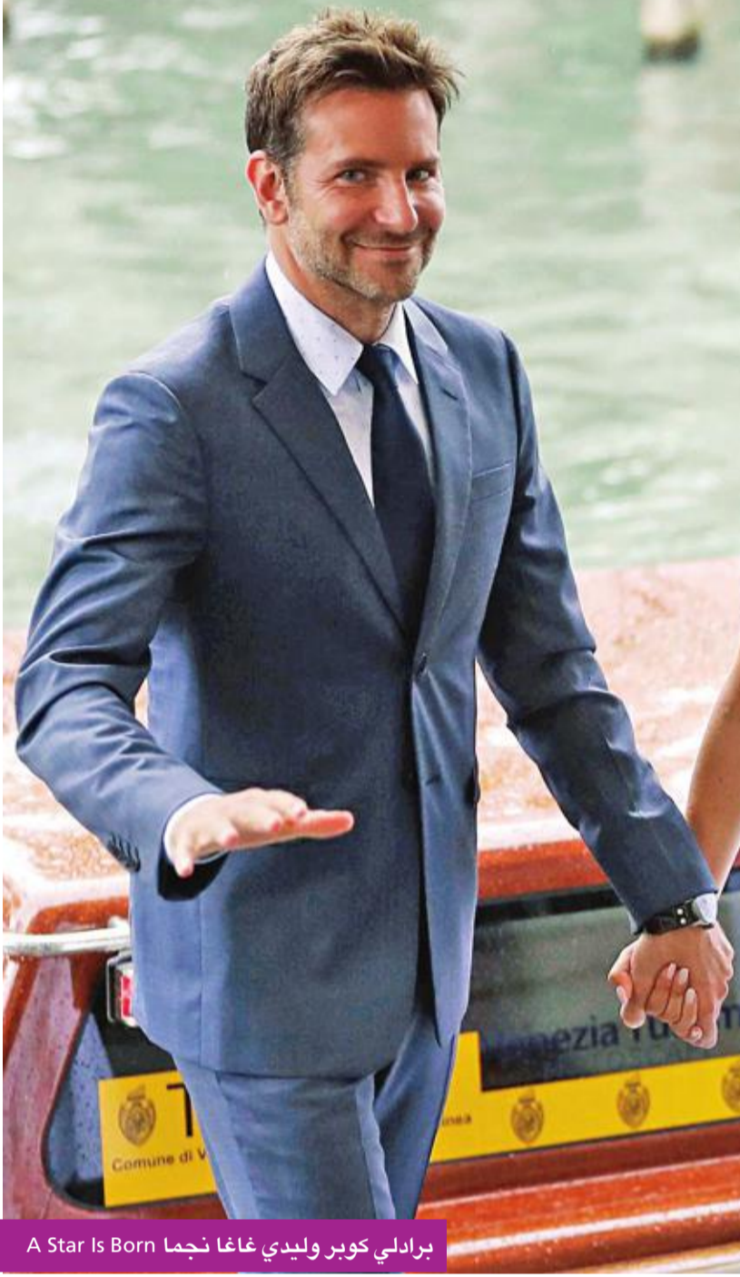
برادلي كوبر وليدي غاغا نجما A Star Is Born

من المقرر أن تكرم منظمة بيتا لحقوق الحيوان، الممثل الأمريكي برادلي كوبر، بجائزة التعاطف الافتتاحي في الأفلام، لاستعانتها بـكلبه الخاص في فيلمه الجديد (A Star Is Born).