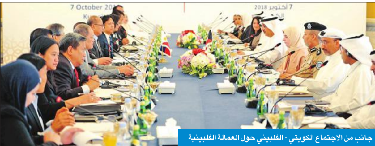
جانب من الاجتماع الكويتي - الفلبيني حول العمالة الفلبينية

الماضي حول تنظيم العمالة المنزلية الفلبينية في الكويت. وأشار إلى عمل الجانب الفلبيني (الشق القانوني) لإتمام الاتفاقية، لكي يخرج الاجتماع بنتائج إيجابية، مؤكداً أن تنفيذ الاتفاقية يصب في مصلحة البلدين الصديقين وثمره عمل الحكومتين.