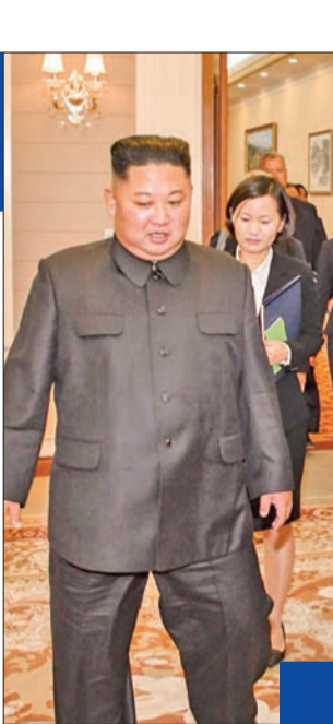
كيم وبومبيو في بيونغ يانغ

واعتقلت الشرطة عددا من المتظاهرين الذين تحشروا على بُعد أمتار من مدخل مبنى الكابيتول حيث مقر الكونغرس، ورغم الطوق الأمني الذي أغلق المنطقة المحيطة بالمبنى، وتمكن نحو 150 شخصا من أصل 2000 متظاهر، معظمهم نساء، من اختراق العوائق، وهتف