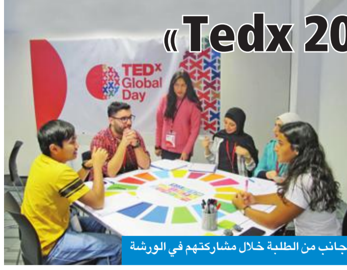
جانب من الطلبة خلال مشاركتهم في الورشة

ناشد عدد من الطلبة أحفاد العسكريين غير الكويتيين وزير التربية والتعليم العالي، وهيئة التطبيقي، الموافقة على استكمال إجراءات قبولهم في الهيئة، أسوة بقرار «التربية»، بإحاق أبناء هذه الفئة بالمدارس الحكومية، وقال الطلبة، في بيان صحافي تلقت «الجريدة» نسخة منه، إن بند قبول أبناء العسكريين لا يشملهم، ما تسبب في رفض تسلم مستنداتهم عند التسجيل لاعتمادها رسمياً، وخاصة بعد نشر أسماء قبولهم في الصحف الرسمية، وهو الأمر الذي دفعهم إلى المطالبة بإحاق أحفاد العسكريين بالبندي، ليستنى لهم الالتحاق بكليات الهيئة. وأكد الطلبة في مناشدتهم، أن الآمال ما زالت معقودة على وزير التربية وزير التعليم العالي د. حامد العازمي، بالسماح لهم بتسليم أوراقهم الرسمية وللحاق بركب العام الدراسي.