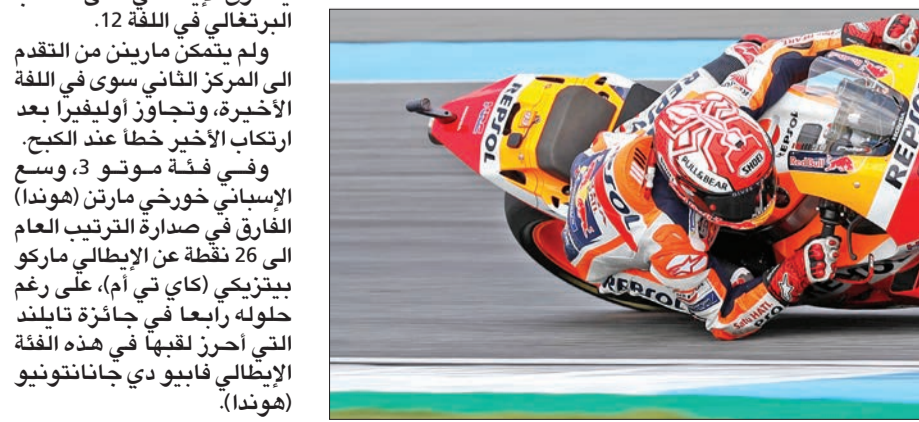
ماركيز خلال سباق تايلند

وفي فئة موتو 2، خطا الإيطالي فرانشييسكو بانيانا (كالكيس) خطوة إضافية نحو للمرة الأولى مرحلة من بطولة