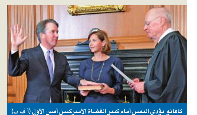
كافانو يؤدي اليمين أمام كبير القضاة الأميركيين أمس الأول

القي تثبيت القاضي بريت كافانو عضواً في المحكمة العليا الأميركية بخلال كثيفة على صورة أعلى هيئة قضائية في الولايات المتحدة، للمرة الأولى في تاريخها، إذ لم يسبق أن تعرض تعيين أي من أعضاء المحكمة لهذا النوع من الجدل والتشكيك، كما لم يسبق أن تم تثبيت أي قاضٍ بأصوات قليلة.