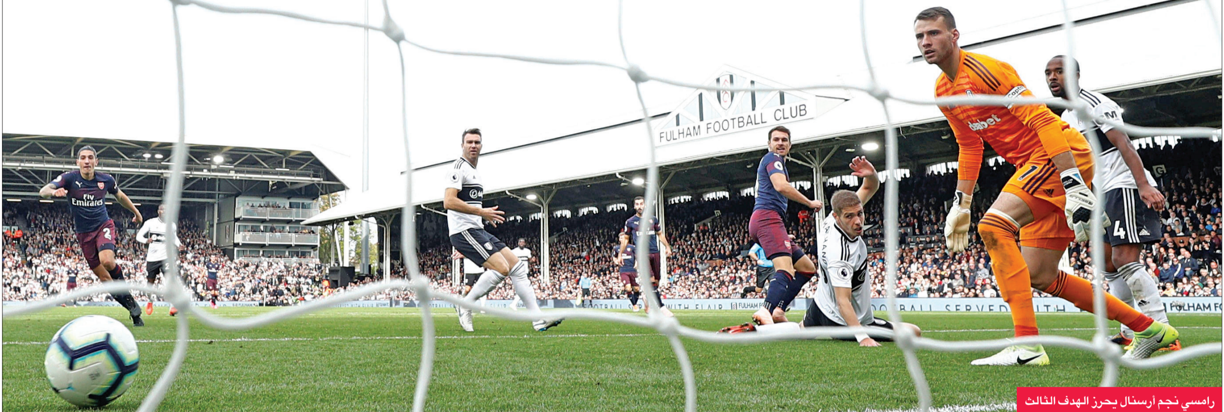
رامسي نجم أرسنال يحرز الهدف الثالث

سحق أرسنال مضيفة فولهام بخمسة أهداف مقابل هدف، أمس. في المرحلة الثامنة من الدوري الإنجليزي لكرة القدم.