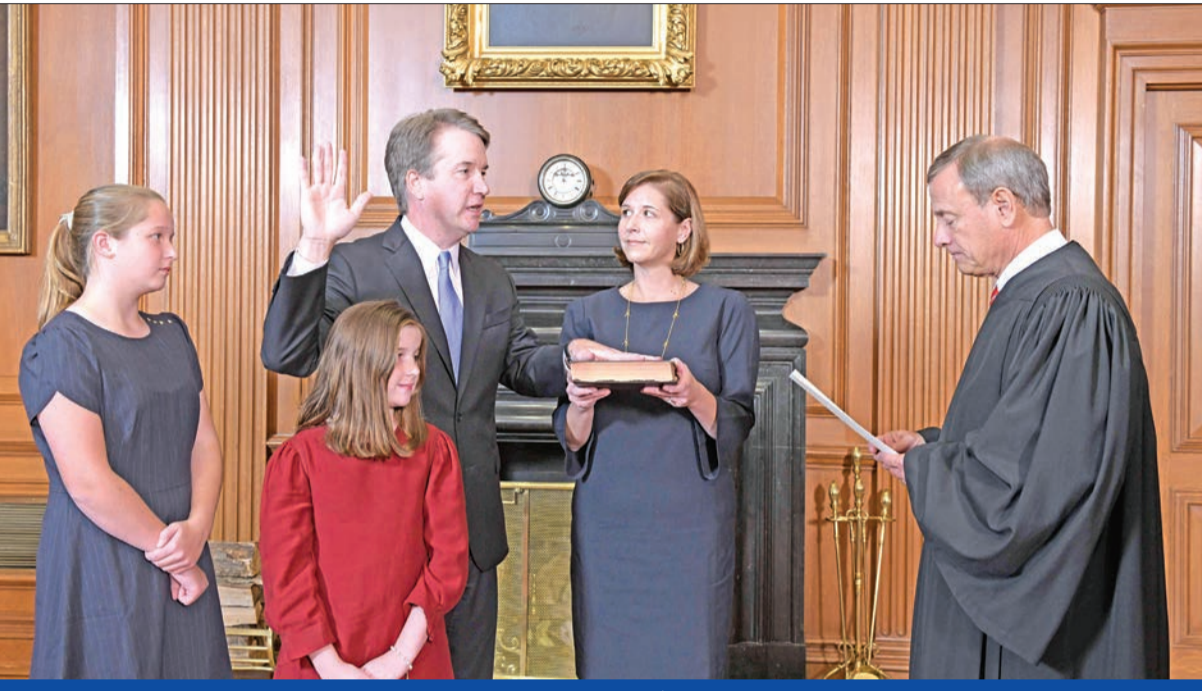
كافانو يؤدي اليمين أمام كبير القضاة الأميركيين عضواً بالمحكمة العليا أمس الأول في واشنطن

وصف الرئيس الأميركي دونالد ترامب تعيين القاضي المحافظ بريت كافانو عضواً في المحكمة العليا، بالانتصار الهائل، منتقدا خصومه الديمقراطيين الذين وصفهم بـ «المتطرفين والخطيرين جدا لتولي السلطة».