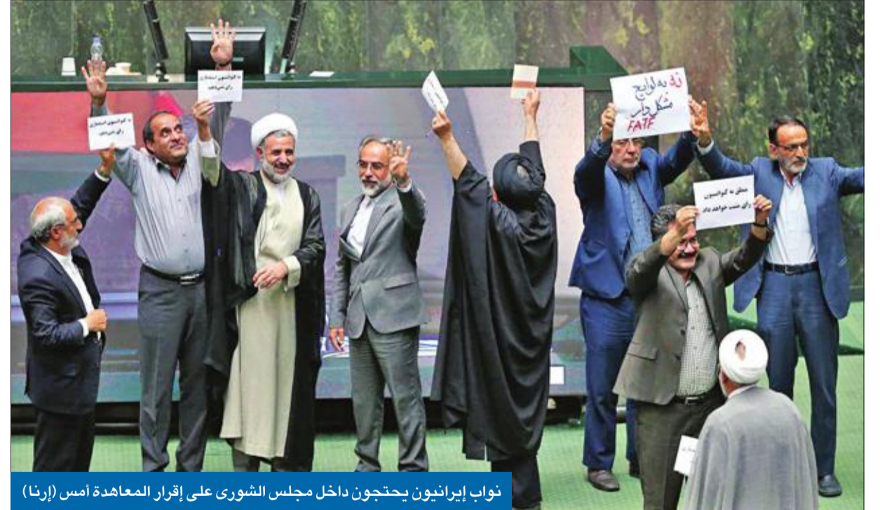
نواب إيرانيون يحتجون داخل مجلس الشورى على إقرار المعاهدة أمس

استجابة لشرط أوروبي لإنقاذ الاتفاق النووي