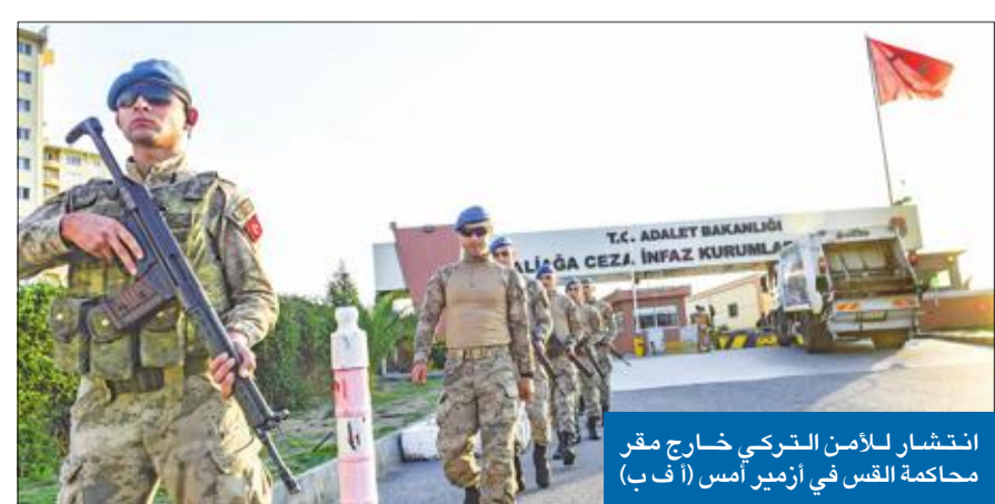
انتشار للأمن التركي خارج مقر محاكمة القس في أزمير أمس

الكرديستاني» المصنف إرهابياً. وبعد دخول الشهود في خلافات ومناقضة بعضهم بعضاً خلال الجلسة، أمرت محكمة علي آغا في منطقة أزمير بسجن برانسون ثلاثة أعوام وشهراً، لكنها أفرجت عنه قبل انقضاء المدة وأكثر من عام، نظراً لسلوكه خلال المحاكمة. وإذ أوصى الادعاء العام برفع الإقامة الجبرية ومنع السفر عن برانسون، بانتظار محاكمته في الاستئناف، طالب بسجنه حتى عشر سنوات بتهمة الانتماء إلى «جماعة إرهابية». وجاءت الخطوة، بعد تقارير تحدثت حول الأول عن توصل الولايات المتحدة وتركيا إلى اتفاق يطلق بموجبه 02