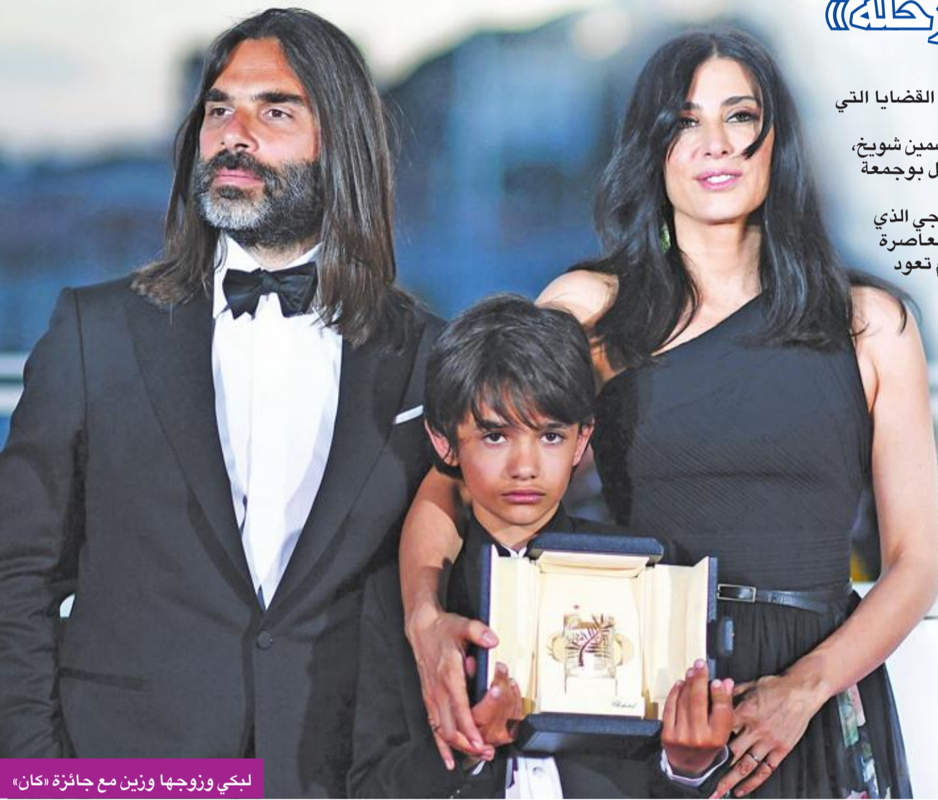
لبي وزوجها وزين مع جائزة «كان»

تتنافس 8 أفلام عربية من بين 87 فيلماً في الترشيح على جائزة أوسكار أفضل فيلم أجنبي، والدخول ضمن القائمة القصيرة للأفلام المرشحة للجائزة، المقرر إقامته 24 فبراير المقبل في دورته الـ 91، وهي: