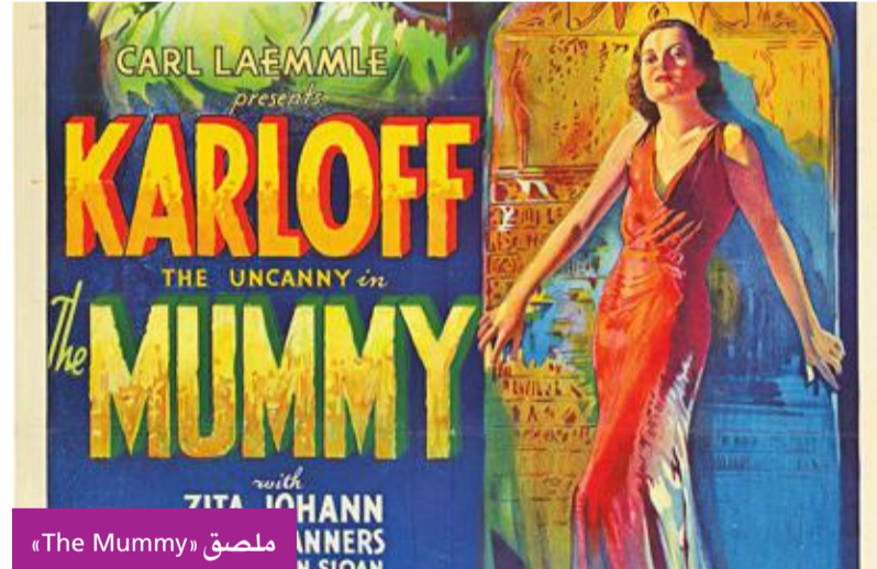
ملصق «The Mummy»