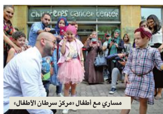
مساري مع أطفال «مركز سرطان الأطفال»