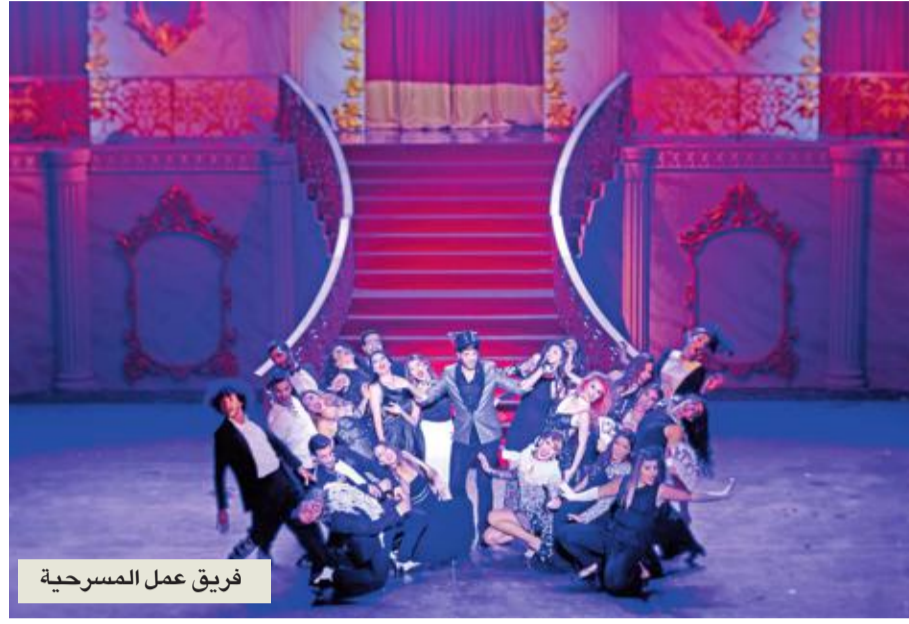
فريق عمل المسرحية

ثلاث ليال (12-13-14 أكتوبر)، تستضيف خشبة مسرح كازينو لبنان المسرحية الغنائية «مجنون ليلي» التي تستخدم أداء غامضاً في السيرك، بقيادة أحد اللاعبين، لإخبار قصة الحب الشهيرة بين ليلي وقيس. والعرض وهو العمل المسرحي الموسيقي الأول بالعربية لفرقة «ليلة واحدة في برودواي»، يشكل نمطاً جديداً في المسرح في لبنان يقوم على دمج الكلاسيكية والغرائبية في مشاهد تتنقل من قصة تنقلت بين الأجيال وترسم لها إطاراً جديداً يحاكي مفهوم الحب اليوم والعلاقات بين الناس.