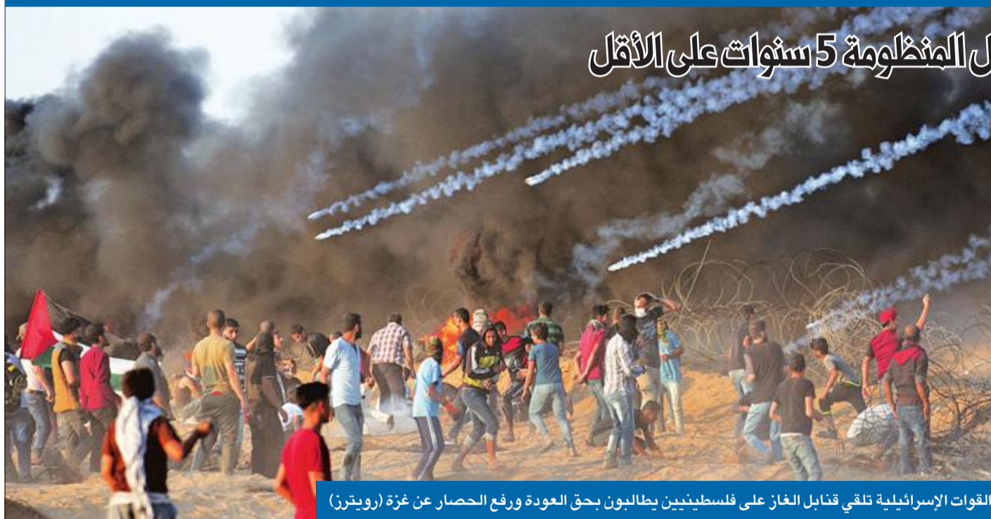
القوات الإسرائيلية تلقي قنابل الغاز على فلسطينيين يطالبون بحق العودة ورفع الحصار عن غزة

لا تزال اللقاعات بين الجانبين الإسرائيلي والروسي متواصلة بعد حادثة سقوط طائرة أيل 20 الروسية قبالة اللاذقية، وقرار موسكو تزويد دمشق بمنظومة S300 للدفاع الجوي، التي تخشاها إسرائيل على طائراتها المدنية أكثر من مقاتلاتها. وقبل لقاء متوقع بين الرئيس الروسي فلاديمير بوتين ورئيس الحكومة الإسرائيلي بنيامين نتنياهو، لإوضع اللمسات الأخيرة وإعلان انتهاء الأزمة بين البلدين، زار أخيراً وفد روسي لإيجاد صيغة جديدة لإعادة التنسيق بين جيشي البلدين. وقالت مصادر كبيرة لـ «الجريدة»، إن موسكو أبلغت إسرائيل أن الخبراء الروس سيشتغلون بمنظومة S300 التي