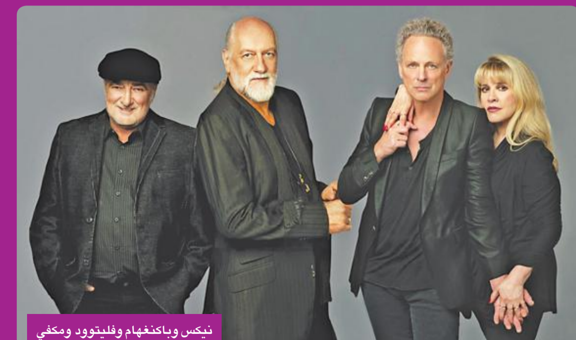
نيكس وباكنغهام وفلييتوود ومكفي

أقام عازف الغيتار ليندسي باكنغهام دعوى قضائية ضد زملائه بعد طرده من فرقة «Fleetwood Mac»، حسب ما أفادت وسائل إعلام، أمس الأول. وذكرت المجلة الشهيرة «رولينغ ستون» أن باكنغهام البالغ من العمر 69 عاماً، الذي تم تأكيد نيا فصله من فرقة الروك البريطانية الأميركية الأسطورية في أبريل، رفع دعوى قضائية في محكمة لوس أنجلوس العليا. ويقاضي باكنغهام الفرقة لخرق واجب الأمانة والعقد الشفهي، وكذلك التدخل