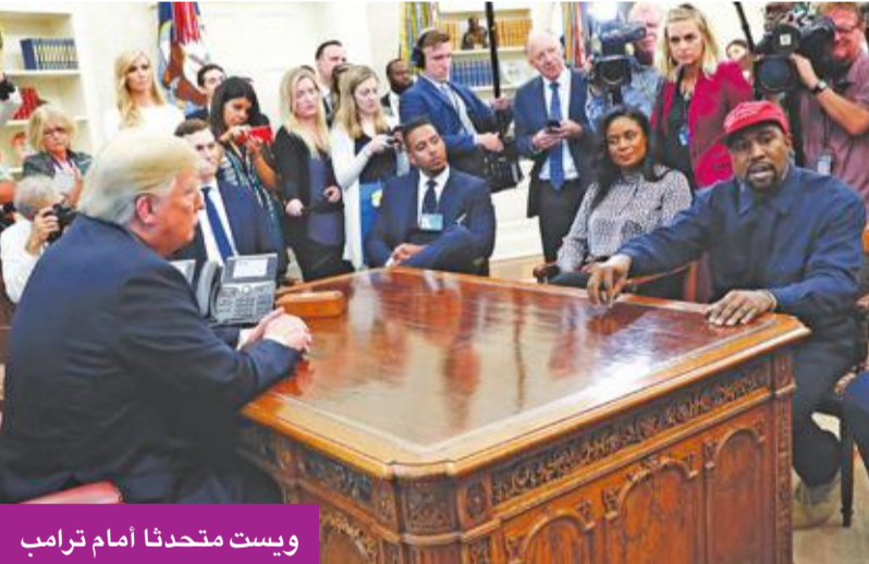
ويست يتحدث أمام ترامب

لُيستند إليها في إطلاق العنان للكثير من القضايا التي كانت طي النسيان. 5- «إلى آخر الزمان» (الجزائر) للمخرجة ياسمين شويخ، الفيلم بطولة جميلة عراس، وإيمان نوال بوجمعة جيلالي. 6- «الرحلة» (العراق) للمخرج محمد الدراجي الذي شارك به في قسم السينما العالمية المعاصرة بمهرجان تورنتو في 2017. أحداث الفيلم تعود إلى عام 2006 الذي شهد صراعات طائفية، وعمليات عنف في بغداد ومحافظات عراقية أخرى. 7- «بورن أوت» (المغرب) لإخراج نور الدين الخماري، هو الجزء الثالث من ثلاثية سينمائية بدأت بفيلم «كازانغرا» ثم فيلم «زيرو»، من بطولة: سارة برليس، وجيسيكا بومبيو، وأنس الباز، وفاطمة الزهراء الجوهري، وفاطمة هرايدي، والطفل إلياس. 8- «10 أيام قبل الزفة» (اليمن) للمخرج عمرو جمال، ويعد أول مشاركة للسينما اليمنية في الأوسكار، وأول فيلم طويل يُعرض للجماهير في اليمن، وتدور أحداثه حول علاقة عاطفية بين فتاة وشاب في عدن، قبل أن تندلع الحرب في المدينة وكيف تغيرت ظروفهم. الفيلم من تأليف مازن رفعت، وعمرو جمال، وشارك في بطولته سالي حمادة، وخالد حمدان.