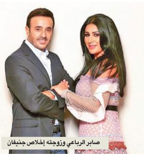
صابر الرباعي وزوجته إخلاص جنيفان

وجه صابر الرباعي معايدة استثنائية إلى زوجته إخلاص جنيفان بمناسبة عيد ميلادها، معبراً عن حبّه الكبير لها بأجمل الكلمات. ونشر أمير الطرب العربي صورة له مع زوجته على حسابه على «إنستغرام»، وقال: «كل سنة وانت أحلى وأعلى وأطف وأحن إنسانة في حياتي، زوجتي الحبيبة إخلاص عيد ميلاد سعيد ونيا رب تكوني دائماً حبيبتي ورفيقتي وسندي طول حياتي ومنبع سعادتي». وختم التعليق بعلامة قلب. ردت إخلاص بالقول: «كل الكلام... شوية فيك، ربي يخليك ليا، كذلك علقت الغفانة أصالة على المعايدة ذاكرة: «كل سنة وأنتوا كمان أحلى اتنين».