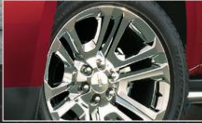
عجلات المنيوم قياس 22 إنش