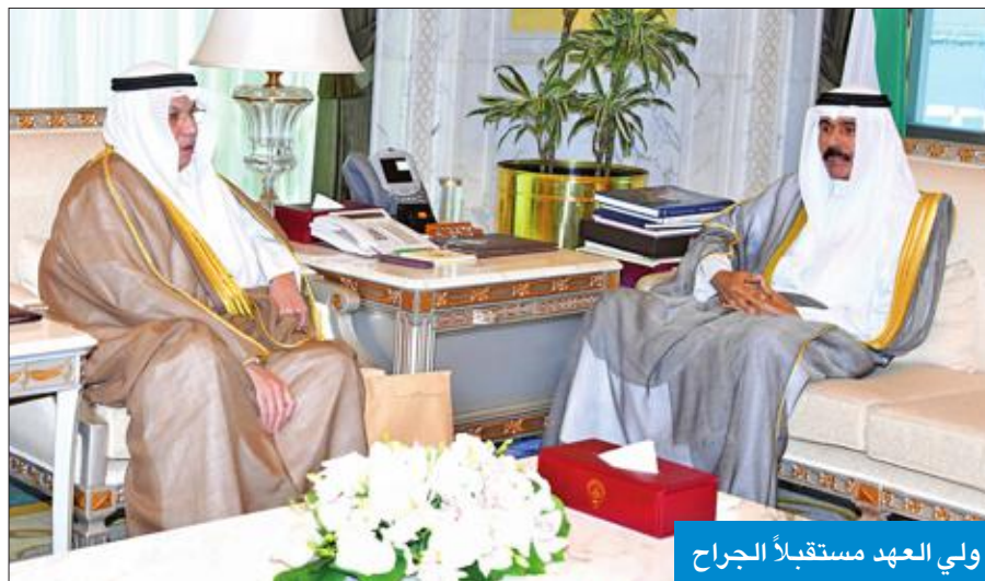
ولي العهد مستقبلاً الجراح

استقبل سمو ولي العهد الشيخ نواف الأحمد، بقصر السيف، صباح أمس، رئيس مجلس الأمة مرزوق الغانم، ورئيس مجلس الوزراء سمو الشيخ جابر المبارك. كما استقبل سموه، نائب رئيس مجلس الوزراء وزير الخارجية الشيخ صباح الخالد، ونائب رئيس مجلس الوزراء وزير الداخلية الشيخ خالد الجراح، واستقبل سموه، وزير المالية د. نايف الحجرف ورئيس مجلس إدارة شركة الخطوط الجوية الكويتية يوسف الجاسم، حيث قدما لسموه الرئيس التنفيذي لـ «الكويتية»، م. كامل العضوي، وذلك بمناسبة تعيينه في منصبه الجديد.