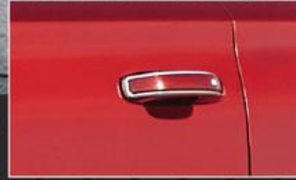
مسكات الأبواب من الكروم