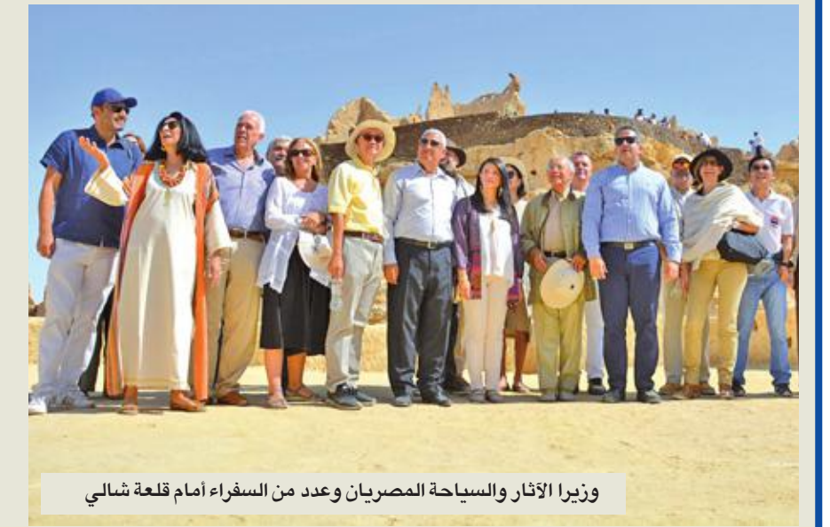
وزيرا الآثار والسياحة المصريان وعدد من السفراء أمام قلعة شالي

أطراف الواحة، وحين تجف المادة تصبح شديدة الصلابة وتتحمل عوامل الجو. تخضع «سيوة» الواقعة في عمق صحراء مصر الغربية (300 كيلومتر جنوب مدينة مطروح) لأعمال ترميم بدأت قبل