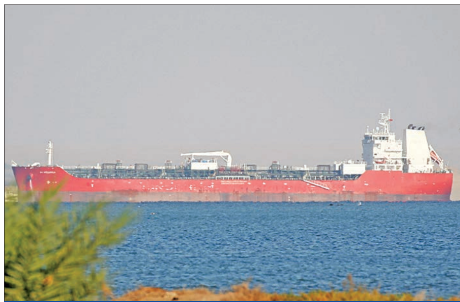
سفينة شحن تجر قبالة الإسماعيلية تستعد لدخول قناة السويس أمس الأول