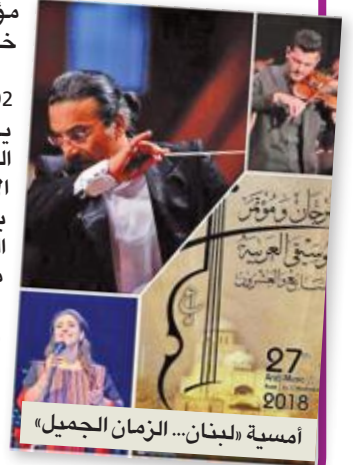
أمسية «لبنان... الزمان الجميل»

والمهرجان الذي تأسس في 1992، هو الأقدم عربياً الذي يتخصص في إحياء التراث الموسيقي، إذ ينظم على هامش الاحتفالات الغنائية جلسات بحثية في الشأن الموسيقي العربي والعالمية، وأبرز محاور هذه الدورة «الموسيقى العربية.. بين الواقع العربي والعالمية»، و«أفاق تعليم الموسيقى العربية»، و«دور وسائل التوثيق والنشر في تشكيل واقع الموسيقى عربيًا وعالمياً».