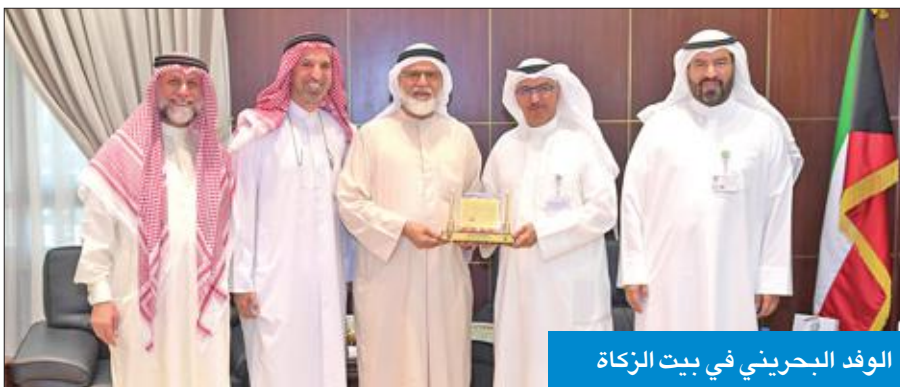
الوفد البحريني في بيت الزكاة

وفي ختام الزيارة أثنى رؤساء الوفود على المدير العام لبيت الزكاة والعاملين فيه على حفاوة استقبالهم وحسن ضيافتهم، كما أعربوا عن عميق شكرهم وتقديرهم لجميع موظفي البيت، لقاء الجهود الكبيرة التي يبذلونها في تسجيل الارتقاء بالعمل الخيري.