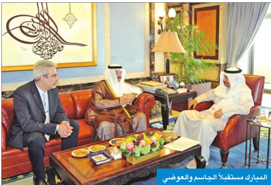
المبارك مستقبلاً الجاسم والعضوي

استقبل رئيس مجلس الوزراء سمو الشيخ جابر المبارك في قصر السيف أمس رئيس مجلس إدارة شركة الخطوط الجوية الكويتية يوسف الجاسم الذي قدم لسموه الرئيس التنفيذي للشركة كامل حسن العضوي بمناسبة تعيينه في منصبه الجديد.