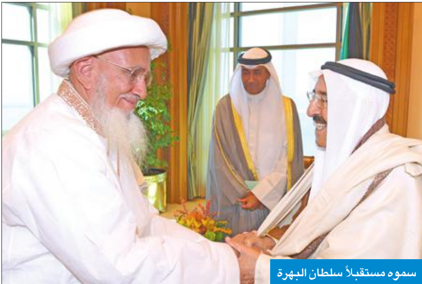
سموه مستقبلاً سلطان البهرة