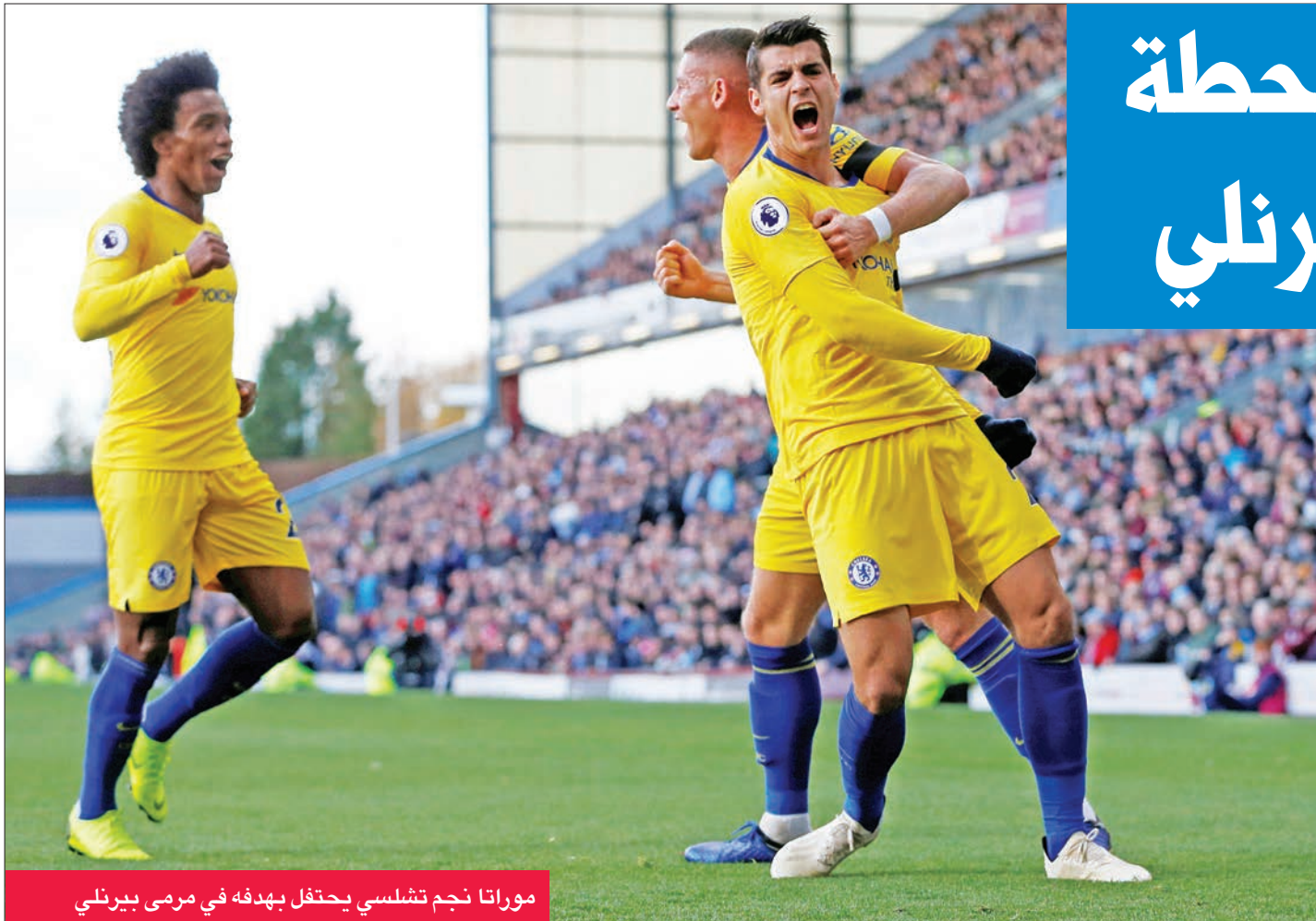
موراتا نجم تشلسي يحتفل بهدفه في مرمى بيرنلي

قال غوارديولا إن فريقه قدم فيها أفضل شوط أول في عهده. أما توتنهام فتلقى هزيمتين في البريميرليغ هذا الموسم. وتعادل 2-2 مع ايندهوفن الهولندي في دوري الأبطال، ما دفع مديره الأرجنتيني ماوريسيو بوكيتينو إلى الإقرار بأنه بات يحتاج إلى معجزة ليلوغ الدور الثاني في المجموعة الثانية، التي تضم أيضا برشلونة الإسباني وإنتر الإيطالي.