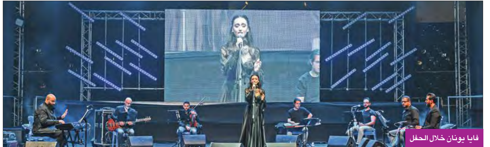
فايا يونان خلال الحفل

وعلى هامش الحفل عبرت يونان عن امتنانها وتقديرها لحديقة الشهيد لأول مره، مضيفة: «أنا سعيدة جداً بوجودي وسط الجمهور الكويتي الذي أتمنى أن التقي به مجددا».