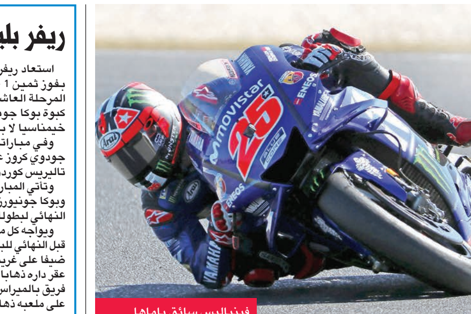
فينيالييس سائق ياماها

ويواجه كل من الفريقين اختبارا برازيليا صعبا في إياب الدور قبل النهائي للبطولة القارية حيث يحل ريفر بليت الثلاثاء المقبل ضيفا على غريميو الذي حقق الفوز على ريفر بليت 1 - صفر في عقر داره نهابا، في حين يلتقي بوكا جونيورز في اليوم التالي فريق بالميراس، علما بأن بوكا جونيورز حقق الفوز 2 - صفر على ملعبه نهابا.