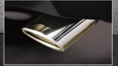
أطراف عادم من الكروم المطقول