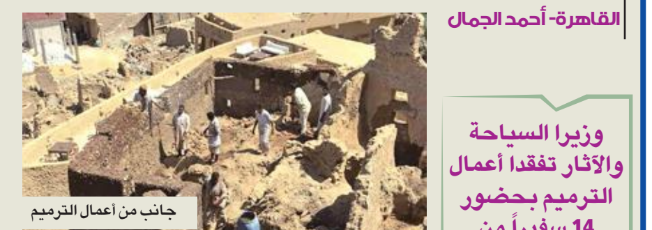
جانب من أعمال الترميم

تشهد «سيوة» أقدم واحة في مصر راهناً، أعمال ترميم واسعة لاستعادة طابعها التاريخي والأثري. تعتمد أعمال الترميم على استخدام مادة «الكرشيف» التي شُيدت بها البنايات القديمة في الواحة التي تضم مواقع أثرية إسلامية أبرزها قلعة شالي (سيوة القديمة) التي يعود تاريخ بنائها إلى عام 1203.