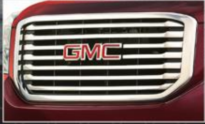
شبكة أمامية من الكروم