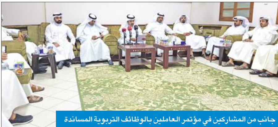
جانب من المشاركين في مؤتمر العاملين بالوظائف التربوية المساندة

طالبوا «التربوية» و«التعليمية» بإنصافهم بصرف كوادر مالية لهم