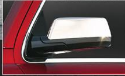
أغطية المرايا الجانبية من الكروم