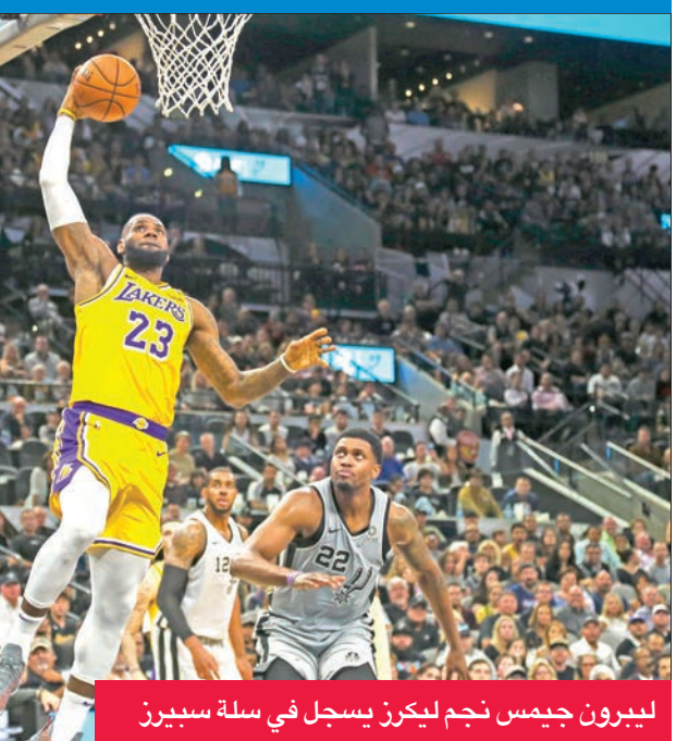
ليبرون جيمس نجم ليكرز يسجل في سلة سبيرز

على ملعب قاعة "سموثي كينغ سنتر" التابع لنيو أورليانز بيليكانز، قاد الإسباني ريكى روبيو والفرنسي رودي غوبير يوتا جاز لتحقيق فوزه الثالث هذا الموسم في 5 مباريات، بتسجيل الأول 28 نقطة مع 6 متابعات و12 تمريرة حاسمة، والثاني 25 نقطة و14 متابعة. وأفقد نيو أورليانز نجمه أنطوني ديفيس الغائب، بسبب إصابة في المرفق،