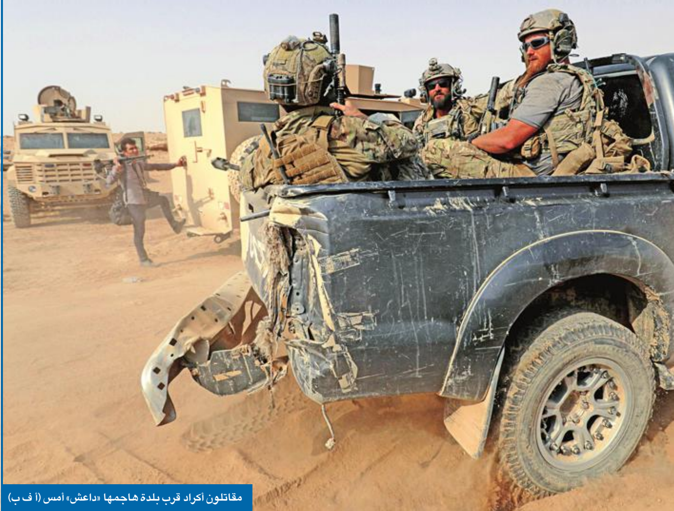
مقاتلون أكراد قرب بلدة هاجمها «داعش» أمس