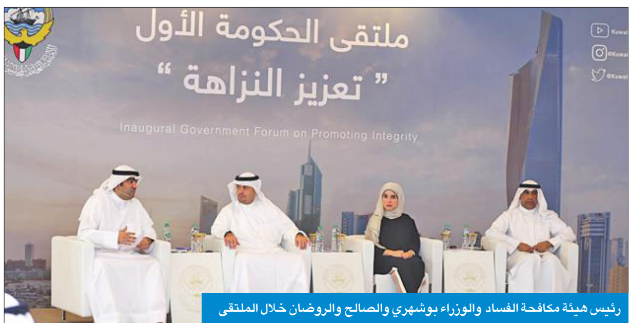
رئيس هيئة مكافحة الفساد والوزراء بوشهري والصالح والروضان خلال الملتقى

شدد رئيس مجلس الوزراء سمو الشيخ جابر المبارك، أمس على أنه لن يسمح بأن يكون هناك فساد في الجهات الحكومية، وأنه سيجمل قياديين تلك الجهات المسؤولية في حال وجود فساد.