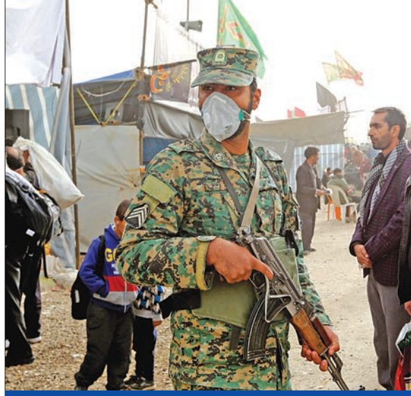
جنديان إيرانيان على متفد مهراّن مع العراق حيث يعبر مئات الآف الزوار الشيعة للمشاركة في أربعين الإمام الحسين

تقديم طهران الطلب من خلال المجلس الأعلى للأمن القومي الإيراني. وقال المصدر إن أكثر من 200 عنصر من الوحدات الخاصة للمخاووير التابعين للجيش الإيراني استقرت بالفعل على الحدود الإيرانية-الباكستانية في حالة تأهب بانتظار جواب السلطات الباكستانية، وأرسلت إيران خمس طائرات مقاتلة من نوع سوخوي، و10 مليكوبترات وطائرات سي 130 إلى مطار زاهران.