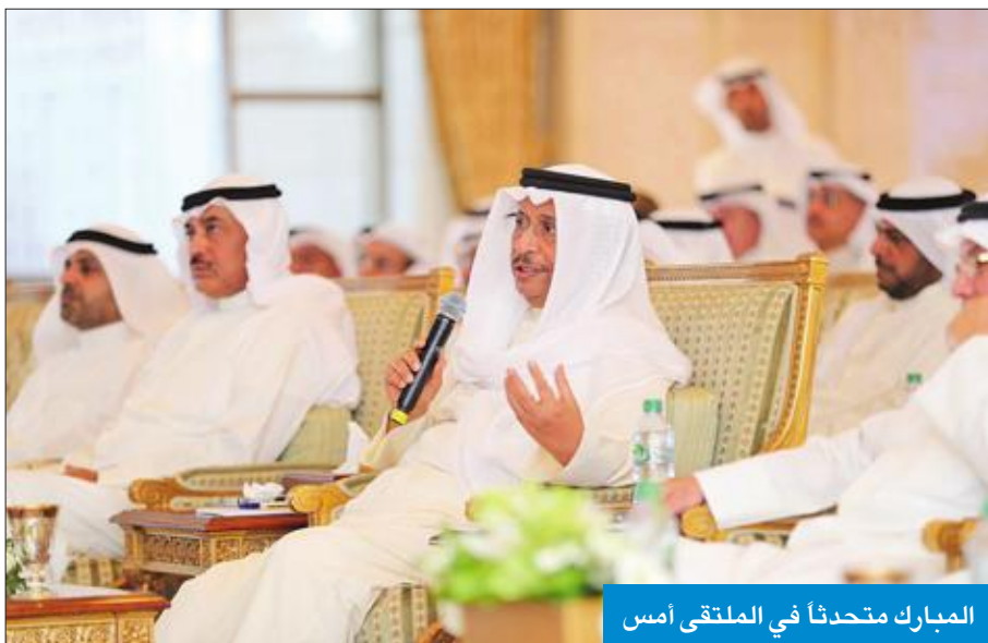
المبارك متحدثاً في الملتقى أمس

أجهزتنا وأنتم أكثر منا دراية بمواطني الفساد وكيفية القضاء عليه. وتابع: «سوف أكون العون لكم في مكافحة الفساد، وسوف أكون أيضاً ضدكم إذا لم أجد أي خطوات إيجابية ضد الفساد.»