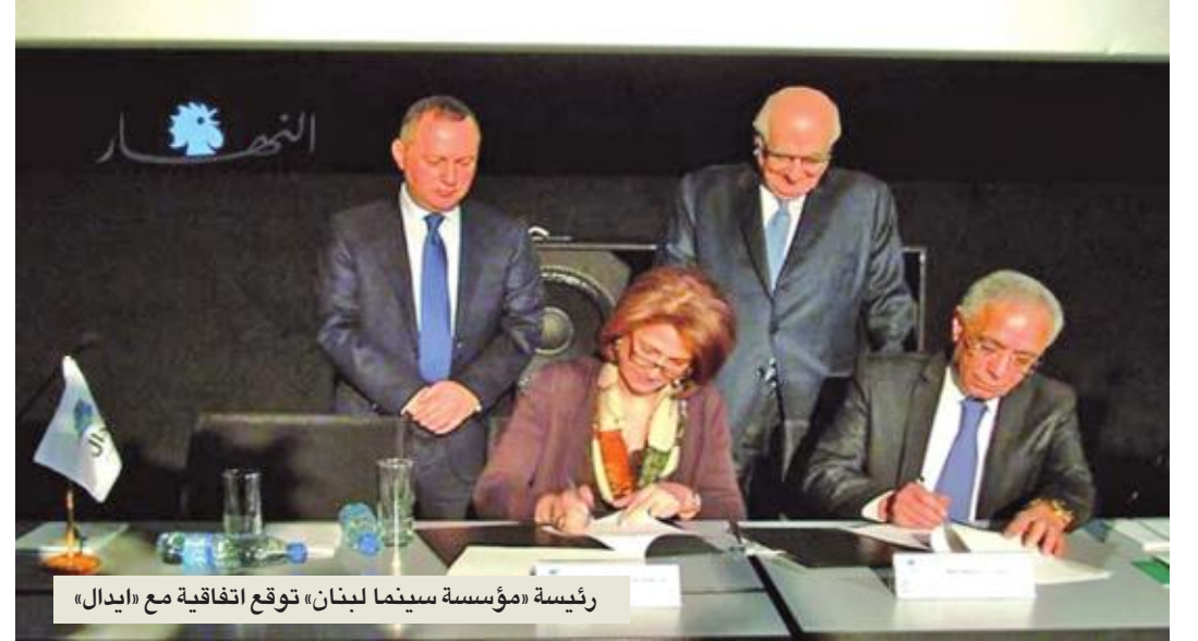
رئيسة «مؤسسة سينما لبنان» توقع اتفاقية مع «إيدال»

بالتعاون مع المعهد الفرنسي في لبنان تنظم «مؤسسة سينما لبنان» ورشة عمل إعادة كتابة سيناريو فيلم روائي طويل، في دورتها التاسعة، وتمتد على دورتين: الأولى من 14 إلى 18 يناير 2019، والثانية في أواخر مارس. في هذا السياق، تلقت المؤسسة اقتراحاً لـ 18 مشروعاً، اختارت أربعة، سيعمل أصحابها مع خبير من كندا وآخر من فرنسا لمدة