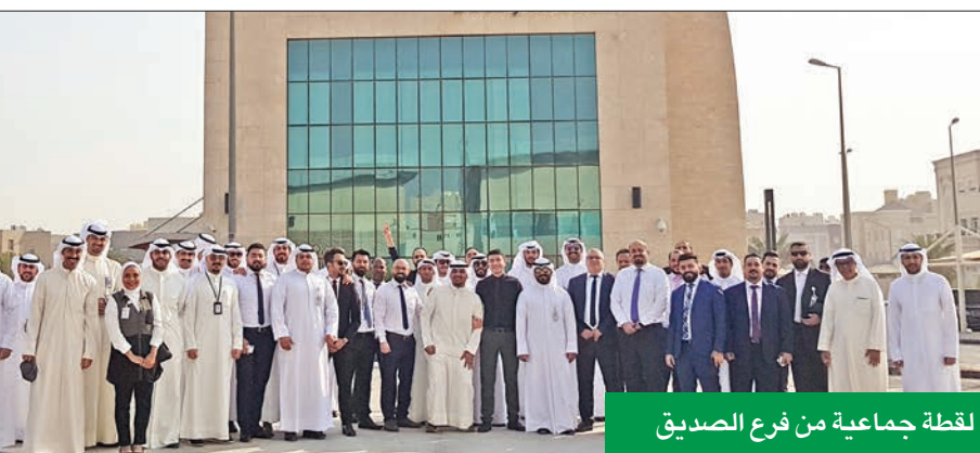
لقطة جماعية من فرع الصديق

تحقيق أعلى مستويات الجاهزية والاستعداد لحالات الطوارئ التي يمكن أن تواجهها. وأضاف اللوغاني: يعد الاستثمار في مجال الأمن والسلامة من أهم المجالات التي نحرض عليها، سواء من خلال الاستثمار في الموارد البشرية المعنية بذلك أو المعدات والأجهزة التي يمتلكها البنك والتي تعتبر الأحدث على مستوى العالم. وأشاد باستعداد موظفي بنك بوبيان للتعامل أثناء عمليتي الإخلاء الوهمي، حيث تم إنهاء الإخلاء في وقت قياسي، وبأقل من الوقت المقرر للتعليق، وهو ما يؤكد مدى جاهزيتهم واستعدادهم لحالات الطوارئ.