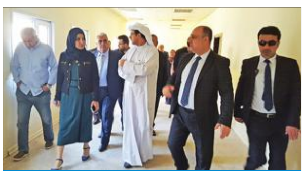
الكندري واختصاصيو التربية يتفقدون مدارس النازحين

تفقد وفد كويتي يضم اختصاصيين في مجال التربية والتعليم أمس برفقة الفضل العام الكويتي في اربيل عدداً من مدارس النازحين العراقيين شمال العراق.