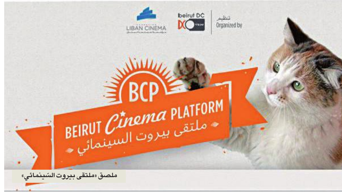
ملصق «ملتقى بيروت السينمائي»

بدأت «بيروت دي سي» و«مؤسسة سينما لبنان» قبول طلبات المشاركة في الدورة الرابعة من «ملتقى بيروت السينمائي» الذي يعقد بين 29 و31 مارس 2019. وتختار لجنة تحكيم متخصصة 15 فيلماً للمنافسة في المسابقة الرسمية. يندرج هذا الملتقى ضمن أهداف «مؤسسة سينما لبنان» التي تعمل كوسيط بين القطاعين الخاص والعام من أجل تنظيم قطاع الأفلام في لبنان وإضفاء الطابع المهني عليه.