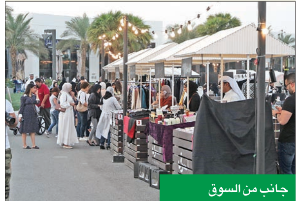
جانب من السوق

أعلنت Ooredoo دعمها لمشروع «سوق مروج»، الذي يساند المشاريع الشبابية، والذي أقيم بجمع مروج للعام الثالث على التوالي الجمعة الماضي (26 الجاري)، وضم المنتجات الزراعية والغذائية والحرف اليدوية، إضافة إلى القسم المخصص للاطعمة، الذي يسلط الضوء على تنوع الأطعمة المحلية، إلى جانب قسم خاص لأنشطة الأطفال، على مدار عطلة نهاية الأسبوع مرة واحدة حتى نهاية مارس 2019، حيث أقيم أول سوق لهذا الموسم في 26 الجاري.