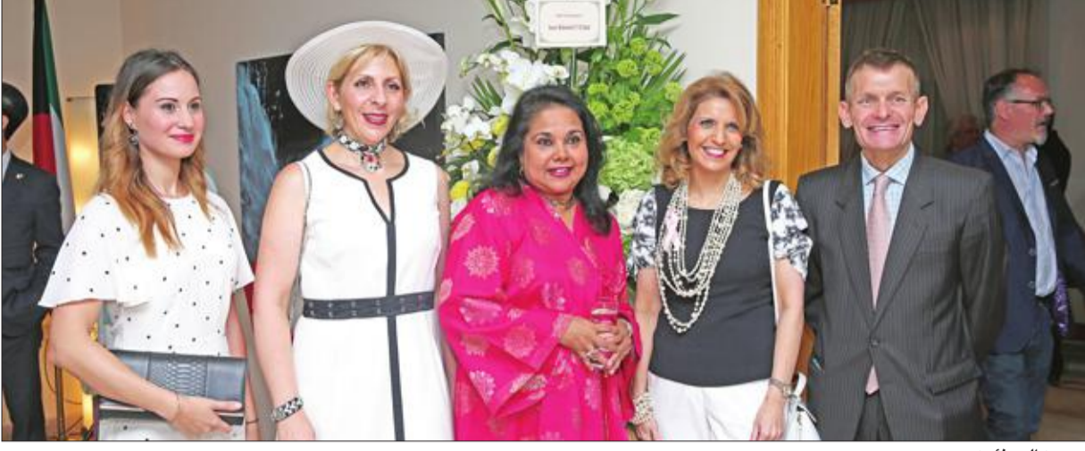
عدد من المهنئين