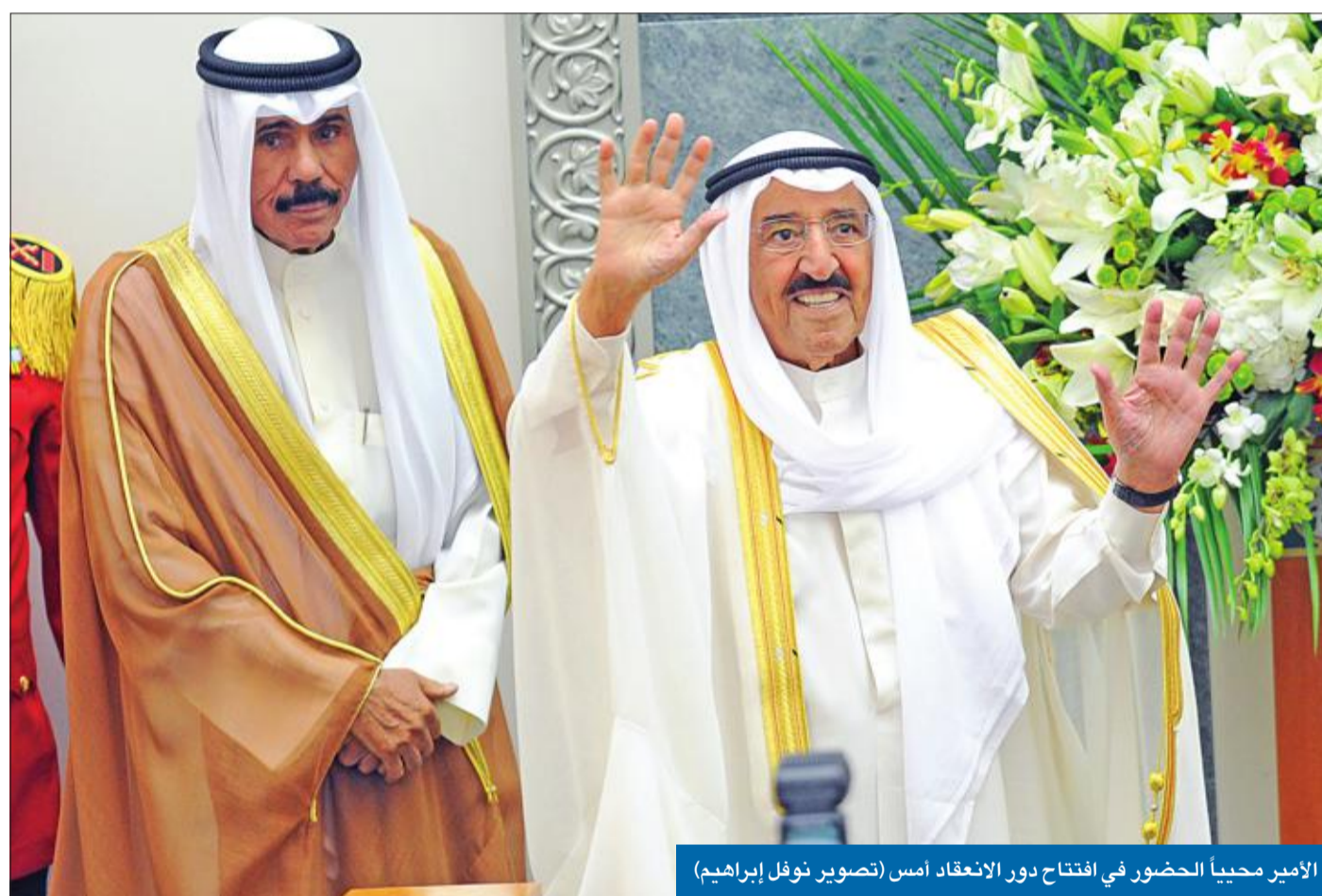
الأمير محيياً الحضور في افتتاح دور الانعقاد أمس

دعا سمو أمير البلاد الشيخ صباح الأحمد إلى الحرص على النظام الديمقراطي والدفاع عنه وصيانته من كل تجاوز على قيمه أو تعسف في ممارسته، حتى لا تصبح الديمقراطية «معول هدم وتخريب، وأداة للهدر مقدرات البلد وتقويض مقوماته»، معقبا: «بحكم المسؤولية والأمانة التي أحملها في عنقي، أقول بكل صراحة وجدية: لن أسمح بأن نحيل نعمة الديمقراطية التي ننحيا ظللها إلى نقمة تهدد الاستقرار وتهدم البناء وتوق الإنجاز». وأكد سموه، في كلمته خلال افتتاح دور الانعقاد الثالث للفصل التشريعي الـ 15 لمجلس الأمة أمس، إيمانه بالديمقراطية فكراً ونهجاً وممارسة، وحرصه على دعمها، مشيراً إلى أنه «ما زالت هناك ممارسات سلبية ومواقف وطروحات ومشاريع عبثية لا تخدم في حقيقتها مصلحة الوطن، بل تسعى إلى اكتسب الانتخابي