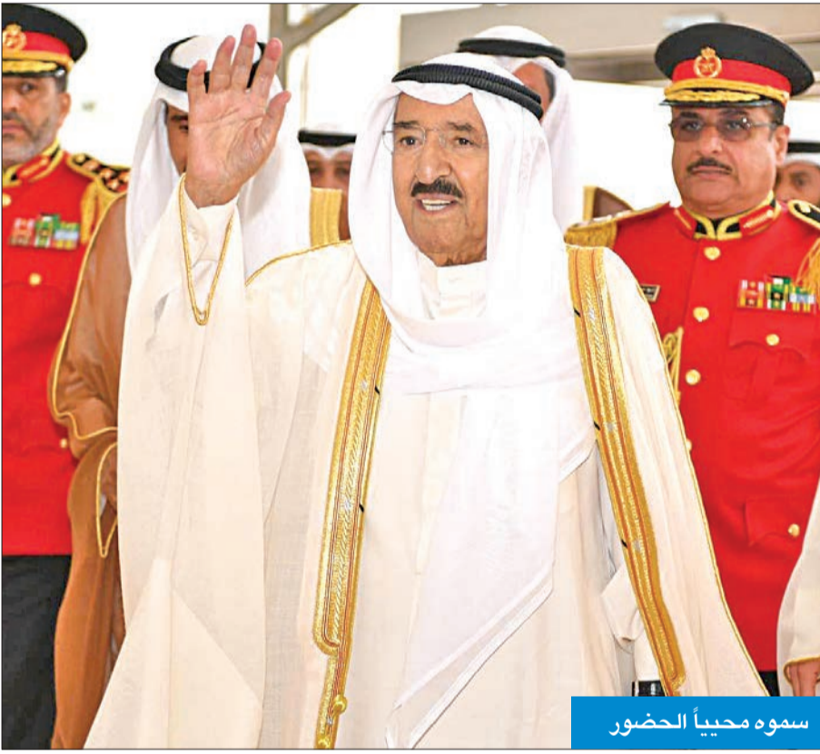
سموه محيياً الحضور

وأضاف سموه أن هذه الممارسات السلبية تارة تعرف على أوتار الطائفية البغيضة وتارة تطرح مشاريع براءة تدعغ عواطف البسطاء، مشيراً إلى أنها في حقيقتها تلحق ضرراً بالغاً بالدولة والمجتمع حاضراً ومستقبلاً. وقال سموه أنه «بحكم موقع المسؤولية والأمانة التي أحملها في عنقي أقول بكل صراحة وجدية: لن أسمح بأن نحيل نعمة الديمقراطية التي نفيها ظللالها إلى نقمة تهدد الاستقرار في بلدنا وتهدم البناء وتعيق الإنجاز». وفيما يلي نص كلمة سموه: