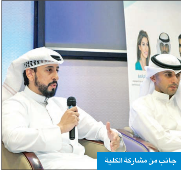
جانب من مشاركة الكلية