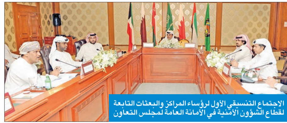
الاجتماع التنسيق الأول لرؤساء المراكز والبعثات التابعة لقطاع الشؤون الأمنية في الإمارة العامة لمجلس التعاون

ناقش اجتماع رؤساء المراكز والبعثات التابعة لقطاع الشؤون الأمنية في الإمارة العامة لمجلس التعاون، تطوير الشراكة لمواجهة التحديات الجديدة، خصوصاً في مجال الإرهاب والجريمة المنظمة والاتجار بالبشر.