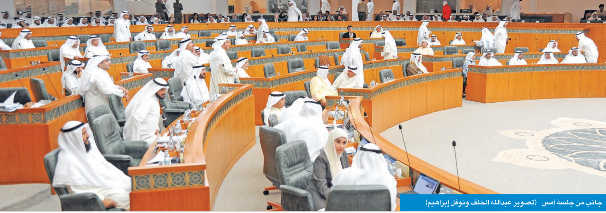
جانب من جلسة أمس

رفع استجواب رئيس الوزراء من جدول الأعمال بناء على طلب الموزير والمطير