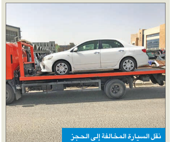
نقل السيارة المخالفة إلى الحجز

نكرت الإدارة العامة للعلاقات والإعلام الأمني بوزارة الداخلية أنه تم حجز المركبة التي ظهرت في مقطع الفيديو المتداول على مواقع التواصل الاجتماعي، وهي تسير بالطريق ومحملة بأغراض خرجت من المركبة، معرضة مرتادي الطريق للخطر.