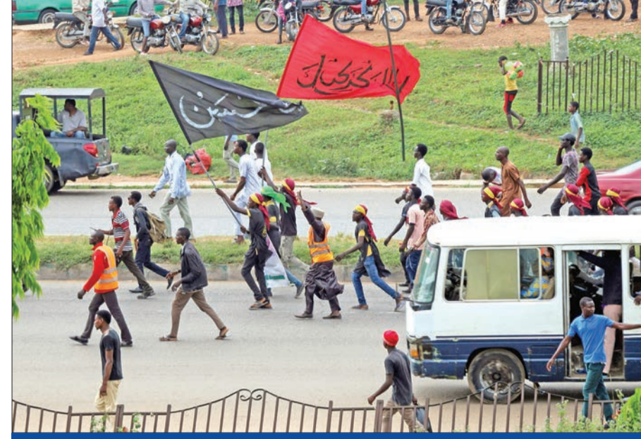
أنصار «حركة نيجيريا الإسلامية» يتظاهرون في أبوجا أمس الأول

وتسبب القمع العنيف للحركة، واعتقال زعيمها في توجيه اتهامات لحكومة الرئيس محمد بخاري بانتهاك حقوق الإنسان. وتقول الجماعة إنه يتعين الإفراج عن زكزاكي بعدما قضت المحكمة بأن احتجازه من دون اتهام غير قانوني.