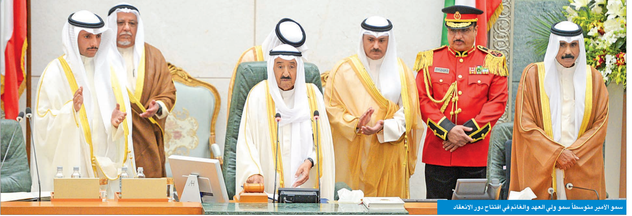
سمو الأمير متوسلاً سمو ولي العهد والغانم في افتتاح دور الانعقاد

سموه دعا في افتتاح الانعقاد الثالث من الفصل الـ 15 إلى الحرص على النظام الديمقراطي وصيانته من التعسف