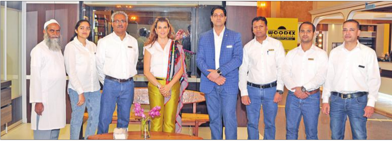
صورة جماعية لعدد من المشاركين