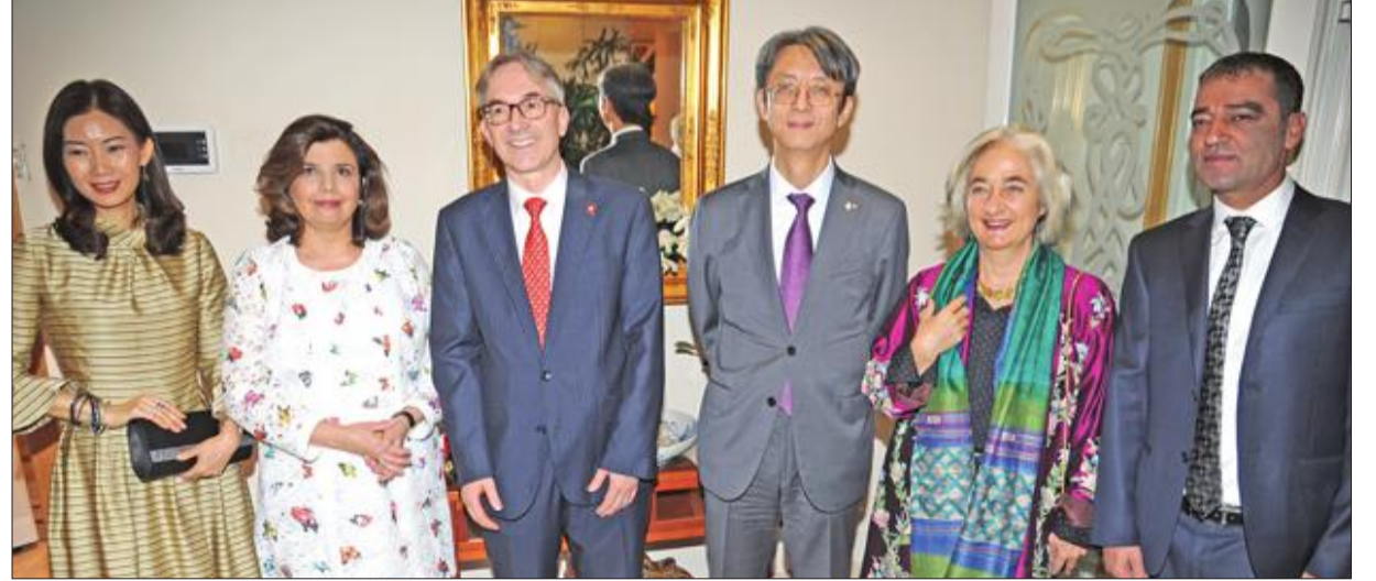
السفير غوبلز لدى استقباله الدبلوماسيين