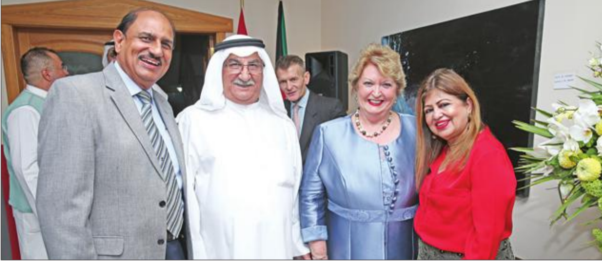
بعض ضيوف الحفل

أقام سفير سويسرا لدى الكويت بينديكت غوبلز حفل استقبال في منزله بمناسبة العيد الوطني لبلاده، بحضور مساعد وزير الخارجية لشؤون أوروبا السفير وليد الخيزي، وحشد كبير من رؤساء البعثات الدبلوماسية، وممثلين عن المنظمات الدولية. وتخلل الحفل استضافة فرقة موسيقية، إضافة إلى معرض لفنانين كويتيين.