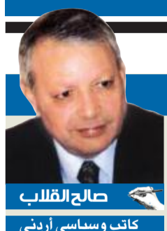
صالح القلب كاتب وسياسي اردني