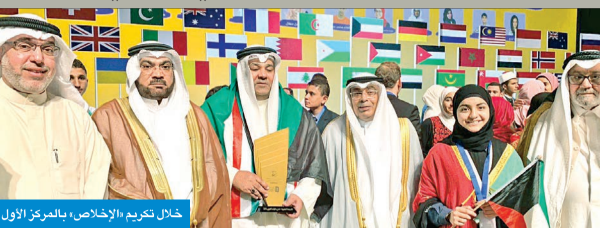
خلال تكريم «الإخلاص» بالمركز الأول

الحافل بالإنجازات التربوية المتلاحقة تحت راية وزير التربية وزير التعليم العالي خلال مسيرة المشاركات في المسابقات والجوائز المحلية والعربية والعالمية. ولفت إلى أن هذا الإنجاز يأتي ضمن خطة واهداف «التربية»، التي تسعى إلى تحقيقها، وتقديم جميع سبل الدعم للمدارس المتميزة، والرعاية للطلاب والطالبات كافة، خصوصاً المتميزين والموهوبين.