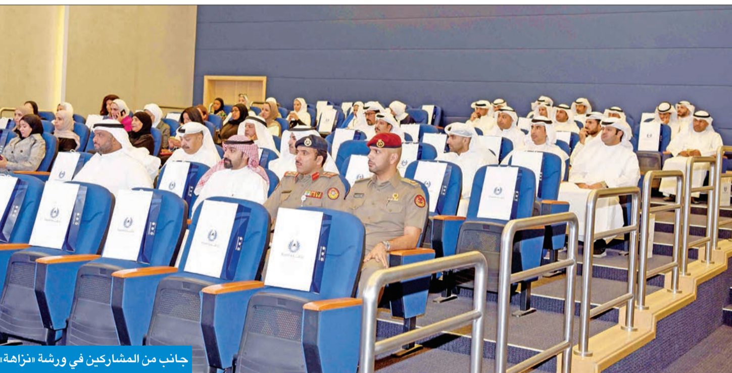
جانب من المشاركين في ورشة «نزاهة»

في ذمتهم المالية وتحسين أدائهم وتعزيز الثقة بالأجهزة الحكومية وموظفيها بالإضافة إلى تحقيق الوقاية والرقابة لهم.