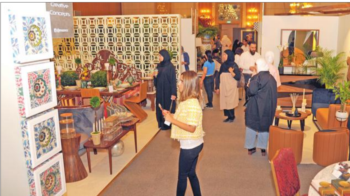
جانبا من المعرض