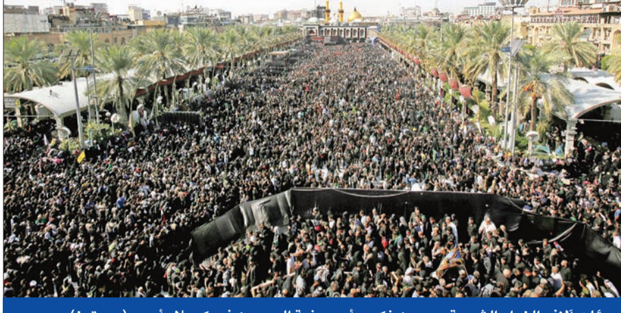
مئات الآف الزوار الشيعة يحيون ذكرى أربعينية الحسين في كربلاء أمس

ولم تعلن أي جهة مسؤوليتها عن الهجوم، لكن اراهبيين من تنظيم «داعش» ينشطون في المنطقة واستهدفوا زوارا شيعة من قبل. من ناحية أخرى، أعلن اللواء الركن قاسم المحمدي، قائد عمليات الجزيرة والبادية، أن الحدود العراقية-السورية مؤمنة ولا تهديد عليها من عناصر «داعش» في أقصى غربي العراق.