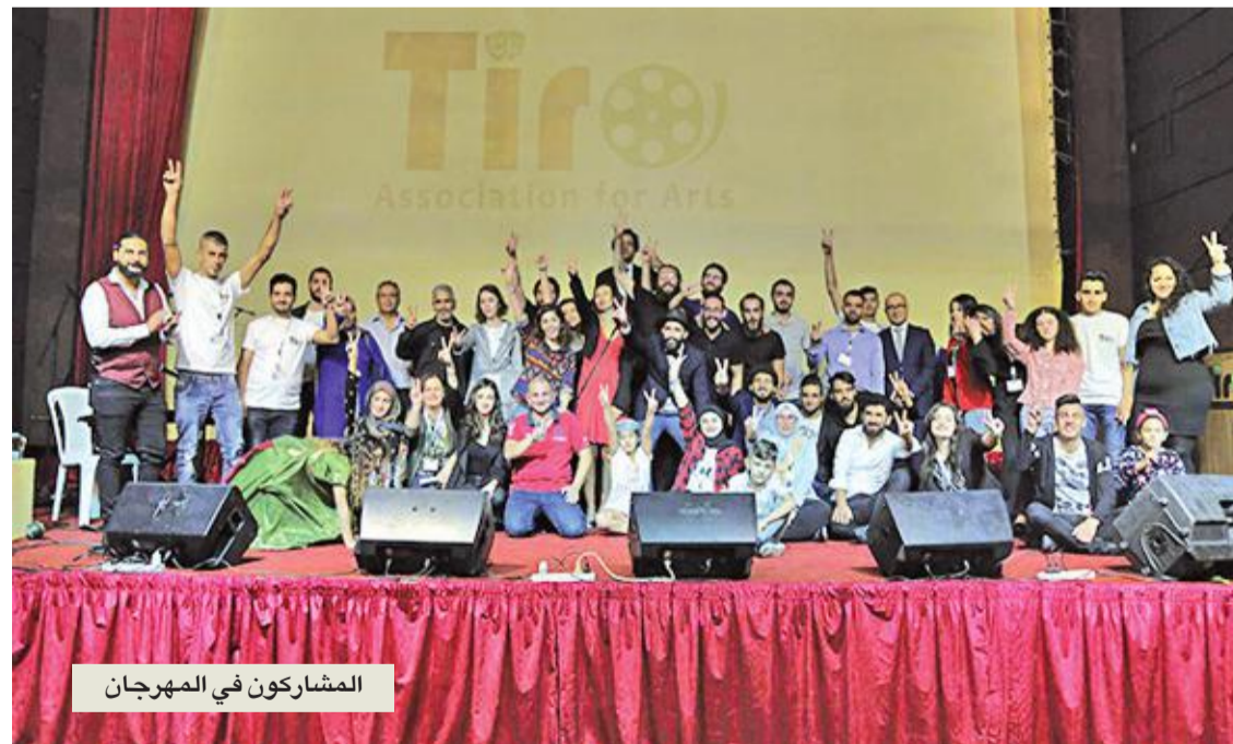
المشاركين في المهرجان

الضال من سلسلة وثائقي الإنترنت «زيارة»، الحاصل على جوائز عدة، من إنتاج «جمعية هوم أوف سيني جام» التي تعمل على إلهام الشفاء الاجتماعي والعاطفي وتحفيزه، من خلال أفلام قصيرة وأقاصيص حقيقية.