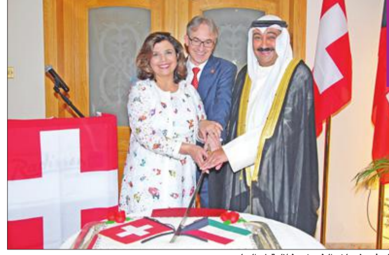
السفير غوبلز والخيزي خلال قطع الحلوى