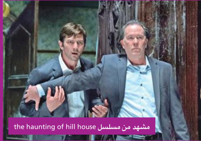
مشهد من مسلسل the haunting of hill house

احتفلت النجمة الهندية بريانكا شوبرا بحفل «هدايا العروسة» وذلك بمقر شركة المجوهرات العالمية «تفاني» في مدينة نيويورك الأمريكية. وظهرت بريانكا بإطلالة ساحرة خلطت بها الأناظر وهي فستان أبيض شبيه بفساتين الزفاف، وذلك فور وصولها قبيل حفل زفافها المنتظر من خطيبها النجم نيك جونز. إذ نشرت بريانكا عدداً من الصور الخاصة بالاحتفال عبر حسابها الرسمي على «إنستغرام»، كما حضرت المناسبة والدتها «مادوه شوبرا» وعدد من صديقاتها المقربين إلى جانب اصداقها من نجوم ونجمات هوليوود. وكشفت تقارير إعلامية في وقت سابق عن الموعد الرسمي لحفل زواج بريانكا ونيك جونز، والمقرر إقامته في شهر نوفمبر المقبل، وذلك في فندق قصر أوبد باهوان ويقع في ولاية راجستان، الهند. وجاء الخبر وفقاً لمصدر مقرب من النجمين، الذي أكد أنهما خلال زيارتهما الأخيرة للهند، زارا بزيارة القصر وقررا أنه المكان الأنسب لإقامة حفل زفافهما، ومن المقرر أن تقيم بريانكا حفل وداع العزوبية خلال الشهر الجاري في مدينة نيويورك الأمريكية.