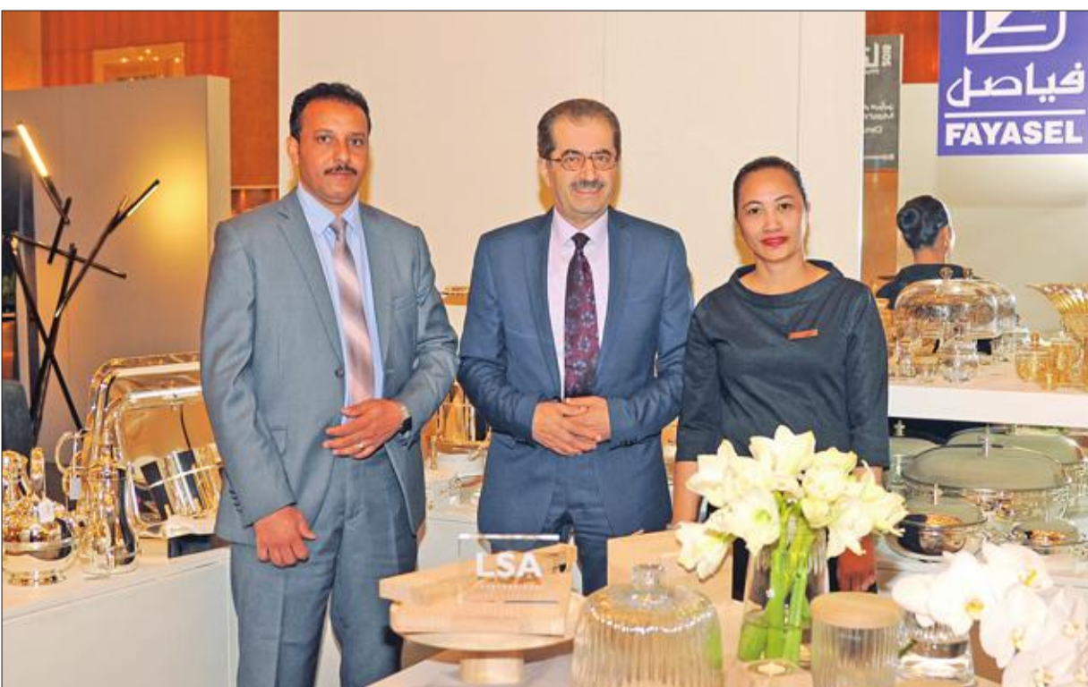
بعض المشاركين في المعرض

وتم تصميم وتنفيذ مشروع «سوب بوكس» وفق أعلى المعايير والمقاييس العالمية، بعد أن تمت دراسة احتياجات المبادرين ومتطلباتهم، ويحتوي «سوب بوكس» على 12 وحدة (محل)، منها واحدة مخصصة لنشاط كوفي شوب، وأخرى مخصصة لنشاط مطعم.