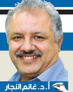
أ.د. غانم النجار