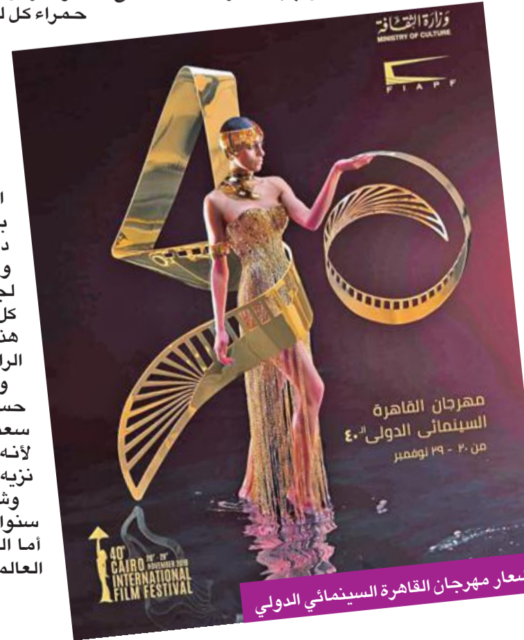
شعار مهرجان القاهرة السينمائي الدولي

أعلنت إدارة الدورة الـ 40 من مهرجان القاهرة السينمائي الدولي الذي يقام خلال الفترة بين 20 و 29 شهر نوفمبر المقبل أسماء أعضاء لجنة تحكيم المسابقة الدولية ويترأسها المخرج الدنماركي العالمي بيل أوغوست صاحب الأوسكار والسعفتين الذهبيتين. وتضم اللجنة في عضويتها كلاً من الممثلة الكازاخية سامال سيلياموفا آخر من حصل على جائزة أحسن ممثلة من مهرجان كان، والمخرج البلجيني بريانتي ميندوزا صاحب «كينتاي» الفائز بأحسن مخرج في مهرجان كان، والممثلة اللبانية ديامان بو عيود الفائزة بجائزة أحسن ممثلة من مهرجان القاهرة في دورته الماضية، والمنتج والكاتب الأرجنتيني المرشح للأوسكار خوان فيرا. وإيضاً تضم النجمة البلجيكية ناتاشا رينيه التي جمعت جائزة أفضل ممثلة في مهرجان كان وجوائز الفيلم الأوروبي وجوائز سيزار، المخرجة المصرية الحاصلة على الجوائز هالة خليل، المخرج الإيطالي فرانثيسكو مونزي الفائز بخمس جوائز مختلفة من مهرجان فينيسيا، والممثل التونسي صاحب الحضور البارز في السينما المصرية والعالمية طاهر العابدين. من جهة أخرى، أكد المنتج