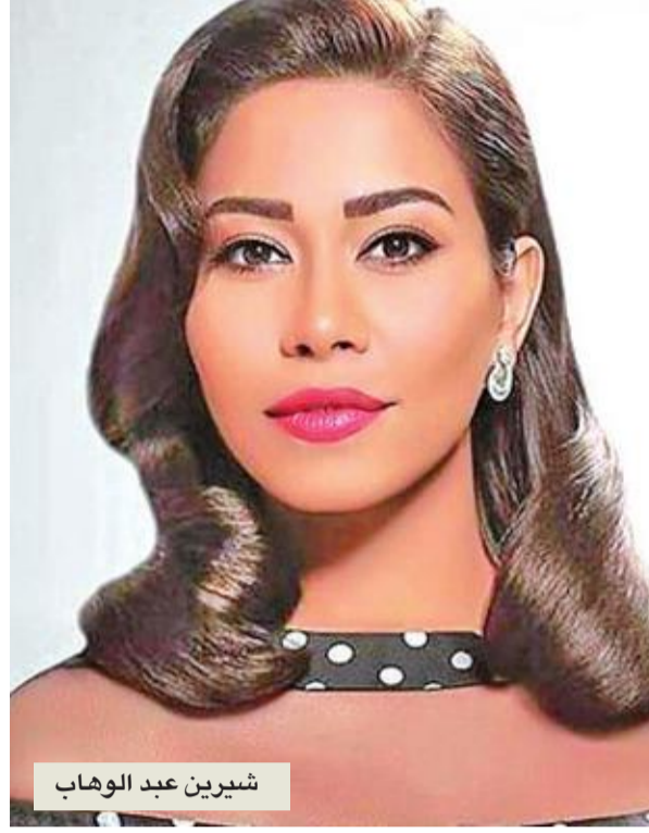
شيرين عبد الوهاب

بدورها، كانت إليسا دخلت في خلافات مع شركتها المنتجة «روتانا»، إذ أعلنت الأخيرة تعاقدها مع إحدى المنصات الإلكترونية لرفع إنتاجها الفنية عليها، ما كان ليقتد النجمة اللبنانية ملايين من المشاهدين على «يوتيوب». من ثم، أعلنت النجمة عبر منصات على مواقع التواصل الاجتماعي أنها ستترك الشركة ولن تعمل معها خلال الفترة المقبلة، نظراً إلى الاتفاقات