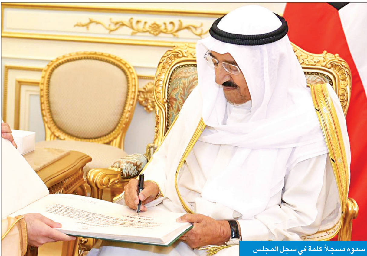
سموه مسجلاً كلمة في سجل المجلس

وأود في ختام حديثي أن أوجه كلمة إلى إخواني وإبنائي وأحبائي المواطنين وأدعوهم إلى عدم الالتفات إلى دعاة التشاؤم ومخبري الفتن ومروجي الشائعات وباعثي القلق والإحباط حول المستقبل وأقولها بكل أمانة وثقة وصراحة إن الكويت كانت وسنظل بإذن الله تعالى دوماً بخير وأمان تحرسها عناية المولى ووحدة صفها وسواعد أبنائها ومساندة قوى الخير والحق في العالم أجمع نعم للثقفة والحذر ولا للخوف والقلق. وأخيراً فالله أسأل أن يمدنا جميعاً بعونه وتوفيقه لما يحب ويرضى ويأخذ بأيدينا من أجل صيانة أمن الكويت واستقرارها وإعلاء شأنها ورخاء شعبها الوفي (ربنا لا تزغ قلوبنا بعد إذ هديتنا وهب لنا من دنك رحمة إنك أنت الوهاب) صدق الله العظيم والسلام عليكم ورحمة الله وبركاته.