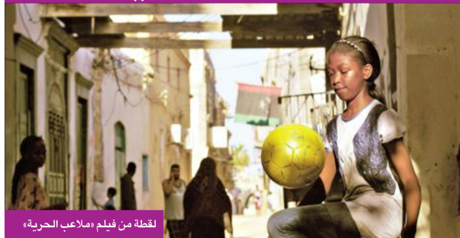
لقطة من فيلم «ملاعب الحرية»

النساء بالعالم، ويزداد الاهتمام بقضاياهن المحقة».