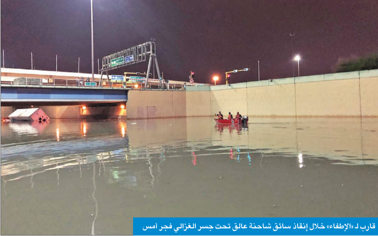
قارب لـ «الإطفاء» خلال إنقاذ سائق شاحنة عالق تحت جسر الغزالي فجر أمس

المكرد أشاد بقرار منح الموظفين والطلبة إجازة مما سهّل التعامل مع أضرار الأمطار