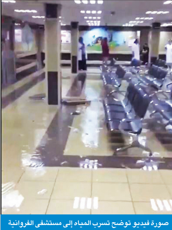
صورة فيديو توضح تسرب المياه إلى مستشفى الفروانية

«الطوارئ الطبية»: استقبال 205 حالات طارئة منها 157 حالة ربو وقلب