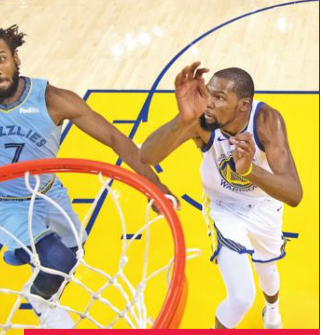
جانب من مباراة غولدن ستايت ووريزز وممفيس غريزلين

حقق حامل اللقب غولدن ستايت ووريزز فوزه الثامن توالياً هذا الموسم في دوري كرة السلة الأميركي للمحترفين، وذلك أمام ضيفه ممفيس غريزلين، في حين منعت إصابة النجم راسل وستبروك فريقه أوكلاهوما سيتي ثاندن من تحقيق فوزه الخامس توالياً على حساب ضيفه نيو أورليانز بـ116-115. في المباراة الأولى، تفوق غولدن ستايت على ممفيس، أمس الأول، 117-101، ليحقق فوزه العاشر هذا الموسم، والثامن توالياً منذ خسارته الوحيدة حتى الآن ضد دنفر ناغتش في 19 أكتوبر.