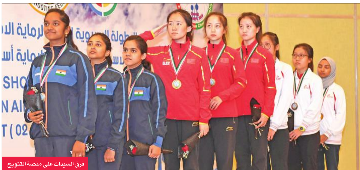
فريق السيدات على منصة التتويج

رافعة رصيدها إلى 9 ذهبيات و4 فضيات و3 برونزيات