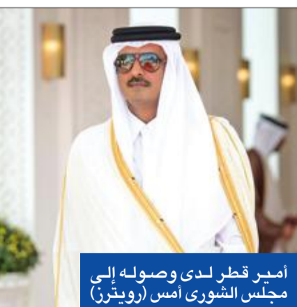
أمير قطر لدى وصوله إلى مجلس الشورى أمس

أكد أمير قطر الشيخ تميم بن حمد، أمس، أن تردى العلاقات الخليجية يضعف القدرة على حل مشاكل المنطقة، معرباً عن أمله أن تمر الأزمة، وأن يستفاد منها في تطوير مجلس التعاون الخليجي. وأعتبر الشيخ تميم، في كلمة القاها خلال افتتاح الدورة الـ 47 لمجلس الشورى بالدوحة، أن «من المؤسف حقاً أن استمرار الأزمة الخليجية كشف عن إخفاق مجلس التعاون الخليجي في تحقيق أهدافه وتلبية طموحات شعوبنا الخليجية، ما أضعف قدرته على مواجهة التحديات والمخاطر وهمش دوره الإقليمي والدولي». وأضاف: «يعلمنا التاريخ أن الأزمات تمر، لكن إدارتها بشكل سيئ قد تخلف رواسب تدوم زمناً طويلاً، داعياً إلى الاستفادة من الأزمة الراهنة في تطوير المجلس على أسس سليمة تشمل الآليات لحل الخلافات وتضمن عدم تكرارها مستقبلاً». ودعا إلى «حل الخلافات عن طريق الحوار الذي يري مصالح الأطراف المعنية كافة»، مشدداً على أن «امن واستقرار دولنا، الخليجية والعربية، لن يتحققا غير السعي إلى المساس بسيادة الدول أو التدخل في شؤونها الداخلية، بل من خلال احترام القواعد التي تنظم العلاقات بينها». على الصعيد الاقتصادي، شدد الشيخ تميم على أن بلاده «ستحافظ على موقعها بوصفها أكبر مصدر للغاز الطبيعي المسال في العالم»، مؤكداً أن صادرات قطر من النفط لم تتأثر بسبب الإجراءات التي اتخذتها السعودية والإمارات والبحرين ومصر بحقها. ورأى أن «الاقتصاد القطري ازداد قوة»، إذ ارتفعت صادرات قطر بنسبة 18 في المئة خلال