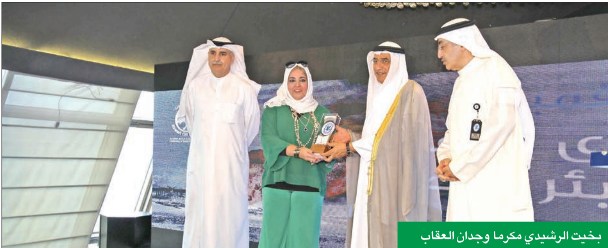
بخيت الرشيدي مكرماً وجدان العقاب

أكد وزير النفط بخيت الرشيدي أن «أوبك» تصب كل اهتمامها نحو استقرار الأسواق النفطية وتوازنها.