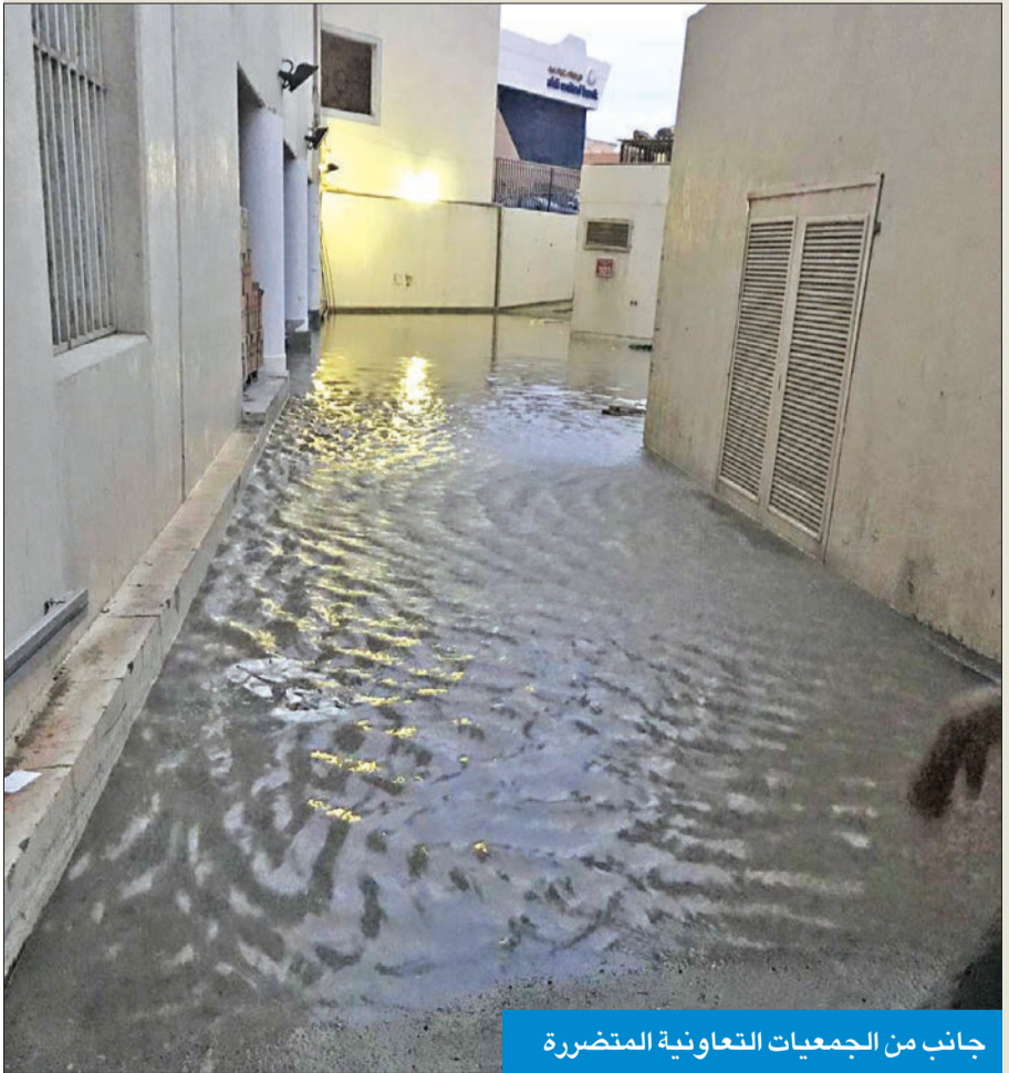
جانب من الجمعيات التعاونية المتضررة

كشفت وكالة وزارة الشؤون المساعدة للتنمية الاجتماعية، هباء الهجري، أن أمطار أمس تسببت في الإضرار بـ 13 صالة أفراح، إضافة إلى إلغاء 14 حفراً في صالات أخرى. بدوره، قال الوكيل المساعد لشؤون التعاون في وزارة الشؤون عبدالعزیز شعيب، إن ما يقارب 15 جمعية تعاونية تأثرت ولحقت بها أضرار متنوعة، جراء هطول الأمطار الغزيرة على البلاد ليلة أمس الأول وفجر أمس. وأوضح شعيب، في تصريح صحفي، أن قطاع التعاون في الشؤون، ومنذ تلقيه معلومات أولية عن تأثر بعض الجمعيات بسوء الأحوال الجوية، ينسق مع اتحاد الجمعيات التعاونية والجهات الأمنية، ممثلة بوزارة الداخلية وإدارة الإطفاء، للاطلاع على آخر تطورات الأوضاع في تلك الجمعيات.