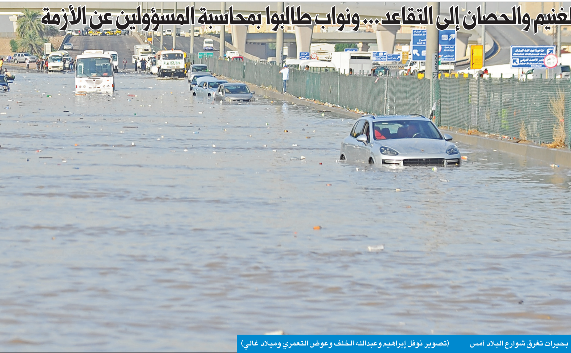
بحيرات تغرق شوارع البلاد أمس