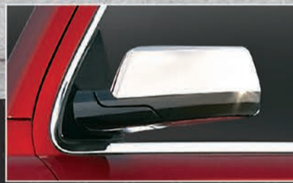
أغطية المرايا الجانبية من الكروم