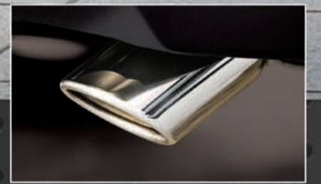
أطراف عادم من الكروم المطقول