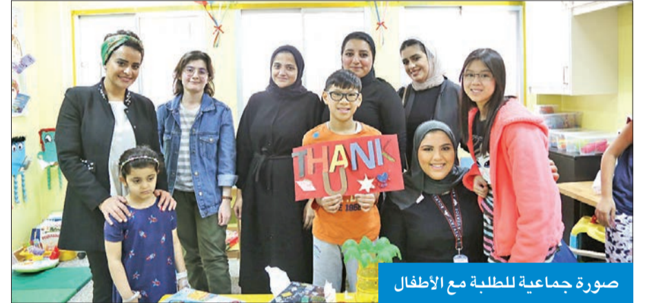
صورة جماعية للطلبة مع الأطفال

الجامعة تسعى إلى تنظيم النشاطات التي تساهم في جعل الطالب عنصراً فاعلاً في المجتمع