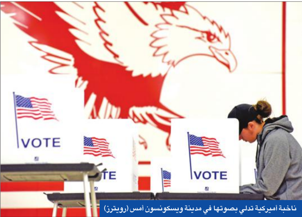
ناخبة اميركية تدلي بصوتها في مدينة ويسكونسون أمس

تصويت النساء يقلق ترامب والجمهوريين... ومعارك «كسر عظم» في ولايات حاسمة