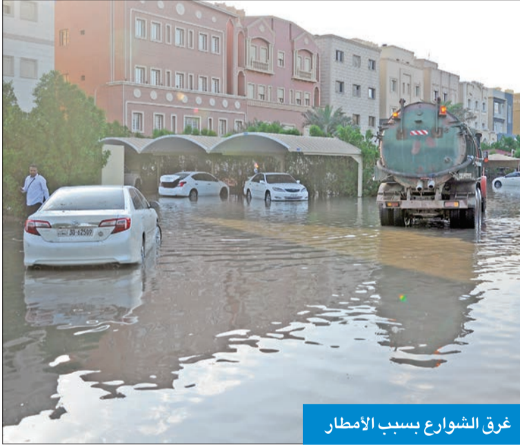
غرق الشوارع بسبب الأمطار