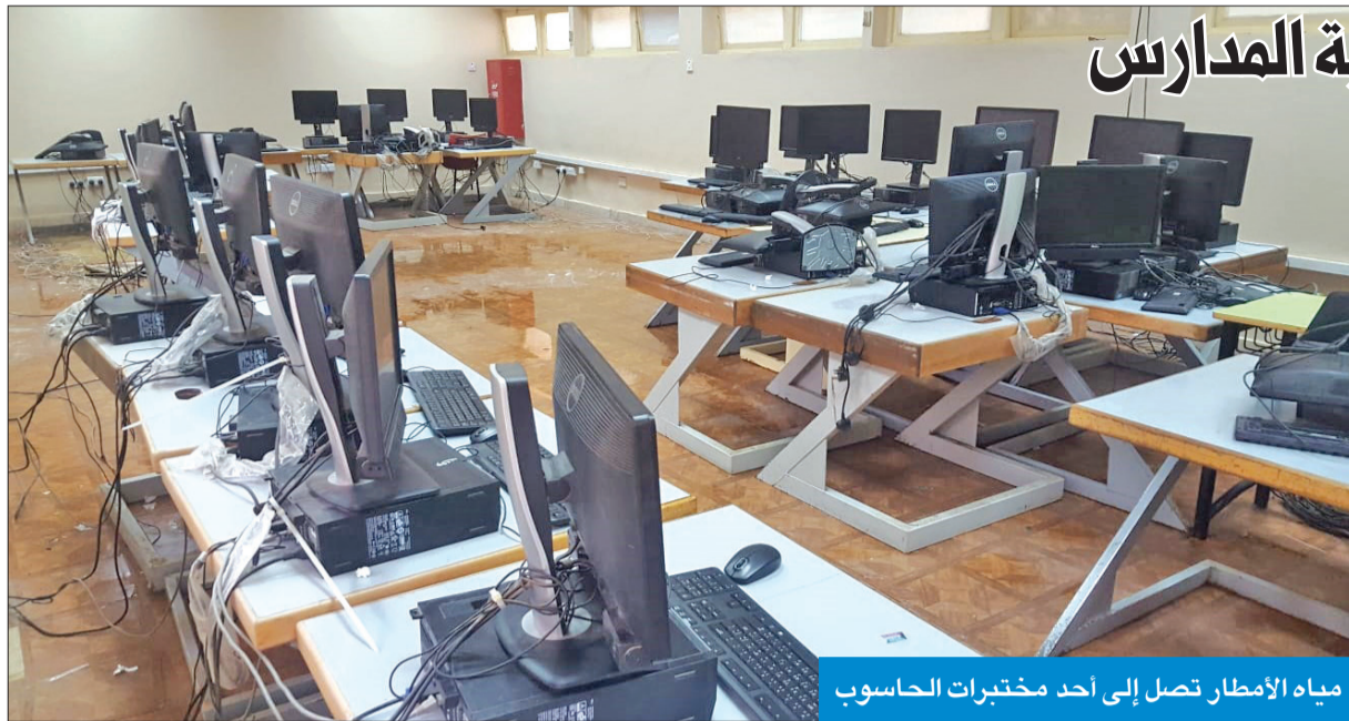
مياه الأمطار تصل إلى أحد مختبرات الحاسوب