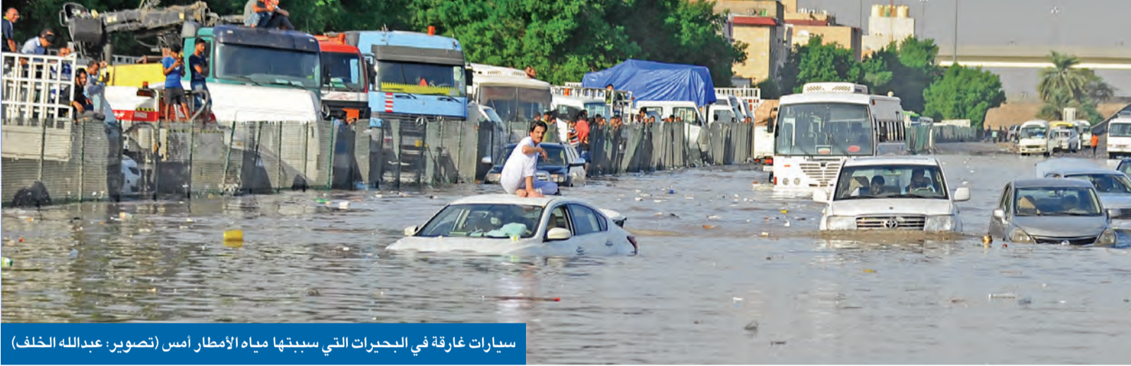
سيارات غارقة في البحيرات التي سببتها مياه الأمطار أمس

المبارك: الجهات المختصة جاهزة لأي ظرف طارئ وستواجه المقصرين بكل حزم وشدة • إحالة الحصان للتقاعد وعدم التجديد للغنيم ووقف العنزي وبن نخي... وفتح تحقيق