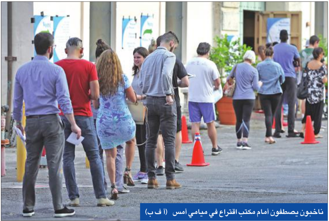
ناخبون يصطفون امام مكتب اقتراع في ميامي أمس (أ ف ب)

رغم زج ترامب بنقله لحسم المعركة، والولاية انحازت إلى كلينتون في الانتخابات الرئاسية بفضل جهود الزعيم الديمقراطي السابق هاري ريد.