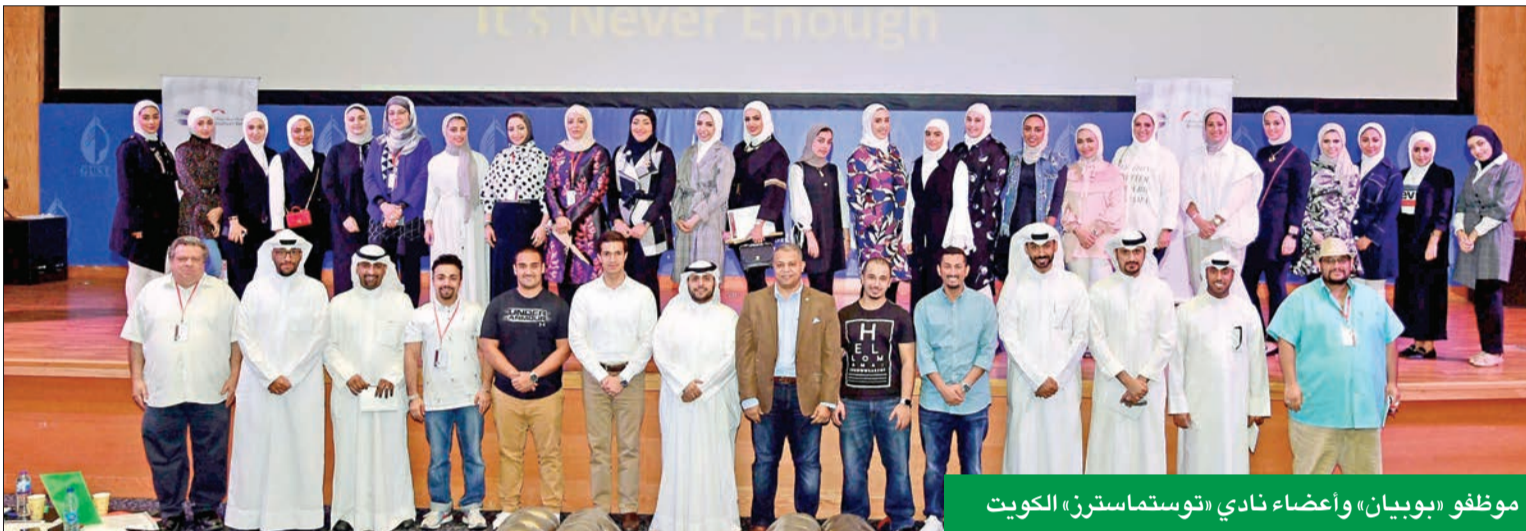
موظفو «بوبيان»، وأعضاء نادي «توستماسترز» الكويت

ولفت الحماد إلى أن نادي بوبيان للتوستماسترز يأتي في إطار المبادرات التي يطلقها البنك بهدف منح موارده البشرية على جميع المستويات خبرات مميزة وإكسابهم تجارب فريدة من نوعها. يذكر أن مؤسسة Toastmasters العالمية هي مؤسسة تعليمية غير ربحية تنظم أندية حول العالم لمساعدة الناس في التواصل والتحدث أمام العامة وتعليمهم مهارات القيادة.