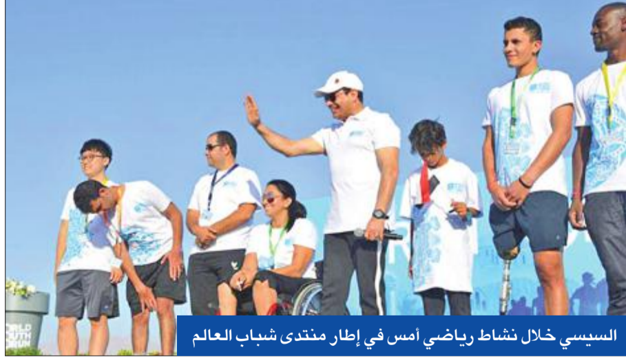
السيسي خلال نشاط رياضي أمس في إطار منتدى شباب العالم

قمة سودانية - مصرية... ودمشق غاضبة من القاهرة