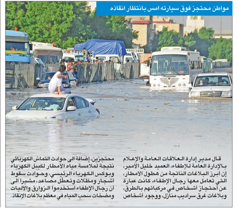
مواطن محتجز فوق سيارته امس بانتظار إنقاذه

محتجزين، إضافة إلى حوادث التماس الكهربائي نتيجة لملامسة مياه الأمطار لكيبال الكهربائية وبوكس الكهرباء الرئيسي، وحوادث سقوط أشجار ومظلات وتعطل مصاعد، مشيرة إلى أن رجال الإطفاء استخدموا الزوارق والآليات ومضخات سحب المياه في معظم بلاغات الإنقاذ.