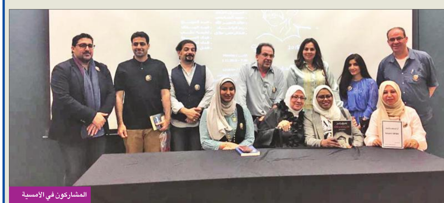
المشاركون في الأمسية

رواية «الأفصاح واللغة المشتركة»، ومنها: «بنايات نظيفة شوارع مستقلة، لا وجود للسيارات، ولا للناس، عدا القليل من شجيرات اثل متباعدة، الرياح بطيئة، ثقيلة، برائحة البحر القابع في الطرف البعيد وراء البنايات.» أما الناقد فهد الهنديل فقراً من رواية «للحدث بقية، ابن زيدون»، ومنها: «على يمين خشية المسرح بضعة محلات للبطارية، تخصص ببيع العطور وأدوات الزينة الخاصة بنساء قرطبة في القرن الحادي عشر، عدد محدود من النساء الأندلسيات - وقد أسدلن خمرهن على وجوههن- يتسوقن، الباعة من الرجال - يتولون تلبية طلباتهم.»