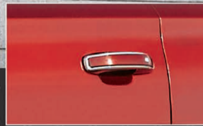
مسلكات الأبواب من الكروم