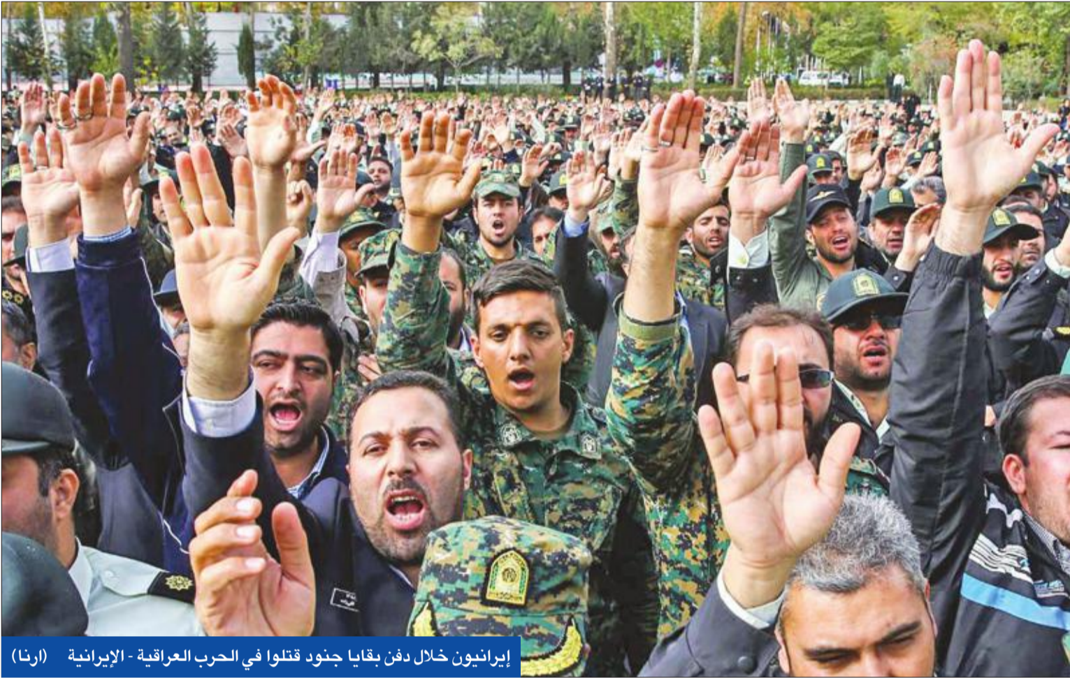
إيرانيين خلال دفن بقايا جنود قتلوا في الحرب العراقية - الإيرانية

واشنطن تسعى إلى خنق طهران بهدوء • إردوغان: الإجراءات الأميركية تخل بتوازن العالم