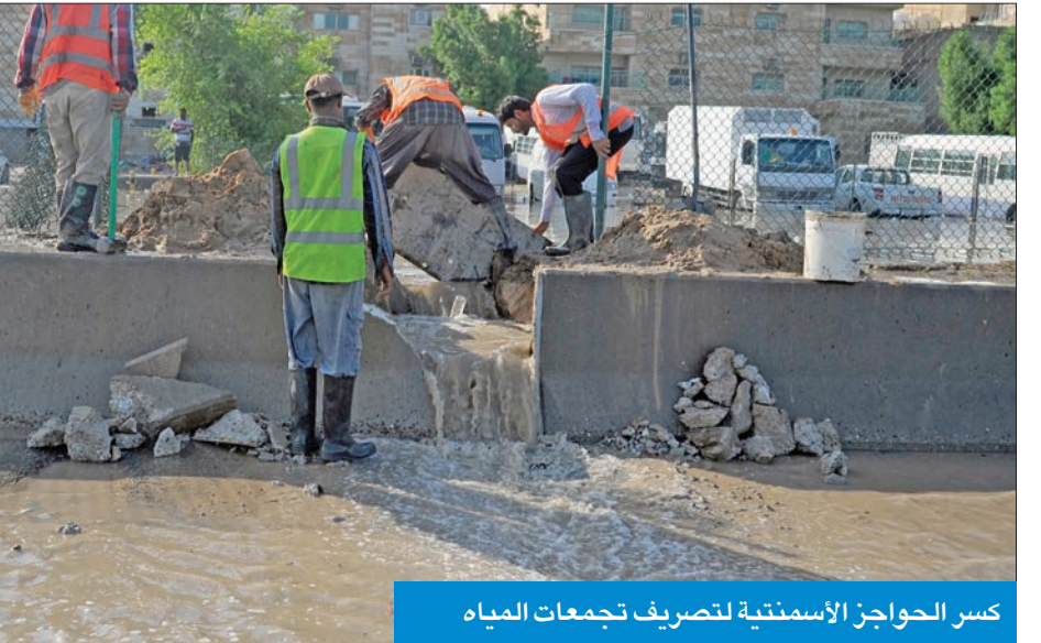
كسر الحواجز الاسمنتية لتصريف تجمعات المياه

وأضاف العلي أن الأمطار بلغت في مطار الكويت 40.4 ملليمترا، وسرعة الرياح 95 كيلومترا في الساعة، وفي منطقة السالمية 35.2 ملليمترا، مع سرعة رياح بلغت 113 كيلومترا في الساعة،