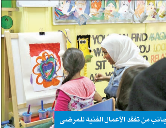
جانب من تفقد الأعمال الفنية للمرضى