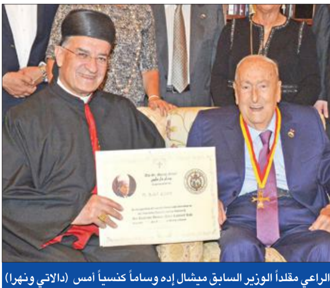
الراعي مقلداً للوزير السابق ميشال إده وساماً كتنسياً أمس (اللاتي ونهرا)

وزير السياحة يعتذر إلى مصر • الجمود السياسي يؤثر على الانضباط المالي