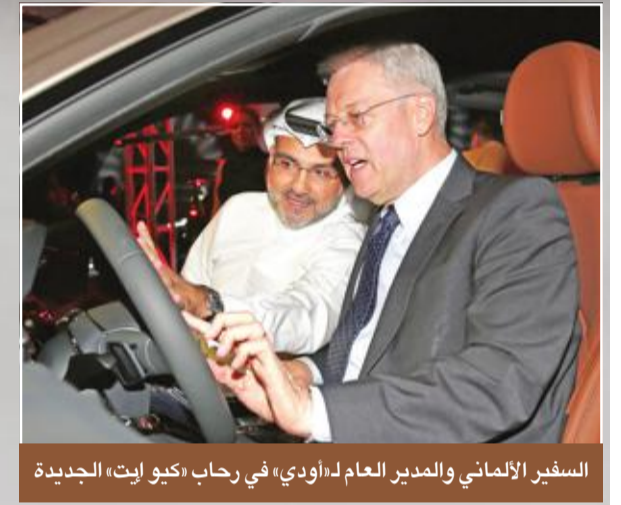
السفير الألماني والمدير العام لهـ «أودي» في رحاب «كوي ايت» الجديدة