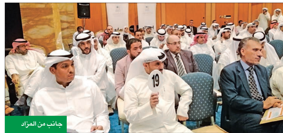
جانب من المزاد

خلال كشفها عن نتائج أعمال الربع الماضي، أعلنت شركة «أبل» توقفها عن نشر بيانات مبيعات منتجاتها المقاسة بعدد الوحدات مستقبلاً، في خطوة صدمت المحللين والمهتمين بتتبع مثل هذه البيانات، بحسب موقع «ستاتيسستا». وعلى مدار السنوات القليلة الماضية، مال المحللون والمستثمرون إلى تركيز اهتمامهم على أداء المنتج الأهم للشركة، وتحديد عدد جولات «يفون» المبيعة، لكن يبدو أن «أبل» لم تعد ترغب في اختصار جهودها وأعمالها في هذا المؤشر فقط.