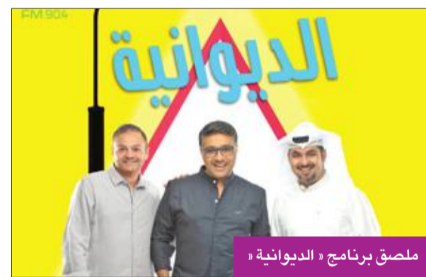
ملصق برنامج «الديوانية»