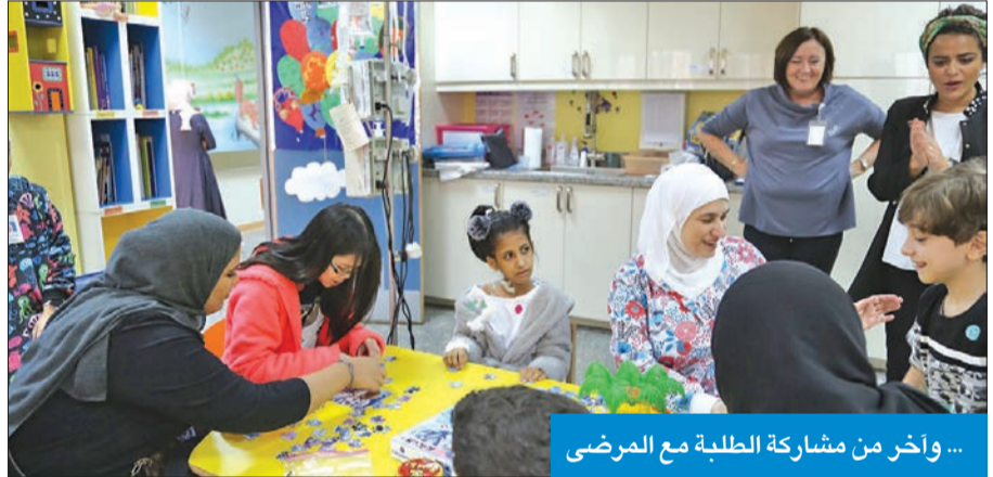
... وأخر من مشاركة الطلبة مع المرضى