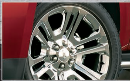
عجلات المنيوم قياس 22 إنش