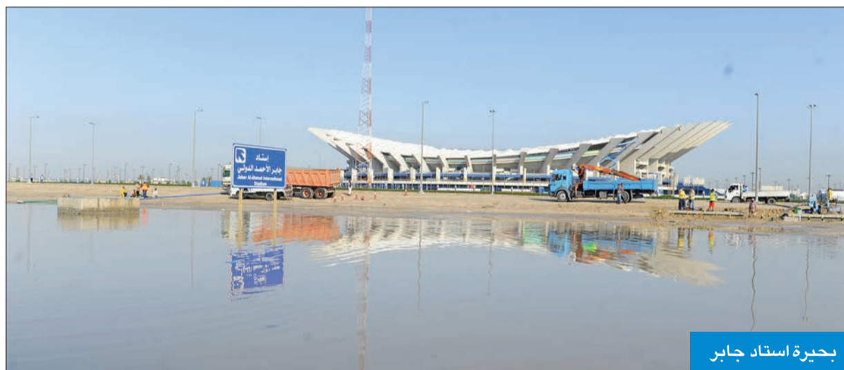
بحيرة استاد جابر