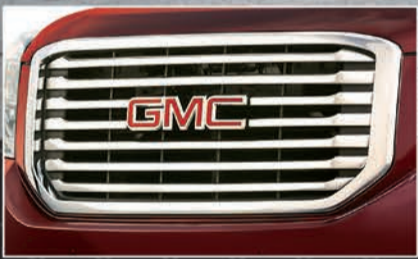
شبكة أمامية من الكروم