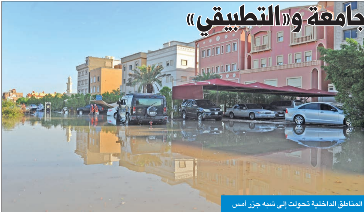
المناطق الداخلية تحولت إلى شبه جزر أمس

وقال الخضّر إنه قام بجولة تفقدية أمس على بعض الإدارات للاطمئنان على سلامة المباني، مؤكداً أن جميع الإدارات بخير، وغير متضررة.