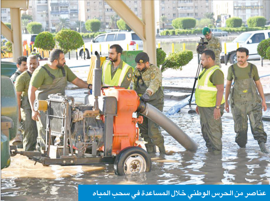
عناصر من الحرس الوطني خلال المساعدة في سحب المياه

من الأشجار المعرّقة للحركة على الطرقات. وقال الرفاعي، إنه تم نشر الفرق أمام المنشآت الحساسة مثل بنك الكويت المركزي ووزارة الإعلام للتأكد من سير العمل بها وتذليل أي عقبات، لافتاً إلى أن الحرس الوطني بجميع منسبته حرص على الدوام رغم العطلة للتعامل مع الطوارئ وتسهيل الحركة أمام المواطنين.