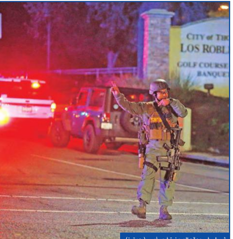
شرطي في موقع المجزرة فجر أمس

ساعة من الحانة، اللدماغ في كل مكان»، متابعا: «ليس لدينا فكرة إذا كانت هناك