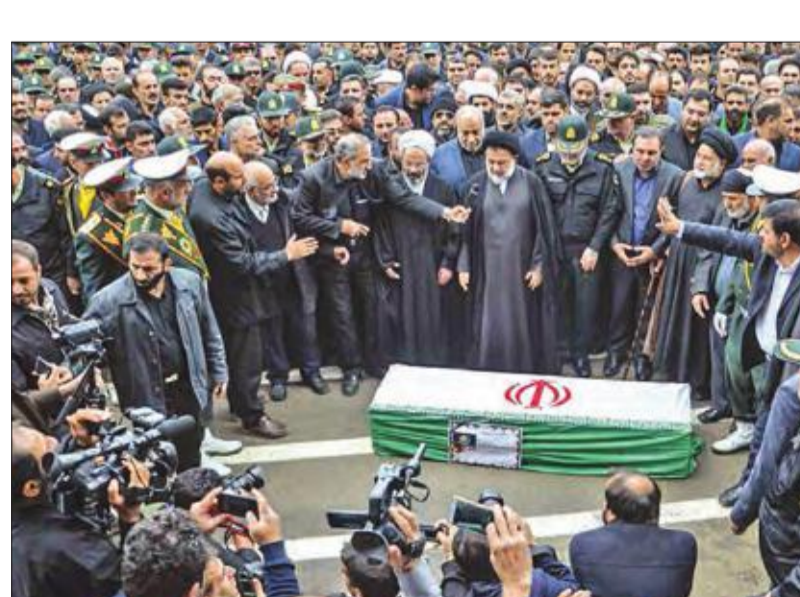
مراسم دفن رسمية وشعبية لجثمان رجل أمن توفي بعد 10 سنوات من دخوله في غيبوبة إثر إصابته خلال تصديه لهجوم إرهابي في خرم آباد أمس

وقال رئيس المكتب السياسي لحركة حماس إسماعيل هنية أمس، إن الجيش المصري قتل أمس الأول صيادا فلسطينياً من غزة، وأضاف خلال مقابلة تلفزيونية مع وكالة الأنباء المصرية بشأن استشهاد الصياد، أن «الغزة هي التي تشهدها على ذلك في وقتنا، خاصة بعد الجهد الكبير الذي بذله جهاز المخابرات العامة المصرية معنا