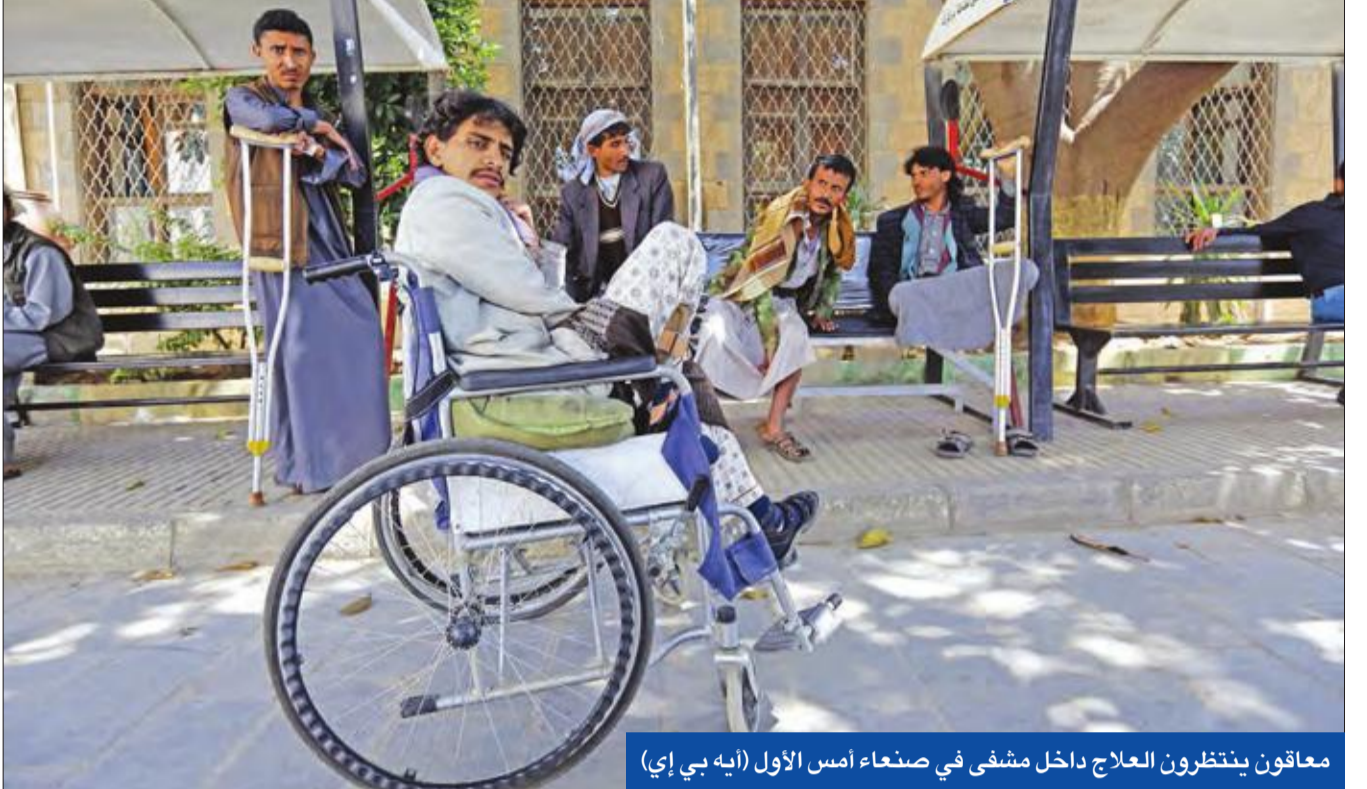
معاقون ينتظرون العلاج داخل مشفى في صنعاء أمس الأول

وأعلنت القوات الموالية للركن بحري عبدالله النخعي رئيساً لهيئة الأركان العامة وترقيته إلى رتبة فريق، وتعيين اللواء الركن طاهر العقيلي مستشاراً للقائد الأعلى للقوات المسلحة. كما قرر هادي تعيين أحمد سالم ربيع محافظاً لمحافظة عدن، ومحمد شاذلي وكيل أول للمحافظة. ويحتجز الحوثيون منذ أبريل 2015 وزير الدفاع السابق اللواء محمود الصبيحي، ولم يعرف مصيره إلا بعد وساطة قادتها سلطنة عمان في 25 أكتوبر الماضي. وفي وقت سابق، قدم عبدالعزیز المفلح، المحافظ السابق لعن، استقالته بعد أشهر من تعيينه في المنصب في أبريل من العام الماضي احتجاجاً على ما وصفه «الفساد». في المقابل، انتقدت قيادات في المجلس الانتقالي الجنوبي، التعيينات التي أصدرها هادي. ووصف رئيس مكتب العلاقات الخارجية بالمجلس الانفصالي، أحمد فريد ترقية العقيلي الذي كان قائداً للجيش اليمني إلى منصب وزير الدفاع «بمقاطعة للفشل» من جهة أخرى، حالت ثلاث دول