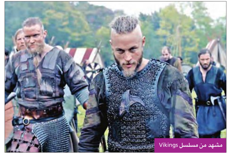
مشهد من مسلسل Vikings

كشفت الشركة المنتجة لمسلسل Vikings عن أسماء الحلقات الخمس الأولى من الجزء الثاني للموسم الخامس من العمل، المقرر بثه اعتباراً من 28 الجاري. والحلقات تحمل أسماء: الوحي، القتل أكثر شراً، إله جديد، اللحظات الضائعة والجحيم. مسلسل Vikings تأليف مايكل هيرست، وتم تصويره في أيرلندا، وبدأ عرضه بكندا وأميركا في 3 مارس 2018، ويرصد قصصاً مستوحاة من حياة أوائل الإسكندنافيين "الفايكنغ"، الذين عاشوا في العصور الوسطى، حروبهم وتجارتهم واكتشافاتهم للبلاد الأخرى، وبروز شخصية راجنار لوثبروك بطل عصره، الذي استطاع اكتشاف بلاد أخرى لغزوها، مثل: إنكلترا وفرنسا. ونال المسلسل نقداً إيجابياً وسلبياً، مثل غيره من المسلسلات، فعلى صعيد النقد الإيجابي أشاد به بعض الاختصاصيين في التاريخ، واعتبروه طريقة جيدة لتسليط الضوء على تلك الحقبة الزمنية. ونال المسلسل تقييم 8.4 على موقع IMDb العالمي، في حين حصد خمس جوائز، وتُشجع لـ 16 جائزة أخرى حتى الآن. وعلى صعيد النقد السلبي، وجهت للمسلسل عدة انتقادات تاريخية من حيث وجود معابد الهة الفايكنغ، أو طريق اللباس، إضافة إلى عدد من الأخطاء في النص عن وجود روسيا حتى قبل اكتشافها. وأعلنت شبكة Netflix أنها ستقوم بعرض الجزء الثاني من الموسم الخامس للمسلسل الشهير، ابتداءً من 30 الجاري، فيما كشفت قناة History عن بدء عرض الحلقات في 28 من الشهر نفسه.