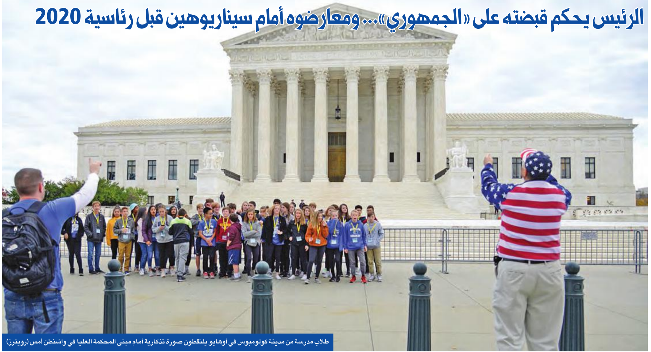
طلاب مدرسة من مدينة كولومبوس في أوهايو يلتقون صورة تذكارية أمام مبنى المحكمة العليا في واشنطن أمس

يمكن جني ثماره في الانتخابات الرئاسية في عام 2020 وهذا يتطلب التعاون مع ترامب ومع الأغلبية الجمهورية في مجلس الشيوخ التي يمكنها عملياً صد كل التشريعات.