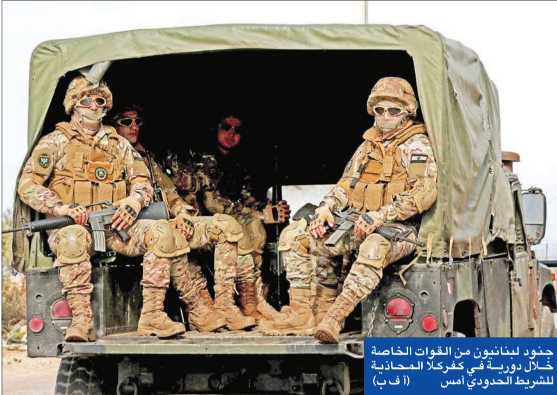
جنود لبنانيون من القوات الخاصة خلال دورية في كفر كلا المحاذية للتشريط الحدودي أمس