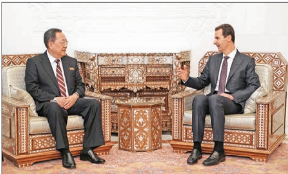
الأسد مستقبلاً وزير خارجية كوريا الشمالية ري يونغ هو في دمشق أمس الأول

معارك قرب قاعدة التنف الأميركية واستنفار في إدلب لليوم الثاني