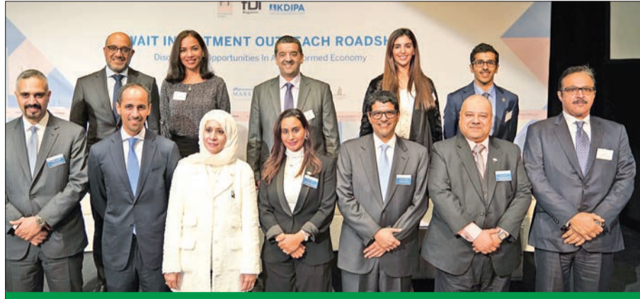
الشيخ د. مشعل الجابر والروضان يتوسطان المشاركين في المؤتمر

الروضان: المشاركة الفعالة للقطاع الخاص عامل حيوي في تحقيق أهداف «كويت جديدة 2035»