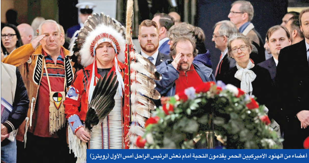
أعضاء من الهنود الأميركيين الحمر يقدمون التحية أمام نعش الرئيس الراحل أمس الأول