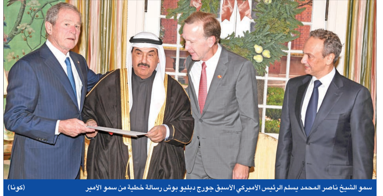
سمو الشيخ ناصر المحمد يسلم الرئيس الأميركي الأسبق جورج دبليو بوش رسالة خطية من سمو الأمير

من اليابان والبرتغال وإستونيا وبولندا وبرمودا وقطر. وبدأت الجنازة في السادسة مساء بتوقيت الكويت، بعد نقل نعش بوش في موكب من مقر الكونغرس إلى الكاتدرائية الوطنية. وأعلن ترامب أمس يوم حداد وطني، وأصدر أمراً تنفيذياً بإغلاق المكاتب الحكومية لإغلاق الأسواق المالية الأميركية.