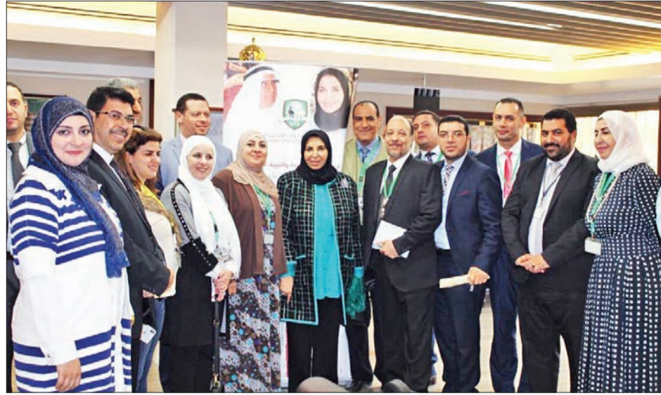
الشيخة د. سعاد الصباح والسداد وأعضاء الهيئة التدريسية