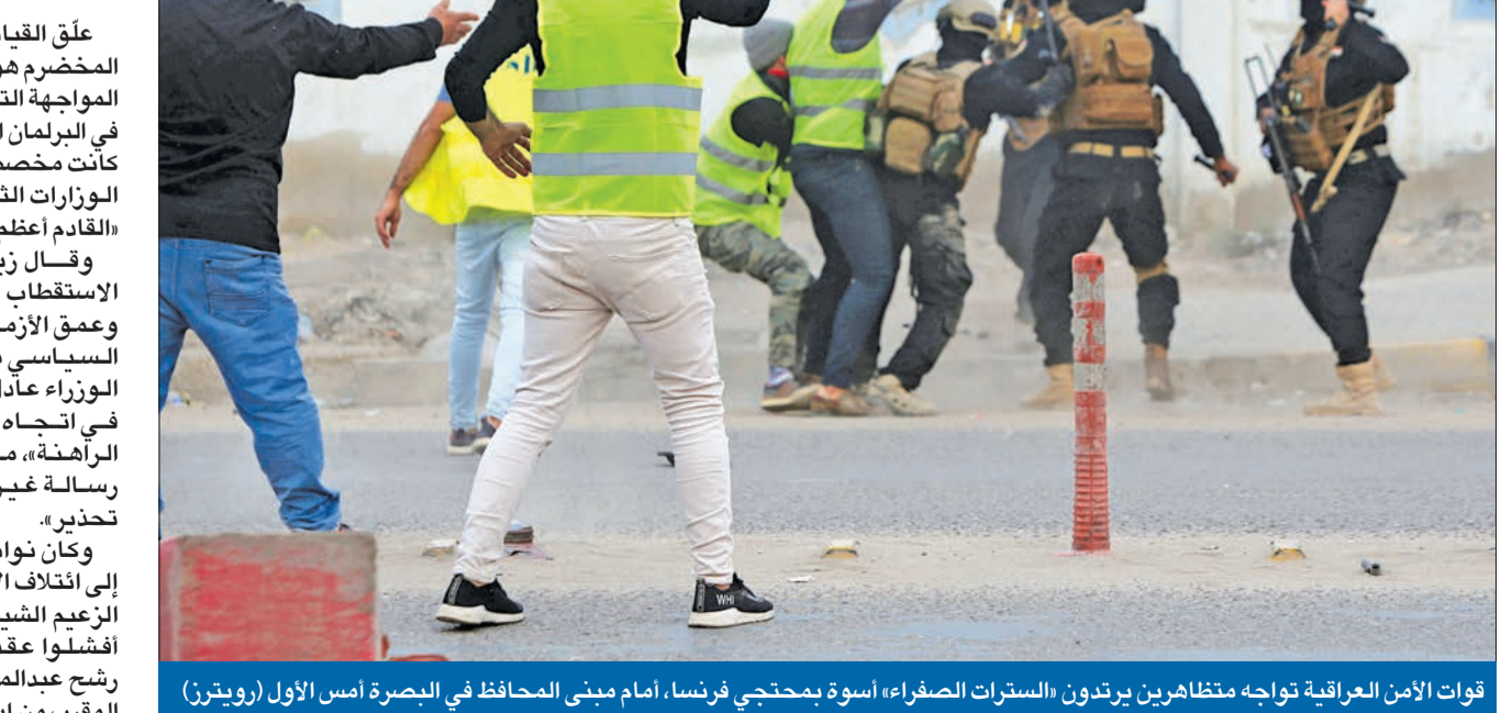
قوات الأمن العراقية تواجه متظاهرين يرتدون «السترات الصفراء» أسوة بمحتجي فرنسا، أمام مبنى المحافظ في البصرة أمس الأول

وقال زيباري إن «حدة الاستقطاب السياسي الشيعي، وعمق الأزمة، وهشاشة الدعم السياسي من الكتلة لرئيس الوزراء عادل عبدالمهدي، كلها في اتجاه إفشال الحكومة الراهنة، معتبراً أن «ما حدث رسالة غير مطمئنة وطلقة تحذير».