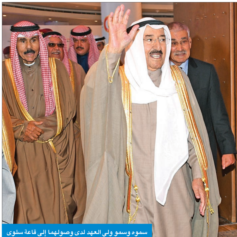
سموه وسمو ولي العهد لدى وصولهما إلى قاعة سلوى

شهاب الدين: الباحثون المكرمون قدموا إنجازات وضعت حلولاً مبتكرة لتحديات مجتمعاتهم