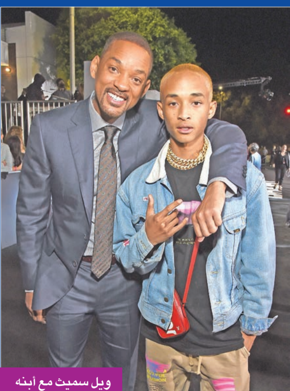
ويل سميث مع ابنه

نشر النجم ويل سميث مقطع فيديو عبر حسابه بـ«إنستغرام»، لأحدث أغاني ابنه النجم جادين سميث بعنوان «Goku»، والتي طرحتها عبر قناته الرسمية بـ«يوتيوب»، وحقق نصف مليون مشاهدة في يوم واحد. ونشر سميث مقطع الفيديو، وعلق عليه قائلا: «لماذا عليّ أن أجد المزيد من الفيديوهات الخاصة بجادين، الفيديو مذهل»، واختتم سميث تعليقه مداعبا جادين: «أنت معاقب، وسط الآلاف من التعليقات لمتابعي سميث. يُذكر أن ويل سميث ينتظر عرض أحدث أعماله السينمائية: النسخة الواقعية من فيلم الرسوم المتحركة «Aladdin»، المقرر طرحة في مايو من العام المقبل، إلى جانب إعلانه بطولة الجزء الثالث من سلسلة الأوكسن (Bad Boys)، المقرر طرحة مطلع 2020.