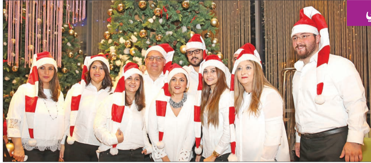
صورة جماعية لعدد من الجوقة المشاركة