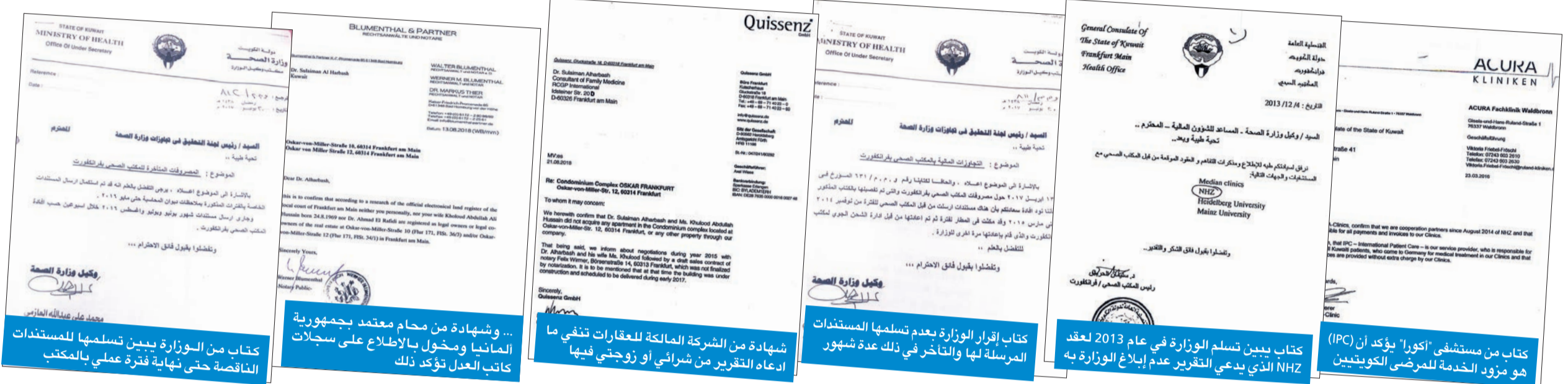
كتاب من مستشفى «أكورا» يؤكد أن (IPC) هو مزود الخدمة للمرضى الكويتيين... وشهادة من محام معتمد بجمهورية ألمانيا ومخول بالإطلاع على سجلات كاتب العدل تؤكد ذلك... كتاب إقرار الوزارة بعدم تسلمها المستندات المرسله لها والتأخر في ذلك عدة شهور... كتاب يبين تسلم الوزارة في عام 2013 لعقد NHZ الذي يدعي التقرير عدم إبلاغ الوزارة به