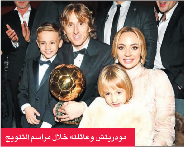
مودريتش وعائلته خلال مراسم التتويج

اعتبر رئيس الاتحاد الكرواتي لكرة القدم مهاجم ريال مدريد الإسباني سابقاً دافور سوكر، أمس الأول، فوز مواطنه لوكا مودريتش بالكرة الذهبية لعام 2018 من مجلة «فرانس فوتبول» أمراً مستحقاً، مضيفاً أن الجائزة تعتبر مكافأة له على موهبته الكروية وشخصيته. وقال سوكر، في بيان الاتحاد عبر موقعه الرسمي على الإنترنت المتهنئة لمودريتش بالجائزة: «لقد فرض حضوره بقوة رغم تواجده الفرنسيين الرائعين الذين فازوا بالمونديال، ورغم تواجده ميسي ورونالدو، الذي يحمل في مسيرته موسم مذهل». وأكد سوكر، الذي كان يعد الأفضل في تاريخ كرواتيا حتى ظهور مودريتش، أن فوز صاحب القميص رقم 10 بالجائزة مستحق «بالنظر لكل ما قدمه هذا العام لريال مدريد، وبشكل خاص للمنتخب الكرواتي». وأضاف صاحب الحذاء الذهبي في مونديال 1998 بفرنسا: «الجائزة تعتبر مكافأة على موهبته وقدراته الكروية، إضافة إلى شخصيته القوية التي ساعدته على تخطي كل هذه العقبات في مسيرته، داخل وخارج الملعب».