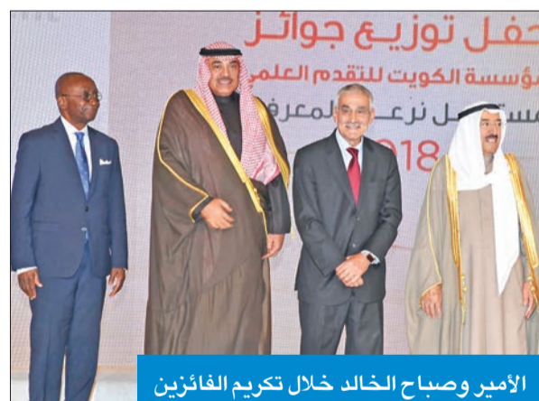
الأمير وصباح الخالد خلال تكريم الفائزين