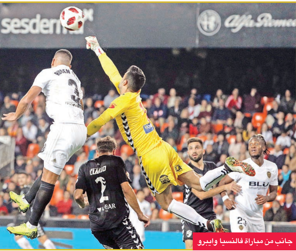
جانب من مباراة فالنسيا وإيبرو