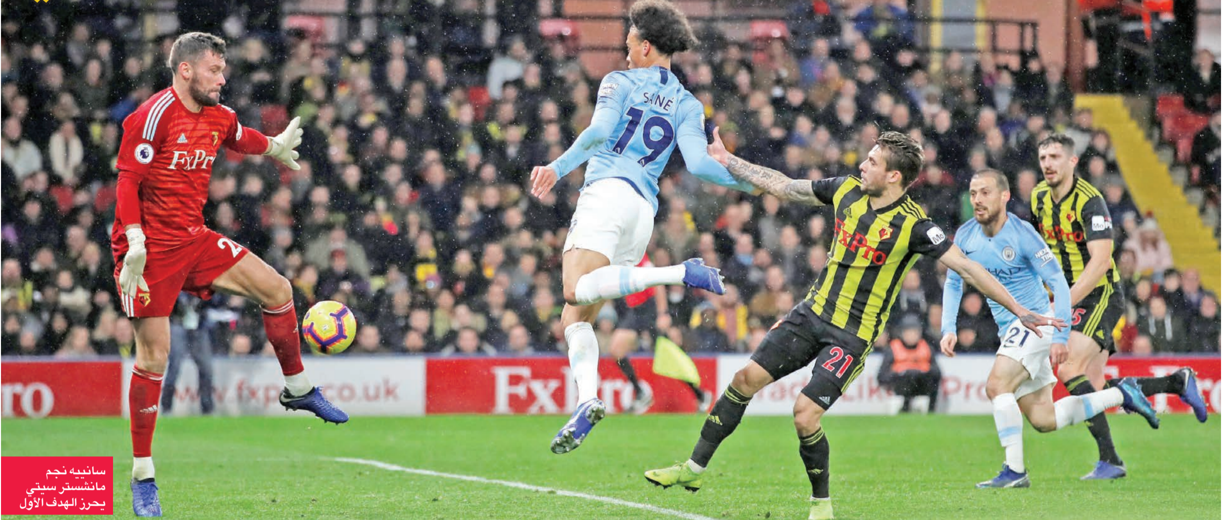
سانتيني نجم مانشستر سيتي يحرز الهدف الأول

الآخرة (90+5) ورغم طرد مكر للاعبه شايان دافي (28)، سجل برايتون، عاشر الترتيب، ثلاثة أهداف في الشوط الأول في رمي ضيفه كريستال بالاس، عن بعد 25 ثانية من نزوله وبدلاً طريق غلين موراي (24) من ركلة جزاء، النيجيري ليون بالوغون (31) والروماني الدولي فلورين اونوني من مجهود فردي رائع من منتصف الملعب (45). وأصبح برايتون أول فريق في الدوري يسجل ثلاثية ويطرده له لاعب في الشوط الأول، منذ مانشستر يونايتد في مواجهة وست هام في مايو 2008. وسجل الصربي لوكا ميليفوفيتش هدف حفظ الماء الوجه لكريستال بالاس من نقطة الجزاء (85).