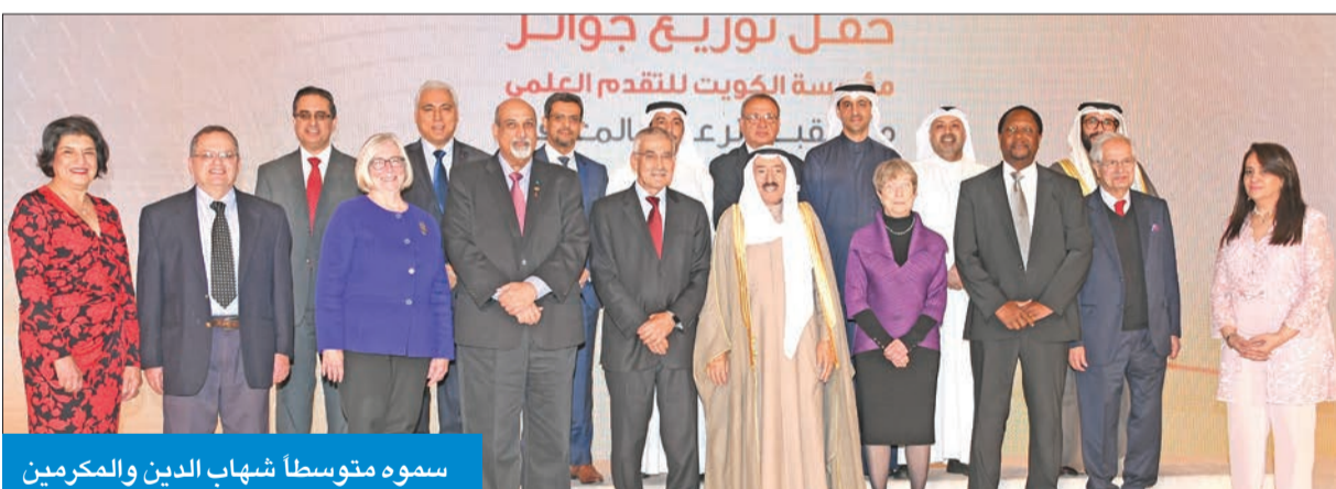
سموه متوسلاً شهاب الدين والمكرمين