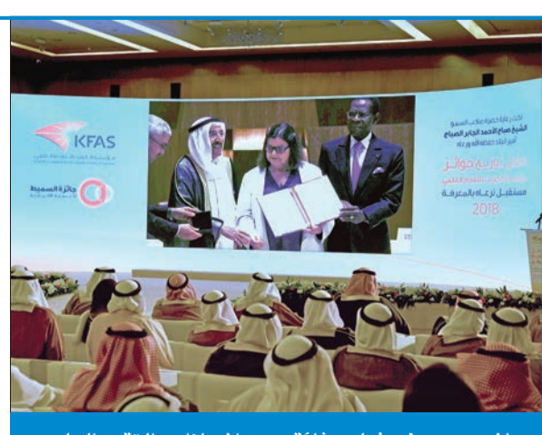
جانب من عرض فيلم وثائقي عن إنجازات «التقدم العلمي»