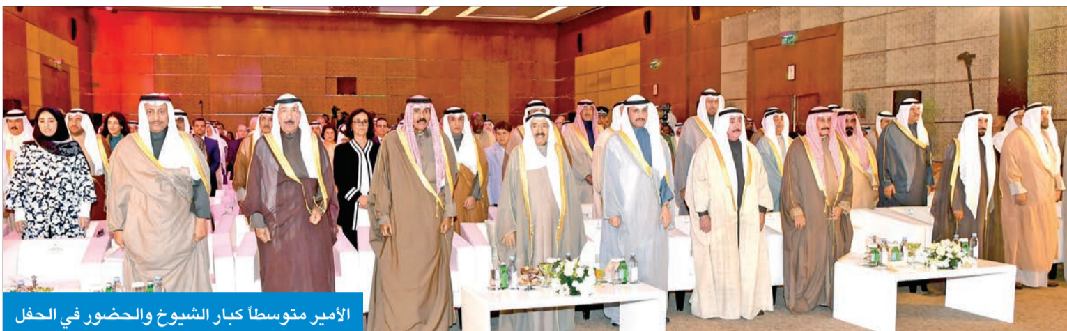
الأمير متوسلاً بجابر الشيوخ والحضور في الحفل

الكويت شكلت عبر التاريخ واحة للقيم ومرسى للمعرفة وحاضناً للعلماء والمهنيين