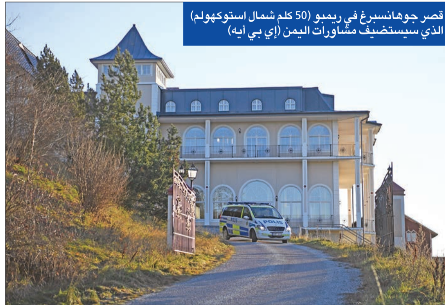
قصر جوهانسبرغ في ريمبو (50 كلم شمال استوكهولم) الذي سيستضيف مفاوضات اليمن

الماضي، وعقب إعلان التوصل إلى اتفاق بين المتمردين والحكومة، لتبادل مئات الأسرى والمعتقلين. ومن المتوقع أن تجتمع الأطراف المتحاربة اليوم في مهمة وصول إلى سلام شامل بأنها "لن تكون سهلة أو سريعة"، ليبحث إطار عام للسلام يشمل إجراءات أخرى لبناء الثقة، وتشكيل هيئة حكم انتقالية، تزامناً مع سعي مجلس الشيوخ الأميركي لدراسة قرار بإنهاء دعم واشنطن لـ"التحالف العربي"، الذي تدخل في الصراع منذ عام 2015. وتعد المحادثات وسط ضغط غربية لإنهاء الحرب التي دفعت الدولة العربية الفقيرة إلى شفا المجاعة. رويترز، أ ب، د ب، أ