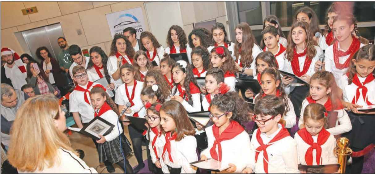
تأدية أغاني العيد

مع اقتراب موسم الاحتفالات، يستعد فندق سيمفوني سنابل الكويت، أحد فنادق راديسون كوليكتشن، لأجواء عيد الميلاد بنشر الزينة في مختلف مرافق الفندق. وإضافة تاليق متميز على هذا الموسم وابتكار ذكريات لا تنسى، استضاف الفندق أمسية خاصة للاحتفال بإضاءة شجرة العيد رافقتها الأغاني الاحتفالية المميزة في 1 ديسمبر 2018. واحتضن الفندق جوقة قدمت اغاني تقليدية خلال فعالية ضمت طاقم عمل الفندق والزلاء الذين اجتمعوا حول الأشجار الضخمة التي اكتست بالزينة الذهبية في ردهة الفندق، وعلت هتافات المحتفلين عند إنارة الشجرة خلال فعالية أدخلت البهجة إلى قلوب المشاركين. يذكر أن فريق عمل الماكولات والمشروبات في الفندق انتهى من إعداد قائمته الخاصة بموسم الكريسماس والمتضمنة أشهى المأكولات من الديك الرومي المحمر المحضّر حسب الطلب، مع جميع الأطباق الجانبية الشهية، إضافة إلى مجموعة واسعة من الحلويات ومكعكات العيد.