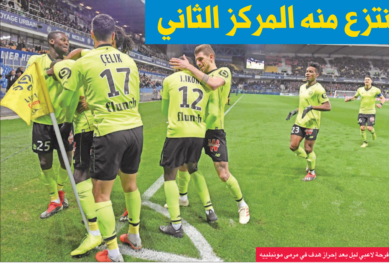
فرحة لاعبي ليل بعد إحراز هدف في مرمى مونبلييه

في الأسابيع الماضية عرفت باسم "السترات الصفراء"، اعتراضا على السياسات الضريبية والاجتماعية للرئيس إيمانويل ماكرون. وتحولت هذه الاحتجاجات الى أعمال شغب في قلب باريس، ودعا جيدا ام لا، بالنسبة إلى الأمر واضح جدا، على الأمن أن يكون أولوية. وتشهد مناطق فرنسية عدة أبرزها باريس، احتجاجات مطلبية