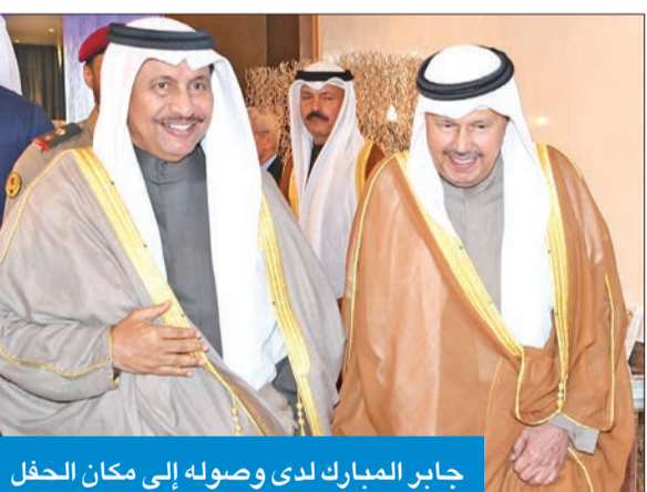
جابر المبارك لدى وصوله إلى مكان الحفل

كما استقبل سموه، رئيس مجلس الوزراء سمو الشيخ جابر المبارك، وفي معيته رئيس المجلس الرئاسي لحكومة الوفاق الوطني في ليبيا فايز السراج والوفد المرافق، وذلك بمناسبة زيارته الرسمية للبلاد. وشهد اللقاء بحث الأوضاع في ليبيا، والجهود الهادفة إلى تحقيق الأمن والاستقرار في البلد الشقيق بما يحفظ سيادة ووحدة الأراضي الليبية، كما تم بحث آخر مستجدات الأوضاع في المنطقة، والتأكيد على دعم الجهود الرامية لتعزيز التضامن ووحدة الصف العربي في سبيل مواجهة التحديات وتحقيق الأمن والاستقرار المنشود. كما استقبل صاحب السمو نائب رئيس مجلس الوزراء وزير الخارجية الشيخ صباح الخالد، والأمين العام لمجلس التعاون لدول الخليج العربية د. عبداللطيف الزباني، حيث سلم لسموه رسالة خطية من أخيه خادم الحرمين الشريفين الملك سلمان بن عبدالعزيز ملك السعودية