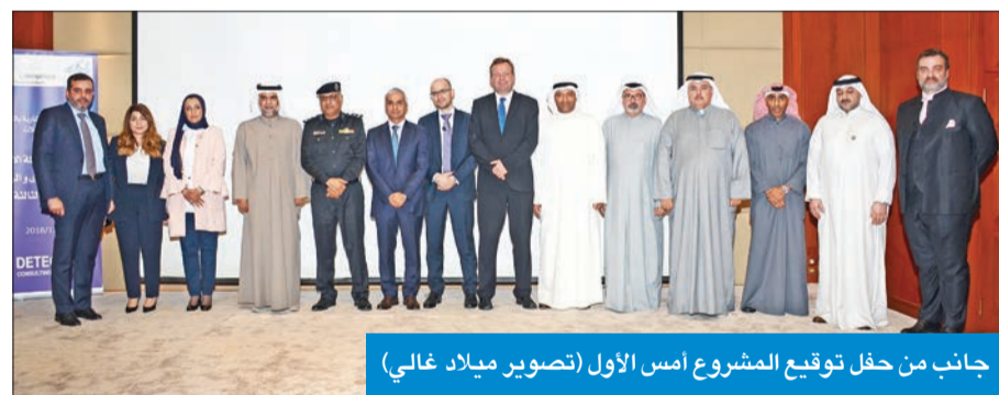
جانب من حفل توقيع المشروع أمس الأول

مؤكدة أن المرحلة الثالثة ستشمل أكثر من 130 ألف منزل، والتي ستعمل بنظام الفايبر، تمهيداً لإلغاء الخطوط النحاسية نهائياً. وقالت كخغ، في تصريح صحفي، على هامش التوقيع، إن «ديتيكون» ستصمم المشروع، الذي سيستمر مدة سنتين ثم مراقبة التنفيذ مدة 5 سنوات، لتغطية جميع مناطق الكويت.