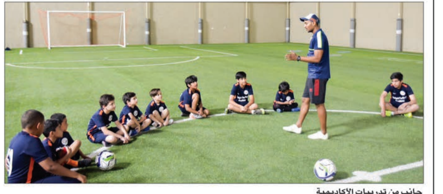
جانب من تدريبات الأكاديمية

باحترام، والموازنة بين حاجات الفرد وحاجات الفريق الذي ينتمي إليه، إضافة إلى التخلص من التعصب الرياضي بحد ذاته لاهتمام بجودة الأداء، والالتزام بروح الفريق، وغرس القيم الأخلاقية، وتعزيز الروح الرياضية لدى البراعم المشاركات. وتستهدف الأكاديمية تدريب المشاركات على مهارات كرة القدم التكتيكية والرياضية، وتوعيتهن بقوانين اللعبة واستراتيجيات تطويرها، حيث سيتم لاحقاً تشكيل فريق للأكاديمية لتمثيل الشركة بدوري الأكاديميات.