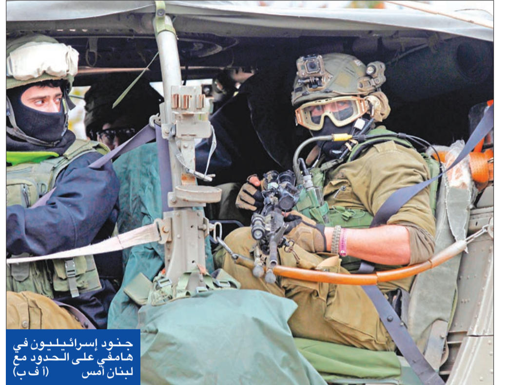
جنود إسرائيليون في هامفي على الحدود مع لبنان أمس

أي انتهاكات. وتدعو كل الأطراف لإظهار المسؤولية اللازمة وضبط النفس، والامتناع عن اتخاذ أي خطوات استفزازية أو تصريحات شديدة اللهجة قد تؤدي إلى تصعيد حدة التوتر". كما أعطى وزير الخارجية والمغتربين في حكومة تصريف الأعمال جبران باسيل، أمس، التعليمات لتحضير شكوى ضد إسرائيل إلى "مجلس الأمن الدولي حول الخروق الإسرائيلية المتكررة تجاه لبنان والتي تعد نحو مئة وخمسين خرقاً شهرياً". وقال رئيس البرلمان اللبناني نبيه بري إن إسرائيل لم تقدم دليلاً على وجود أنفاق على الحدود المشتركة بين البلدين، وهل فعلاً هي مع قوات حفظ السلام التابعة للأمم المتحدة. ونقل بيان من المكتب الإعلامي لبري عنه القول خلال اجتماع مع قائد الجيش وقوات حفظ السلام التابعة للأمم المتحدة: "لم يتقدم الجانب الإسرائيلي بأي معلومات". وأضاف: "الرؤية المشكوك فيها بالطبع، وقد طالب لبنان بالإحذائيات حول الموضوع المتعلق بالمزارع الإسرائيلية، ولم نتلق أي شيء عن هذه الإحذائيات، وهل فعلاً هي موجودة هذه الأنفاق أم لا". ونقل العضو في كتلة بري البرلمانية علي بزي عن رئيس البرلمان قوله بعد الاجتماع: "هذه المسألة لا تستند إلى أي وقائع صحيحة على الإطلاق".