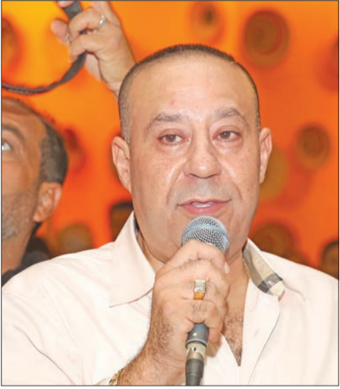
ماجد حنا ملقيا كلمته

ضمن فعاليات قسم اللغة العربية والتربية الإسلامية في مدرسة الكويت الإنكليزية للعام الدراسي الحالي 2018/2019، نظم القسم تحت إشراف أ. إيهاب حبشي، رئيس قسم اللغة العربية والتربية الإسلامية بالمدرسة، أصبوحة شعرية قدمتها الدكتورة الشاعرة سعاد الصباح. وأعد هذه الأصبوحة د. خالد المهدي عضو الهيئة التدريسية في المدرسة، والتي صاحبها المدرسة محمد جاسم السداد كلمة ترحيبية قصيرة عثر فيها عن فخره واعتزازه بحضور منارة أدبية عالية المستوى متمثلة بنخس الضيفة الكريمة. وقدم الطلاب بعض الفقرات الشعرية التي أبدعت فيها الضيفة بأسلوب قوي ومتمكن، ثم بدأت الشاعرة سعاد الصباح الأصبوحة بالحديث عن مسيرتها الإنسانية والعلمية والعملية الحافلة بالعطاءات غير المتناهية، معقمة في نفوس الطلاب معنى الوطنية والهوية، ومستشهادة بدورها الشعري النضالي في سبيل إعلاء كلمة الوطن.