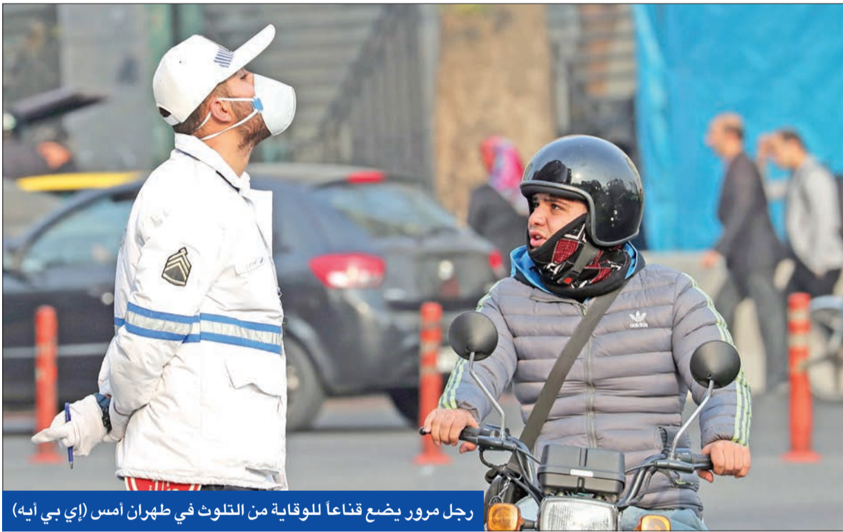
رجل مرور يضع قناعاً للوقاية من التلوث في طهران أمس

أكد وزير الخارجية عدم تصميم إيران لأي صواريخ يحمل سلاحاً نووياً، لافتاً إلى أن المنظومة الصاروخية الإيرانية صممت للأسلحة التقليدية المسموح بها، وستتم في المستقبل القريب، وقال: "دون تزويدها بأسلحة محظورة، إنه نظراً إلى ضغوط واشنطن لمنع أي إجراء أو تطور لمصلحة إيران، ستقوم الأوروبيون بتنفيذ الخطوة بطريقة سرية". من جانب آخر، قال ظريف على هامش اجتماع الحكومة الإيرانية في طهران أمس، تعليقا على تصريحات أطلقها بعض ساسة البيت الأبيض ووزير الخارجية مايك بومبيو حول انتهاك النشاط الصاروخي الإيراني لقرارات مجلس الأمن، إن الاتفاق النووي وقرار 2231 لا يمنعان النشاط الصاروخي.