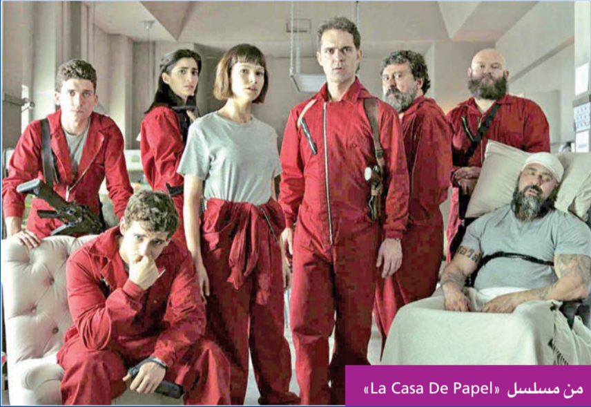
من مسلسل «La Casa De Papel»

المفاجأة الأكبر كانت في ظهور الممثل بيدرو الوتسو، صاحب شخصية «برلين»، أحد أهم شخصيات المسلسل في الجزئين الأول والثاني، وخاصة أن شخصية برلين تنتهي مشاهدتها بوفاة الشخصية في الجزء الثاني، بعدما يفجر نفسه لتسهيل عملية هروب أفراد العصابة من الشرطة الإسبانية، في مشهد اسطوري من ناحية الكتابة والإخراج وحتى من حيث التجسيد من قبل الفنان بيدرو الوتسو.