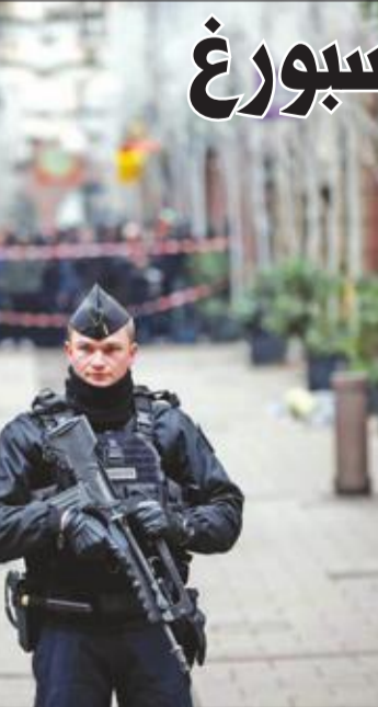
شرطي فرنسي يحرس الشارع حيث جرى إطلاق النار في ستراسبورغ أمس

أطلق رجل النار، أمس الأول، في كنيسة مدينة كامبيناس قرب ساو باولو في جنوب شرقي البرازيل، مودياً بحياة 4 قبل أن يتنحّر. وأدت هذه العملية التي استخدم فيها المنفذ سلاحين بينها مسدس، أيضاً إلى جرح 4 آخرين. وأفادت هيئة حفظ الأمن في ساو باولو، أنها تعرفت إلى هوية المنفذ، وهو رجل في التاسعة والأربعين من العمر يقم في مدينة فالينبوس على بعد 12 كيلومتراً من كامبيناس (ساو باولو - أ ف ب)