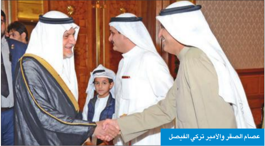
عصام الصقر والأمير تركي الفيصل