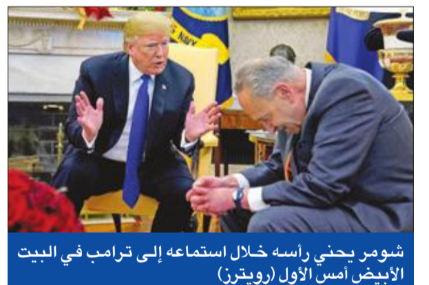
شومر يحثي رأسه خلال استماعه إلى ترامب في البيت الأبيض أمس الأول

وجاء تراشق الاتهامات بين ترامب ووزير خارجيته السابق ريكس تيلرسون، وإعلانه مغادرة كبير موظفي البيت الأبيض الأبيض الجنرال المتقاعد جون