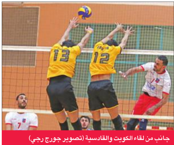
جانب من لقاء الكويت والقادسية

غرّد فريق الكويت للكرة الطائرة منفردا على قمة ترتيب فرق بطولة الاتحاد "التصنيفية"، بعدما نجح في إسقاط غريمه القادسية بثلاثة أشواط دون رد (25-17، 25-23، 25-14)، في المباراة التي جمعتهما، أمس الأول، على صالة نادي كاظمة ضمن الجولة الثامنة، ليرفع رصيده إلى 16 نقطة في المركز الأول، بينما تراجع القادسية إلى المركز الثالث بفارق نقاط الأشواط عن كاظمة الثاني برصيد 15 نقطة، بعد تلقيه هزيمة مفاجئة على يد نظيره الجهراء، الذي ارتقى للنقطة 13 نقطة في المركز السادس، بنتيجة ثلاثة أشواط لشوط واحد، وجاءت نتائج الأشواط كالتالي (25-22، 25-21، 25-23، 25-23).