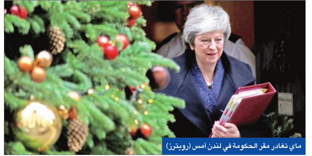
ماي تغادر مقر الحكومة في لندن أمس