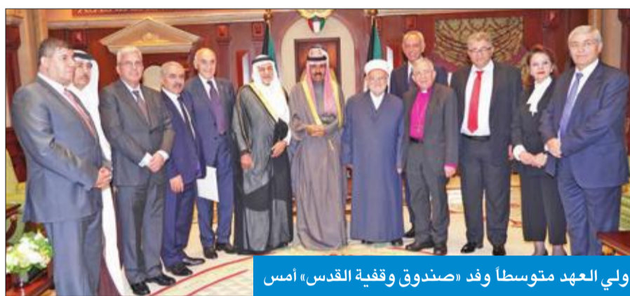
ولي العهد متوسطاً وفد «صندوق وقفية القدس» أمس

عبدالعزیز وأعضاء مجلس أمناء الصندوق وذلك بمناسبة اجتماع مجلس أمناء وقفية القدس المنعقد حالياً في الكويت في الفترة بين 11 و 13 ديسمبر الجاري بعنوان "نحو رؤية شاملة لإفراج قناديل القدس". وعبر سموه عن شكره وتقديره لرئيس وأعضاء مجلس أمناء الصندوق، مشيداً بجهودهم الكبيرة التي يقومون بها في المجال الإنساني والتخفيف في دعم القدس وإغاثة الشعب الفلسطيني، مؤكداً أن الكويت لم تتأخر يوماً في دعم وإغاثة الشعب الفلسطيني، متمنياً لهم التوفيق والنجاح.