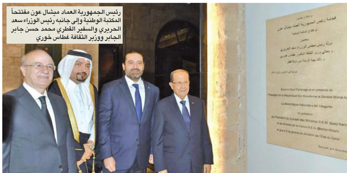
رئيس الجمهورية العماد ميشال عون مفتحاً المكتبة الوطنية وإلى جانبه رئيس الوزراء سعد الحريري والسفير القطري محمد حسن جابر الجابر وزير الثقافة غطاس خوري

في أحد الأيام من عام 1919، راودت الفيكونت فيليب دي طراز (1865-1956)، وهو من هواة جمع الكتب النادرة ومؤرخ الصحافة العربية، فكرة إنشاء دار للكتب في منزله، وشكلت مجموعة الخاصة، المؤلف من عشرين ألف وثيقة مطبوعة وثلاثة آلاف مخطوطة بلغات عدة، نواة الدار التي تحولت فيما بعد إلى المكتبة الوطنية. وأضحت في وقت قصير كنزاً ثقافياً يضم مئات الآلاف من الكتب والمخطوطات، واستمرت في التطور إلى أن دمرتها الحرب تماماً كما دمرت معالم كثيرة. اليوم، تعود المكتبة الوطنية إلى القها وإلى دورها الثقافي والحضاري بعدما أعيد ترميمها بعناية من دولة قطر.