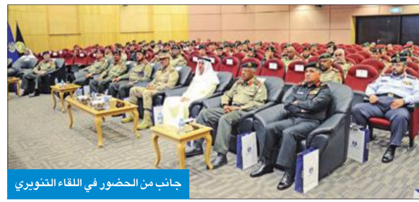
جانب من الحضور في اللقاء التنويري