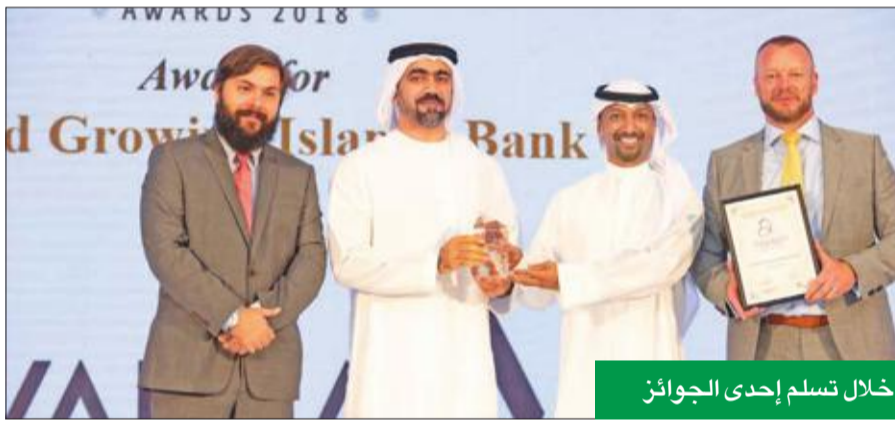
خلال تسلم إحدى الجوائز

أفضل مؤسسة استشارية للشركات» و«البنك الإسلامي الأسرع نمواً في الكويت»