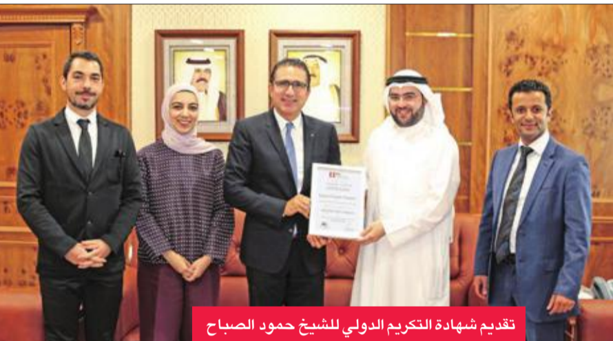
تقديم شهادة التكريم الدولي للشيخ حمود الصباح

أعلنت الهيئة العامة للرياضة أمس فوز مشروع تصميم استاد صباح السالم بالنادي العربي بتكريم دولي من المعهد الأميركي للمهندسين المعماريين، عن التصميم المعماري للمشروع، الذي سيتم تنفيذه في إطار حرص الهيئة على إنشاء استادات ومرافق رياضية ذات مواصفات عالمية، علما أن سعة مدرجات الاستاد الجديد تبلغ تقريبا 30 ألف مقعد مزود بالمتفرجين.