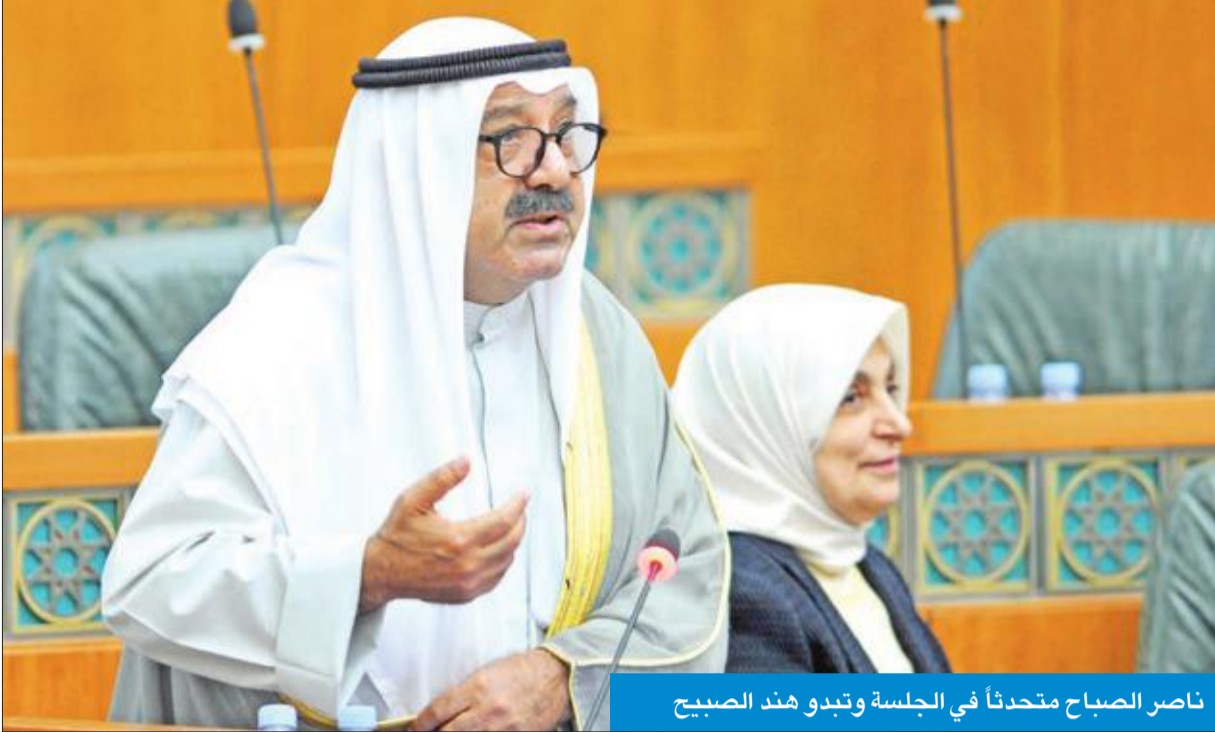
ناصر الصباح يتحدث في الجلسة وتبدو هند الصباح

المجلس أقر 8 اتفاقيات ونواب يؤكدون وجود تخمة في توقيعاتها