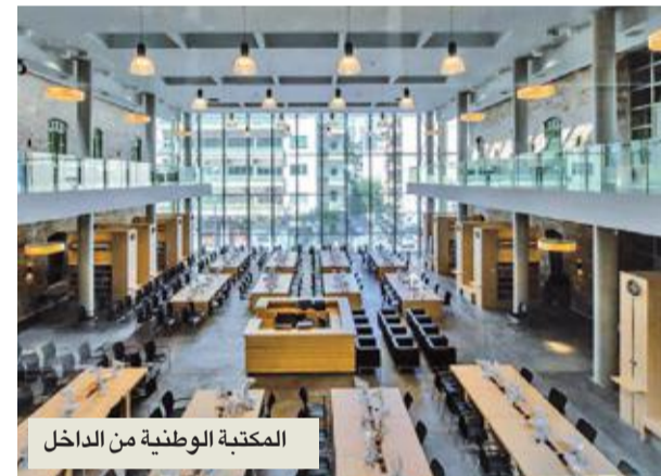
المكتبة الوطنية من الداخل