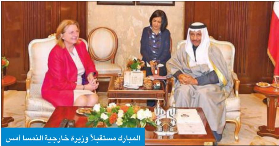
المبارك مستقبلاً وزيرة خارجية النمسا أمس