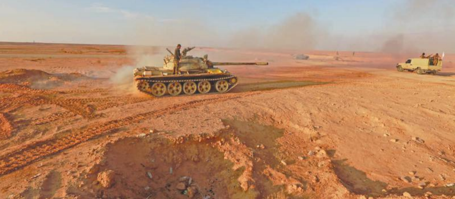
قوات عراقية من الحشد الشعبي مقابل الحدود مع سورية في القائم أمس

الأسد يرفع وتيرة الحشد بإدلب... و«داعش» يتلقى ضربة عراقية وأعنف قصف فرنسي منذ حرب فيتنام