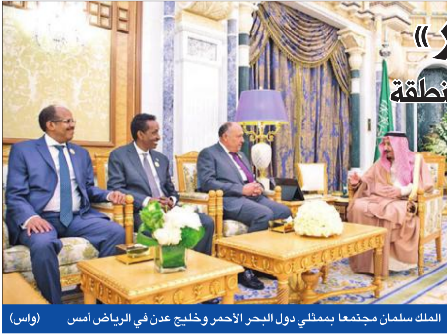
الملك سلمان مجتمعاً بممثلي دول البحر الأحمر وخليج عدن في الرياض أمس (واس)

هدفها تعزيز الأمن والاستثمار والتنمية في المنطقة