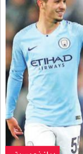
دياز نجم سيتي

ماجلا ويتحدر من أصول مغربية 5 ملايين يورو، لكن الريال، بحسب الصحيفة الإسبانية، قدم له عرضا قيمته 10 ملايين يورو، خاصة في ظل رغبة باريس سان جيرمان الفرنسي أيضا في الحصول على خدماته. وحصل دياز هذا الموسم على فرصة المشاركة في ثلاث مباريات مع الفريق الأول، وسجل هدفين في مرمرى فولهام ببطولة كأس الرابطة. وكان مانشستر سيتي مستعدا للصفقة الماضي لإعارة دياز، في حال وقع عقدا جديدا مع النادي بطل إنكلترا، لكن الأمر لم يتم، وفشل اللاعب في إثبات قدراته، خاصة في ظل وجود عدد كبير من اللاعبين الأساسيين في مركزه أمثال ستراينغ وساني وحمرن، ليقتل في الحصول على فرص كثيرة للعب.