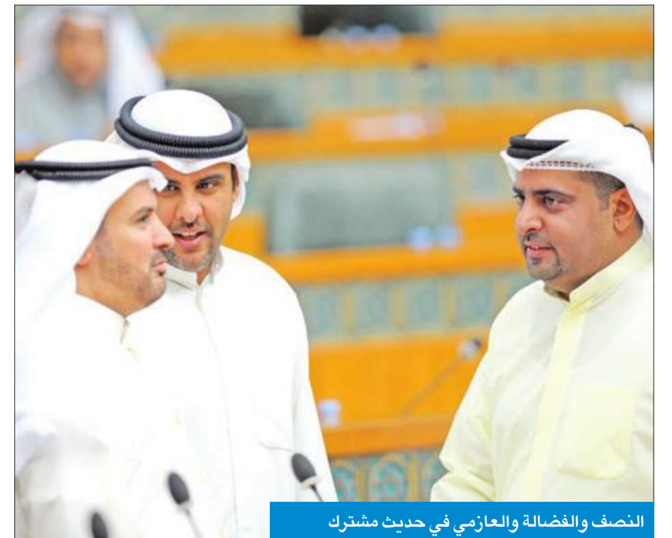
النصف والفضالة والعارضي في حديث مشترك