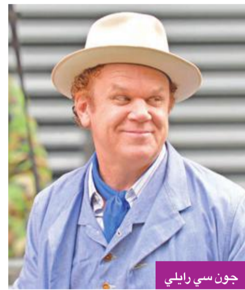
جون سي رايلي

طرحت شركة "Icon Films" الإعلان الدعائي الأول لفيلم الدراما والجريمة "Hotel Mumbai"، وهو أحدث الأعمال السينمائية للنجم الهندي المرشح لجائزة أوسكار، ديف باتيل، وتدور أحداثه في إطار قصة حقيقية حول فندق يتعرض لهجوم مسلح. يشترك باتيل البطولة؛ أرمي هامر، جيسون إيزاكس، والممثلة البريطانية تازانين بنيادي، وأنويام خير. وتم تصوير الفيلم ما بين الهند وأستراليا، وكان من المقرر طرحه خلال نوفمبر الماضي، لكن الشركة المنتجة أجلت عرض الفيلم تجارياً إلى مارس المقبل.