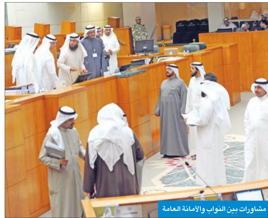
مشاورات بين النواب والإمامة العامة

«زاهة» فكلنا متهمون. وأضاف ان الدولة أولى بالعسكريين من نذب النواب إليهم، مشيراً إلى إلغاء نذب 560 عسكرياً يتقاضى كل واحد منهم ألف دينار إجمالي 560 ألف دينار، وهذه كارثة وتهدد للمال العام وحسناً فعل الشيخ ناصر بوقف نذب هؤلاء، لافتاً إلى أننا كنواب عاجزون عن حماية الدستور، وحماية المال العام ونسعى للخطب الرئانية وبالعلن يقولون «ما يجوز مع النواب مهم نظراً إلى خبرتهم في المجال العسكري كما هو حاصل بانتداب العاملين بالجهات الأخرى. وأضاف: «اننا نسعى إلى إنجاز حق العسكريين بالتصويت لتوسيع المشاركة الديمقراطية، منتقداً طرح هذا الموضوع للنقاش في المجلس معتبراً إياه إهدار لوقت المجلس. وتساءل: أين الغرابة في نذب العسكريين لدى النواب، وكيف يسمح للحرس الوطني والتصويت بينما الشرطة والجيش لا يصوتون، فإين العدالة بهذا الاتجاه؟»