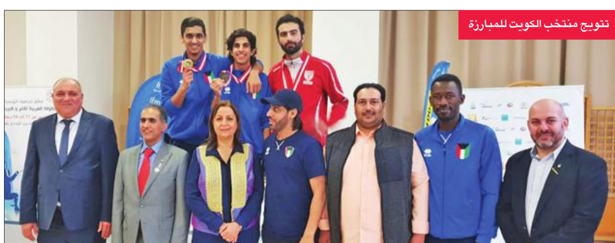
تتويج منتخب الكويت للمبارزة