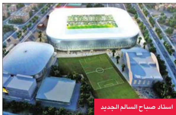
استاد صباح السالم الجديد

والتهوية للمناطق العامة، ونقل مع الارتفاع تدريجيا حتى تتلائم قبل الوصول للأسف، علما أن أوراق القمح ترمز إلى حقبة جديدة في حياة النادي العربي، حيث إنها تعني النمو والازدهار".