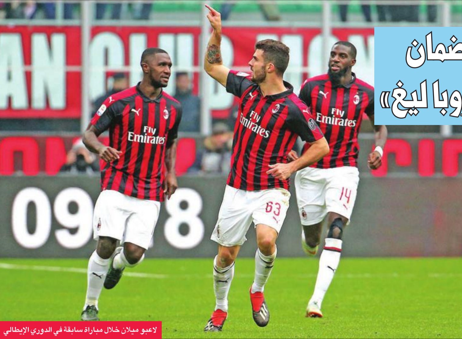
لاعبو ميلان خلال مباراة سابقة في الدوري الإيطالي