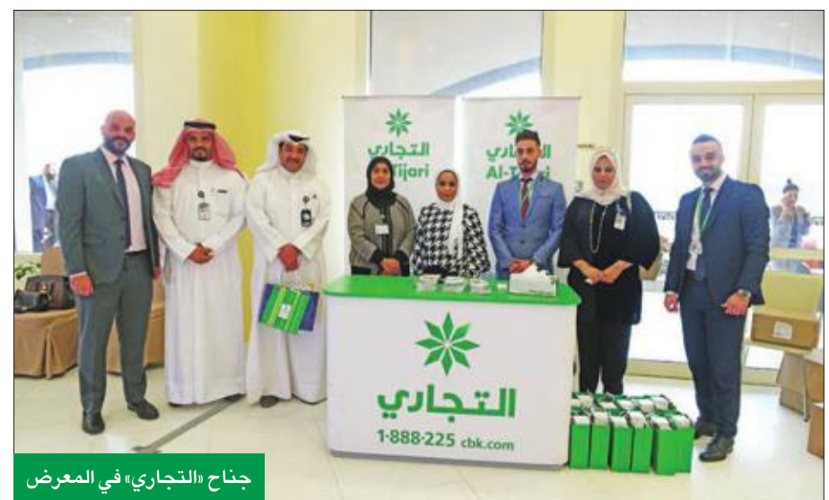
جناح «التجاري» في المعرض

جميع احتياجاتهم المصرفية، كما تم عرض مميزات حساب النجمة الخاص بالجوائز، الذي يقدم أكبر جائزة بالعالم وهي 1.5 مليون دينار، وتم إطلاع الحضور على مزايا الودائع والحسابات والبطاقات الائتمانية والسفيرة الدفع. ويحرص «التجاري» على الوجود بصفة دورية في مختلف الوزارات والهيئات الحكومية لتعريف منسوبي تلك الجهات بالحسابات والعروض والحملات التسويقية المحددة التي يطرحها البنك، والتي تتضمن العديد من المزايا التي تعود بالنفع الكبير على العملاء، وتسهل تسويقهم داخل الكويت وخارجها بأمان وراحة بال.