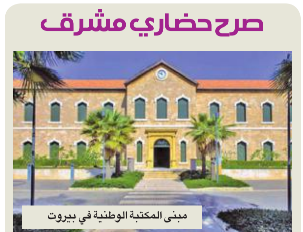
مبنى المكتبة الوطنية في بيروت

مع اندلاع الحرب تعرضت المكتبة التي كانت تقع وسط العاصمة لأضرار جسيمة وفقدت 1200 مخطوطة نادرة