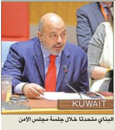
البناء متحدثاً خلال جلسة مجلس الأمن

أشار البناء إلى عدم موافقة الجمعية العامة على اعتماد ميزانية الآلية المقترحة لفترة 2018-2019، ما أدى إلى قيام الآلية بإعداد ميزانية منقحة ومنخفضة عن سابقتها، وذلك عن طريق تسريح عدد من موظفيها، وهو ما قد يعكس سلباً على عمل الآلية في تنفيذ ولايتها، فضلاً عن انخفاض الروح المعنوية لدى موظفي الآلية. وأثنى على سرعة الإجراءات التي تقوم بها القائمون على الآلية من قضاة وادعاء وقلم المحكمة في المحاكمات المنطوية أمام قضاة الآلية، والتي من شأنها تسريع صدور الأحكام بحق المتهمين.