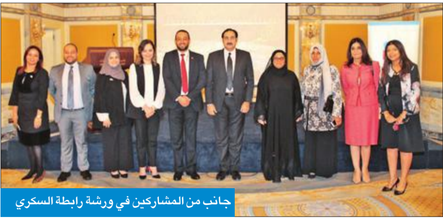
جانب من المشاركين في ورشة رابطة السكري

وقال إن هناك عدة طرق لفحص السكر في الدم نطلق عليها «الفحص المنزلي»، وأغلبها كما نعرف جميعاً تعتمد على وخز الإصبع بالإبر ووضعها في الجهاز، إلا أن هناك طرقاً جديدة ظهرت مع التقدم التكنولوجي،