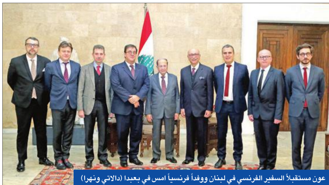
عون مستقبلاً السفير الفرنسي في لبنان ووفداً فرنسياً أمس في بعيدا (اللاتي ونهرا)

واصل الرئيس اللبناني ميشال عون، أمس الاتصالات التي يجريها لمعالجة الوضع الحكومي، في ضوء الأفكار المطروحة لإنهاء الأزمة الحكومية الراهنة، التي يبدو أنها ستحل قريباً، مع تأكيد أن العمل على حلحلة أزمة القبلين.