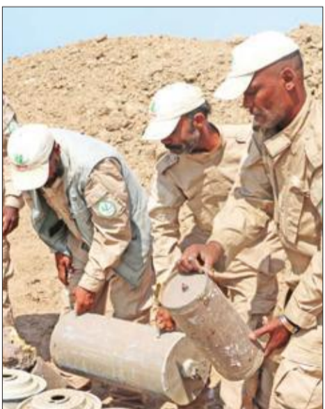
عنصر موالية لحكومة هادي تجمع الغاما تم تفكيكها بمدينة الحديدة أمس الأول

«مفاوضات السويد» تختتم اليوم وتبادل الأسرى يتضمن رفات صالح