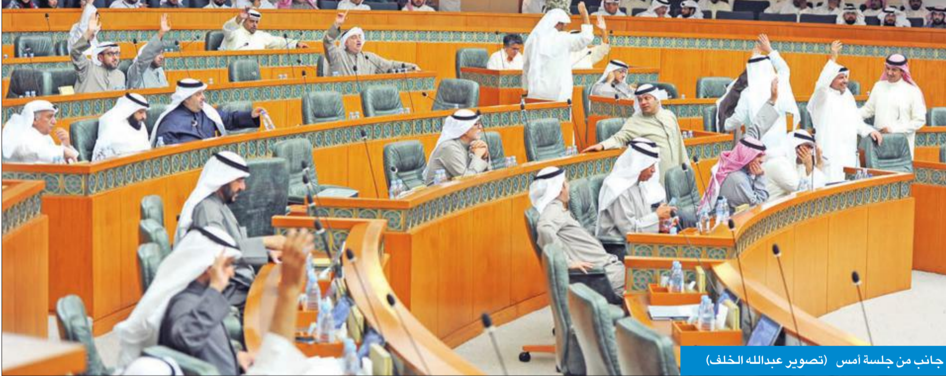
جانب من جلسة أمس

● طلب من الديوان فحص عقود مشروع الشقيا للطاقة المتجددة وتقديم تقرير قبل مارس المقبل