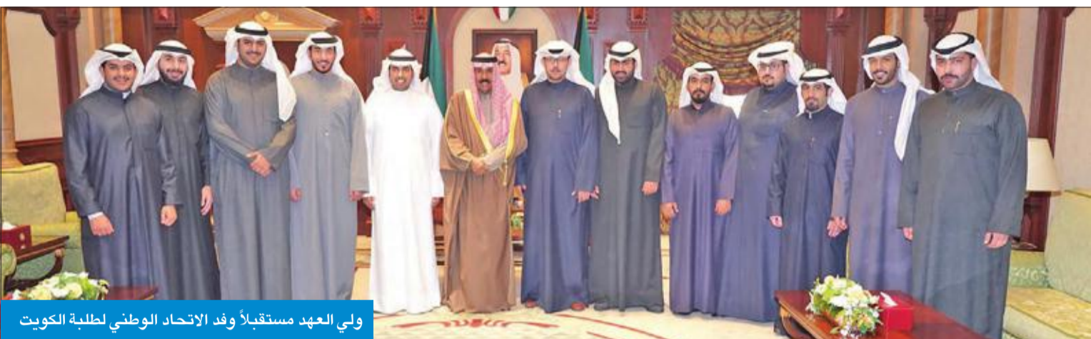
ولي العهد مستقبلاً وفد الاتحاد الوطني لطلبة الكويت

استقبل سمو ولي العهد الشيخ نواف الأحمد قصر بيان، صباح أمس، سمو الشيخ ناصر المحمد. واستقبل سموه رئيس المجلس البلدي أسامة العتيبي، ونائب رئيس المجلس البلدي عبدالله المحري، حيث قدما لسموه إصداراً خاصاً بعنوان «محاضر تاريخية للمجلس البلدي منذ عام 1932»، وقد شكرهما سموه متمنياً لهما التوفيق والنجاح.