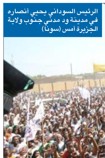
الرئيس السوداني يحيي انتصاره في مدينة ودمدني جنوب ولاية الجزيرة (أسون)

في أول ظهور له منذ انطلاق الاحتجاجات على ترمي الأوضاع الاقتصادية، التي عمت مناطق عدة في السودان بينها الخرطوم، التي تحولت إلى «ثكنة عسكرية»، اتهم الرئيس عمر البشير، أمس، «خونة ومرترقة ومندسين باستغلال الضائقة المعيشية في التخريب وخدمة الأعداء».