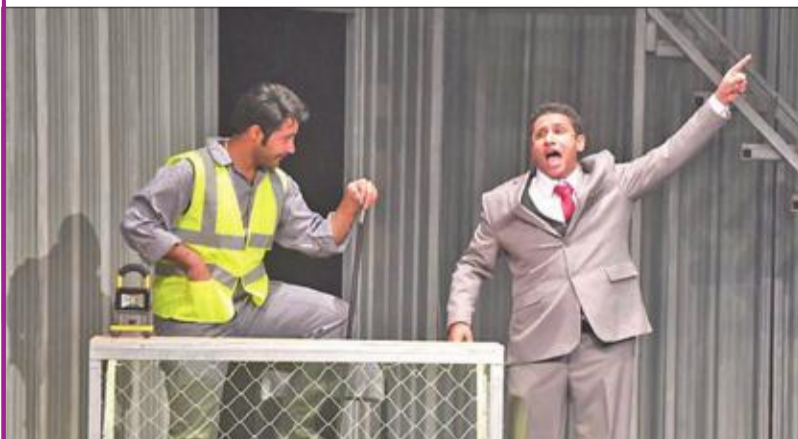
مشهد من مسرحية «درس»

الشبك الحديدي ورمزية وضع الكرسي أعلى السلم. وتتطرق المسرحية إلى النفس البشرية، والصراعات الدائمة على الكرسي، والمناصب، وحاول المخرج أن يترجم نص عبادة بصريا، من خلال توظيف العديد من النماذج الإنسانية، مسلطاً الضوء على الخلل الذي يكمن في الجهاز الإداري، ما يسبب غياب العدالة.