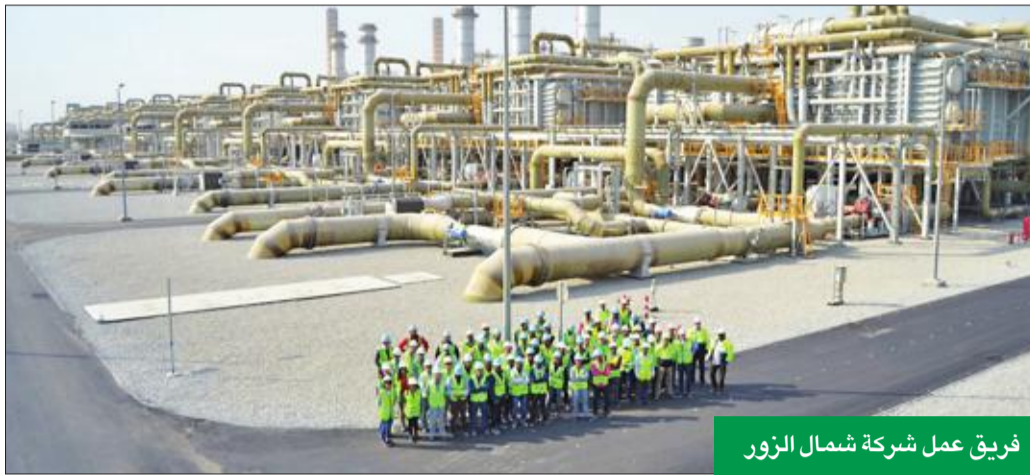
فريق عمل شركة شمال الزور

أعلنت بدأت أعمالها التشغيل وإدارة وصيانة محطة الزور الشمالية المرحلة الأولى، أمس، بلوغ هذه المحطة عامها الثاني من التشغيل التجاري بنجاح وسلامة، وهي أول محطة مستقلة لتوليد الطاقة وتخليقة المياه في الكويت تسهم اليوم بطاقة إنتاجية تصل إلى 1.53 ميغاواط من الكهرباء بما يعادل 27 في المئة من احتياج الطاقة في الكويت و107 ملايين غالون من المياه يومياً بما يعادل 35 في المئة من احتياج المياه للكويت.