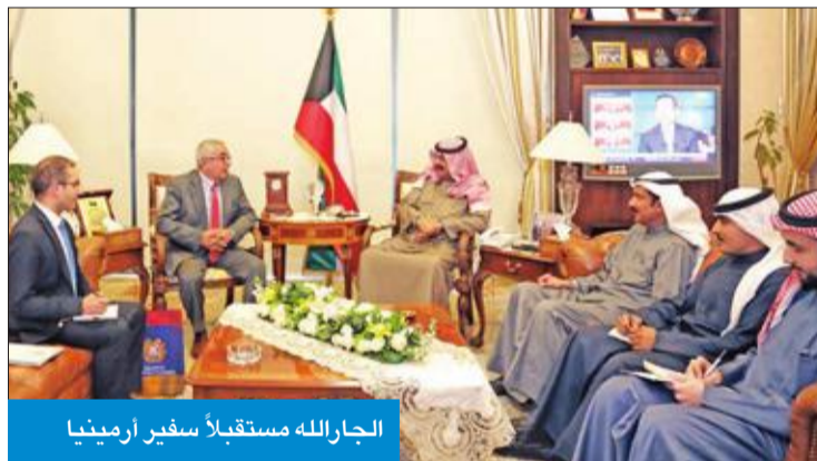
الجارالله مستقبلاً سفير أرمينيا

حضر اللقاء مساعد وزير الخارجية لشؤون مكتب نائب الوزير السفير أيهم العمر.