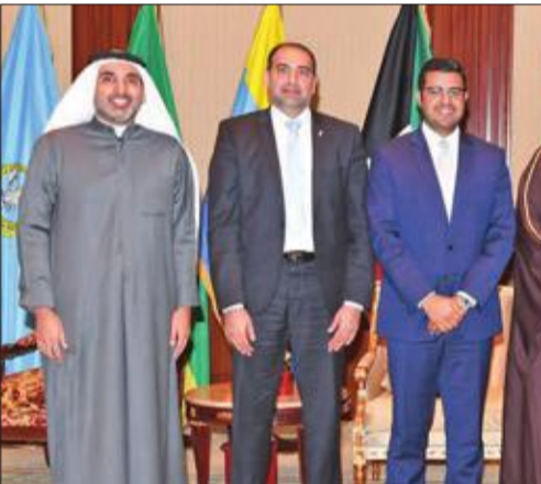
الأمير مستقبلاً وزير الصحة والجمعية الطبية