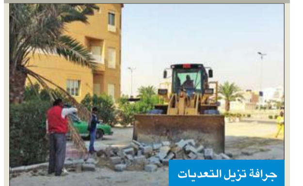
جرافة تزيل التعديلات