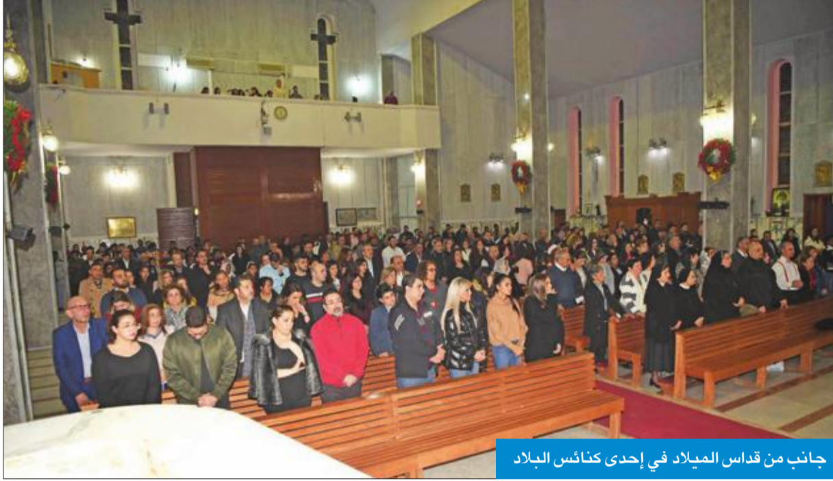
جانب من قداس الميلاد في إحدى كنائس البلاد