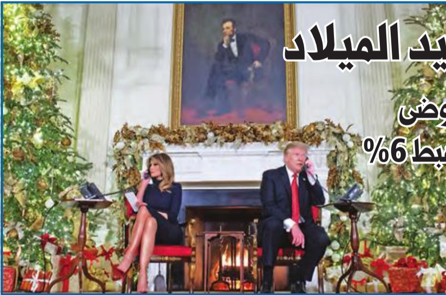
ترامب وزوجته ميلانيا يجيبان عن أسئلة متصلين حول عيد الميلاد في البيت الأبيض مساء الأول

الادارات الفدرالية، وصولاً إلى إقالة وزير الدفاع المفاجئة. ووسط غياب أي مخرج فوري للضرورة، تبادل الجمهوريون والديمقراطيون منذ منتصف ليل الجمعة - السبت الاتهامات، بشأن مازق إقرار مشروع الموازنة، الذي أدى إلى إغلاق جزئي للإدارات. وقالت زعيمة الديمقراطيين في