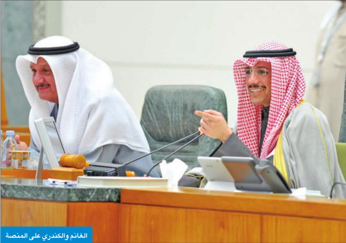
الغانم والكندري على المنصة

المجلس يواصل مناقشة الخطاب الأميري اليوم ويصوت على «المعلومات الائتمانية» في المداولة الثانية