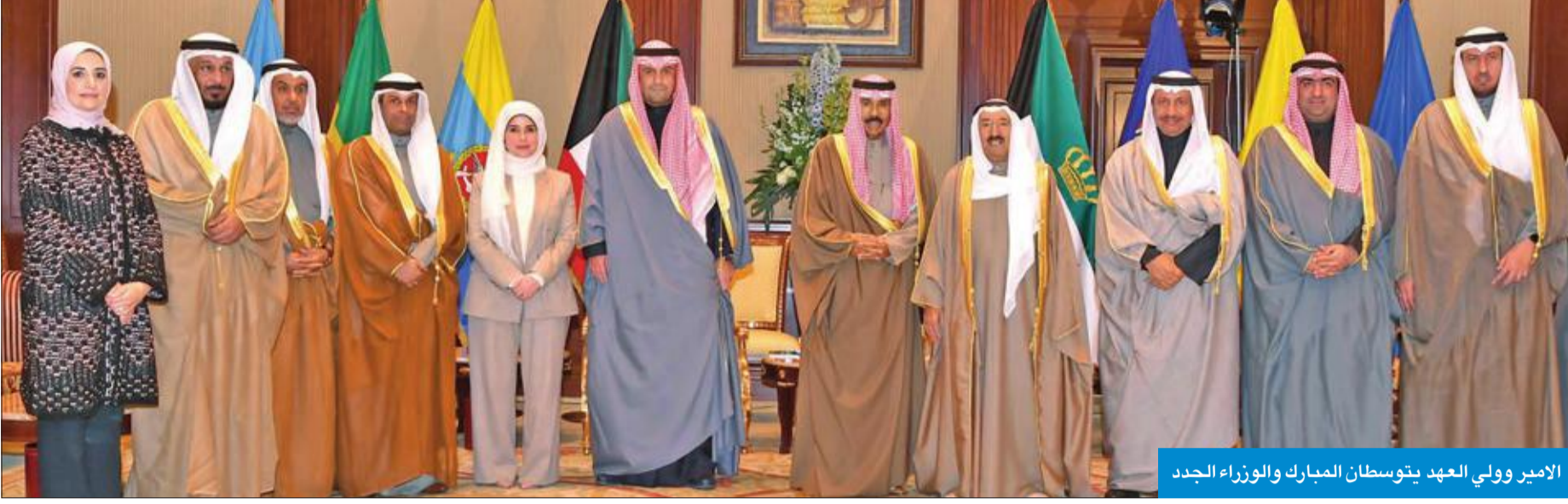
الأمير وولي العهد يتوسطان المبارك والوزراء الجدد

ولي العهد: تحمّل أعباء المسؤولية الوطنية لبلوغ النهضة التنموية الشاملة للوطن والشعب