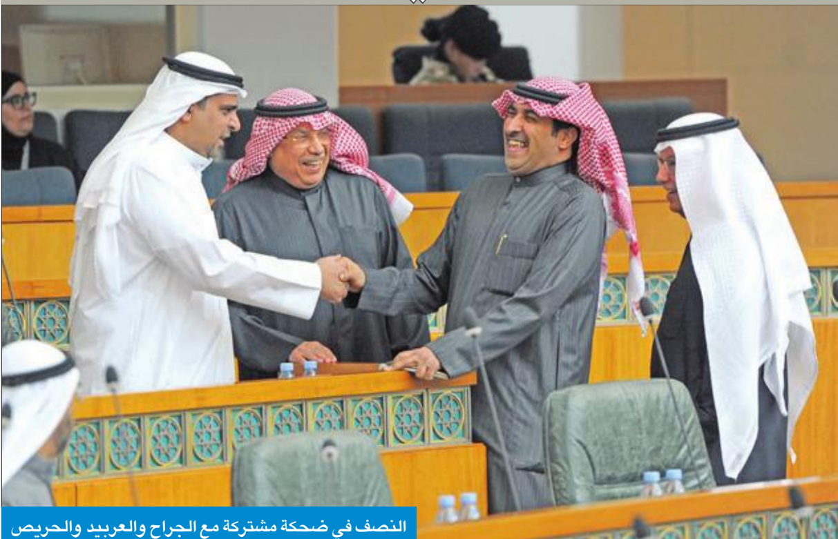
النصف في ضحكة مشتركة مع الجراح والعريبيد والحريص