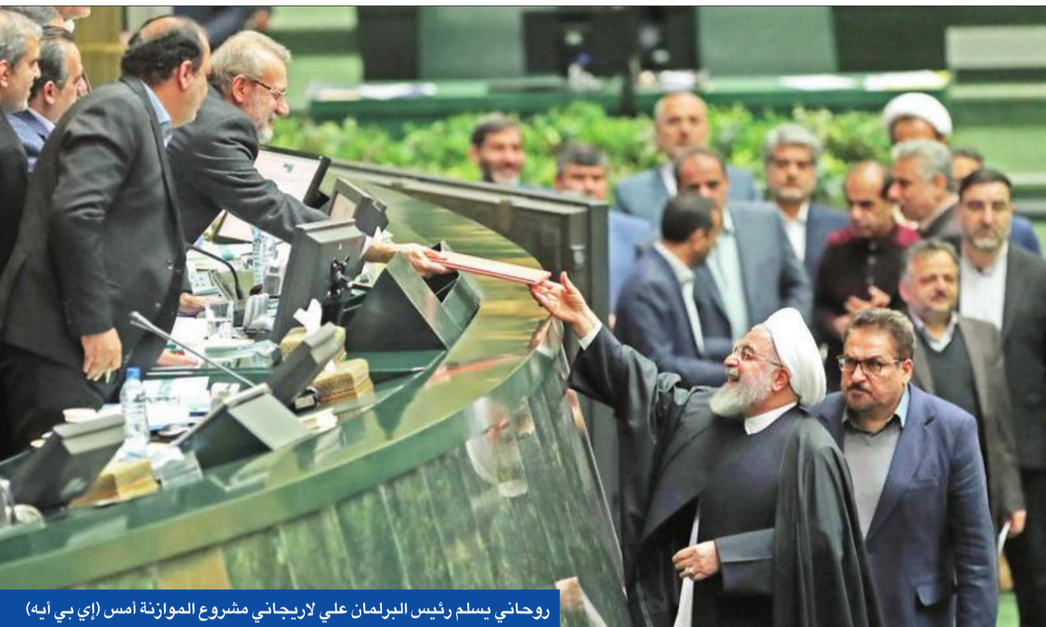
روحاني يسلم رئيس البرلمان علي لاريجاني مشروع الموازنة أمس

قدم الرئيس الإيراني حسن روحاني الموازنة المالية الجديدة إلى مجلس الشورى، أمس، وكشف خلال استعراضها أن مدخرات البلاد من العملات الأجنبية نفذت، على وقع العقوبات الأميركية، في حين كشف تقرير أن أزمة الاقتصاد الإيراني أعمق من ضغوط واشنطن. بعد نحو 8 أشهر من انسحاب الولايات المتحدة من الاتفاق النووي وإعلانها إعادة فرض عقوبات اقتصادية خانقة على طهران، كشف الرئيس الإيراني حسن روحاني، أمس، أن المدخرات من العملات الأجنبية وصلت خلال الأشهر الماضية إلى الصفر. وقدم روحاني مشروع موازنة البلاد للعام الفارسي الجديد (47 مليار دولار يسعر السوق الحرة) إلى مجلس الشورى «البرلمان»، أمس، مؤكداً أن حكومته اتخذت إجراءات صعبة لإنقاذ إيران. وحذر روحاني، الذي أيد بشدة الاتفاق النووي مع القوى الكبرى عام 2015، من أن «هدف أميركا هو تركيع النظام الإسلامي، وستقتل في ذلك، لكن لا شك أن العقوبات الظالمة ستؤثر على معيشة المواطنين، وعلى التنمية والنمو الاقتصادي». وأضاف أن العقوبات أثرت عملياً ونفسياً على سوق العملات في إيران، حيث ساهمت في تدهور العملة الإيرانية، مؤكداً أن الموازنة الجديدة تتناسب مع العقوبات المفروضة.