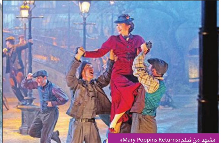
مشهد من فيلم «Mary Poppins Returns»