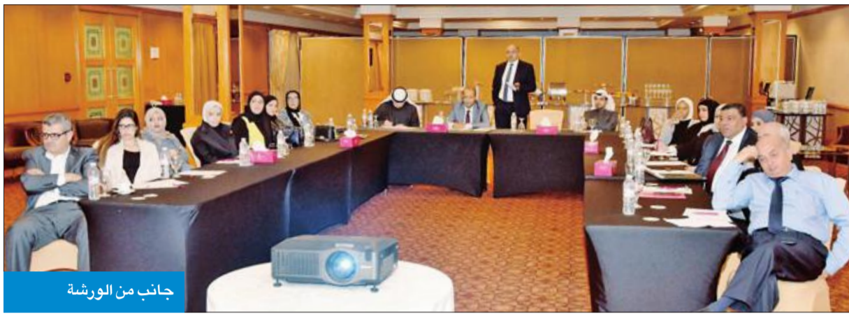
جانِب من الورشة

المتبعة، والاختلافات القائمة بين الإصدارين المذكورين، وكذلك مناقشة مفهوم الأخطار الناشئة عن عقود الضمان في عقود الفيديو والقوة القاهرة، وأثر تحققها على التزامات الأطراف (المالك والمهندس والمقاول) الواردة في بنود العقد الموحد.