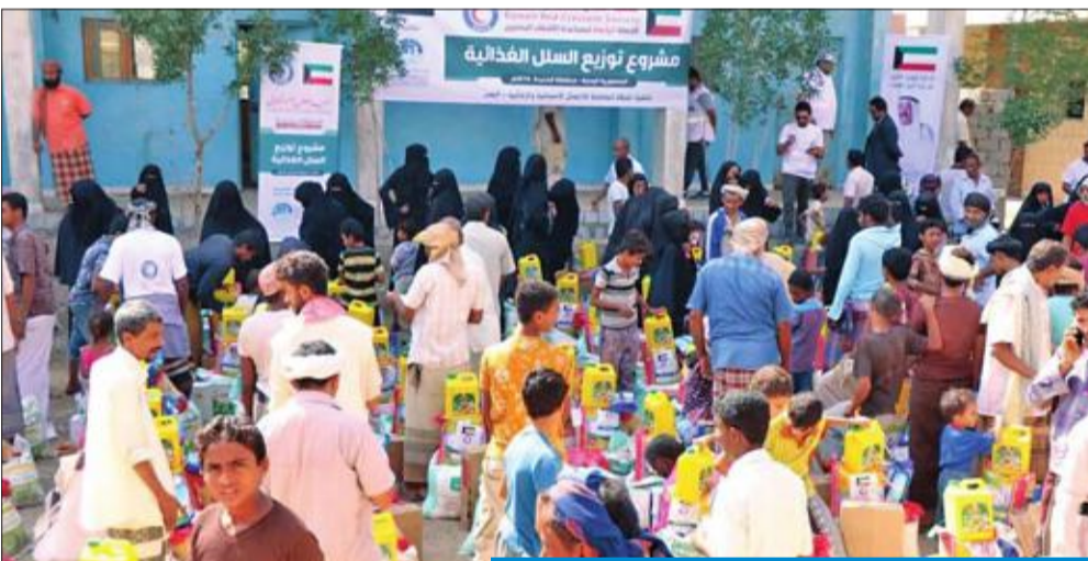
جانب من توزيع السلال الغذائية بالمحافظات البينية