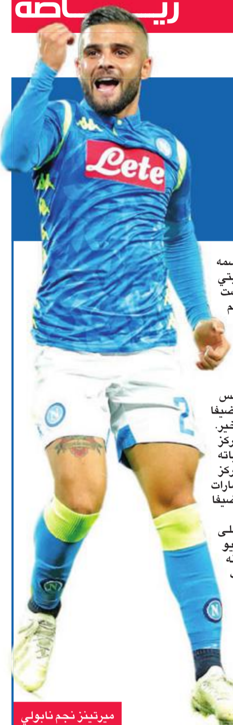
ميرتيز نجم نابولي