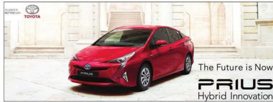
The Future is Now PRIUS Hybrid Innovation

سريعة الحركة (9)، إن الجهود المبذولة لتطوير وزيادة تنوع خيارات نظم الطاقة الكهربائية مرتبطة بصورة مباشرة بتحديات البيئة لتويوتا عام 2050 إذ تهدف الشركة إلى تحقيق مبيعات من السيارات الكهربائية تصل إلى 5.5 ملايين مركبة بحلول عام 2030، ولتحقيق هدفها كشفت «تويوتا» النقاب عن خطتها لتوفير عشر موديلات من السيارات الكهربائية حول العالم في مطلع 2020 واعتباراً من عام 2025 تقريباً تهدف الشركة إلى إنتاج 33 موديلاً من السيارات الكهربائية من إنتاجها العالمية.