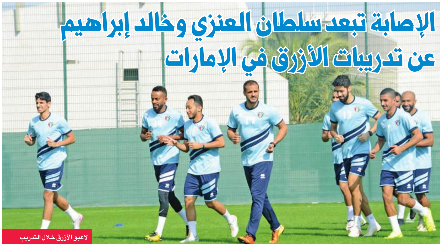
لاعبو الأزرق خلال التدريب

وأضاف أن طموح الكويت، كما الوحدات، وبقيّة الفريق المشاركة في المحلق هو التأهل لمواجهة الكبار في بطولة دوري أبطال آسيا، مؤكداً أن المهمة صعبة، لكنها ليست مستحيلة. وعن الفوز الذي حققه الأبيض على خيطان في مستهل منافسات كأس الاتحاد، قال عبدالله إن