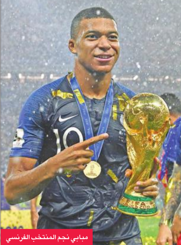
مبابي نجم المنتخب الفرنسي

سائق فراري الألماني سيباستيان فيتل الباحث عن لقبه العالمي الخامس، والأول منذ عام 2013.