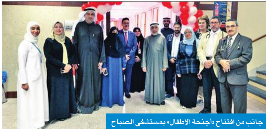
جانب من افتتاح «أجنحة الأطفال» بمستشفى الصباح

أصدر وزير الصحة الشيخ د. باسل الصباح عدة قرارات لتنظيم آلية شراء الأدوية والأجهزة الطبية، وذلك بما يتوافق مع قانون المناقصات العامة رقم 49 لسنة 2016 ولائحته التنفيذية وتعاميم وزارة المالية في هذا الشأن. ويأتي هذا الإجراء ضمن الخطوات التصحيحية التي يتخذها وزير الصحة لتلافي ملاحظات الجهات الرقابية المحتملة في ديوان المحاسبة وجهاز المراقبين الماليين. كما أصدر وزير الصحة قراراً