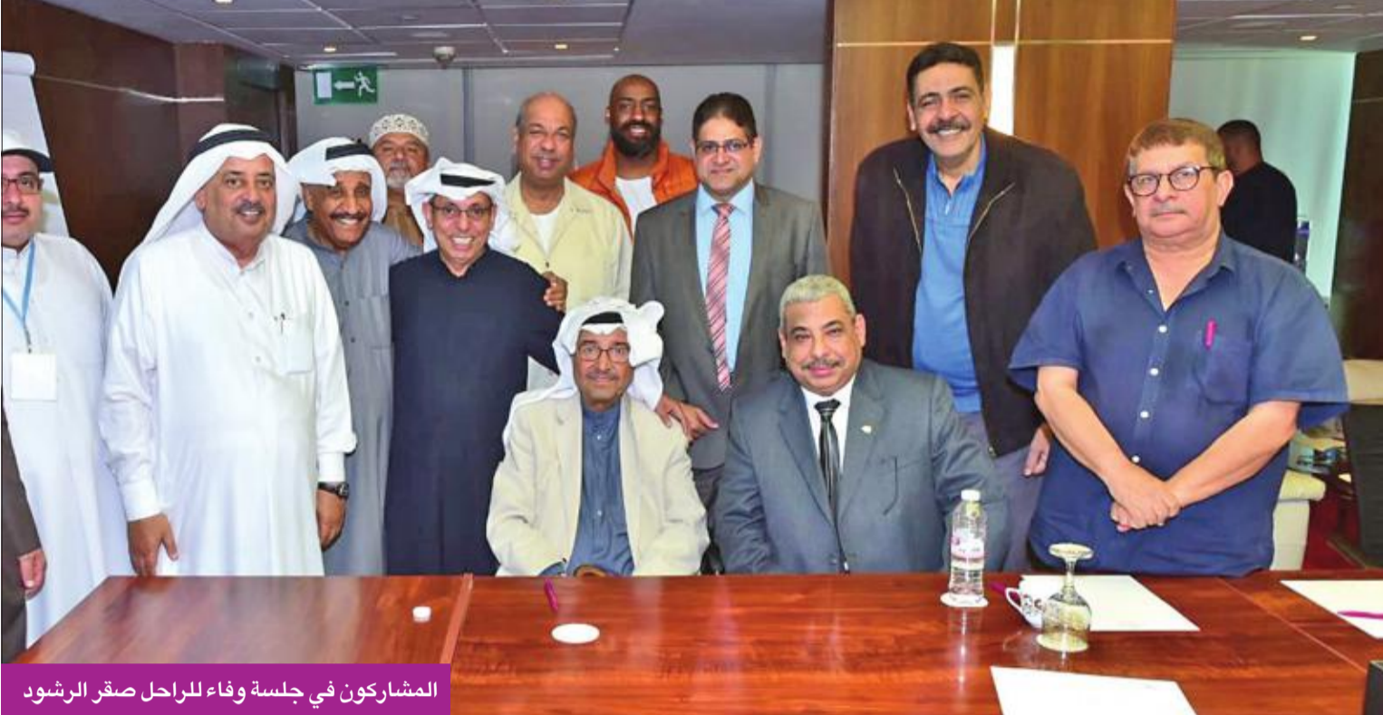
المشاركين في جلسة وفاء للراحل صقر الرشود

مهرجان الكويت المسرحي نظم جلسة حوارية عن الراحل