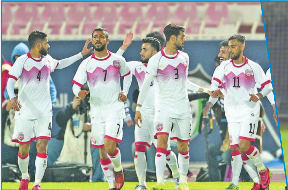
... وأخسر من تدريبات المنتخب البحريني