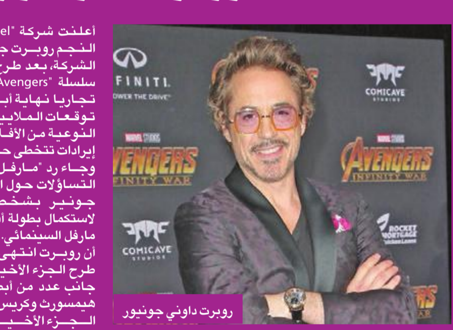
روبرت داووني جونور

أعلنت شركة «Marvel» انتهاء عقد النجم روبرت جونور رسمياً مع الشركة، بعد طرح الجزء الأخير من سلسلة «Avengers»، والمقرر عرضه تجارياً نهاية أبريل المقبل، وسط توقعات الملايين من محبي هذه النوعية من الأفلام بتحقيق الفيلم إيرادات تتخطى حاجز الملياري دولار. وجاء رد «مارفل» بعد العديد من التساؤلات حول الاستعانة بخدمات جونور بشخصية «Iron Man»، لاستكمال بطولة أفلام أخرى من عالم مارفل السينمائي. إلا أن «مارفل» أكدت أن روبرت انتهى عقده بالفعل مع طرح الجزء الأخير من السلسلة، إلى جانب عدد من أبطالها، منهم: كريس هيمسورث وكريس ايفانز. الجزء الأخير من السلسلة