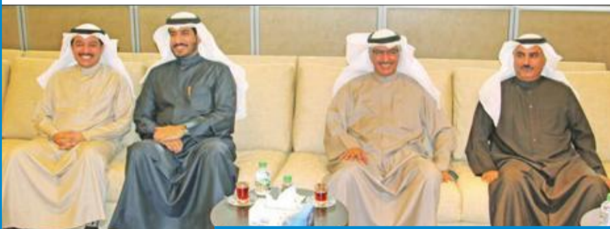
مسؤولو «التربية» وبيت الزكاة خلال توقيع الاتفاقية

اتفاقية شراكة مع «التربية» بقيمة 750 ألف دينار