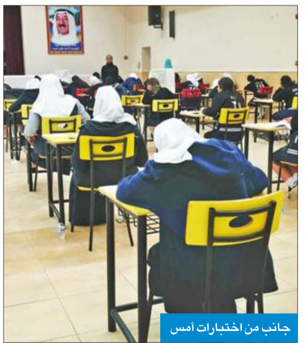
جانب من اختبارات أمس

تعمل الجهات المعنية في «التربية» على دراسة طلبات النقل الخارجي للمعلمين، وإصدار القرارات قبل نهاية عطلة الربيع.