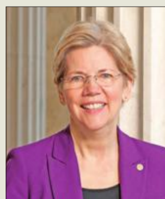
السيناتور إيزابيث وارن