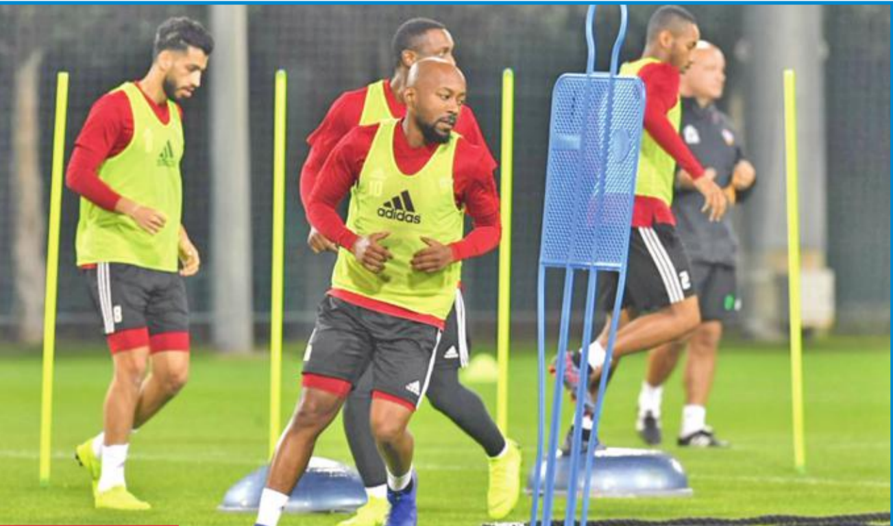
جانب من تدريبات المنتخب الإماراتي