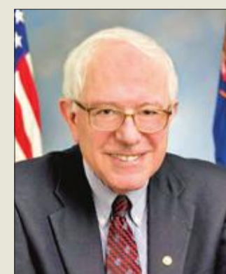
السيناتور المستقل بيرني ساندرز

عدداً ضئيلاً من النخبويين فحسب، أين الاختلاف بين هذا الرأي وما يقوله ترامب؛ يبدو الجناح التقدمي في الحزب الديمقراطي مستعداً للتحلي عن التجارة الحرة بقدر الحزب الجمهوري الذي اجتاحتته النزعة «الترامية»، كما أنه مستعد بالقدر نفسه لانتقاد المبالغ التي تُصرف لبناء الأوطان في الخارج على شكل هبات للأجانب، على اعتبار أن صرف تلك الأموال داخلياً سيكون أفضل لتلبية الحاجات المحلية.