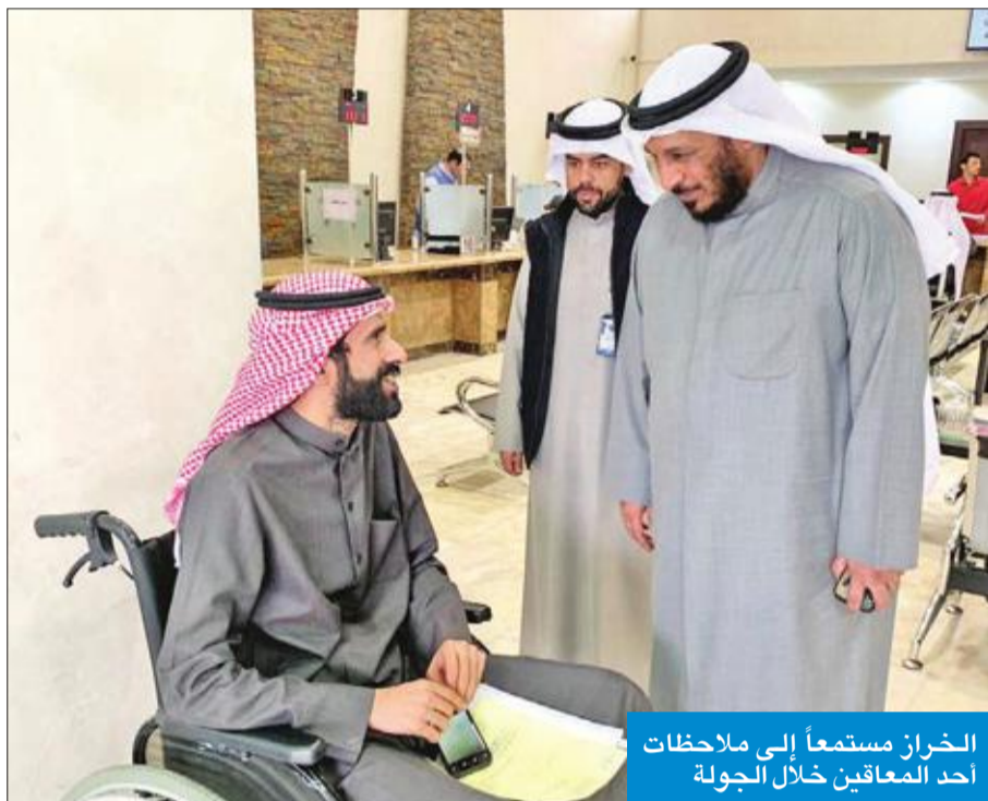
الخرز مستمعاً إلى ملاحظات أحد المعاقين خلال الجولة

وأوضح الأنصاري لـ «الجريدة» أنه عقب الزيارة، اجتمع مع الوزير الخراز حيث شرح له آليات عمل القطاع التعليمي والخدمات التي يقدمها، ومنها متابعة وتقييم جودة الخدمات التعليمية المقدمة في المراكز والمدارس والحضانات التأهيلية التابعة للهيئة، والتأكد من وضع المناهج المناسبة لذوي الاحتياجات الخاصة، فضلاً عن متابعة دورية للجهات التعليمية، عبر اللجان والفقر التابعة للقطاع، للوقوف على مدى التزامها بالمنهجية المعتمدة لدينا».