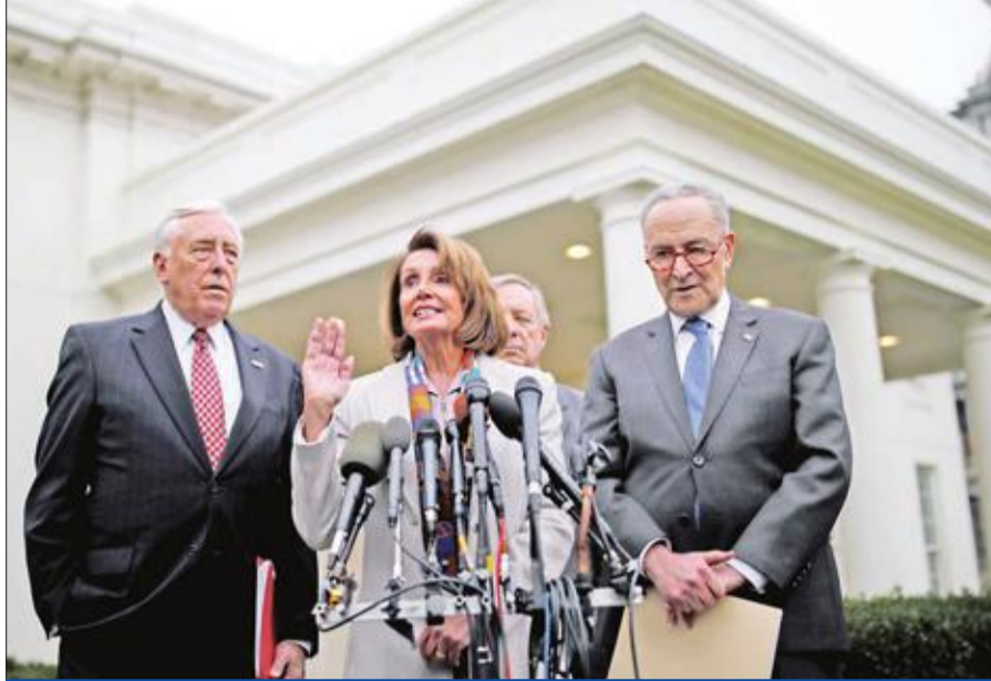
بيلوسي تتوسط السيناتورين هوير وشومر خلال مؤتمر صحفي بعد اجتماعهم مع ترامب في البيت الأبيض أمس الأول

وكرر الديمقراطيون موقفهم المؤيد ل«امن» متين، على الحدود، مع استمرار معارضة الجدار الذي يرون أنه مكلف وغير مجد.