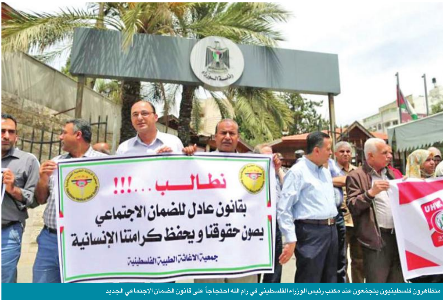
متظاهرون فلسطينيون يتجمعون عند مكتب رئيس الوزراء الفلسطيني في رام الله احتجاجاً على قانون الضمان الاجتماعي الجديد

في ظل الحالة الاقتصادية القاتمة في الضفة الغربية يدّعي المعارضون أن الخصومات مفرطة كما يعترضون على الأحكام التمييزية في القانون