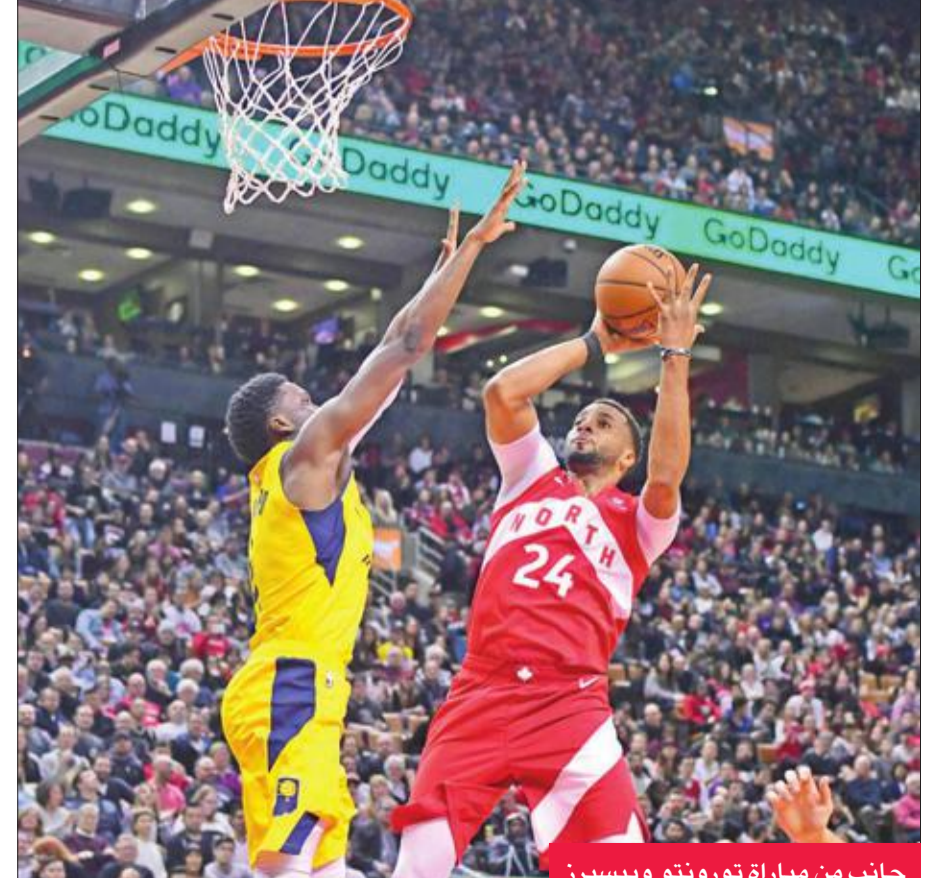
جانب من مباراة تورونتو وبيسيرز

تغلب تورونتو رابتورز على إنديانا بيسرز، في حين فاز مينيسوتا تمبرولفز على لوس أنجلس ليكرز، أمس الأول، في الدوري الأميركي لكرة السلة. غلين تابلور