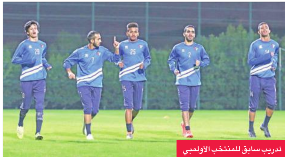
تدريب سابق للمنتخب الأولمبي

معسكراً حالياً استعداداً لمواجهة فلسطين، وكذلك للدورة الرباعية الدولية التي تنظمها قطر بمشاركة منتخبات طاجيكستان وإيران إلى جانب منتخب البلد المضيف والأزرق.