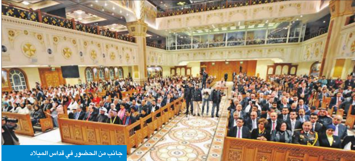
جانب من الحضور في قداس الميلاد

بالإضافة إلى الانتهاء من إنشاء 12 محطة كهرباء، وإنجاز 512 مشروعاً إسكانياً بتكلفة اقتربت من 50 مليار جنيه. وقال القوني «مر عام منذ اعتمادنا سفيرا لمصر في الكويت الشقيقة، وقد لمست خلال العام الماضي بوضوح إسهام الجالية المصرية المقدرة في العديد من القطاعات الحكومية وغير الحكومية داخل الكويت، إسهاماً هو محل تقدير وإشادة من مختلف المسؤولين الكويتيين، وبما يعكس تميز الجالية ودورها الكبير في التنمية بالكويت، كما لمست انشغال تلك الجالية بقضايا