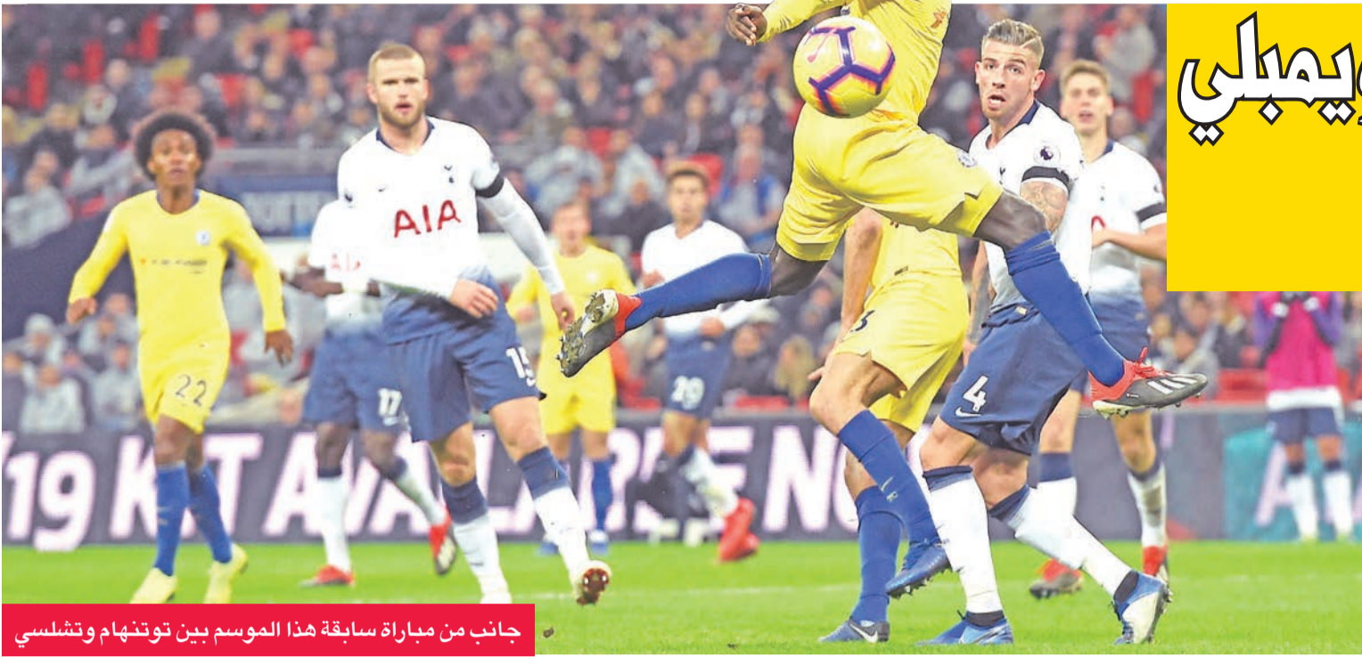
جانب من مباراة سابقة هذا الموسم بين توتنهام وتشلسي