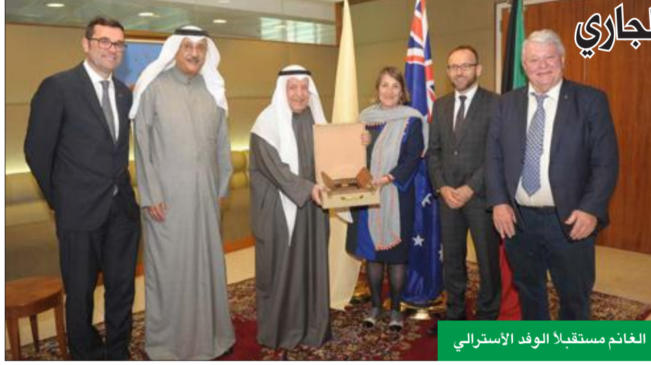
الغانم مستقبلاً الوفد الأسترالي

إتاحة الفرصة لهم للقاء نظرائهم من أصحاب الأعمال الكويتيين.