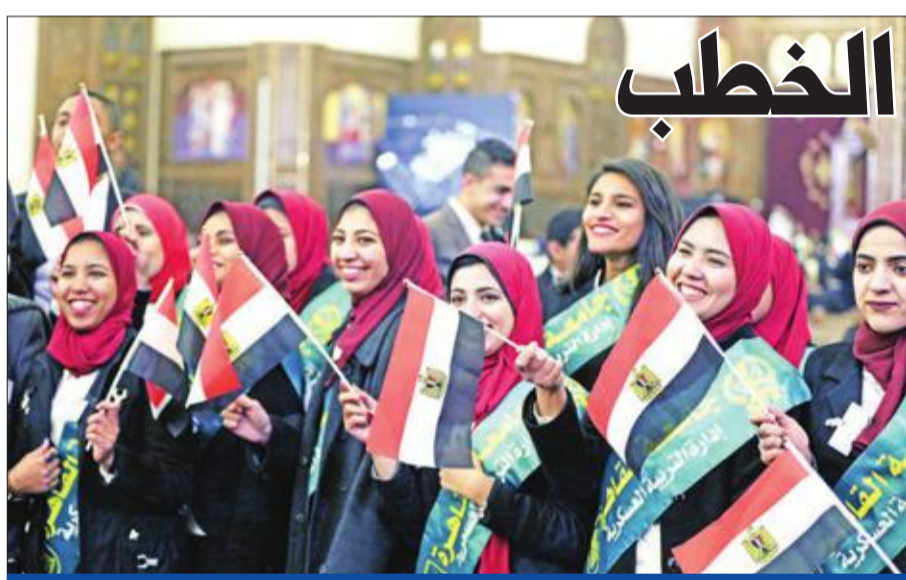
تساء يحملن أعلاماً مصرية داخل كاتدرائية الميلاد في العاصمة الإدارية أمس الأول

إلى ذلك، طالب بشار الكيكي، نائب رئيس كتلة الحزب الديمقراطي الكردستاني بزعامة مسعود البارزاني، رئيس مجلس الوزراء عادل عبدالمهدي بـ «التدخل لمنع تصليب سلطة محلية في سنجان بالقوة»، وقال الكيكي في بيان: «ترفض بشدة قيام أشخاص بتخصيص قائمقام جديد لسنجان بالقوة وبمساعدة مقاتلي حزب العمال الكردستاني التركي المنضويين في تشكيل الحشد الشعبي، الذين يتواجدون في القضاء دون موافقة الحكومة العراقية، وخلافاً للاتفاقيات مع دول الجوار». وتكشف صحيفة «الشرق الأوسط» عن قيام أطراف غير شرعية بتشكيل حكومة محلية ومجلس قضاء في منطقة سنجان الحدودية مع سورية، معتبراً أن هذه الخطوة «باطلة ولا يمكن الاعتراف بها».