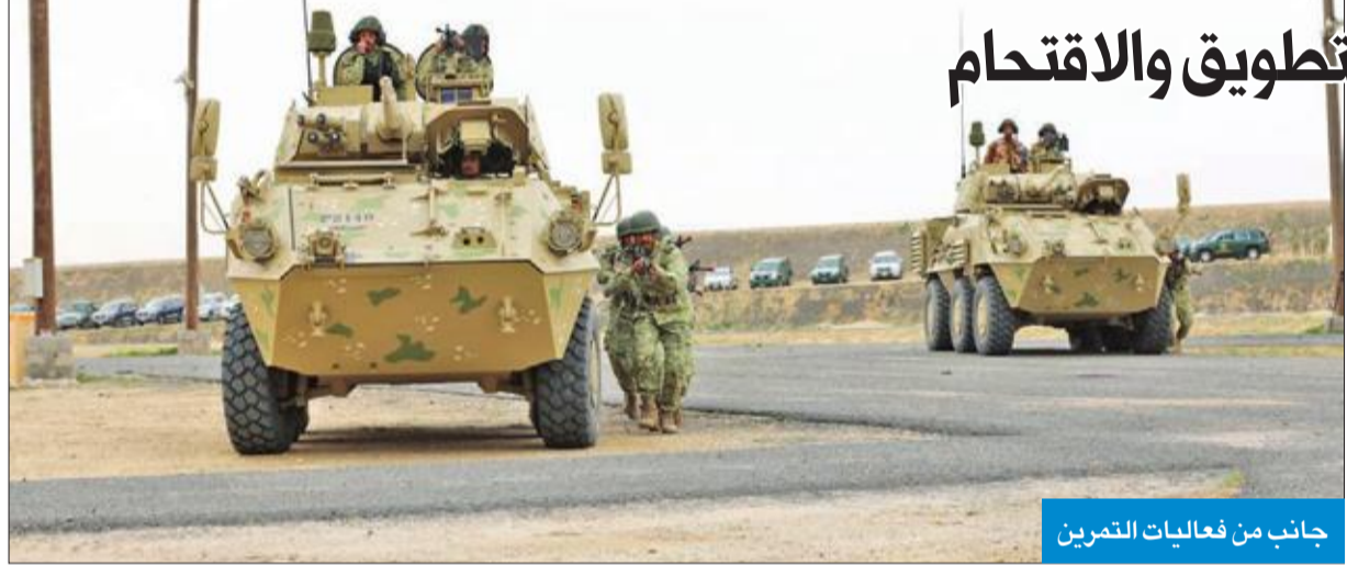
جانب من فعاليات التمرين

التمارين يشمل فض الشغب والتطويق والاقترام أقام معهد تدريب قوات الحرس الوطني التمرين النهائي لسدورة المشاة التأسيسية للضباط (صقر 4)، برعاية وكيل الحرس الوطني الفريق الركن مهندس هاشم الرفاعي، وبحضور معاون العمليات والتدريب اللواء الركن فالح شجاع. واشتمل التمرين على سيناريو فض الشغب والقتال بالمناطق المبنية، وعمليات العزل والتطويق، والاقترام، والإخلاء الطبي، بهدف تدريب ضباط الدورة على هذه العمليات مع التركيز على التعاون في التخطيط والتنفيذ بين الوحدات المختلفة. وأكد اللواء شجاع أن هذا التمرين يأتي بتوجيهات القيادة العليا للحرس الوطني ممثلة في الفريق الركن الوطني سمو الشيخ سالم العلي، ونائب رئيس الحرس الوطني الشيخ مشعل الأحمد، وبمتابعة من وكيل الحرس الوطني، ضمن سلسلة تمارين يتم تنفيذها لرفع الكفاءة القتالية وتعزيز الثقة بالنفس لدى مختلف الوحدات، مع الوقوف على نقاط القوة والضعف. وأشار اللواء شجاع إلى أن الوثيقة الاستراتيجية للحرس