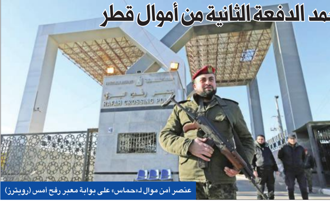
عنصر أمن موال لـ«حماس» على بوابة معبر رفح أمس

أمس ان حملة الاعتقالات طالت نحو 1000 من كوادر الحركة التي يتزعمها عباس.