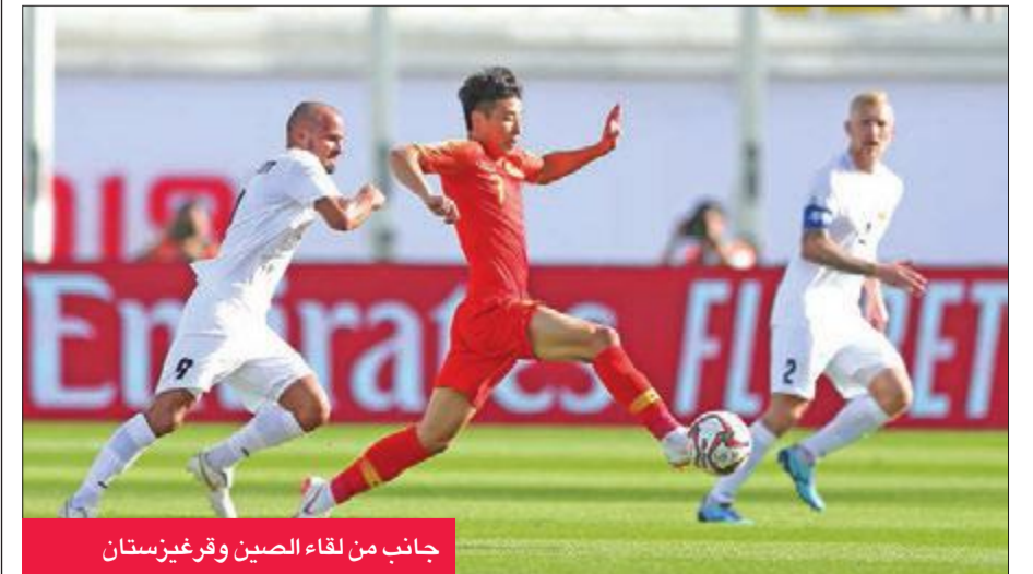
جانب من لقاء الصين وقبرغيزستان