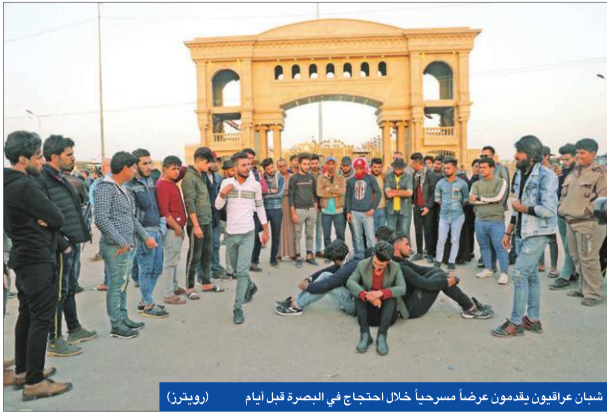
شباب عراقيون يقدمون عرضاً مسرحياً خلال احتجاج في البصرة قبل أيام

● لا تصويت على الوزارات الشاغرة اليوم ● قوات أميركية تشن مدهامات في الأنبار و«العصائب» تهددها