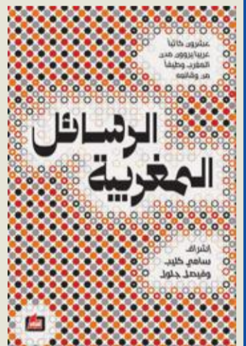
بيروت - الجريدة

حزّر كتاب «الرسائل المغربية» عشرون كاتباً ومتقفاً وإعلامياً من بلدان عربية مختلفة تروى نصوصهم على بابين: الأول يقضي إلى نصوص معرفية عامة في الثقافة والأنثروبولوجيا والسياسة والشعر. أما الثاني فيفتح على نصوص حول ثلاث عشرة مدينة مغربية «اعتمدنا في تناولها على قاعدة كاتب واحد لمدينة واحدة، بيد أن أربع مدن هي فاس وأصيلة والرباط ومراكش قد حظيت كل واحدة منها بنصين من كاتبين مختلفي الحساسيات والانتماء الثقافي والجهوي»، كما يوضح سامي كليب.