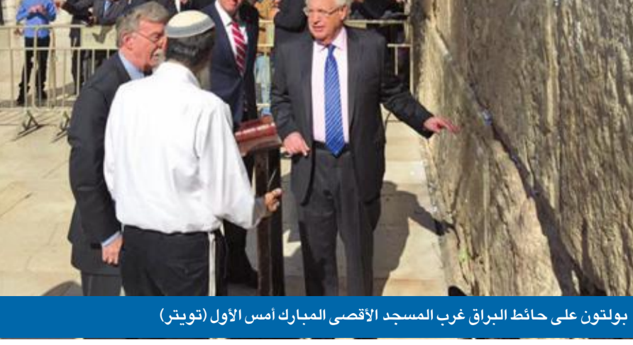
بولتون على حائط البراق غرب المسجد الأقصى المبارك أمس الأول (تويتر)

نتنياهو: الاعتراف الأميركي بضم الجولان مقابل بقاء الأسد