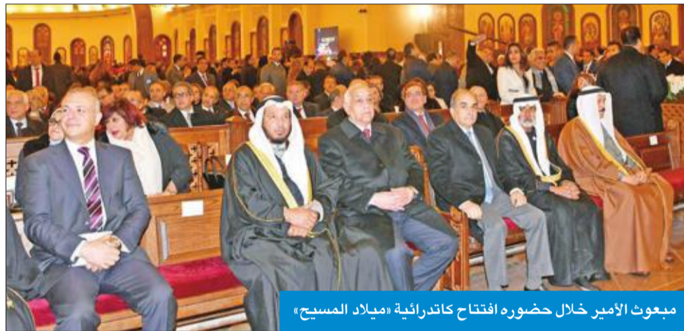
مبعوث الأمير خلال حضوره افتتاح كاتدرائية «ميلاد المسيح»

حضر مبعوث صاحب السمو أمير البلاد الشيخ صباح الأحمد المستشار بالديوان الأميري الدكتور عبدالله المعتوق، مساء أمس الأول، الافتتاح بافتتاح مسجد الفتح والعلم، وكاتدرائية «ميلاد المسيح»، وذلك بالعاصمة الإدارية الجديدة في مصر. وأشاد مبعوث المعتوق بحرص مصر على ترسيخ قيم التسامح والموهبة والتعايش بين المسلمين والأقباط. وقال في تصريح ادلى به المعتوق لـ «كونا» قبيل مغادرته القاهرة أمس إن افتتاح هذين الصرحين الكبيرين من صروح العبادة في وقت واحد وفي مدة زمنية قصيرة يمثل «انجازاً استثنائياً كبيراً على مدى تاريخ الإسلام والمسيحية». وأوضح أن هذه الرمزية تهدف إلى تجسيد مشاعر الأخوة بين المسلمين والأقباط والتعايش جنباً