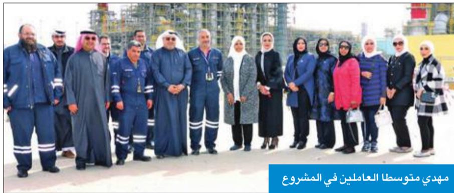
مهدى متوسط العاملين في المشروع

نظمت الأمانة العامة للمجلس الأعلى للتخطيط والتنمية، أمس، زيارة ميدانية لموقع مشروع الوقود البيئي في شركة البترول الوطنية.