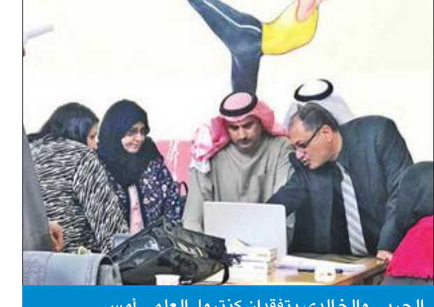
الحربي والخالدي يتفقدان كمتنول العلمي أمس

تفقد رئيس كمتنول الثانوية العامة، وكيل وزارة التربية د. سعود الحربي لجان سير اختبارات الفترة الدراسية الأولى لطلبة الصف الـ 12 بالمرحلة الثانوية في القسم العلمي، واطلع على جهود اللجان المكلفة بعملية التصحيح ومتابعة الرصد وذلك وفق الخطط الموضوعية.