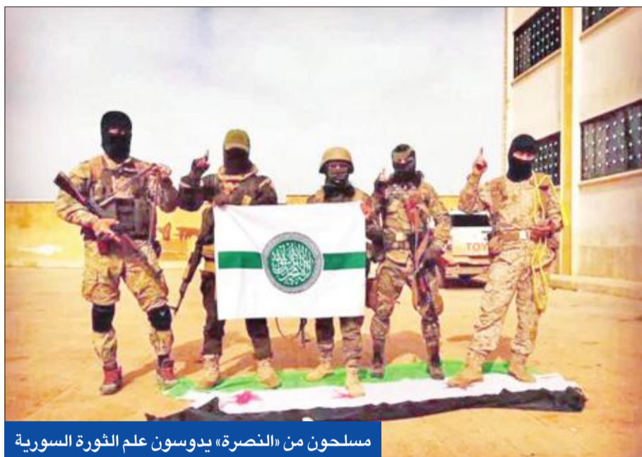
مسلحون من «النصرة» يدسون علم الثورة السورية

• بيدرسون يبدأ مهامه ويتلقى إشادة سورية • «داعش» يخوض معارك كرفر في دير الزور