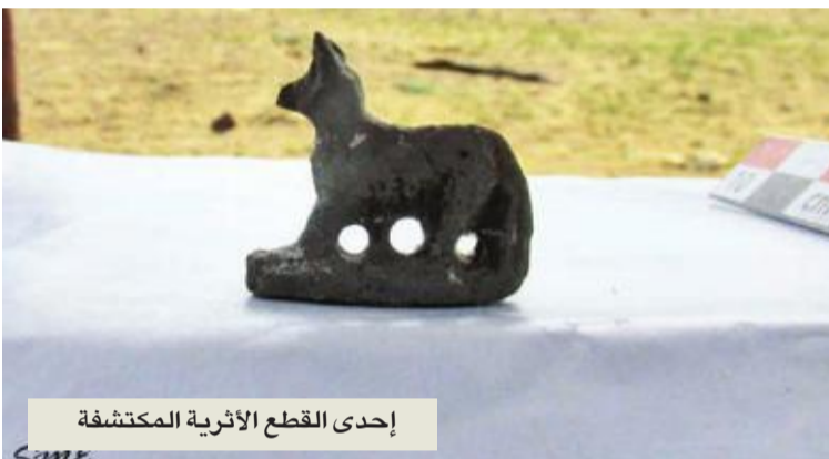
إحدى القطع الأثرية المكتشفة