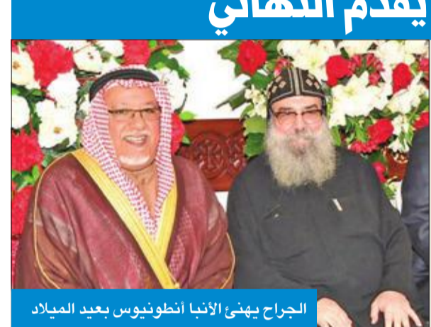
الجراح يهنئ الإنبا انطونيوس بعيد الميلاد

زار وزير شؤون الديوان الأميري الشيخ علي الجراح، أمس، كاتدرائية مارمرقس، حيث قدم التهاني بمناسبة عيد الميلاد.