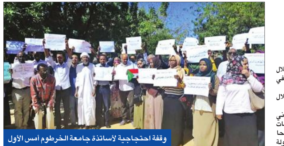
وقفة احتجاجية لاساتذة جامعة الخرطوم أمس الأول

وأردف: «الضرر الذي يلحق بأمننا القومي لن يكون عن طريق الأعداء بل سياجنا من الداخل». وكان حفيد الخميني مؤسس الجمهورية الإسلامية، حذر في وقت سابق من سقوط النظام الإيراني، في حال عدم فهم طبيعة السلوك الإنساني وأسباب البقاء والسقوط.