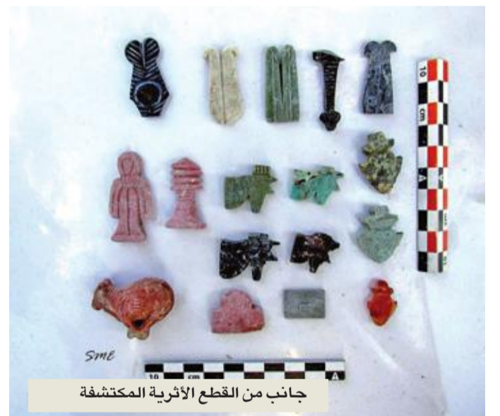
جانب من القطع الأثرية المكتشفة