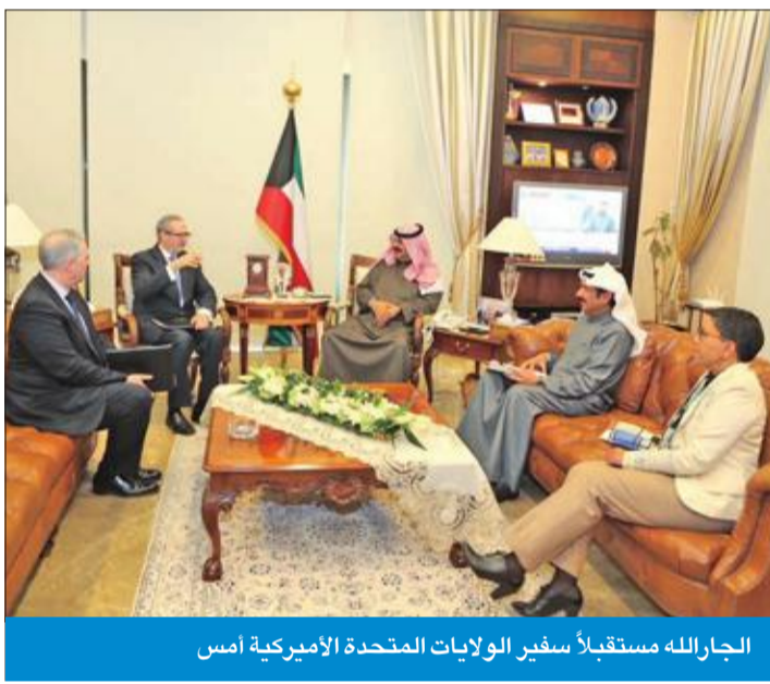
الجارالله مستقبلاً سفير الولايات المتحدة الأمريكية أمس

اجتمع نائب وزير الخارجية خالد الجارالله، أمس، مع سفير الولايات المتحدة الأمريكية لدى الكويت لورانس سيلفرمان، في إطار التحضير للدورة الثالثة من الحوار الاستراتيجي المقرر عقدها بالكويت يوم 15 الجاري، إضافة إلى عدد من أوجه العلاقات الثنائية بين البلدين، وتطورات الأوضاع على الساحتين الإقليمية والدولية. وحضر اللقاء مساعد وزير الخارجية لشؤون مكتب نائب الوزير السفير أيهم العرع، ومساعدة وزير الخارجية لشؤون الأميركيتين الوزيرة المفوضة ريم الخالد. يذكر أن الحوار الاستراتيجي بين الكويت والولايات المتحدة الأمريكية تم إنشاؤه عام 2016، حيث يرأس الجانب الكويتي في الدورة نائب رئيس مجلس الوزراء وزير الخارجية الشيخ صباح الخالد، والجانب الأمريكي وزير خارجية الولايات المتحدة الأمريكية مايكل بومبيو، وتضم في عضويتها العديد من الجهات والمؤسسات والوزارات الحكومية في كلا البلدين.