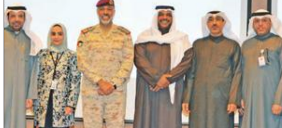
وكيل «الدفاع» متوسطاً بعض المشاركين

نظم ديوان المحاسبة، صباح أمس، بكلية مبارك العبدالله للقيادة والأركان المشتركة، محاضرة حول الرقابة المسبقة واللاحقة، بحضور وكيل وزارة الدفاع الشيخ أحمد المنصور، ونائب رئيس الأركان العامة للجيش الفريق الركن عبدالله النواف. وتطرقت المحاضرة إلى شرح أبرز مواد قانون «المحاسبة» وتعديلاته، والخطوات والإجراءات الواجب تنفيذها على كل أجهزة الوزارة ومتنسيبها من الهيئة العسكرية والإدارية والمالية فيما يتعلق بعملية الرقابة السابقة واللاحقة، تحقيقاً للمصلحة العامة، وللحفاظ على سير الإجراءات التعاقدية وفق الأطر القانونية المتبعة، وبعد ذلك فتح باب النقاش والرد على جميع الاستفسارات ذات العلاقة بموضوع المحاضرة. من جانبه، وجه الوكيل المنصور الشكر إلى «المحاسبة» وفريق المختصين بالرقابة السابقة واللاحقة على ما قدموه من معلومات ذات فائدة ومرود إيجابي يعود بالنفع على الجميع، ويعمل على تحسين مستوى الأداء، ويسهم بدوره في تحقيق المصلحة العامة، التي يعمل الجميع من أجلها.