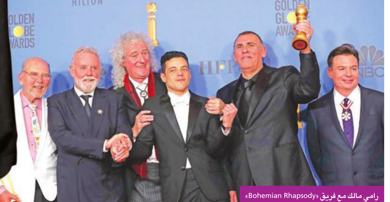
رامي مالك مع فريق «Bohemian Rhapsody»