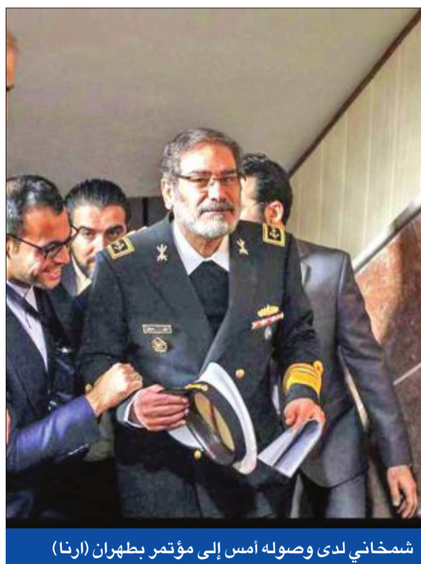
شمخاني لدى وصوله أمس إلى مؤتمر بطهران

وقال مصدر إيراني مطلع، لـ«الجريدة» إن شمخاني فضل أن يقوم هو بكشف اللقاء بدلاً من أن يتكشف في تسريبات صحافية. وكانت الجريدة كشفت عن لقاء غير سري جدا في لندن بين دبلوماسيين من البلدين، تم خلاله الاتفاق على التعاون في ملف اليمن، وهو ما أثمر انعقاد مشاورات السويد.