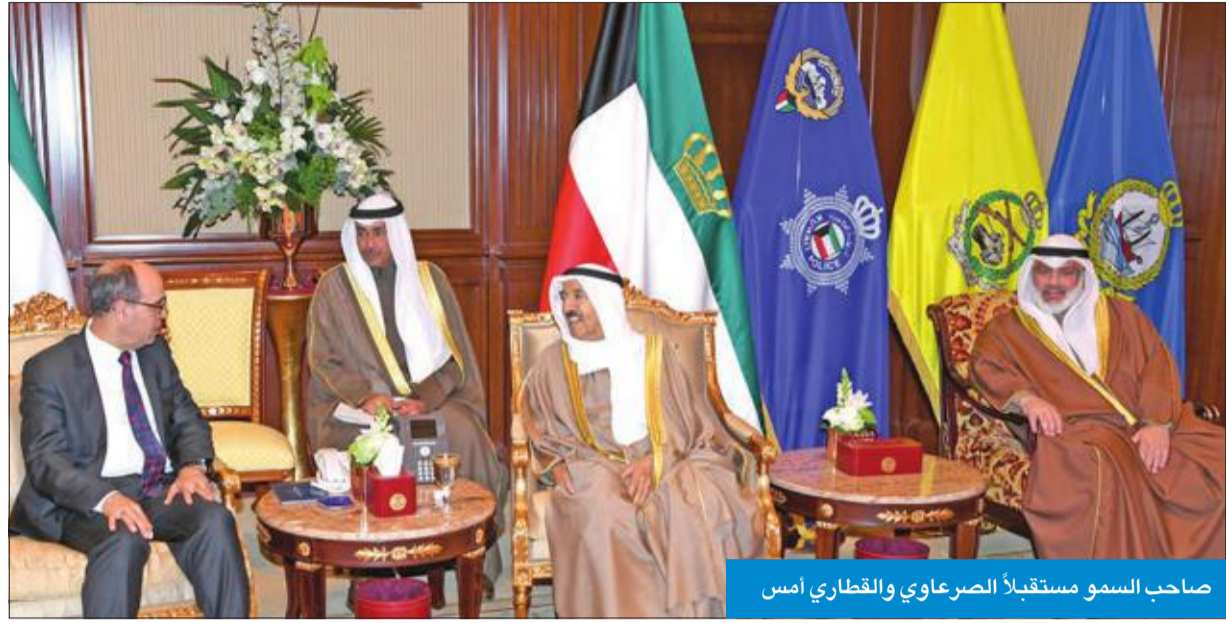
صاحب السمو مستقبلاً الصرعاوي والقطاري أمس

استقبل سمو ولي العهد الشيخ نواف الأحمد بقصر بيان صباح أمس الشيخ ثامر الجابر.