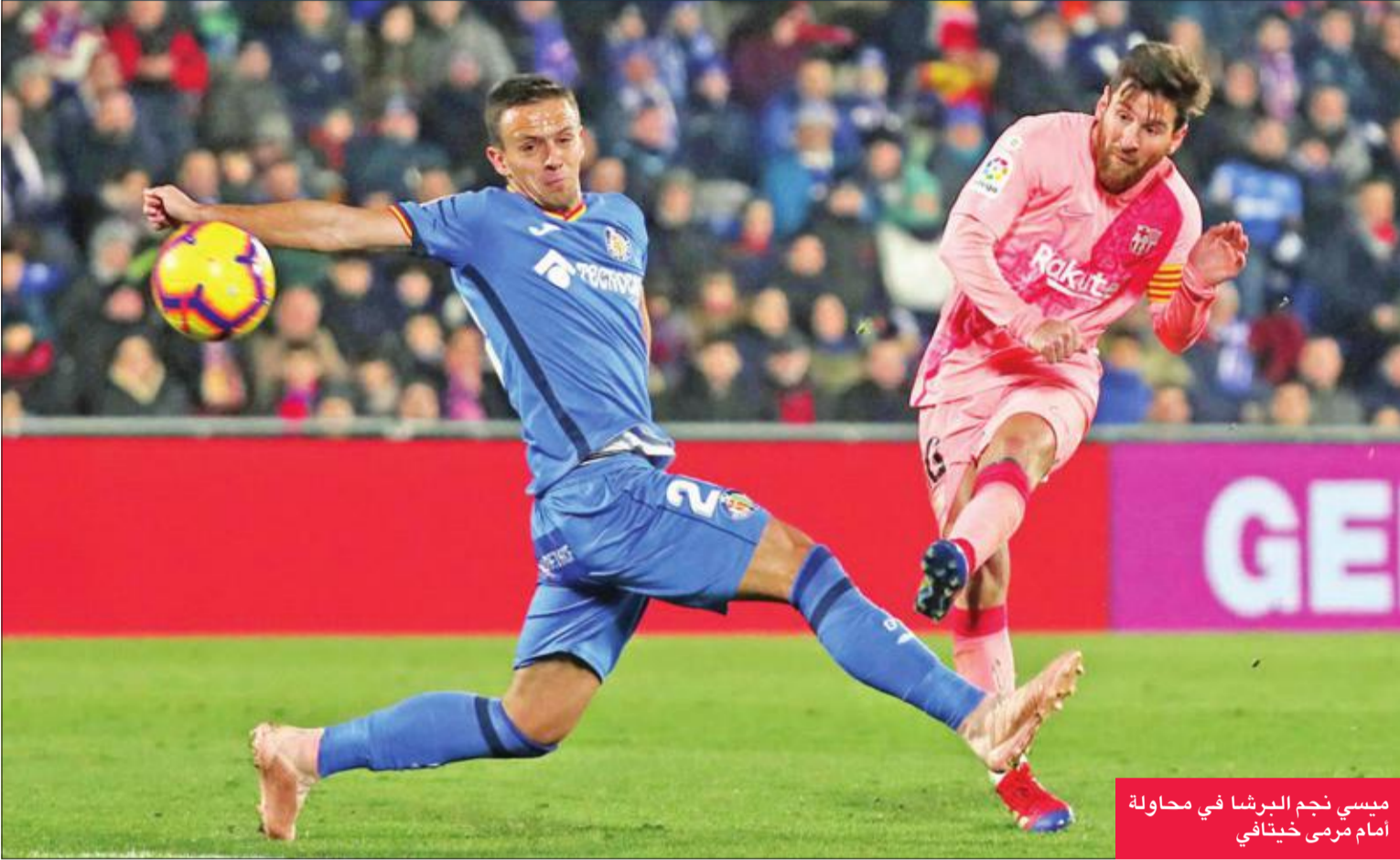
ميسي نجم البرشا في محاولة أمام مرمرى خيتافي

تقبل برشلونة هدايا منافسيه واقترب خطوة جديدة نحو الاحتفاظ بلقب الدوري الإسباني للموسم الثاني على التوالي، عقب فوزه الصعب 1-2 على مضيفه خيتافي، أمس الأول، في المرحلة الثامنة للمسابقة.