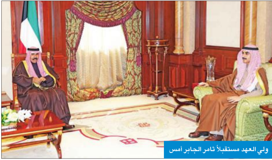
ولي العهد مستقبلاً ثامر الجابر أمس