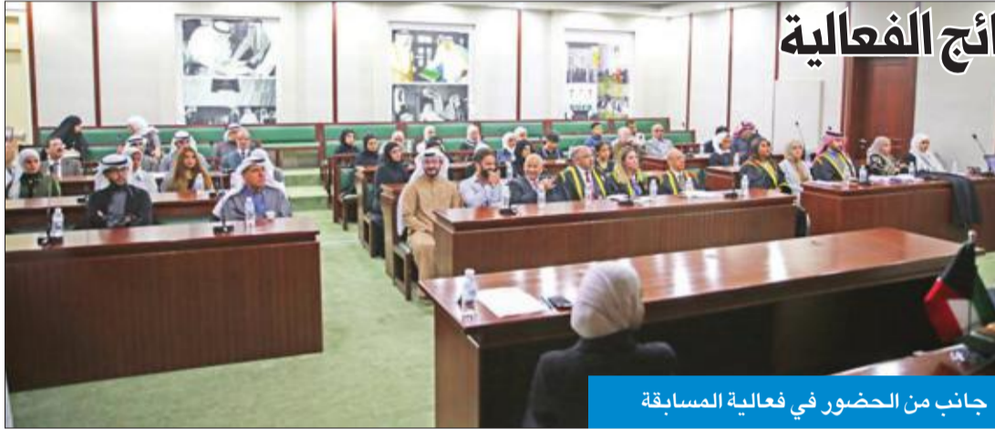
جانب من الحضور في فعالية المسابقة

فريق المدعى عليه يفوز بالجائزة في نتائج الفعالية