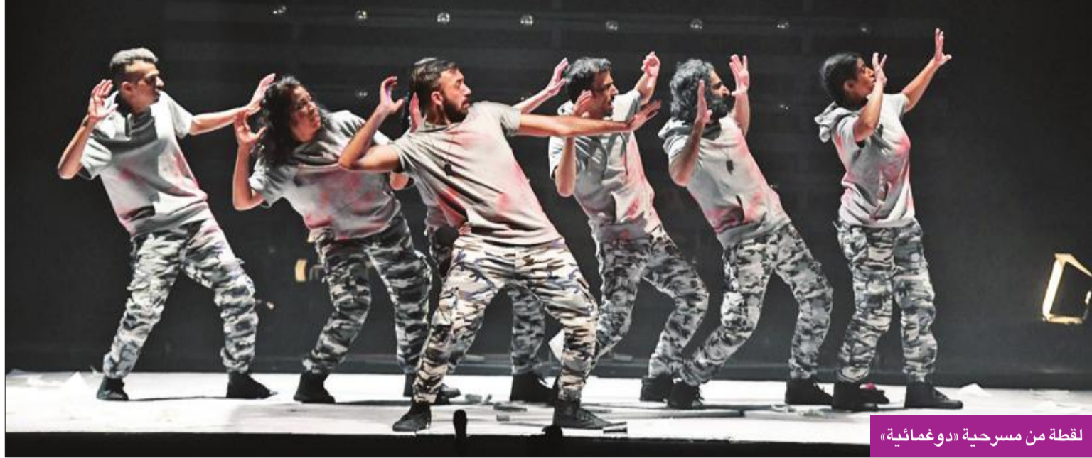
لقطة من مسرحية «دوغمانية»