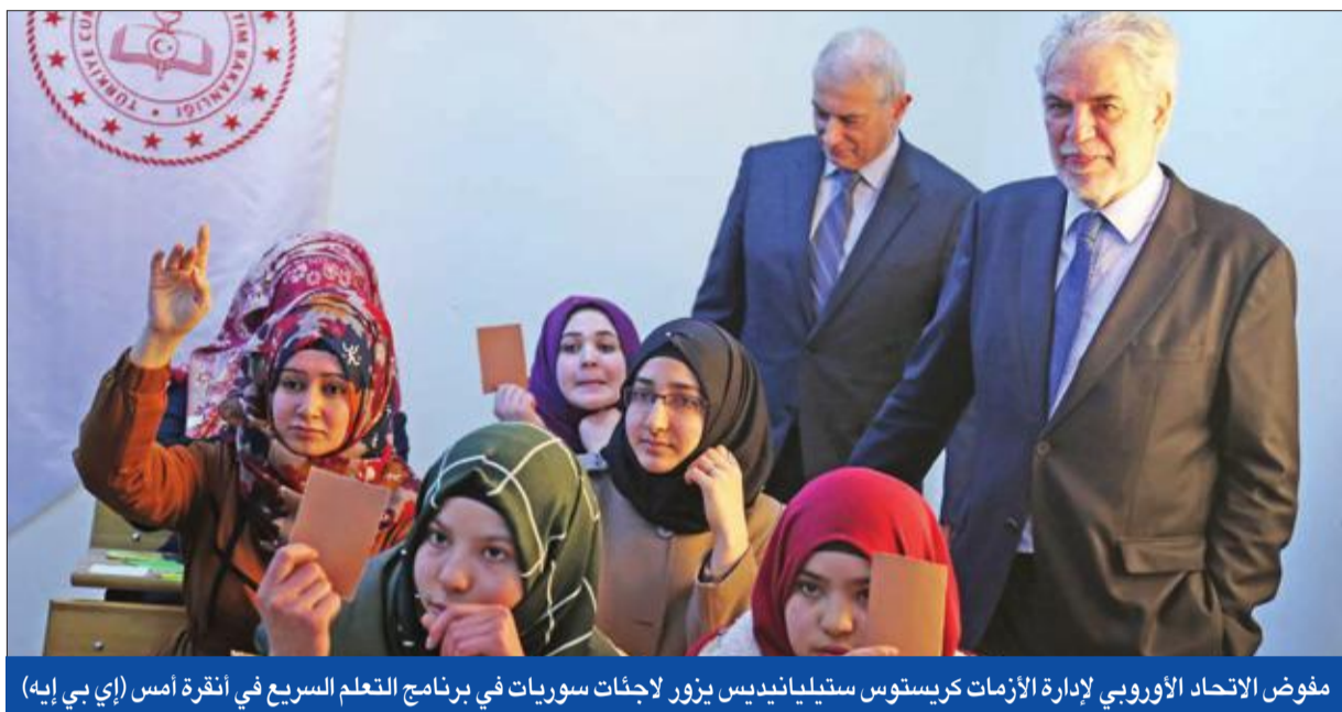
مفوض الاتحاد الأوروبي لإدارة الأزمات كريستوس ستيليانديس يزور لإجبات سوريات في برنامج التعلم السريع في أنقرة أمس (إي بي إي)

متهمًا النظام وإيران الداعمة له بتحريك هذه التنظيمات من أجل إفساد أي تفاهم قد يكون لمصلحة الشعب السوري. وعلى جبهة موازية، أعلنت قوات سورية الديمقراطية (قسد) المدعوم من واشنطن، أنها أوقفت خمسة اجانب من «داعش» بينهم أميركيان وإيرلندي، موضحة أنها تمكنت من إحباط هجمات في 30 ديسمبر ضد قوافل زارحين من محافظة دير الزور كانوا يسعون إلى الهروب من مناطق التنظيم.