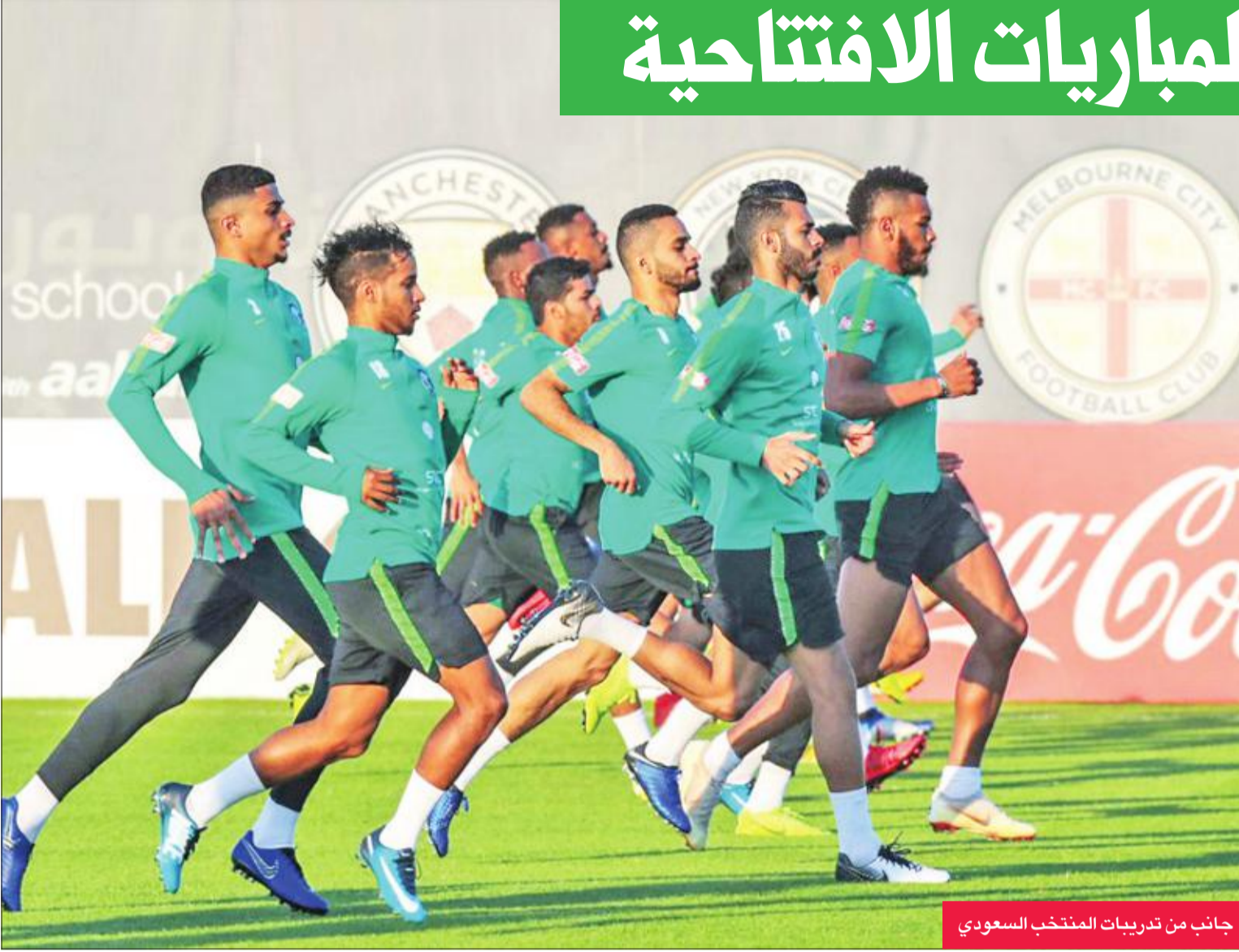
جانب من تدريبات المنتخب السعودي

ريونغ (26 عاما و 13 هدفا في 34 مباراة دولية) الذي أصبح في 2011 أول كوري شمالي يخوض مباراة في دوري أبطال أوروبا مع بازل السويسري. وتشارك كوريا الشمالية للمرة الخامسة في النهائيات، فحلت رابعة في 1980، وودعت باكرا في 1992 و 2011 و 2015. (أ ب)