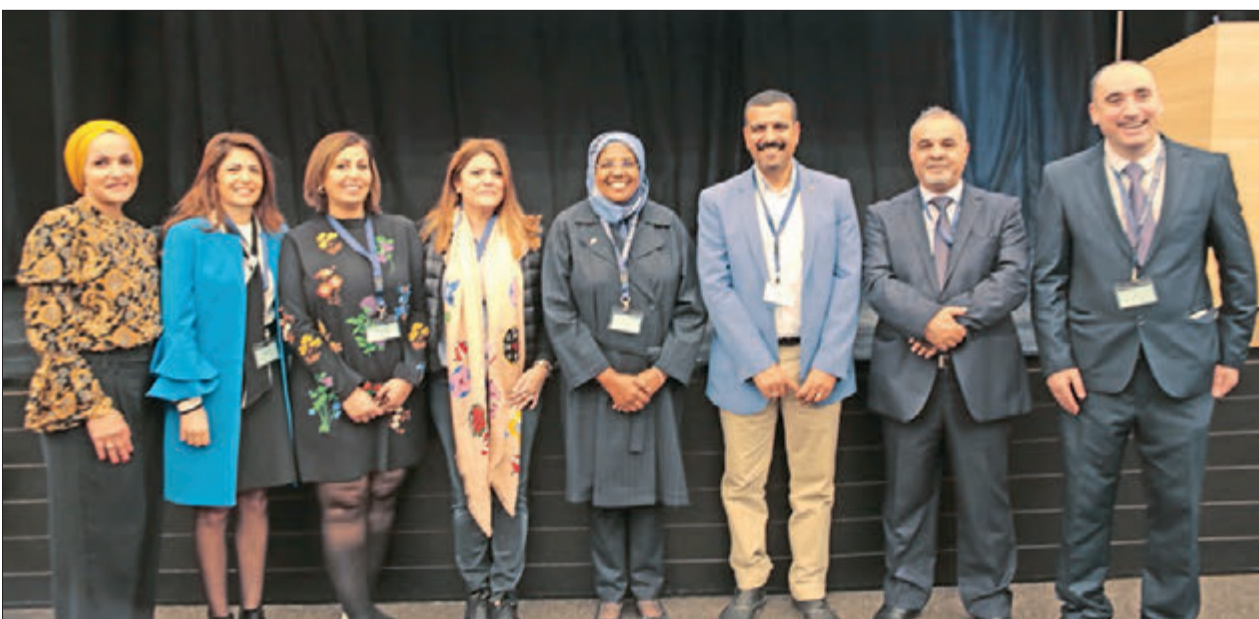
صورة جماعية للمحاضرين مع إدارة المدرسة وإدارة «المفكرون الصغار»

واستقطب المؤتمر المئات من معلمي المدارس الخاصة والحكومية، وطرح عدة مواضيع، منها: التشجيع على القراءة المبتكرة، والتغلب على صعوبات القراءة من خلال الدراما. وتهدف منصة «المفكرون الصغار»، من خلال هذا المؤتمر، إلى صقل مهارات المعلم، وتعزيز استراتيجيات التعليم لديه بالتدريبات.