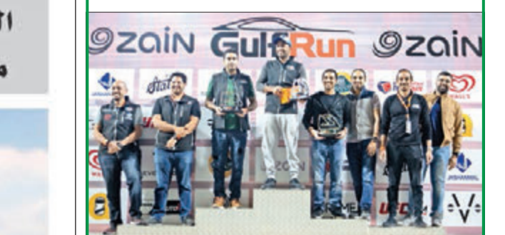
جانب من تكريم الفائزين في السباق