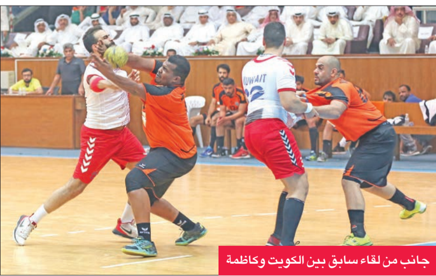
جانب من لقاء سابق بين الكويت وكاظمة

حسم فريق برقان تاهله للدوري الممتاز بعدما رفع رصيده إلى 18 نقطة في المركز الخامس إثر فوزه على التضامن الأخير بدون رصيد بنتيجة 17-38. كما فاجأ الساحل نظيره الصليبيخات وانتزع منه فوزاً ثميناً بنتيجة 26-28، وتعادل الجهراء مع خيطان بنتيجة 28-28، وبذلك رفع الجهراء رصيده إلى 11 نقطة في المركز التاسع، يليه خيطان عاشراً بـ10 نقاط، كما ارتقى الساحل إلى النقطة 4 في المركز الرابع عشر متأخراً بنقطتين عن الصليبيخات الثالث عشر.