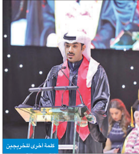
كلمة أخرى للخريجين