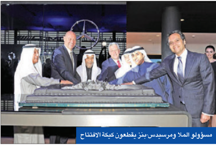
مسؤولو الملا ومرسيدس-بنز يقطعون كعكة الافتتاح