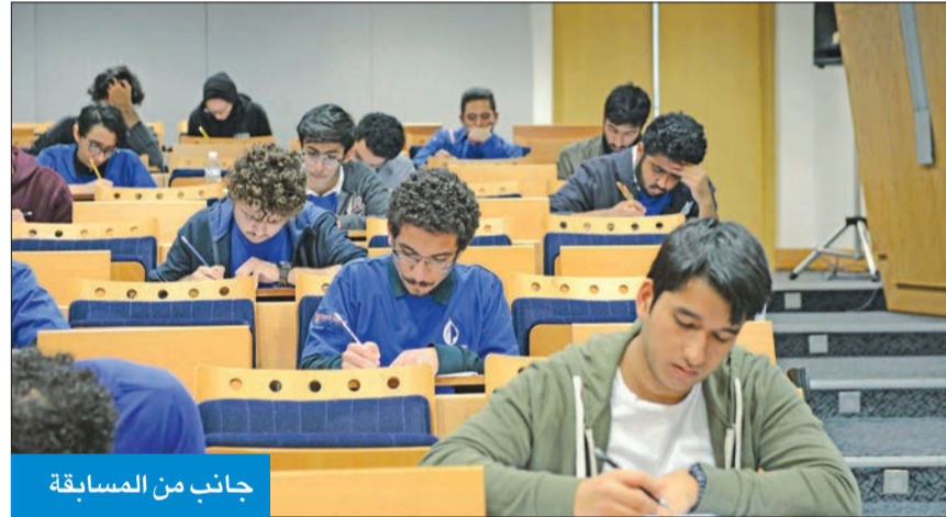
جانب من المسابقة

بنين، مدرسة أجيال ثنائية اللغة- بنات وبنين، مدرسة الأمريكية الدولية، المدرسة الكندية ثنائية اللغة، مدرسة دسمان ثنائية اللغة، المدرسة العالمية الأمريكية، ومدرسة الكويت الفرنسية الخاصة.