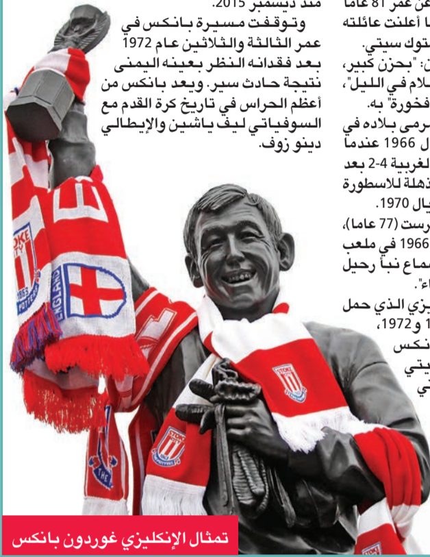
تمثال الإنكليزي غوردون بانكس

صحافية، عانى بانكس سرطانا في الكلى منذ ديسمبر 2015. وتوقفت مسيرة بانكس في عمر الثالثة والثلاثين عام 1972 بعد فقدانه النظر بعينه اليمنى نتيجة حادث سير. ويعد بانكس من أعظم الحراس في تاريخ كرة القدم مع السوفياتي ليف ياشين والإيطالي دينو زوف.