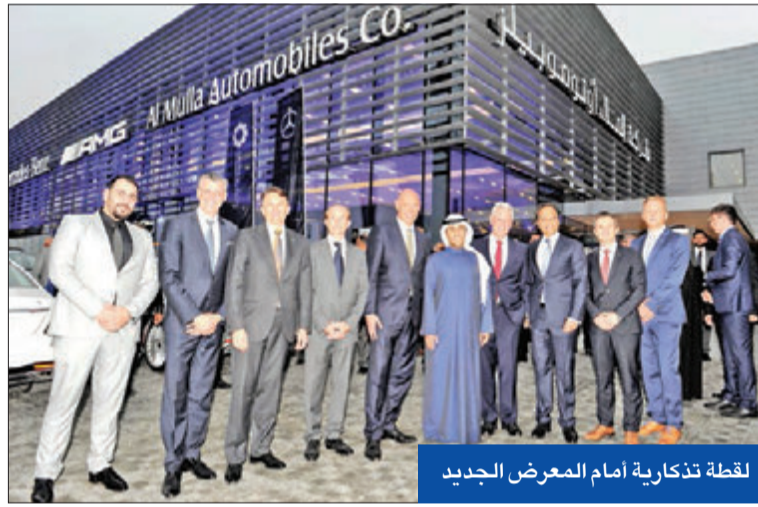
لقطة تذكارية أمام المعرض الجديد