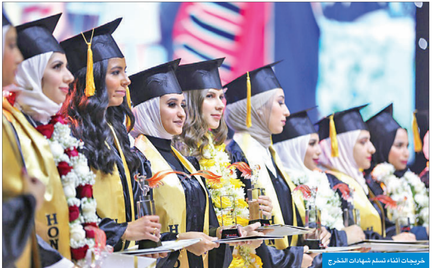
خريجات أثناء تسلم شهادات التخرج