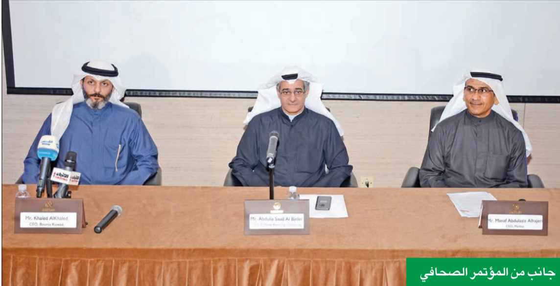
جانب من المؤتمر الصحفي

من التصنيف الائتماني للتصنيف الخاص بالشركة من (+B) إلى (-BB). كما رفعت وكالة كايبتال انتلجنس في نوفمبر 2016 التصنيف الائتماني إلى (BB)، وذلك نتيجة الاستقرار الذي مرت به الشركة خلال السنوات الخمس السابقة.