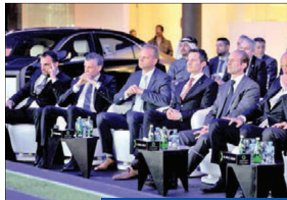
السفير الألماني و كبار ممثلي مرسيدس-بنز للسيارات في الشرق الأوسط

مرسيدس-بنز في توفير أجواء مريحة وودية، حيث تم استخدام التكنولوجيا الرقمية التفاعلية لمنح الزوار تجربة