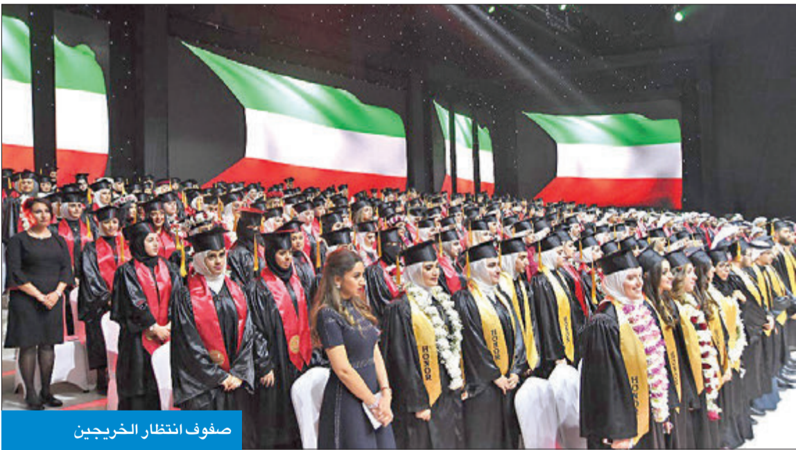
صفوف انتظار الخريجين