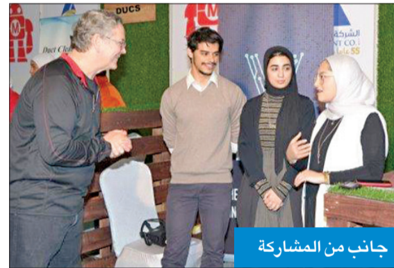
جانب من المشاركة

وبجائزة قدرها ألفا دولار. ولغنت الى ان مشروعى بينت بوت PaintBot والسيارة العاملة بالطاقة الشمسية حصلنا على جائزة 'بلو ريبون' وهي الجائزة التي تمنح للصناعات الذين يظهرون الإبداع والبراعة والابتكار.