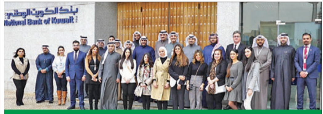
القادات التنفيذية للبنك ومسؤولو إدارة المواهب والتدريب والتطوير في استقبال المتدربين الجدد

وتم افتتاح أكاديمية الوطني عام 2008 بهدف تمهيد الطريق للخريجين الجامعيين الجدد من الشباب الكويتي للالتحاق بالعمل في قطاع الخدمات المصرفية، وتوفر الأكاديمية للخريجين أفضل البرامج التدريبية التي تم وضعها بالتعاون مع أكبر المؤسسات والجامعات حول العالم لتواكب متطلبات سوق العمل.