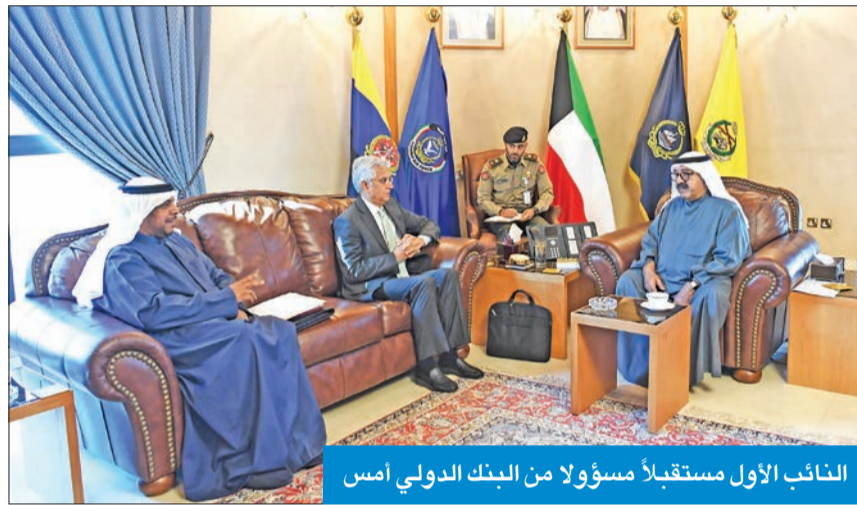
النائب الأول مستقبلاً مسؤولاً من البنك الدولي أمس

تحقيق النهضة الشاملة لكويت جديدة يكون فيها الجانب التعليمي حجر الأساس لأي انطلاقة، ولتحقيق الأهداف التي يتطلع إليها الجميع لرفعة هذا الوطن وإزدهاره وتقديمه.