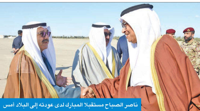
ناصر الصباح مستقبلاً المبارك لدى عودته إلى البلاد أمس