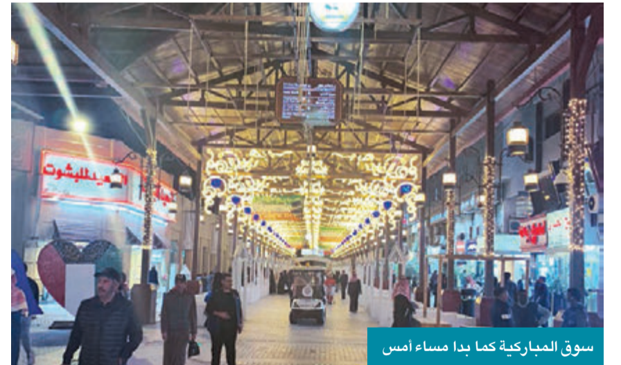
سوق المباركية كما بدأ مساء أمس

وتابع خورشيد: يفترض أن وزارة الإعلام ليست معنية بإقامة الحفلات بسوق المباركية، إنما البلدية هي التي منحت التراخيص للشركة المنظمة، وهناك التزامات مالية وأدبية للشركة باعطائها الموافقة، مجدداً تأكيداً أن الأعياد الوطنية مناسبة طيبة تحتفل بها وإذا كانت هناك ممارسات عنقوية غير مقصودة فلا يعني ذلك أن نوقف فرحة الناس.