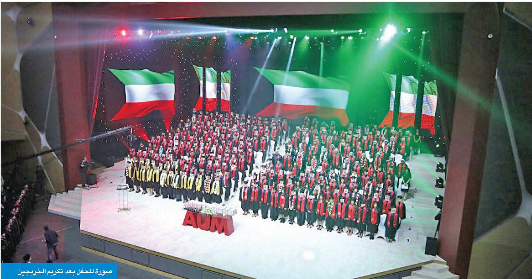
صورة للحفل بعد تكريم الخريجين