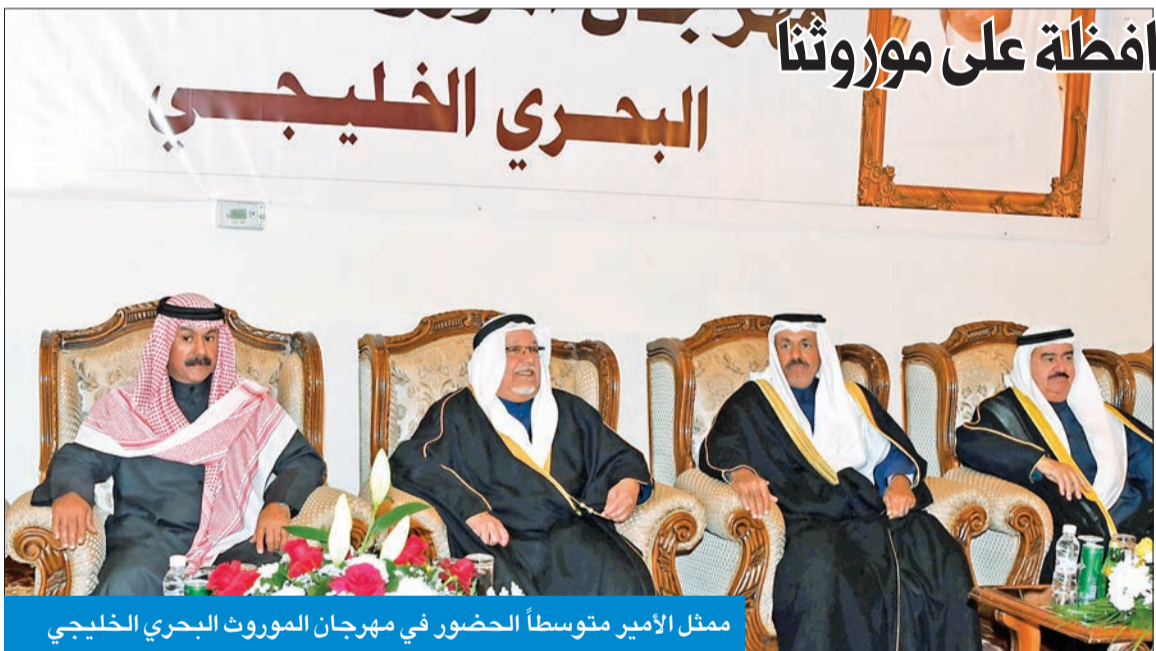
ممثل الأمير متوسطاً الحضور في مهرجان الموروث البحري الخليجي