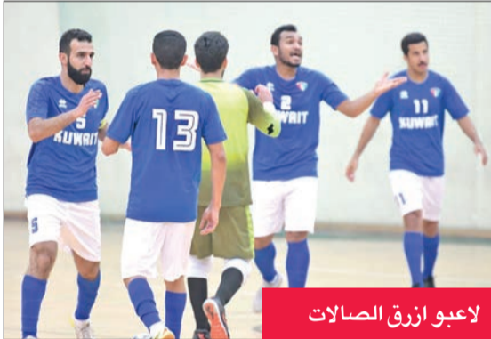
لاعبو أزرق الصالات

يدشن منتخبنا الوطني الأول لكرة الصالات المغلفة تدريباته اليوم في العاصمة التايلاندية بانكوك، وذلك استعداداً لمواجهة المنتخب التايلاندي المقرر لهما يوم 15 و17 من الشهر الجاري. وتأتي المباراتان ضمن الاستعدادات لخوض منافسات التصفيات التي ستجرى خلال أكتوبر المقبل، المؤهلة لنهائيات كأس آسيا.