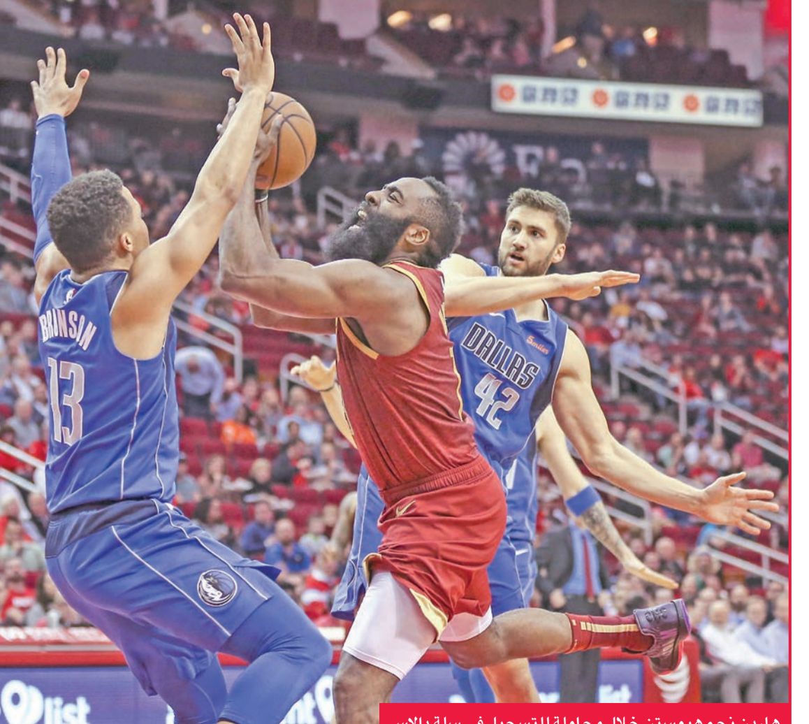
هاردن نجم هيوستن خلال محاولة للتسجيل في سلة دالاس

وكادت سلسلة هاردن تتوقف أمام مافريكس بعدما عانى المراقبة الصعبة، في محاولة من الفريق الضيف لحد من خطورته، وبدا كأنه نجح في مهمته، إذ لم يتمكن نجم روكتس من تسجيل سوى 20 نقطة قبل ثلاث دقائق من صافرة النهاية. ولكن ما لبث هاردن أن انتفض على ملعبه وأمام جماهيره بعدما نجح في تسجيل رميتين ثلاثيتين على التوالي رفع بهما رصيده إلى 26 نقطة قبل 1.57 دقيقة من النهاية، ليعود ويسجل رميتين حرتين قرابة الدقيقة من النهاية ليصبح رصيده 28 نقطة. وفي ظل الحماس الشديد الذي تلقاه من جماهير ملعب "تويوتا سنتر" التي هتفت اسمه، نجح هاردن في تحطيم حاجز