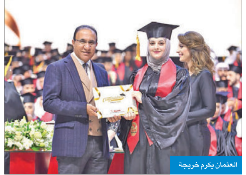
العثمان يكرم خريجة