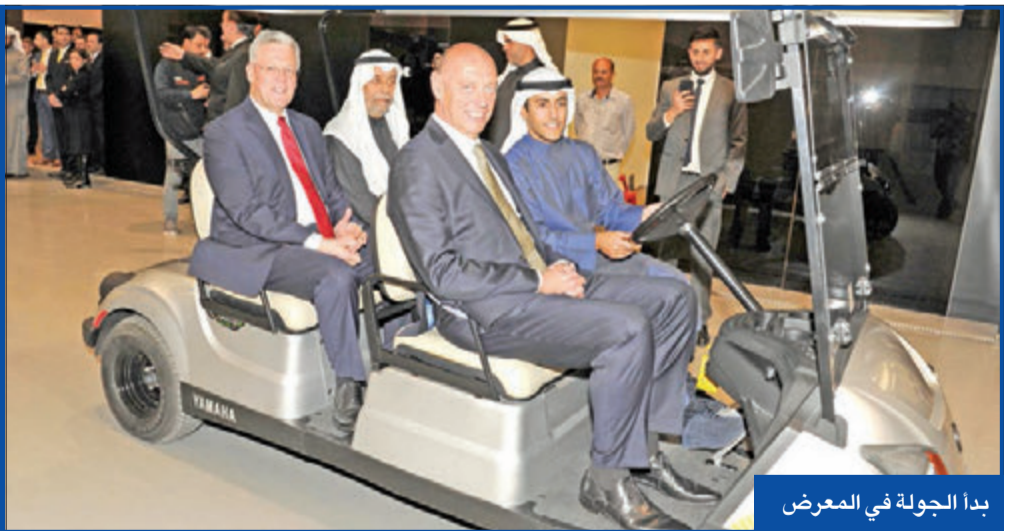
بدا الجولة في المعرض

بعد حفل الافتتاح، رافق الملا مسؤولي مرسيدس-بنز بجولة في مختلف أركان صالة العرض ومركز الخدمة ومناطق توصيل السيارات، كما شملت الجولة زيارة لمراكز خدمة وتوزيع قطع الغيار بالشويخ، وقدم لهم شرحاً عن مميزات هذه المرافق وقدراتها التشغيلية ودورها المهم في ضمان حصول عملاء الشركة على أفضل الخدمات.