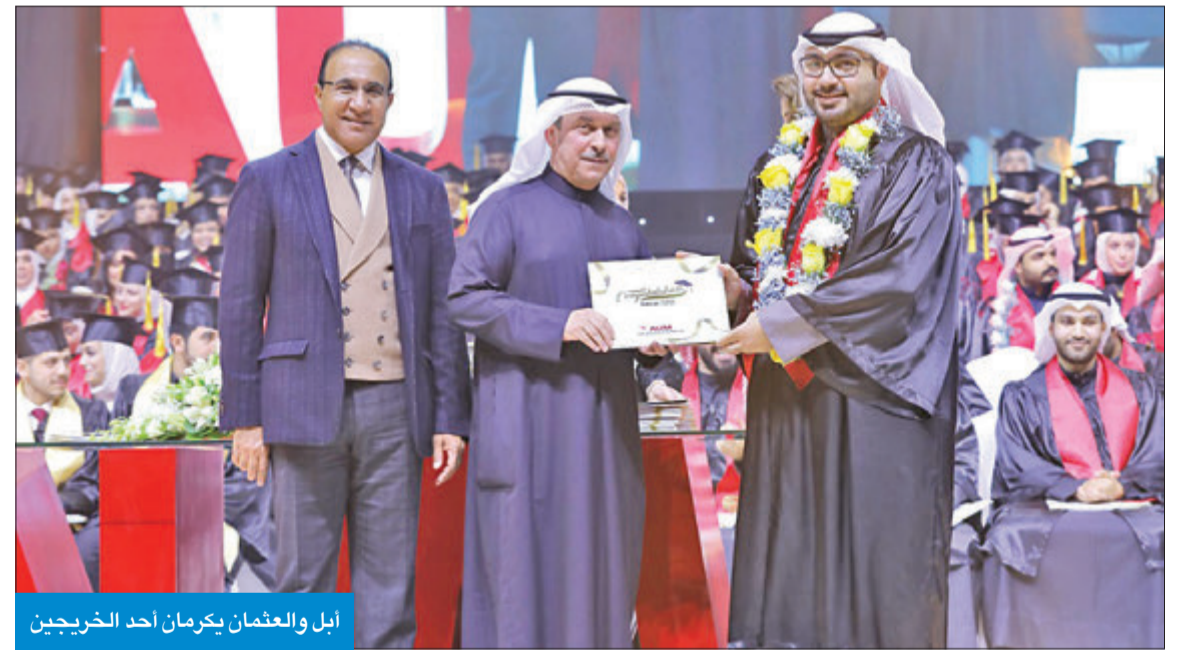
أبل والعثمان يكرمان أحد الخريجين