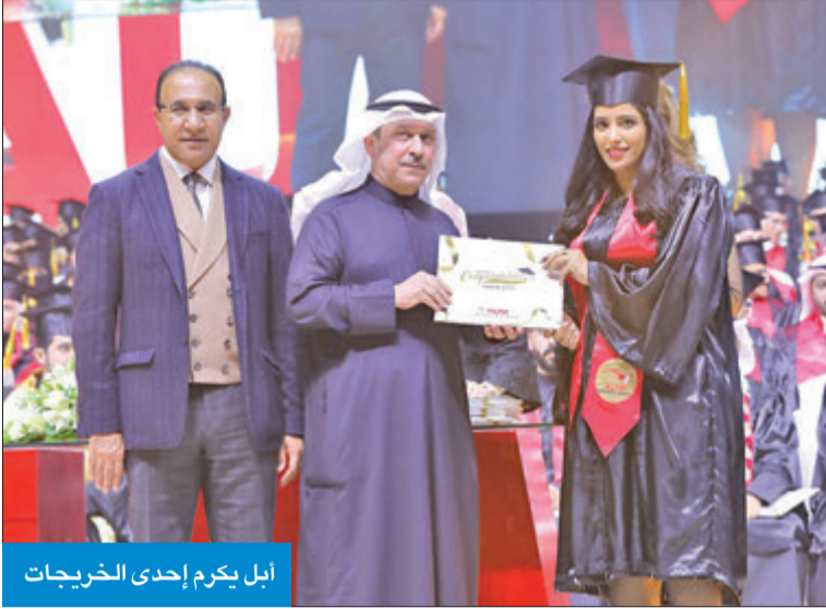
أبل يكرم إحدى الخريجات