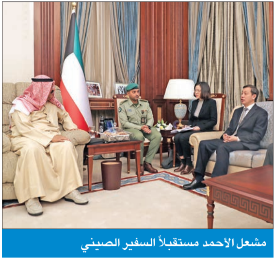
مشعل الأحمد مستقبلاً السفير الصيني

استقبل نائب رئيس الحرس الوطني الشيخ مشعل الأحمد، السفير الصيني لدى البلاد لي مينغ قانغ، ورحب الشيخ مشعل بالسفير الصيني، مثنياً جهود سفارة الصين لدى الكويت في تعزيز التعاون المشترك بين البلدين الصديقين، وخاصة في المجالين العسكري والأمني. وبحث اللقاء سبل تطوير أطر التعاون المشترك بين الحرس الوطني والجهات ذات الصلة في الصين. حضر اللقاء مدير ديوان نائب رئيس الحرس الوطني اللواء جمال ذياب.