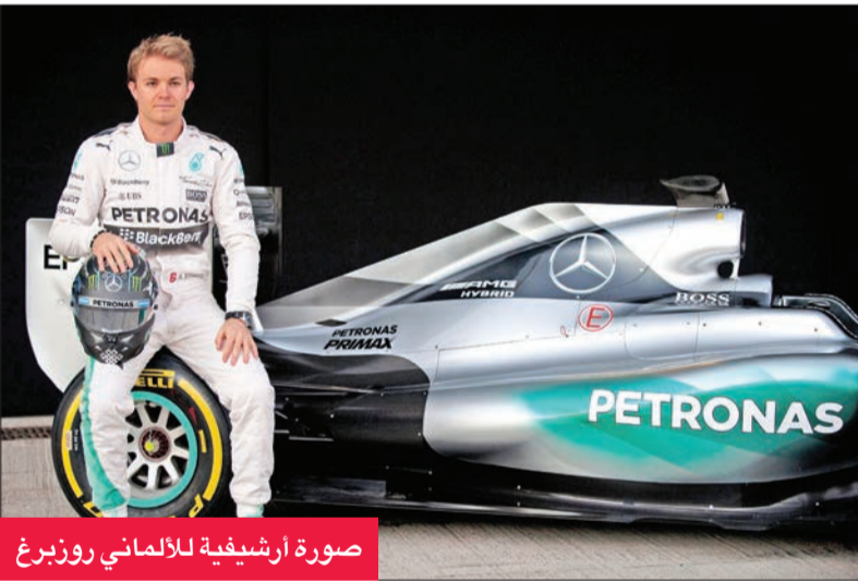
صورة أرسيفية للألماني روزبرغ

يرى الألماني نيكو روزبرغ، البطل السابق لبطولة العالم لسباقات سيارات فورمولا 1، أن فريقه السابق مرسيدس قد يفقد أفضليته التنافسية بسبب اللوائح الجديدة في الموسم المقبل. وفاز روزبرغ بلقب بطولة العالم مع "مرسيدس" في 2016، في الوقت الذي فرض "مرسيدس" هيمنته على المنافسات في مواسم 2014 و2015 و2017 و2018، حيث فاز البريطاني لويس هاميلتون بلقب فئة السائقين في تلك المواسم. ويقول روزبرغ إن "السيارات ستكون مختلفة تماما، وقد يكون هناك فوارق كبيرة في الأداء مجددا"، مضيفا: "ربما لن يكون فريق مرسيدس قوة مهيمنة مجددا". ويتوقع روزبرغ، الذي اعتزل بطولة العالم لسباقات سيارات فورمولا 1، بعد الفوز باللقب، أن يعود ريد بول لكونه المعهودة، وأن يكون منافسا قويا لمرسيدس عندما ينطلق الموسم الجديد في 17 مارس المقبل في مليون عبر سباق جائزة أستراليا الكبرى. ويشير السائق الألماني إلى أن "هذا سيكون رائعا، لأنه في الموسم الماضي أكثر السباقات حماسا جاءت عندما كان ريد بول في المقدمة". ويتابع: "بالتأكيد مرسيدس هو المرشح الأبرز للقب حاليا، لكن قد تتباين النتائج بشكل ملحوظ".