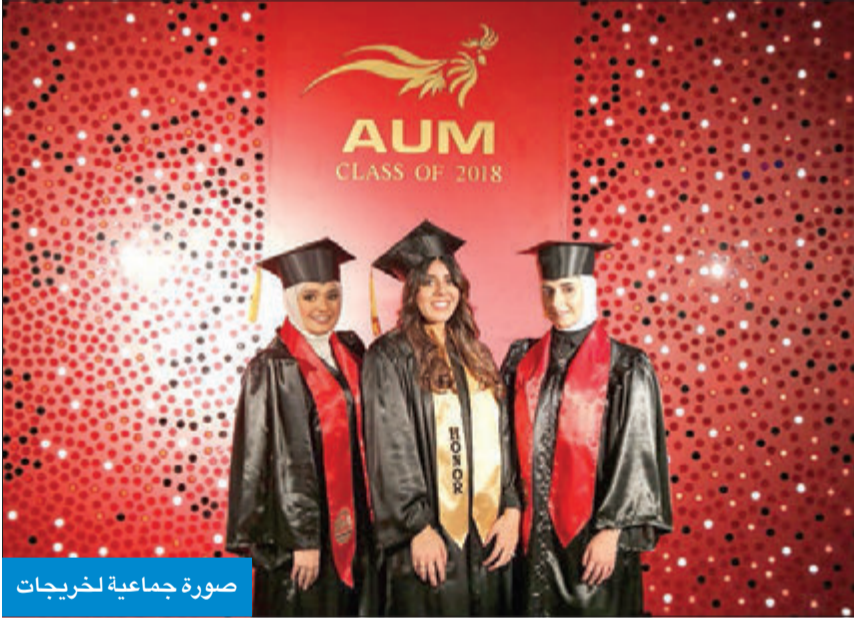
صورة جماعية لخريجات