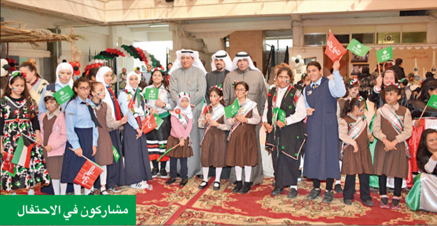
مشاركون في الاحتفال

والسرور على قلوب الصغار والكبار، إضافة إلى المسابقات والفقرات الترفيهية.