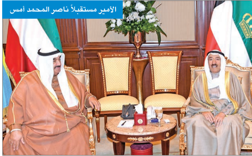
الأمير مستقبلاً ناصر المحمد أمس

استقبل صاحب السمو أمير البلاد الشيخ صباح الأحمد، بقصر بيان، صباح أمس، سمو الشيخ ناصر المحمد. من جهة أخرى، يتفضل سمو أمير البلاد القائد الأعلى للقوات المسلحة فيمشل برعايته وحضوره حفل تخريج الطلبة الضباط الجامعيين من دفعة (22) بكلية علي الصباح العسكرية في العاشرة من صباح اليوم. من جانب آخر استقبل سمو ولي العهد الشيخ نواف الأحمد، بقصر بيان، صباح أمس، سمو الشيخ ناصر المحمد.