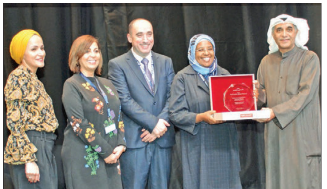
شركة «المفكرون الصغار» تكرم إدارة «دسمان ثنائية اللغة»