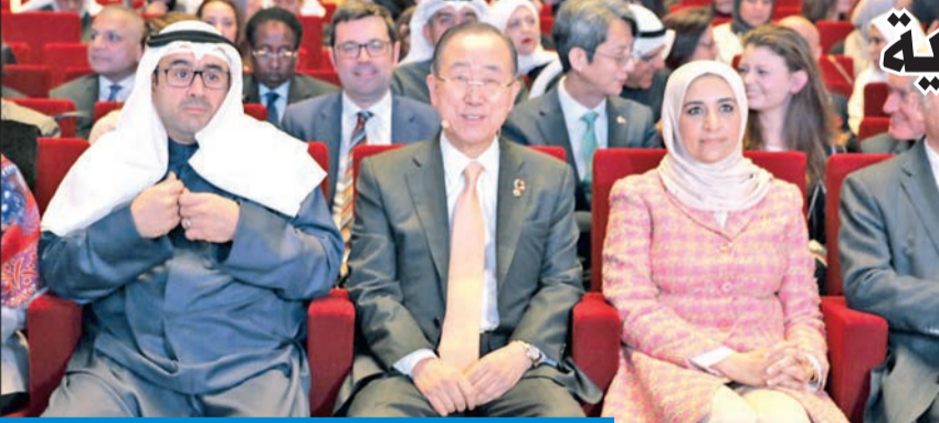
العقيل وبن كي مون خلال افتتاح منتدى تمكين المرأة

ولفت إلى أن هذه التحديات التي تواجه الأمة العربية تستدعي أن تكون هناك لقاءات تشاركية مع الأشقاء في الأردن على مستوى القيادة السياسية العليا.