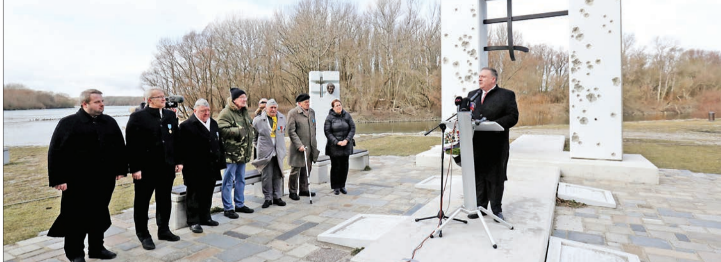
بومبيو يلقي كلمة عند «بوابة الحرية» في براتسلافا في سلوفاكيا أمس. وأقيم هذا النصب التذكاري للاحتفاء بـ 400 مواطن سلوفاكي قتلوا في 1989 خلال هروبهم باتجاه النمسا من النظام الشيوعي

• نتياهو لإيران: إذا أخطأتم فستكون الذكرى الـ 40 للثورة هي الأخيرة • كوشنير لن يعرض «صفقة القرن»