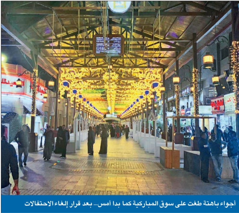
أجواء باهتة طغت على سوق المباركية كما بدا أمس... بعد قرار إلغاء الاحتفالات

الشبهة مو على الوزير... الشبهة على حكومة التنمية ونواب الحريات اللي ما يستجوبونه!