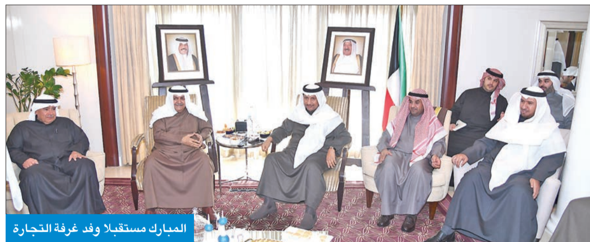
المبارك مستقبلاً وفد غرفة التجارة