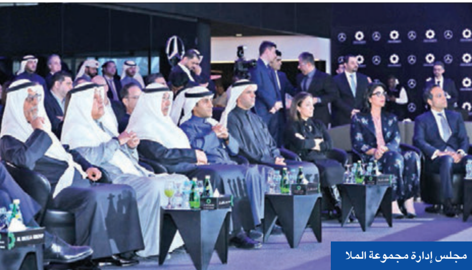
مجلس إدارة مجموعة الملا

افتتحت شركة الملا وأتوموبيلز، الموزع المعتمد لشركة مرسيدس-بنز في الكويت، صالة عرضها الجديدة ذات الطابع الرقمي، في حفل لافت وغير مسبوق في البلاد، لتلبي احتياجات العملاء على أفضل مستويات من الخدمة من خلال تجربة تفاعلية للتعرف على العلامة التجارية وخدماتها عبر العروض الرقمية، مع تخصيص ركن خاص بعرض سيارات AMG ذات الأداء العالي، إضافة إلى مركز متطور للخدمة.