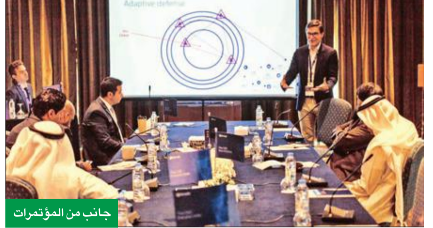
جانب من المؤتمرات

منهج مايكروسوفت فيما يتعلق بمواضيع الأمان والخصوصية والأمن الإلكتروني، والتي تقام سنوياً في الدولة، حيث ضمت الفعالية نخبة من كبار موظفي أمن المعلومات المتخصصين في القطاع المالي داخل الكويت. وتم توجيه هذا الحدث، الذي أقيم في فندق جي دبليو ماريوت، خصيصاً للقطاع المصرفي، على ضوء ما تشهده الدولة من تصاعد مستمر للهجمات الإلكترونية التي تستهدف مؤسسات القطاع العام والخاص، ومن هذا المنطلق تهدف الفعالية إلى تمكين مديري أمن المعلومات من التغلب على التحديات المتزايدة في مجال الأمن الإلكتروني. وقدم خلال الحدث خبراء مايكروسوفت، وهم رامون بوش مدير شعبة المخاطر والأمن لدى مايكروسوفت أوروبا والشرق الأوسط وإفريقيا، وفولكان فريم خير تقنية المبيعات الأمنية من مايكروسوفت الخليج، ومحمد زايد مدير حزمة مايكروسوفت 365 وحلول الأمن السيبراني في مايكروسوفت الكويت، عروضاً تقديمية حول الأمن الإلكتروني، إضافة إلى جلسات شاملة غطت