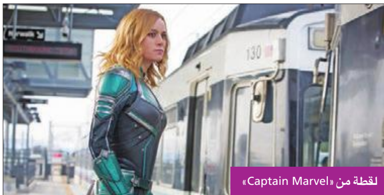
لقطة من «Captain Marvel»