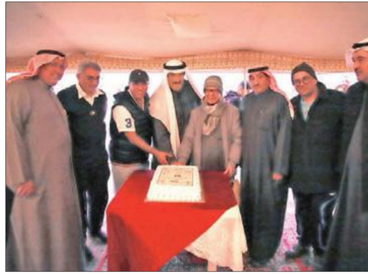
قطع كعكة الاحتفال