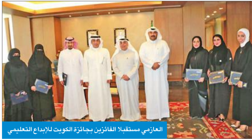
العازمي مستقبلاً الفائزين بجائزة الكويت للإبداع التعليمي

عقد وزير التربية وزير التعليم العالي د. حامد العازمي، أمس، اجتماعاً مع مساعده وزير الخارجية الأميركية للشؤون التعليمية والثقافية ماري رويس، برفقتها السفير الأميركي في البلاد