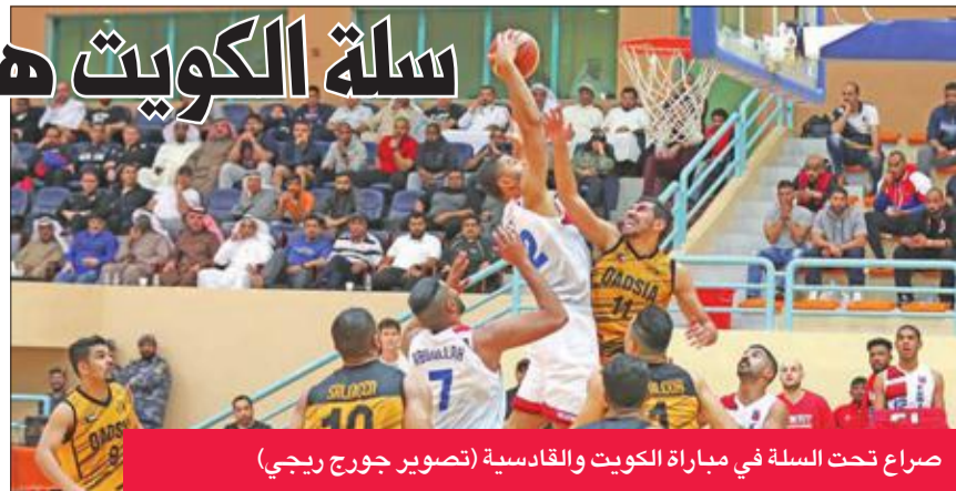
صراع تحت السلة في مباراة الكويت والقادسية

للبطولة برصيد 16 نقطة، يليه القادسية 14 نقطة، ثم كاظمة 13، والجهراء 12، يليه القرنين 9، وأخيراً الشباب 8 نقاط. ويقام الدوري الممتاز من قسمين على 10 مراحل، على أن يتوج الفريق الأكثر نجاحاً للنقاط بلقب البطولة.