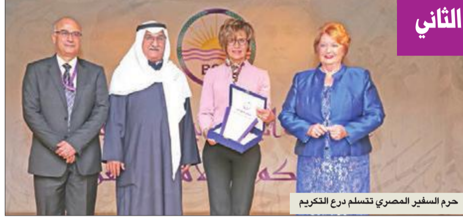
حرم السفير المصري تتسلم درع التكريم