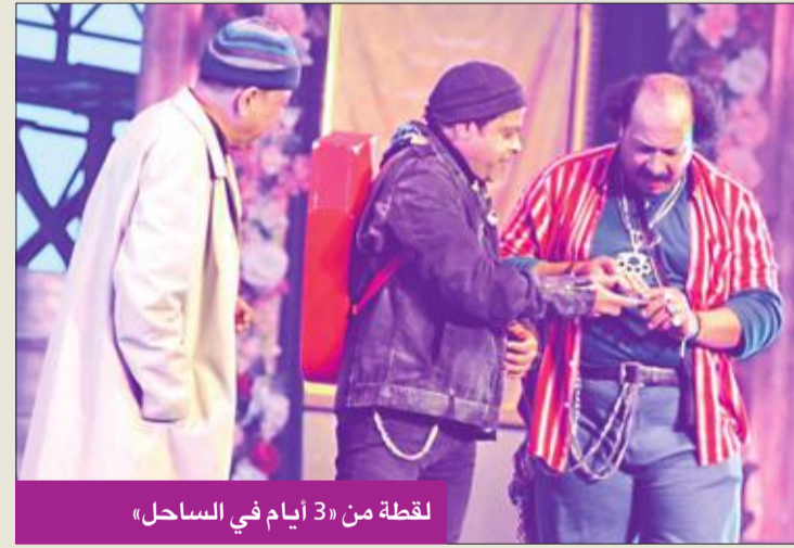
لقطة من «3 أيام في الساحل»

وتأخر عرض «الملك لير» بسبب الاعتذار الكثرية التي شهدتها العرض خلال الفترة الأخيرة، وهو ما أرجا خروجه للنور، علماً بان الحملة الدعائية للعرض انطلقت بالفعل خلال الأيام الماضية، دون تحديد موعد نهائي لأولى الحفلات، فيما لم يستقر