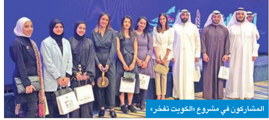
المشاركون في مشروع «الكويت تفخر»

سماهمتهم الإيجابية تشير إلى خطوة في مسيرة التنمية لتحقيق رؤية سمو الأمير بضرورة الاهتمام بالشباب، وفي إطار الخطة الموضوعية لتحقيق رؤية الكويت - 2035.