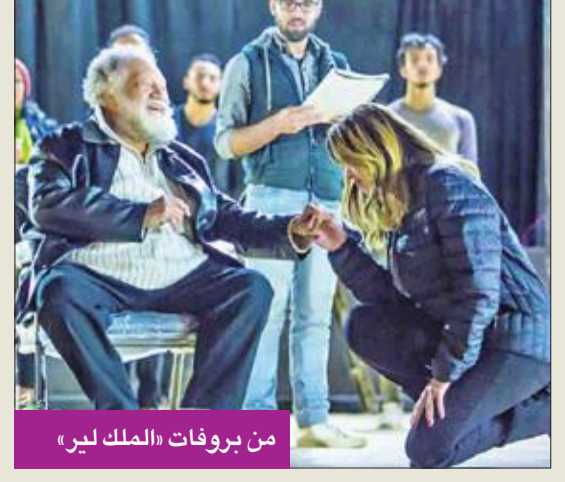
من بروفات «الملك لير»

وقررت الفرقة الاستعانة بالنصوص المسرحية التي ستفوز بالجائزة التي أعلن عنها من أجل تنفيذها، وخاصة مع وجود اتفاقات مبدئية لعدد كبير من