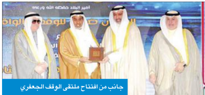
جانب من افتتاح ملتقى الوقف الجعفري

حقوق المستحقين للوقف، ومنع التجاوز على شروط الواقفين وإرادتهم في الصرف على المستحقين.