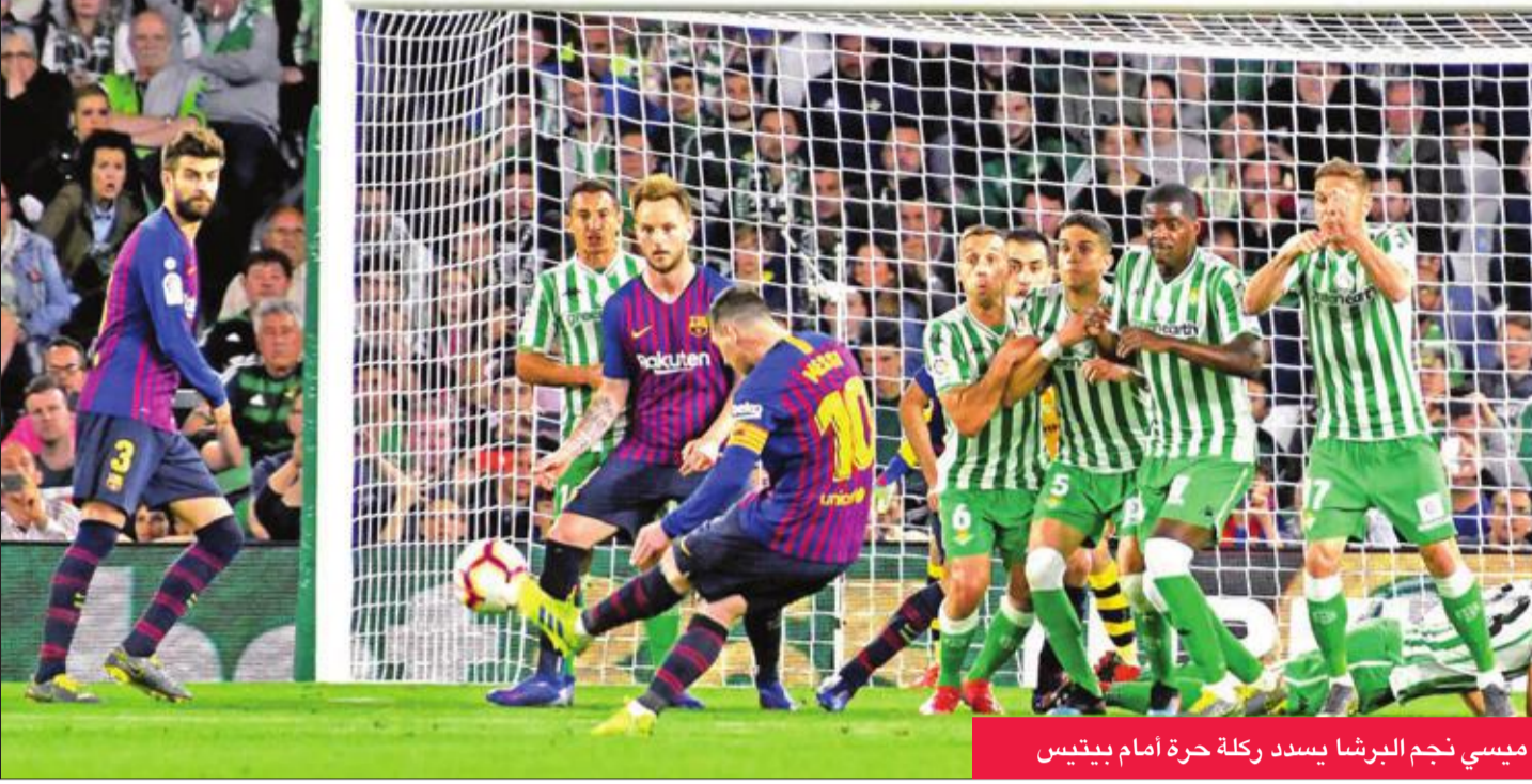
ميسي نجم البرشا يسدد ركلة حرة أمام بييتيس

بفضل ثلاثية رائعة لنجمه الأرجنتيني ليونيل ميسي، في المرحلة الـ28 من الدوري الإسباني لكرة القدم، مضى برشلونة بثبات نحو اللقب للدوري الإسباني لكرة القدم.