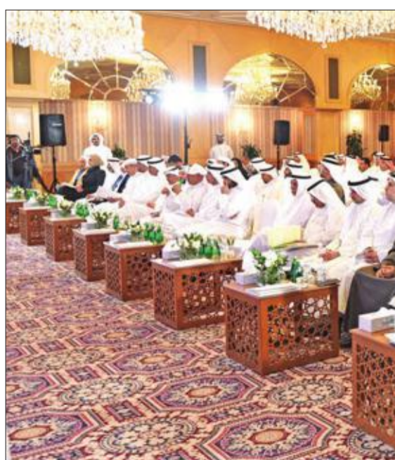
مساهمون يتابعون العمومية

شركة مينا هومز. وستمر مجموعة بيت التمويل الكويتي في الحفاظ على مكانتها الرائدة كمكثف موقوف للصكوك السيادية والخاصة على مستوى العالم، وقامت الشركة التابعة "بيتك كابيتال" بالتعاون مع مجموعة الخزفانة خلال عام 2018 بالعمل كمدير رئيسي مشترك للاكتتاب في بعض الإصدارات الرئيسية للصكوك بالمنطقة، ومن أبرزها إصدار صكوك لسلطنة عمان بقيمة 1.5 مليار دولار، وبنك دبي الإسلامي بقيمة مليار دولار، وأول إصدار لبنك أبوظبي الأول بقيمة تصل إلى 650 مليون دولار. وبالإضافة إلى إعلان مؤسسة إدارة السهولة الإسلامية الدولية تصنيف بيت التمويل الكويتي في المركز الأول على قائمة المتداولين الرئيسيين التي تشمل الكثير من البنوك الدولية والإقليمية مما يثبت "بيتك" كلاعب رئيسي في سوق الصكوك قصيرة الأجل.