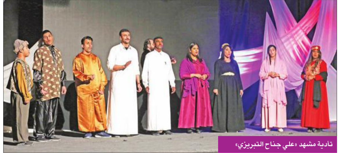
تادية مشهد «علي جناح التبريزي»