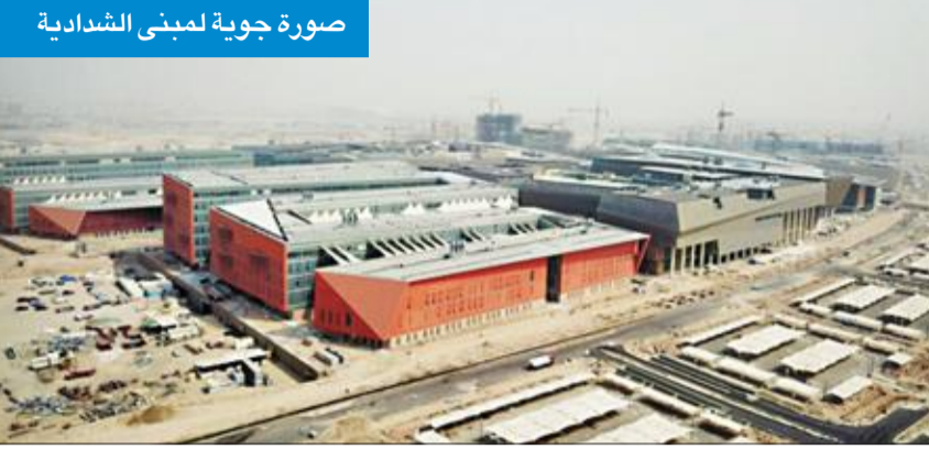
صورة جوية لمبنى الشدادية

كشفت البرنامج الإنشائي في جامعة الكويت عن تدريب 287 متدرباً في تخصصات مختلفة خلال عامي 2017 و2018 في البرنامج الإنشائي بمدينة صباح السالم الجامعية (الشدادية) خلال 14 فترة تدريب.