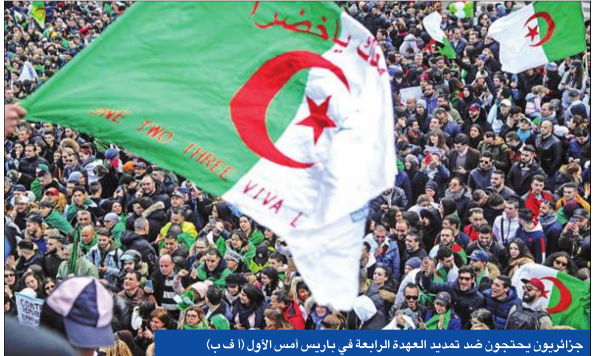
جزائريون يحتجون ضد تمديد العهدة الرابعة في باريس أمس الأول

أمس، رسالة إلى المتظاهرين ضد بوتفليقة، واعتبر أن مطلب «ارحلوا جميعا وفورا»، هو ما تسبب في تدمير بلد كبير مثل العراق. وقال المفوض الأممي السابق إن «المطالبة برحيل الجميع سهلة، لكن تطبيقها صعب، لأن الجزائر بحاجة إلى رجال يقفون على الاستقرار والأمن».