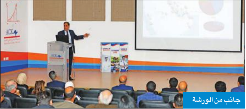
جانب من الورشة

نظمت الكلية الأسترالية في الكويت ورشة عمل حول «استخدام تكنولوجيا الأغشية المستخدمة اقتصادياً لتحلية المياه» بحضور نخبة من الضيوف من جميع أنحاء العالم.