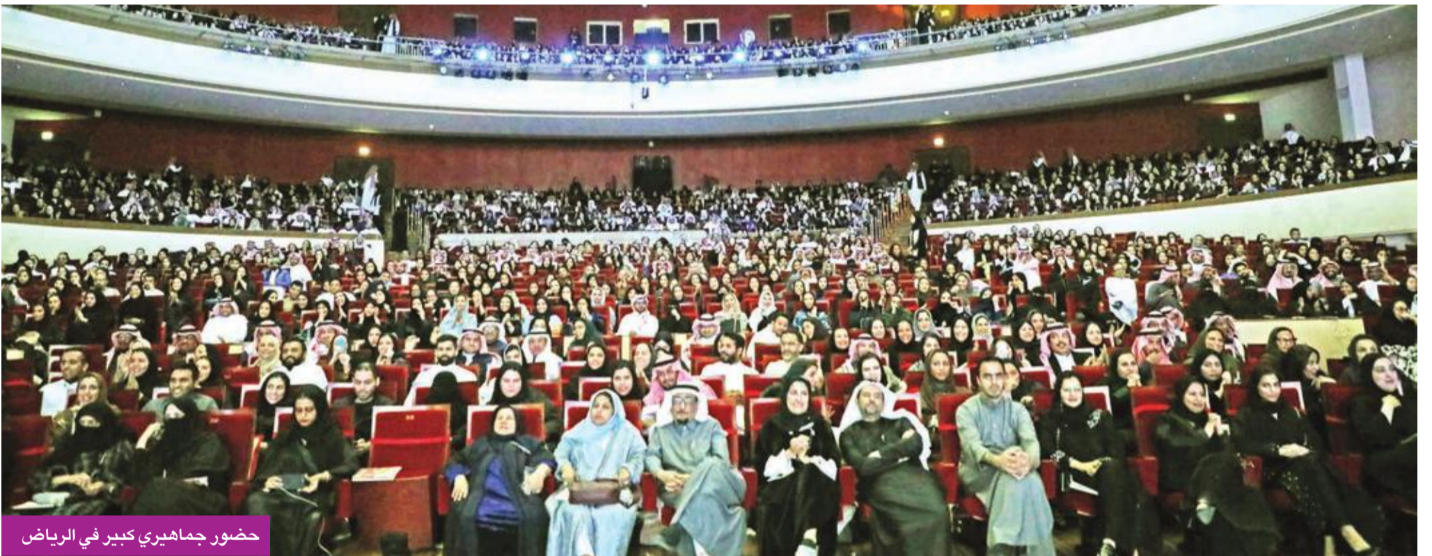
حضور جماهيري كبير في الرياض

في زمن التغريد والمغريد أصبحت ردود أفعال الجمهور واضحة وصريحة، وفي قطر، كان عرض «الثمانينات» الموضوع الأكثر تداولاً على «تويتز» في 22 فبراير الماضي.