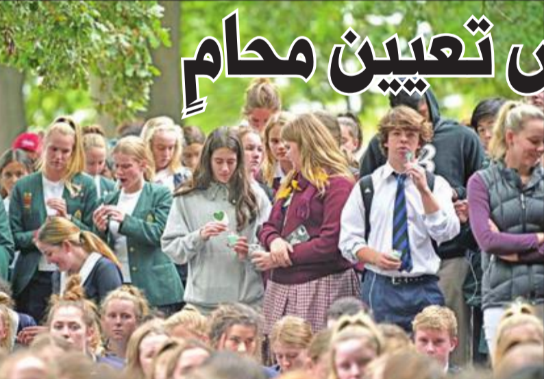
طلاب يقفون حداداً على أرواح ضحايا المسجدين في مدينة كرايستشيرش أمس

ونظراً لرفع مستوى التحذير الأمني إلى الدرجة القصوى في المنطقة، تم تعزيز التواجد العسكري في مركز الحكومة الهولندية ومجمع المباني بيننهورف وسط لاهاي وأمام