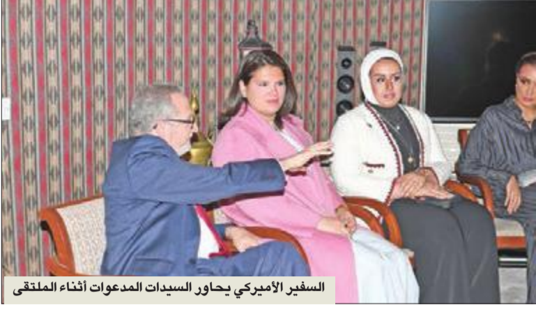
السفير الأميركي يحاور السيدات المدعوات أثناء الملتقى