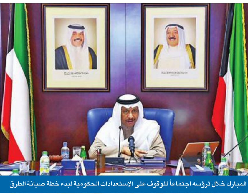
المبارك خلال ترؤسه اجتماعاً للوقوف على الاستعدادات الحكومية لبدء خطة صيانة الطرق

أما وزيرة الأشغال العامة وزيرة الدولة لشؤون الإسكان د. جنان بوشهري فكتفت أن البدء بتنفيذ إصلاحات الطرق سيكون في الأسبوع الأول من إبريل المقبل، مستعرضة الإجراءات التي اتخذتها الأشغال والهيئة العامة للطرق والنقل العام خلال الفترة الماضية، تمهيداً لبدء العمليات.