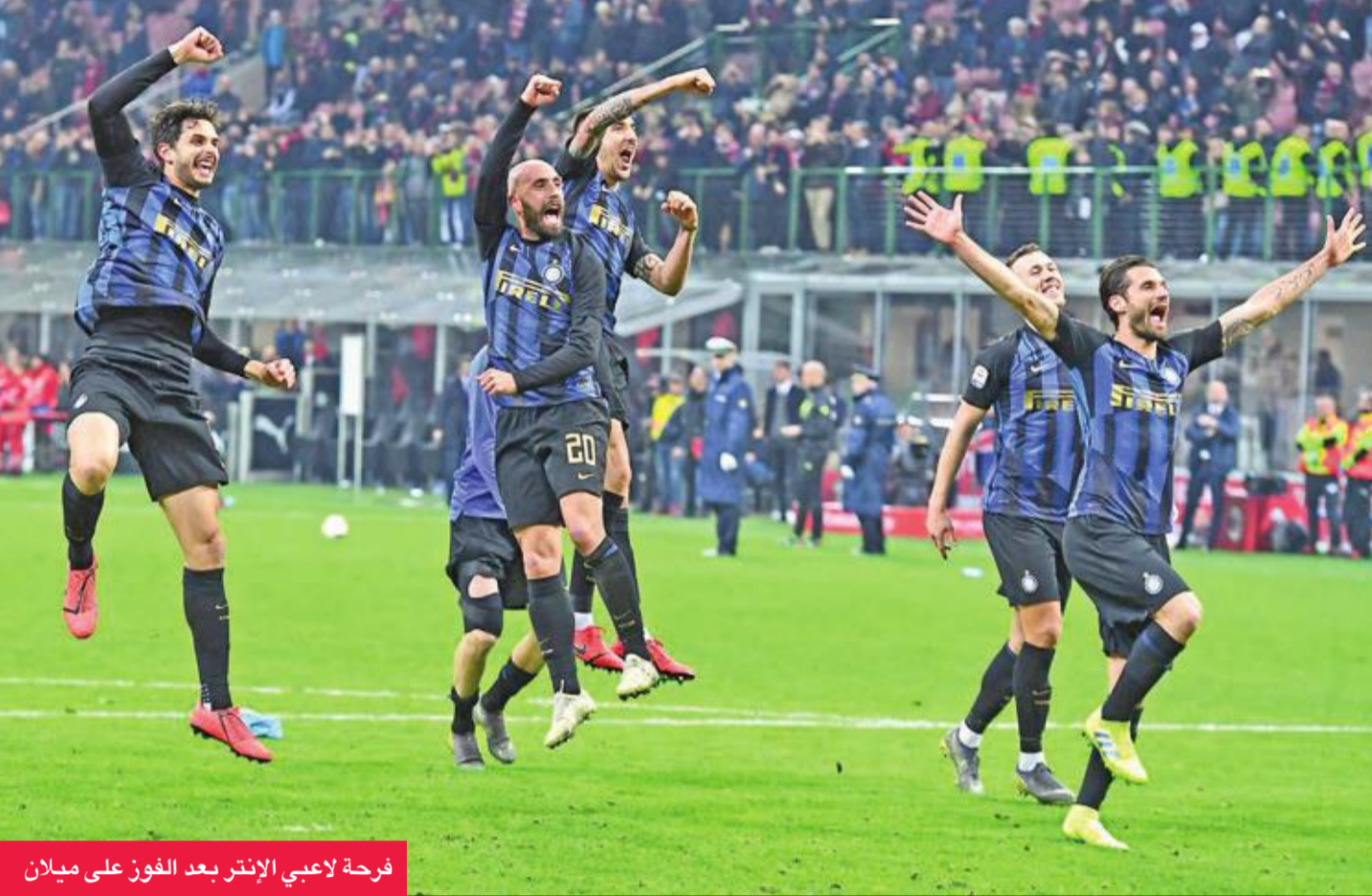
فرحة لاعبي الإنتر بعد الفوز على ميلان

الوقت بدل الضائع عندما لعبت كرة عرضية وصلت إلى باتريك كوتروني داخل منطقة الجزاء، ليسدد كرة قوية تصدى لها دانييلو دي امبروزيو بجسده، قبل أن تعبر خط المرمى لتخرج إلى ركلة ركنية، لكنها لم تستغل ليطلق بعدها إنتر صافرة نهاية المباراة بفوز إنتر على ميلان 2-3.