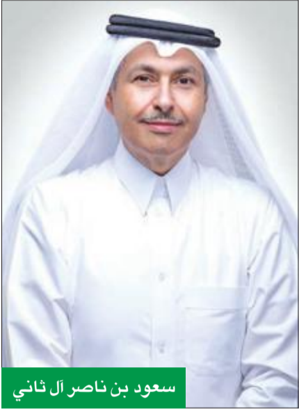
سعود بن ناصر آل ثاني

للاستفادة من خبرتها وحلولها الرقمية الرائدة، لتوفير خدمات وحلول المبادرة، لتضاف بذلك إلى قائمة الخدمات والحلول التي توفرها الشركة في مجالات شبكة الجيل الخامس 5G وإنترنت الأشياء؛ لتحقيق أكبر نفع ممكن للمؤسسات والأفراد. كما تجمع المبادرة خبراء من جميع شركات المجموعة ومن مختلف وحدات الأعمال، بما في ذلك إدارات خدمات الشركات الصغيرة والمتوسطة، ووحدات الأعمال التجارية والرقمية والقانونية. وتعليقاً على المبادرة، أضاف الشيخ سعود: «نهدف بلوك تشين إلى فتح باب استخدام هذه التقنية على مصراعيه، والاستفادة من أفضل الممارسات العالمية لتقديم ابتكارات محلية عبر العديد من الأسواق الأسرع نمواً في العالم. كما إن دعوتنا المفتوحة للمبتكرين في مجال تقنية بلوك تشين ستكشف لنا عن طرق جديدة يمكن من خلال دمج التقنية مع تقنيات الذكاء الاصطناعي والتعلم الآلي، والحوسبة السحابية، وإنترنت الأشياء».