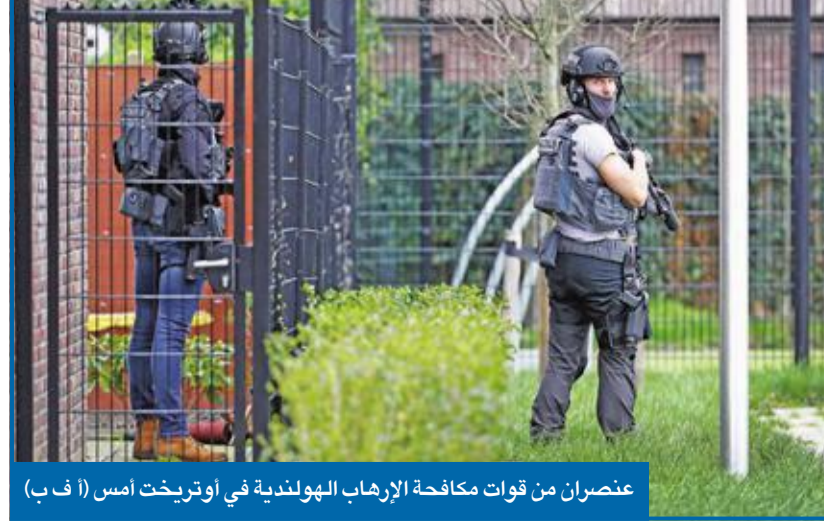
عنصران من قوات مكافحة الإرهاب الهولندية في أوترخت أمس