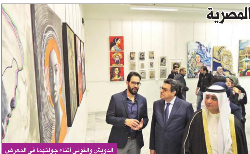
الدويش والقوني أثناء جولتهما في المعرض