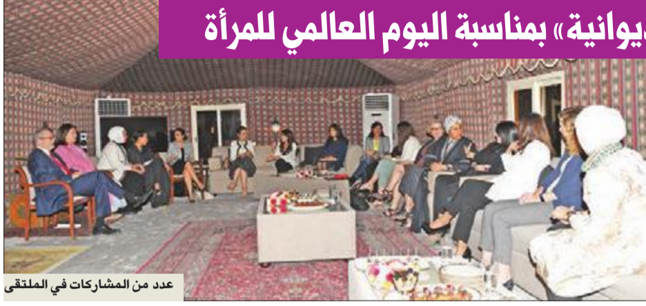
عدد من المشاركات في الملتقى