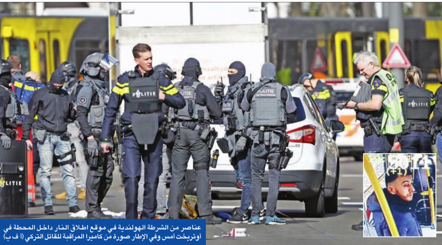
عناصر من الشرطة الهولندية في موقع إطلاق النار داخل المحطة في أوترخت أمس وفي الإطار صورة من كاميرا المراقبة للقاتل التركي (أ ف ب)

استخباراتي نجح في اختراق الخلايا الإرهابية، كما أنها تتميز عن بقية دول أوروبا بما يسمى بالأمن المجتمعي. وفي أغسطس قام شاب أفغاني (19 عاماً) بحمل تصريح إقامة ألمانيا بطعن سائحين أميركيين في محطة القطارات الرئيسية بأمستردام قبل أن يتم إطلاق النار عليه وإصابته. وفي سبتمبر، قال محققون هولنديون إنهم اعتقلوا 7 أشخاص، واحتفظوا مخطاط لشن «هجوم ضخم» على مدنيين في فعالية كبيرة بهولندا، مضيفين أنهم عرفوا على كمية كبيرة من المواد المستخدمة في صنع القنابل، ومن بينها سماء برح أنه كان يمكن أن يستخدم في سيارة مفخخة، واعتقل الرجال في مدينتي ارنهم وويرت (لاهاي، برلين - وكالات)