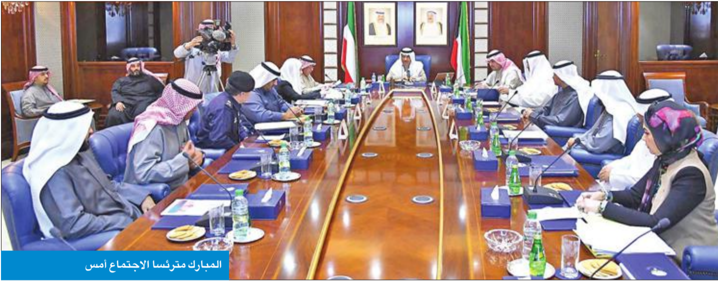
المبارك مترئسا الاجتماع أمس

الدولة لشؤون مجلس الأمة المستشار د. فهد العفاسي في مداخلته أنه ستتم محاسبة الأشخاص المتسببين الذين أشرفوا على هذه الأعمال قانونيا وتطبيق مواد القانون عليهم إضافة إلى الشركات «فهناك ضمان عشري موجود يفعل عليها أيضا».