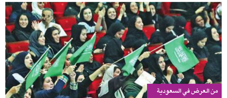
من العرض في السعودية

ترديد الجمهور الخليجي كلمات أعمال كويتية يؤكد مكانة الكويت في الثمانينات، وبصمتها المؤثرة على خريطة الإعلام في المنطقة، كما يؤكد ترابط شعوب الخليج ثقافياً بذاكرة جمعية واحدة.