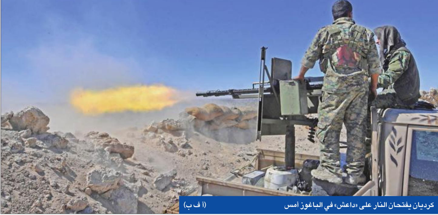
كرديان يفتحان النار على «داعش» في الباغوز أمس (أ ف ب)

«داعش» في دير الزور، نفى رئيس هيئة الأركان الأميركية الجنرال جوزف دانفورد بقوة، أمس الأول، تقريراً صحفياً «وول ستريت جورنال» عن اعترافه ترك نحو ألف جندي في سورية، مؤكداً أن الخطط لإبقاء قوة من 200 جندي لم تتغير.