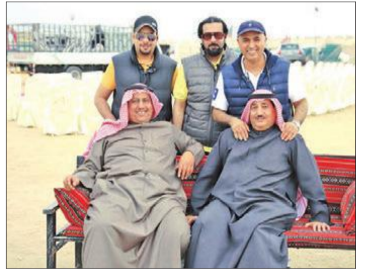
عدد من المشاركين في المخيم الربيعي