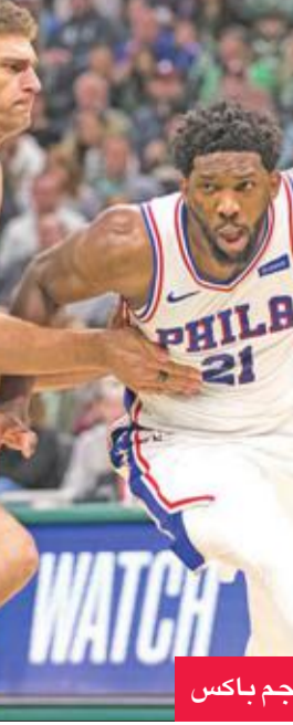
إمبييد نجم فيلادلفيا ولوبيز نجم باكس