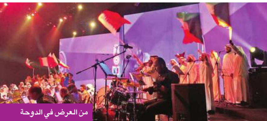
من العرض في الدوحة