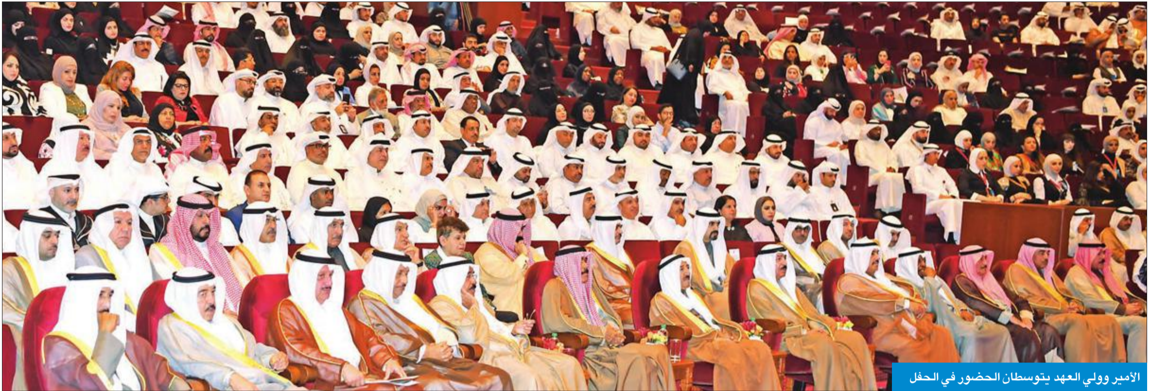
الأمير وولي العهد يتوسطان الحضور في الحفل

بحضور ولي العهد والمبارك والكندري والعاظمي وكبار المسؤولين في الدولة