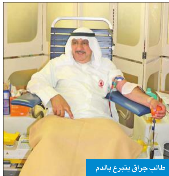
طالب جراق يتبرع بالدم