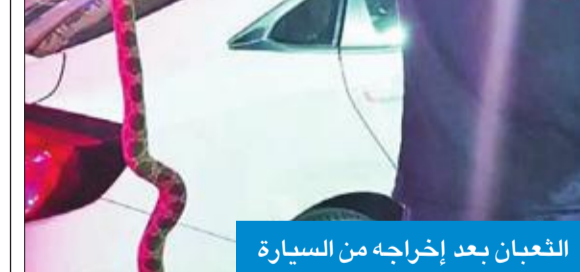
الثعبان بعد إخراجه من السيارة