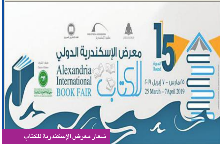
شعار معرض الإسكندرية للكتاب

العربية العاملة في مجال المخطوطات. ويشهد المعرض عرضاً لإنشائه العلمي للمعهد منذ إنشائه إلى الآن من موسوعات وكتب محققة ومجلات علمية، وستقدم المكتبة عرضاً مفتوحاً للمخطوطات، كما سيتم إعلان إصدار أول كتاب لمتحف المخطوطات في المكتبة.