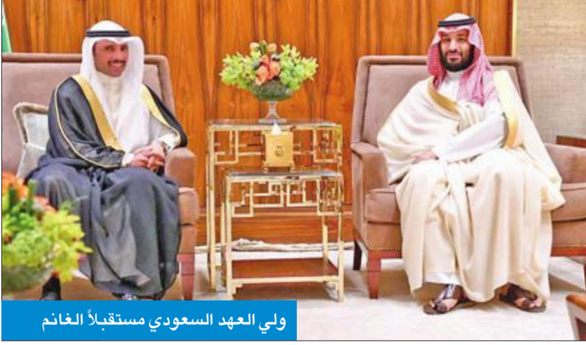
ولي العهد السعودي مستقبلاً الغانم

التقى ولي العهد محمد بن سلمان ورئيس مجلس الشورى