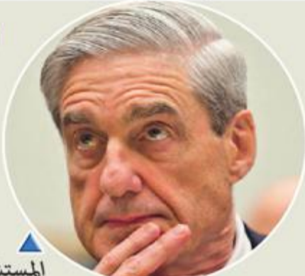
المستشار الخاص روبرت مولر

لا عرقلة للعدالة: الأدلة "ليست كافية لإثبات أن الرئيس ارتكب جريمة عرقلة العدالة" وبينما أن هذا التقرير لا يستنتج أن الرئيس ارتكب جريمة، فإنه أيضاً لا يبرؤه