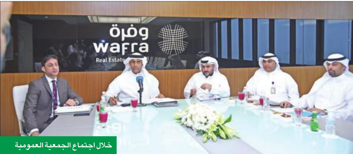
خلال اجتماع الجمعية العمومية