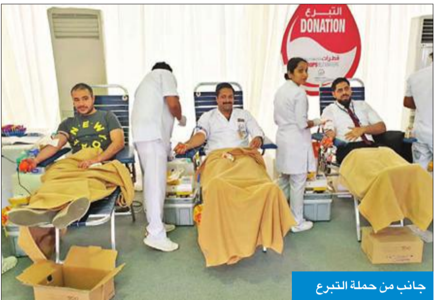
جانب من حملة التبرع