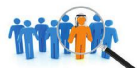
عقود مقاولي القطاع النفطي أمام تحدي العمالة الوطنية

البورصة تواصل حصد المكاسب... والسيولة نحو 36 مليون دينار