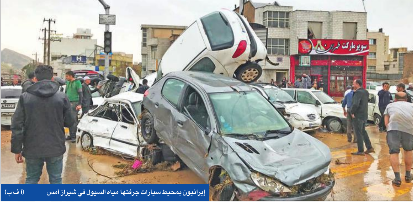
إيرانيون بمحيط سيارات جرفتها مياه السيول في شيراز أمس

جهانغيري يطيح محافظاً أصولياً... والمدعي العام يمنع المشاهير من جمع التبرعات