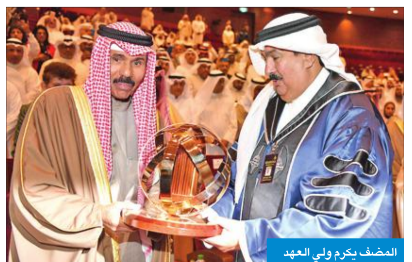
المصفي يكرم ولي العهد