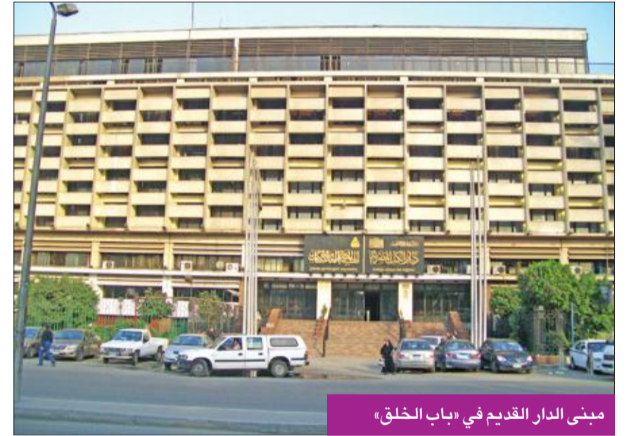
مبنى الدار القديم في «باب الخلق»