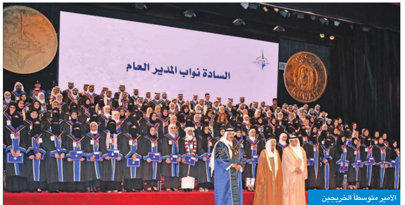
الأمير متوسلاً الخريجين