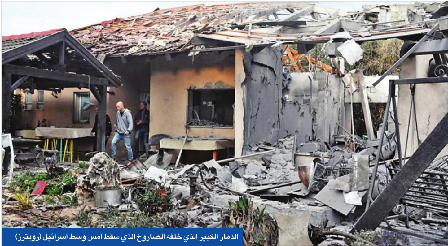
الدمار الكبير الذي خلفه الصاروخ الذي سقط امس وسط إسرائيل

التعب الصحراوي، واعتدت على الأسرى خلال محاولة نقلهم بسبب إجراء تفتيشات. وأشارت الهيئة التي وقوع مشادة بين المعتقلين والسجناء الذين حاولوا الاعتداء على الأسرى، مما دفع معتقلين إلى طعن ضابط إسرائيلي وشرطي. وحذرت منظمة التحرير الفلسطينية و«حماس» أمس من تداعيات «التصعيد ضد الأسرى.