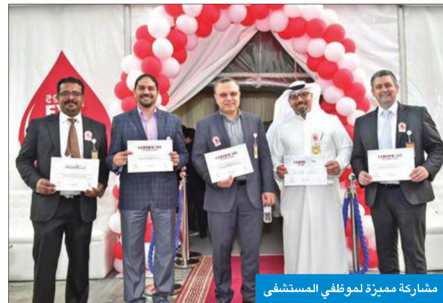
مشاركة مميزة لموظفي المستشفى