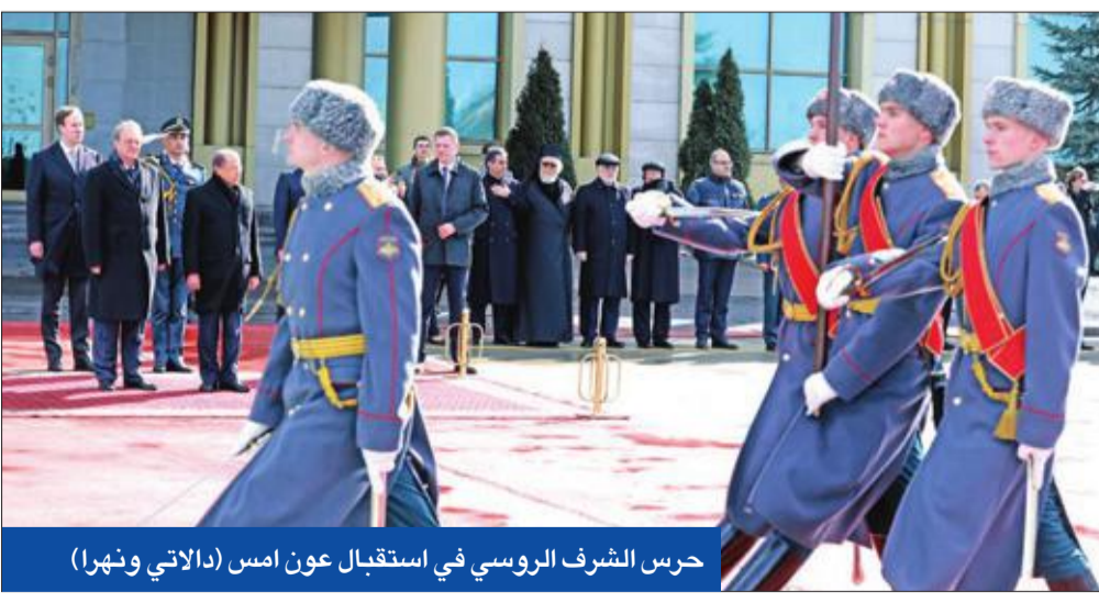
حرس الشرف الروسي في استقبال عون امس

باسيل: هناك خلاف حول «حزب الله» مع واشنطن... وقوانين أميركا تعينها