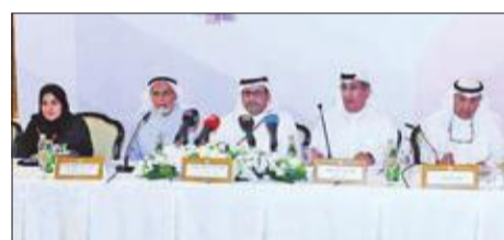
الشايح: «المباني» تركز حالياً على السوق السعودي

مساهم في شركة تمويل شطب لنفسه ديناً بـ 20 مليون دينار!