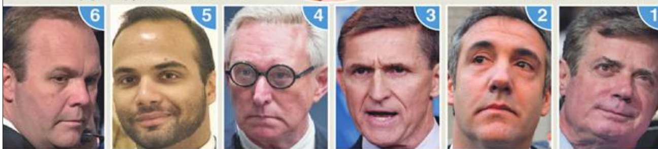
أعوان ترامب المدانون

لا تواطؤ: يذكر تقرير مولر أن "التحقيق لم يتوصل إلى أن أعضاء حملة ترامب تأمروا أو نسقوا مع الحكومة الروسية في أنشطة التدخل في الانتخابات"