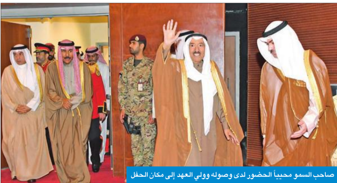
صاحب السمو محبياً الحضور لدى وصوله وولي العهد إلى مكان الحفل