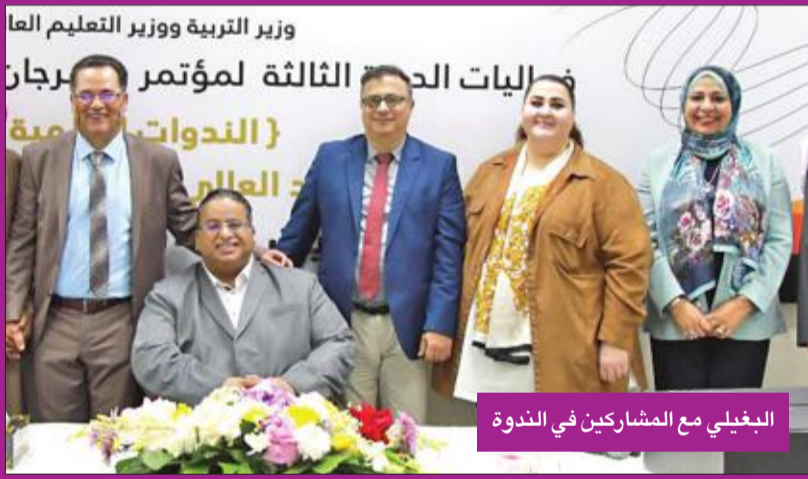
البغليبي مع المشاركين في الندوة

عن وجود فروقات عدة في عدد سنوات الدراسة واختلاف المسميات للمقررات الدراسية، كذلك انفراد بعض المؤسسات بمواد دراسية ومقررات تهدف إلى خدمة مجتمعها.