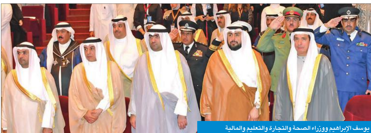
يوسف إبراهيم ووزراء الصحة والتجارة والتعليم والمالية