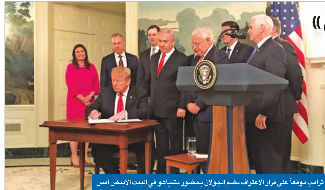
ترامب موقفاً على قرار الاعتراف بضم الجولان بحضور نتنياهو في البيت الأبيض أمس

وقبل أيام فقط من ذكرى مرور عام على الاحتجاجات الفلسطينية، التي اندلعت عند الحدود بين إسرائيل وغزة تحت عنوان «مسيرات العودة»، اتهم الجيش الإسرائيلي حركة حماس، التي تدير القطاع، بإطلاق الصاروخ، موضحاً أنه نشر تعزيزات