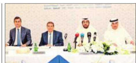
«الأهلي المتحد»: استراتيجيتنا حصرية في منح الائتمان

مساهم في شركة تمويل شطب لنفسه ديناً بـ 20 مليون دينار!