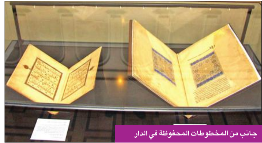
جانب من المخطوطات المحفوظة في الدار

وتعتبر دار الكتب أكبر مكتبة في مصر، تليها مكتبة الأزهر ومكتبة الإسكندرية الجديدة، ويبلغ عدد المخطوطات المحفوظة في الدار نحو 57 ألف مخطوط، تعتبر من أنفس المجموعات، وهي مرقمة