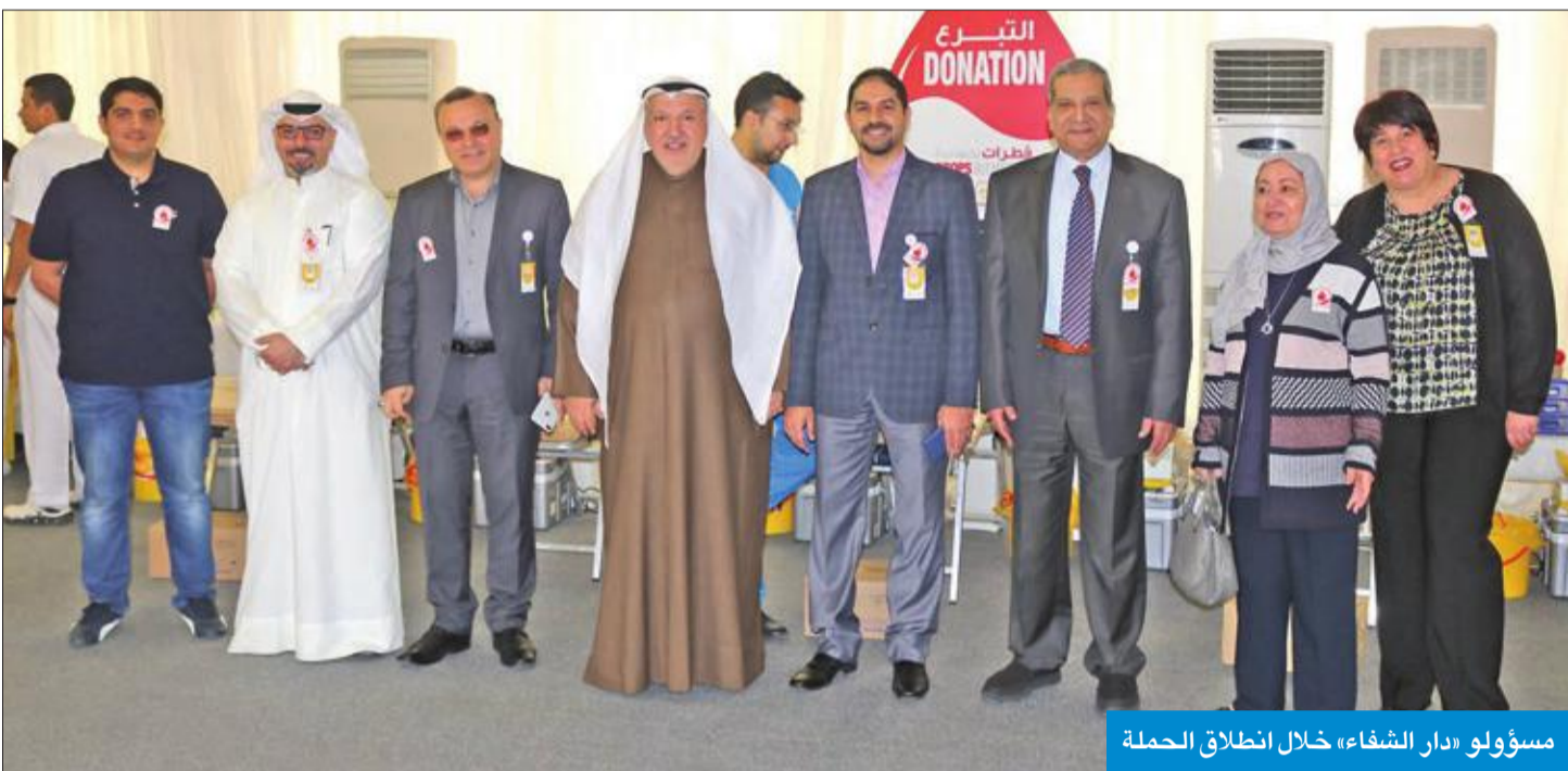
مسؤولو «دار الشفاء» خلال انطلاق الحملة

بالتعاون مع «المركزي» تحت عنوان «قطرة لكنها حياة»... والحصيلة 355 كيساً