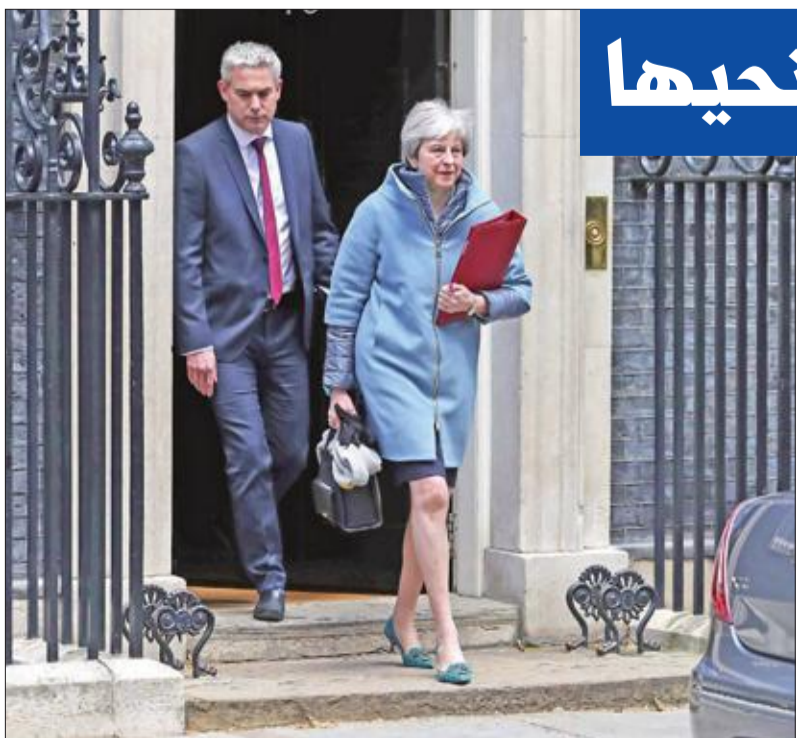
تيريزا ماي تهم بمغادرة مقر رئاسة الحكومة في لندن أمس (أ ف ب)

وفي ظل الموقف المذل والضعيف الذي تواجهه ماي، أكد وزراء أنها لا تزال تقود البلاد، ونفوا ما تردد عن مؤامرة لمطالبتها بتحديد موعد للاستقالة خلال اجتماع لمجلس الوزراء أمس. وأفادت وسائل إعلام بريطانية، بأن ماي، ألغت نواباً مؤيدين لـ "بريكست"، أمس الأول، بأنها ستستقيل إذا صوتوا لمصلحة خططها للخروج التي رفضها البرلمان مرتين من قبل. ونقل المحرر السياسي في قناة ITV، روبرت بيستون، عن "مصدر موثوق به" تأكيده له أن ماي، خلال اجتماع عقدهه أمس الأول، بمقرها الريفي في تشيكرز مع نواب بارزين محافظين، بمن فيهم وزير الخارجية السابق بورييس جونسون، تعهدت بالاستقالة مقابل تصويتهم لمشروعها للاستحباب، الذي يضم الية Backstop التي يرفضونها.