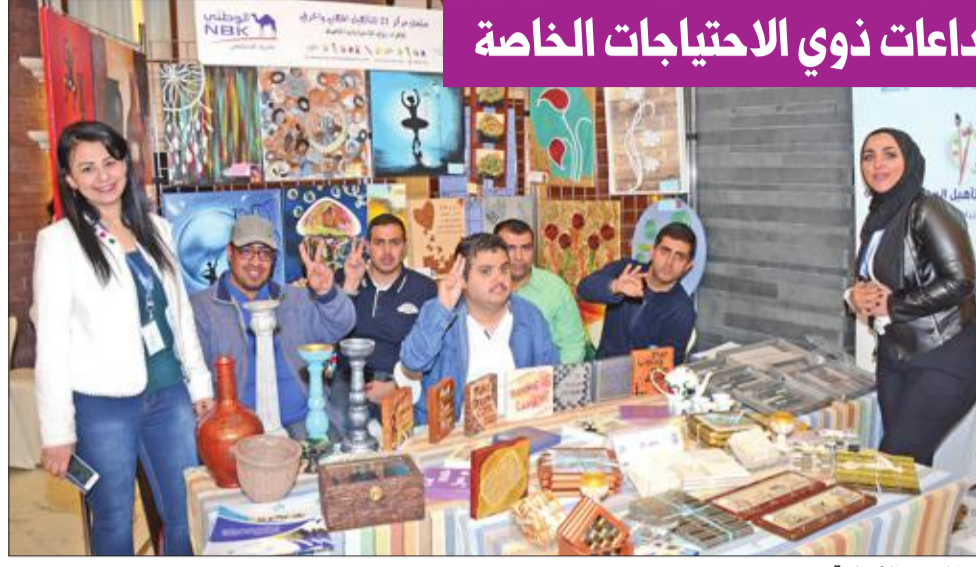
جانب من الفعالية