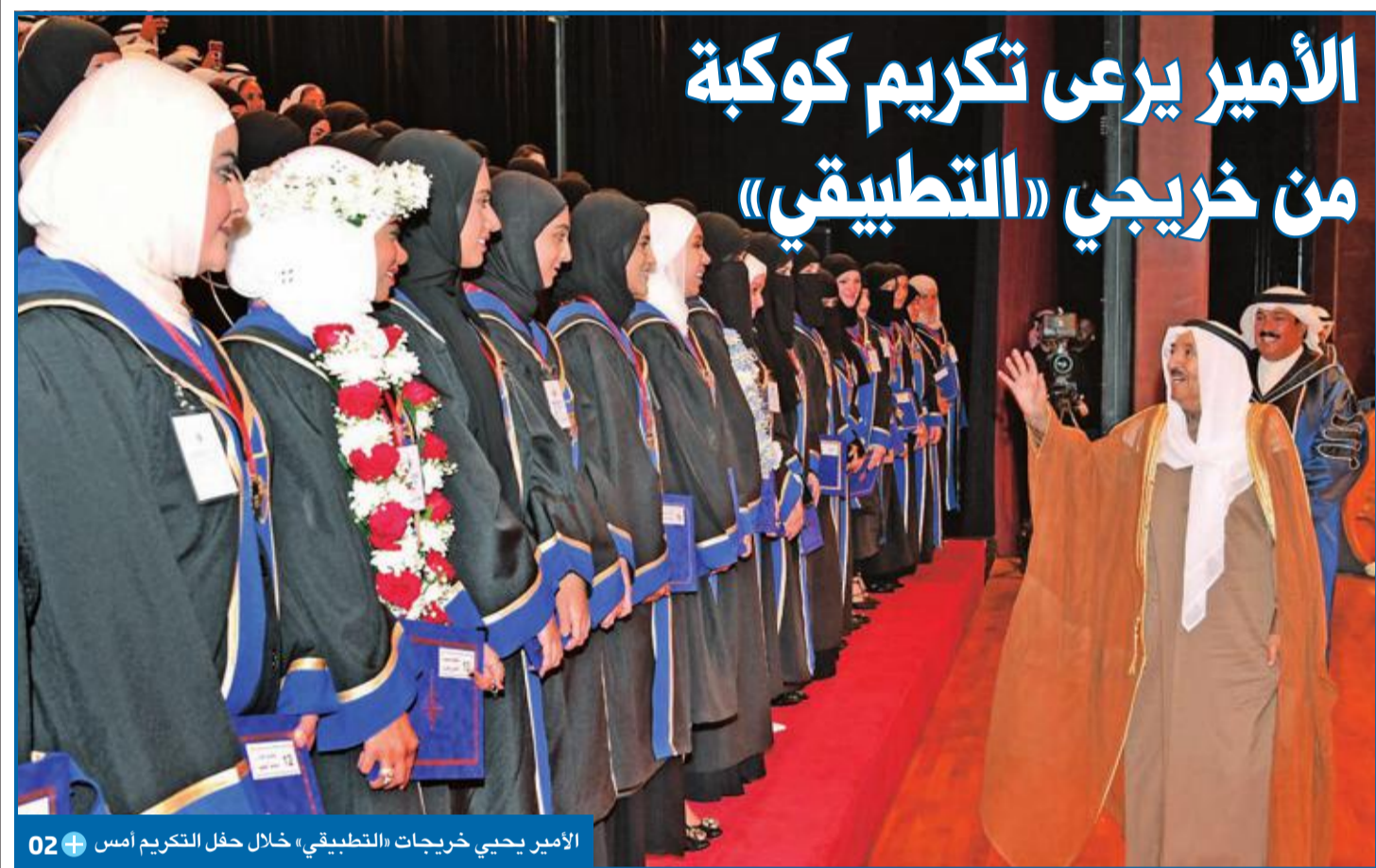
الأمير يعرّي تكريم كوكبة من خريجي «التطبيقي»

ويعد تطبيق التعديل الذي ينص على زيادة رصيد