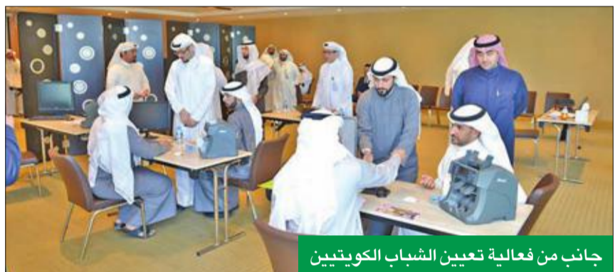
جانب من فعالية تعيين الشباب الكويتيين

في المؤسسات من أهم عناصر تحقيق التنمية المستدامة. ويعتبر توظيف وتطوير الشباب الكويتي استراتيجيات مستمرة في «بيتك»، تعززها فرص النمو والحصص السوقية الكبيرة التي يتمتع بها، وتستلزم توفير كوادر وظيفية وطنية تقوم على رأس العمل، وتساهم في تحقيق النجاح المنشود في كل المجالات.