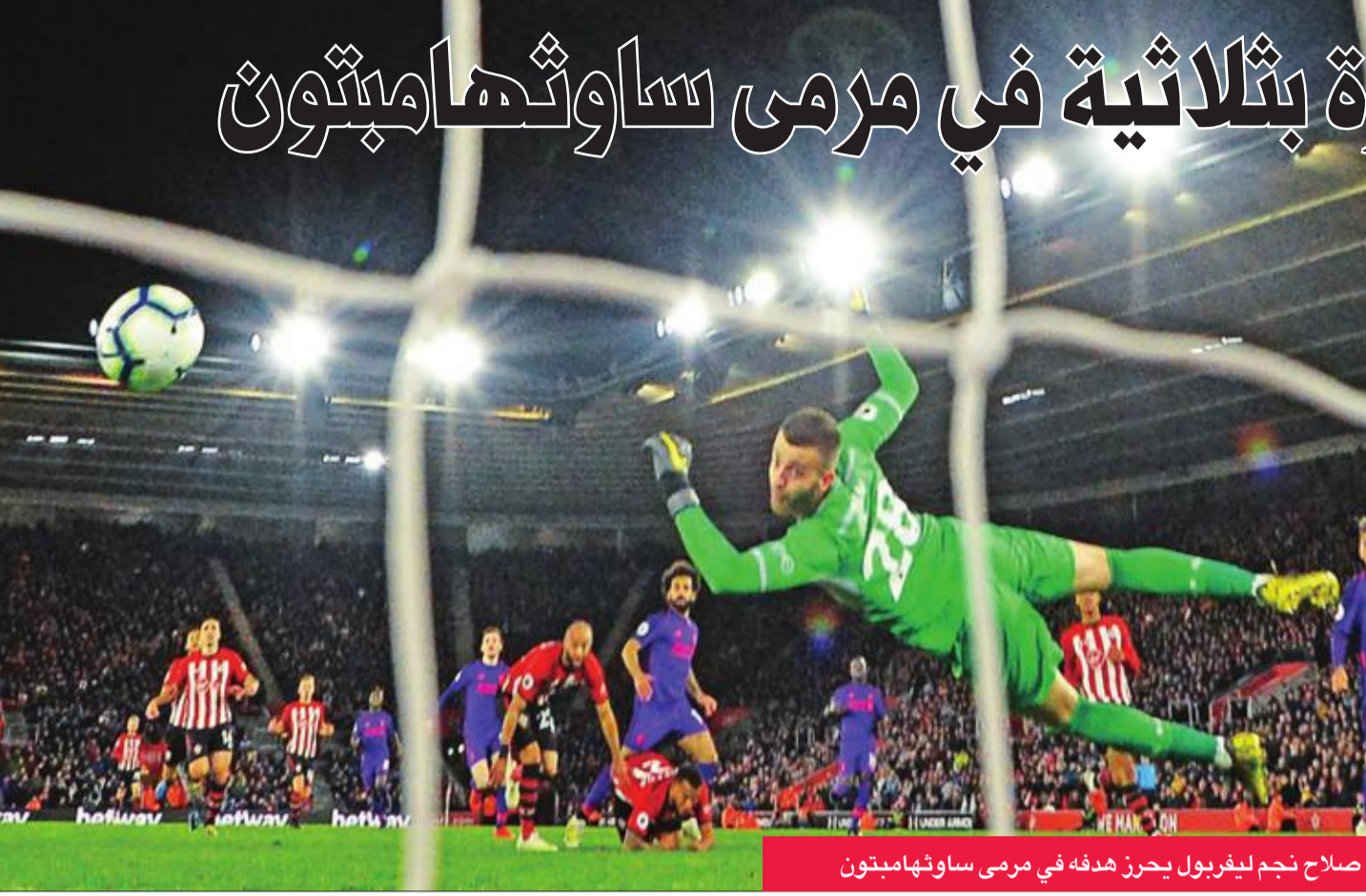
صلاح نجم ليفربول يحزن هدفه في مرمى ساوثهامبتون

مانشستر يونايتد 2-1، واتفورد على فولهام 1-4. وتستكمل المرحلة اليوم ببقاء إيفرتون مع أرسنال، وتختتم الاثنين بقاء تشلسي مع وست هام. وتاجلت مباراة توتنهام هوتسبر مع برايتون إلى 23 أبريل الحالي، بسبب خوض الأخير للدور النهائي لمسابقة كأس انكلترا، حيث يلاقي مانشستر سيتي مع ولفرهامبتون الأحد في المباراة الثانية للمربع الذهبي.