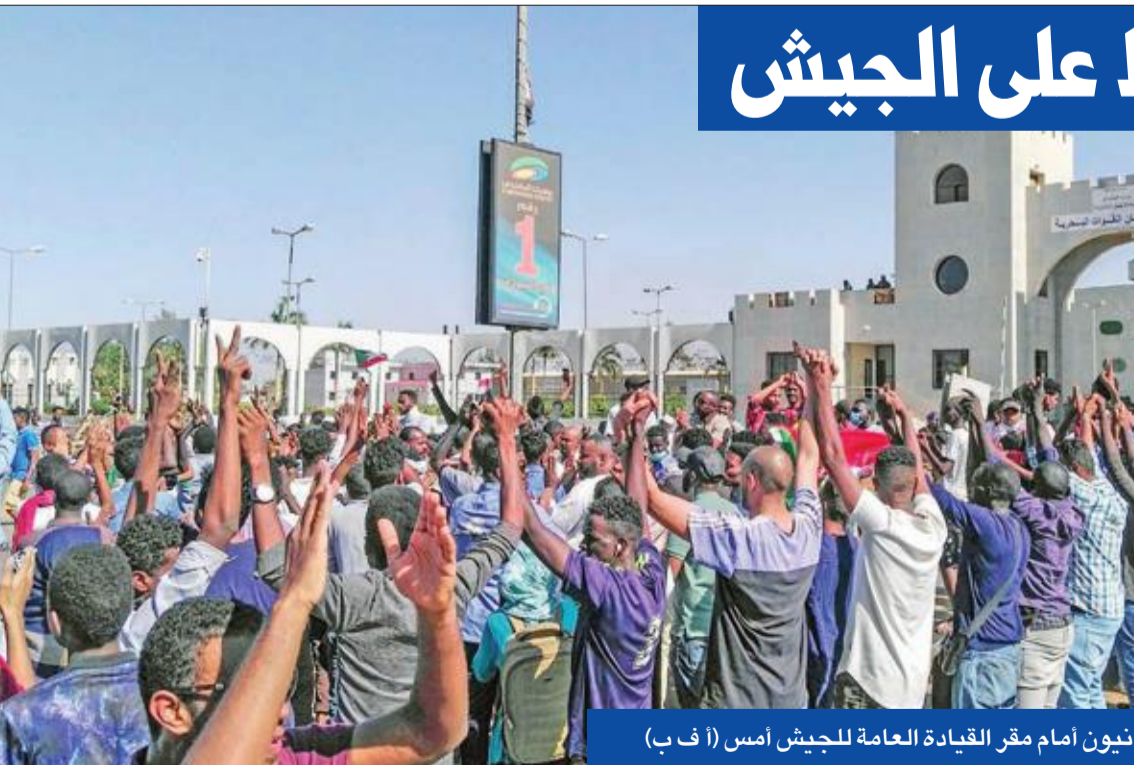
سودانيون أمام مقر القيادة العامة للجيش أمس

مسيرات واسعة، وللتحرك نحو مقر الجيش وأختار منظمو التظاهرات تاريخ 6 أبريل للدعوة للاحتجاجات لإحياء ذكرى انتفاضة عام 1985 التي أطاحت بنظام الرئيس آنذاك جعفر النميري. وقبل انطلاق المسيرات، انتشر عناصر الأمن بشكل واسع في ساحات الخرطوم الرئيسية، وفي أم درمان، على الضفة المقابلة من نهر النيل، وقال شاهد عيان: «كان هناك انتشار أمني كثيف في المكان، حيث كان المتظاهرون سيتجمعون من أجل المسيرة، لكنهم خرجوا رغم ذلك وهم يهتفون بشعارات مناهضة للحكومة». وأفاد شهود بان عناصر أمن بلباس مدني منعوا حتى المازة من الوصول إلى المناطق الواقعة في وسط المدينة. وقال شهود، إن عناصر الأمن أمروا بإغلاق المحلات التجارية والأسواق في وسط الخرطوم قبيل انطلاق التظاهرات. وذكر أحدهم أن «عناصر الأمن اعتقلت فورا الأشخاص الذين كانوا يسبرون ضمن مجموعات أو طلبوا منهم العودة إلى منازلهم». وقاد الحركة الاحتجاجية الحالية في البداية «تجمع المهنيين السودانيين» لكن عدة أحزاب سياسية بينها حزب الأمة المعارض الأبرز رمت بثقلها لاحقاً. ويشير محللون إلى أن الحركة تحولت إلى أكبر