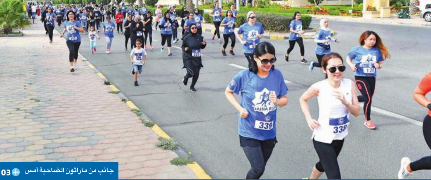
جانب من ماراثون الضاحية أمس 03