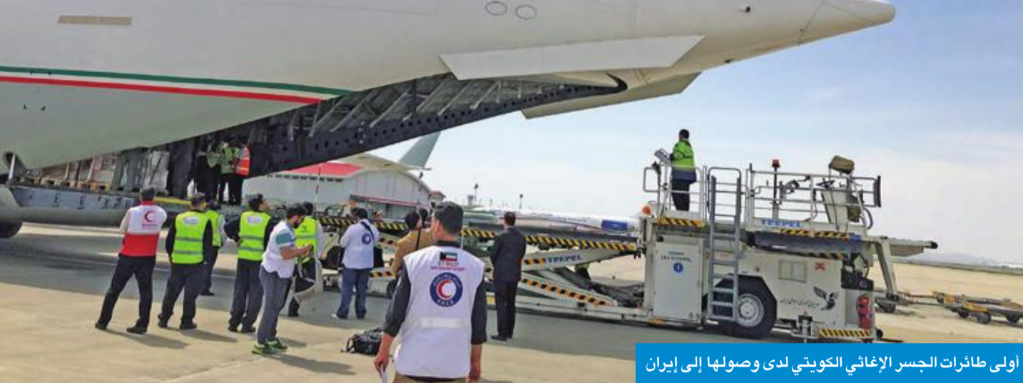
أولى طائرات الجسر الإغاثي الكويتي لدى وصولها إلى إيران