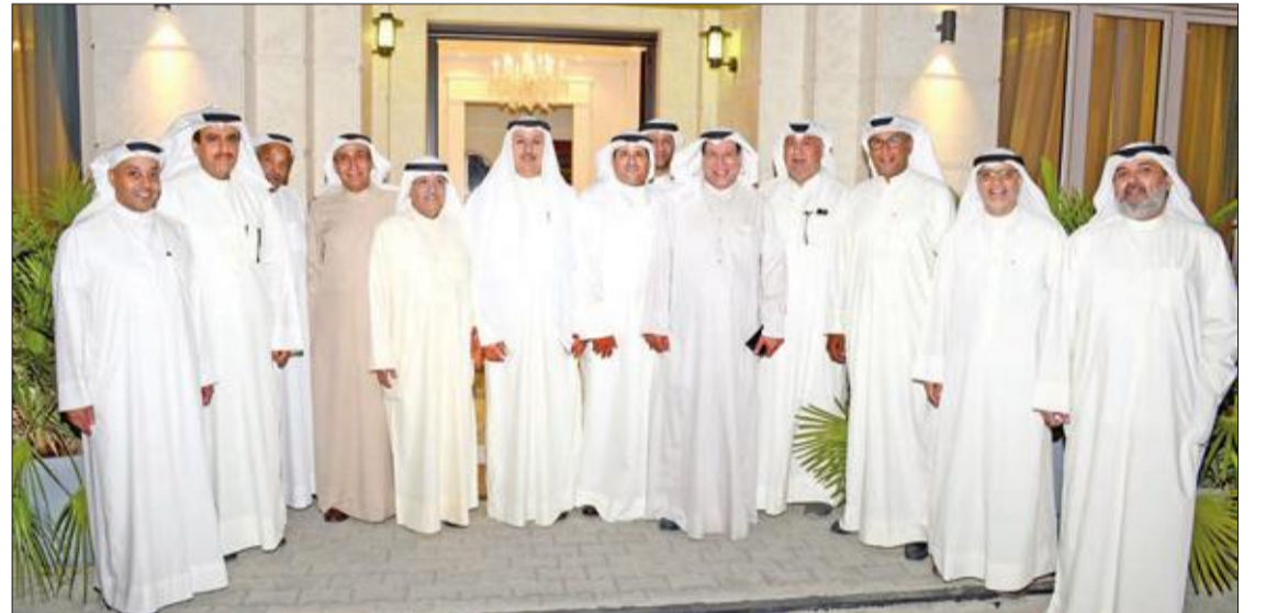
الدخيل متوسطاً عدداً من المدعوين والضيوف