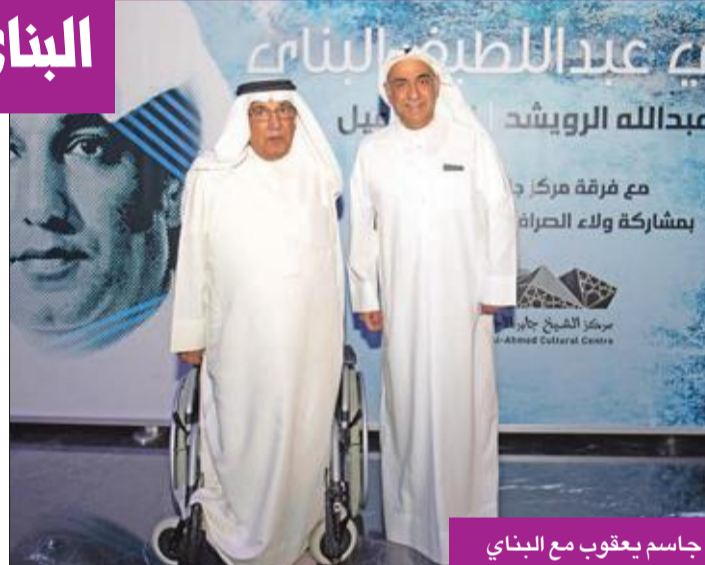
جاسم يعقوب مع البناي

كان في مقدمة الحضور في الليلة الثانية نجم نادي القادسية والمنتخب الوطني لكرة القدم المخضرم جاسم يعقوب، حيث تبادل مع البناي الحديث عن تكرياتهما، وتضمن برنامج الحفل لقاء مع يعقوب تحدث فيه عن تأثره العميق بالكلمات التي كتبتها البناي لأغنية تكريمه بعد العودة من رحلة علاجه من الإصابة.