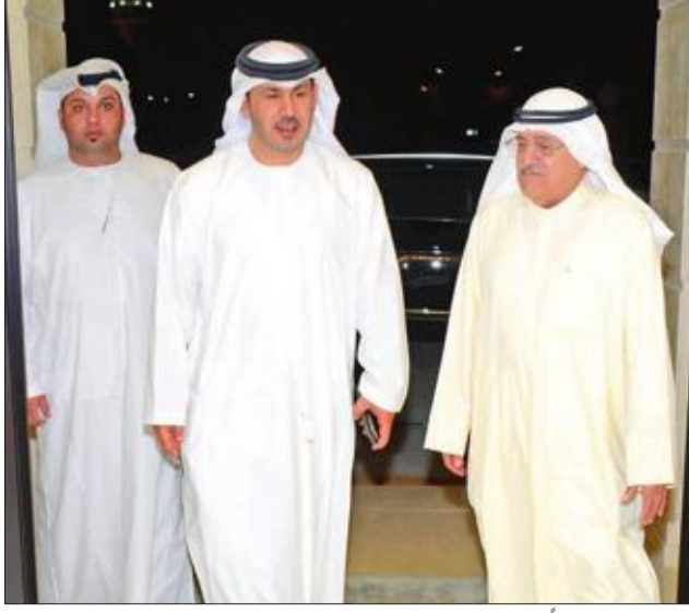
الدخيل مستقبلاً السفير الإماراتي صقر الرئيسي