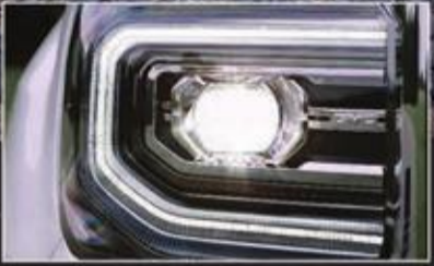
إضاءة أمامية LED - HID