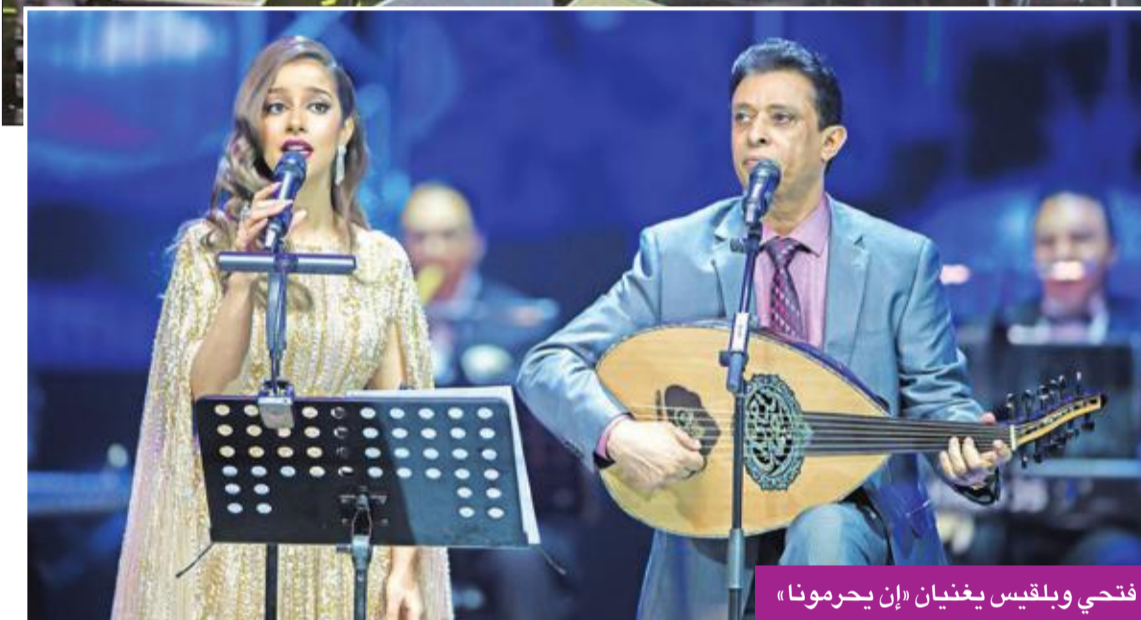
فتحي وبلقيس يغنيان «إن يحرمونا»