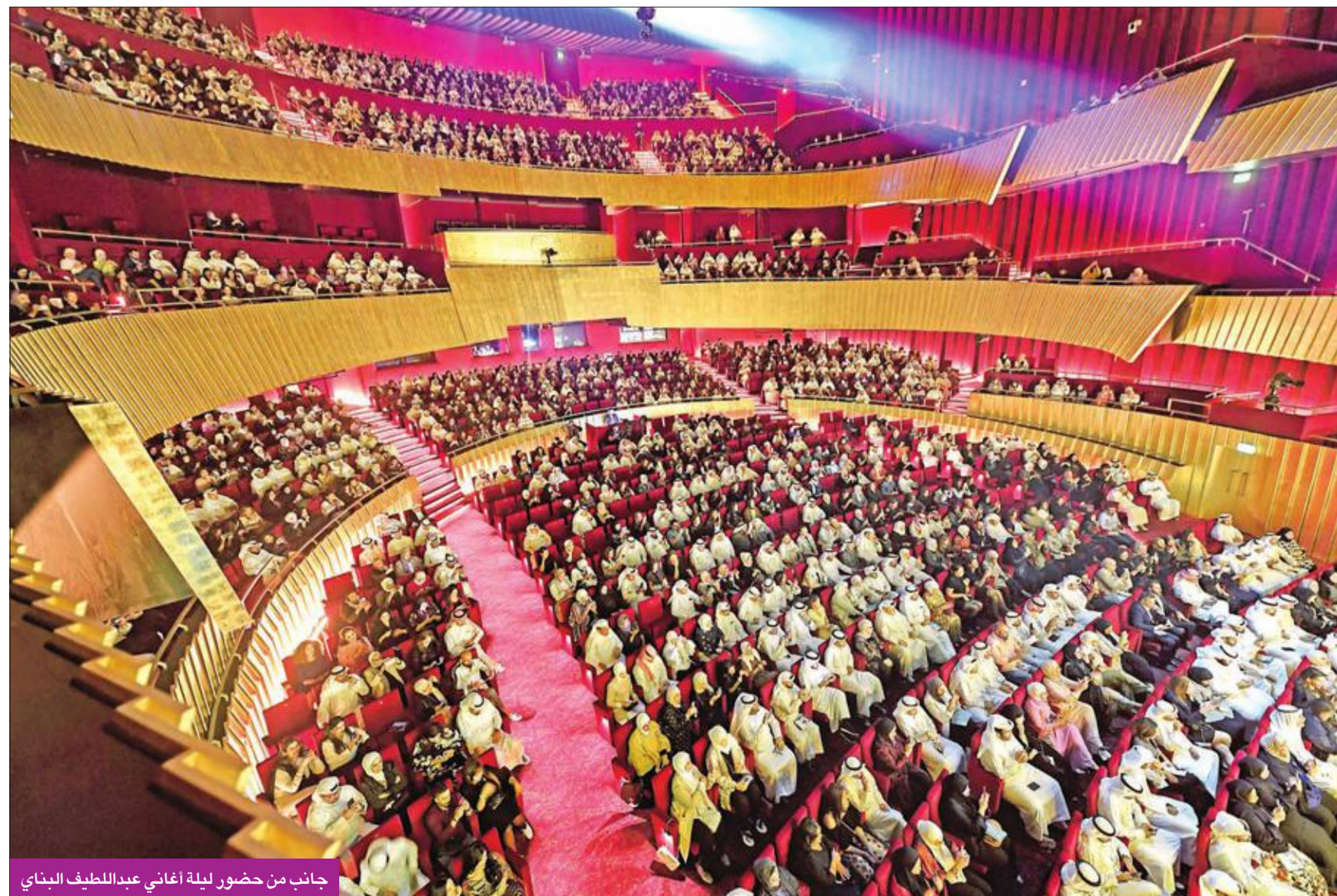
جانب من حضور ليلة أغاني عبداللطيف البناي

التفت الجماهير حول البناي بعد الحفل لالتقاط الصور التذكارية، والتعبير عن امتنانهم لما قدمه الشاعر عبر السنين من كلمات لامست قلوبهم وامتعتهم من خلال الأغاني التي رددوها في مختلف المناسبات. وكان لافتاً أن تتفاوت الفئات العمرية للجماهير التي احتفت بالبناي، ما يعكس التأثير الممتد لكلمات البناي على الأجيال المتعاقبة.