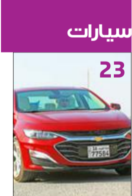
سيارات 23 ماليبو 2019 الجديدة رياضية بامتياز