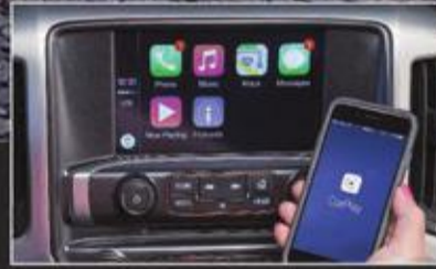
إمكانية التوصل بـ Bluetooth