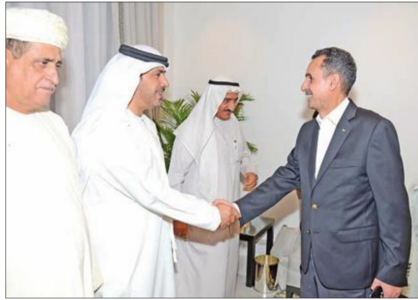
... والسفير الأردني أبوشتال