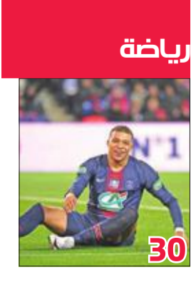
رياضة 30 مبابي يتقدم على رونالدو بقائمة «ماركا» لأفضل لاعب العالم