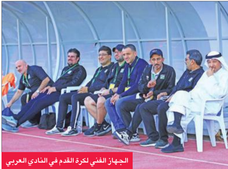
الجهاز الفني لكرة القدم في النادي العربي