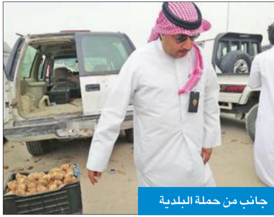
جانب من حملة البلدية

أعلنت إدارة العلاقات العامة ببلدية الكويت، أن فريق الطوارئ بفرع بلدية العاصمة ممثلاً في النوية (ج) نفذ جولات ميدانية بالتعاون مع إدارة النظافة العامة بالمحافظة واللجنة الرباعية لرصد المخالفات واتخاذ الإجراءات القانونية بحقها على الفور، فضلاً عن إزالة الإعلانات العشوائية من الشوارع والميادين.