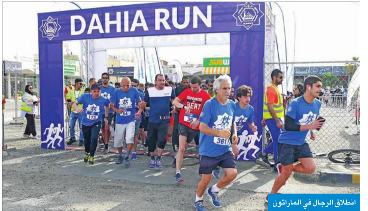
انطلاق الرجال في الماراثون