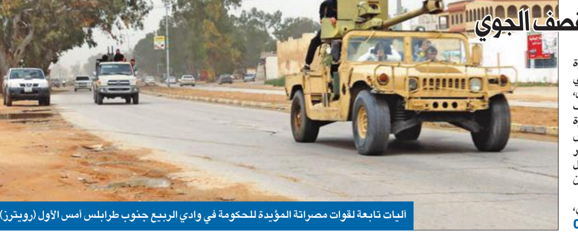
اليات تابعة لقوات مصراتة المؤيدة للحكومة في وادي الربيع جنوب طرابلس أمس الأول

قواته تغلغت في العاصمة... والسراج يلجأ إلى القصف الجوي