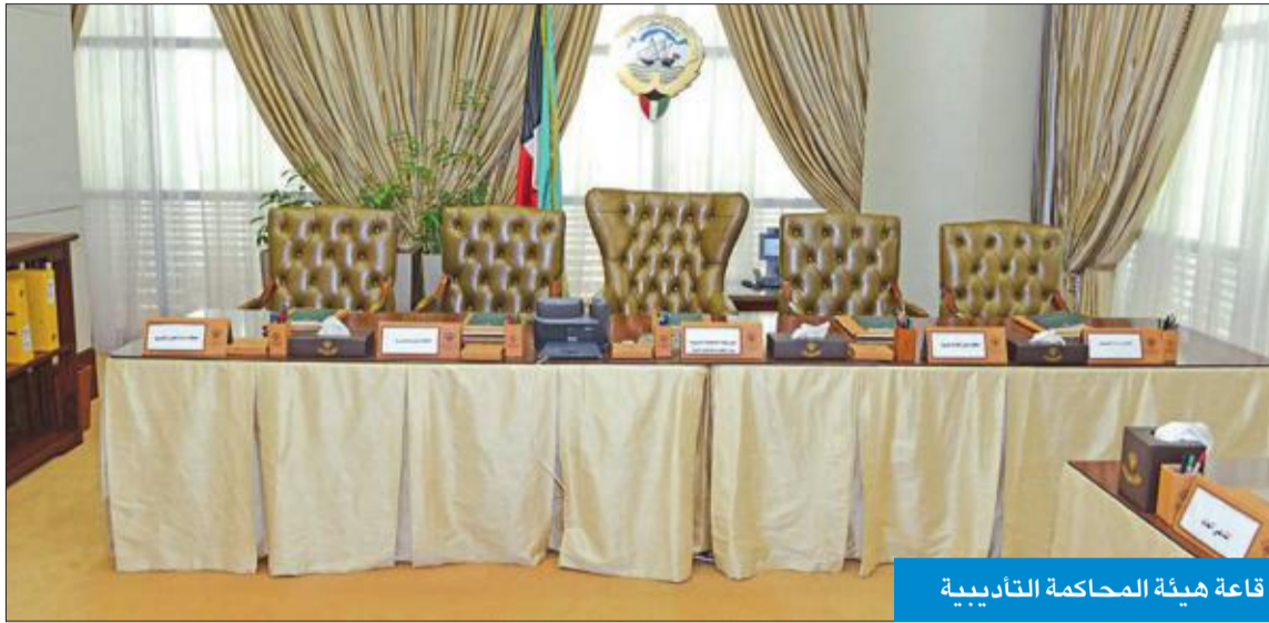
قاعة هيئة المحكمة التأديبية

كما كشف عن عدم قيام شركة ناقلات النفط الكويتية بمراعاة الاحتياجات والوصفات الفنية العامة للرعاية السكنية 2، بنك الائتمان الكويتي 2، شركة الخطوط الجوية الكويتية 2، الديوان الأميري 2، جامعة الكويت 2، هيئة أسواق المال 2، شركة نقل وتجارة المواشي 2، وزارة المواصلات 1، وزارة العدل 1، مؤسسة المواشي الكويتية 1، الشركة الكويتية للاستثمار 1، شركة البترول الوطنية الكويتية 1، الإدارة العامة للجمارك 1، بيت الزكاة 1، مؤسسة البترول الكويتية 1 ليصبح المجموع 143، أما عدد المحالين إلى هيئة المحاكم التأديبية فبلغ 383 محالاً، وزارات 257، شركات 47، جهات ملحقه ومستقلة 79.