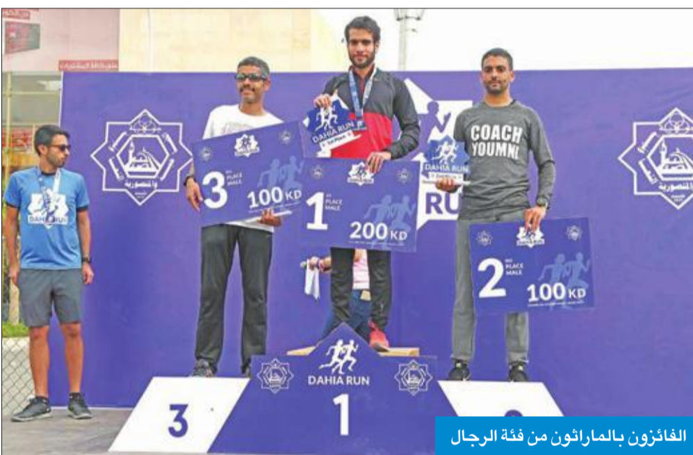
الفائزون بالماراثون من فئة الرجال

مشيرا إلى أن مسافة السباق خمسة كيلومترات للرجال والنساء والعوائل. وأكد الفارس أن نسبة المشاركة بلغت الحد الأقصى بواقع 500 مشارك، لافتا إلى أن الماراثون حقق أهدافه دون حدوث أي مشكلات تذكر، مضيفا أن الناس سعداء بالماراثون وغالبية المشاركين من أبناء المنطقة وبسبة 60 في المئة وهناك آخرون من خارجها، مشيدا بالجهات الداعمة للماراثون.