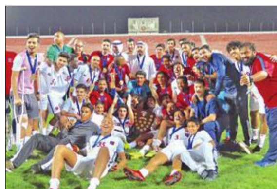
فريق الكويت متوجاً بدرع الدوري

توج فريق الكويت متوجاً بدرع الدوري ببطولته على جميع بطولات المراحل السنوية واكتسحها بتحقيق لقب الدوري في جميع المراحل تحت 13 و15 و17 و20.