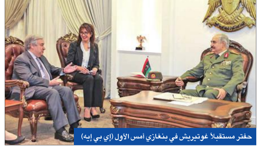
حفتر مستقبلاً غوتيريس في بنغازي أمس الأول

وسط ترقب عالمي، دخلت قوات شرق ليبيا بقيادة المشير خليفة حفتر الضواحي الجنوبية من العاصمة طرابلس في توغل أشعل المخاطر بمقل حكومة الوفاق المعترف بها دولياً برئاسة فايز السراج، الذي أصدر أوامر بشن غارات جوية على منطقة العريزية ومعسكر مزدة جنوب مدينة غريان ومنطقة سوق الخميس. واحتدم القتال قرب مطار طرابلس الدولي الخارج عن الخدمة منذ تدميره في 2014 بين ائتلاف المجموعات المسلحة الموالية لحكومة السراج، و«الجيش الوطني» التابعة لحفتر، الذي هدد بقصف أي قاعدة جوية أو مطار عسكري أو مدني تعلق منه طائرات لتفنيذ عمليات ضد. وقبل تعيينه العقيد طيار محمد حسن محمد قنونو ناطقاً رسمياً باسم الجيش، زار السراج، برفقة قادة المنطقة الغربية، حاجز كوبري 27 العسكري الواقع على بعد 27 كلم من البوابة الغربية للعاصمة، فور استعادته من قوات حفتر في موكب مؤلف من نحو عشرين آلية، بينها شاحنات مزودة بمضادات للطائرات. ونددت قوات حفتر عبر مكتبها الإعلامي بشدة بالغارة الجوية على منطقة العريزية، مؤكدة أنها من طائفة ألقعت من مصراتة، التي تتمرکز فيها فصائل موالية بالغليبيها لحكومة الوفاق.