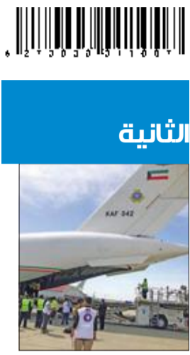
ترحيب إيراني واسع بمبادرة الأمير لإغاثة مكبوبي السيول