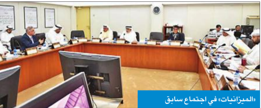
«الميزانيات» في اجتماع سابق