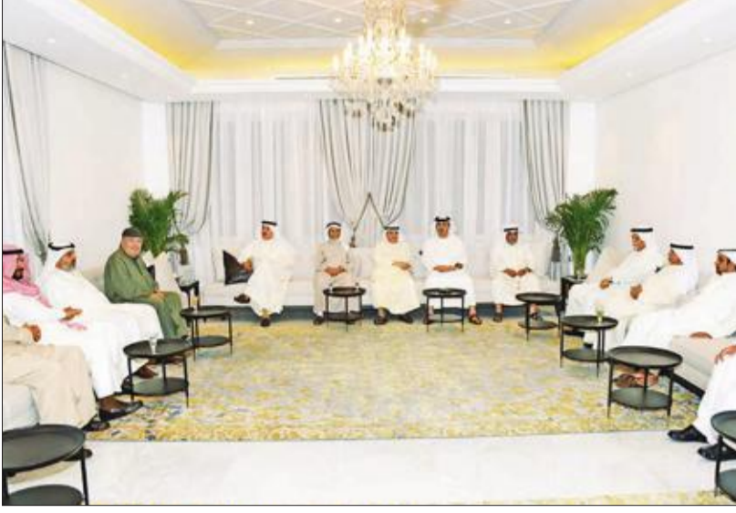
جانب من حفل الاستقبال