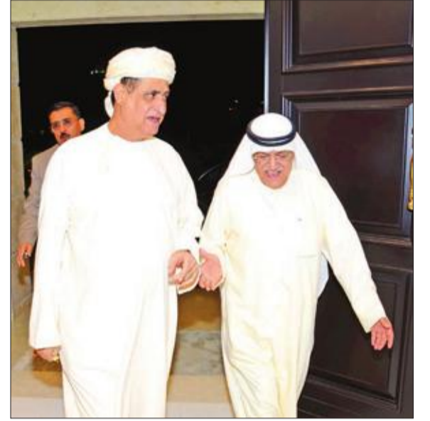
الدخيل مستقبلاً السفير العماني في الكويت د. عدنان الأنصاري