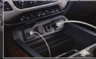
مداخل وصلات USB متعددة