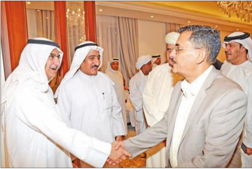
... والسفير اليمني د. خالد راجح

أقام محمد الدخيل حفل استقبال على شرف السفير الإماراتي الجديد لدى الكويت صقر الرئيسي، وعلى شرف عدد من السفراء العرب لدى الكويت في ديوان الدخيل بمنطقة الشامية، وهم: السفير الأردني صقر أبوشتال، وسفير جنوب السودان فرمينا ريك، والقائم بأعمال السفارة السودانية عمر تاناي، وسفير سلطنة عمان د. عدنان الأنصاري، والقائم بأعمال السفارة البحرينية المستشار محمد السبت، وسفير اليمن د. خالد راجح. وتمنى الدخيل للسفير الإماراتي التوفيق في مهام عمله، والمزيد من التقدم.