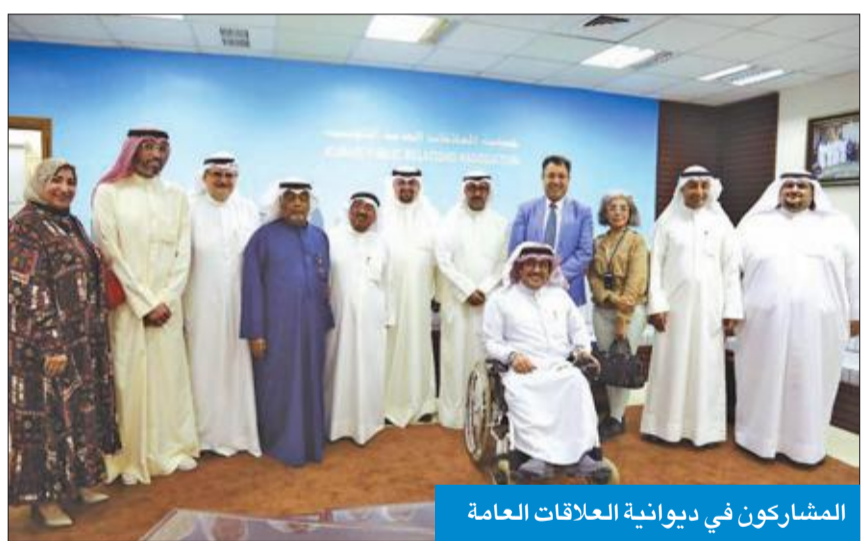
المشاركون في ديوانية العلاقات العامة

أعلنت هيئة الملتي الإعلامي العربي الانتهاء من صياغة جدول الأعمال الخاص بفعاليات الدورة السادسة عشرة، والمقر انعقادها من 21 و22 الجاري، بمرکز جابر الثقافي، تحت رعاية رئيس مجلس الوزراء سمو الشيخ جابر المبارك، ومشراكة عدد من وزراء الخارجية والإعلام، وملاك المؤسسات الإعلامية العربية المختلفة. وأضاف إلى