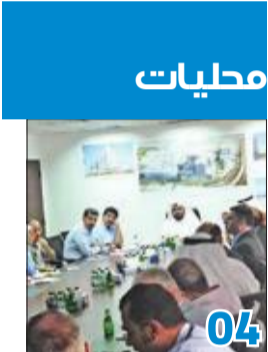
«الصحّة»: الكويت خالية من «كورونا» واتخذنا الحيطة