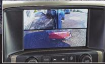
شاشة كبيرة مزودة بكامير للرؤية الخلفية