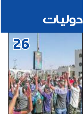
دوليات 26 المعارضة السودانية تضغط على الجيش