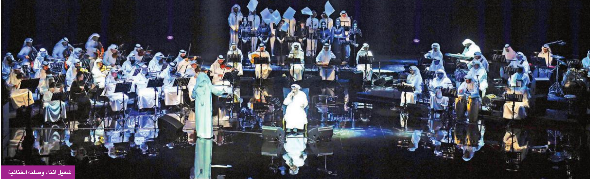
شعيل أثناء وصلته الغنائية

بمشاركة عبدالله الرويشد ونبيل شعيل وفرقة مركز جابر الموسيقية