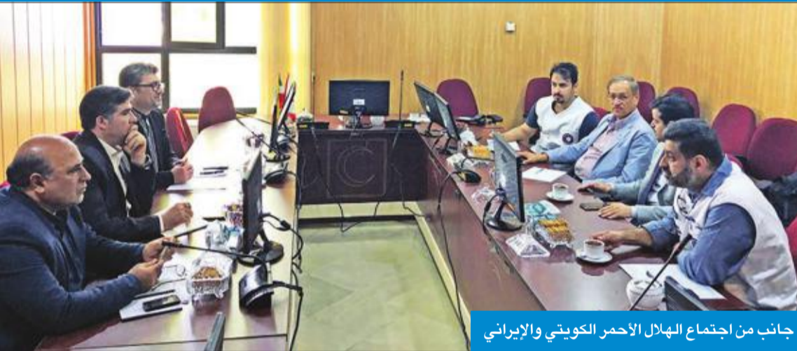
جانب من اجتماع الهلال الأحمر الكويتي والإيراني