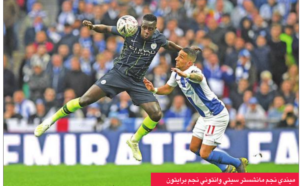
ميدفي نجم مانشستر سيتي وانتوني نجم برايتون

لكن الفريق الشمالي لم يتأخر في تسجيل هدفه، وذلك بعدما تقدم لاعبه البلجيكي كيفن دي بروين على الجهة اليمنى، ورفع كرة