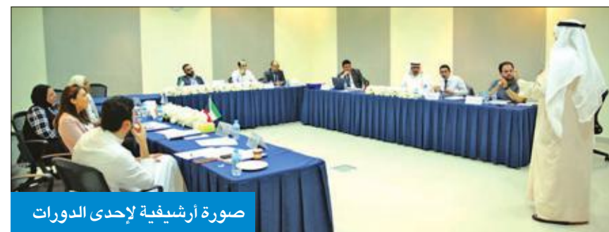
صورة ارشيفية لإحدى الدورات

تنظيم هذا البرنامج على مدى يومين متتاليين نظراً لأهميته، حيث سيتم التركيز في اليوم الأول على التعريف بعدد من الجوانب ذات الصلة بالموضوع، ومنها قاعدة استنفاد القاضي سلطته بإصدار الحكم، وأضاف الغزالي: «أما في اليوم الثاني فسيتم التعرف على عدد من الجوانب الهامة، منها الرجوع إلى ذات المحكمة التي أصدرت الحكم للطعن بطريقة اعتراض الخارج عن الخصومة، ماهية الاعتراض ومدلوله، وشروط قبوله، وإجراءات الطعن بالاعتراض وسلطة المحكمة التي تنظر الطعن، ونظام الحكم الصادر بالاعتراض».