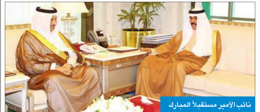
نائب الأمير مستقبلاً المبارك

وزير الخارجية الشيخ صباح خالد، ووزير خارجية جمهورية اليمن خالد اليماني، والوفد المرافق له وذلك بمناسبة زيارته للبلاد. كما استقبل سموه، نائب رئيس مجلس الوزراء وزير الداخلية الشيخ خالد الجراح، ونائب رئيس مجلس الوزراء وزير الدولة لشؤون مجلس الوزراء أنس الصالح.