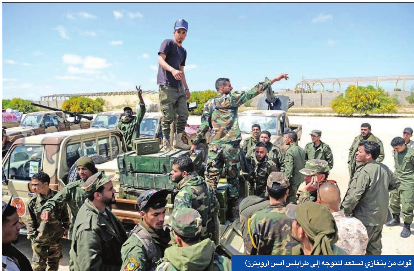
قوات من بنغازي تستعد للتوجه إلى طرابلس أمس

في خطاب متلفن، اتهم السراج، أمس الأول، خصمه حفر بـ «نقض العهد والظلم في الظهر» وإعلان «حرب لا رايح فيها». وقال: «لقد مددنا أيدينا للسلام، لكن بعد الاعتداء الذي حصل من القوات التابعة