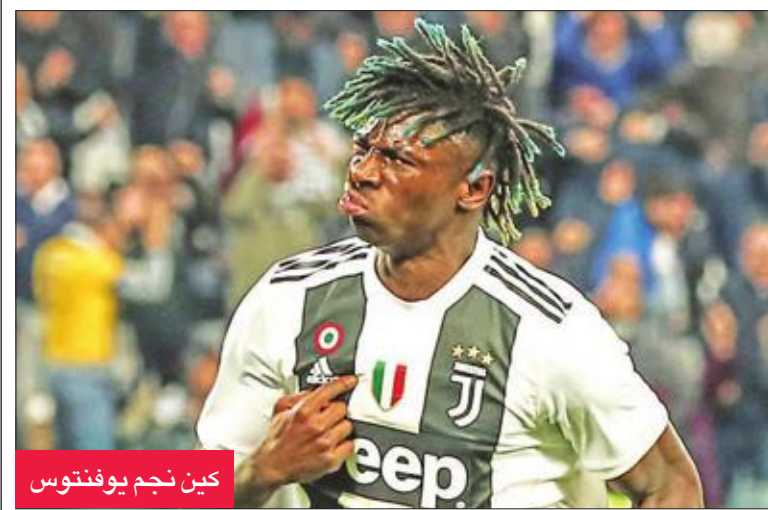
كين نجم يوفنتوس

يجعل مركزه الرابع وحلم العودة لدوري أبطال أوروبا للمرة الأولى منذ موسم 2013-2014، مهدداً من قبل أكثر من فريق مثل روما الذي تنفس الصعداء وحقق فوزه الثاني من أصل 5 مباريات بقيادة مدربه القديم الجديد كلاوديو رانيري، وذلك على حساب ضيفه سمبوريا بهدف للقائد دانييلي دي روسي (75).