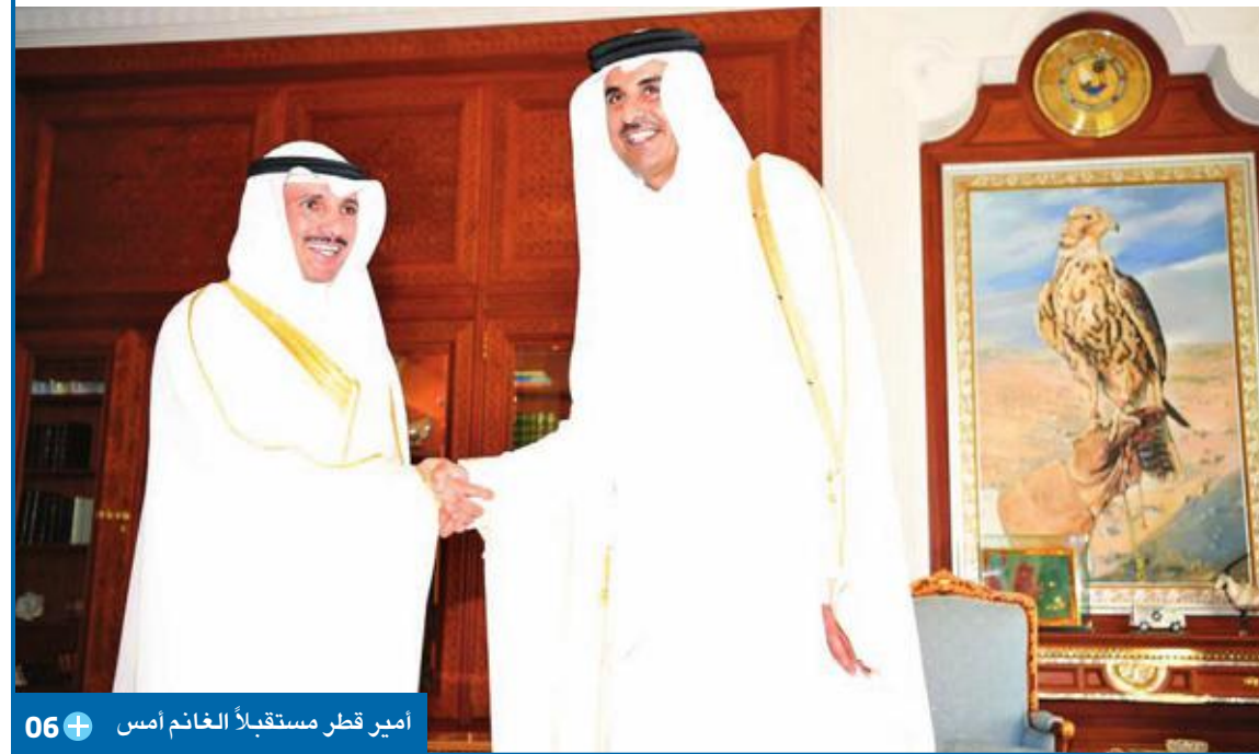
أمير قطر مستقبلاً الغانم أمس 06

أمير قطر استقبله والوفد البرلماني المرافق