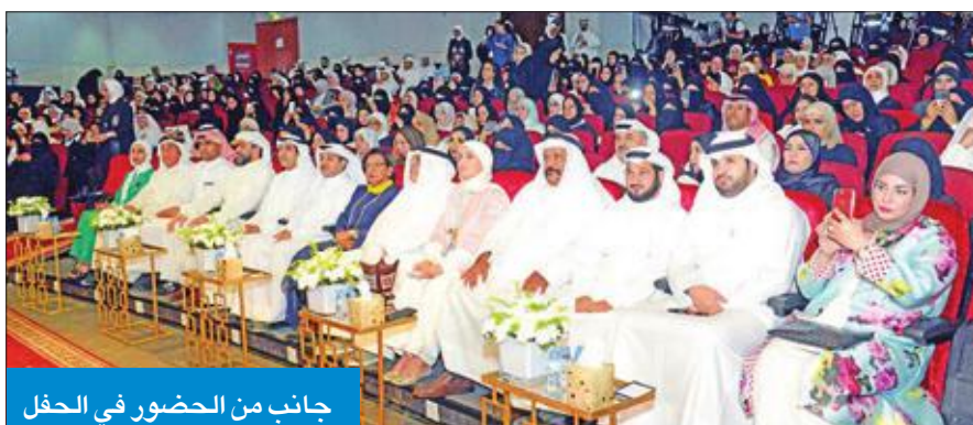
جانب من الحضور في الحفل

وأضافت أن على المرشحين أن يكونوا بكفاءة عالية وخبرة تتناسب مع متطلبات المنصب، إن تعمل الدولة على صنع قياديين قادرين على إدارة الأزمات والاختبار من الأدوات التي تحقق ذلك، موضحة أنه بعد أن يتمكن المرشح لمنصب قيادي من تجاوز الاختبار بنجاح يتم طرح اسمه بشكل فوري على طاولة مجلس الوزراء حتى يتم اختياره.