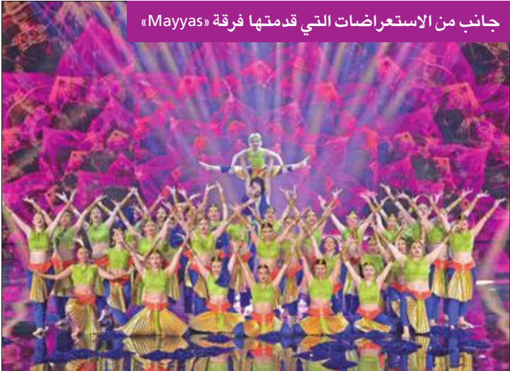
جانب من الاستعراضات التي قدمتها فرقة «Mayyas»

فريق «Iapa-loyac academy» يمثل الكويت في العرض المباشر الرابع