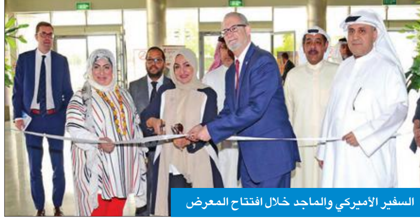
السفير الأميركي والماجد خلال افتتاح المعرض

أكد السفير الأميركي لدى الكويت لورانس سيلفرمان، أن إجراءات التأشيرات بسيطة جداً للطلبة الحاصلين على القبول في الجامعات الأميركية، مشيراً إلى أن هناك خيارات كثيرة للطلبة من حيث نوعية وقوة الدراسة في المجالات كافة. وقال سيلفرمان، خلال افتتاح معرض الجامعات EduEx Q8 التعليمي على أرض المعارض الدولية في مشرف صباح أمس، إن أفضل ما تقدمه الجامعات الأميركية هو الاعتماد على النفس، فالأمر لا يتعلق بدراسة الطالب المواد المقررة، لكنه يتعلق باكتشاف الذات، وهذا أفضل ما في جامعاتنا، عربياً عن سعادته بالمشاركة في أكبر معارض الجامعات بالكويت بمشاركة 39 جامعة عالمية، منها نحو 20 جامعة أميركية من القطاعين الحكومي والخاص. وأضاف أن الولايات المتحدة