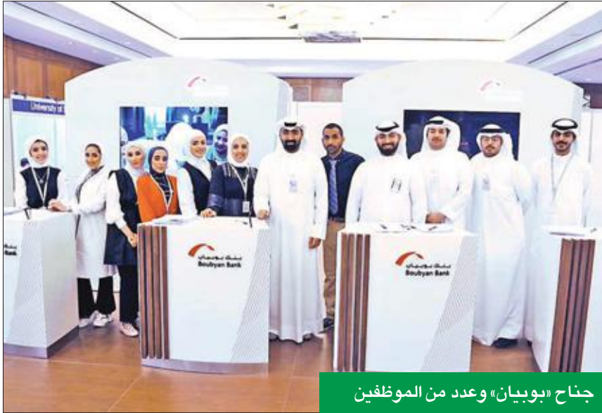
جناح «بوبيان» وعدد من الموظفين

شارك بنك بوبيان في ملتقى اديوسبيتوت «كيف أحد مستقبلتي»، الذي نظم مؤخرا، في إطار حرص البنك على المشاركة في الفعاليات والأنشطة المختلفة التي تستهدف شريحة الشباب انطلاقاً من دوره المميز في ذلك.