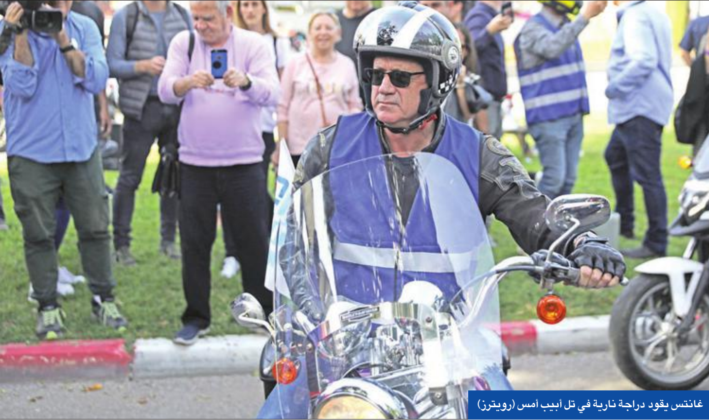
غانتس يقود دراجة نارية في تل أبيب أمس

وأضاف وسط ضحك من الحاضرين «قلت أيها الزملاء أسوأ لي معروف». حدثوني قليلاً عن التاريخ بشكل سريع، تعرفون لدي أمور كثيرة أعمل بشأنها: الصين وكوريا الشمالية». وقيل ساعات من الانتخابات، أعلن مصدر عسكري إسرائيلي أن إطلاق صواريخ من قطاع غزة على الداخل الإسرائيلي اليوم «خيار يؤخذ بعين الاعتبار». وذكر الموقع الإسرائيلي العبري «0404»، أمس الأول، أن «حماس والجهد وغيرها من المنظمات الفلسطينية في غزة مهتمة بالإطاحة بحكومة نتنياهو، وستحاول التآثر على الناخب عبر إطلاق صواريخ وقذائف على الداخل الإسرائيلي».