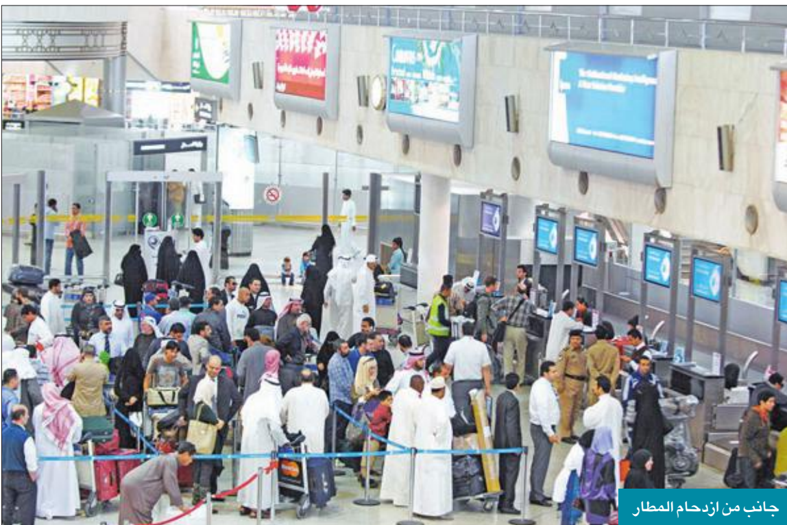
جانب من ازدحام المطار

سلبية على أصحاب المكاتب، فانا استقدم شهرياً من 150 إلى 160 عاملاً، وكل واحد أدفع مقابل خروجه من المطار 5 دقائق، وهذا مبلغ كبير جداً يتجاوز 750 ديناراً، وهو يتجاوز إيجار المكتب، بمعنى أنني ملزم بدفع أكثر من 10 آلاف دينار سنوياً للشركة فقط، مقابل رسوم تسلم العمالة، إضافة إلى ساعات الانتظار الطويلة التي يقضيها المندوب في مواقف المطار بشكل يومي، وهذا الأمر ينعكس على تكاليف العمالة المنزلية، علماً بأن الدولة لديها اتفاقات مع دول عدة من بينها الفلبين، من ضمن اشتراطاتها تخفيض تكاليف الاستقدام، فكيف تخفض هذه التكاليف وفي المقابل تزيد الرسوم على أصحاب المكاتب؟! وأشار إلى أن زيادة الرسوم يفرض أن تكون مقابل خدمات مميزة، كأن تقوم الشركة بإحضار العامل إلى المكتب، هنا يكون المبلغ مستحقاً، لكن أن يتم زيادة الرسوم من أجل الزيادة فهذا الأمر غير مقبول، فالشركة تحصل مبالغ طائلة من خلال دخول الآلاف العمالة إلى البلاد سنوياً مقابل خدمة تتمثل في تسليمهم إلى مندوبي المكاتب فقط، متسائلاً: لماذا لا يكون هذا المبلغ إيراداً للدولة على كل مجموعة من العمالة الخاصة بكل مكتب؟! وقال: نتمنى من "الطيران المدني" الالتزام بتوجيهات الدولة في خفض أسعار استخدام