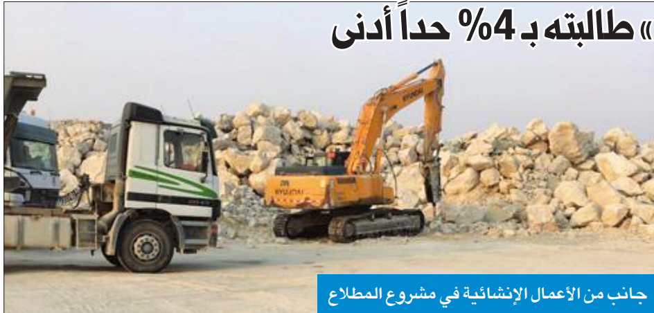
جانب من الأعمال الإنشائية في مشروع المطلاع

أنجز 3% في مارس... و«السكنية» طالبت به 4% حداً أدنى