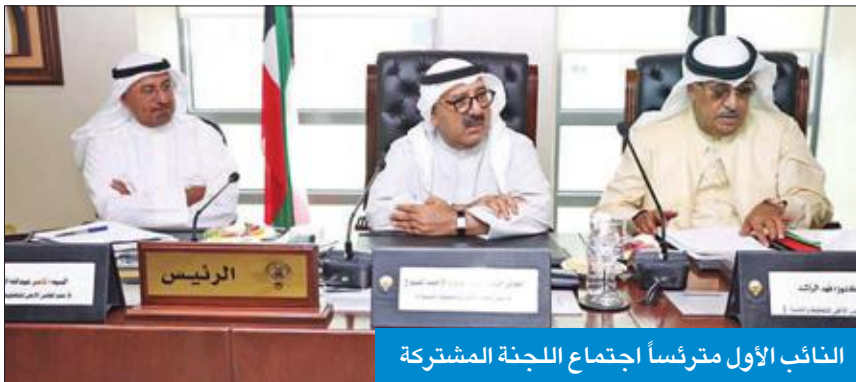
النائب الأول مترأساً اجتماع اللجنة المشتركة

إلى اللجنة المشتركة، مبيئة أن الاجتماع بحث الاستراتيجية، ورفع التوصيات بشأنها، وأشارت إلى أن الاجتماع استعرض مكونات استراتيجية الكويت لأمن الطاقة المستدامة في ظل تقلبات أسعار النفط والتغيرات العالمية في صناعات الطاقة النظيفة المتجددة.