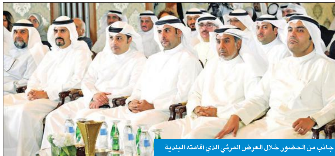
جانب من الحضور خلال العرض المرئي الذي أقامته البلدية

ولفت إلى أن 85 في المئة من معاملات البلدية ستكون إلكترونية مع انتهاء المرحلة الثانية، مؤكداً أنه في المرحلة الثالثة ستكون هناك أماكن محددة لإصدار التراخيص، سواء في الجمعيات أو المولات أو غيرها، حيث إننا سنقضي على مراجعة المواطن والمقيم للبلدية لإنجاز كل المعاملات. وأشار إلى أن جميع هذه