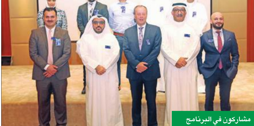
مشاركون في البرنامج

الغقلة النوعية التي يطمح إليها «وربة»، خصوصاً ضمن الاتجاه التكنولوجي، الذي يداب البنك على تعزيزه لتسهيل المعاملات البنكية للعملاء خلال الفترة المقبلة. وأضاف الغانم أن برنامج «رواد» يساهم في رفع الروح المهنية للموظفين المشاركين فيه، ويحفزهم على الإبداع، وينمي روح الولاء لديهم عندما يرون مدى دعم الإدارة التنفيذية لهم، وأن أفكارهم وجهودهم تؤخذ على محمل الجد، وأن البنك مستعد للاستثمار في سبيل تحقيق هذه الأفكار، وتحولها إلى واقع.