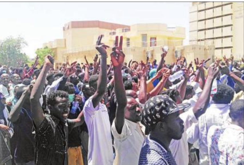
سودانيون يتظاهرون لليوم الثاني على التوالي أمام مقر هيئة الأركان في الخرطوم أمس (أ ف ب)

المظاهرات التي اندلعت في الخرطوم، أمس الأول، وطالب إسماعيل القوى السياسية للمحافضة على دعاء الشعب السوداني والتقليل من حدة الاستقطاب. وبينما دعت السفارة السودانية في الخرطوم، أمس، مواطنيها إلى الابتعاد عن أماكن التظاهرات، قال دبلوماسي أوروبي فضل عدم كشف اسمه إن «المشاركة في تظاهرات السبت كانت مؤثرة جداً، وهذا يُعزِّز الضغط