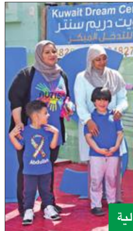
موظفو البنك مع طلاب وموظفات مركز التوحد أثناء الاحتفالية