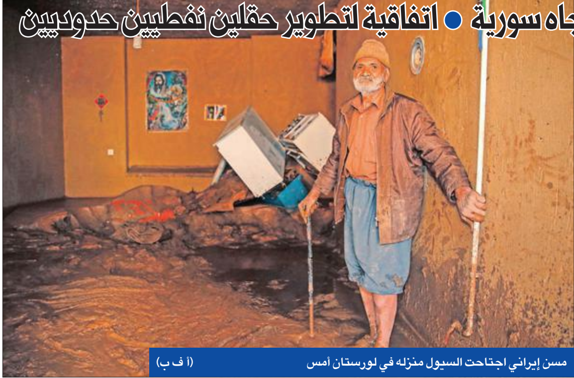
مسكن إيراني احتاحت السيول منزله في لورستان أمس

● باقري ينشد تأمين ديالى لفتح الطريق باتجاه سورية ● اتفاقية لتطوير حقائب نفطيين حدوديين