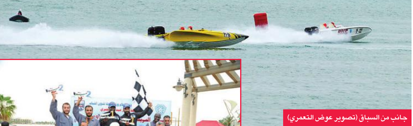
جانب من السباق

في الجولة الثانية من سباق الكويت للزوارق السريعة