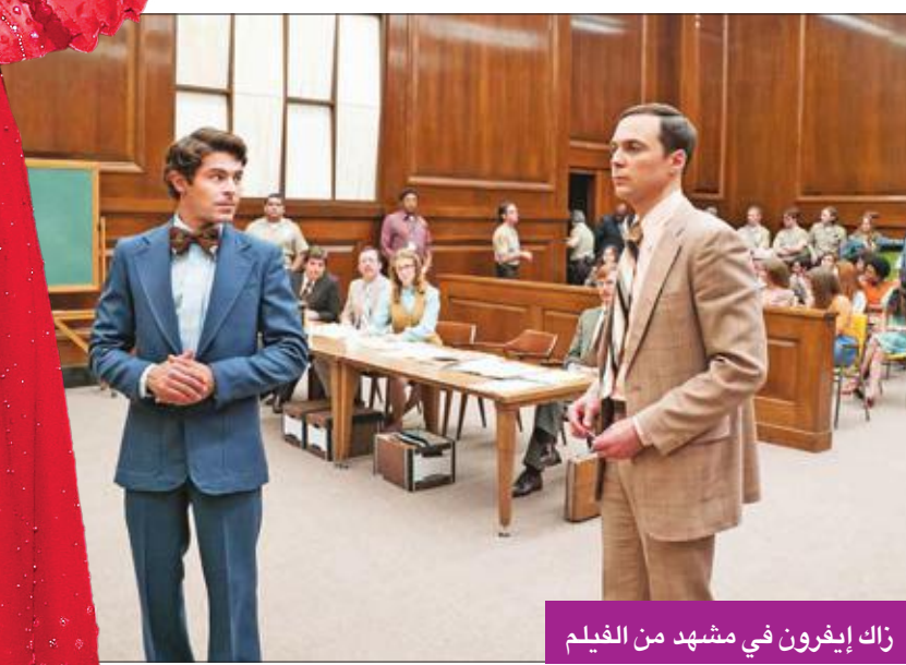
زاك إيفرون في مشهد من الفيلم

لقاء مختلف يجمع بين النجم الأميركي زاك إيفرون والبريطانية الحسنة ليلي كولينز في فيلم الدراما والجريمة «Extremely Wicked, Shockingly Evil, and Vile» الذي يراهن عليه الثنائي مع تميز فكرته ودفقة تنفيذية ومشاركة