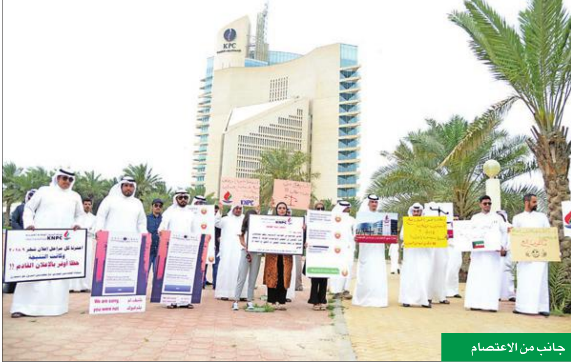
جانب من الاعتصام

بمهندسي البترول الذين تم تعيينهم أخيراً، وقد اجتازنا كل الاختبارات المطلوبة، لافتاً إلى أن هناك أكثر من 150 مهندسا تخصص ميكانيك ينتظرون دورهم في التعيينات. بدوره، قال ولي أمر أحد المهندسين المعصمين إنه يوجد هناك المئات من الوافدين على سلم درجات التعيينات في القطاع النفطي، ولا توجد أي درجات للكويتيين من خريجي الهندسة رغم تعليمهم الراقي في أكبر جامعات العالم. وأضاف أن هناك أكثر من 900 مهندس ميكانيك تقدموا للاختبارات، واجتاز منهم 230 تلك الاختبارات، وتم تعيين 60 فقط منهم، تم رفعهم فيما بعد إلى 88 شاغراً.