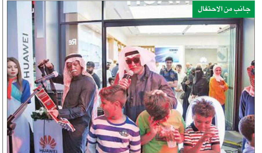
جانب من الاحتفال