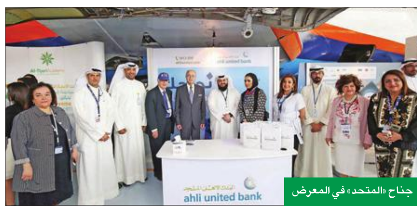
جناح «المتحد» في المعرض

في إطار استراتيجيته الهادفة لدعم الكفاءات الشابة في الكويت، يشارك البنك الأهلي المتحد في المعرض الوظيفي السنوي الذي تنظمه الكلية الأسترالية بالكويت، أمس واليوم، في مجمع الطيران بالكلية.