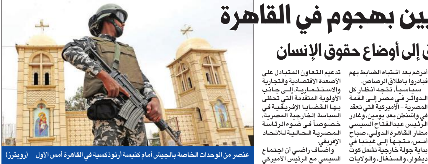
عنصر من الوحدات الخاصة بالجيش امام كنيسة أرثوذكسية في القاهرة أمس الأول