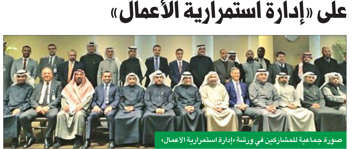
صورة جماعية للمشاركين في ورشة «إدارة استمرارية الأعمال»

ولفت البنداري إلى أنه تم تقسيم المشاركين في الورشة إلى 3 مستويات ادارية، المستوى الأول الإدارة التنفيذية، يليه المستوى الإداري الأوسط الذي يتلقى التعليمات والقرارات من الإدارة التنفيذية، ثم يوصلها إلى المستوى الثالث، الذي يحتوي على مشغلين ومنفذين للعمليات، وتم تنفيذ تجربة سيناريوهات تدريب افتراضية، أثبتت نجاح وقدرة وكفاءة الإدارات المشاركة وجاهزية «بيتك» وإمكاناته لإدارة استمرارية الأعمال، وأضافت الورشة للمشاركين مهارات وخبرات جديدة، بما يتوافق مع رؤية واستراتيجية «بيتك» والمعايير والمقاييس العالمية في مجال إدارة استمرارية الأعمال.