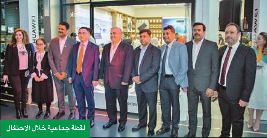
لقطة جماعية خلال الاحتفال