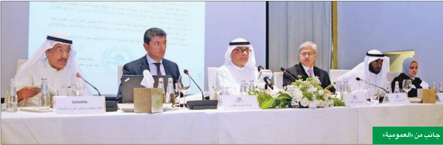
جانب من «العمومية»

«عمومية التجارية» وزعت 5% أرباحاً نقدية وأسهم منحة بنسبة 2% من رأس المال