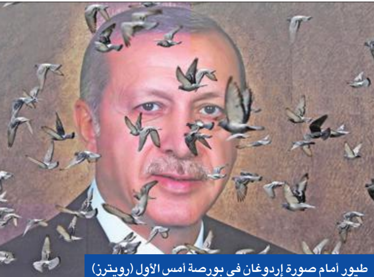
طور أمام صورة إردوغان في بورصة أمس الأول

إمام أوغلو: يحاول كسب الوقت لإخفاء أدلة عمليات اختلاس