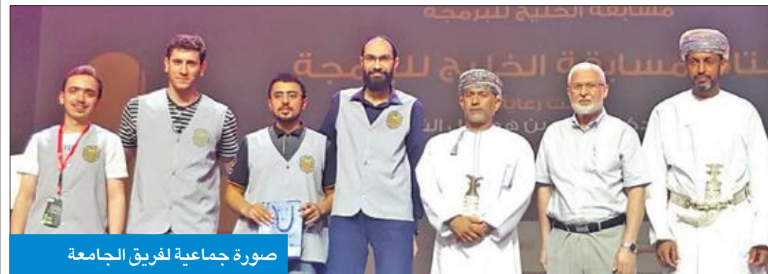
صورة جماعية لفريق الجامعة