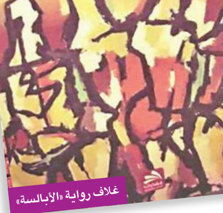
غلاف رواية «الأبالسة»

جوانب التصوير وجمالياته من طرف طلاب في جامعة "مسيلة".