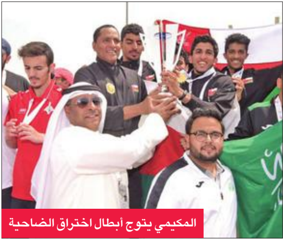
المكيمة يتوج أبطال اختراق الضاحية

في اليوم الخامس للدورة الرياضية الثامنة للجامعات