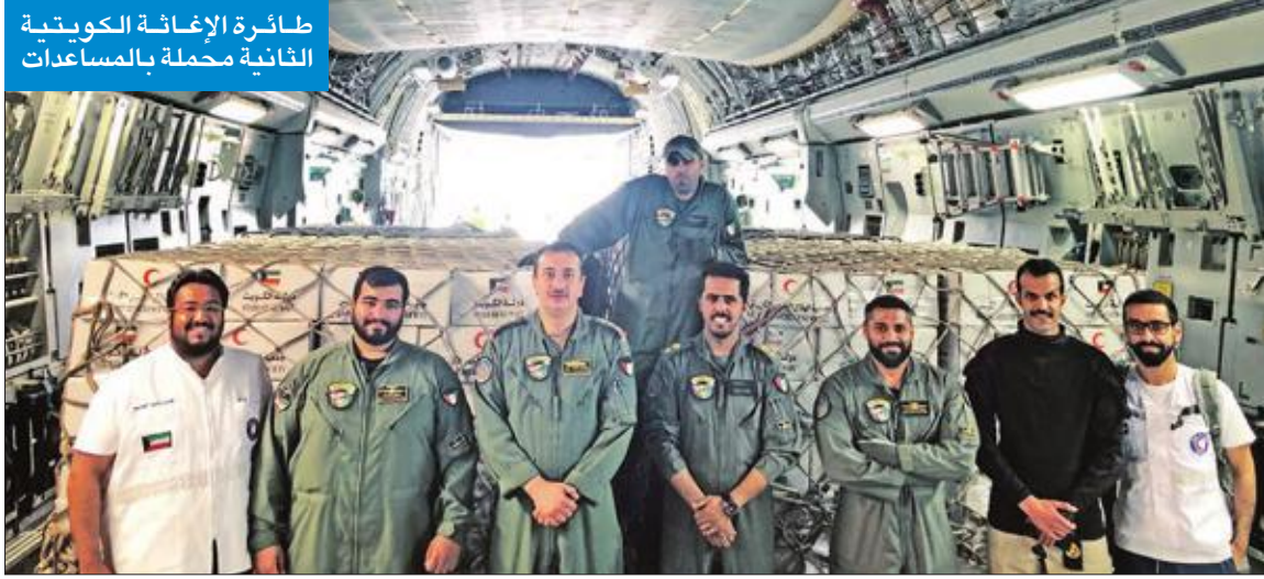
طائرة الإغاثة الكويتية الثانية محملة بالمساعدات

● السائر: مواقف الكويت شكلت نموذجا يحتذى في العمل الإنساني والدعم الإغاثي