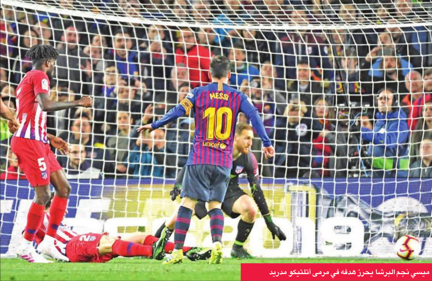
ميسي نجم البرشا يحرز هدفه في مرمى أتلتيكو مدريد

المباريات الـ17 المتتالية التي خاضها فالنسيا دون هزيمة في مختلف المسابقات (أطول سلسلة في الدوريات الخمس الكبرى)، بفوزه بهدفين سجلهما راؤول دي توماس (32) وماريو سواريز (1+90) في مباراة كانت لتتخبر مجرياتها لو نجح داني باريوخو في ترجمة ركلة جزاء للضيوف في الدقيقة 28.