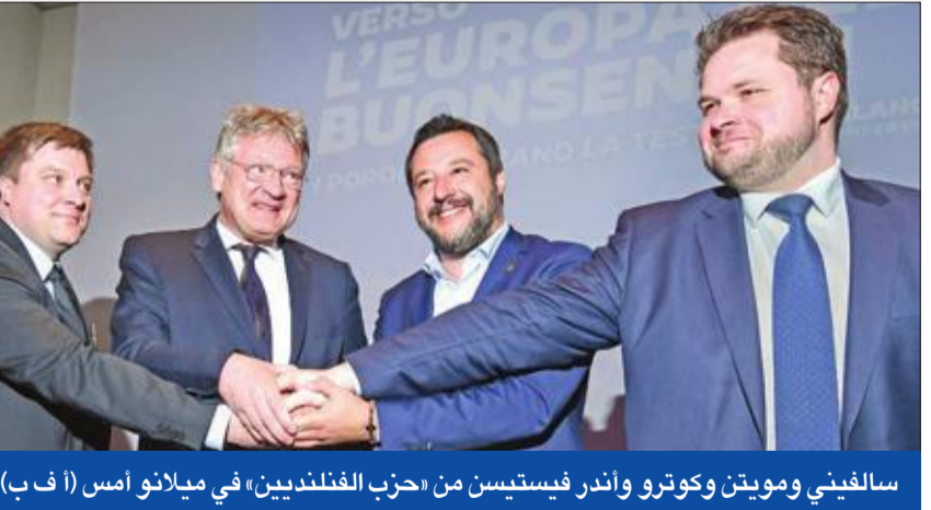
سالفيني ومويتن وكوترو وأندر فيستيس من «حزب الفلنديين» في ميلانو أمس

أعلن حزب البديل من أجل ألمانيا (AFD) اليميني المتطرف، وحزب الرابطة (ليغا) الإيطالي الحاكم، أمس، تشكيل تحالف جديد بينهما في البرلمان الأوروبي، إلى جانب عدد من الأحزاب اليمينية المتشككة تجاه الاتحاد الأوروبي، بهدف تولى السياسة القومية زمام السلطة في أوروبا، والفوز في انتخابات البرلمان الأوروبي المقررة مايو وفي مؤتمر صحفي عقده في ميلانو مع زعيم «الرابطة» نائب رئيس الوزراء الإيطالي ماتيو سالفيني، وحضره أيضاً ممثلون من حزب الشعب الديمقراطي وحزب الفلنديين، قال زعيم AFD يورغ مويتن إنه سيطلق على الكيان الجديد «تحالف الشعوب والدول الأوروبي». وأوضح أن «التحالف يرحب بجميع الأحزاب التي تعد صفات مثل المحافظ والليبرالي والوطني بالنسبة لها أكثر من مجرد كلمات فارغة، لكن ليس مرحباً بالاشتراكيين والشيوعيين والفاشيين في مجال البيئة والمتطرفين، سواء كانوا من اليسار أو اليمين». من ناحية، انتقد سالفيني، رجل إيغاليا القوي، الاتحاد الأوروبي، وقال إنه «خان مبادئه الرئيسية، ويبدل المزيد لإعانة مواطنيه بدلاً من مساعدتهم،