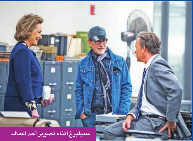
سيلبرغ أثناء تصوير أحد أعماله

عظيمة، وكلمات ضمن أعظم ما كتب على الإطلاق. وأضاف أنه يمكن القول إنني مهتم جداً بالقصة، وهي في عملي ضمن مشاريع مقبلة».