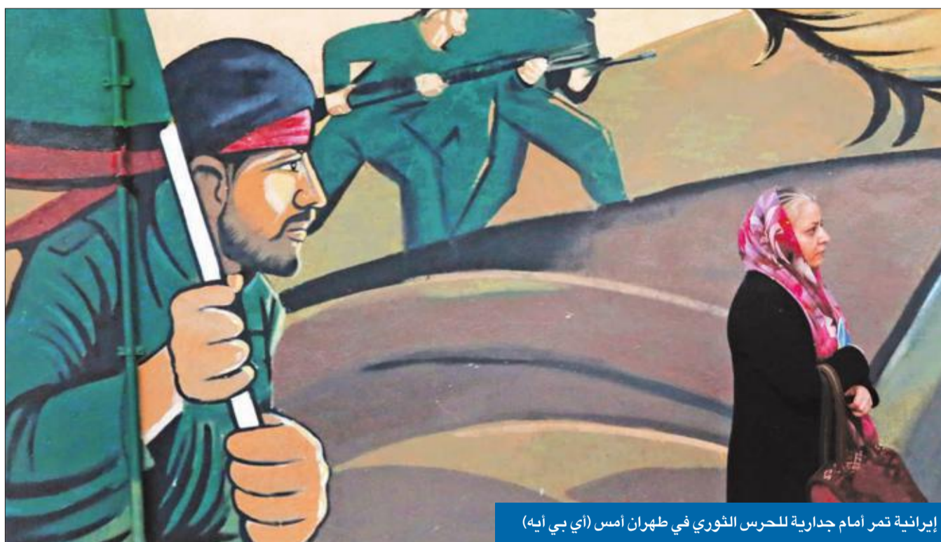
إيرانية تمر أمام جدارية للحرس الثوري في طهران أمس

خطوة غير مسبوقه تسهّل على البيت الأبيض ضربه عسكرياً دون موافقة الكونغرس