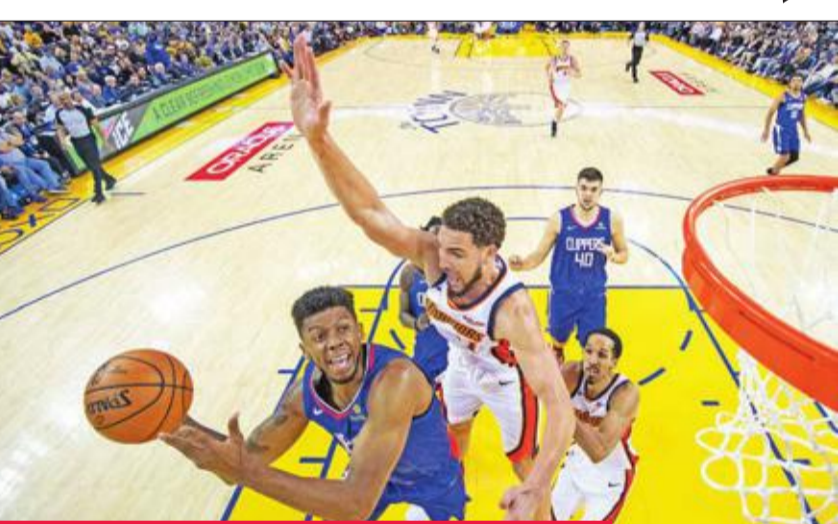
جانب من مباراة غولدن ستايت ووريزر ولوس أنجلوس كليبرز

وحذا أورلاندو ماجيك حذو بروكلين وضمن تأهله للمرة الأولى منذ موسم 2011-2012 بفوزه على مضيفه بوسطن سلتيكس، رابع المنطقة، 116-108.