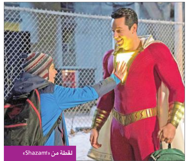
لقطة من «Shazam!»

وجاء في المركز السابع «Five Feet Apart» بـ 3.7 ملايين. وفي المركز الثامن «Unplanned» بـ 3.2 ملايين دولار. وفي المركز التاسع جاء «Wonder Park» بمليوني دولار. وأخيراً المركز العاشر «How to Train Your Dragon: The Hidden World» بمليون دولار.