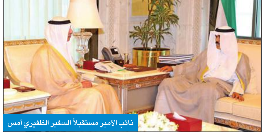
نائب الأمير مستقبلاً السفير الظفيري أمس

استقبل سمو نائب الأمير ولي العهد الشيخ نواف الأحمد، في قصر السيف، أمس، سفير الكويت لدى إيران مجدي الظفيري.