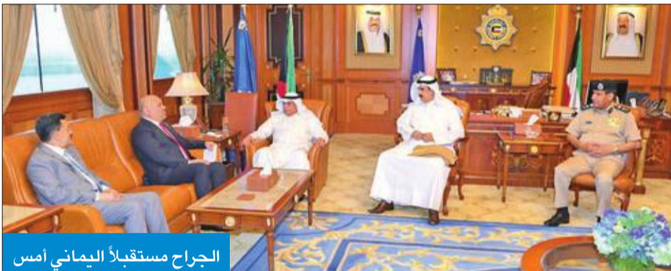
الجراح مستقبلاً اليمني أمس

بحث نائب رئيس مجلس الوزراء وزير الداخلية الشيخ خالد الجراح مع وزير خارجية اليمن خالد اليمني، عدداً من الموضوعات الأمنية ذات الاهتمام المشترك، وسبل تعزيزها وتطويرها.