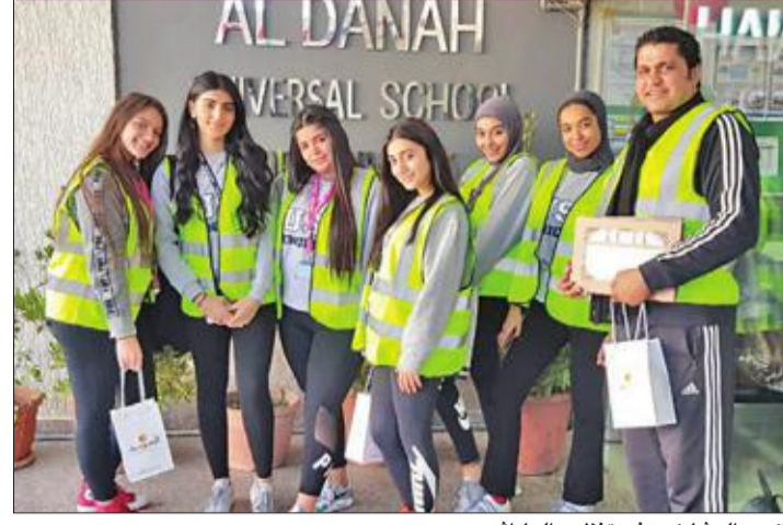
تكريم المشاركين في تنظيم الماراثون