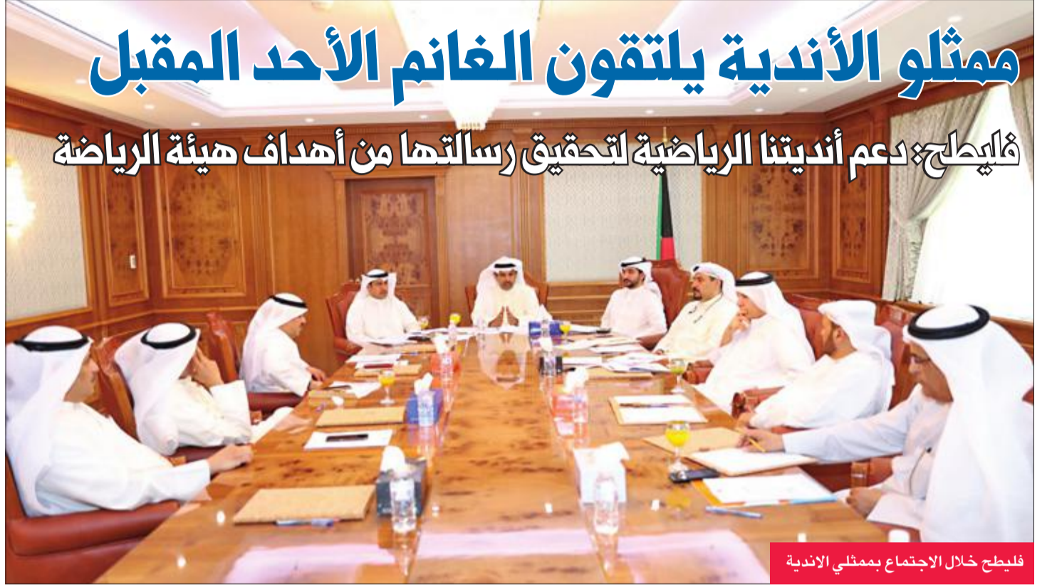
فليطخ خلال الاجتماع بممثلي الأندية