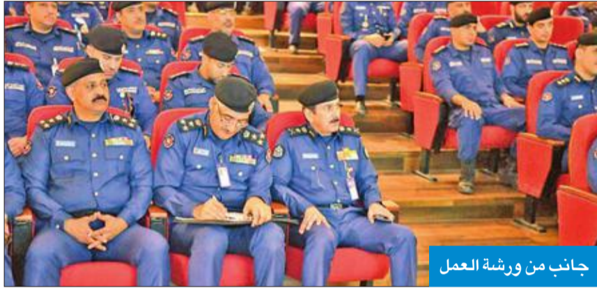
جانب من ورشة العمل

الرشيدوي إيجازاً عن الأسلوب القيادي الذي تم تطبيقه للسيطرة على الحريق في موقع الحادث، وطرق تقسيم الحادث إلى قطاعات مختلفة للحد من انتشار الحريق، إضافة إلى توضيح الإيجابيات والسلبيات الخاصة بعملية مكافحة الحريق وإخماده بوقت قياسي.