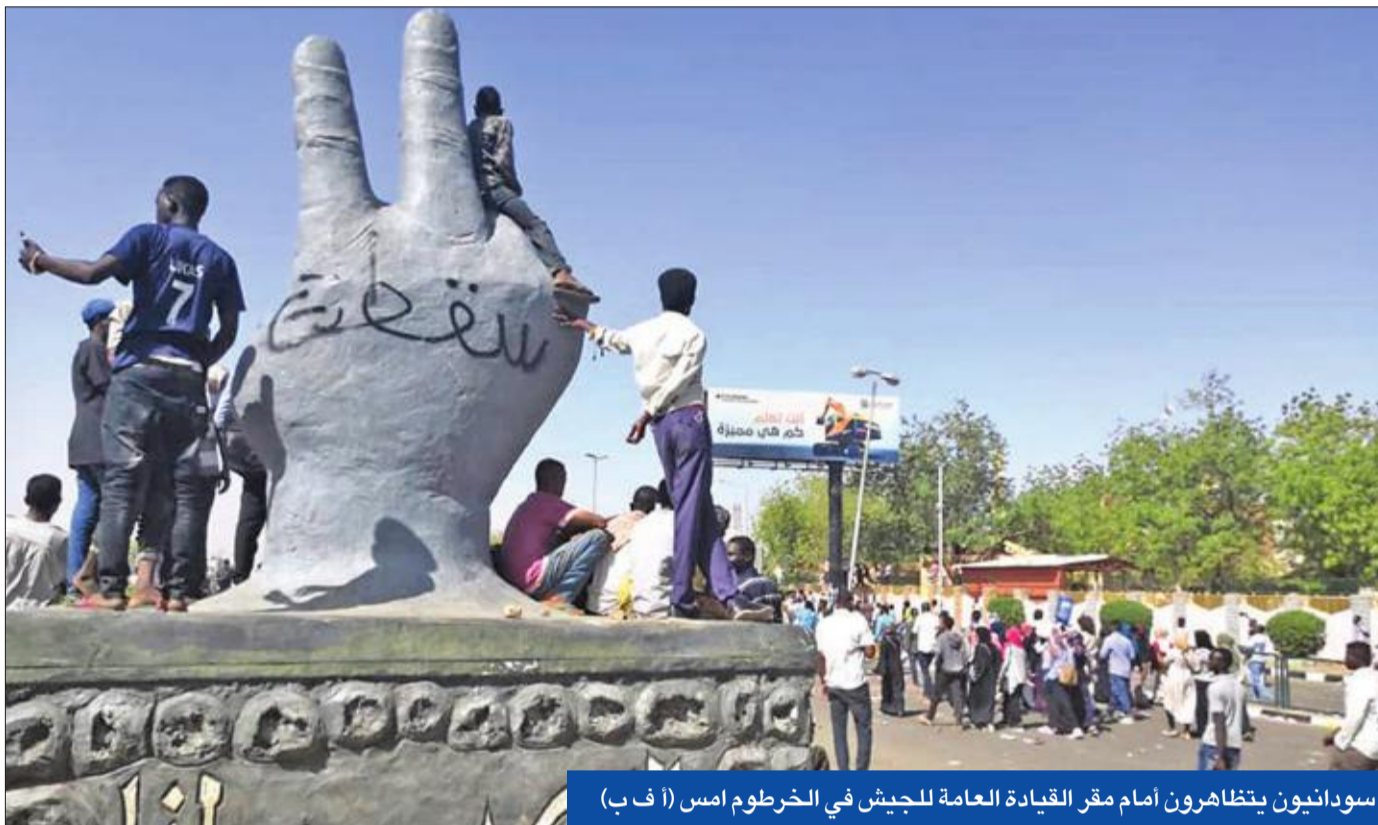
سودانيون يتظاهرون أمام مقر القيادة العامة للجيش في الخرطوم امس

تقارير عن تدخل الجنود لحماية المتظاهرين وتصديهم لمحاولات الشرطة فض اعتصام «القيادة العامة»