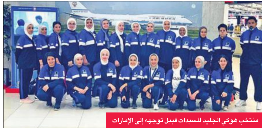
منتخب هوكي الجليد للسيدات قبيل توجهه إلى الإمارات

توجه وفد منتخب الكويت لهوكي الجليد للسيدات، أمس، إلى أبوظبي، للمشاركة في تصفيات كأس العالم للعبة التي تستضيفها الإمارات في 14 الجاري، بمشاركة تسعة منتخبات، وتستمر أسبوعاً.