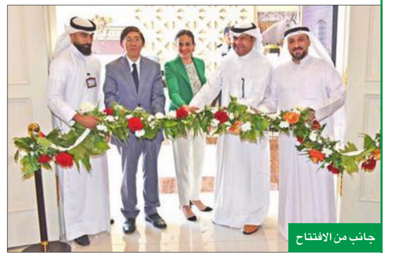
جانب من الافتتاح