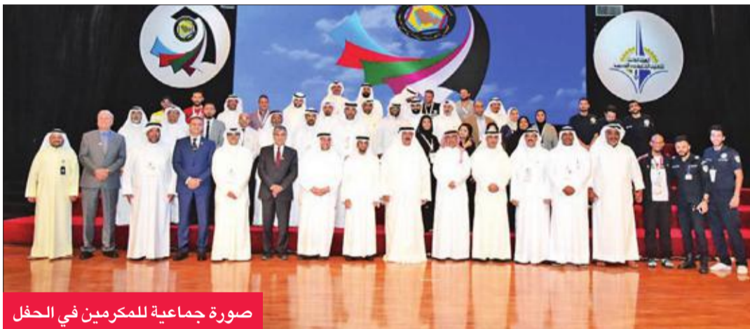
صورة جماعية للمكرميين في الحفل

فريق «التطبيقي» على جامعة الملك عبد العزيز صفر/3، وفريق جامعة قطر على جامعة الإمارات 3/1، واليوم تختتم مباريات القدم والطائرة والألعاب الفردية.