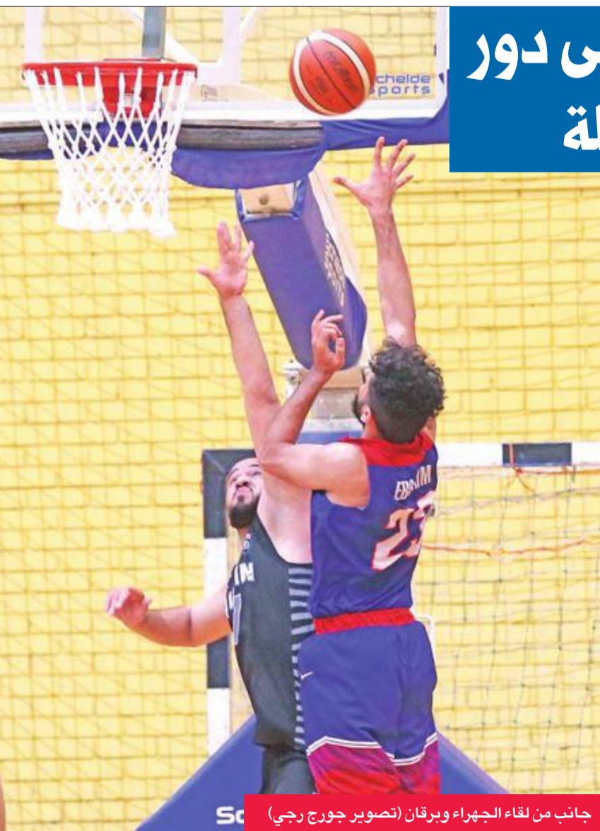
جانب من لقاء الجهراء وبرقان