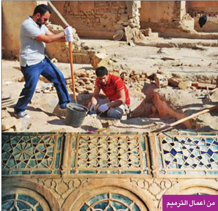
من أعمال الترميم

يقع قصر الشيخ خزعل في منطقة دسمان بمدينة الكويت، وبناء الشيخ خزعل الكعبي أمير المحمرة عام 1916، بعد أن أهداه الشيخ مبارك الصباح قطعة أرض فضاء في منطقة دسمان. واستلمت القصر في ثلاثينيات القرن الماضي من أحمد محمد الغانم، في حين قام الشيخ عبدالله الجابر بشراء ديوان خزعل.