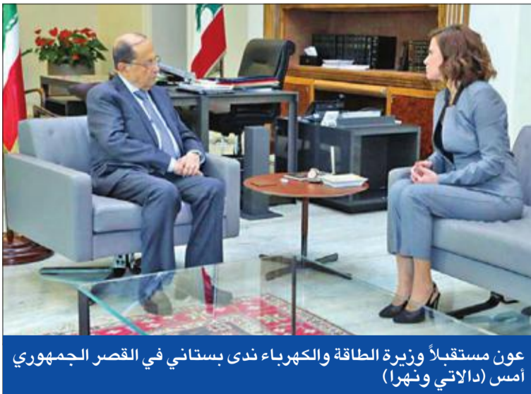
عون مستقبلاً وزيرة الطاقة والكهرباء ندى بستاني في القصر الجمهوري أمس

الإعلام الابتعاد عن الإنارة والالتزام بأخلاقيات المهنة». كما صدر عن قاضي التحقيق الأول في جبل لبنان نقولا منصور، أمس، بيان قال فيه: «خلفاً لما تداوله وسائل الإعلام، يهمني توضيح أنني قاضي ينتمي إلى سلطة قضائية مستقلة تستمد قوتها من الشعب اللبناني فقط، وأنّ علاتي بالزملاء القضاة ممتازة، لا سيما مع مدعي عام جبل لبنان القاضي غادة عون ومع السلطة القضائية ككل، وأن عملنا ينطلق من مبدأ الحرص على تطبيق القانون كل من جهته، وإذا حصل أي خلاف في وجهات النظر فإننا نبدل على الاستقلالية في عمل القضاة، خلافاً لرغبة بعض المنتفعين الموجهين بأهداف سياسية بعيدة كل البعد من أجواء العمل لدى المحاكم».