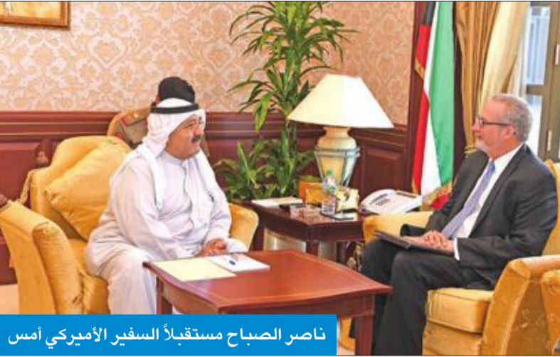
ناصر الصباح مستقبلاً السفير الأميركي أمس

استقبل رئيس مجلس الوزراء بالإمارة وزير الدفاع الشيخ ناصر الصباح، أمس، سفير الولايات المتحدة الأميركية لدى الكويت لورانس سلفرمان، وتم خلال اللقاء مناقشة أهم الأمور والمواضيع ذات الاهتمام المشترك ضمن محور الزيارة. وقد حضر اللقاء مساعد الملحق العسكري الأميركي لدى البلاد العقيد لامونت جوبيت. كما استقبل مستشار الدفاع الأول لشؤون الشرق الأوسط للمملكة المتحدة الصديقة الفريق السير جون لورييمر، يرافقه سفير المملكة المتحدة لدى البلاد مايكل دافننورت، وذلك بمناسبة زيارته للبلاد. وتم خلال اللقاء مناقشة أهم