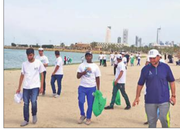
جانب من عملية تنظيف الشواطئ