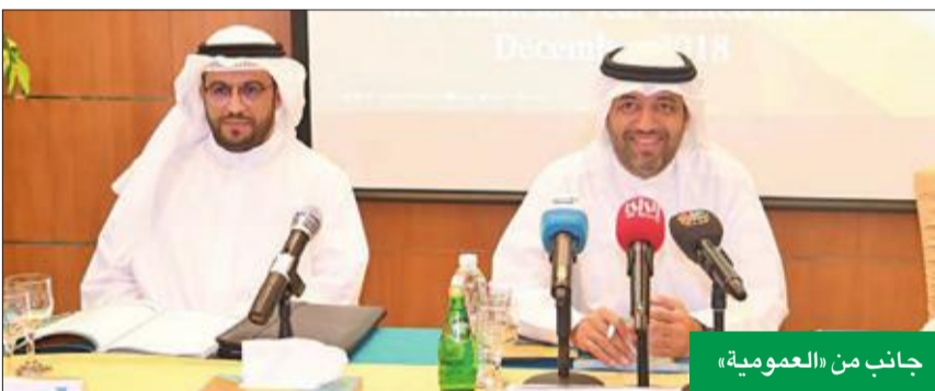
جانب من «العمومية»

وفند المخاطر التي يشهدها السوق، مشيراً إلى ضرورة تحديد نوع المخاطر التي توجد بالسوق الكويتي وحاجته إلى تغطية التأمين لها، لأنها تشكل مخاطر يجب أن تغطي بالقيمة العادلة، ليكون هناك دور لشركات إعادة التأمين بالسوق، وهو ما يتطلب ضرورة تسخير الجهود لتنظيم سوق التأمين في الكويت آسوة بالأسواق المجاورة، وتمنى أن يتم إنشاء هيئة للتأمين في القريب.