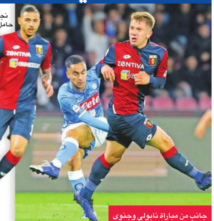
جانب من مباراة نابولي وجنوى

ولم يقع نابولي وصيف الموسم الماضي في فخ ضيفه،