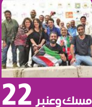
مسك وعنبر 22

«عاسك من عواده» دراما إذاعية تجمع محمد المنصور وهيفاء عادل وجاسم النبهان في رمضان.