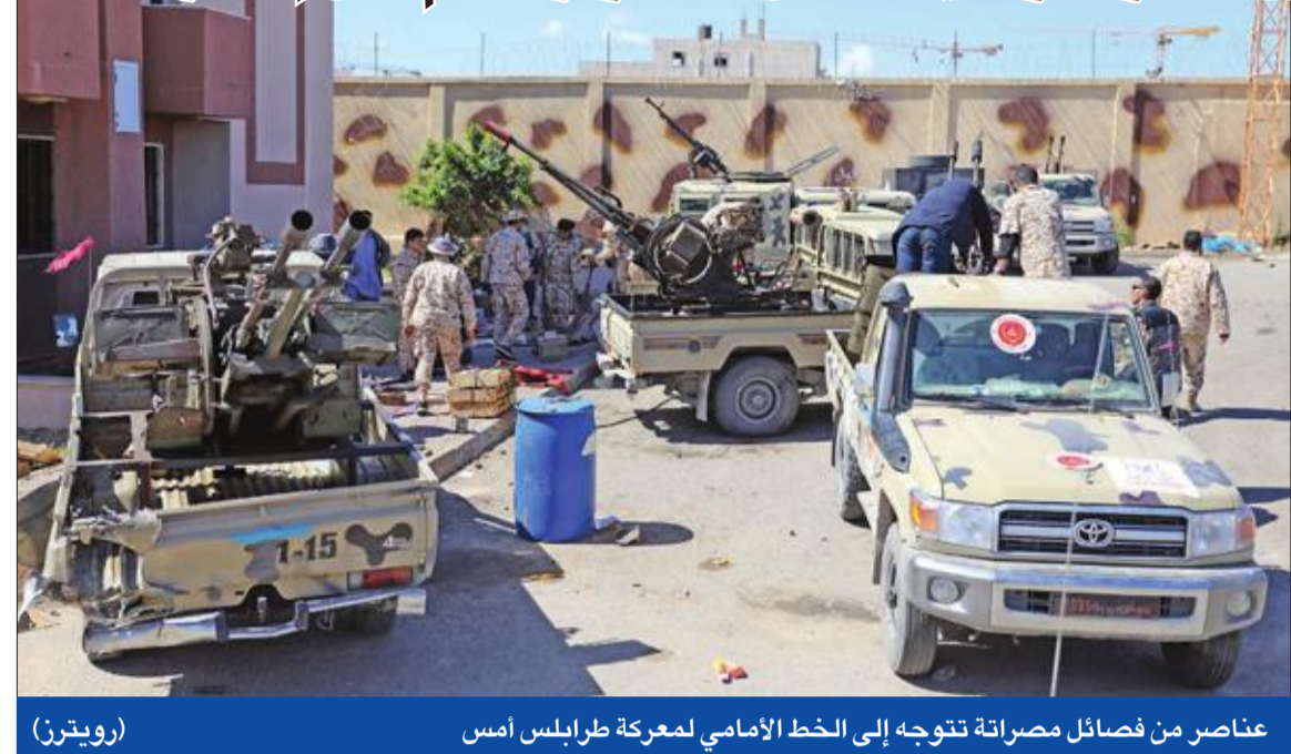
عناصر من فصائل مصراة تتوجه إلى الخط الامامي لمعركة طرابلس أمس

● قتل ونار حون ونائب السراج يدعم حكومة الشرق ● موسكو تحيد مجلس الأمن وفرنسا لم تتلق إشعاراً مسبقاً