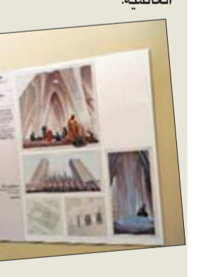
جانب من المعارض

وذكرت أن المعرض، الذي تستمر فعالياته بمرکز الأبريكاني الثقافي حتى 25 أبريل الجاري، يعد فرصة لتكثيف الطلبة على تقديم مشروعاتهم المستقبلية ليكون لهم الدور الفاعل في المسابقات العالمية.