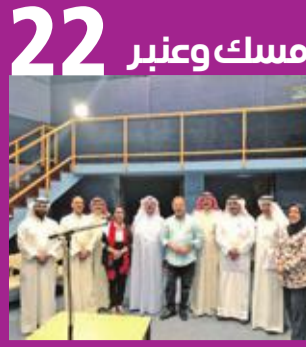
مسك وعنبر 22

تحدثت الفنانة سوزان نجم الدين عن دورها في مسلسل «ابن أصول» وكواليسه، وعودتها للسنيما.