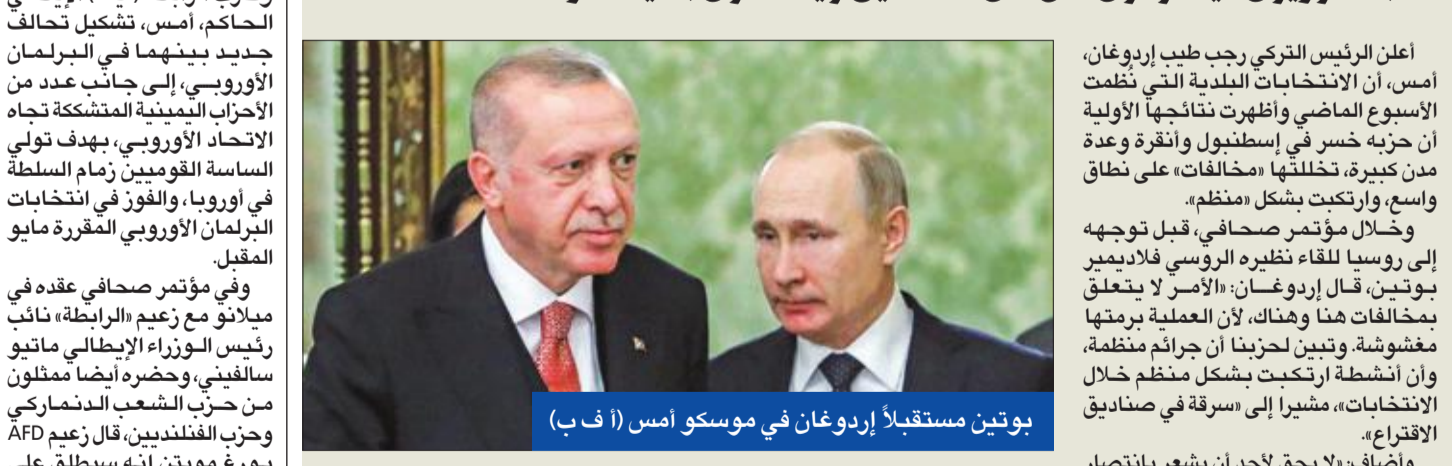
بوتين مستقبلاً إردوغان في موسكو أمس

«الجمهوريون» يتخفون على أمن الصناديق ويتسلمون بلدية أنقرة