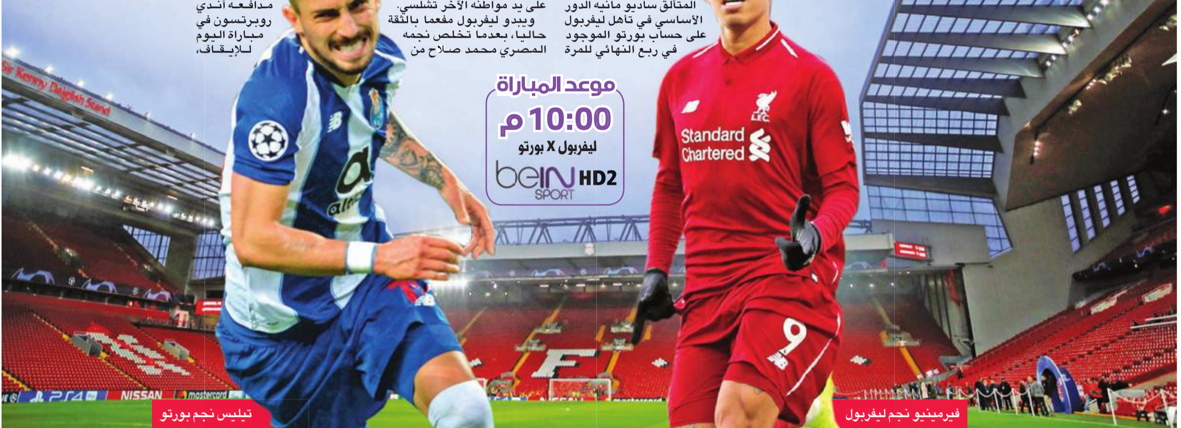
تيليس نجم بورتو

بأمل ليفربول أن يكرر التاريخ نفسه، وأن يطيح بفرق بورتو البرتغالي من دور الثمانية. مثلما أطاح به من دور الـ16 في الموسم الماضي، عندما يستقبله اليوم في ذهاب ربع نهائي مسابقة دوري أبطال أوروبا.