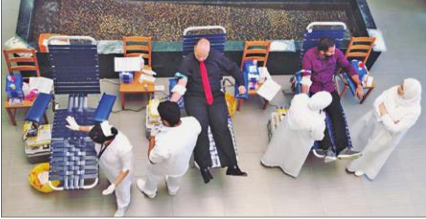
متبرعون خلال الحملة

نظمت الشركة الكويتية لبناء المعامل والمقاولات (المعامل) حملة للتبرع بالدم في مقرها الرئيسي بالشويخ، وذلك بالتعاون والتنسيق مع بنك الدم المركزي.