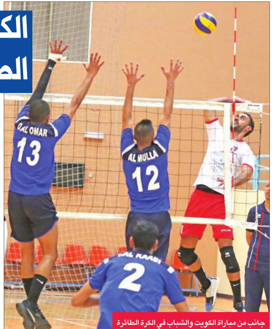
جانب من مباراة الكويت والشباب في الكرة الطائرة

وسيخوض الأبيض في معسكره ثلاث مباريات تجريبية مع فرق الصف الأول في الدوري القطري، كما ستعمل إدارة الفريق على حسم ملف المحترفين الأجانب الذين سيستعين بهم في البطولة الآسيوية، وسيغادر الفريق من قطر 16 الجاري متجهاً إلى الصين تايبيه للمشاركة في البطولة.