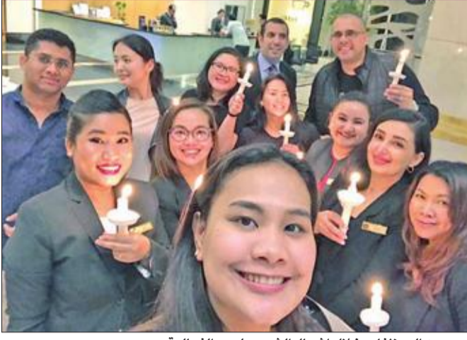
عدد من الموظفين خلال إشعال الشموع لدعم الفعالية

شارك فندق ومركز مؤتمرات مليونيوم الكويت ملايين الأفراد والمنظمات حول العالم في فعالية ساعة الأرض، بهدف زيادة التوعية بأهمية حماية البيئة، واتخاذ المزيد من الإجراءات التي تخفف من وتيرة التغير المناخي. ودعم الفندق المبادرة في اليوم الذي يوافق ساعة الأرض في مارس الماضي، الساعة 8:30 مساءً بالتوقيت المحلي، من خلال تنفيذ عدة إجراءات لتوفير الطاقة مدة 60 دقيقة، ضمنها إطفاء أضواء اللوحات الرئيسية المضيفة للفندق والإضاءة غير الأساسية بالمناطق المشتركة والمطاعم، وأتم إجراءاته بقطع التيار الكهربائي عن الأجهزة غير الأساسية في الفندق. وقال المدير العام للفندق أحمد الصيرفي: «مشاركتنا في فعالية ساعة الأرض أحد الأساليب التي نبرز من خلالها التزامنا بتوفير الطاقة، فقد أن الأوان لاتخاذ إجراءات ضد التغير المناخي أكثر من أي وقت مضى. نفهم أثر أنشطتنا على البيئة، ونؤكد التزامنا المستمر بابتكار وسائل بديلة تخفف الأضرار البيئية، وتعزز ترشيد استهلاك الطاقة».