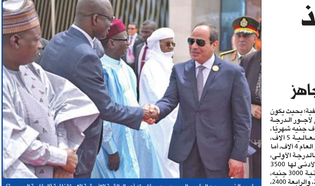
رئيس النيجر يودع الرئيس المصري بعد رئاسته أعمال القمة الإفريقية الاستثنائية