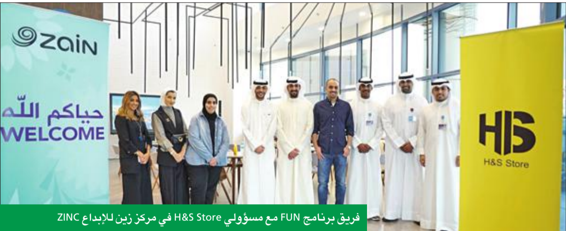
فريق برنامج FUN مع مسؤولي H&amp;S Store في مركز زين للإبداع ZINC

ينظمه برنامج شبكة شباب زين FUN في موسم العطلة