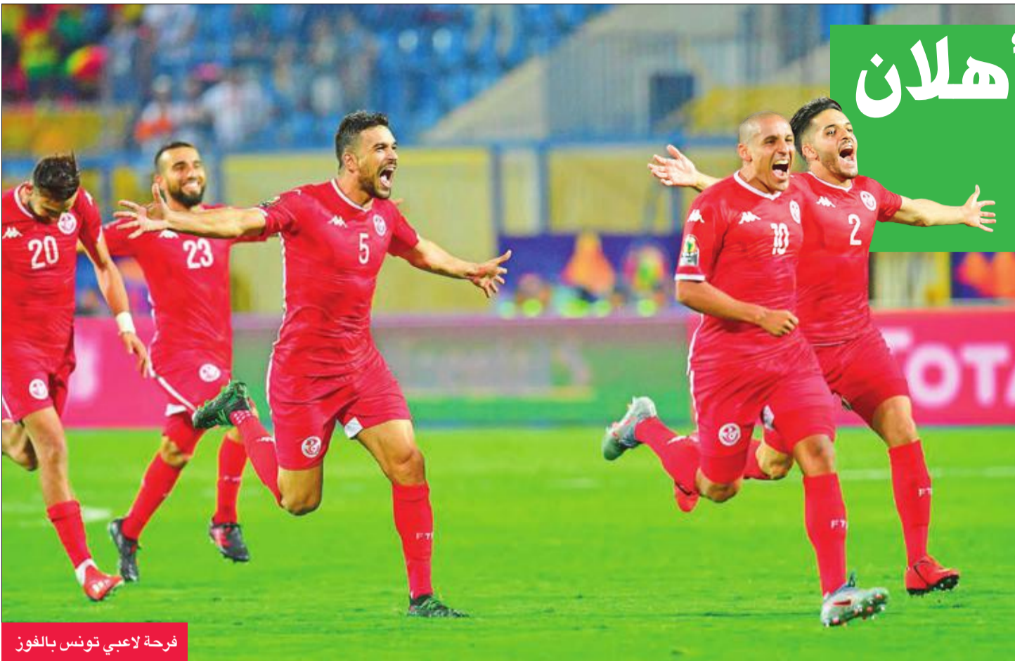
فرحة لاعبي تونس بالفوز