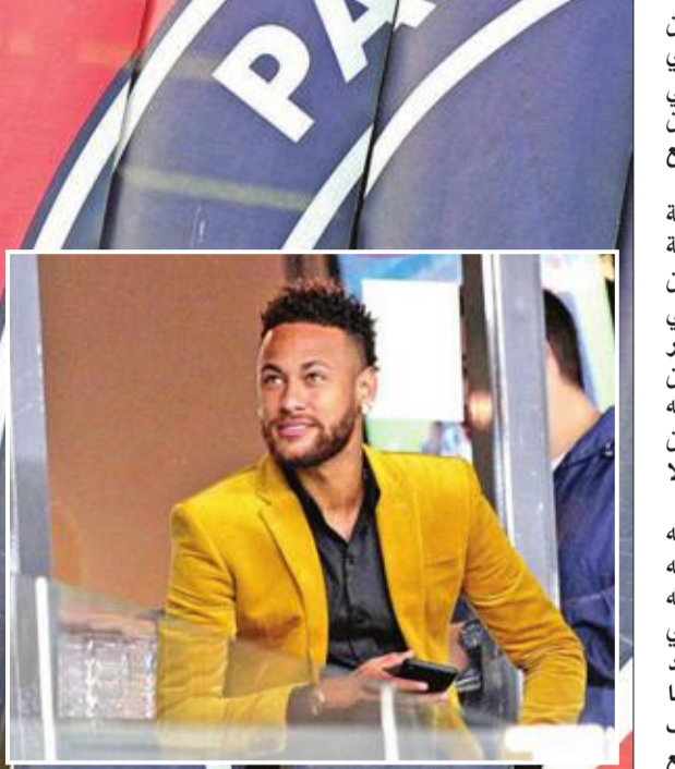
نيمار في باريس سان جرمان