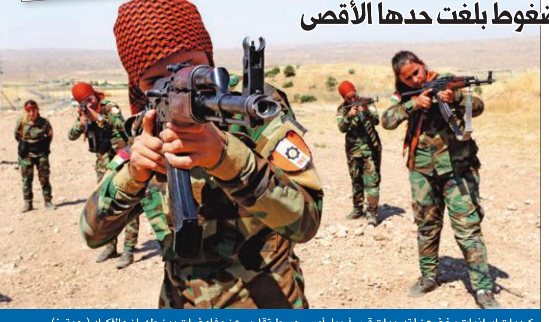
كرديات إيرانيات يخضعن لتدريبات قرب أربيل أمس، وسط تقارير عن مفاوضات بين طهران والأكرد

نتيها هو لإيران: أراضيك في مرمى مقاتلات F35 قائد «الحرس»: الضغوط بلغت حدها الأقصى