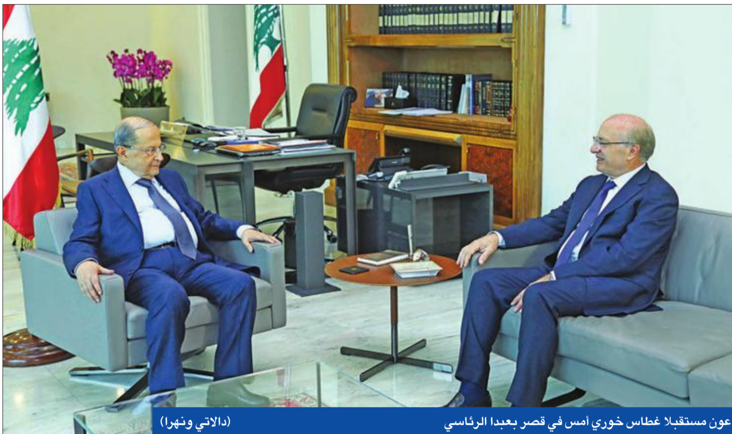
عون مستقبلاً غطاس خوري أمس في قصر بعبدا الرئاسي (الداخلي ونهرا)

في السياق، غرّد رئيس الحزب «الديمقراطي اللبناني» النائب طلال أرسلان على