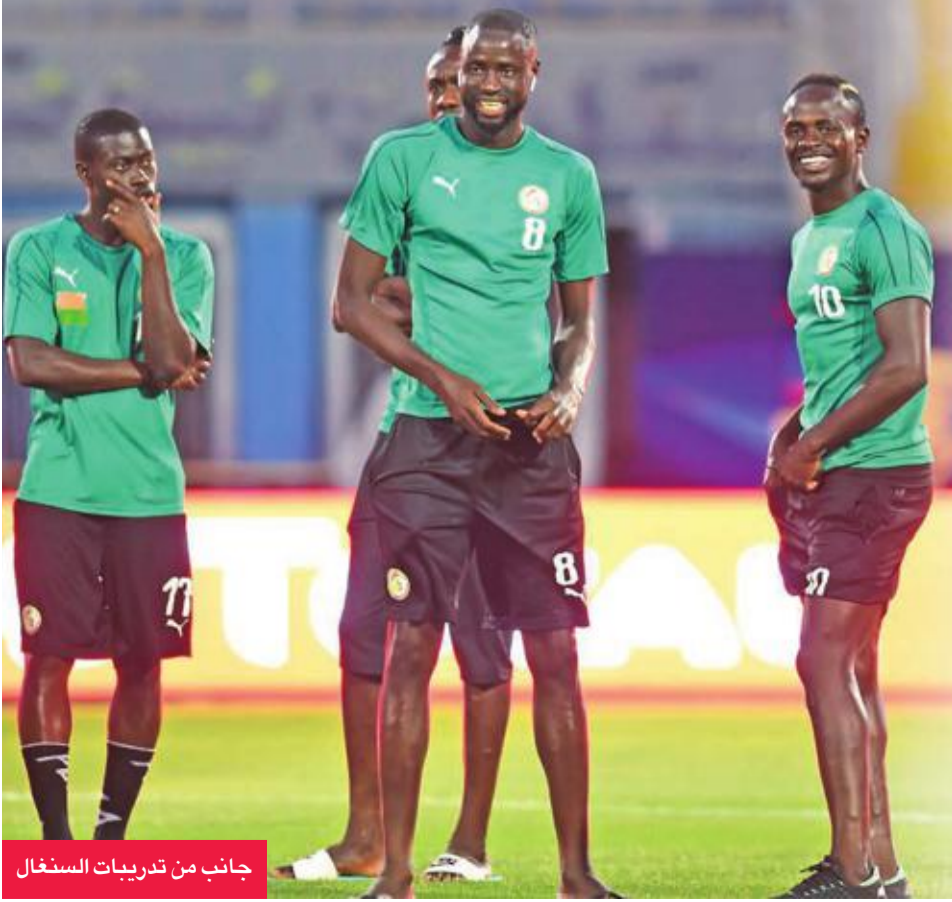
جانب من تدريبات السنغال

في المقابل، يتطلع منتخب بنين إلى مواصلة مفاجاته بالإطاحة بنظيره السنغالي وتقديم عرض مشرف أمامه الليلة. ولم يتذوق السنجاب مرارة الهزيمة في البطولة حتى الآن، بعدما حقق 3 تعادلات خلال مشواره في دور المجموعات، ثم تعادل في المواجهة الرابعة أمام المغرب، وصعد إلى دور الثمانية بالفوز بركلات الجزاء.