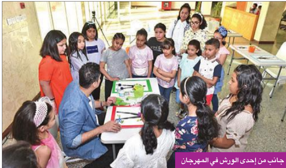
جانب من إحدى الورش في المهرجان

لفن العرائس في تونس، حسان السلامي، أن مسرح العرائس يلقي صدى كبيراً في العالم، وأنه في تونس لديهم تجربة مسرح العرائس قرابة 60 عاماً، وهذا المسرح يتصف بأنه متناقل ومتطور جداً. ووصف مسرح العرائس بأنه ينمي القدرات الذهنية والحسية للطفل، معرباً عن سعادته بزيارته