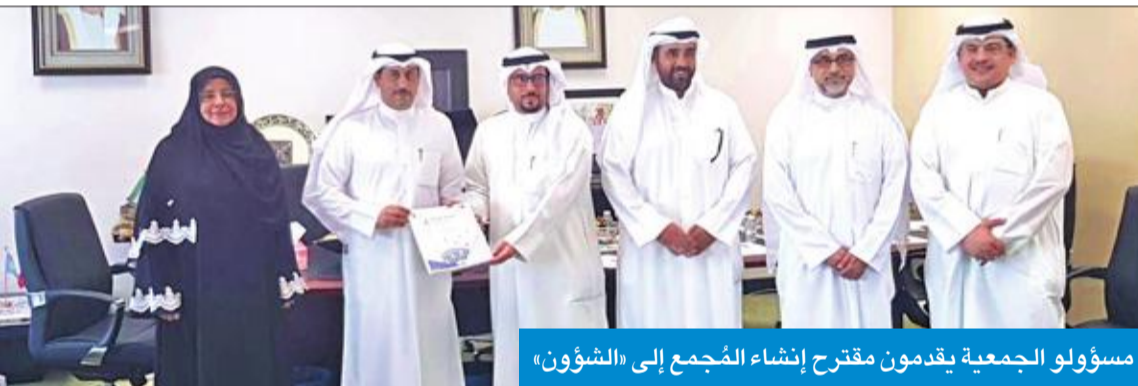
مسؤولو الجمعية يقدمون مقترح إنشاء المجمع إلى «الشؤون»