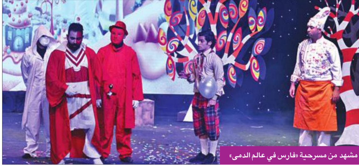
مشهد من مسرحية «فارس في عالم الدمى»

وسيط حضور كثيف من الأطفال وأسره، قدم مسرح الخليج ضمن فعاليات المهرجان العربي لمسرح الطفل في دورته السابعة على مسرح الدسمة مسرحية الأطفال «فارس في عالم الدمى».