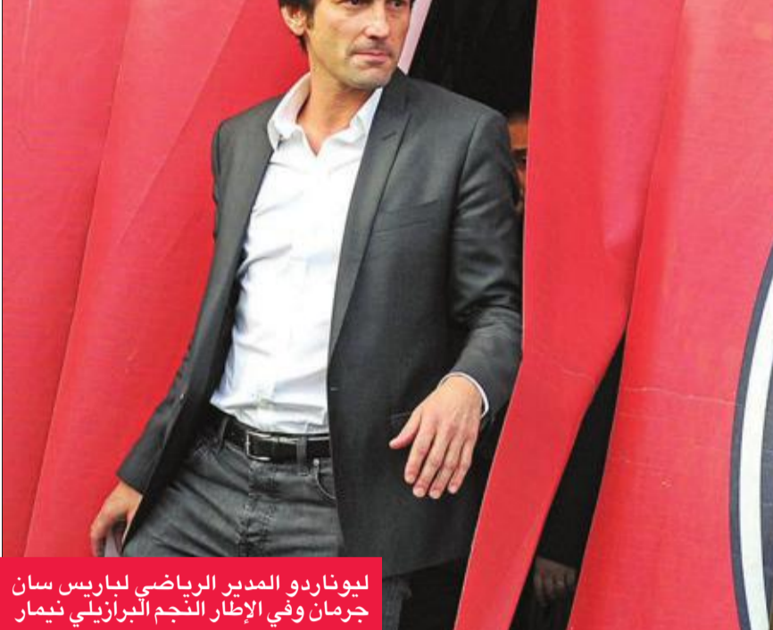
ليوناردو المدير الرياضي لباريس سان جرمان وفي الإطار النجم البرازيلي نيمار