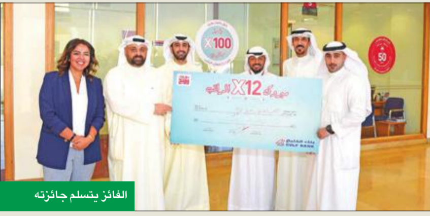
الفائز يتسلم جائزته

حصل على جائزة نقدية تصل إلى 12 ضعف الراتب