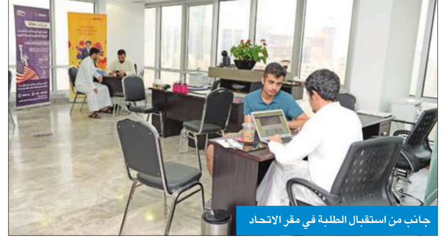
جانب من استقبال الطلبة في مقر الاتحاد

قال رئيس اللجنة الثقافية بالاتحاد نظر، إن الاتحاد قدم عدداً من الأنشطة الثقافية والاجتماعية التي تهم الطلبة الكويتيين الدارسين بأميركا، وتم تنظيم العديد من الأنشطة آخرها NUKS talk في مجمع الحمراء ورداً على سؤال حول مدى تعاون الاتحاد مع المسؤولين في وزارة التعليم العالي أوضح نظر أن هناك تعاوناً كبيراً بين الاتحاد والمسؤولين في وزارة التعليم العالي في الجانب الأكاديمي والتعليمي،