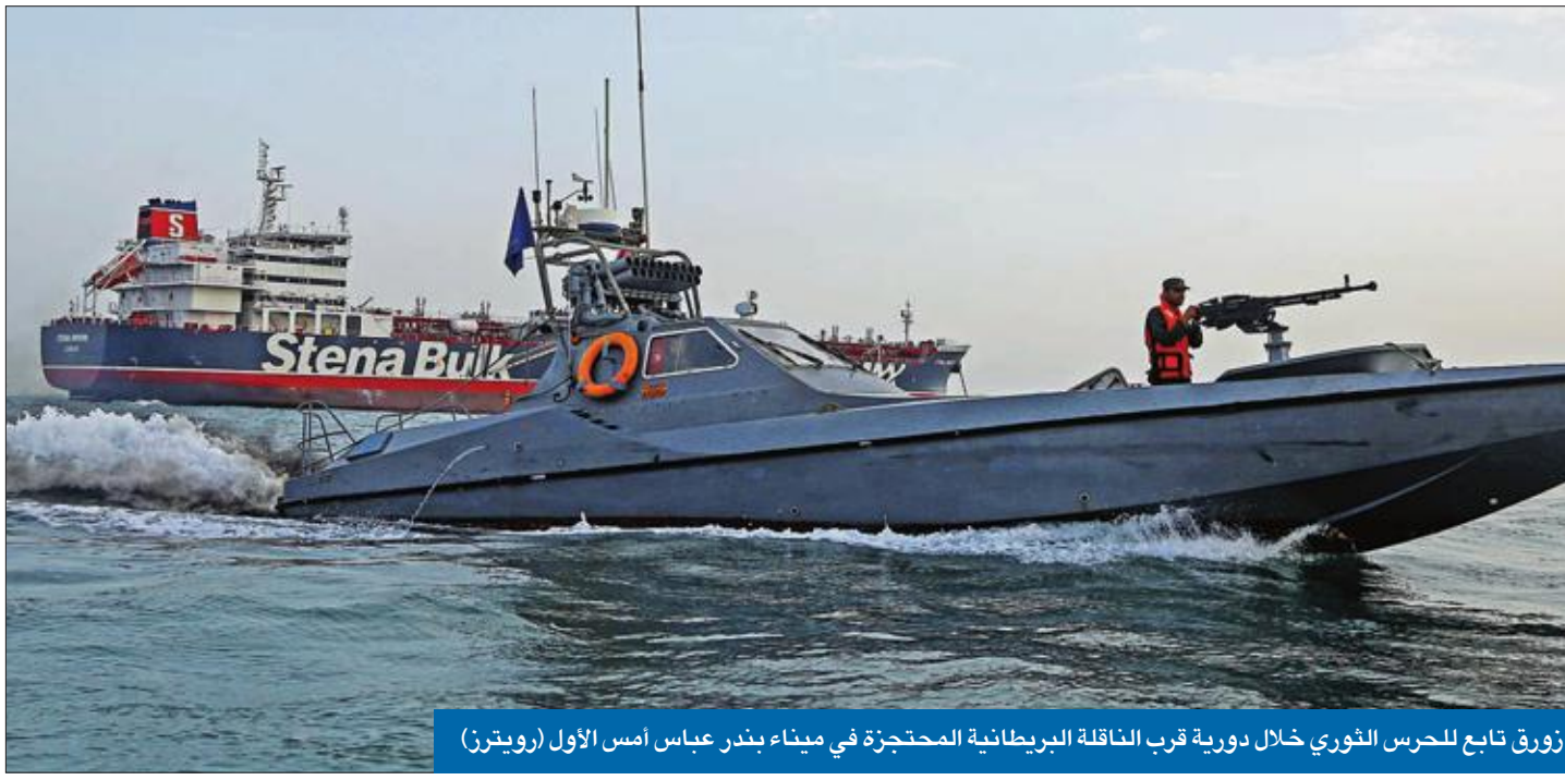
زورق تابع للحرس الثوري خلال دورية قرب الناقله البريطانية المحتجزة في ميناء بندر عباس أمس الأول

واعتبر رئيس اللجنة النائب محمد رضا داوراني أن المجلس تأخر في التدخل، متهماً الحكومة و«المركزي» بالعجز عن حل المشاكل الاقتصادية وفقد القدرة على إدارة الاقتصاد وأسواق العملة الصعبة. وعزا البعض سبب التدهور الجديد لسعر العملة الإيرانية إلى التوترات الجيوسياسية الحادة، التي تشهدها المنطقة حالياً والتغيرات السياسية في واشنطن، في حين رأى البعض الآخر أن عدم وجود أفق للسياسات الاقتصادية الإيرانية وفشل الحكومة في إعادة أموال صادرات البترول خلال الستينين الماضيتين، بسبب العقوبات المصرفية الأميركية، هما السبب في هذا التدهور. ورداً أكثر الخبراء تفاقماً هذا التراجع إلى السياسات