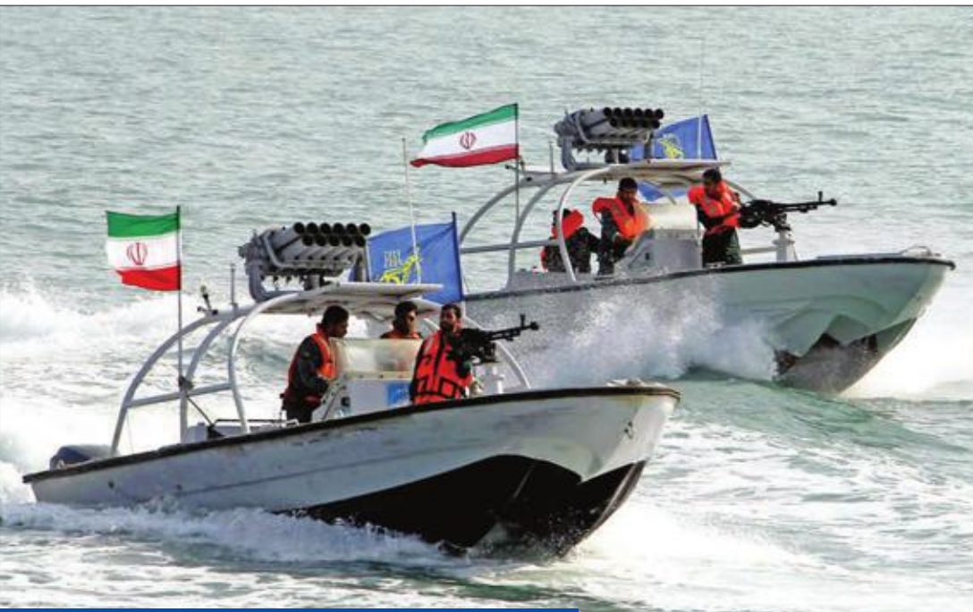
قوارب الحرس الثوري وبارجة أميركية في صورة مركبة

● عبدالمهدي وبن علوي يزوران العاصمة الإيرانية... والكويت تدعو لضبط النفس وتأمين الملاحة ● إيران تعلن اعتقال خلية تجسس أميركية وتحكم على بعض أعضائها بالإعدام وترامب يكذبها