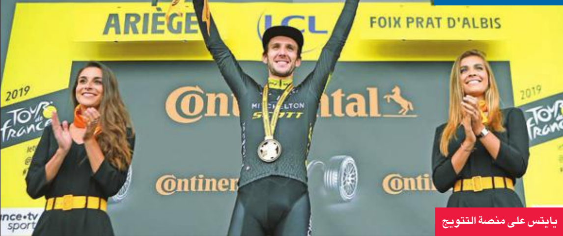
بايتس على منصة التتويج