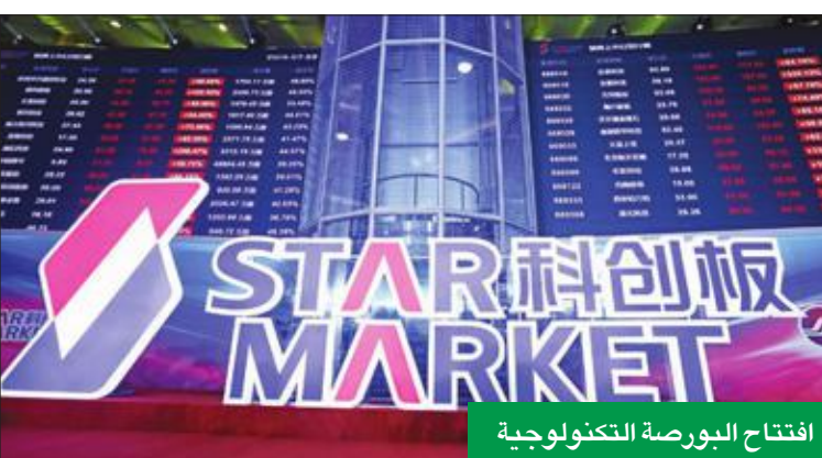
افتتاح البورصة التكنولوجية

يسعى فيه العملاق الآسيوي إلى تعديل نمطه الاقتصادي باتجاه التكنولوجيات الجديدة والمنتجات العالية القيمة المضافة، وفي أوج حرب تجارية مع الولايات المتحدة. ووضعت لـ"ناسداك" الصيني شروط مرنة لمساعدة الشركات الواعدة على جمع رؤسائهم