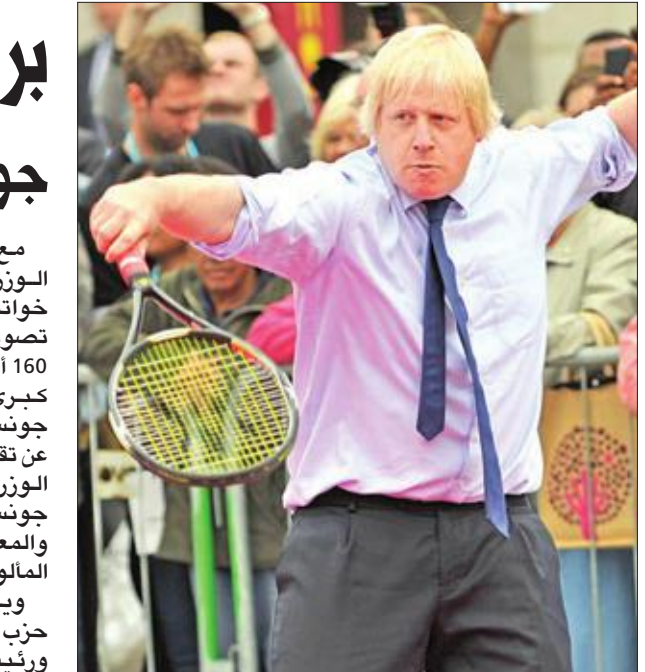
جونسون في صورة أرشيفية يمارس لعبة التنس بكامل ملابسه وسط لندن

ويحظى جونسون بتأييد ناشطي حزب المحافظين، لكن وزير الخارجية ورئيس بلدية لندن السابق لا يتمتع بإجماع تام داخل حزبه، خصوصاً في أوساط المعسكر المؤيد لأوروبا الذي أبدى عزمه على وضع العقبات في