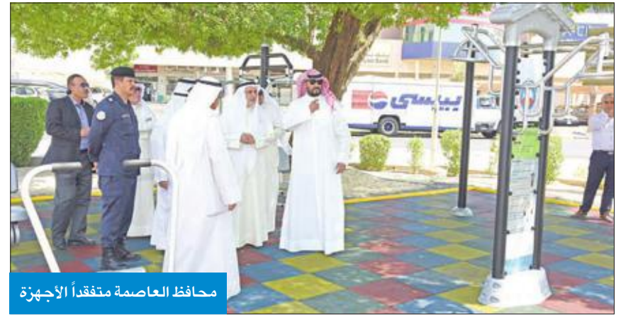
محافظ العاصمة متفقداً الأجهزة

أهالي منطقة الدسمة وفي مقدمهم النائب السابق أحمد لاري، ووزير الشؤون الاجتماعية الأسبق خالد الجميعة، إضافة إلى عدد من مسؤولي ديوان عام المحافظة.