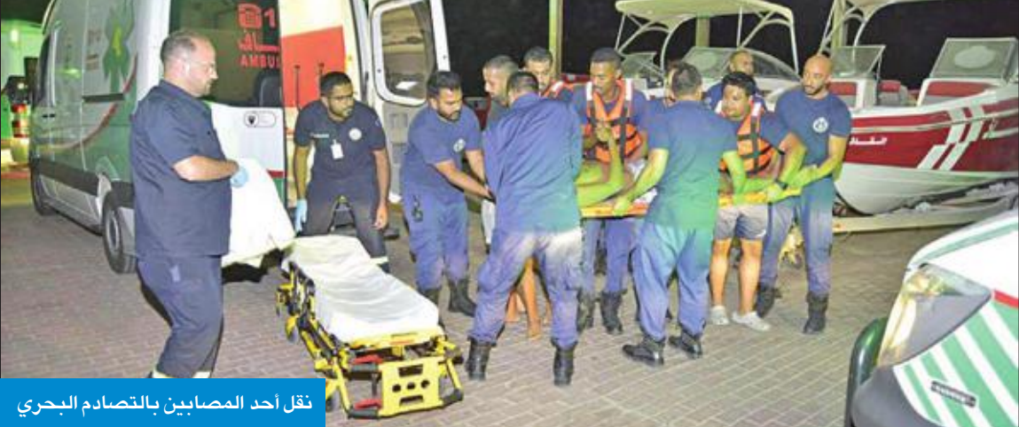
نقل أحد المصابين بالتصادم البحري

وأضاف العميد الأمير أن التصادم أسفر عن إصابة ثلاثة أشخاص، لافتاً إلى أن رجال الإنقاذ البحري عملوا على انتشالهم ونقلهم إلى الشاطئ وتسليمهم إلى فني الطوارئ الطبية الذين أكدوا، بعد عملية فحص المصابين، وفاة أحدهم، بينما نقل الأخران إلى المستشفى لتلقي العلاج.