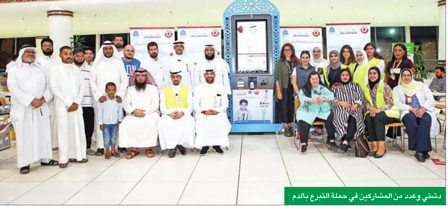
دشتي وعدد من المشاركين في حملة التبرع بالدم