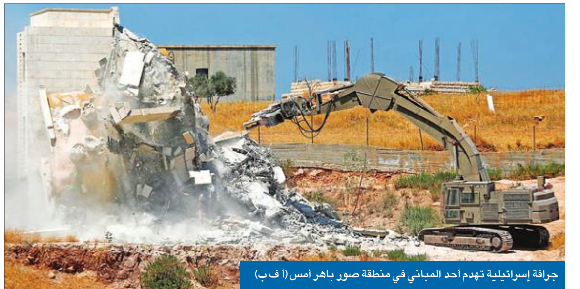
جرافة إسرائيلية تهدم أحد المباني في منطقة صور باهر أمس

بين القدس والضفة الغربية المحتلة. وتقول إسرائيل إن المباني التي هدمتها بُنيت قريباً جداً من الجدار الفاصل، الذي بدأت بنائه في عام 2002، بعد الانتفاضة الثانية التي شهدت الكثير من أعمال العنف، بهدف