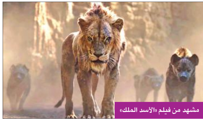
مشهد من فيلم «الأسد الملك»

فيريوي (سامويل إل. جاكسون) العالم بلا "أيرن مان" (روبرت داووني جونيور)، ويشارك في البطولة أيضاً كل من زندايا وجاكي جيلينغال وجي بي سموف. وحل ثالثاً "توي ستور 4" مع إيرادات بقيمة 14.6 مليون دولار في الأسبوع وتصدر فيلم "The Lion King" التذاكر في شبك التذاكر الأميركية الجديدة "ديزني" بنسخته الجديدة بعدما حصد 185 مليون دولار في أول ثلاثة أيام من عرضه في الصالات، بحسب ما أفادت شركة "أكزبيت ريليشن" المتخصصة. وسبق التوقعات عال جداً لهذا الفيلم الذي يستعيد قصة الشبل "سيمبا" الذي يريد أن يثار لموت والده، وبلغت ميزانية العمل 250 مليون دولار، وهو يجمع كوكبة من النجوم، من أمثال بيونسي وجيمس إيرل لوشكياتا، والفيلم "The Lion King" الجديد من إخراج جون أفارو. وتراجع إلى المرتبة الثانية فيلم "سوني" الجديد "سايدرامان: فار فروم هوم" الذي حصد 21 مليون دولار. وتدور أحداثه حول طريقة مواجهة "سايدرامان" (توم هولاند) ونيك