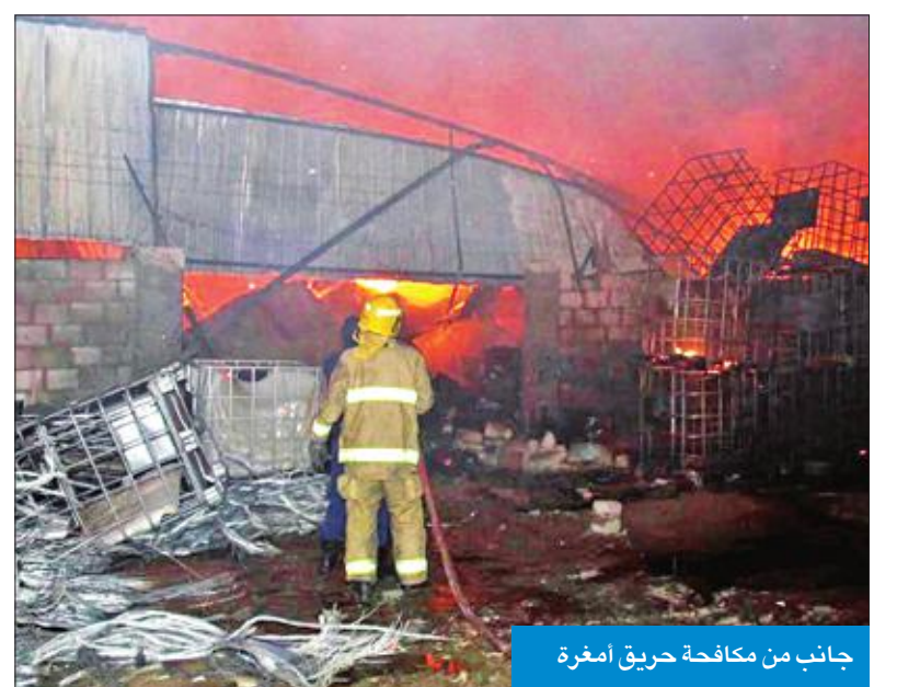
جانب من مكافحة حريق أمغرة