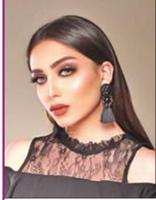
البحرينية قرارا بعلاجها في الخارج، نتيجة مناشدة والدتها، في محاولة لإنقاذ حياتها، ليكن أمس إعلان خبر وفاتها.

وكان آخر أعمالها مسلسل «أمي دلال والعيال» في شهر رمضان الماضي، وبدأت مجال التمثيل عام 2012 من خلال مسرحية «مصباح زين»، كذلك شاركت في العديد من المسلسلات والبرامج الإذاعية.