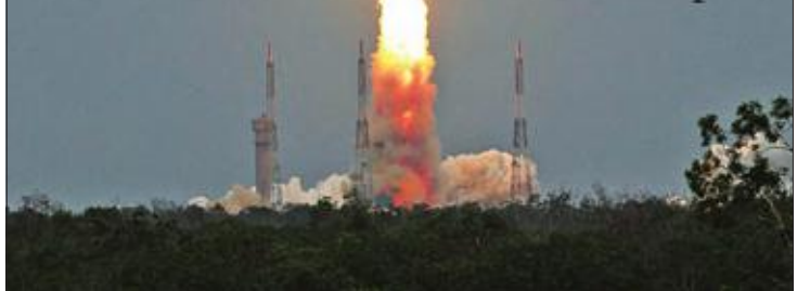
أطلقت الهند أمس، مهمتها الثانية إلى القمر "شانديان-2" المتوقع أن تبلغ وجهتها في السادس من سبتمبر المقبل.

ورفع علماء "إسرو" الصلوات التقليدية في معبد قرب منصة الإطلاق. وكان من المفترض إطلاق "شانديان-2" -التي يعني اسمها "عربة قمرية" باللغة الهندية- في الخامس عشر من يوليو الجاري، لكن العملية الغيت قبل 56 دقيقة و24 ثانية من موعدها، بسبب "مشكلة تقنية" لم توضح وكالة الفضاء الهندية تفاصيلها رسمياً.