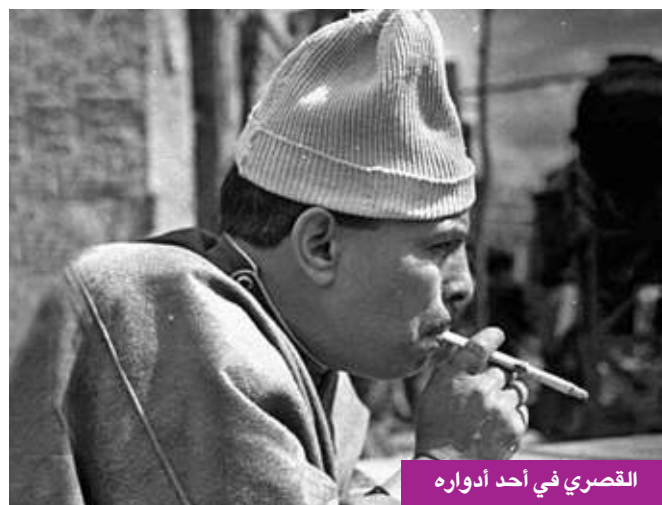
القصري في أحد أدواره