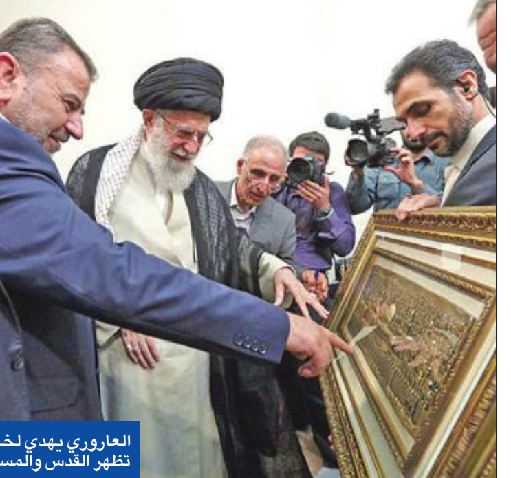
العاروري يهدي لخامنئي لوحة تظهر القدس والمسجد الأقصى

وأبلغ المرشد الإيراني الوفد الفلسطيني بأن "قضية فلسطين تمثل القضية الأولى والأهم في العالم الإسلامي وسوف تنتهي حتماً لصالح الشعب الفلسطيني والعالم الإسلامي جميعاً