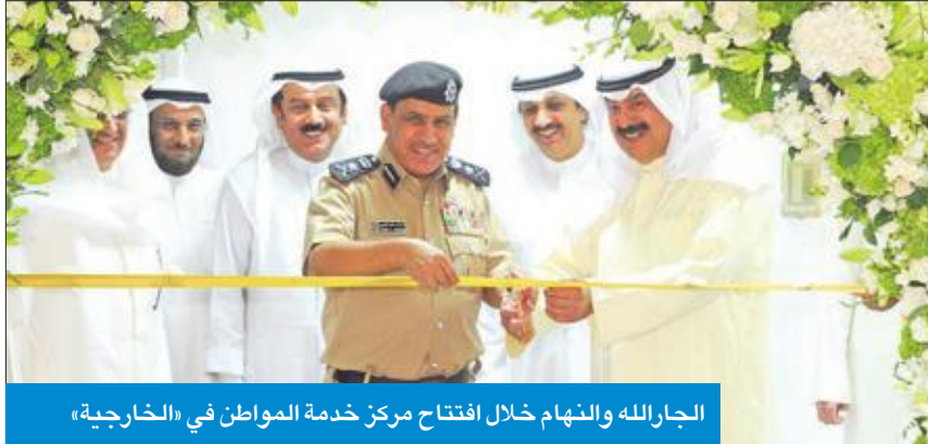
الجارالله والنهام خلال افتتاح مركز خدمة المواطن في «الخارجية»

تجاوبا وتفهما، حيث «لمسنا استعداد الاتحاد الأوروبي، من خلال موعديني، أن تكون هناك أولوية للكويت فيما يتعلق بإعفاء مواطني الدول من تأشيرة «الشنغن». وأعرب عن تفاؤله بتجاوب الاتحاد الأوروبي، مؤكدا سعي ومواصلة «الخارجية» مساعيها بالضغط والتحرك الإيجابي بهذا الجانب.