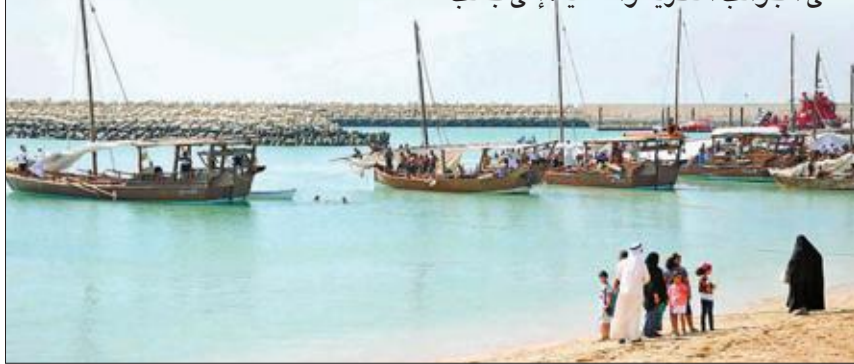
الغوص في الكويت

وتنطلق بعد غد رحلة إحياء ذكرى الغوص الحادية والثلاثين، التي تنظمها لجنة التراث البحري في النادي البحري الرياضي، تحت رعاية صاحب السمو الأمير في الفترة من 25 الجاري إلى 1 أغسطس، بمشاركة سفن الغوص المهواة من صاحب السمو، وسمو الأمير الراحل الشيخ جابر الأحمد.