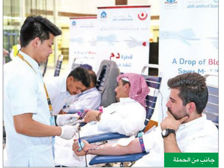
جانب من الحملة

نظم البنك الأهلي المتحد حملة للتبرع بالدم في مجمع البوليفارد تحت شعار «قطرة دم تنقذ حياتي»، بالتعاون مع جمعية المنابر القرآنية وبنك الدم الكويتي. وقال البنك في بيان صحفي أمس، إن هذه الحملة تأتي امتداداً لجهود البنك الأهلي المتحد ومبادراته المتميزة في مجال الرعاية الصحية، سعياً إلى نشر ثقافة العمل الخيري، وترسيخاً للهدف الإنساني النبيل في مجال البذل والعطاء، وسبق أن أطلق البنك العديد من حملات