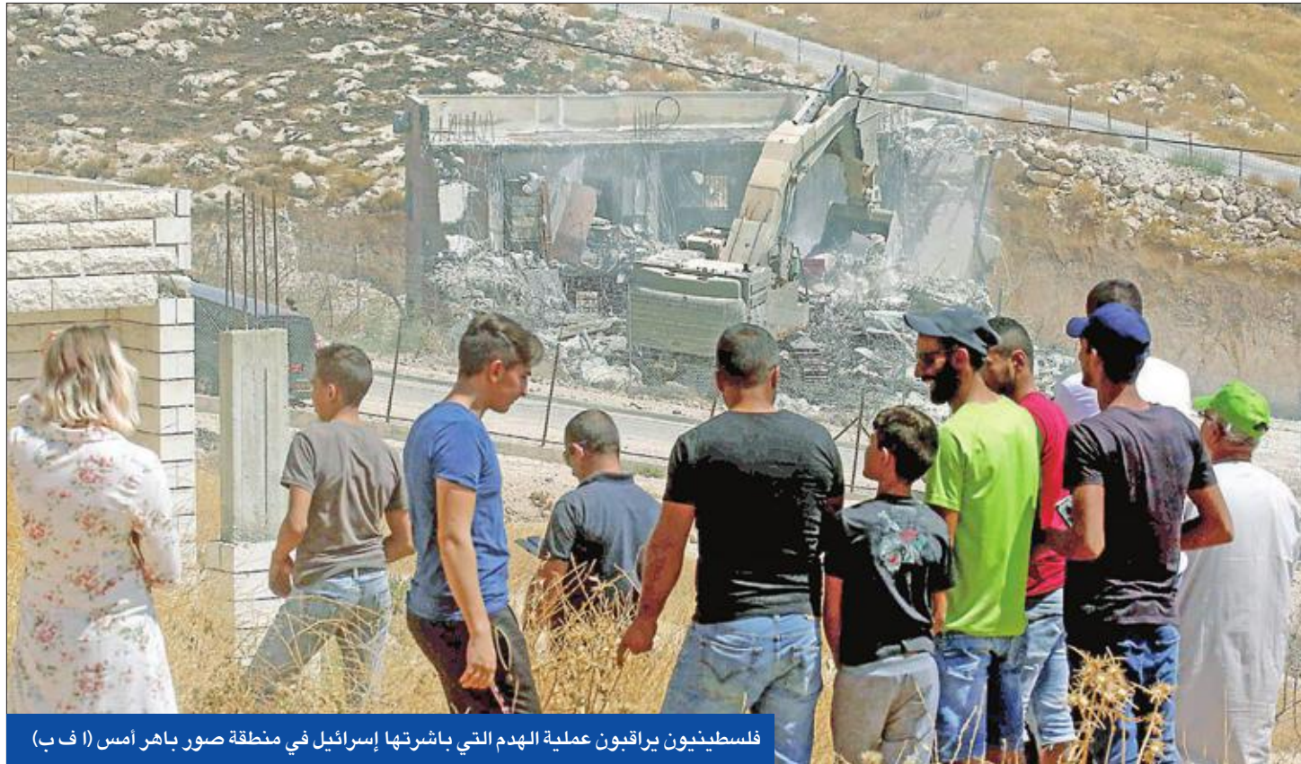
فلسطينيون يراقبون عملية الهدم التي باشرتها إسرائيل في منطقة صور باهر

باشرت القوات الإسرائيلية، أمس، هدم منازل فلسطينيين تعتبرها غير قانونية، جنوب القدس الشرقية، وعلى مقربة من السياج الفاصل بين القدس والضفة الغربية، في عملية أثارت تنديد الفلسطينيين، وقلق الأمم المتحدة.