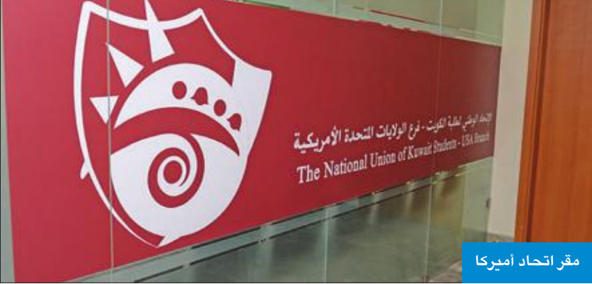
مقر اتحاد أميركا