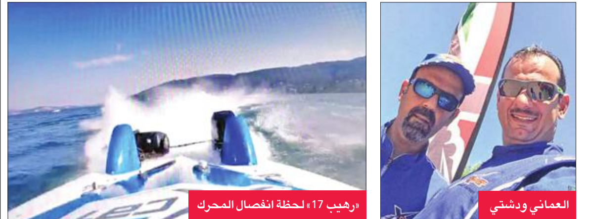
«رهيب 17» لحظة انفصال المحرك