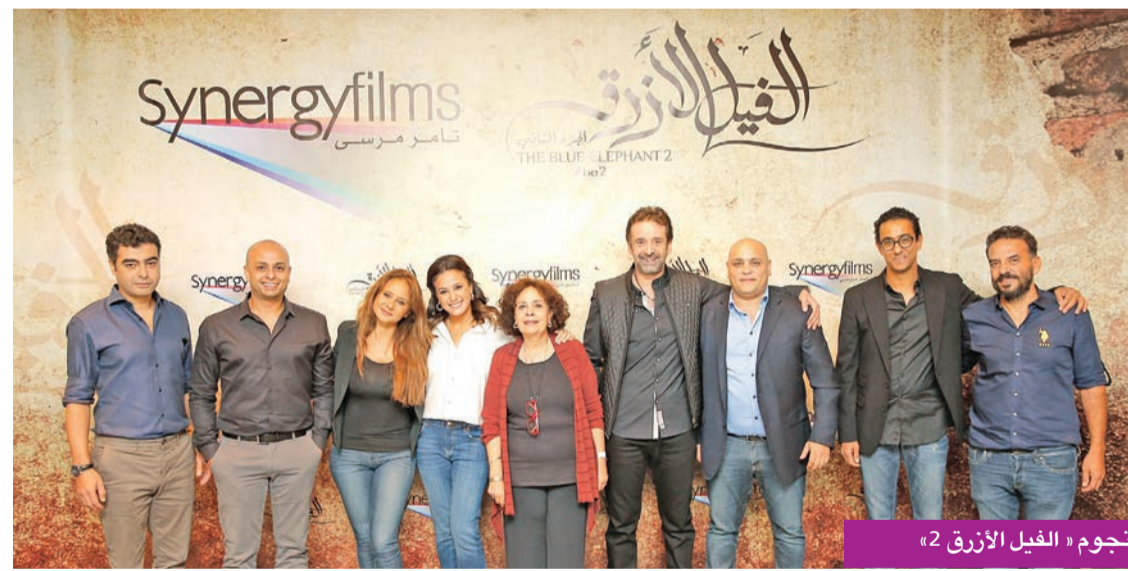
نجوم «القبيل الأزرق 2»