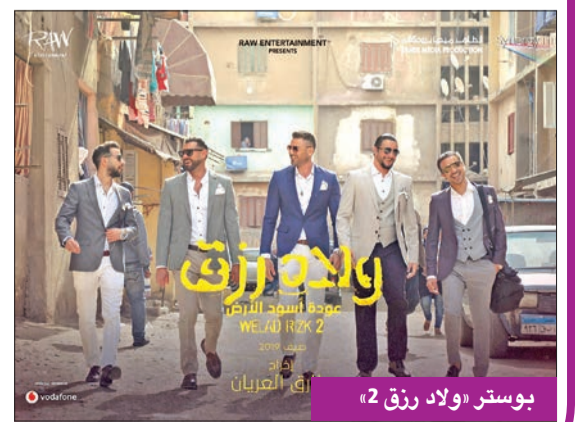
بوستر «ولاد رزق 2»

ان تكلفة الفيلم تحطت 30 مليون جنيه. واعتمدت الشركة المنتجة في الترويج للفيلم على «تريبلر» دعائي مليء بالغموض والتشويق، حيث ظهر د. يحيى الذي يقوم بدوره كريم عبدالعزيز وهو يصارع نفسه، بينما ظهر عنكبوت ضخم وهو بطارده، فيما ظهرت حيوانات عديدة في الإعلان التشويقي الذي شهد ظهوراً غامضاً للابطل الرئيسي همد صبري، نيللي كريم، وإياد نصار دون أن تكشف عن مزيد من التفاصيل. كما جرى التفاعل عبر منصات مواقع التواصل التي أطلقت عليها صفحات خاصة بالفيلم، وجرى تنشيطها منذ وقت مبكر، مع الأخذ في الاعتبار وجود خطة ترويجية لتكثيف الدعايا للفيلم مع اقتراب عرضه، علماً بأن الشركة المنتجة تدرس طرحه قبل العرض، لضمان تحقيق إيرادات مبكرة جيدة