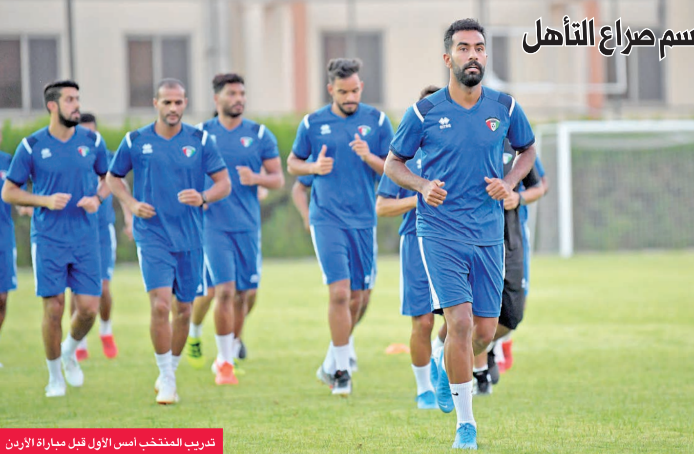
تدريب المنتخب أمس الأول قبل مباراة الأردن