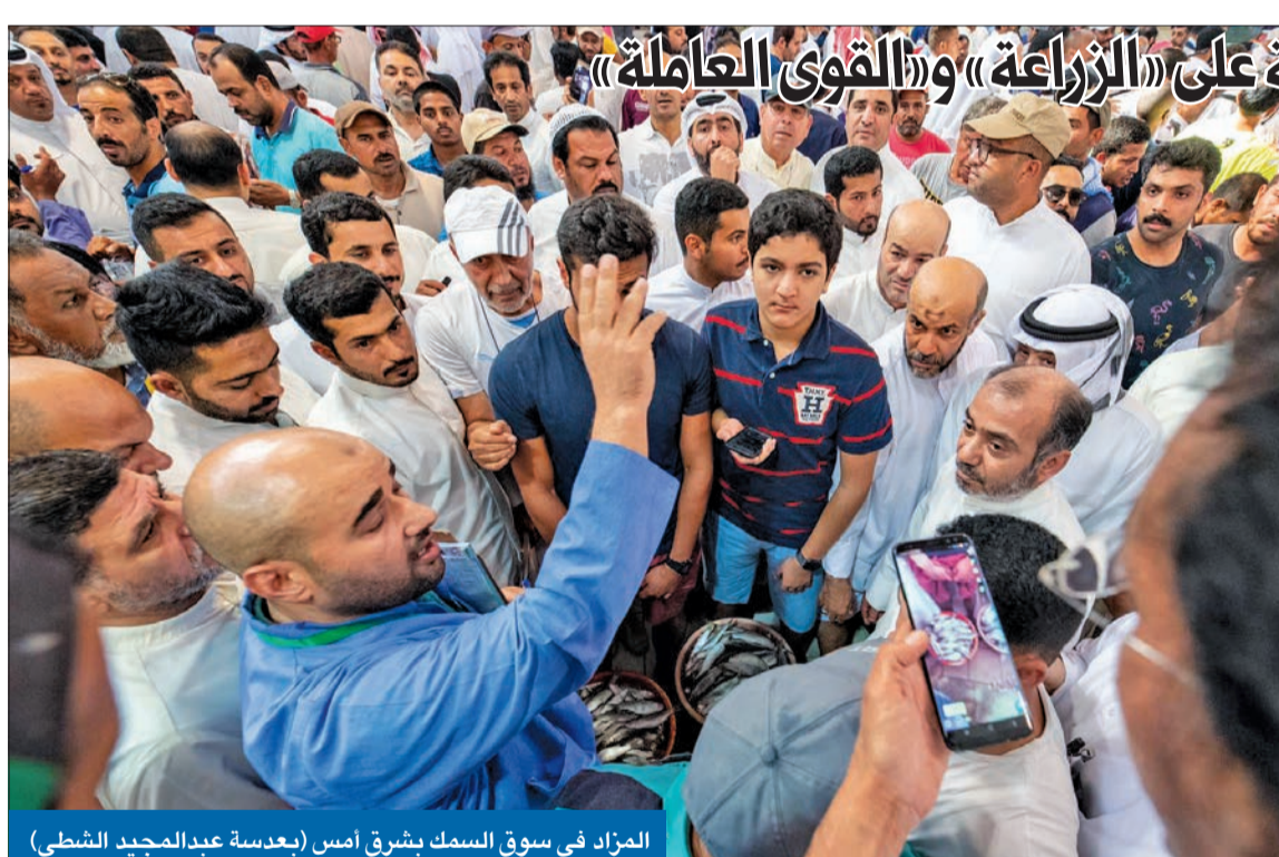
المزاد في سوق السمك بشرق أمس