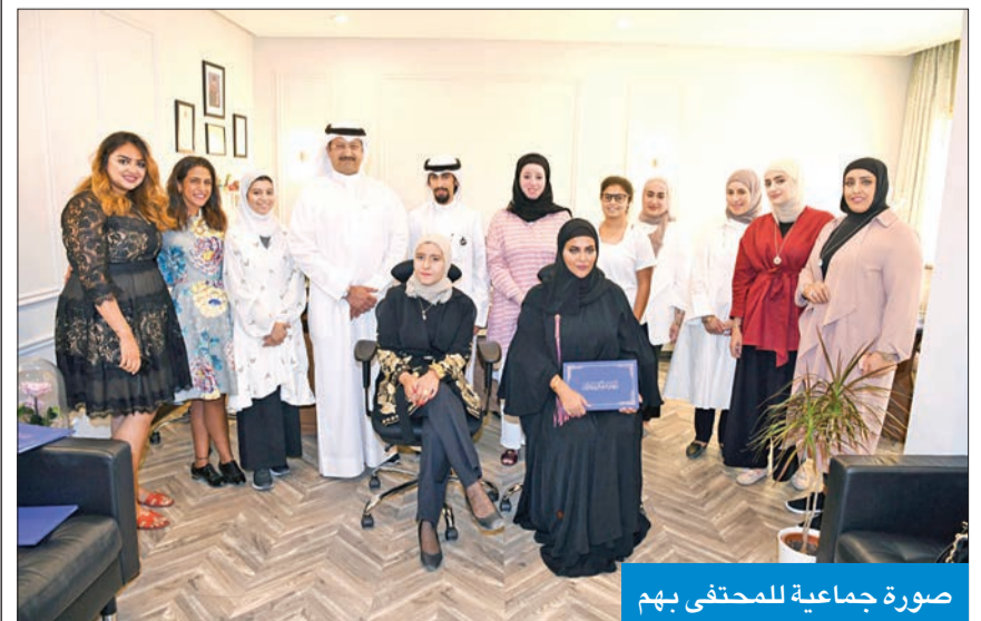
صورة جماعية للمحتفي بهم

نظم برنامج قادة الغد وكلية القانون الكويتية العالمية وبرنامج إعادة الهيكلة بالتعاون مع مكتب خالد الخبيزي للمحاماة والاستشارات القانونية حفل تخريج طلبة وخريجي القانون للدورة التاسعة من البرنامج، وذلك من خلال تدريب الطلبة ميدانياً وصقل مهاراتهم القانونية والعملية.