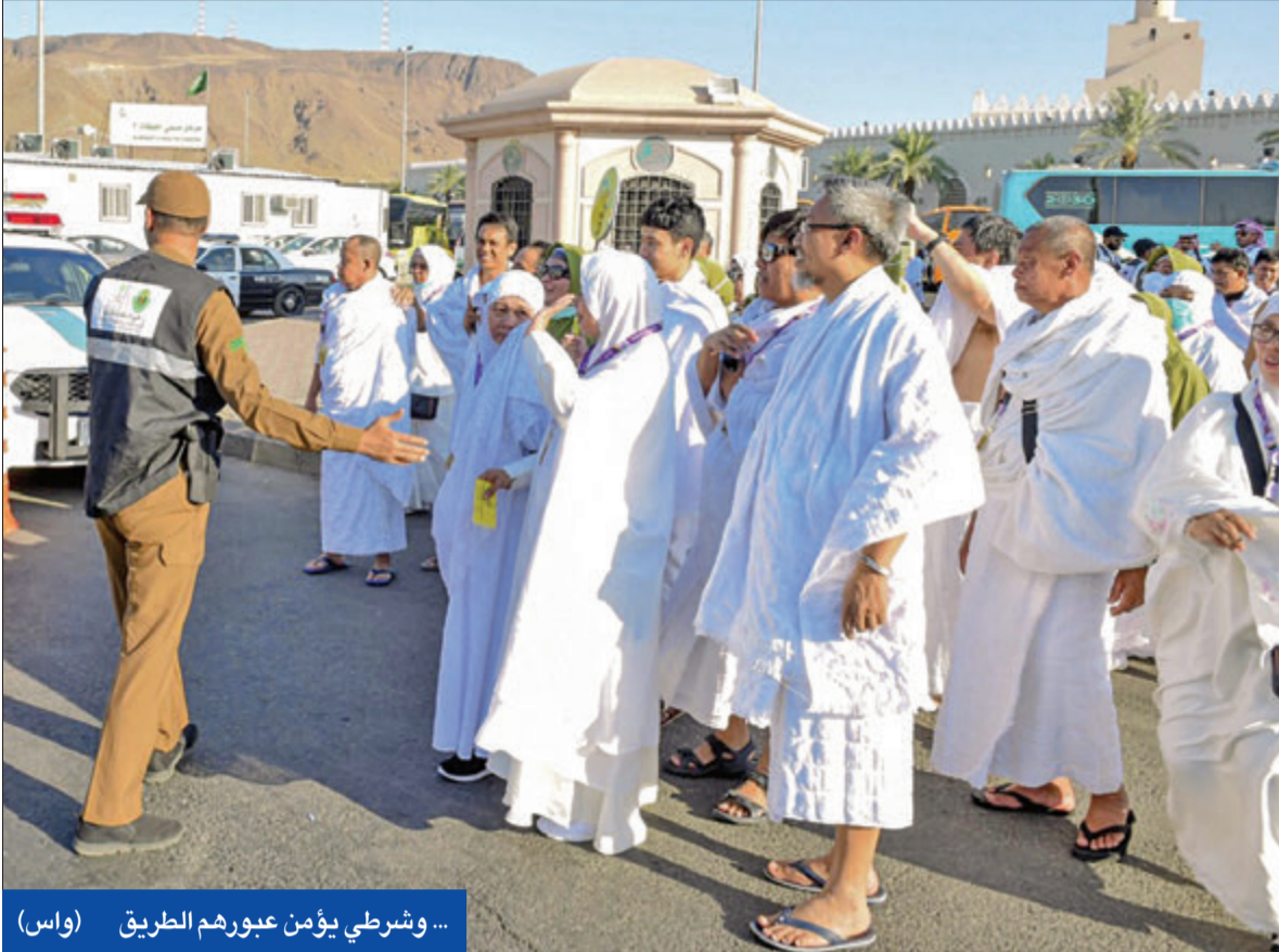
... وشرطي يؤمن عبورهم الطريق

إجراءات مشددة وحشد عشرات الآلاف من رجال الأمن... و88 ألف إيراني يشاركون في المناسك