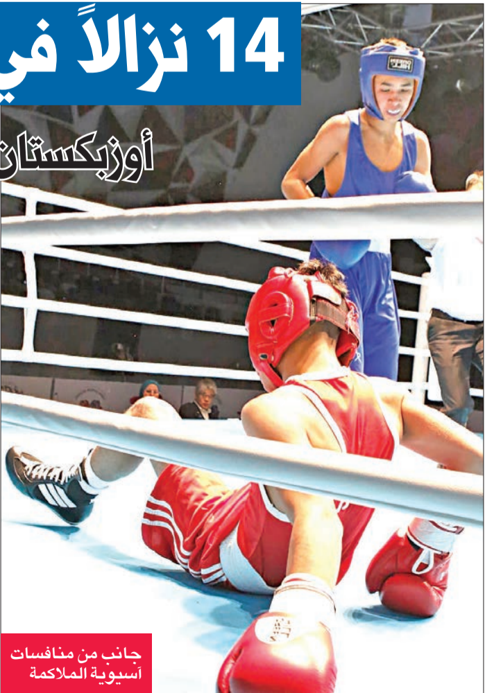
جانبا من منافسات آسيوية الملاكمة

تختتم اليوم البطولة الآسيوية للملاكمة للصغار، التي تستضيفها الكويت منذ السبت الماضي برعاية رئيس اللجنة الأولمبية الكويتية الشيخ فهد الناصر. ويشهد اليوم الختامي إقامة 14 نزالاً نهائياً لجميع الأوزان بدءاً من 33 كغم وحتى ما فوق وزن 70 كغم، ويبدو منتخب أوزبكستان الأوفر حظاً للظفر بأكبر عدد من الميداليات الذهبية، بعدما تأهل لاعبه للدوار النهائية في جميع الأوزان الأربعة عشر، مسجلين حضوراً هو الأقوى من بين الدول المشاركة في البطولة القارية، ويأتي المنتخب الكازاخي ثانياً من حيث المنافسة على المركز الأول، بعدما فقد الأمل في المنافسة على أربع ميداليات ذهبية، في حين يأتي المنتخب الهندي ثالثاً يتأهل 8 ملاكمين له للدوار النهائية، ويحل منتخب قرغيزستان رابعاً من حيث الترشيحات لتأهل خمسة ملاكمين فقط لأدوار الحاسمة.