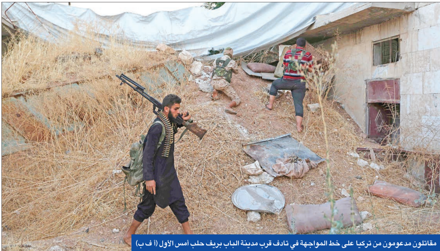
مقاتلون مدعومون من تركيا على خط المواجهة في تادف قرب مدينة الباب بريف حلب أمس الأول

«البيتاغون»: «داعش» يعود بقدرات معززة في سورية والعراق... وحلفاؤنا غير قادرين على التمسك بالأرض