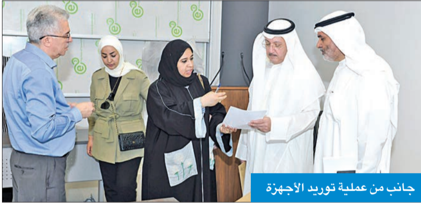
جانب من عملية توريد الأجهزة

من الكليات المنتقلة، بالتعاون مع عمادات الكليات والمديرين الإداريين، الذين أبدوا تعاوناً كبيراً في تنفيذ خطة الانتقال وتشغيل الأجهزة.