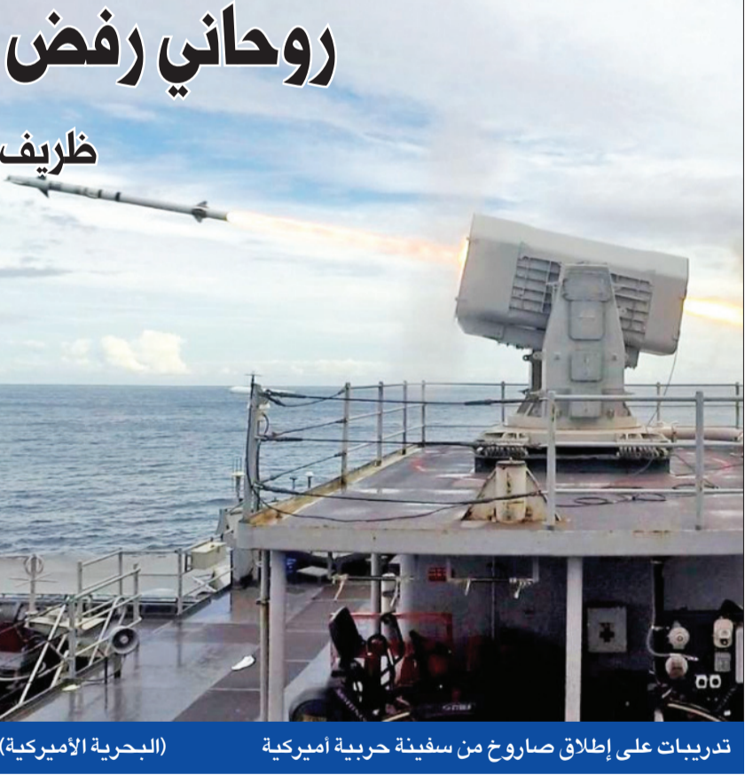
تدريبات على إطلاق صاروخ من سفينة حربية أميركية (البحرية الأميركية)

أفاد تقرير لموقع «المانيتور» الأمريكي بأن الرئيس الإيراني حسن روحاني رفض دعوة ماكرون للقاء الرئيس الأمريكي دونالد ترامب، على هامش قمة مجموعة السبع المقررة انعقادها في فرنسا أواخر الشهر الجاري. وذكر الموقع الأمريكي نقلاً عن مصادر مطلعة قولها إن «ماكرون اقترح على روحاني خلال اتصال هاتفي أمس الأول مشروعاً لوضع 15 مليار دولار في اليد المالية الأوروبية المعروفة بباينستكس». وأضافت المصادر أن «ماكرون عرض 10 مليارات الأخرى لخدمة أعضاء الاتفاق النووي»، موضحة أن «الرئيس الفرنسي وجه دعوة لروحاني لحضور قمة مجموعة السبع G7 كضيف شرف، وأكد له أن القمة ستكون فرصة للقاء ترامب حتى لا تعزل أميركا المشروع الأوروبي»، الذي يهدف لإنقاذ الاتفاق النووي عبر منح طهران امتيازات اقتصادية.