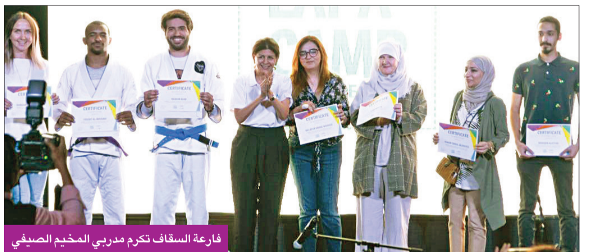
فارة السقاف تكرم مدربي المخيم الصيفي

وأشارت إلى أن «المخيم صمم بعناية شديدة ليخدم برنامجاً متوازناً للصغار، يجمع بين الفنون والرياضة والثقافة