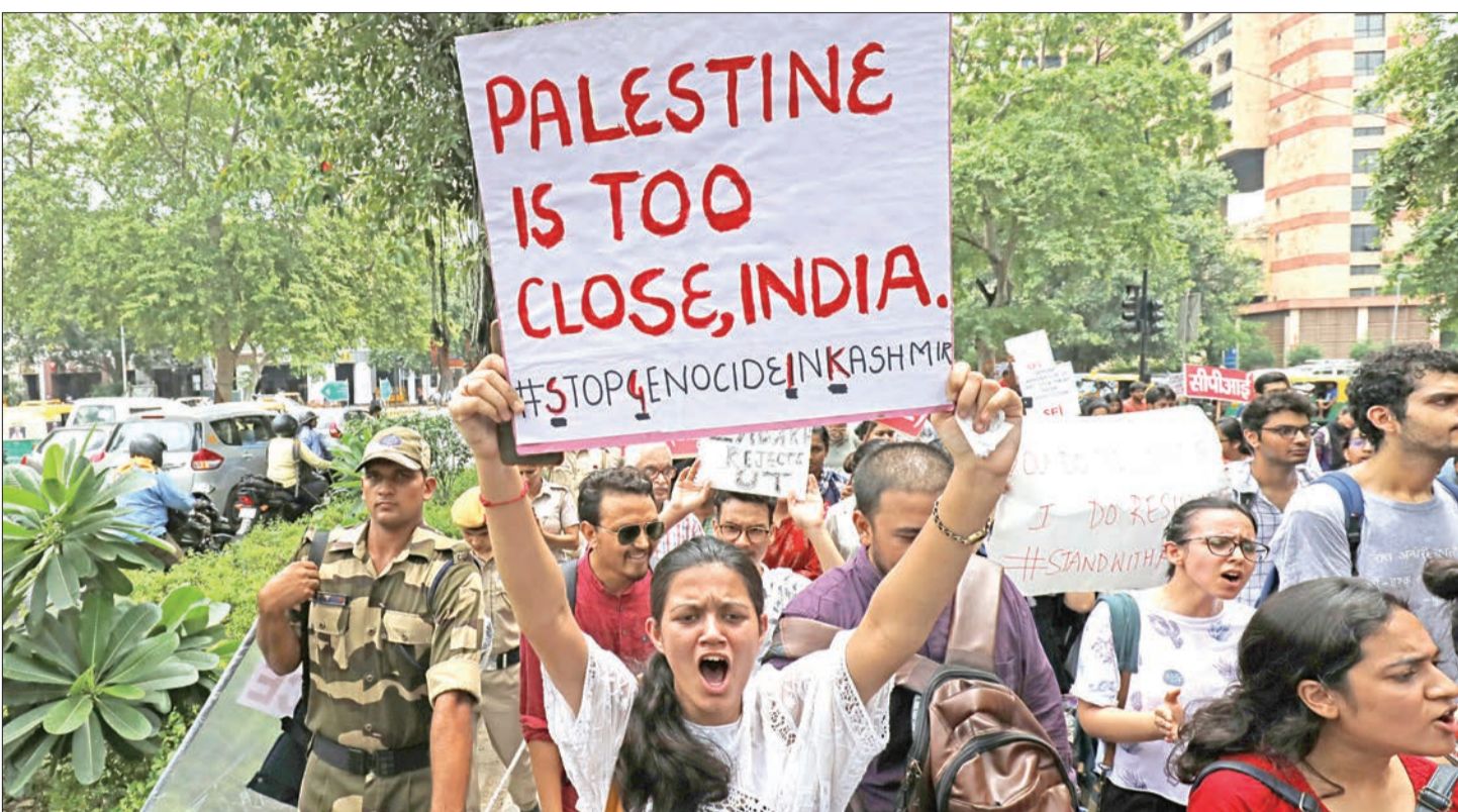
سيدة ترفع لافتة كتب عليها «فلسطين قريبة جداً» خلال تظاهرة في دلهي أمس احتجاجاً على قرار إلغاء الوضع الخاص بكشمير

حروب في عام 1947 و1965، في غضون ذلك، أعربت الصين، التي تطالب بالسيادة على جزء من إقليم، عن معارضة قوية لقرار الهند بشأن جامو وكشمير، وهي الولاية الوحيدة في الهند التي تظنها أغلبية من المسلمين. في المقابل، قال المتحدث باسم وزارة الخارجية الهندية رافيش كومار، إن تقسيم ولاية جامو وكشمير إلى منطقتين اتحاديتين شأن داخلي. من جانب آخر، قال المتحدث باسم المفوضية العليا لشؤون اللاجئين روبرت كوفلين إن وقف الاتصالات والإجراءات الأمنية يثيران قلقاً بالغاً، خاصة في ظل الروايات عن التوتر والخوف التي ترد من السكان.