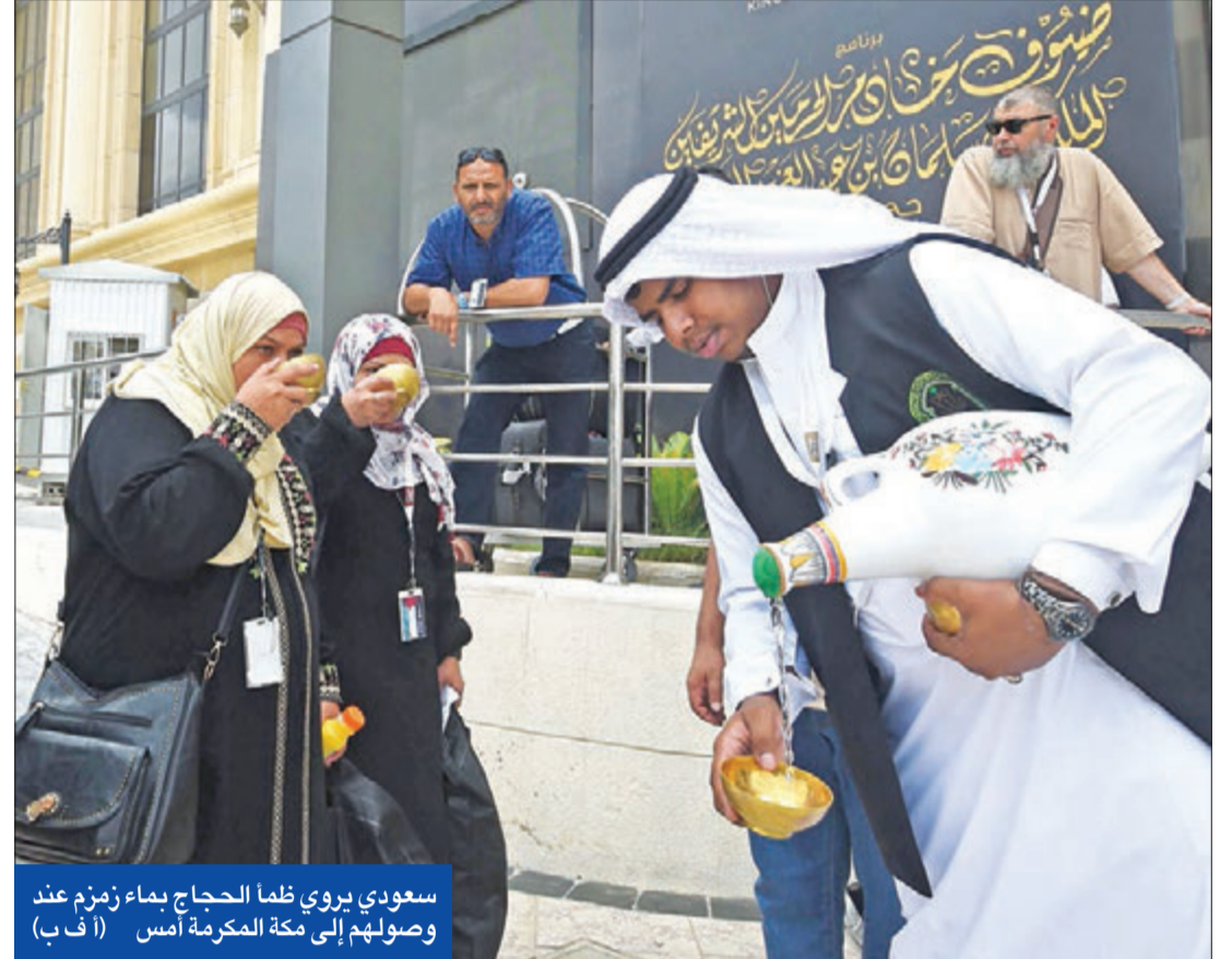
سعودي يروي ظلماً الحجاج بماء زمزم عند وصولهم إلى مكة المكرمة أمس

وتأكيداً على التضامن ومساعدة ضحايا حادثة إطلاق النار، تم التكفل بتذاكر الطيران وتكاليف الإقامة وتقديم الدعوة بعد أن أخبر السفير السعودي لدى نيوزيلندا، عبدالرحمن السحبياتي، العائلات بأن الملك سلمان كان مصدوماً بشدة من الهجمات على مسجدين في 15 مارس الماضي.