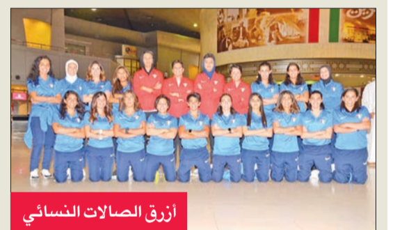
أزرق الصالات النسائي

غادر وفد المنتخب الوطني لكرة القدم النسائية للصالات إلى كرواتيا، للدخول في معسكر تدريبي يستمر حتى 27 الجاري استعداداً لخوض منافسات الدورة السادسة لرياضة المرأة بدول مجلس التعاون الخليجي، وبطولة كأس آسيا.