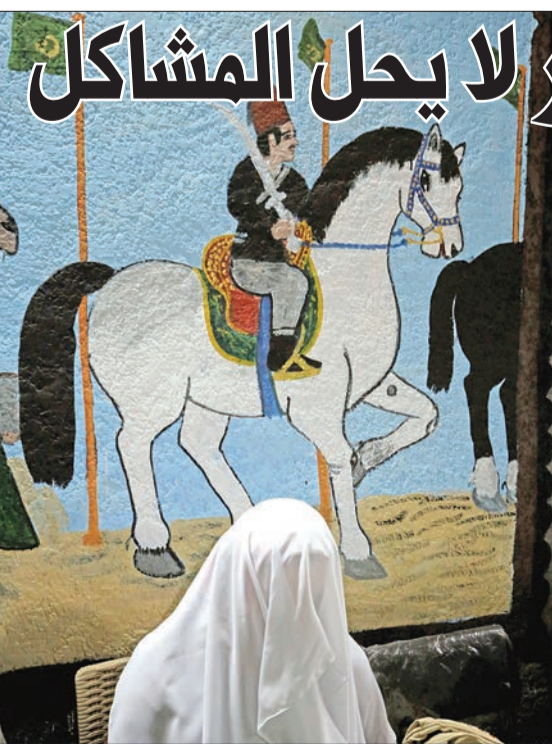
سيدة أمام رسم غرافيتي على أحد الجدران في القاهرة

للاجئين، لاسيما حق عودتهم إلى ديارهم». وفي تعليق هو الأول على حوادث «البساتين»، أعلنت السفارة الأميركية المتحدة المراجعة القضائية العادلة والشفافة دون أي تدخل سياسي، مضيفاً أن «أي محاولة لاستغلال الحدث السياسي، الذي وقع بقبرشمون في 30 يونيو الماضي، بهدف تعزيز أهداف سياسية، يجب أن يتم رفضه». وأشارت إلى أن «الولايات المتحدة عبرت، بعبارات واضحة، إلى السلطات اللبنانية عن توقعها أن تتعامل مع هذا الأمر بطريقة تحقق العدالة دون تأجيج نغرات طائفية ومناطقية بخلفيات سياسية».