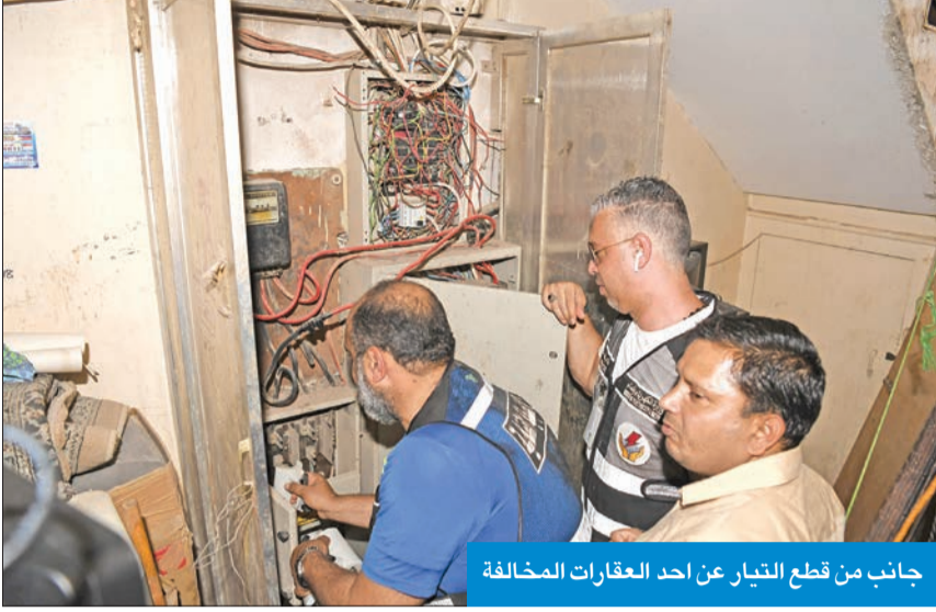
جانب من قطع التيار عن أحد العقارات المخالفة

المنفوشي: إخلاء 40 عقاراً من العزاب في خيطان... والجليب تحتاج إلى حلول مناسبة