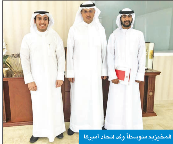
المخيزيم متوسلاً وفد اتحاد أميركا

إلى العديد من مشاكل الطلاب والطالبات، وأبرز المشاكل التي تواجههم مع المكاتب الثقافية، بالإضافة إلى إيجاد حلول عاجلة لمشاكل تصديق شهادات خريجي الجامعات الأميركية.