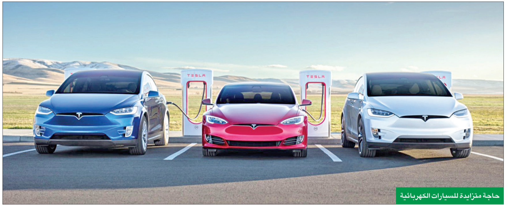
حاجة متزايدة للسيارات الكهربائية