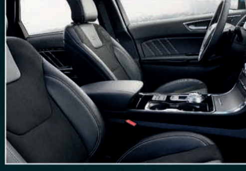
مقاعد جلد و شامواه مع خاصية التبريد والتدفئة