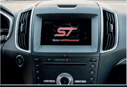
شاشة قياس 8" مع نظام SYNC3 المعلوماتي والترفيهي