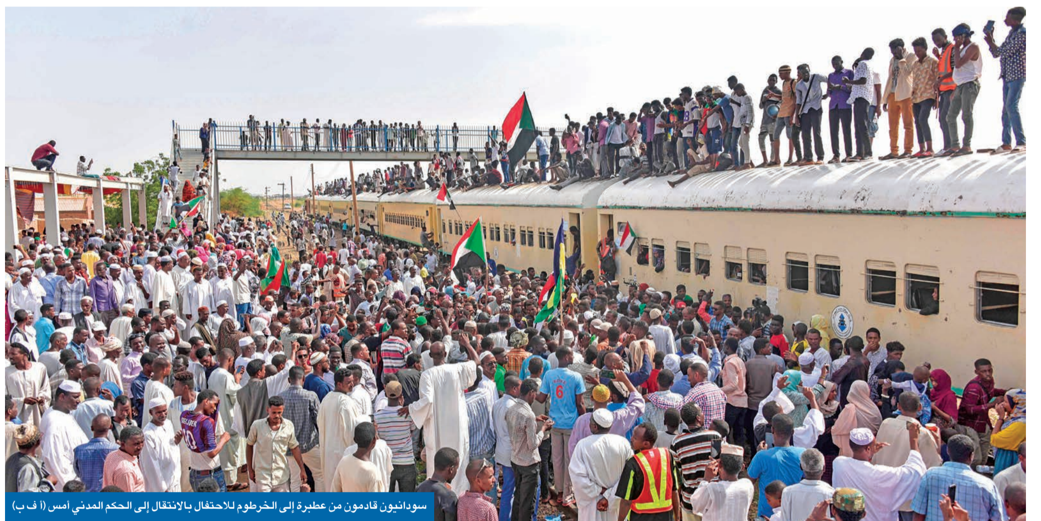
سودانيون قادمون من عطبرة إلى الخرطوم للاحتفال بالانتقال إلى الحكم المدني أمس (أ ف ب)

«وثيقة الفرع» تطوي 3 عقود من الحكم العسكري... واصطفاف دولي لإنجاحها • البرهان يعد بتفعيل الانتقال الديمقراطي... والمعارضة تعلن نهاية حقبة الفساد • تشكيل المجلس السيادي اليوم وتعيين رئيس الوزراء الثلاثاء والانتخابات بعد 39 شهراً