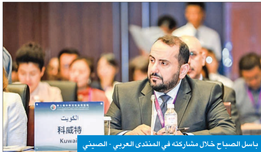
باسل الصباح خلال مشاركته في المنتدى العربي - الصيني

أكد أن المنتدى يحقق التغطية الصحية الشاملة للجميع دون تفریق أو تمييز