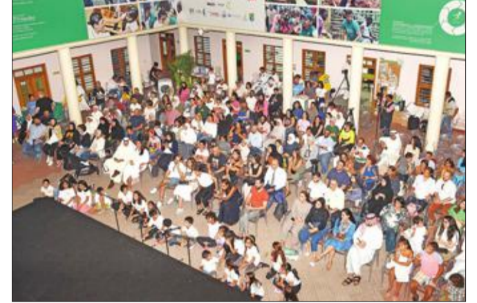
جانب من الحضور