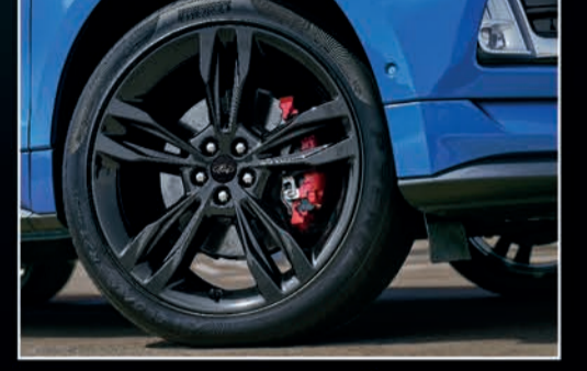
عجلات ألنيوم متميزة 21"