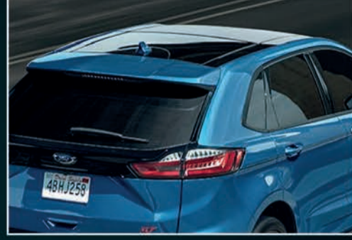
فتحة سقف بانورامية