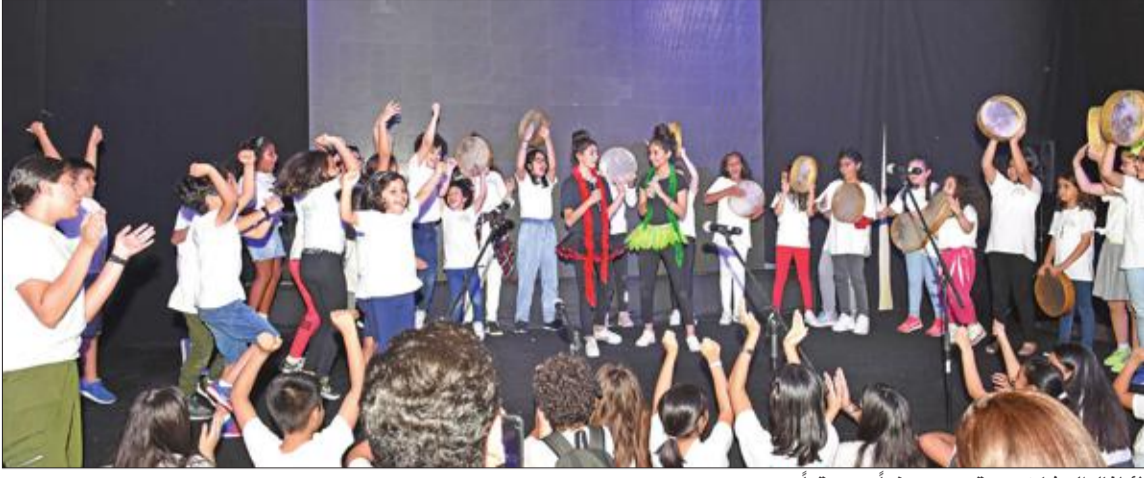
الأطفال المشاركون يقدمون عرضاً موسيقياً