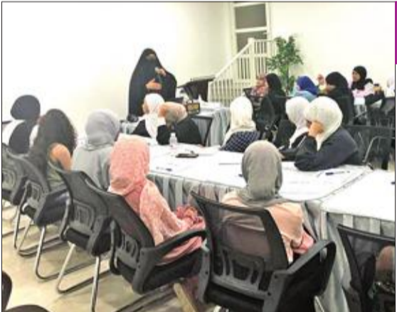
جانب من ورشة العمل