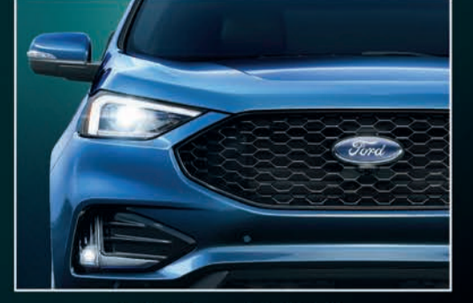
الاضاءة المميزة LED