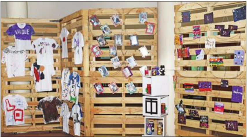
أشغال فنية من أعمال الأطفال أثناء المخيم