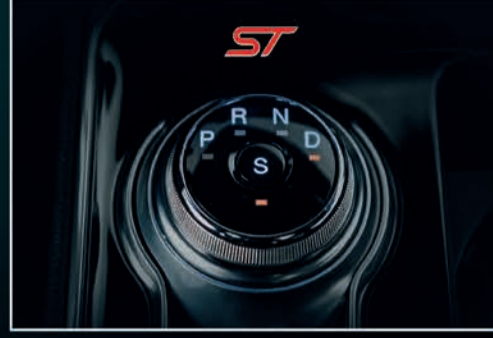
ناقل حركة 8 سرعات دوار مع دفع بالعجلات الأربع