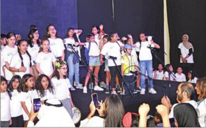
عدد من الأطفال المشاركين يقدمون فقرة غنائية