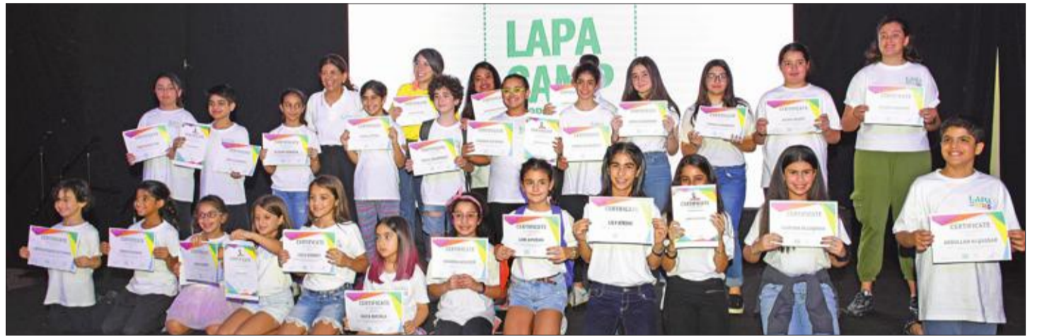
صورة جماعية للأطفال المكرمين مع شهاداتهم