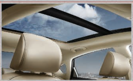
فتحة سقف بانوراما