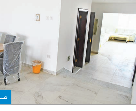
صالة للاستقبال وأخرى للمعيشة

في مشروع شقق شمال غرب الصليبيخات وشقق مدينة جابر، كانت هناك معاناة كبيرة في إيجاد مقر لاتحاد الملاك، فهل تغلبتم على هذه المشكلة بذلك المشروع؟