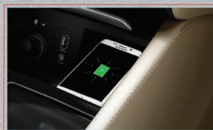
شاحن لاسلكي للهواتف الذكية