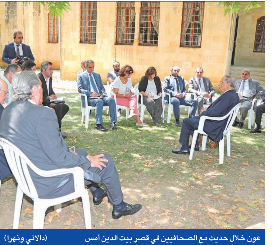
عون خلال حديث مع الصحافيين في قصر بيت الدين أمس (الاتي ونهرا)

بيروت - الجريدة. عادت عجلة الحياة السياسية في لبنان إلى الدوران وسط أجواء انفراجات داخلية، أحدثتها لقاءات تمت ومهدت للمعالجات بين وزير الدفاع وليد جنبلاط، ورئيس التكتل تيمور جنبلاط، ومن ثم بوفد كبير ضم زهاء 300 شخص من فاعليات الشوف للترحيب بالرئيس. وفي دردشة مع الصحافيين، أكد عون أنّ «الورقة الاقتصادية