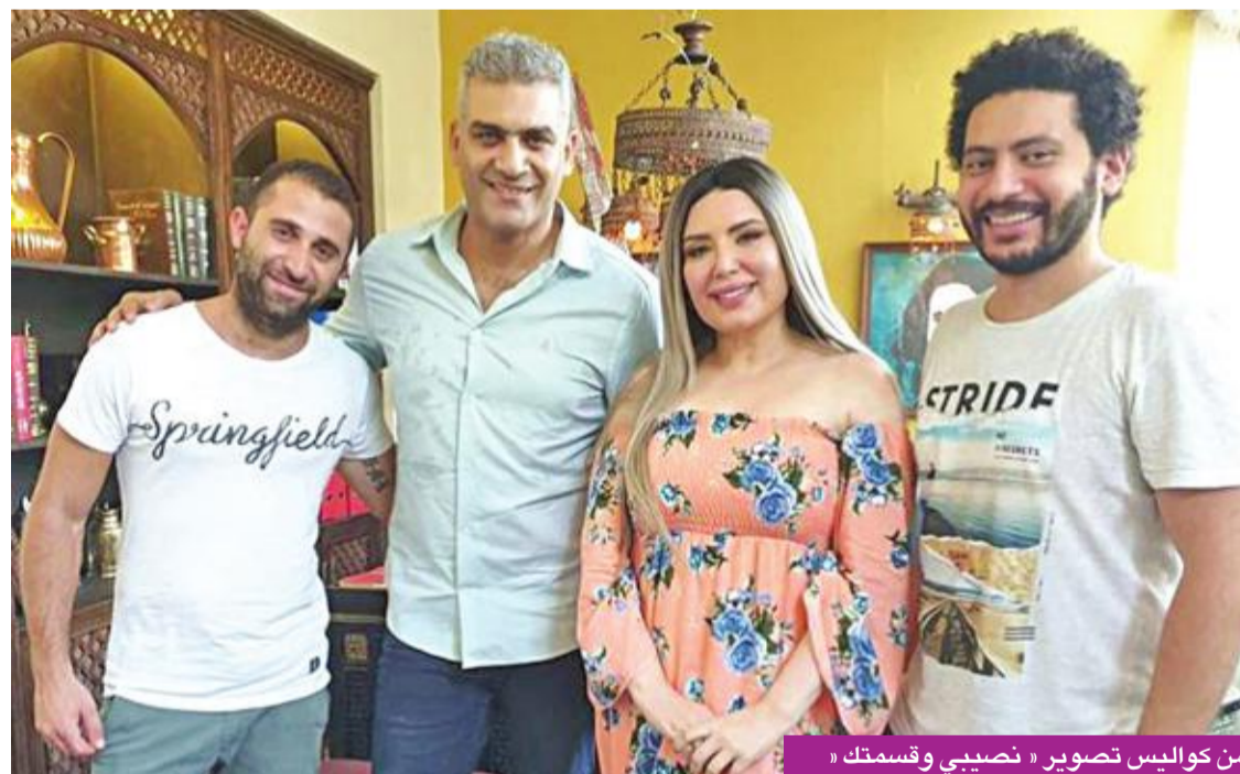
من كواليس تصوير «نصيبي وقسمتك»