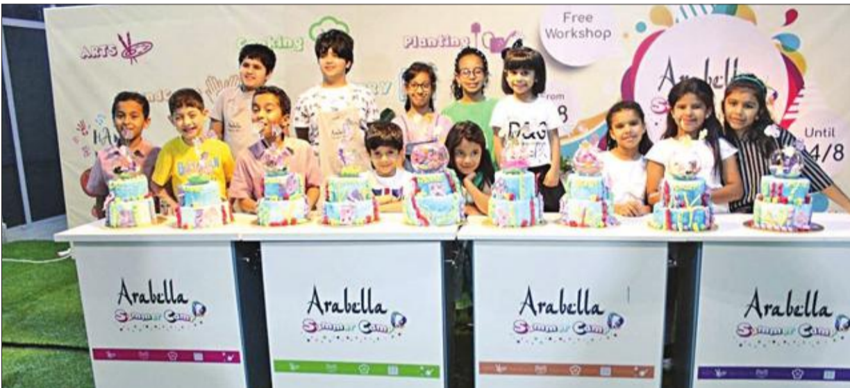
صورة جماعية للمشاركين