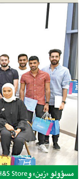
مسؤولو «زين» و H&S Store مع الطلاب والطالبات في ZINC

كُرمت شركة زين الطلاب والطالبات من منتسبي برنامج التدريب الميداني الصيفي في H&S Store، بالتعاون مع برنامج شبكة شباب زين FUN، خلال حفل الختام الذي استضافه مركز زين للإبداع (ZINC) بمقر الشركة الرئيسي في الشويخ. وتكرمت الشركة، في بيان صحفي، أن شراكتها لهذا البرنامج أتت تحت مظلة استراتيجيتها المتكاملة للمسؤولية الاجتماعية والاستدامة، والتي تركز بشكل كبير حول تنمية وتطوير قطاع الشباب والتعليم، وبالأخص فيما يتعلق بتنمية مهارات الإدارة لدى الفئات العمرية الشبابية. حيث تؤمن «زين» بأهمية تعزيز العلاقة بين الشركة والمجتمع الذي تعمل فيه، كونها إحدى أكبر الشركات الرائدة في القطاع الخاص الكويتي. ويجند «زين» أنها استضافت الطلاب والطالبات ومسؤولي H&S Store في مركزها للإبداع (ZINC) بمقر الشركة الرئيسي بالشويخ، حيث تم تكريم منتسبي برنامج التدريب