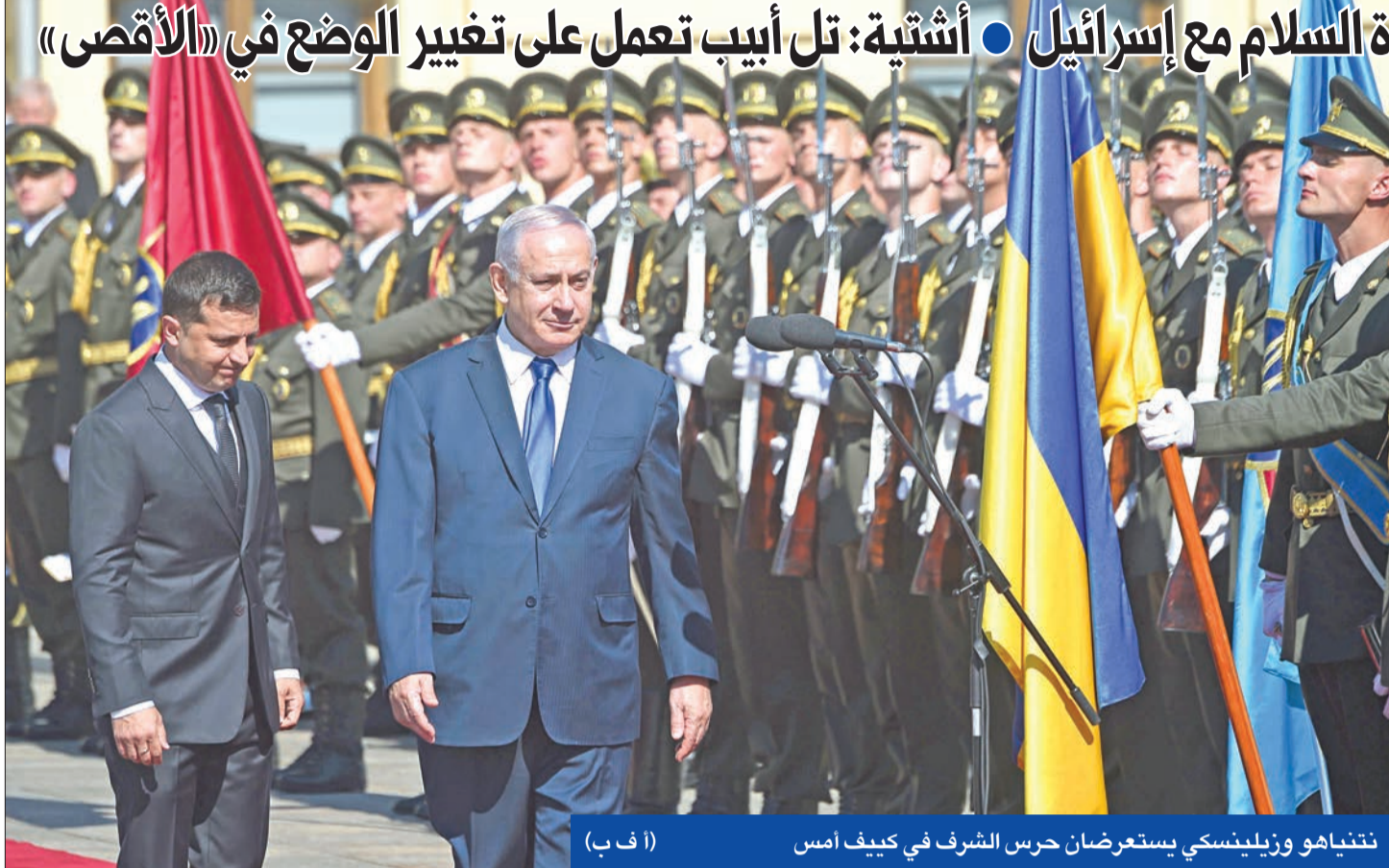
نتنياهو وزيلينسكي يستعرضان حرس الشرف في كييف أمس

● البرلمان الأردني لإلغاء معاهدة السلام مع إسرائيل ● أشتية: تل أبيب تعمل على تغيير الوضع في «الأقصى»