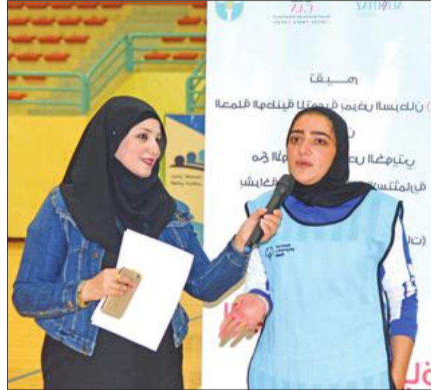
إحدى المشاركات متحدثة عن إنجازات المرأة