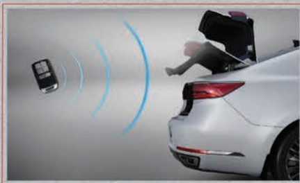
صندوق خلفي ذكي