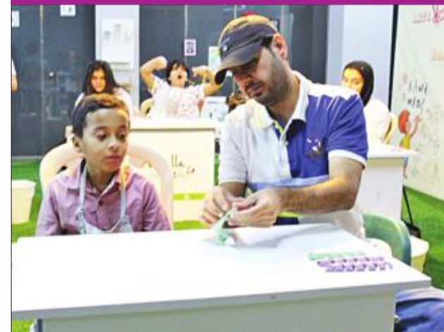
تدريب أحد الأطفال على القطع المستخدمة في تزيين الكيك

نظم «جونيو شيف كلوب» بالاتفاق مع المشاريع المصاحبة المختصة بتنويع الورش، فعالية نادي الأطفال الصيفي، باعتباره راعيا استراتيجيا للحدث، وتضمنت ورش عمل متنوعة وممتعة ما بين أنشطة ترفيهية ومفيدة كالحريرية والفنية والبيدوية والتعليمية والطهو، ولاسيما «تزيين الكيك»، وذلك في «أرابيلا»، وقدمت الورش للأطفال مجاناً. واستهدفت الفعالية شريحة الأطفال من عمر 6 إلى 12 سنة، إذ يسعى المسؤولون عن الفعالية دائماً إلى خلق أجواء ممتعة للأطفال تملأ أوقات فراغهم في العطلة الصيفية بالمشاركة في مثل هذه الفعاليات. وتشارك أيضاً في الفعالية طهارة من مشاهير «السوشيال ميديا».