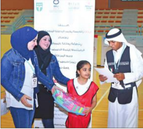
توزيع الهدايا على المشاركات