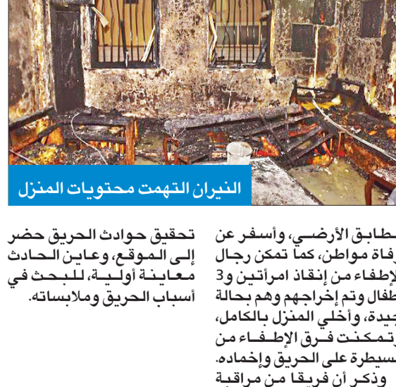
النيران التهمت محتويات المنزل

تذكرت إدارة العلاقات العامة والإعلام في الإدارة العامة للإطفاء، أن حريقاً اندلع مساء الأول، في أحد المنازل الكائنة بمنطقة السرة، أسفر عن وفاة مواطن في العقد الخامس من العمر. وفي التفاصيل التي رواها مدير الإدارة العميد خليل الأمير، أن مركز عمليات الإطفاء تلقى بلاغاً يفيد باندلاع حريق بأحد المنازل الواقعة في منطقة السرة، مع وجود أشخاص محتجزين، وعلى إثره توجهت فرق الإطفاء من مركزي إطفاء الشهداء وحولي. وأضاف العميد الأمير أنه عند وصول فرق الإطفاء للمنزل المكون من 3 طوابق تبين لهم أن الحريق نشب في صالة