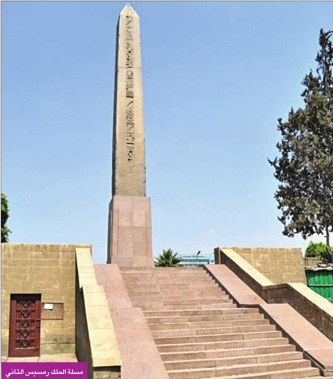
مسلة الملك رمسيس الثاني

مسلة رمسيس إلى العلمين وتابوت توت للمتحف الكبير... ومقبرة توتو للعاصمة الإدارية