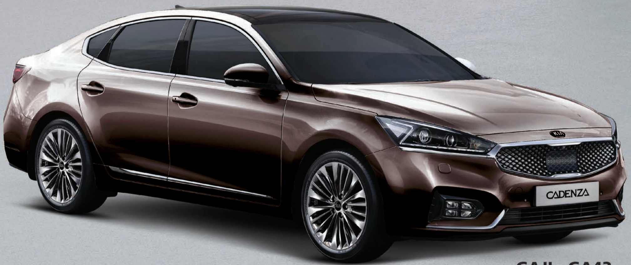
GAJI - GA43