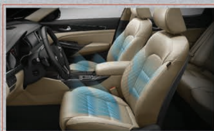
كراسي جلد كهربائية مع تدفئة وتبريد للمقاعد الأمامية