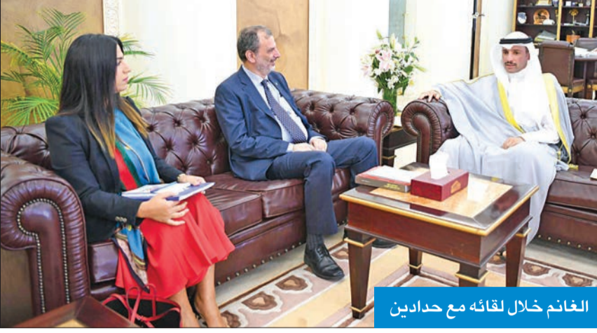
الغانم خلال لقائه مع حدادين

استقبل رئيس مجلس الأمة مرزوق الغانم بمكتبه امس، مدير مكتب مفوضية الأمم المتحدة لشؤون اللاجئين في الكويت الدكتور سامر حدادين، وحضر اللقاء عضو مجلس الأمة النائب محمد الدلال.