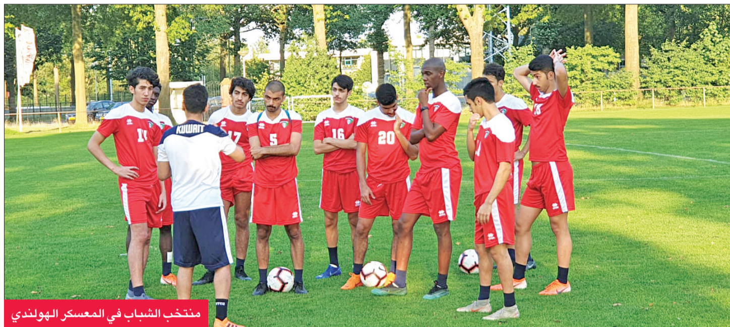
منتخب الشباب في المعسكر الهولندي

مع اللاعبين طالبهم خلاله ضرورة بذل أقصى مجهود ممكن لديهم في المعسكر للوصول إلى المستوى المأمول قبل انطلاق التصفيات. يذكر أن الأزرق سيخوض في معسكره السلوفيني 6 مباريات تجريبية متدرجة المستوى، يسعى من خلاله عبيد وعاونيه في الوقوف على مستوى اللاعبين، ووضع الخطة المناسبة للتصفيات التي تتسم بالقلوة والمنافسة الشرسة.