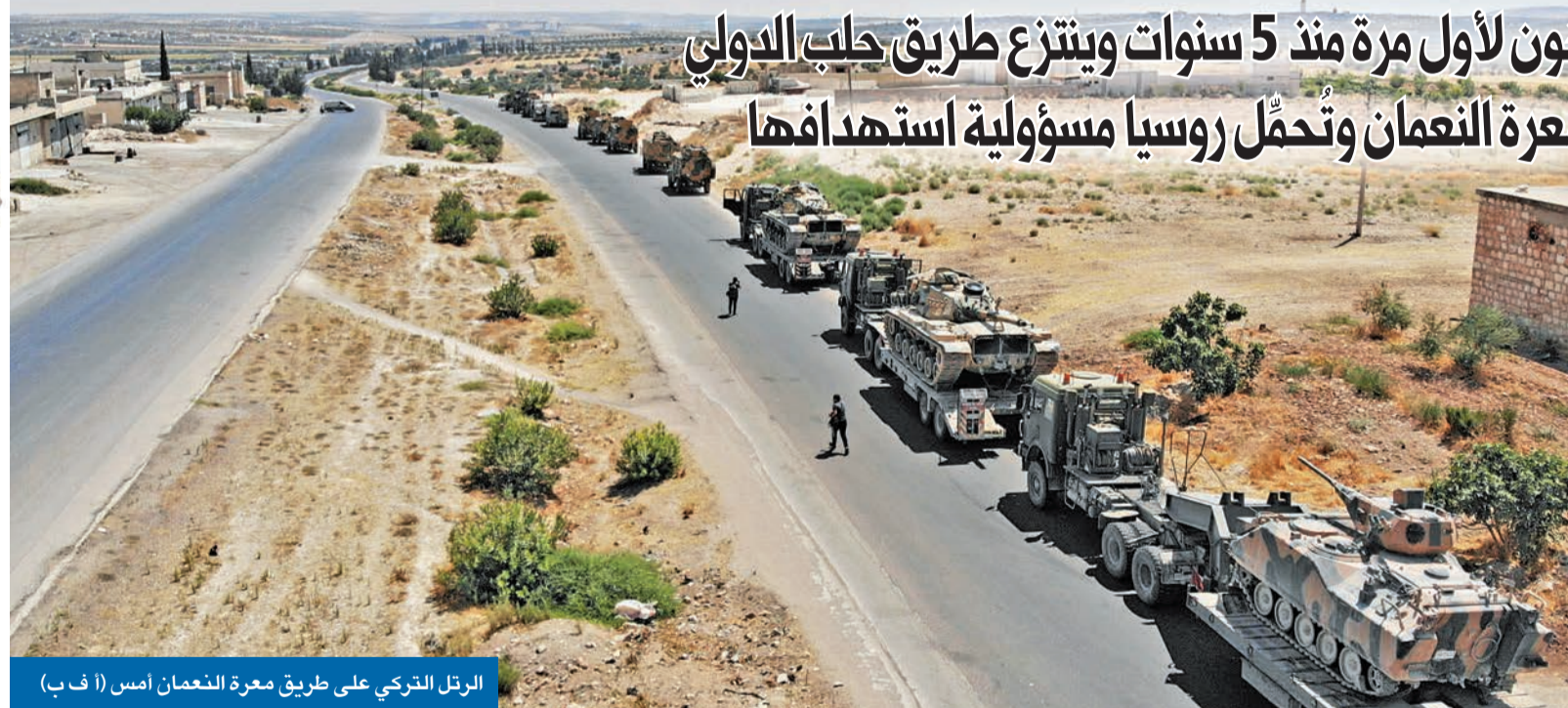
الرتل التركي على طريق معرة النعمان أمس (أ ف ب)

● النظام يدخل خان شيخون لأول مرة منذ 5 سنوات ويتنزع طريق حلب الدولي ● تركيا ترسل تعزيزات لمعرة النعمان وتحمل روسيا مسؤولية استهدافها