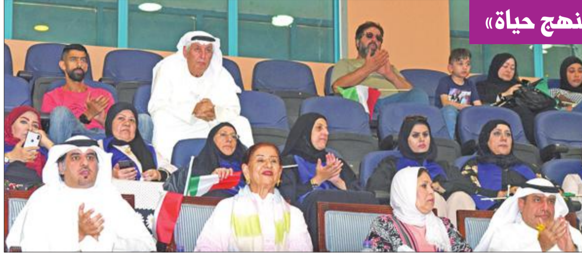
الشيخة متوسطة الحضور

أطلقت الحملة الوطنية للتوعية بمرض السرطان (كان) فعالية رياضية، وذلك بتخليم مباراة للعبة كرة السلة بالتعاون مع الأولمبياد الخاص الكويتي تحت شعار «الرياضة... منهج حياة». وضمت المباراة عددا من الرياضيين، وهي موحدة بين البنين والبنات، ويتكون الفريقان من ذوي الهمم والأصحاء. ويهذه المناسبة، أكد نائب رئيس الحملة الوطنية للتوعية بمرض السرطان (كان) د. خالد الصالح ضرورة الاهتمام بنمط حياة صحي يعود بالفائدة على صحة الإنسان ويساعد في حمايته من الأمراض. ومن جانبها، أشادت الشبيخة شيخة العبدالله بإقامة المباراة وبالنشاطات والفعاليات الرامية لدعم ورعاية القطاع الصحي الوثيق الصلة بحياة كل أفراد المجتمع الكويتي، مطالبة بمزيد من الفعاليات الرياضية التي تعزز دور حملة كان للتوعية بمرض السرطان من أجل رفع الوعي بأهمية الكشف المبكر عن الأمراض للوقاية منها وتفاذي تطورها.