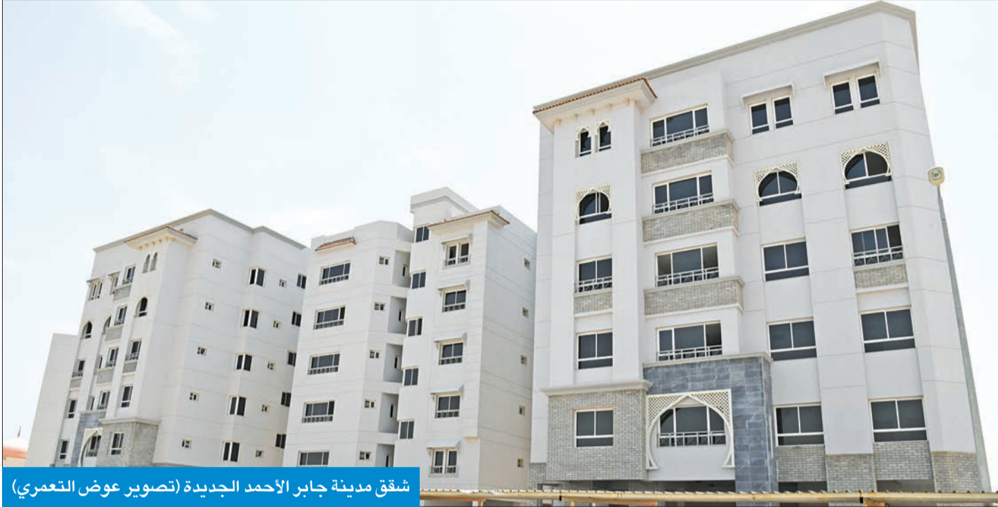
شقق مدينة جابر الأحمد الجديدة

خاص بها، مدخل رئيسي للأسرة ومدخل للسائق والديوانية، موضحاً أن ما يميز تلك الشقق عن شقق الصوابر هو تمتعها بخدمات منفصلة وتكييف مستقل. وبين أن الشقة الواحدة تضم 4 غرف نوم وغرفة متعددة الاستخدام وصالتين للاستقبال والمعيشة وديوانية، إلى جانب غرفتين للسائق والخادمة، بالإضافة إلى المطبخ، لافتاً إلى أن واجهات ومدخل الشقق والعمارات تتمتع بتصميم وألوان عصرية تواكب المواصفات الحديثة. وأوضح أن طاقة الشقة الاستيعابية تشمل أسرة مكونة من نحو 5 إلى 6 أفراد، إضافة إلى السائق والخادمة، لافتاً إلى توفير نحو 4 مواقف سيارات لكل شقة... وفيما يلي تفاصيل اللقاء: