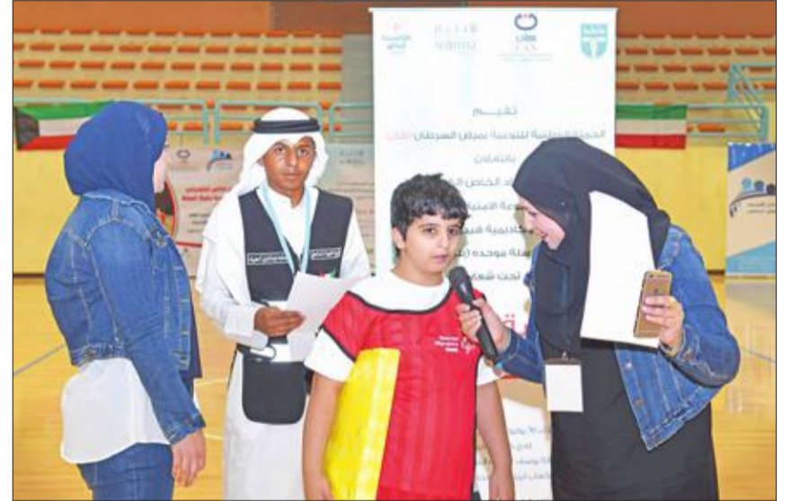
مشارك متحدثا عن هدفه في المشاركة