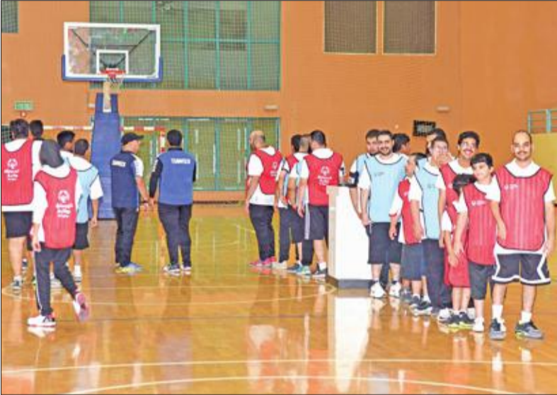
صورة جماعية للمشاركين