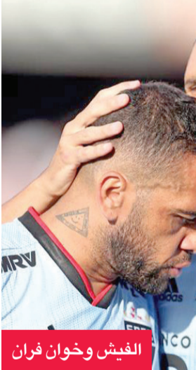
الفيش وخوان فران

حضر أدولفو جايش واليكسيس ماك اليستير، إضافة إلى عودة ماركوس روخو، أبرز المستحقات في قائمة المنتخب الأرجنتيني التي أعلنتها المدرب ليونيل سكالوني لمواجهتي المكسيك وتشيلي الوديعتين في سبتمبر المقبل.