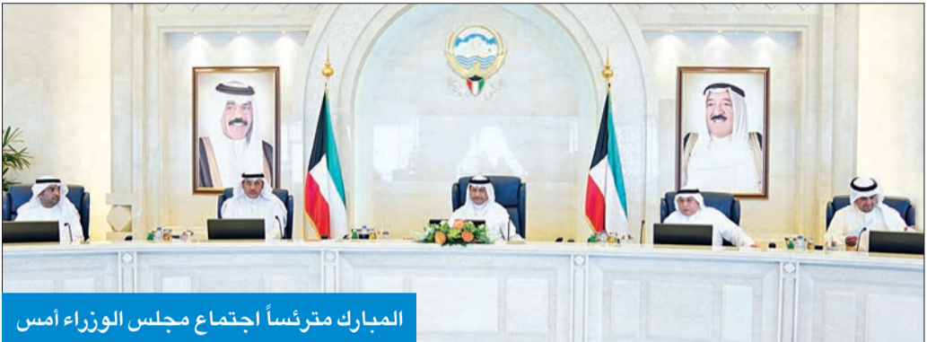
البارك متروساً اجتماع مجلس الوزراء أمس

كما قرر تكليف الهيئة العامة للطرق والنقل البري بالتنسيق مع كل من (وزارة المالية، ووزارة الأشغال، وبلدية الكويت، والمؤسسة العامة للرعاية السكنية) لضرورة إيجاد الحلول العاجلة والمؤقتة لمعالجة ظاهرة زحف الرمال (السافي) وتراكم الأتربة على الطرق السريعة التي تعاني من نفس الظاهرة في الكويت، وعلى صعيد الحل الجذري لهذه المشكلة،