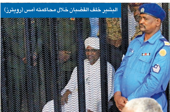
البشير خلف القضبان خلال محاكمته أمس

بينما لا تزال عملية انتقال السودان إلى سلطة مدنية بانتظار أول إجراء ملموس، مثل أمس الرئيس المعزول عمر البشير لأول مرة أمام المحكمة بتهمة الفساد وحيازة النقد الأجنبي والإثراء غير المشروع واستغلال النفوذ. وفي أول جلسات محاكمته، فجر البشير الذي حكم السودان طوال 30 عاماً وأطاحه الجيش في 11 أبريل تحت ضغط تظاهرات حاشدة، مفاجأة من العيار الثقيل باعترافة بتلقيه عشرات ملايين الدولارات من الخارج. وأكد المحقق في القضية العميد شرطة أحمد علي، للقاضي عند بدء جلسات المحاكمة ◀◀ 02