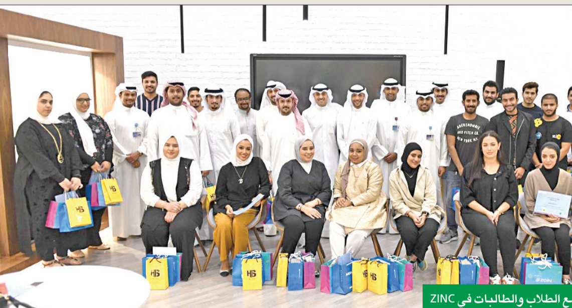
مسؤولو «زين» و H&S Store مع الطلاب والطالبات في ZINC

يحتاجونها لخوض سوق العمل، سواء على الصعيد المهني أو الشخصي. وأوضح «زين» أنها تحرص على دعم مجموعة كبيرة من البرامج والأنشطة التعليمية التي تعنى بتنمية مختلف المهارات لدى الشباب، منها برنامج «كن» لتطوير ريادة الأعمال الاجتماعية لدى الشباب الذي تنظمه مؤسسة لويك، بالتعاون مع كلية باسبون في بوسطن، التي تُعد إحدى أرقى المؤسسات التعليمية المتخصصة بزيادة الأعمال في الولايات المتحدة وحول العالم، ودعمها لأكاديمية «لويك أي سي ميلان لكرة القدم» وغيرها. وأكدت الشركة أنها تركز المزيد من الجهود والمبادرات التي تعزز من تطوير التنمية البشرية بالدولة وفي جميع المجالات، حيث لن تدخر جهداً لتسخير إمكانياتها لتعزيز الروابط مع الجهات والمؤسسات التي تعنى بالتعليم وتطوير الموارد البشرية، إلى جانب دعم المشاريع والمبادرات التي تسهم بشكل فعال في مجالات التنمية البشرية.