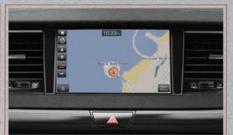
شاشة وسائط متعددة قياس 8 بوصة مع Apple CarPlay