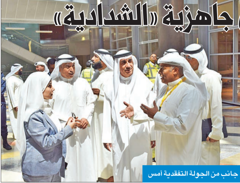
جانب من الجولة التفقدية أمس

المؤقتة، والعلامات الإرشادية. وتضمنت الجولة زيارة ميدانية لمباني الكليات الست التي تسلمتها الجامعة (الأدب، التربية، العلوم الإدارية، العلوم الحياتية، الهندسة والبتترول، والعلوم)، والتي سيتم انتقالها وفق ما أقره المجلس الأعلى للجامعة خلال اجتماعاته الأخيرة، إضافة إلى جولة في مرافق الحرم الجديد، والمختبرات والقاعات الدراسية، والطرق الداخلية للحرم، حرصاً على سير عملية الانتقال الجامعي بالصورة المثلى.