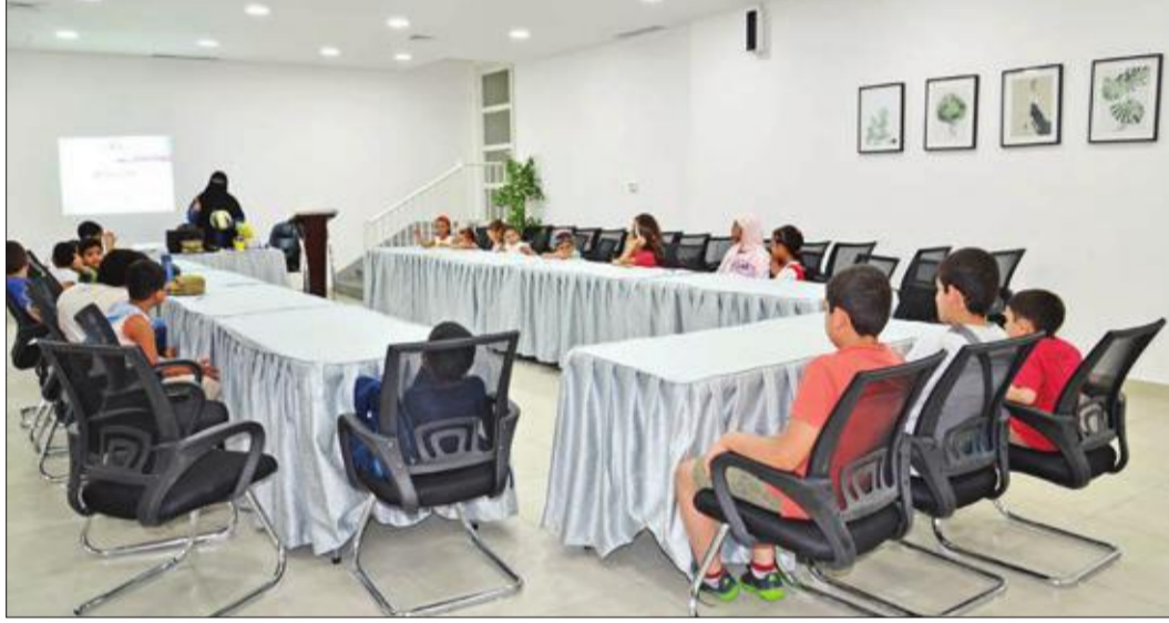
جانب من الورشة