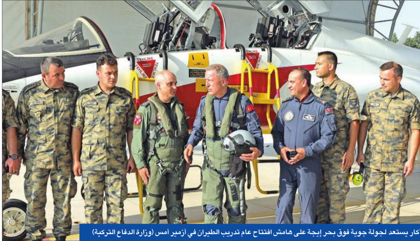
أكار يستعد لرحلة جوية فوق بحر إيجة على هامش افتتاح عام تدريب الطيران في أزمير أمس (وزارة الدفاع التركية)

● أنقرة لواشنطن: منطقة آمنة أو «الخطة ب» ● «النصرة» تخسر قاعدتها ودعوات حلها تتسع