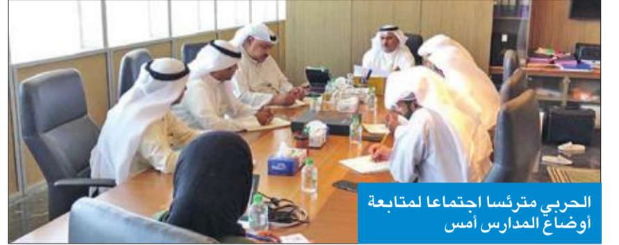
الحربي مترئسا اجتماعا لمتابعة أوضاع المدارس أمس

الحربي وقياديو الوزارة كثفوا جولاتهم للاطمئنان على المدارس