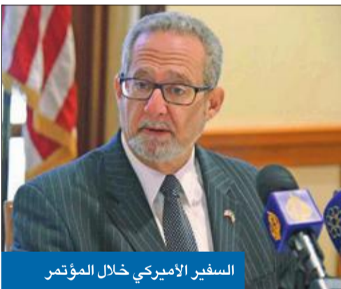
السفير الأميركي خلال المؤتمر

الولايات المتحدة من استمرار هذه الأزمة، متوقفاً قيام الرئيس ترامب وسمو الأمير ببحث أفضل السبل لاستعادة وحدة مجلس التعاون. وبينما كشف أنه سيتم خلال قمة الأمير-ترامب توقيع بعض الاتفاقيات التي بحثت أخيراً في الحوار الاستراتيجي، اعتبر سيلفرمان أن ملف حقوق العمالة المنزلية في الكويت شهد تطوراً ملحوظاً انعكس على موقعها في التقرير السنوي لحقوق الإنسان الصادر عن الخارجية الأميركية.