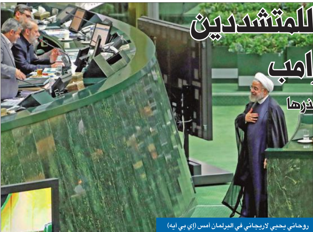
روحاني يحيي لاريجاني في البرلمان أمس (إي بي آيه)

بعد 8 أيام من إعلان الإيزيه عن تحضيرات لقمة غير مسبوق مع نظيره الأميركي دونالد ترامب خلال أسابيع، خضع الرئيس الإيراني حسن روحاني أمس لضغوط التغير المتشدد، مؤكداً أنه «لم ولن يقرر في أي مرحلة إجراء حوار ثنائي مع واشنطن». وفي مواجهة عريضة قدمها 83 نائباً، أغلبيهم من التيار الأصولي تتهمه بمخالفة توجيهات المرشد الأعلى علي خامنئي بمنع التفاوض مع واشنطن، قال روحاني، أمام مجلس الشورى: «لا نستطيع أن نشرح الأمر بشكل كامل في خطاباتنا، بظن البعض أن القصد من طرحنا للتفاوض هو محادثات ثنائية، للأجانب تصوراتهم في ذلك، لكن من يقرر مبادئ سياساتنا هو المرشد، جميعنا يسلك طريقاً واحداً، ولا يوجد أي خلاف في القضايا الوطنية».