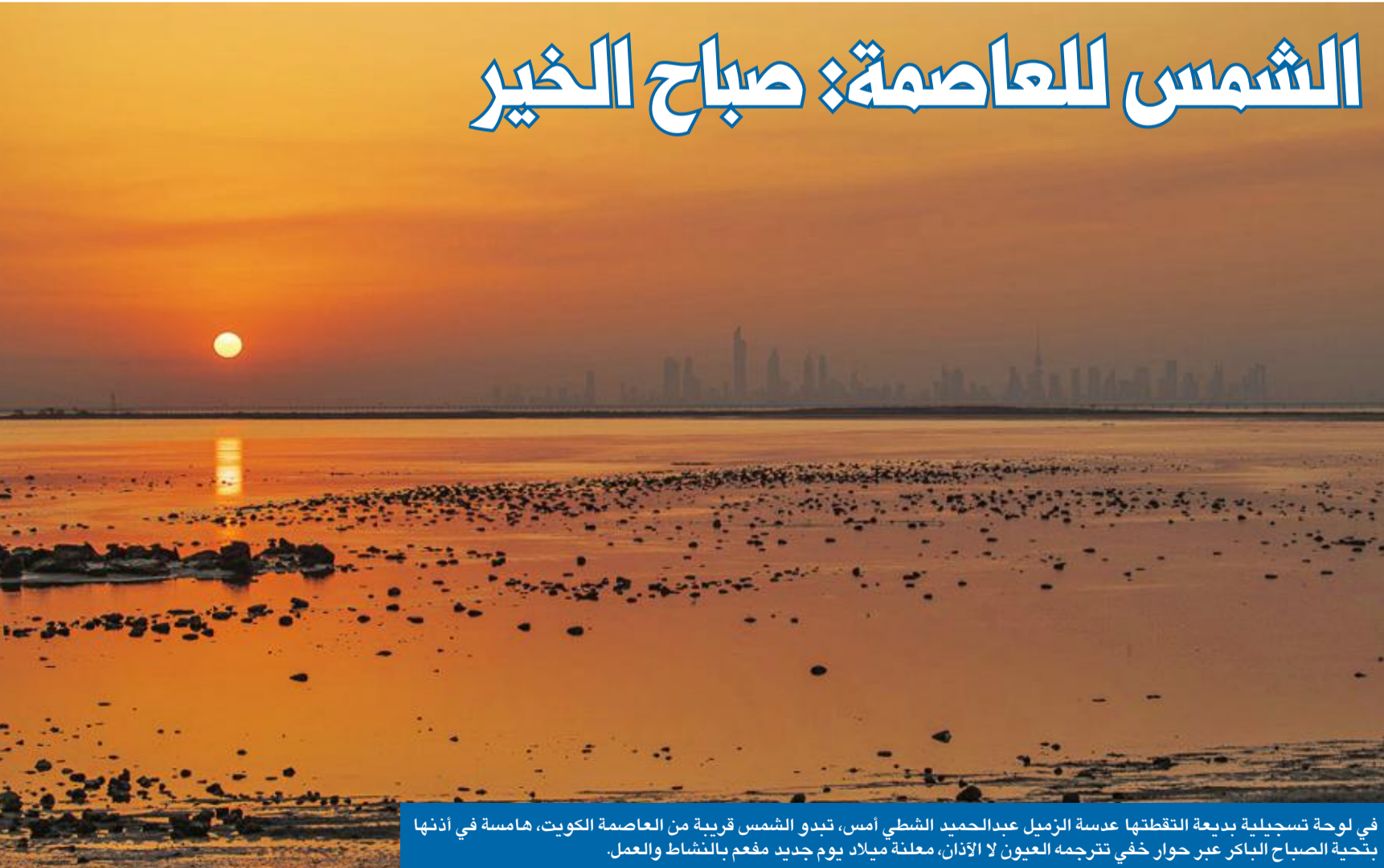
في لوحة تسجيلية بديعة التقطتها عدسة الزميل عبدالحاميد الشطي أمس، تبدو الشمس قريبة من العاصمة الكويت، هامة في أذننا بتحية الصباح الباكر عبر حوار خفي تترجمه العيون لا الأذان، معلنة ميلاد يوم جديد مفعم بالنشاط والعمل.

الشكاوى والتوزيع: شركة الجريدة للصحافة والنشر والتوزيع تلفون: 1828111 - داخلي: 700 - فاكس: 22252537 البريد الإلكتروني: ads@aljarida.com