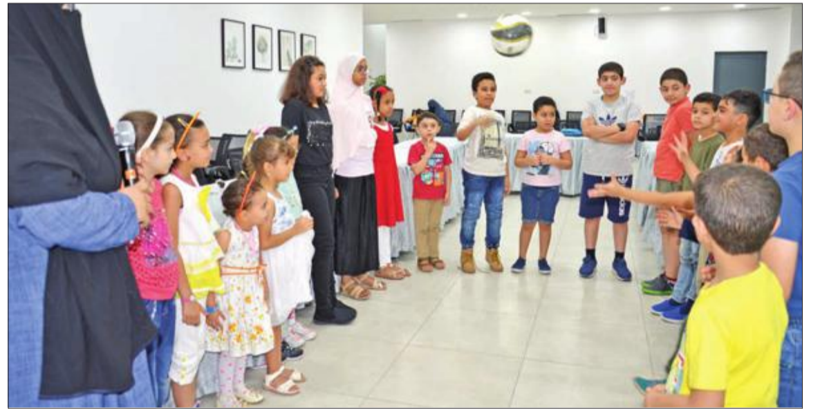
تدريب الأطفال من خلال اللعب