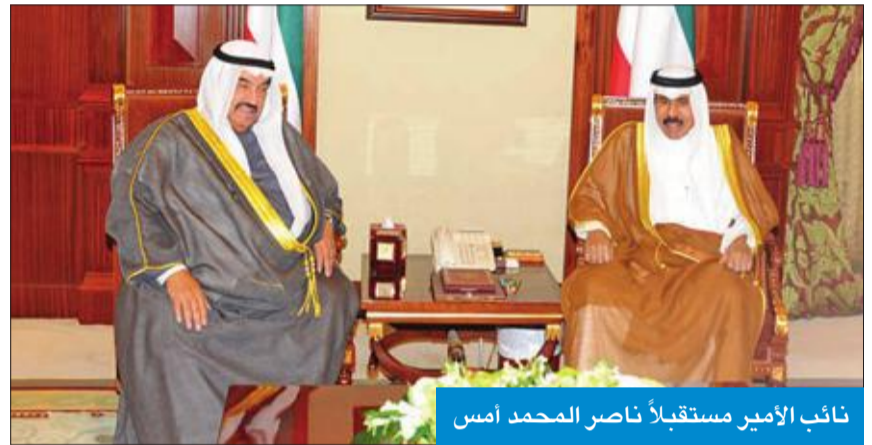
نائب الامير مستقبلاً ناصر المحمد امس

استقبل سمو نائب الامير ولي العهد الشيخ نواف الاحمد بقصر بيان صباح امس سمو الشيخ ناصر المحمد.