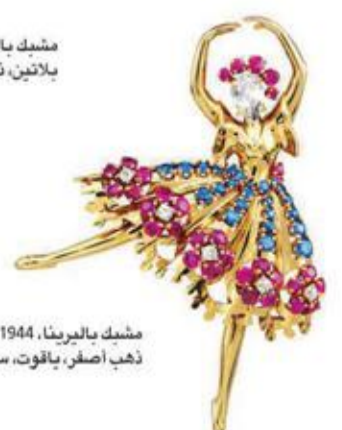
مشبك بالبالييرينا، 1944. ذهب أصفر، ياقوت، سافير، ماس