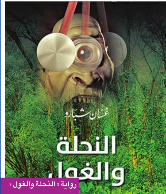
رواية «النحلة والغول»

100 ألف مشترك على قناته الخاصة على اليوتيوب وهؤلاء هم أصدقاؤه.