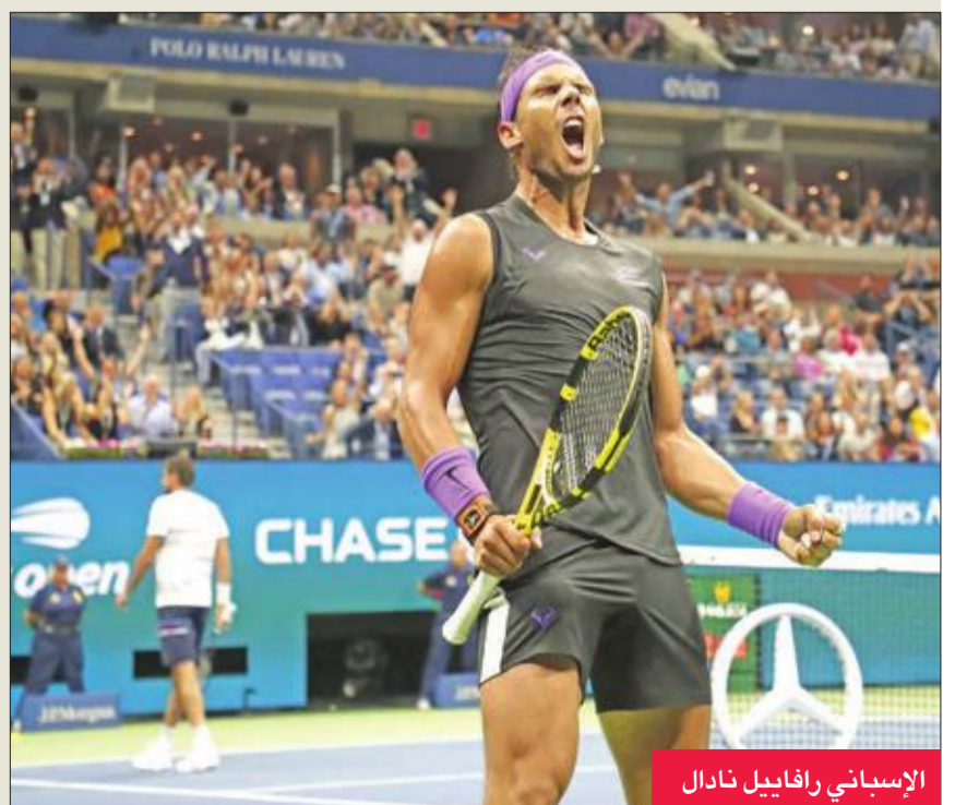
الإسباني رافايل نادال

خسر الإسباني رافايل نادال المصنف ثانياً مجموعة، لكنه سيخوض ربع نهائي بطولة الولايات المتحدة، آخر البطولات الأربع الكبرى في كرة المضرب، خلفاً لليابانية ناومي أوساكا، التي خسرت صدارة التصنيف العالمي. لدى الرجال، خسر نادال (33 عاماً) مجموعته الأولى في الدورة، لكنه تخطى الكرواتي مارين سيليتش المتوج في 2014 بالمركز الثاني والعشرين 3-6 و6-3 و1-6 و2-6. ليبلغ ربع النهائي الرابعين في البطولات الكبرى بينها 9 مرات في "فلاشينغ ميدوز". وتبادل الإسباني الفوز مع خصمه في أول مجموعتين، لكنه سيطر على الثالثة والرابعة وأحرز تسعة أشواط متتالية، بعد سلسلة من الضربات الناجحة تفاعل معها بشكل كبير نجم الغولف العالمي الأميركي تايفر وودز الموجود على المدرجات. ويلتقي نادال في دور الثمانية الأرجنتيني ديفغو شفارتسمان العشرين، والذي أفضى الألماني الكسندر زفيريف المصنف سادساً 3-6 و6-2 و6-4 و6-3.