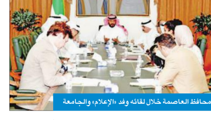
محافظ العاصمة خلال لقائه وفد «الإعلام» والجامعة