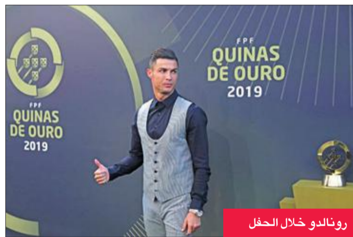
رونالدو خلال الحفل

ولتعب صربيا وإيطاليا بالدور الثاني في مجموعة تضم منتخب إسبانيا حامل لقب نسخة 2006، والذي حجز البطاقة الأولى عن نظيره البورتوريكي 73-63. وفي المجموعة ذاتها، عزز المنتخب التونسي، بطل إفريقيا 2017، أماله بلوغ الدور الثاني