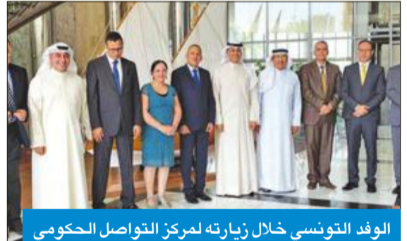
الوفد التونسي خلال زيارته مركز التواصل الحكومي