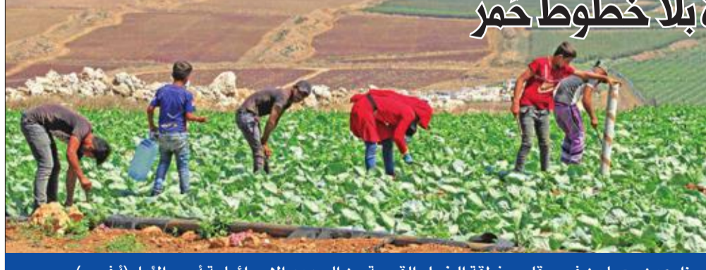
مزارعون يعملون في حقل بمنطقة الخيام القريبة من الحدود الإسرائيلية أمس الأول

حسن نصرالله، قال في كلمته أمس الليلة الثالثة من عاشوراء مساء أمس الأول، إن المقاومة كسرت أكبر خط أحمر إسرائيلي قائم منذ عشرات السنين، وثبتت المعادلة التي أراد رئيس الوزراء الإسرائيلي بنيامين نتنياهو كسرهما. وأضاف: «النتيجة كانت أننا ثبتنا للدفاع عن لبنان وسيادة لبنان وكرامة لبنان وأمن لبنان وشعب لبنان، وليس هناك خطوط حمر بعد الآن».