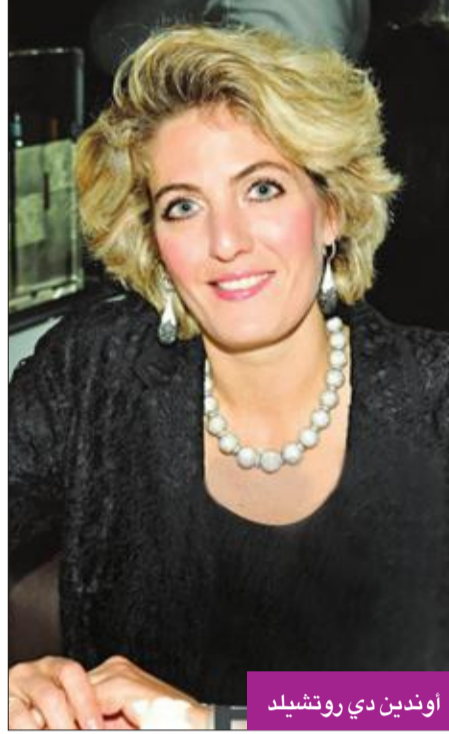
اوندين دي روتشيلد

بعد مرور 58 عاماً، عادت التحقيقات في قضية وفاة نجمة هوليوود مارلين مونرو، حيث طالب الضابط المتقاعد جاك كليمنس السلطات بإعادة فتح قضية مقتلها من جديد. ويعتقد جاك أن وفاة مونرو في ظل ظروف غامضة كان مركباً، وليس صدفة، وهناك أدلة تشير إلى ذلك، وخاصة أنه أول من وصل إلى مكان وفاتها في 5 أغسطس 1962. ولفت كليمنس الانتباه إلى أنه لم ين كاس ماء في غرفة مونرو، الأمر الذي يصعب عليها ابتلاع الأقراص المهدئة التي أدت إلى وفاتها. وأشار إلى أنه رأى حبتها مديرة المنزل إيونيس موراى تغسل شيئاً ما في غسالة الصحون، لكنه لم يحقق في الأمر. من جهة أخرى، تظهر في الصورة التي التقطتها الشرطة في مكان الحادث، كاساً من الزجاج إلى جانب سرير مارلين، ويُعتقد أنها ضمن 12 كاساً ابتاعتها مونرو من المكسيك.