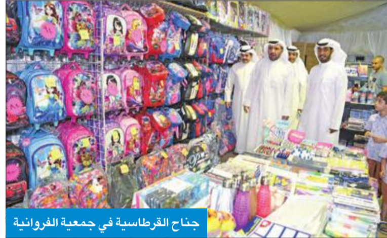
جناح القرطاسية في جمعية الفروانية