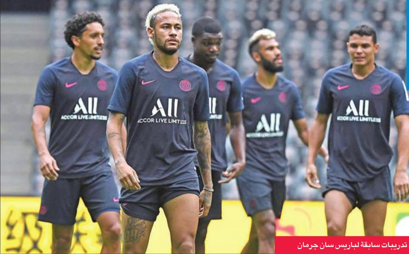
نيمار خلال تدريبات سابقة لباريس سان جرمان