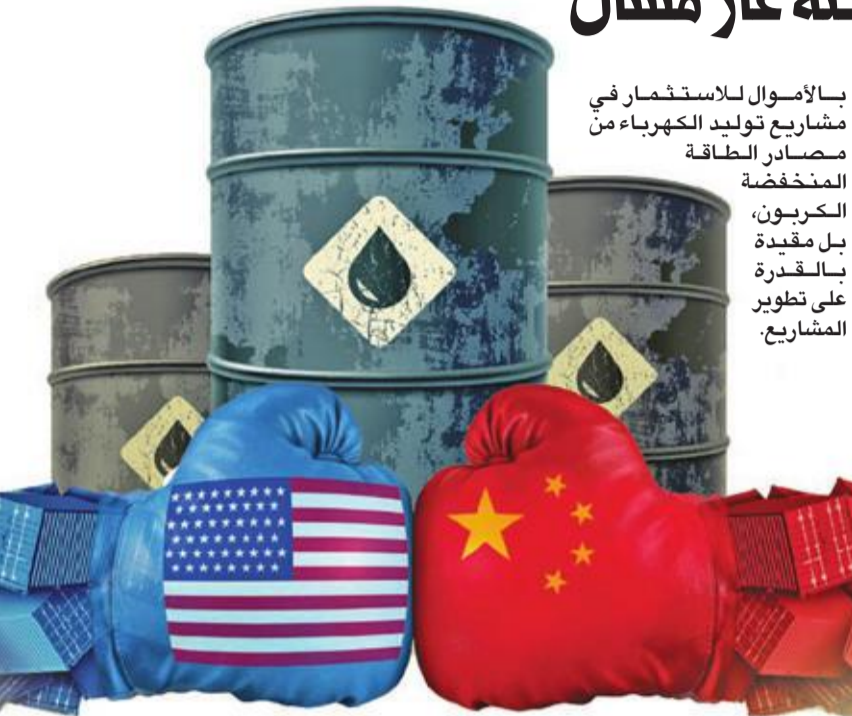
بالأموال للاستثمار في مشاريع توليد الكهرباء من مصادر الطاقة المنخفضة الكربون، بل مقيدة بالقدرة على تطوير المشاريع.

لا يزالان يعتزمان اللقاء في وقت لاحق هذا الشهر لإجراء محادثات. وأظهرت بيانات من البنك المركزي أن اقتصاد كوريا الجنوبية نما بأقل من المتوقع في الربع الثاني، إذ تمت مراجعة الصادرات بالخفض في ظل النزاع التجاري الأميركي/الصيني الذي طال أمده. ويلقي تحرك الأرجنتين الأحد لقرض قيود على رؤوس الأموال الخسوء أيضا على مخاطر في الأسواق الناشئة.