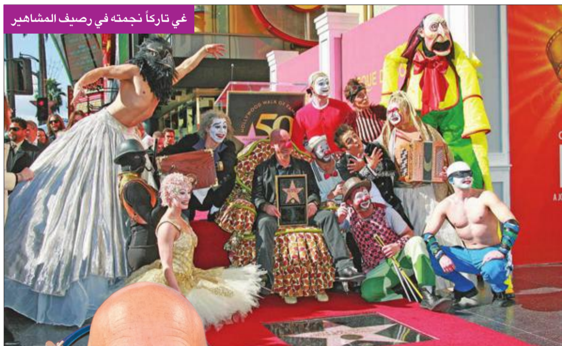
في تاركاً نجمته في رصيف المشاهير

أحداث فنية كبيرة احتضنها مدينة مونتريال الكندية. أهمها سيرك دو سوليفي، كما نظم مهرجانات ثقافية كبيرة، مثل «فرانكوفولي» والجاز، مصحوبة بقطاع دينامي للألعاب الفيديو.