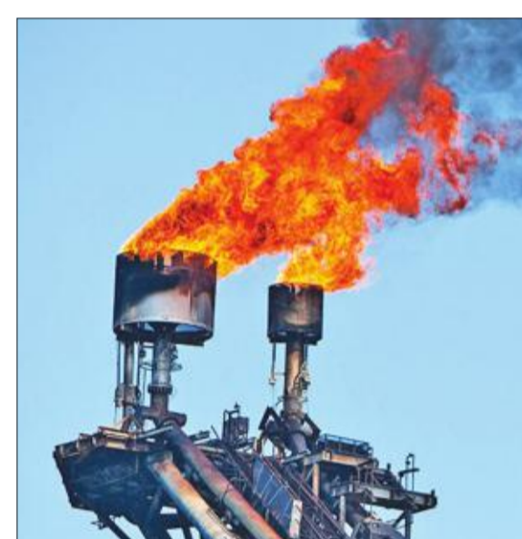
في حالة مثيرة للجدل، منحت اللجنة ترخيصا لإسكو ريسورسز في السداس من أغسطس، رغم أن الشركة كانت قادرة على استخدام خطوط الأنابيب، لكنها ادعت أن ذلك سيسبب لها خسارة مالية.

توقع تقرير حديث صادر عن البنك الدولي أن يسجل حجم التحويلات إلى الدول منخفضة الدخل زيادة سنوية قدرها 9.6 في المئة بنهاية 2019، لتصل إلى 550 مليار دولار، مقارنة بالعام الماضي. وتشمل الدول منخفضة الدخل (LMICs)، بحسب تصنيف "الدولي" 90 دولة تقع 20 منها في منطقة الشرق الأوسط وشمال إفريقيا.