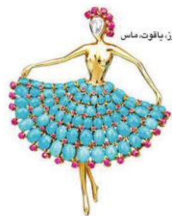
مشبك بالبالييرينا، 1952. بلاتين، ذهب أصفر، فيروز، ياقوت، ماس