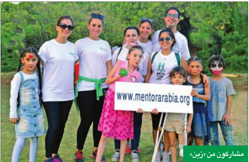
مشاركون من «زين»

مبتنور العربية، ستشهد الشراكة الاستراتيجية مع مجموعة زين قيام الطرفين بتطوير جهود عمل مشتركة مع الكيانات وأصحاب المصلحة المعنيين، والتواصل مع الهيئات الفاعلة في مجال تمكين الشباب وتنسيق مراحل التنفيذ المختلفة للبرامج المشتركة. أيضاً، ستعمل مجموعة زين و«مينتور العربية» على تعزيز مساعيها من خلال العديد من منصات الإعلام ووسائل التواصل الاجتماعي، وخلق فرص لحشد الموارد لدعم عمل مبتنور العربية وزيادة عدد المستفيدين من البرامج والمبادرات المشتركة.