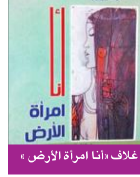
غلاف «أنا امرأة الأرض»