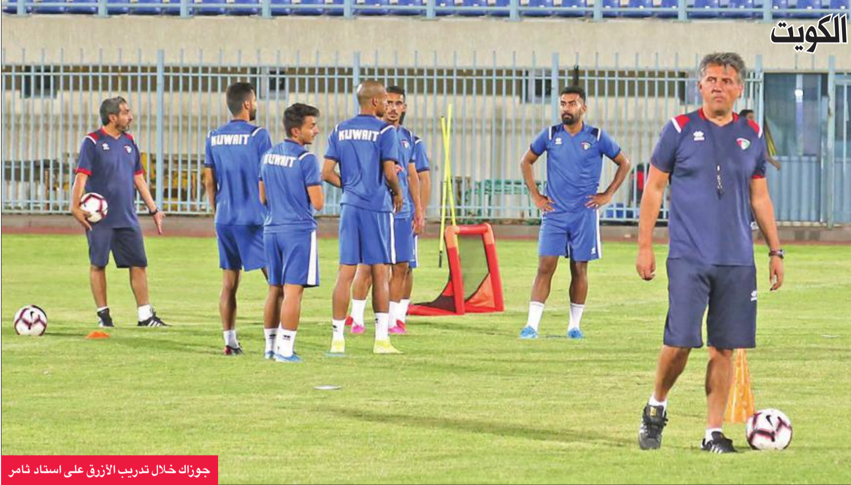
جوزاك خلال تدريب الأزرق على استاد ثامر

السلبيات والأخطاء، بداية من مواجهة نيبال. وتابع: "واجهنا المنتخب النيبالي في مباراتين وديتين بالكويت في مارس الماضي، وهو ما يعني أن لاعبي الأزرق على علم تام بإمكانيات المنافس، ومن المؤكد أن الفوز بالمباراة الافتتاحية وحصد النقاط الثلاث سيرفع من الروح المعنوية للجميع قبل مواجهة أستراليا المقبلة".