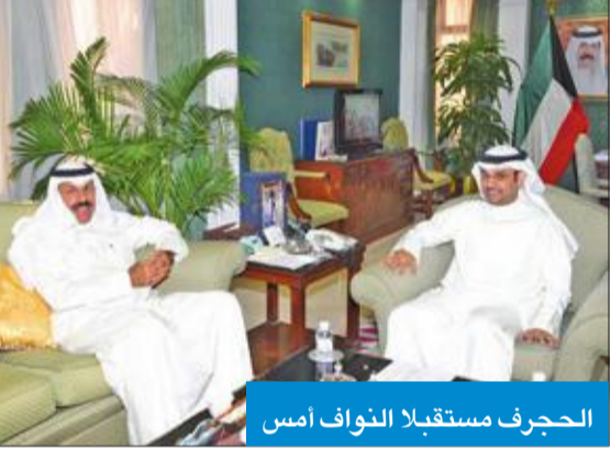
الحجرف مستقبلاً النواف أمس

اللذين تحظى بهما بعثة بلاده على كافة المستويات الرسمية والشعبية.