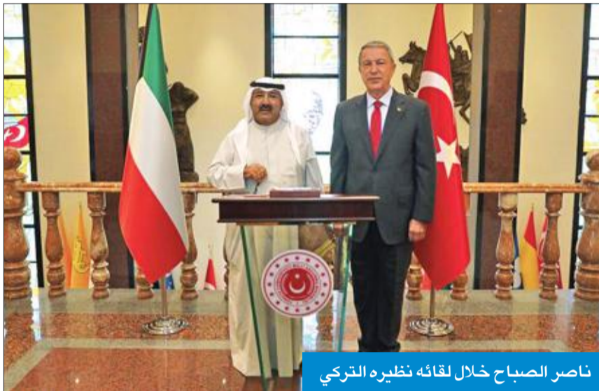
ناصر الصباح خلال لقائه نظيره التركي