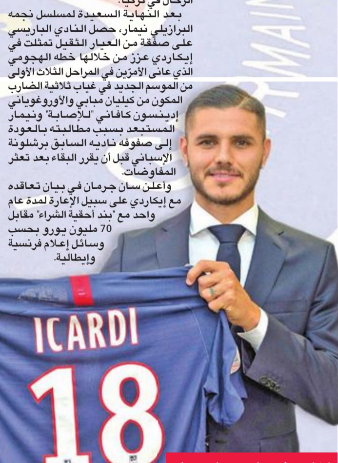
إيكاردي نجم باريس سان جرمان

وفي وقت مبكر ظهر أمس، أعلن سان جرمان رسمياً تعاquه مدة أربعة أعوام مع نافاس، ورحيل حارس مرماه سانشينز في صفقة أربو إلى صفوف النادي الملكي على سبيل الإعارة عاماً واحداً في صفقة لا تتضمن خيار الشراء النهائي. واضضى نافاس خمسة أعوام في صفوف ريال "2014-2019"، أحرز خلالها