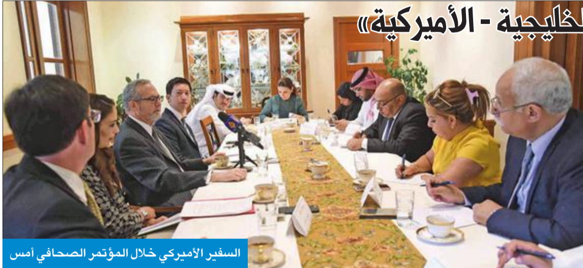
السفير الأميركي خلال المؤتمر الصحفي أمس

«لا موعد محدد حتى الآن لانعقاد القمة الخليجية - الأميركية»