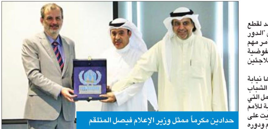
حدادين مكرماً ممثل وزير الإعلام فيصل المتلقم

فكانت للمفوضية شراكة متميزة وناجحة مع الكويت التي بلغت تبرعاتها خلال العام الماضي أكثر من 400 مليون دولار لمختلف الأزمات الإنسانية حول العالم.