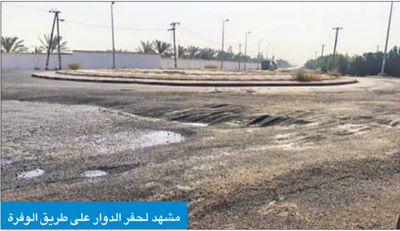
مشهد لحفر الدوار على طريق الوفرة

نشأ عدد من أصحاب المزارع ورواد طريق الوفرة، وزارة الأشغال وهيئة الطرق، إصلاح الدوار الواقع على طريق 500 الوفرة قبل مضخة المياه. وأشار أصحاب المناشدات، التي وردت لـ"الجريدة"، إلى أن الحفر والانخسافات الكبيرة للطريق على امتداد الدوار والمساربات المؤدية إليه تسببت في حوادث كثيرة وأعطال لمركبات دفع أصحابها ثمناً كبيراً، لاسيما بعد تأخر