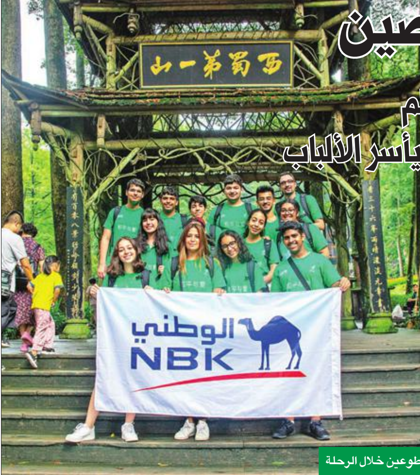
لقطتان جماعيتان للمتطوعين خلال الرحلة