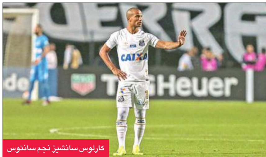
كارلوس سانتوس نجم سانتوس

أفلت سانتوس من الهزيمة أمام أتلتيكو بارانينسي، وانتزع تعادلا صعبا ومخاطرا 1-1 مساء أمس الأول في المرحلة 18 من الدوري البرازيلي لكرة القدم، التي شهدت أيضا فوز بوتافوجو على أتلتيكو مينيرو 2-1 وجريميو على مضيغه كروزيرو 4-1 والأجانو على شابيكوينسي 2- صفر.