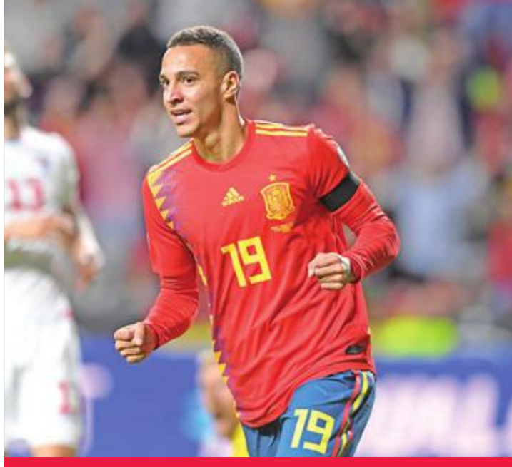
رودريغو نجم منتخب إسبانيا يحتفل بهدفه الأول أمام جزر فارو

بفضل قائدتها هنريك مختياريان الذي سجل هدفين (3 و66)، وصنع الهدف الثالث الذي سجله هوفهانيس هامبارزوميان (77) وتسببه ملعب أولمبيكو ممثلاً عن آخره. وأضاف: «سيطرنا على مجريات اللعب لكننا خسرننا بعض الكرات السهلة. شعرنا بالخوف عندما كانت النتيجة 1-1 لكن الشباب قاموا بعمل جيد على العموم». وانعشت أرمينيا أماله بفوزها الثمين على ضيفها البوسنة 4-2 في بريغان