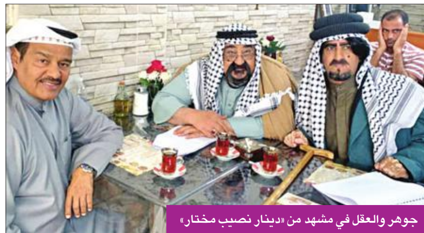
جوهر والعقل في مشهد من «دينار نصيب مختار»

كان مطلوباً لثمانية محطات بخلاف تلفزيون الكويت وتسبب إرجاء التلفزيون عرض العمل إلى توقف المفاوضات مع هذه المحطات حتى تتضح الصورة بموعد العرض الجديد. وأضاف في السياق نفسه، «أتابع عن كثب سير الأمور ووصلت إلى نتيجة أن المسلسل دخل الرقابة وتمت إجازته في انتظار إرجائه بالدورة التلفزيونية الجديدة، لكن كما تعرف الفترة الماضية كنا في عطلة الصيف والآن بصدد شهر محرم كل شيء متوقف والرؤية غير واضحة هل هناك منتج منفذ لأعمال جديدة أم لا؟، ومتى ستعرض الأعمال الجاهزة؟ كلها أسئلة دون إجابات وأتمنى أن تتضح الأمور