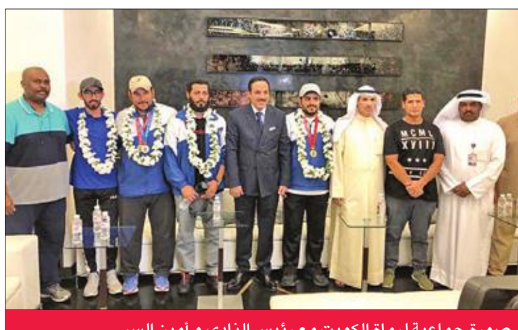
صورة جماعية لرماة الكويت مع رئيس النادي و أمين السر

من أبرز المنتخبات في هذه الرياضة لاسيما من آسيا اتسمت بالقوة والندية إذ كانت المسابقات صعبة وقوية معرباً عن سعادهته بتحقيقه وزملائه هذا الإنجاز التي تسجل باسم الرماية الكويتية. (كونا)