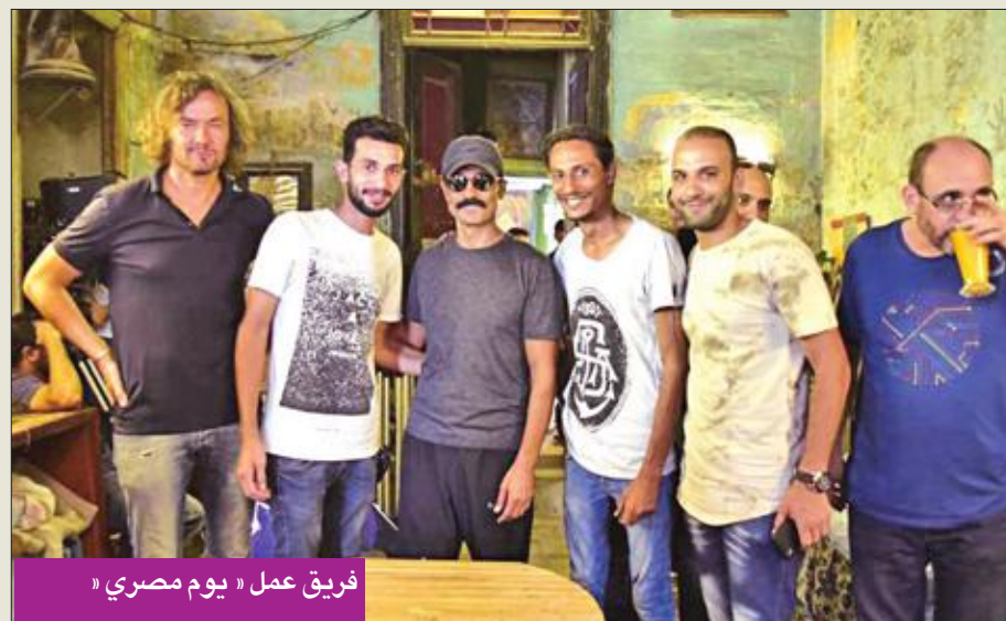
فريق عمل «يوم مصري»