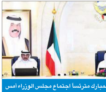
المبارك مترئساً اجتماع مجلس الوزراء أمس

المراق الحكومية في المدينتين، وفق الجدول الزمني المعد، وموافاة السكنية خلال أسبوعين، بالخطوات التي اتخذتها تلك الجهات تنفيذاً للقرارات الصادرة من مجلس الوزراء بهذا الشأن.