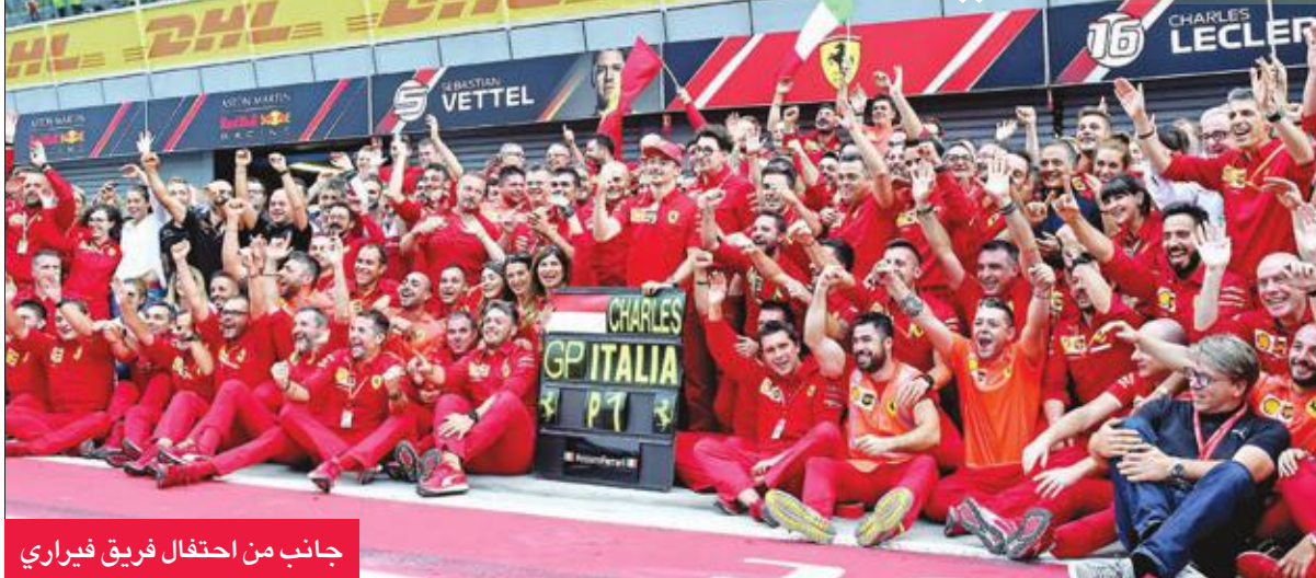
جانب من احتفال فريق فيراري

المركز الـ 13 بعد انطلاقه من المركز الرابع، وهو الفوز الثاني للوكلير والثاني تواليا في بطولة 2019، بعد جائزة بلجيكا الأسبوع الماضي، وأصبح به أول سائق لفيراري يفوز بجائزة إيطاليا الكبرى، منذ بطل العالم مرتين الإسباني فرناندو ألونسو في عام 2010. ومنح لوكلير فيراري الفوز الثاني في موسم ينهد هيمنة لمرسيدس. وقال السائق، بعد تتويجه: "يا له من صباح لم يسبق لي أن شعرت بالتعب إلى هذا الحد خلال السباقات. لقد كان صعباً جداً، بالنسبة إلي إنه حلم أن أفوز هنا أمام الحيفوري (مشجعي فيراري)، شكراً جميعاً". وشهد السباق تنافسا قويا بين لوكلير وهاميلتون على حلبة مونزا، التي استضافت سباق الجائزة الكبرى للمرة 69، أكثر من أي حلبة أخرى في تاريخ بطولة العالم للفورمولا واحد التي انطلقت في عام 1950. وامنح السائقان بتنافسهما. وتمكن لوكلير من الحفاظ على صدارته عند الانطلاق على رغم محاولة البريطاني بطل العام خمس مرات تتجاوز، وبسط ضغط أيضاً من بوتاس ثالث المنطلقين.