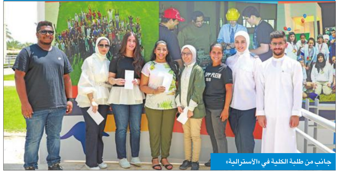
جانب من طلبة الكلية في «الأسترالية»

تخلت الكلية الأسترالية في الكويت جولات تعريفية للطلبة المستجدين لمدة يومين، للوقوف على قواعد وانظمة الكلية، والتي تعد مهمة لإرشاد الطلبة وتهيئتهم للنجاح خلال مسيرتهم الجامعية. وركزت الكلية، في بيان صحفي، أمس، أن فعاليات «عودة الدراسة» تقام مرتين في العام خلال بداية كل فصل دراسي، حيث تقدم للطلبة أنشطة ترفيحية مختلفة طوال الأسبوع الأول من الفصل الدراسي. وأشارت إلى أن هذه الفعاليات اشتملت على مسابقات متعددة، منها مسابقة الأسئلة الترفيحية ولعبة «البينغون»، حيث حصل الفائزون على جوائز، واشتمل الحفل أيضاً