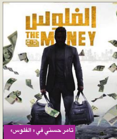
تامر حسني في «الفلوس»

تدخل مجموعة من شركات الإنتاج السينمائي في مصر جو المغامرة بأفلام جديدة بين موسمي عيد الأضحى وראس السنة المقبلة، مع بداية الموسم الشتوي خلال أكتوبر المقبل.