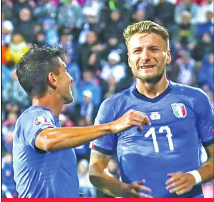
تشيرو إيموبيلي مهاجم إيطاليا يحتفل بهدفه في شبك فنلندا