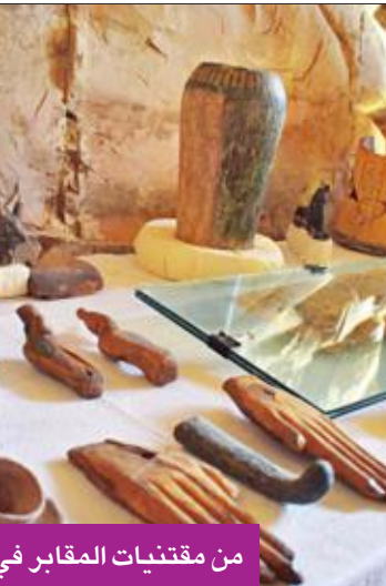
من مقتنيات المقابر في منطقة أبو النجا

عقب افتتاح مقبرتي مايا وريا لكبار رجال الدولة، تفقد وزير الآثار خالد العناني معبد خنسو بالكرنك، حيث تم الانتهاء من ترميم مقاصره، إذ تم ترميم الصالة الخاصة به والتي تضم الأعمدة الخارجية، وتمت إعادة الألوان كما لو