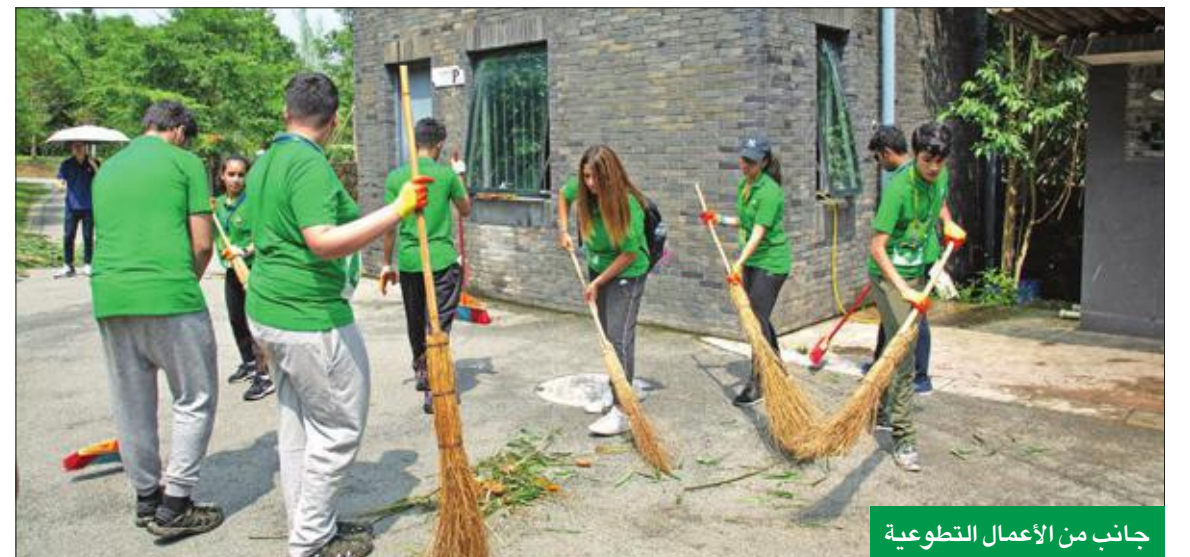
جانب من الأعمال التطوعية