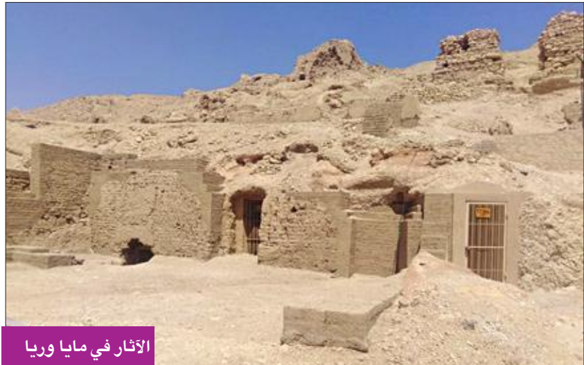
الإثار في مايا وريا

تمثال فرعوني متنوعة الأحجام، ومنها جرى التوصل لكونز مقبرتين آخرتين تم العثور عليهما في بئر بعمق 7 أمتار داخل مقبرة «أوسرحات».