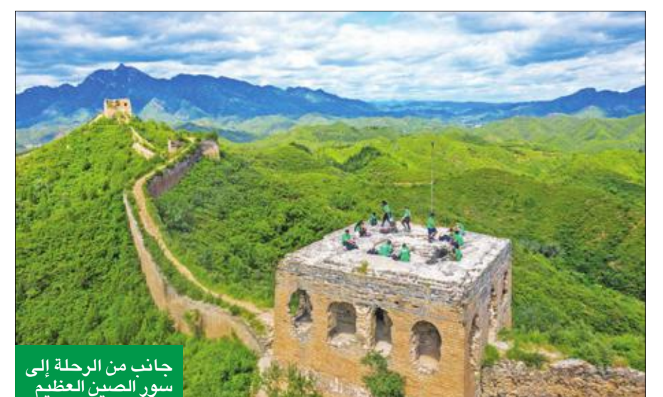
جانب من الرحلة إلى سور الصين العظيم