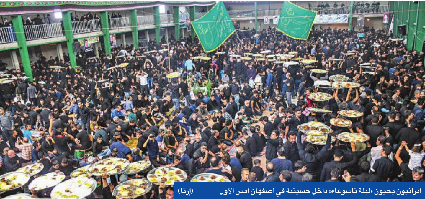
إيرانيون يحيون «ليلة تاسوعاء» داخل حسينية في أصفهان أمس الأول

«الوكالة الذرية» تطالب إيران بالتعاون • ننتياهو: طهران لديها موقع نووي سري في أباده