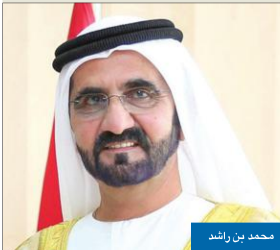
محمد بن راشد

● ترامب: أتطلع إلى لقاء سموه بمجرد تماثله للشفاء ● بن راشد: تعبك يتعبنا يا أبا ناصر... حفظك الله ورعاك