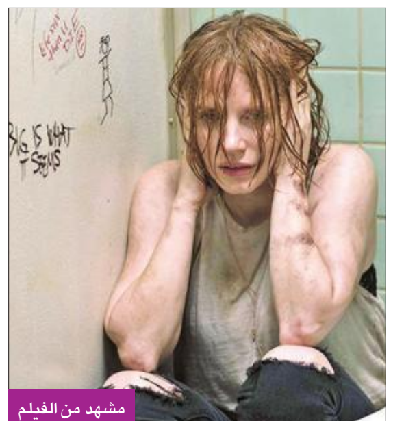
مشهد من الفيلم