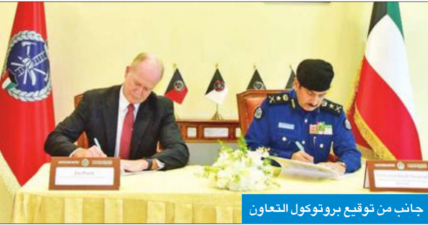
جانب من توقيع بروتوكول التعاون