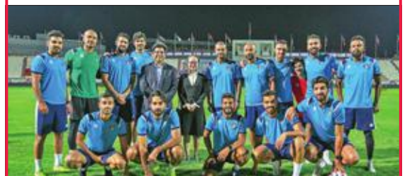
مسؤولو هاواي في صورة جماعية مع الأزرق

أعلنت مجموعة هاواي تكنولوجيز الكويت رعاية مباريات منتخبنا الوطني لكرة القدم خلال التصفيات المشتركة المؤهلة لبطولة كأس العالم 2022 وكأس آسيا 2023 التي تقام في الكويت. وتأتي هذه الخطوة انطلاقا من إدراك «هاواي» لمكانة كرة القدم في قلوب ما يقارب نصف تعداد السكان حول العالم منذ مرحلة الطفولة، ويتجلى ذلك بالشغف الكبير الذي يبديه الناس على المستويين المحلي والعالمي بهذه اللعبة، وبدورها في تعزيز مشاعر الفخر والانتماء الوطني عبر المنتخبات الوطنية. وباعتبارها واحدة من الجهات الراعية للمباريات، وضمن إطار دعمها المتواصل والمتنامي للمواهب الرياضية المحلية، تعاونت «هاواي» مع لاعبي منتخب الكويت بطريقة فريدة جدا تمثلت بمنح هاتف Huawei P30 Pro أفضل لاعب في الفريق.