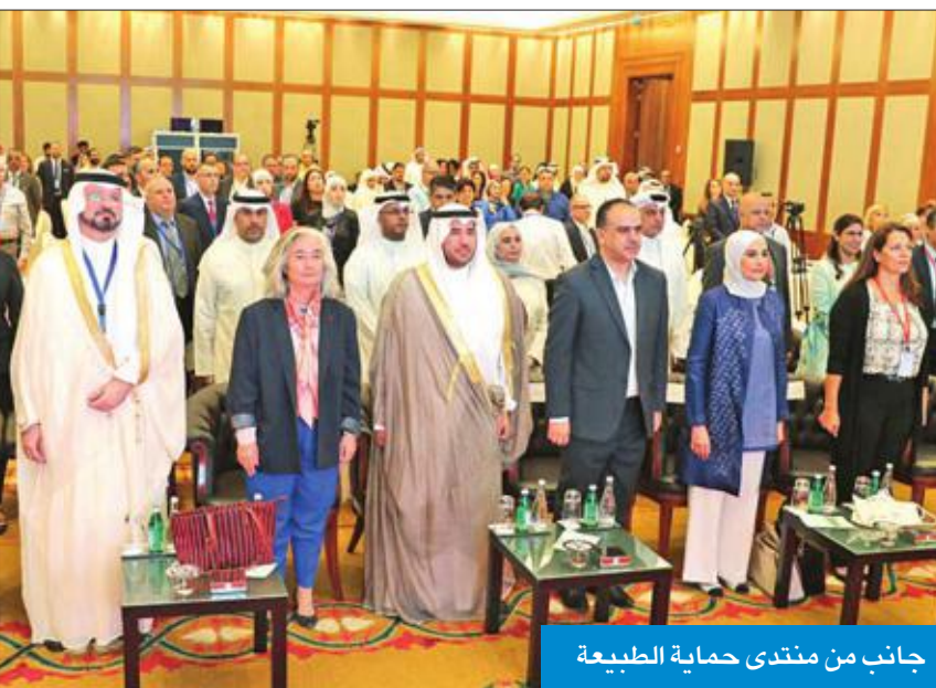
جانب من منتدى حماية الطبيعة

أيام للاستفادة من التجارب العالمية ولبحث كيفية النهوض بالبيئة في دول غرب آسيا ودول العالم بشكل شامل. وأعلن عن إقامة حملة لزراعة أكثر من ثلاثة آلاف شجرة من أنواع مختلفة داعيا الجميع للمشاركة فيها عن طريق موقع الهيئة العامة للبيئة حيث سيكون موقع الزراعة بجانب محمية الجهراء. وقال أن هناك خطة لهيئة البيئة بالتعاون مع الهيئة العامة للزراعة لتوسيع الرقعة الخضراء بالدولة.