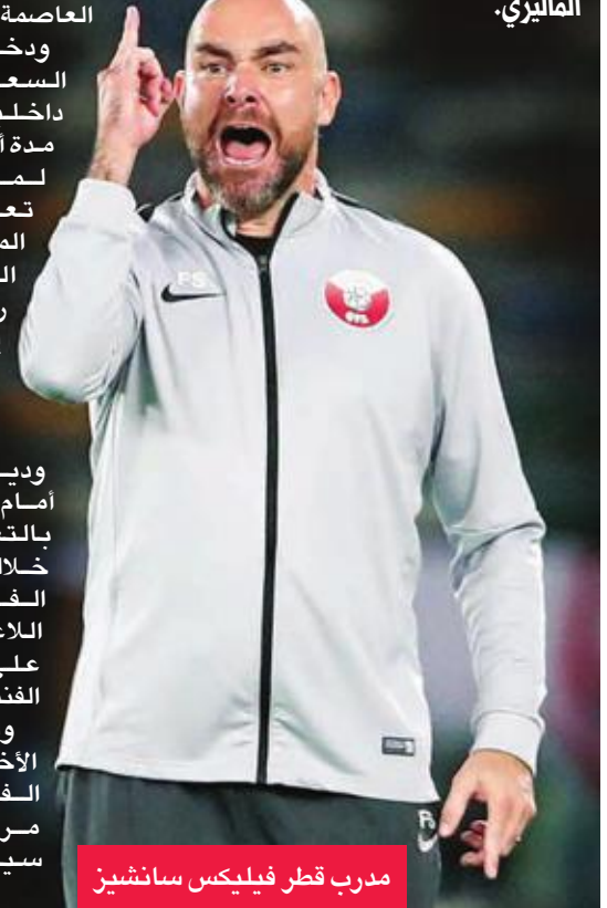
مدرب قطر فيليكس سانثوشين