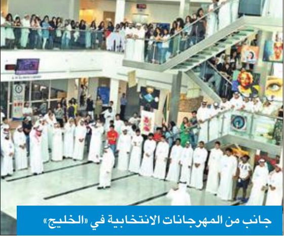
جانب من المهرجانات الانتخابية في «الخليج»

وقعت القوائم الطلابية في جامعة الخليج للعلوم والتكنولوجيا «المستقلة» و«الوسط الديمقراطي» و«1962» ميثاق شرف مشترك، ليكون أساساً للعمل الطلابي، وذلك قبل انطلاق منافسات الانتخابات الطلابية المزمع عقدها بتاريخ 17 الجاري.