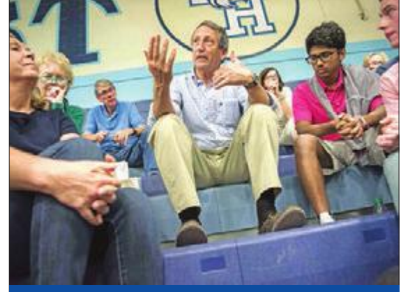
سانفورد متحدًا خلال أحد لقاءاته في جنوب كارولينا (أ ف ب)

بعد يوم من احتجاجات سعى خلالها المحتجون للحصول على دعم الولايات المتحدة في الأزمة المستمرة منذ ثلاثة أشهر، حذرت حكومة هونغ كونغ، أمس، «الحكومات الأجنبية من التدخل في شؤون المدينة»، في حين هددت الصين «بسحق أي شكل من النزعات الانفصالية». وبعد يوم واحد من تجنّب عشرات آلاف المظاهرين عند القنصلية الأميركية طلباً للمساعدة في تحقيق الديمقراطية بالمستعمرة البريطانية