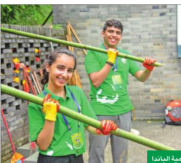
تنظيف محمية الباندا