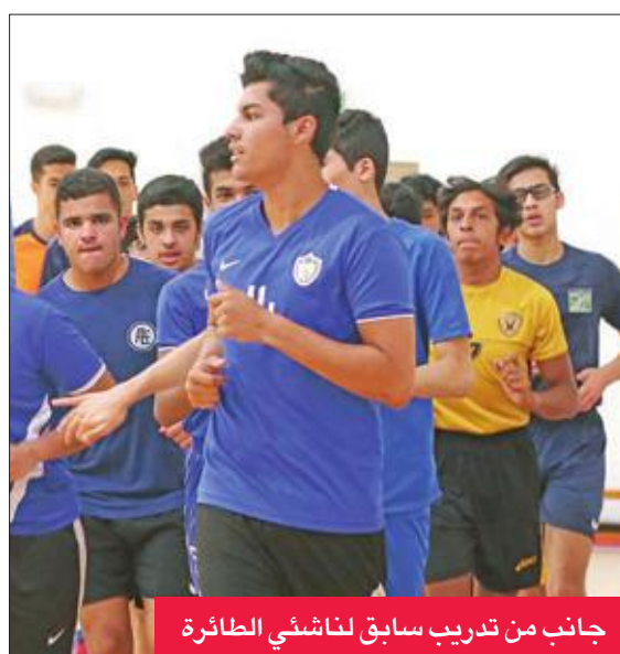
جانب من تدريب سابق لناشئي الطائرة

الإمارات وخسارة أمام العراق، بينما صعد البحرين بعدما تصدر مجموعته الأولى بـ6 نقاط من فوزين على منتخبي فلسطين والجزائر. وسيحاول مدرب المنتخب جاسم الطرارة استغلال طموح اللاعبين في تقديم مستوى جيد، والتصدي لقوة البحرين طمعاً في التأهل للنصف النهائي، وعلى الجانب الآخر سيعمل منتخب البحرين على تحقيق نتيجة إيجابية ومواصلة حملة دفاعه عن اللقب.