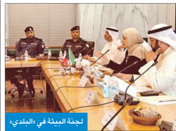
لجنة البيئة في «البلدي»

أعلنت إدارة العلاقات العامة ببلدية الكويت، أن مفتشي فريق الطوارئ بفرع بلدية محافظة حولي نفذوا حملات ميدانية أسفرت عن تحرير 24 مخالفة وإزالة 4 تعدييات على أملاك الدولة. وقال رئيس فريق الطوارئ أحمد رمضان، في تصريح صحافي، أمس، إن الحملات أسفرت عن تحرير 24 مخالفة للمحال، لمخالفة لوائح ونظم البلدية. ولفت رمضان إلى توجيه 22 إنذارا لإزالة تعدييات على أملاك الدولة، وإزالة 4 إعلانات عشوائية مخالفة بالشوارع والميادين.