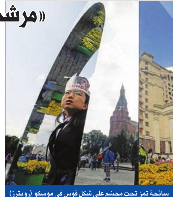
ساحة تمر تحت مجسم على شكل قوس في موسكو

في تحول لما كان من المفترض أن يكون جولة هادئة من الانتخابات الإقليمية في روسيا، وفي الوقت نفسه استفادت على الرئيس فلاديمير بوتين وحزبه الحاكم «روسيا الموحدة»، أظهرت نتائج الانتخابات المحلية التي جرت أمس الأول، أن الحزب الحاكم مني بخسائر كبيرة في انتخابات برلمان مدينة موسكو التي جرت وخسر فيها أكثر من ثلث مقاعده، عقب حملة قمع شنتها الشرطة لاحتجاجات مناهضة للحكومة خلال الصيف. لكن مرشحي الكرملين هيمنوا على انتخابات محلية وإقليمية أخرى جرت خارج العاصمة.