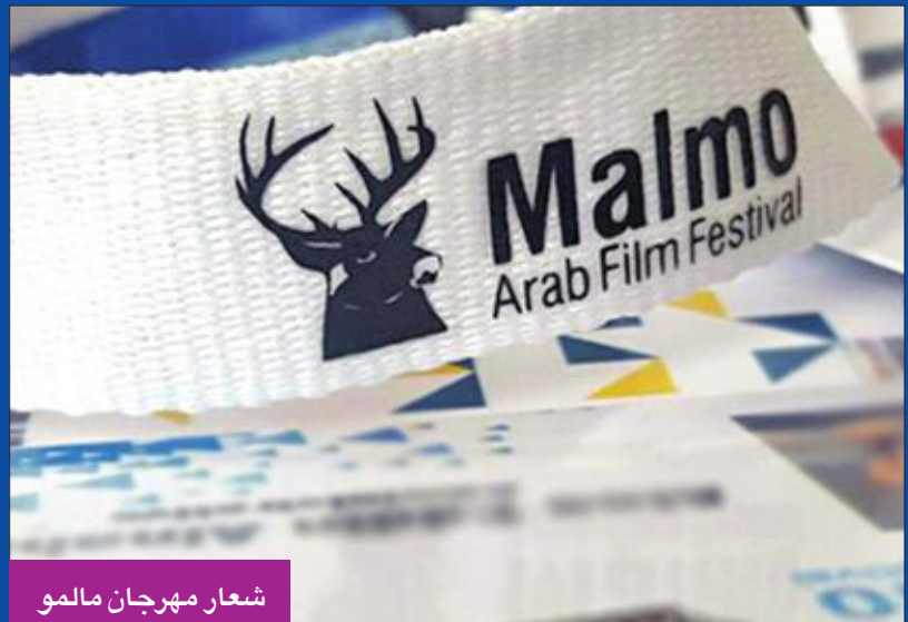
شعار مهرجان مالمو

تستقبل سينما بانورا العروض، وهي من صالات السينما الشعبية وقد أعيد افتتاحها في 27 فبراير 2017، وتقع قرب ساحة المولفينغ الشهيرة، وهي من أكبر صالات العرض في جنوب السويد، إذ تتسع إلى 377 مقعداً، وهناك سينما رويال، افتتحت عام 1961، وهي واحدة من أكبر صالات العرض في مدينة مالمو، تتسع إلى 498 مقعداً وتقع قرب ساحة غوستاف الشهيرة وسط مدينة مالمو، وسوف تشهد ختام الدورة التاسعة للمهرجان وتعتبر من المباني الملكية.