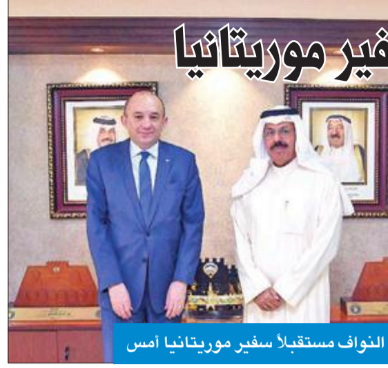
النواف مستقبلاً سفير موريتانيا أمس

استقبل محافظ حولي الشيخ أحمد النواف، في مكتبه بديوان عام المحافظة، أمس، سفير موريتانيا لدى الكويت محمود داداه. وجرى خلال اللقاء التعارف، وبحث العلاقات الثنائية التاريخية الوثيقة التي تربط موريتانيا والكويت، وسبل تعزيزها في شتى المجالات. وتطرق النواف وداداه خلال اللقاء إلى بحث فرص تطوير التعاون المشترك وتبادل الخبرات بين البلدين على المستوى الإداري وعلى صعيد المحافظات والمناطق. وتمنى النواف لسفير موريتانيا التوفيق والنجاح في مهامه، لأجل الدفع بالعلاقة الأخوية بين البلدين إلى آفاق أرحب. فيما عبّر داداه عن سعادته وامتثانه بالبالغين لحفاوة استقباله، معرباً عن شكره وتقديره للرعاية التي تحظى بها البعثة الدبلوماسية لبلادته والجلية الموريتانية على الصعيدين الرسمي والشعبي في الكويت.