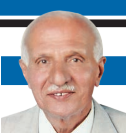
د. ناجي سعود الزيد

دون اتفاق، وهو مُصِرٌّ على ذلك، وتحدّى هذا القانون، وأصرّ على الخروج رغم أنف البرلمان، وصوّح النائب العام السابق بأنه سيسجن إن لم ينفذ القانون البرلماني الجديد، واستقالات وعزل من البرلمان، ولخطة في لخبطة في بلد أعرق الديمقراطيات. لو حدث ما حدث في عالمنا المتخلف، لانقلبت الدنيا واشتعلت المظاهرات، ولأصبحنا ما ننام الليل من كثرة الهذرة والتحليلات! لندن باراتها مليئة والتنس والكريكت وموسم انتقال لاعبي كرة القدم ماشي مثل دقة الساعة ما تعطل شي.