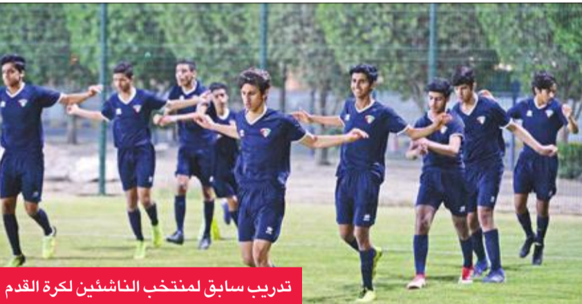
تدريب سابق لمنتخب الناشئين لكرة القدم

وصل وفد منتخبنا الوطني للناشئين لكرة القدم تحت 17 سنة، في الخامسة من صباح أمس، إلى العاصمة الأردنية عمان، قادماً من سلوفينيا التي أقام بها معسكراً تدريبياً تخللته 6 مباريات تجريبية.