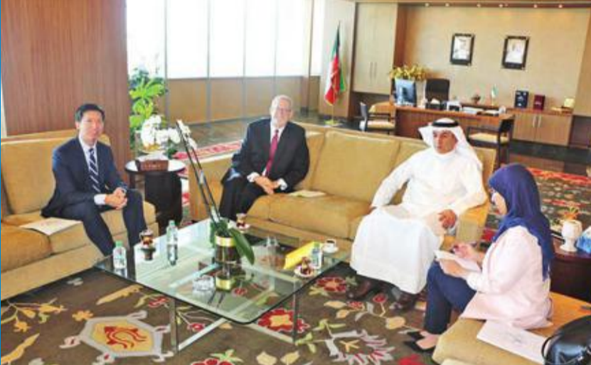
العازمي مجتمعاً مع السفير الأميركي أمس

استقبل وزير التربية وزير التعليم العالي د. حامد العازمي في مكتبه صباح أمس، سفير الولايات المتحدة الأميركية لدى البلاد لورانس سيلفرمان، وتباحث الطرفان في سبل تعزيز أطر التعاون المشترك بين البلدين في المجالات التربوية والتعليمية.