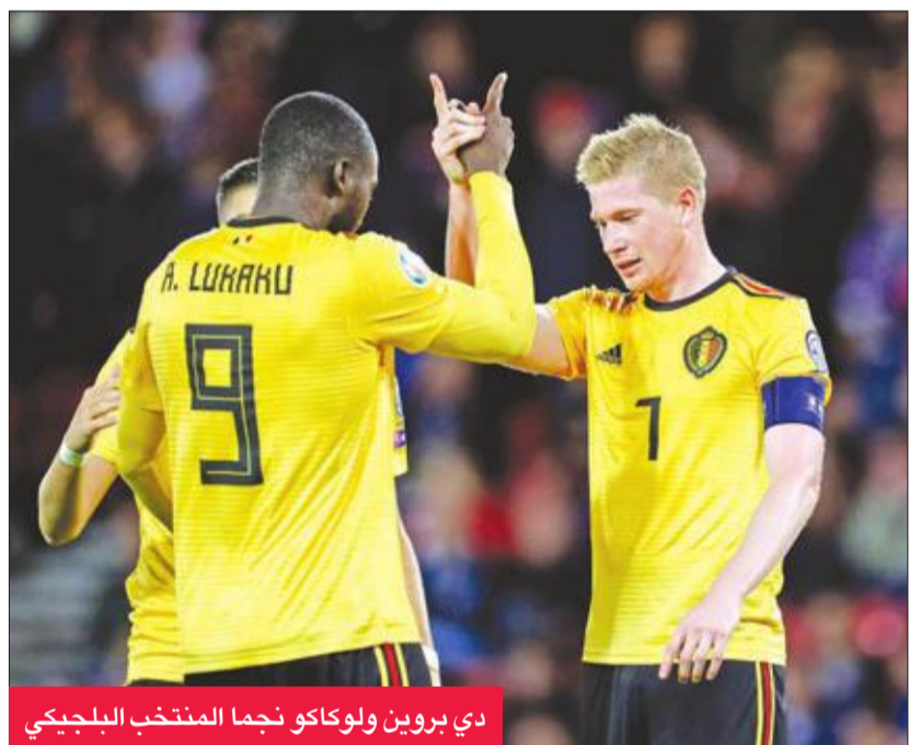
دي بروين ولوكاكو نجما المنتخب البلجيكي