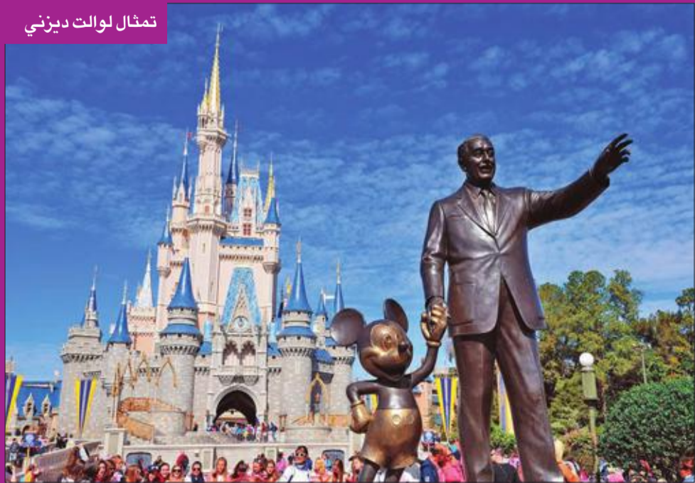
تمثال لوالث ديزني

يُعرض قناع نادر وخوذة ارتداها الشرير دارث فيدر في أحد أوائل أفلام سلسلة «حرب النجوم»، «ستار وورز» للبيع في مزاد بمدينة لوس أنجلوس الأميركية هذا الشهر إلى جانب نظارة الساحر الصغير هاري بوتر الشهيرة وقطع أخرى من أعمال سينمائية ذاتة الصيت. وسيضم المزاد الذي تنظمه دار «بروفايلز إين هيسيتوري» للمزادات أزياء ارتداها الممثلان ليوناردو دي كابريو وكيت وينسليت في فيلم «تايتانيك»، بالإضافة إلى زي لشخصية دوروفي بطة فيلم «ساحر أون» «ذا ويزرد أوف أوز». ومن المتوقع أن يحقق قناع وخوذة دارث فيدر أحد أعلى أسعار مقتنيات حرب النجوم في ظل تقديرات بأنهما سيباعان بما يتراوح بين 250 و450 ألف دولار.