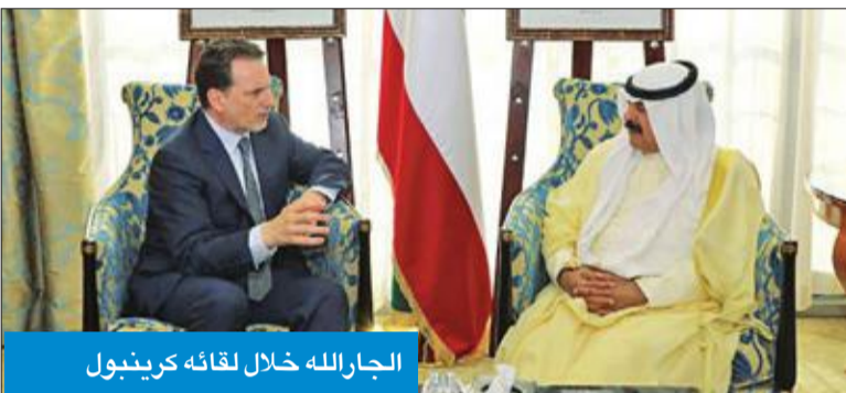
الجارالله خلال لقائه كرينبول

الفلستينيين. وأعرب المفوض العام عن شكره وامتنانه لحكومة الكويت على دعمها للوكالة. حضر اللقاء مساعد وزير الخارجية لشؤون الوطن العربي السفير فهد العوضي، وسفير الكويت لدى جمهورية مصر العربية محمد الذويخ، ونائب مساعد وزير الخارجية لشؤون مكتب نائب الوزير المستشار طلال الشطي.