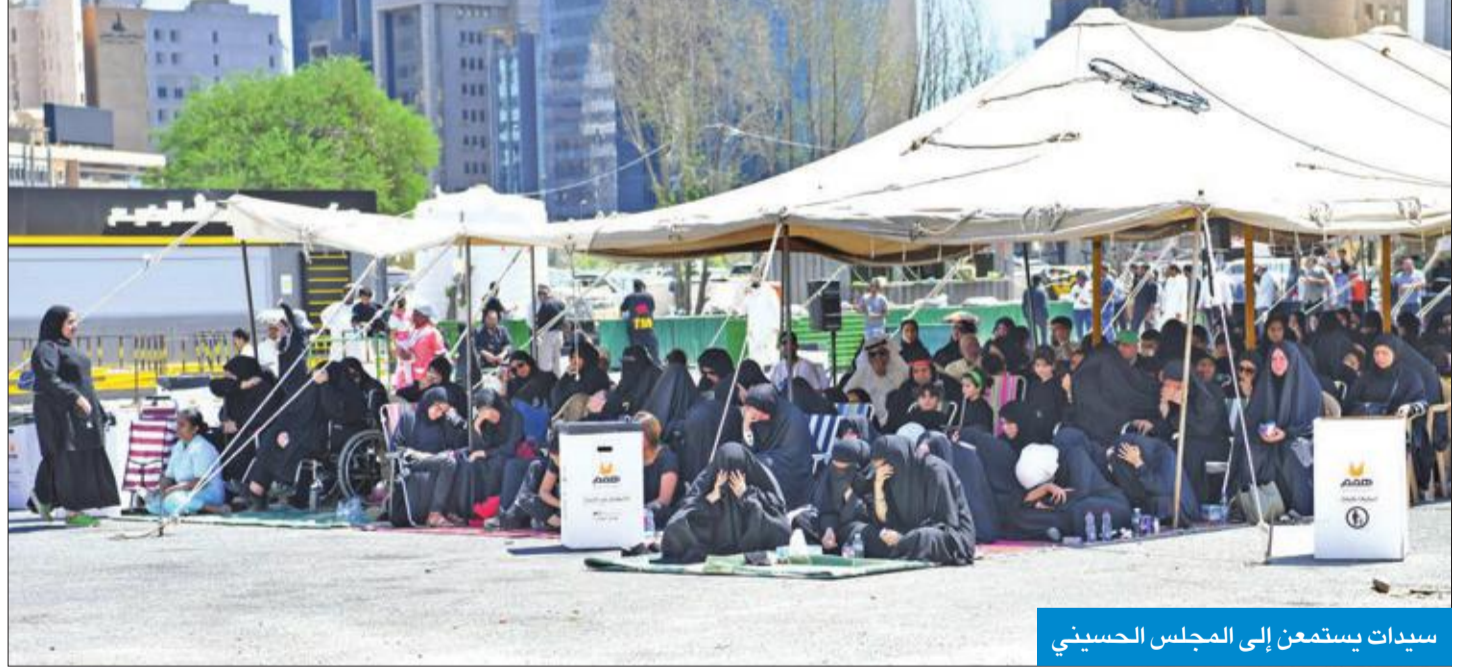
سيدات يستمعن إلى المجلس الحسيني

وأشاروا إلى أن هذه المأساة أدمت قلب الإنسانية، لاسيما أن الإمام الحسين قدم نفسه وولده فداء للإسلام، فضلاً عن أن هذه الفاجعة قتل فيها الشيخ الطاعن في السن من أصحاب الحسين، وكذلك