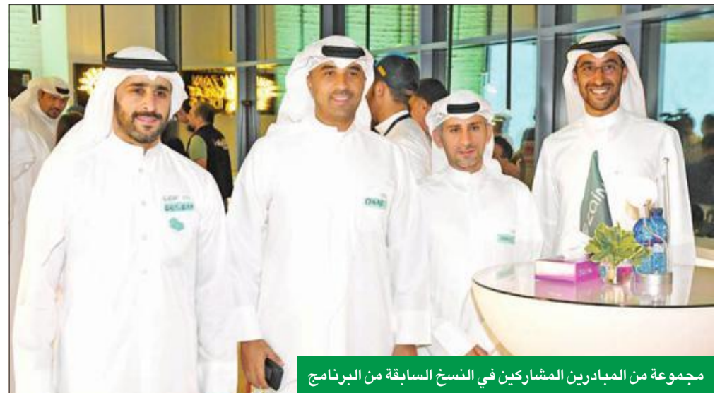
مجموعة من المباردين المشاركين في النسخ السابقة من البرنامج