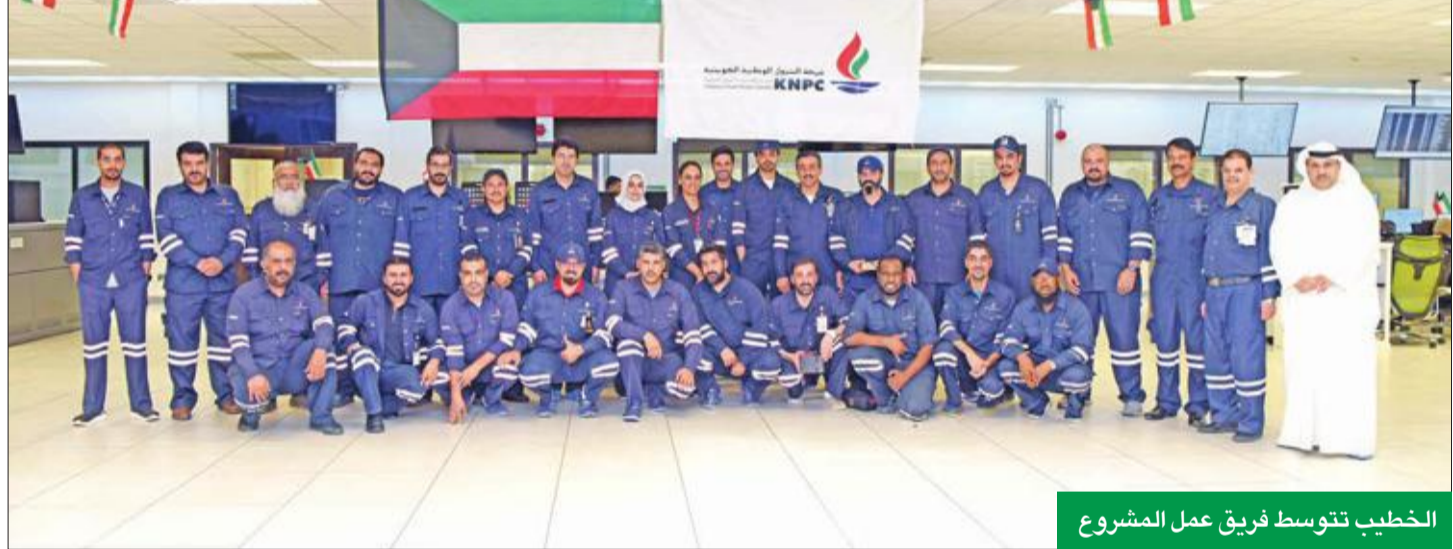
الخطيب تتوسط فريق عمل المشروع