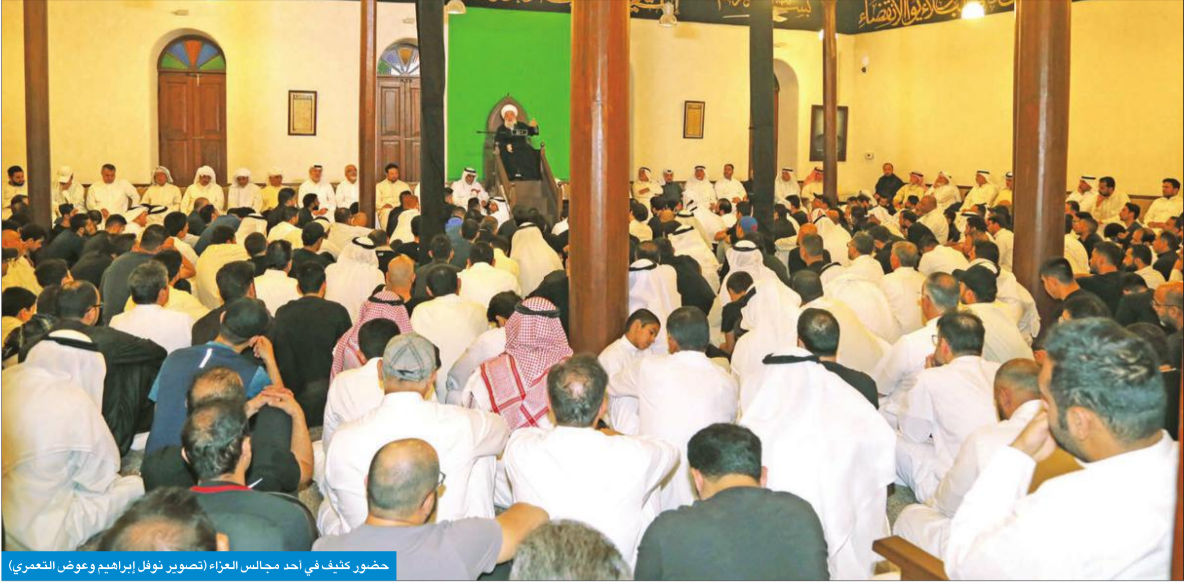
حضور كثيف في أحد مجالس العزاء

الخطباء: مصيبة الحسين باقية إلى قيام الساعة وخالدة في كل زمان ومكان