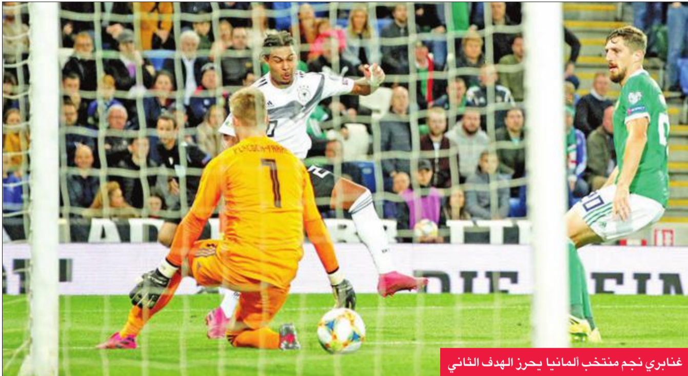
غنايري نجم منتخب ألمانيا يحرز الهدف الثاني

تمريرة مبنية داخل المنطقة من البديل كاي هافيرتس (3+90).