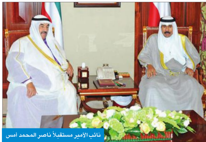
نائب الأمير مستقبلاً ناصر المحمد أمس

استقبل سمو نائب الأمير ولي العهد الشيخ نواف الأحمد، بقصر بيان، صباح أمس، سمو الشيخ ناصر المحمد. كما استقبل سموه، سفير خادم الحرمين الشريفين لدى الكويت سمو الأمير سلطان بن سعد آل سعود.