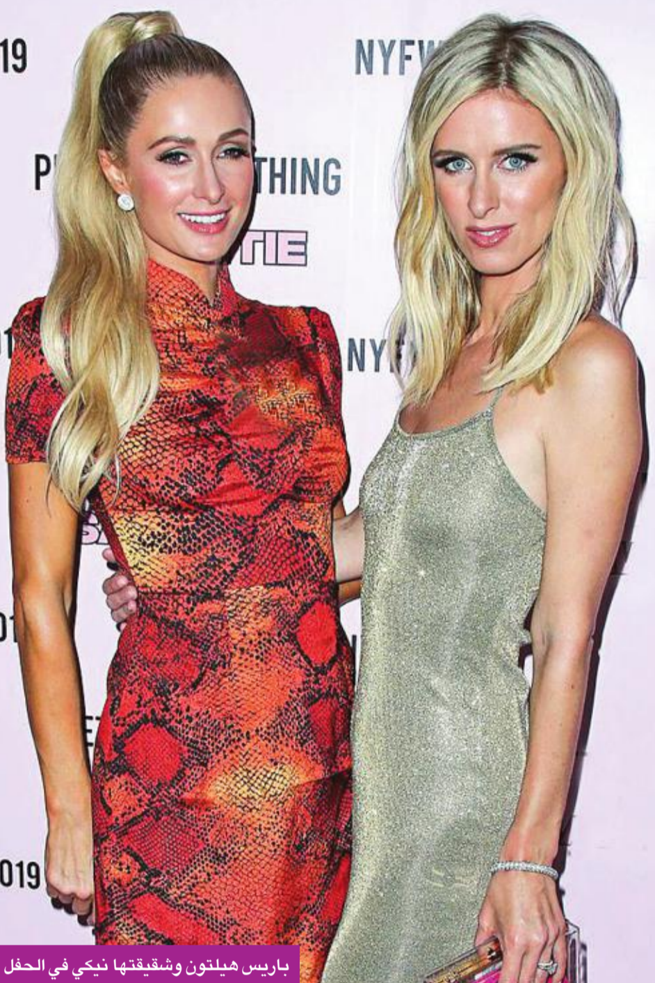
باريس هيلتون وشقيقتها نيكي في الحفل

نيويورك، الولايات المتحدة عام 1981، لعائلة من أغني عائلات أميركا، وهي وريثة مؤسس سلسلة فنادق هيلتون الشهيرة كونراد هيلتون، وهي الابنة الكبرى لعائلة ريتشارد هيوارد هيلتون ولديها 3 أخوة: نيكولاي أوليفيا الشهيرة بنيكي، بارون نيكولاس وكونراد هيوون. وفي طفولتها، انتقلت مع عائلتها إلى لوس أنجلوس وكان من ضمن أصدقائها كيم كارداشيان ونيكول ريتشي. وفي عام 2001، بدأت شهرتها تزداد مع صديقها ريك سالمون. وفي نفس العام، شاركت في أول أعمالها السينمائية من خلال دور بسيط في فيلم "Zoolander" كما بدأت رحلتها مع عروض الأزياء.