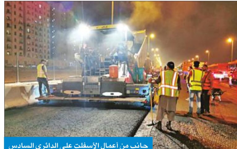
جانب من أعمال الأسفلت على الدائري السادس

سيد القصاص تواصل وزارة الأشغال أعمال صيانة الطرق وفرش الأسفلت في العديد من المواقع بالمحافظات وعلى الطرق السريعة، وفقاً للجدول الموضوع لأعمال الصيانة المختلفة. وقالت مصادر «الأشغال» لـ «الجريدة» إن فريق الوزارة أشرفت، أمس، على أعمال صيانة الطرق في مختلف المناطق، حيث قامت وفقاً لبرنامج أعمال الصيانة بأعمال فرش الأسفلت بمنطقة الجبراء بشارع مبارك بن هيف الحجر، مقابل مستشفى الجبراء، وفي منطقة الواحة قطعة 3 شارع 9. وبيّنت أن أعمال الصيانة على الطرق شملت، أمس، محافظة حولي بمنطقة الزهراء قطعة 4 شارع 420، 418، ومنطقة السلام شارع 27 بين القطعتين 1، و7، وأعمال صيانة الأسفلت في منطقة الشعب قطعة 1 شارع المنامة. ولفتت إلى أن الأعمال في العاصمة تشمل فرش الأسفلت في منطقة الدوحة قطعة 1 شارع 20، وفي منطقة الروضة بشارع عيسى بن عبد الطيف العبدالجليل. وفيما يخص الطرق السريعة، بينت أن الأعمال متواصلة على الدائري السادس باتجاه الجبراء، وعلى طريق الملك فهد باتجاه الاحمدي.