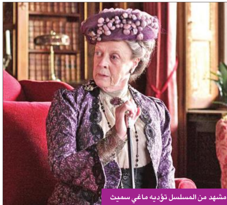
مشهد من المسلسل تؤديه ماغي سميث

شارك نجم الكرة الإنكليزية السابق ديفيد بيكهام في حملة دعائية لمصلحة أحد الفنادق إلى جانب عارضة الأزياء الصينية أنجيلا بونغ وينغ، وتدور فكرة الإعلان حول أنه يتزوج من امرأة صينية بدلاً من زوجته عارضة الأزياء فيكتوريا بيكهام، وظهر من خلال الصور التي التقطت لهما أن الحملة الدعائية تدور حول رجل وزوجته يستمتعان في حفل زفافهما داخل شوارع العاصمة البريطانية، إذ أطل بيكهام مُرتدياً بدلة توسكيديو سوداء، بينما عروسه أنجيلا ارتدت فستان الزفاف الأبيض. وتابعت الإعلان عدسات المايكرو، والتقطت صوراً من موقع التصوير، حيث ظهر باص أحمر مركون جانبا وعلقت عليه لافتة بيضاء كتب عليها "ادعوا الضيوف فقط" وسط أجواء من الاحتفال والرقص إلى جانبه.