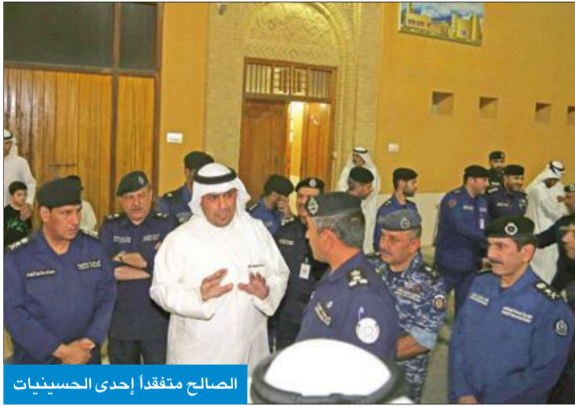
الصالح متفقداً إحدى الحسينيات

الفتى الصغير والطفل الرضيع والمرأة العجوز، ولا يمكن أن ننسى ما مرت به المأساة من الألم والحسرة من خلال التمثيل بأجساد الشهداء