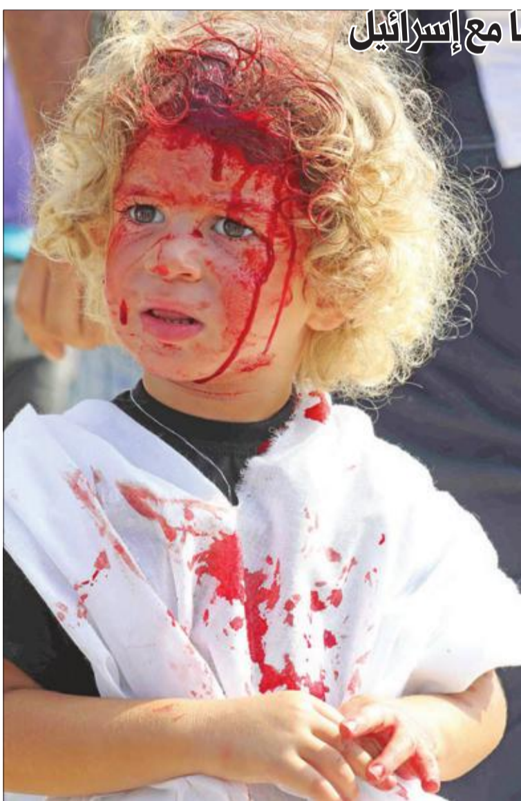
طفل لبناني ينفذ أمس بعد خضوعه للتطبير وهي عادة تشتهر بها مدينة النبطية جنوب لبنان تقوم على ضرب الجبين بشفرة حادة في ذكرى العاشر من المحرم (ا ف ب)

عون يطلب من واشنطن مواصلة وساطتها مع إسرائيل