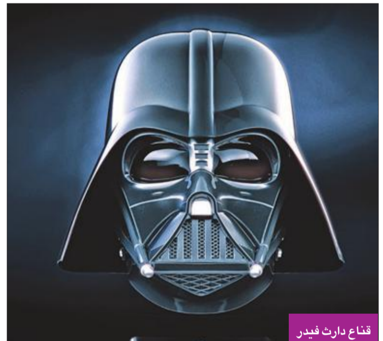
قناع دارث فيدر

بعد تسع سنوات على عرض الحلقة الأولى من مسلسل «داونتاون أبي»، قدم في لندن العرض الأول العالمي لفيلم سينمائي حول مغامرات عائلة كرولي الأرستقراطية في نهاية العشرينيات، وتنتظر العائلة في هذا العمل السينمائي حدثاً بالغ الأهمية هو زيارة الملك جورج الخامس وزوجته ماري. وقال جوليان فيلوز مؤلف المسلسل الذي توقف عرضه في عام 2015 بعد ستة مواسم: «لم أكن أفكر في فيلم سينمائي، لكنني تلقيت طلبات كثيرة وإستحاح الفيلم حقيقة في نهاية المطاف». وجمع العمل السينمائي ماغي سميث بدور الكونتيسة الأرملة الصعبة المراس، وسبق لها أن حازت جوائز «أوسكار» وأربع جوائز «إيمي» وثلاث «غولدن غلوب» وجائزة «توني» وخمس جوائز بافتا.