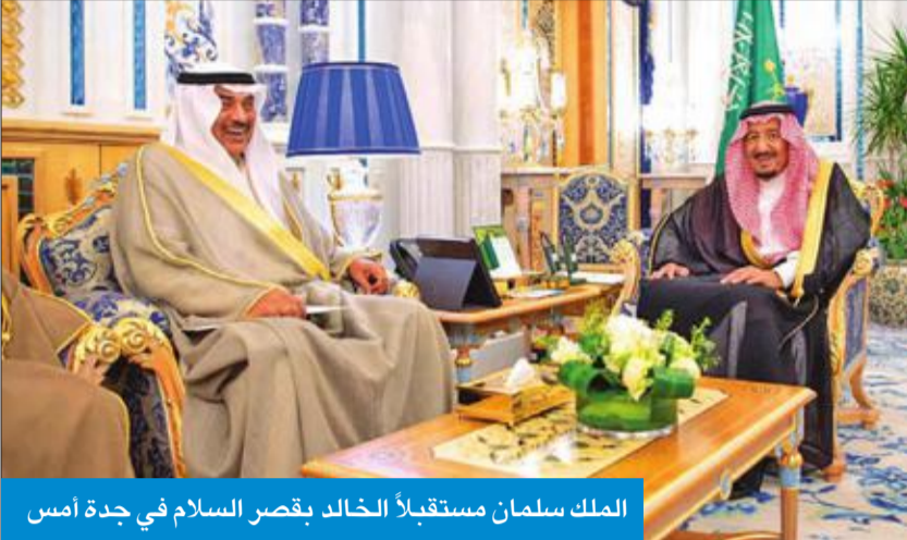
الملك سلمان مستقبلاً الخالد بقصر السلام في جدة أمس