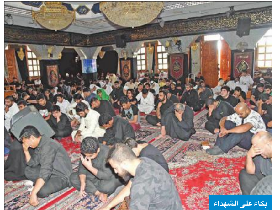
بكاء على الشهداء

التزمت الحسينيات والمساجد بالانظمة والقوانين التي أقرتها وزارة الداخلية قبل بدء شهر المحرم، الأمر الذي كان له بالغ الأثر في نجاح هذا الموسم دون حوادث تذكر.