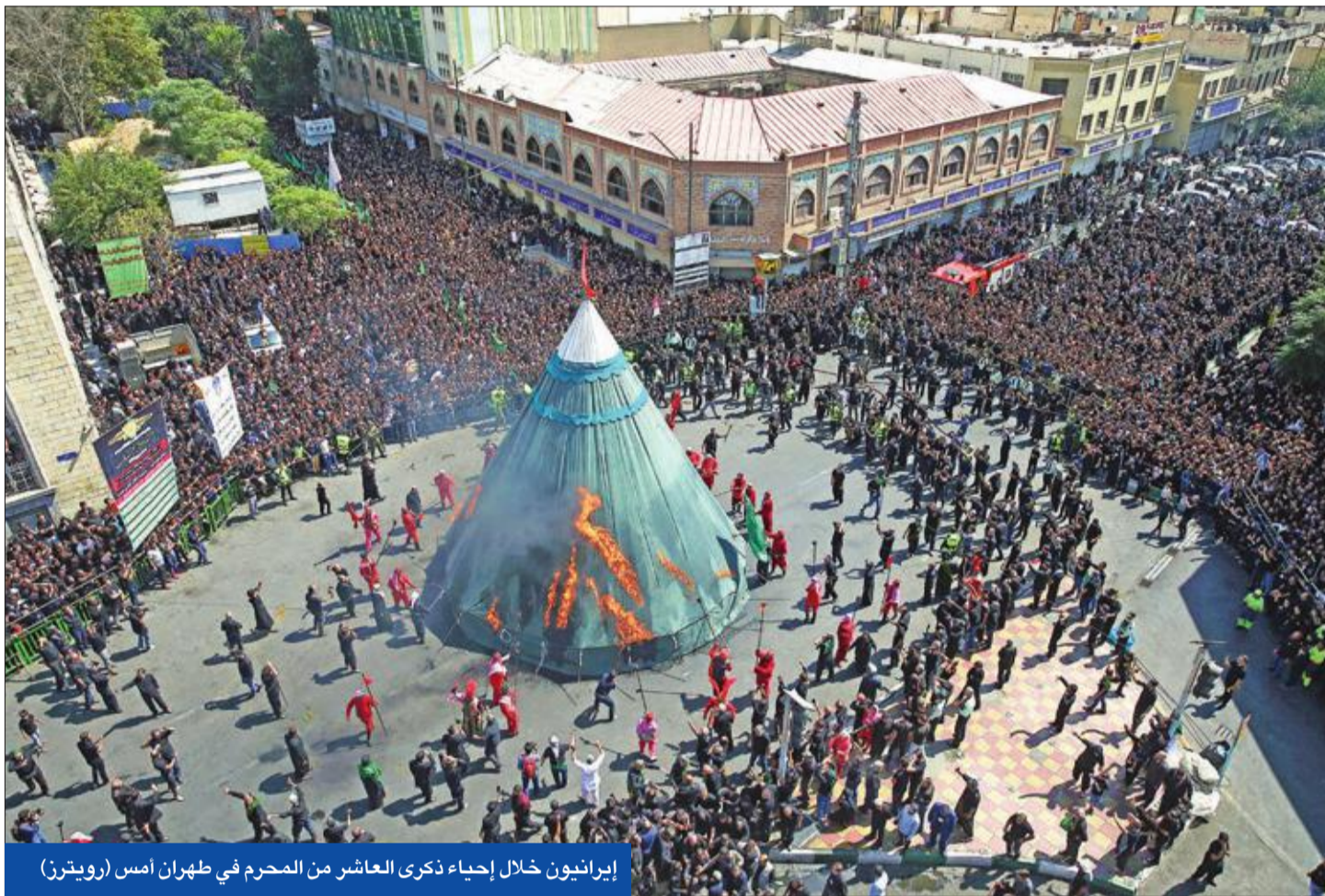
إيرانيون خلال إحياء ذكرى العاشر من المحرم في طهران أمس

• ترامب لا يستبعد لقاء روحاني • بومبيو: طهران تقوم بأنشطة نووية سرية