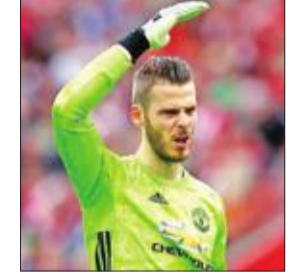
ديفيد دي خيا

اقرب الحارس الإسباني ديفيد دي خيا من تجديد عقده مع ناديه مانشستر يونايتد الإنجليزي، وفقا لما نشرته الثلاثاء صحيفة (ذا غاردريان). وينتهي عقد الحارس البالغ من العمر 28 عاما مع النادي الإنجليزي في يونيو المقبل، وسيصبح حرا إذا