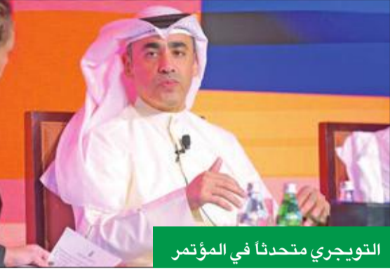
التوحيدي متحدًا في المؤتمر

خلال مؤتمر «غلوبل فاينانس» للتكنولوجيا المصرفية