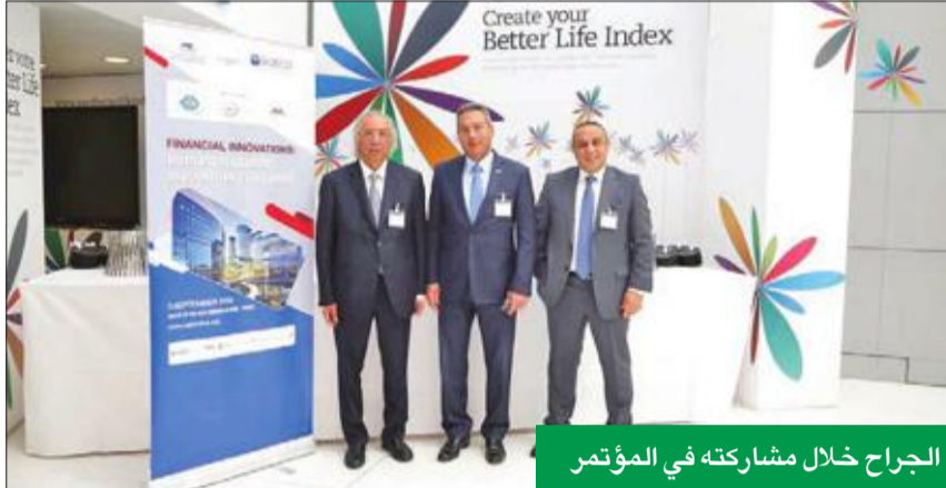
الجراح خلال مشاركته في المؤتمر

على هامش مشاركته في مؤتمر «المصارف العربية» و«التعاون الاقتصادي والتنمية»