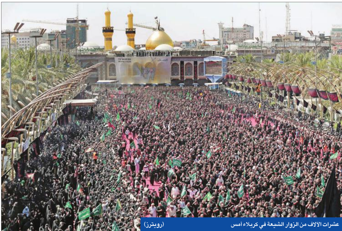
عشرات الآلاف من الزوار الشيعة في كربلاء أمس

بينما كان مئات الآلاف من المسلمين الشيعة يحيون ذكرى العاشر من المحرم في مدينة كربلاء المقدسة لدى الشيعة، أمس، وقع حادث تدافع مؤسف أدى إلى مقتل العشرات من الزوار.