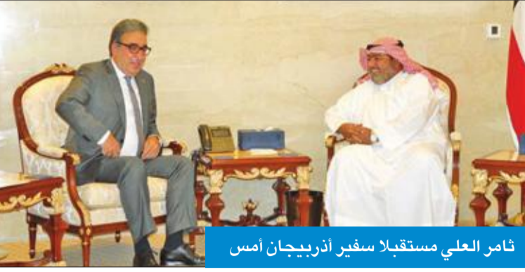
ثامر العلي مستقبلاً سفير أذربيجان أمس

بحث رئيس جهاز الأمن الوطني الشيخ ثامر العلي أمس مع سفير أذربيجان لدى البلاد إيخان قهرمان أوجه التعاون المشترك والعلاقات الثنائية بين البلدين الصديقين وسبل تعزيزها وتطويرها. وأعلن "الأمن الوطني" في بيان أن العلي استقبل أيضاً سفير أوكرانيا لدى البلاد الدكتور ألكسندر بالانوتسا، وبحسب أبرز القضايا المشتركة التي تهم البلدين على الساحتين الإقليمية والدولية.