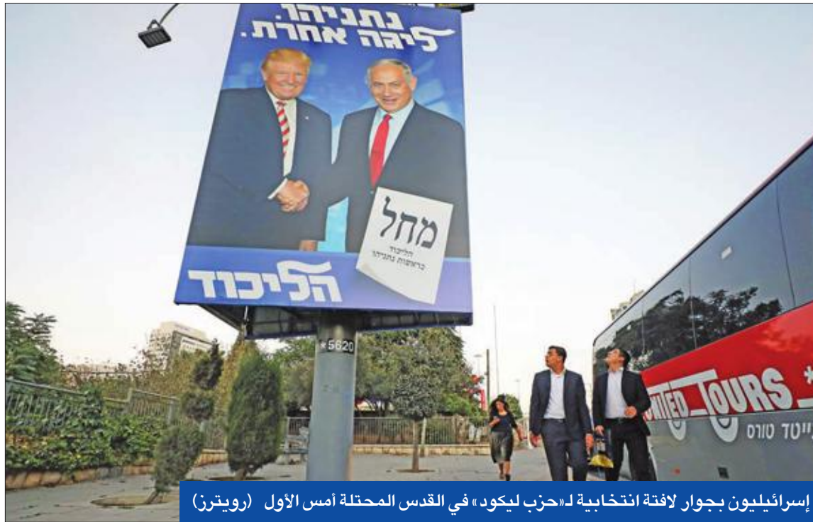
إسرائيليون بجوار لافتة انتخابية لـ«حزب ليكود» في القدس المحتلة أمس الأول

إنتاج إيران النفطي بأدنى مستوى منذ 30 عاماً... وتنتياهو في موسكو للاحتفاظ بحرية العمل بسورية