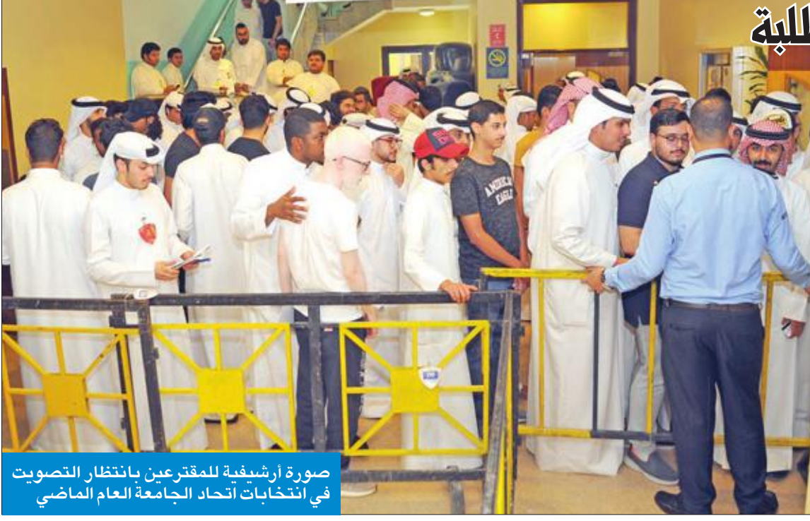
صورة أرشيفية للمقترعين بانتظار التصويت في انتخابات اتحاد الجامعة العام الماضي

التي حلت ثالثة على 395 صوتاً، وأخيراً حصلت "الوسط الديمقراطي" على 225 صوتاً.