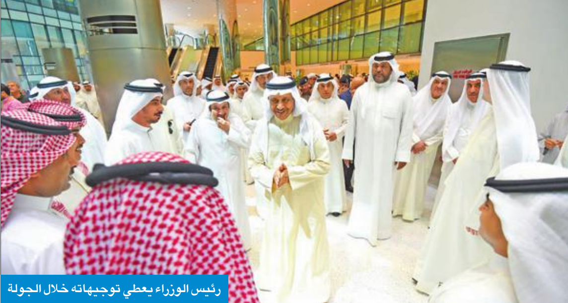
رئيس الوزراء يعطي توجيهاته خلال الجولة