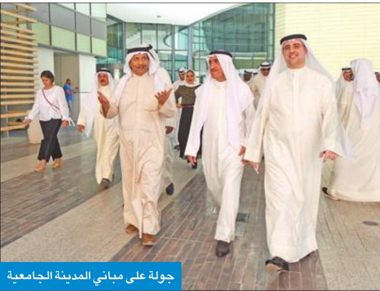
جولة على مباني المدينة الجامعية

والشيخ جابر المبارك، صباح أمس، مدينة صباح السالم الجامعية بمنطقة الشداوية للاطلاع على سير الدراسة فيها، بعد أيام على بدء العام الجامعي وانتظام الدراسة في الكليات الست التي انتقلت إلى المدينة الجامعية الجديدة. وجال المبارك، يرافقه نائب رئيس مجلس الوزراء وزير الخارجية الشيخ صباح الخالد، ونائب رئيس الوزراء وزير الدولة لشؤون مجلس الوزراء أنس الصالح، ووزير التربية وزير التعليم العالي حامد العازمي، ووزيرة الأشغال ووزيرة الدولة لشؤون الإسكان جنان بوشهري، على عدد من الكليات ومرافقها، واستمع إلى شرح من كبار المسؤولين عن سير الدراسة،