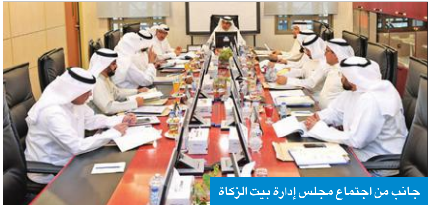
جانب من اجتماع مجلس إدارة بيت الزكاة

الشكر للمحسنين والجهات الداعمة على تبرعاتهم ودعمهم، لتمكين البيت من مواصلة مسيرته الخيرية والإنسانية في المجتمع، مثنيا على إدارة بيت الزكاة والجهود المخلصة لعموم موظفيه.