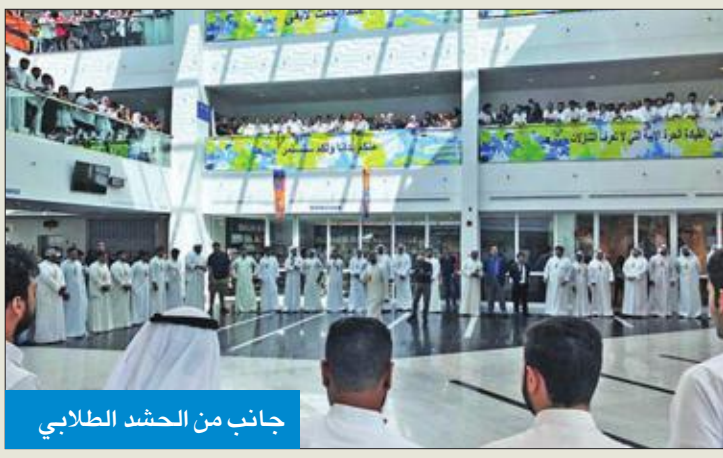
جانب من الحشد الطلابي

حشد أعضاء قائمة الوسط الديمقراطي بجامعة الخليج للعلوم والتكنولوجيا (GUST)، أمس، في بهو الجامعة، لإعلان خوضهم انتخابات الرابطة، وسط حضور لافت للطلبة.