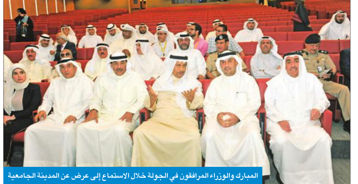
المبارك والوزراء المرافقون في الجولة خلال الاستماع إلى عرض عن المدينة الجامعية