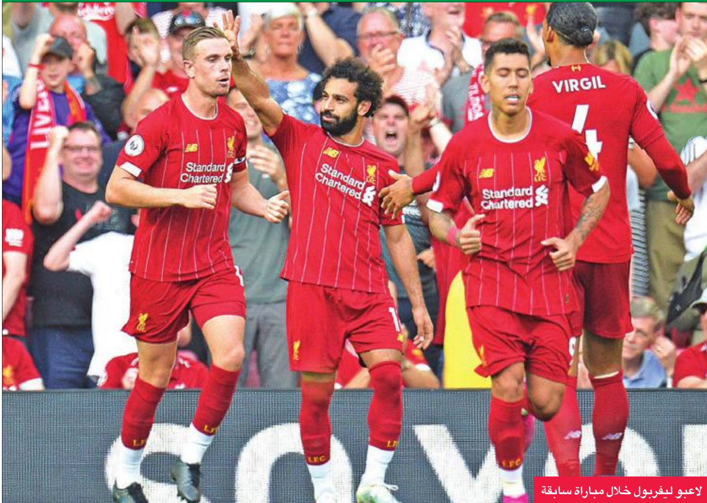
لاعبو ليفربول خلال مباراة سابقة

بعد توقف استمر أسبوعين بسبب المباريات الدولية، يبدأ ليفربول مباريات الغد في المرحلة الخامسة من الدوري الإنجليزي الممتاز لكرة القدم، عندما يستضيف نيوكاسل يونايتد مع سعيه للحفاظ على بدايته المثالية للموسم وتحقق الفوز الـ14 على التوالي في الدوري، ليمدد رقما قياسيا للنادي. ويدخل محمد صلاح نجم نادي ليفربول المواجهة أمام نيوكاسل بمعنويات عالية، وذلك بعد أن أعلن نوابه تنويجه بجائزة أفضل لاعب عن شهر أغسطس. ونشر نادي ليفربول، عبر حسابه الرسمي على تويتر صورة لمحمد صلاح وهو يحمل الجائزة: «أفضل لاعب في أغسطس»، بعدما ساهم في فوز ليفربول في 4 مباريات بالدوري الإنجليزي تصدر بها جدول ترتيب المسابقة. ويلتقي مانشستر سيتي الذي يتأخر بنقطتين عن ليفربول، مع نورويتش سيتي الوافد الجديد في آخر مباريات الغد. ويستضيف توتنهام، المتصدر، كريستال بالاس صاحب المركز الرابع، بينما يحل تشلسي بقيادة مديره فرانك لامبارد، الذي يملك خمس نقاط أيضا، ضيفا على وولفرهامبتون الذي لا يزال يبحث عن فوزه الأول في الدوري هذا الموسم. من جانب آخر، يلعب