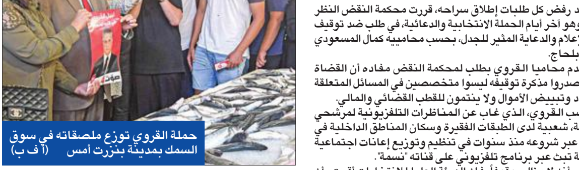
حملة القروي توزع ملصقاته في سوق السمك بمدينة بنزرت أمس

وسط ترقب لامتحان جديد للديمقراطية في مهد الربيع العربي، بدأ أبرز مرشح للانتخابات الرئاسية في تونس نبيل القروي إضراباً عن الطعام أمس داخل سجن الرناقية بالعاصمة؛ احتجاجاً على استمرار حبسه طوال الحملة الدعائية ومنعه من ممارسة حقه الدستوري. ويواجه القروي ملاحقات منذ 2017 بتهم تتعلق بتبويض أموال وتهرب ضريبي، وتم توقيفه قبل انطلاق الحملات الانتخابية للرئاسية بعشرة أيام، مما أثار عديداً من الانتقادات والتساؤلات حول تسييس القضاء.