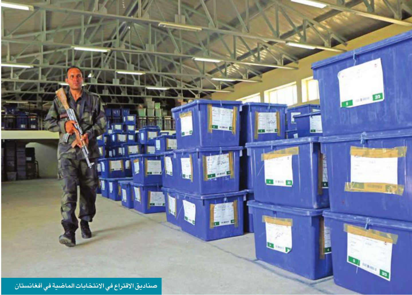
صناديق الاقتراع في الانتخابات الماضية في أفغانستان

في غضون ذلك، قد لا تتمحور المحادثات المبكرة حول لغة دستورية جديدة، لكنها ربما تمهد لتوجيه ما يمكن وما لا يمكن تغييره.