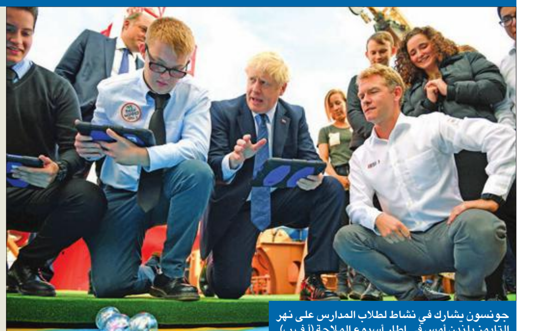
جونسون يشارك في نشاط لطلاب المدارس على نهر التايمز بلندن أمس في إطار أسبوع الملاحظة

الطازجة سيقل كذلك، مشيرة إلى أن هناك فرصة لارتفاع «كبير» في أسعار الكهرباء، وأن الفئات ذات الدخل المنخفض ستتأثر بشكل غير متناسب بأي ارتفاع في أسعار المواد الغذائية والوقود. ولقّحت إلى أن المسافرين البريطانيين ربما يواجهون عمليات تفتيش أكثر صرامة، مما يؤدي إلى طوابير طويلة عند الوصول إلى مطارات الاتحاد الأوروبي والموانئ والمعابر الحدودية. موضحة أنه من المحتمل كذلك تأثر الخدمات المالية وعمليات تبادل المعلومات 02