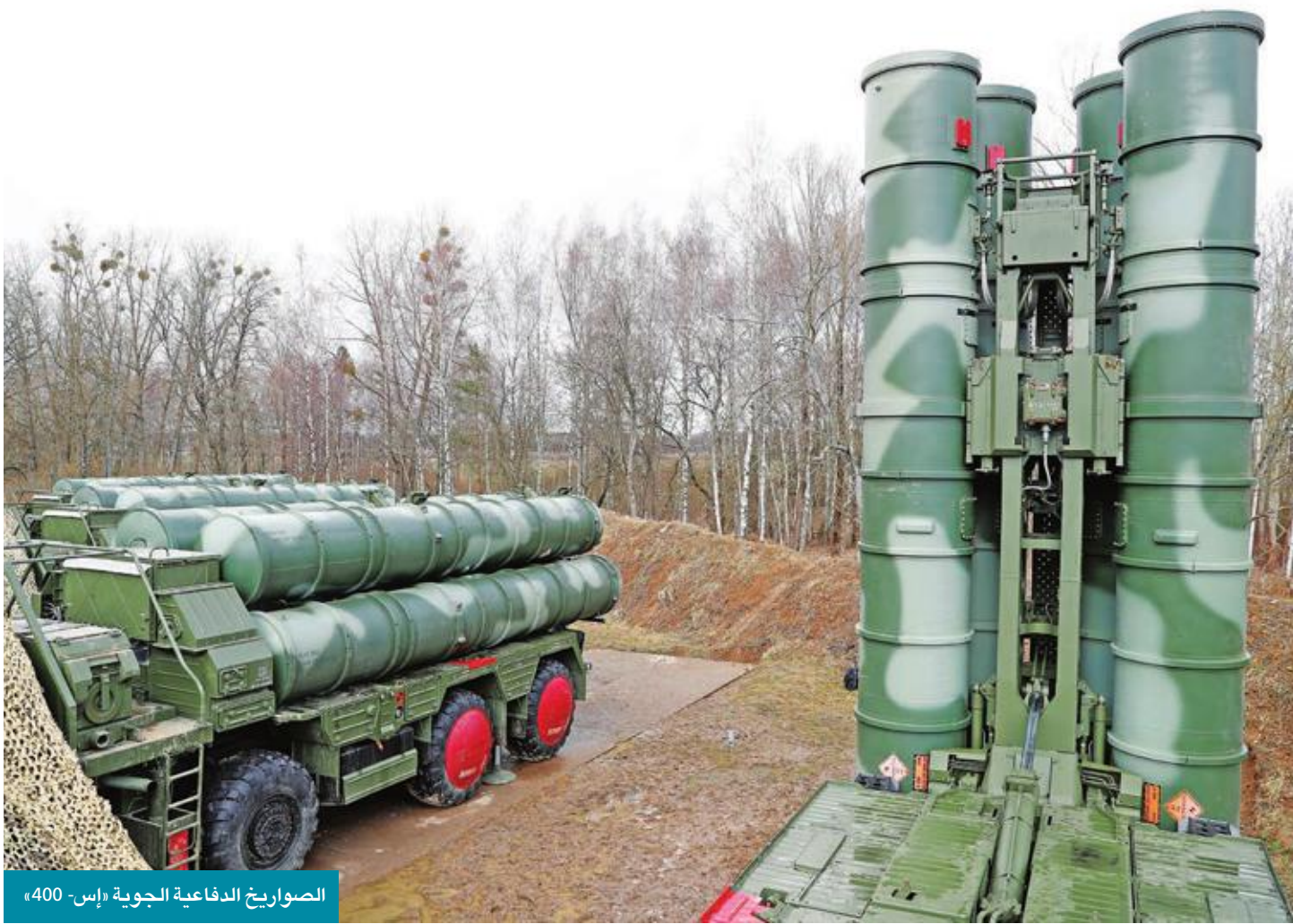
الصواريخ الدفاعية الجوية «إس-400»

جهودها بنشوء هندسة بديلة للشؤون العالمية، على غرار متشابهة تركز على تلك المعايير الثابتة وتُحددها الأفكار التاريخية والمفاهيم الموروثة، والخصوصيات الثقافية والحضارية، والقيم المعيارية، وخلفيات قديمة متشابهة ومرتبطة بالغرب تظن خبيرة العلاقات الدولية من فلوكرات أن شبكة عقدة من العلاقات «بين الأنظمة» تُستخد طابع العالم المتعدد الأنظمة في المرحلة المقبلة. ستكون إيران وروسيا في موقع أمن ضمن هذا النظام المتداخل، لا تتعلق الفكرة الأساسية باقتلاع النظام الدولي، بل بإفساح المجال أمام دول لا تتماشى مع النظام القائم، على غرار روسيا وإيران، لا بد من تقييم العلاقة الروسية الإيرانية التي تشبه «زواج المصلحة» أحياناً في هذا السياق تحديداً