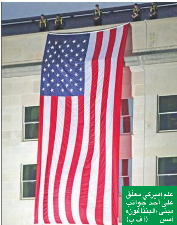
علم أميركي معلق على أحد جوانب مبنى «النتاغون» أمس

حول اجتماع المركزي الأوروبي، في ظل توقعات واسعة النطاق بخفض الفائدة وإعلان المزيد من التدابير التخفيفية.