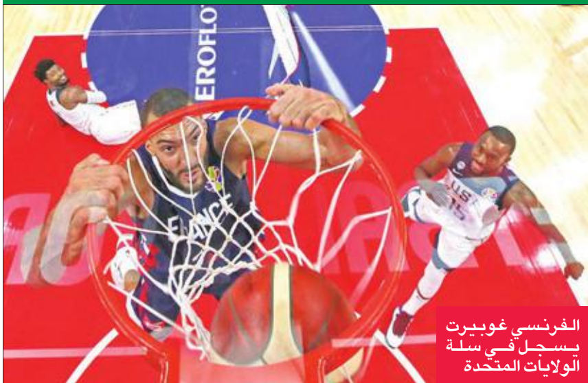
الفرنسي غوبيرت يسجل في سلة الولايات المتحدة

تلتقي أستراليا في المربع الذهبي مع إسبانيا بطله العالم 2006.