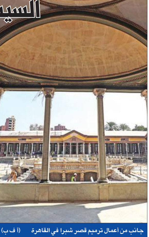
جانب من أعمال ترميم قصر شبرا في القاهرة