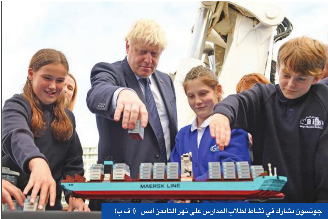
جونسون يشارك في نشاط طلاب المدارس على نهر التايمز أمس

نشرت الحكومة البريطانية وثيقة من 6 صفحات وضعت فيها الخطوط العريضة لاستعداداتها الخاصة بسيناريو الخروج من الاتحاد الأوروبي (بريكست) من دون اتفاق، وحذرت فيها من سيناريوهات كارثية، بدءاً من ارتفاع أسعار الكهرباء وتأثيرات على إمدادات الأدوية والأغذية، وصولاً إلى توترات مجتمعية وازدحامات في المرافئ.