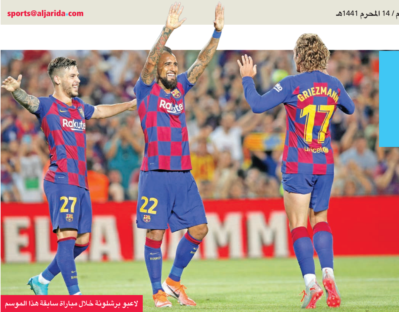
لاعبو برشلونة خلال مباراة سابقة هذا الموسم