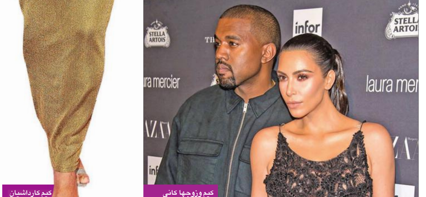
كيم وزوجها كاني

يذكر أن نجمة تلفزيون الواقع كيم كارداشيان سبق أن ظهرت على غلاف مجلة «Vogue» بنسختها العربية لشهر سبتمبر الجاري في