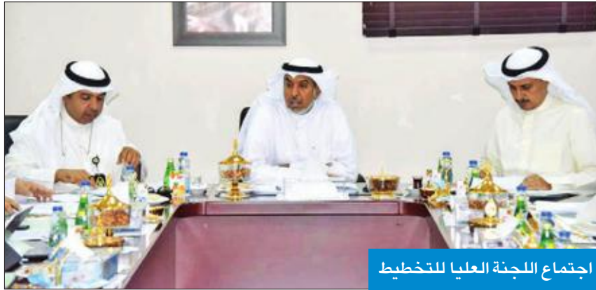
اجتماع اللجنة العليا للتخطيط

«تطبيق اشتراطات النظافة وإزالة معوقات تطوير المباركية»