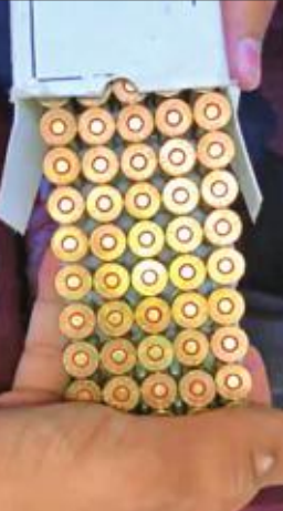
طلقات الخرازة المضبوطة

على 550 طلقة نارية لبنندقية الخرازة كما عثروا على بنندقية أخرى جديدة. وذكر الخميس أن رجال الجمارك حرزوا المضبوطات التي بحوزة المهرب وتحفظوا عليه قبل أن يسلم إلى الجهات الأمنية المختصة، مشيراً إلى أن رجال الجمارك احتالوا المضبوطات التي وازرة الداخلية تمهيداً لاحتالها إلى الإدارة العامة للأدلة الجنائية لفحصها مخبرياً وتحديد نوعيتها ومواقع استعمالها.