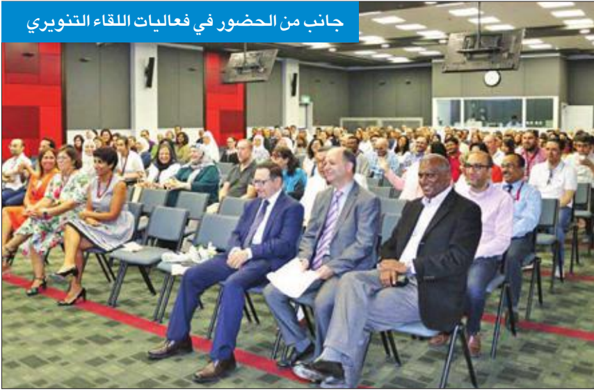
جانب من الحضور في فعاليات اللقاء التنويري

مظفر: نشجع طلابنا على الاستفادة من مواردنا لتأمين تجربة شاملة