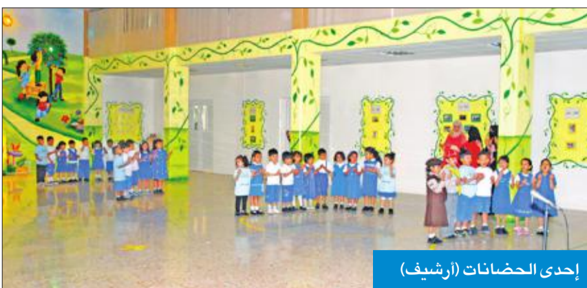
إحدى الحضانات (الترسيف)

وأوضحت المصادر أن الوزارة شددت على أصحاب الحضانات، ضرورة إحضار المستندات المطلوبة وهي البطاقة المدنية وصورة عنها، والرخصة الأصلية وصورة عنها، والكتب الصادرة