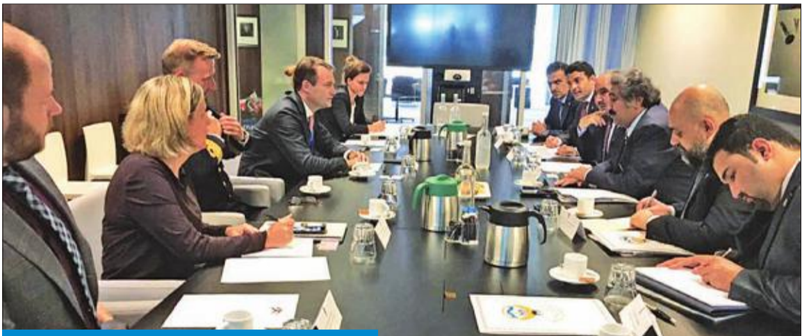
خلال أعمال الجولة الخامسة من المشاورات السياسية

انطلاق الجولة الخامسة من المشاورات بين مسؤولي «الخارجية» في لاهي