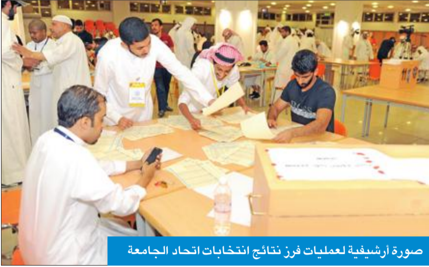
صورة أرشيفية لعمليات فرز نتائج انتخابات اتحاد الجامعة

وتابع السوري: أما موقع الجامعة في الخالدية، فكلية الهندسة والبتروك في قاعة رقم (102) للطلبة مقابل الكافتيريا، والطلبات في صالة فاروق برغش مبنى (14)، أما كلية العلوم للطلبة مبنى (3) شبرات