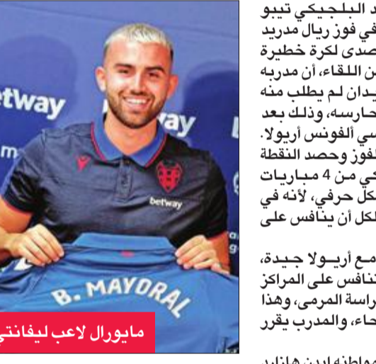
مايورال لاعب ليفانتي

من جانب آخر، أكد البلجيكي تيبو كورتوا عقب مساهمته في فوز ريال مدريد على ليفانتي، بعدما تصدى لكرة خطيرة في الدقائق الأخيرة من اللقاء، أن مدربه الفرنسي زين الدين زيدان لم يطلب منه "حرفياً" أن يكون هو حارسه، وذلك بعد تعاقده النادي مع الفرنسي الفونس أريولا. وصرح كورتوا عقب الفوز وحصد النقطة الثامنة للفريق الملكي من 4 مباريات بالليغا "ليس هكذا بشكل حرفي، لأنه في فريق مثل مدريد على الكل أن ينافس على مركزه".