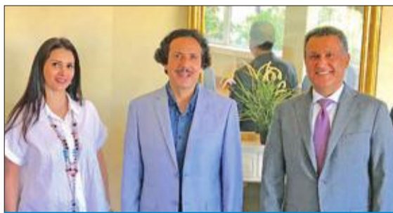
عزام الصباح متوسطاً منار الصباح ويوسف جحيل

المنذوية، بينهم الملحق الدبلوماسي الشيخة منار الصباح، والسكربتير الأول د. جيهان الأستاذ، والباحث السياسي سلطان العتيبي. من جانبه، شكر مندوب الكويت الدائم م. يوسف جحيل، السفير عزام الصباح على زيارته ومؤازرته وتشجيعه المهم للمندوبية وأعضائها في أداء عملها، الذي يعكس حرصه ودور وزارة الخارجية في مساندة الحضور الكويتي الفاعل في المنظمات والمحافل الدولية.