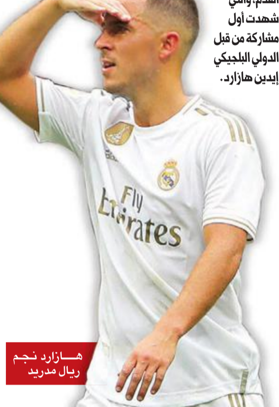
هازارد نجم ريال مدريد

حقق ريال مدريد انتصاراً صعباً على ضيفه ليفانتي 2-3 ضمن الجولة الرابعة من دوري الدرجة الأولى الإسباني لكرة القدم، والتي شهدت أول مشاركة من قبل الدولي البلجيكي إيدن هازارد.