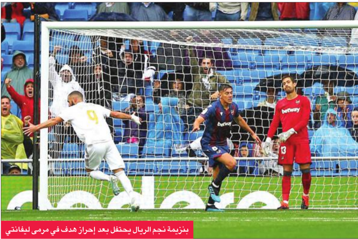
بنزيمة نجم الريال يحتفل بعد إحراز هدف في مرمى ليفانتي