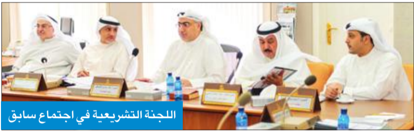
اللجنة التشريعية في اجتماع سابق

رقم (11) لسنة 1962 في شأن جوازات السفر بندين بمحتان أزواج وزوجات الفئة (أ) أعضاء