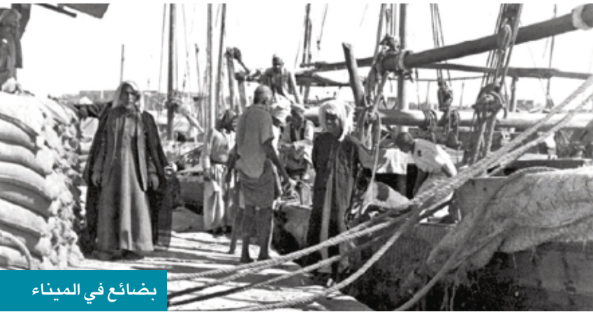
بضائع في الميناء

بعض طرق «فريج سعود» وهو أحد أقدم أحياء الكويت لم يكن عرضه يزيد على متر واحد