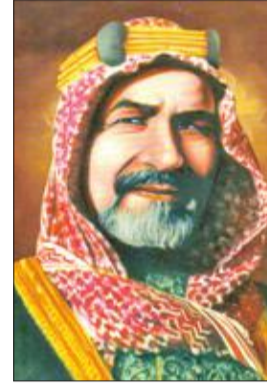
الشيخ أحمد الجابر الصباح

كما تكون هذه الحُفر أحياناً مكاناً للتخلص من النفايات والحيوانات النافقة، وإذا تكاثرت كميات النفايات أو الحيوانات النافقة في هذه الحُفر أو حولها يقوم المجاورون لهذه الحُفر في بعض الأحيان بحرقها للتخلص من الروائح الكريهة المنبعثة منها، ومعاً لتكاثر الذباب، ناهيك عن الأضرار الصحية التي تسببها وما أكثرها وأخطرها، ومما لا شك فيه أن وجود هذه النفايات كان يسبب مضايقة كبيرة للناس، لاسيما الذين يسكنون البيوت المجاورة لهذه الأماكن، أضف إلى ذلك وجود بيوت خربة أو مهجورة تستعمل