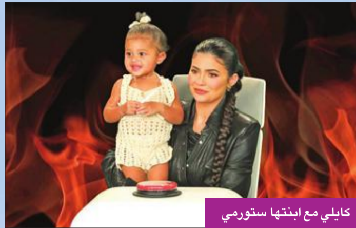
كايلي مع ابنتها ستورمي

تعرضت نجمة تلفزيون الواقع كايلي جينر إلى موقف محرج على الهواء، خلال استضافتها ضمن برنامج «الين دي جينيريس»، وكانت تصطحب معها ابنتها «ستورمي»، من والدها مغني الراب ترافيس سكوت. وبينما كانت جينر تحتضن ابنتها، سألتها «من بحبك أكثر؟»، فأجابته ستورمي فوراً «بابا»، مما دفع كايلي للتجاهل والنظر إلى الكاميرا، والقول بابتسامة عريضة: «في كل مرة هذه إجابتي».