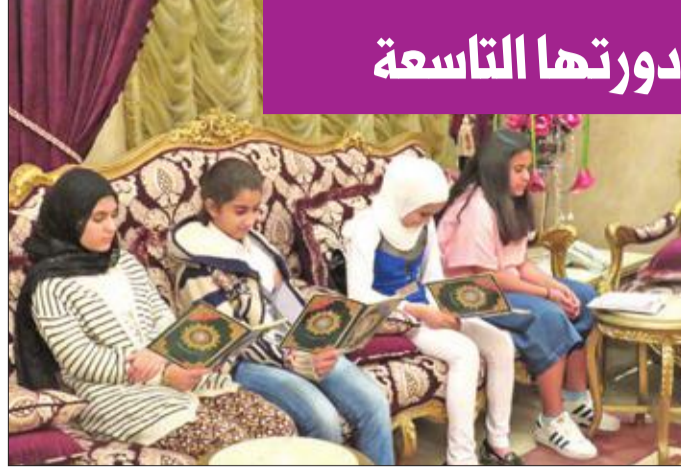
مشاركات يتدربن على التجويد