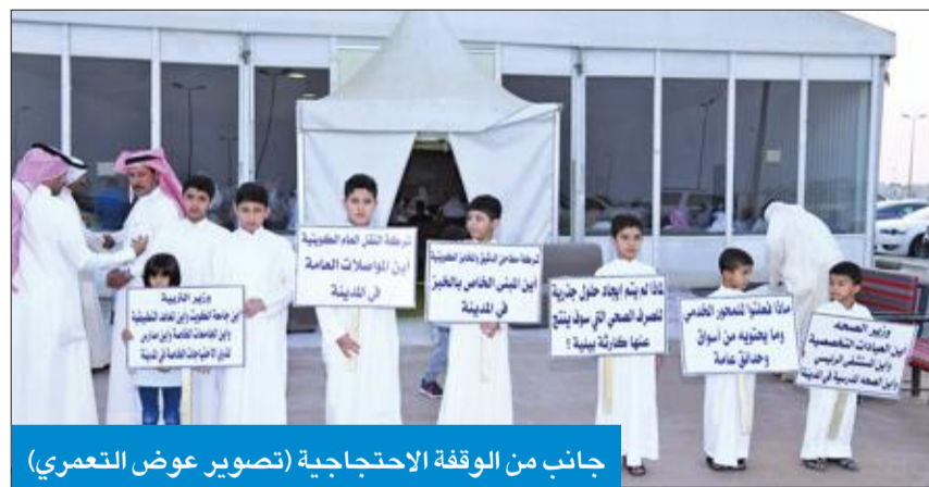
جانب من الوقفة الاحتجاجية

من جهته، ناشد أحد أهالي مدينة صباح الأحد السكنية بضرورة توفير مواقع عبر البناء أو الاستئجار لمدارس ذوي الاحتياجات الخاصة، مشيراً إلى أنه يخرج من منزل يومياً الساعة 4 فجراً لإيصال أبنائه في منطقة حولي، داعياً مسؤولي الدولة إلى توفير المدارس المناسبة لذوي الإعاقة في المنطقة الجنوبية على وجه السرعة.