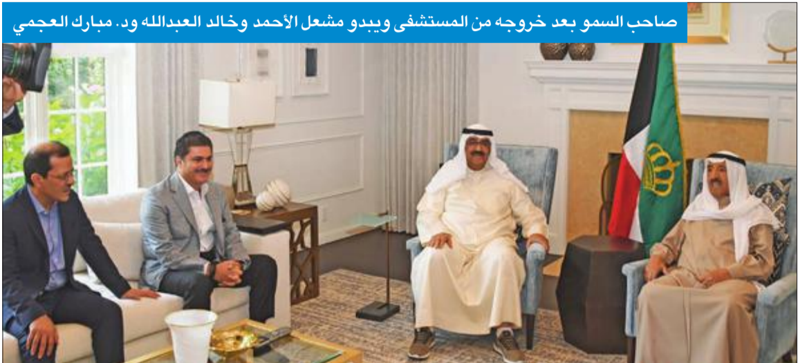
صاحب السمو بعد خروجه من المستشفى ويبدو مشعل الأحمد وخالد العبدالله ود. مبارك العجمي

والاستقرار في البلد الصديق، والذي يتناهى مع الشرائع والقيم الإنسانية. وبعث صاحب السمو ببرقية تعزية إلى ملك مملكة إسبانيا الصديقة فيليب السادس عبر فيها سموه عن خالص تعازيه وصادق مواساته بضحايا العاصفة التي ضربت شرقي إسبانيا وأسفرت عن سقوط عدد من الضحايا والمصابين. راجيا سموه للضحايا الرحمة وللمصابين سرعة الشفاء والعافية ويان يتمكن المسوقون في البلد الصديق من تجاوز آثار هذه الكارثة الطبيعية.