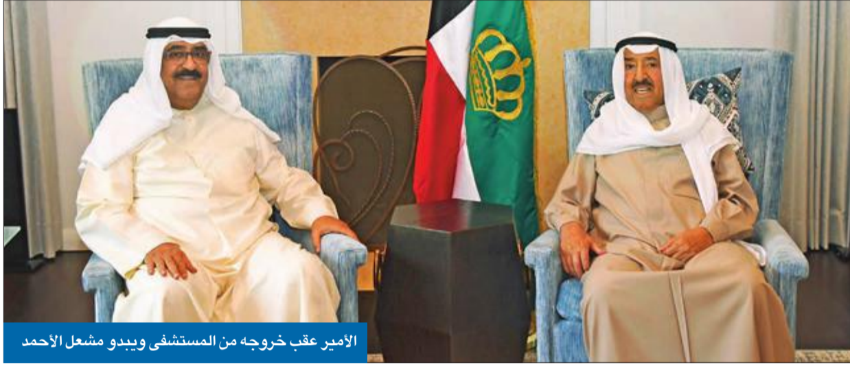
الأمير عقب خروجه من المستشفى ويبدو مشغل الأحمدة

سموه شكر المطمئنين على صحته من المواطنين والمقيمين وقادة الدول ● «أقدر مشاعركم الطيبة ودعواتكم الصادقة ومتابعتمكم المستمرة عبر وسائل التواصل»