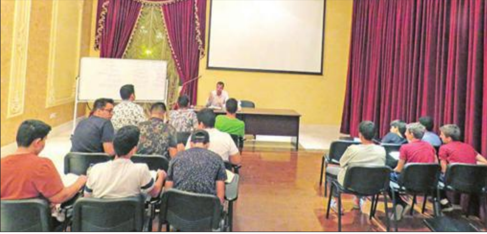
جانب من الدورة التعليمية