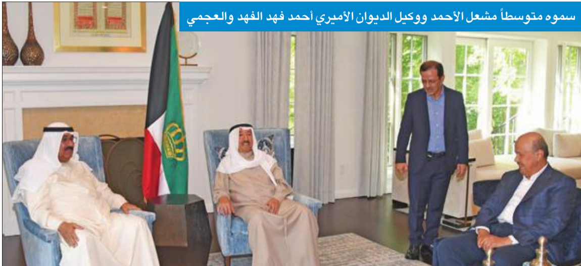
سموه متوسطاً مشعل الأحمد ووكيل الديوان الأميري أحمد فهد الفهد والعجمي

سموه شكر المطمئنين على صحته بعد الفحوصات الطبية وعزى رئيسي الإمارات وتركيا وملك إسبانيا