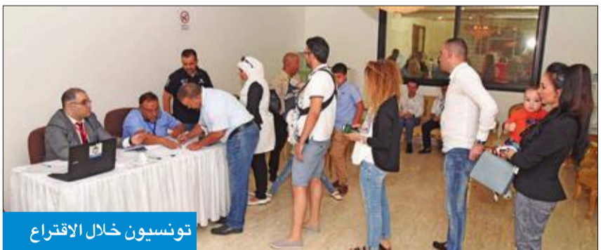
تونسيون خلال الاقتراع

بن صغير يشيد بتعاون «الخارجية» و«الداخلية» في تسهيل الاقتراع