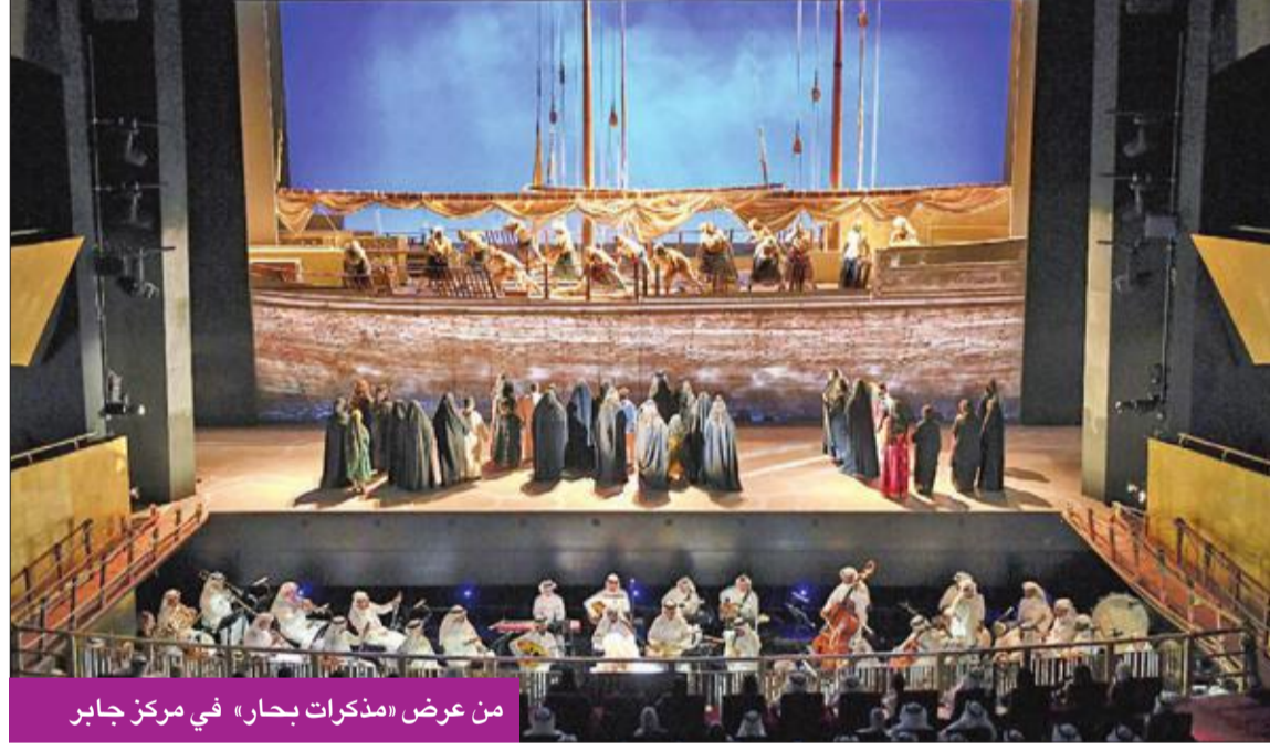
من عرض «مذكرات بحار» في مركز جابر

حضور الفيلم وقد شعرت بالحنين إلى ذلك الزمن، «لا سقى للمواضيع المطروحة حينها. كنا نستطيع مناقشة أي موضوع اجتماعي بكل حرية». * محرر مجلة «فايننشال تايمز»، 10 سبتمبر 2019