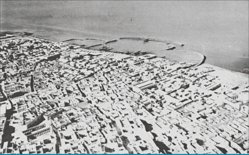
مدينة الكويت كما بدت من الجو خلال الثلاثينيات... بيوت مترصة وفرجان وأزقة ضيقة

مناطق المذكورة، وتصل هذه البضائع عادة على شكل أكوام مكدسة في السفينة غير مُعبأة، وينتج عن تفريغها تناثر أجزاء كثيرة منها وتساقطها في حوض الميناء مما ينتج عنه نفايات. أما ما يُرَد إلى الكويت عن طريق البر فمكان تجمعه في ساحة الصفاة، وتشمل هذه الواردات في الغالب الأغنام والماعز والإبل، بالإضافة إلى مُنتجات السمن واللبن والجرثي (لبنيه) والإقط مما يشتريه الناس للأكل، وكذلك العرّج والحلّة (بعر البعير) لاستعمالهما للوقود، والشام