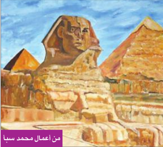
من أعمال محمد سبأ