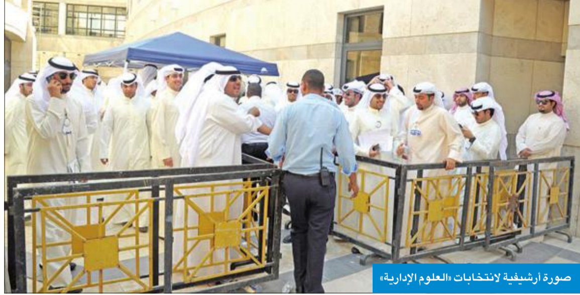
صورة أرشيفية لانتخابات «العلوم الإدارية»