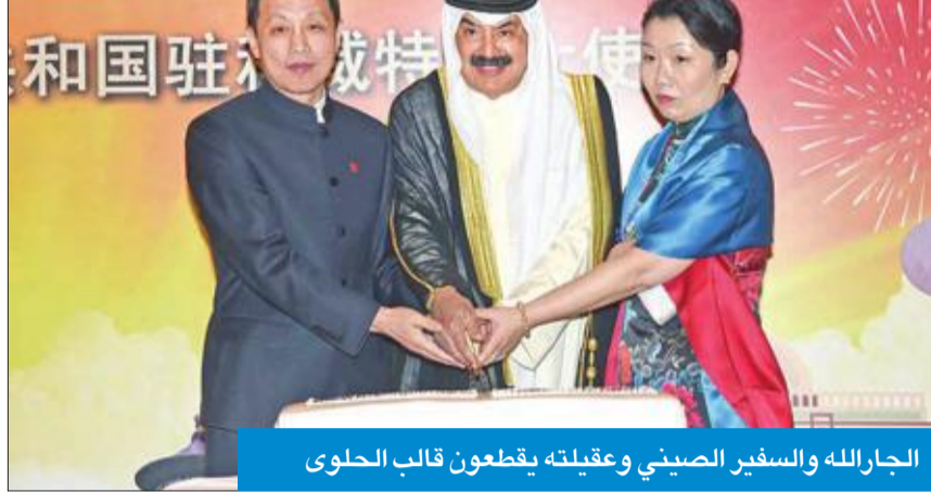
الجارالله والسفير الصيني وعقيلته يقطعون قالب الحلوى

وإذا ما كانت هناك أطراف تحركت الوضع، قال الجارالله: "لا تغفل عن بعض الجهات في العراق الشقيق التي تحاول أن تغذي هذه الأمور بكل أسف"، مشيراً إلى أن الكويت تنظر إلى الشكوى من العراق لمجلس الأمن في إطار محاولة توضيح موقف، ومؤكداً أن الكويت