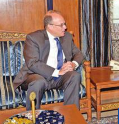
بري مستقبلاً بلينغسلي أمس

محافظة جنوب سيناء والسويس وللشغيل التجريبي لمنظومة التامين الصحي الشامل الجديدة، قالت النائبة البرلمانية منى الشبراوي، في بيان أمس، إنها جمعت موافقة 81 نائباً على سحب الثقة من وزيرة الصحة هالة زايد، وأكدت النائبة أن «حال المستشفيات في مصر والقطاع الصحي في عهد الوزيرة وصل إلى حالة يرثي لها»، وسبق أن تقدمت الشبراوي بمذكرة عاجلة لرئيس البرلمان الأرياء الماضي، لاستدعاء وزيرة الصحة فور انعقاد البرلمان أكتوبر المقبل. في غضون ذلك، ترأس رئيس مجلس الوزراء مصطفى مدبولي، اجتماع اللجنة الرئيسية لتقنين أوضاع الكنائس، أمس، إذ استعرضت اللجنة أعمال المراجعة منذ آخر اجتماع لها في 5 أغسطس الماضي، وقررت اللجنة تقنين أوضاع 62 كنيسة ومبنى تابعة، وبذلك يبلغ عدد الكنائس التي تمت الموافقة على توفيق أوضاعها منذ بدء عمل اللجنة في يناير 2017 وحتى الآن 1171 كنيسة ومبنى تابعاً. وواصل الرئيس عبد الفتاح السيسي نشاطه المكثف على هامش فعاليات الدورة الـ 74 للجمعية العامة للأمم المتحدة بنيويورك، إذ التقى بنظيره الأميركي دونالد ترامب مساء أمس، كما التقى كلمة مصر أمام قمة المناخ الدولية،