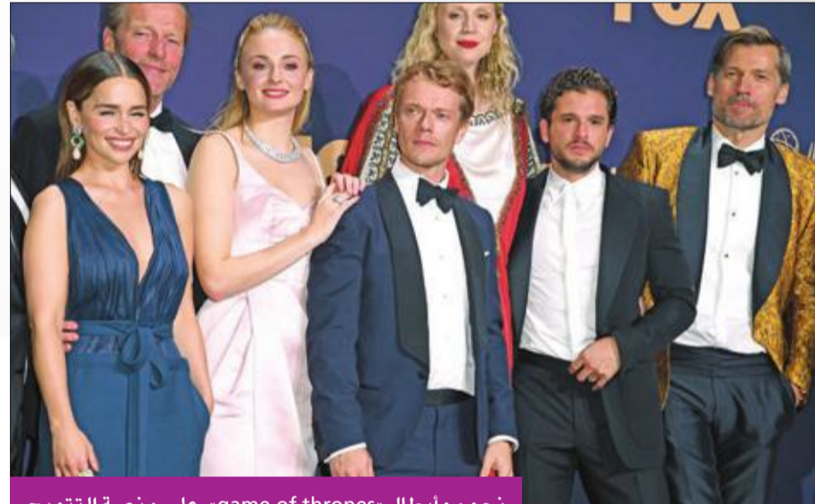
نجوم وأبطال «game of thrones» على منصة التتويج

جائزة أفضل ممثلة في مسلسل كوميدي، ونال «فليباغ» بعد ذلك جائزة أفضل مسلسل كوميدي. وحصد المسلسل البريطاني وهو من إنتاج «بي بي سي» كذلك، جائزتي أفضل سيناريو وأفضل إخراج إذ استحالت ظاهرة على جانبي الأطلسي بعدما اشترته منصة «أمازون». وبات بيلي بورتير أول رجل أسود يفوز بجائزة أفضل ممثل في مسلسل درامي عن «بون» الذي يتناول ثقافة «الحفلات» السرية في نيويورك الثمانينيات.