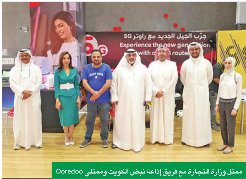
ممثل وزارة التجارة مع فريق إذاعة نبض الكويت وممطي Ooredoo

حول تمكين الأفراد ومساعدتهم على اختبار وعيش أحلامهم. وأضاف: تم تصميم مسابقة الكنز بمكافأتها المذهلة بشكل أساسي لتعزيز تفاعل Ooredoo مع عملائنا على مدار العام، وتشجيع الآخرين على الانضمام والاشتراك معنا. وختم: «توفر مسابقة الكنز فرصاً ودية للمشاركين من عملاء Ooredoo للاستمتاع بالمحتوى اليومي القيم والمفيد، ولعب مسابقة مثيرة، لاكتساب المزيد من الفرص، ويحصل المشاركون على المزيد من النقاط لكل الإجابات الصحيحة». تجدر الإشارة إلى أن اختباراً لتقنية 5G عالية السرعة من Ooredoo، والتي لا تزال آثار اهتمام العالم كله، تم إجراؤه من قبل فريق العاملين في برنامج الديوانية على هامش حفل السحب على جائزة Treasure الكبرى.