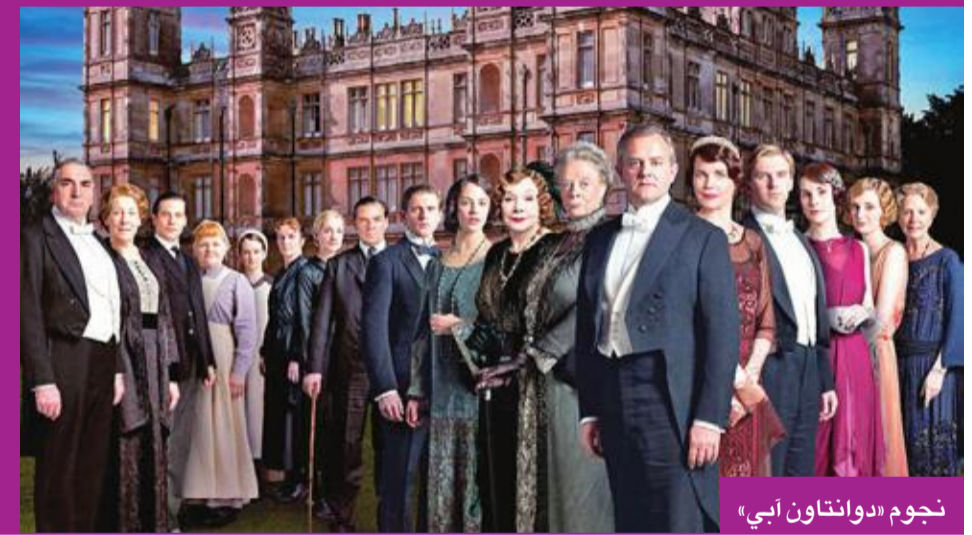
نجوم «داونتاون أبي»

يلعب دور رائد قضاء فيه، والثالث «رامبو: لاست بلد» بطولة سيلفستر ستالون نجم أفلام الحركة (73 عاماً). وكان الفائز الواضح «داونتاون أبي»، الذي