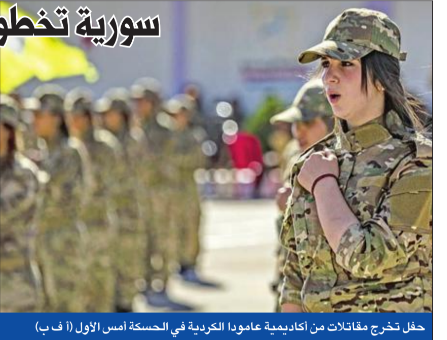
حفل تخرج مقاتلات من أكاديمية عامودا الكردية في الحسكة أمس الأول

في خطوة منتظرة منذ وقت طويل في إطار عملية السلام المتعثرة بسورية، أعلن الأمين العام للأمم المتحدة أنطونيو غوتيريس، أمس، تشكيل لجنة إعداد الدستور بعد موافقة الحكومة والمعارضة والمجتمع المدني على أن تجتمع خلال الأسابيع المقبلة في جنيف، مؤكداً أنها «بداية الطريق للخروج من المأساة نحو حل سياسي»، ينهي النزاع العسكري المستمر منذ أكثر من ثمانية أعوام. وفي زيارته الثالثة لدمشق، بحث المبعوث الأممي غير بيدرسون مع وزير الخارجية السوري وليد المعلم، أمس، إعادة إطلاق العملية السياسية وتشكيل اللجنة الدستورية واليات وإجراءات عملها. وبعد اللقاء، أكد المعلم التزام دمشق بالحل السياسي وقيام لجنة الدستور بدورها بعيداً عن أي تدخل خارجي، مشيراً إلى تطابق وجهات النظر مع بيدرسون بخصوص حق الشعب في تقرير مستقبله، وصولاً إلى إعادة