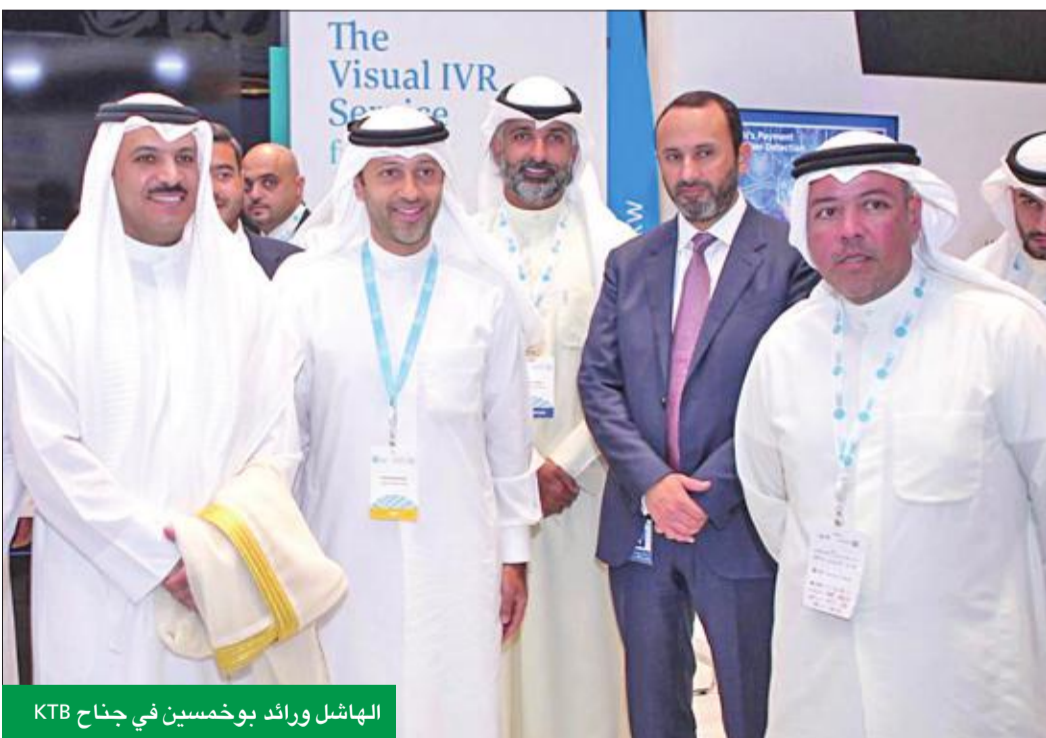
الهاشل ورائد بوخمسين في جناح KTB

بنك الكويت المركزي يعمل على تطوير نظام الكويت الوطني للمدفوعات ليوفر البنية التحتية للاقتصاد الرقمي الذي يتألف من 8 نظم متطورة.