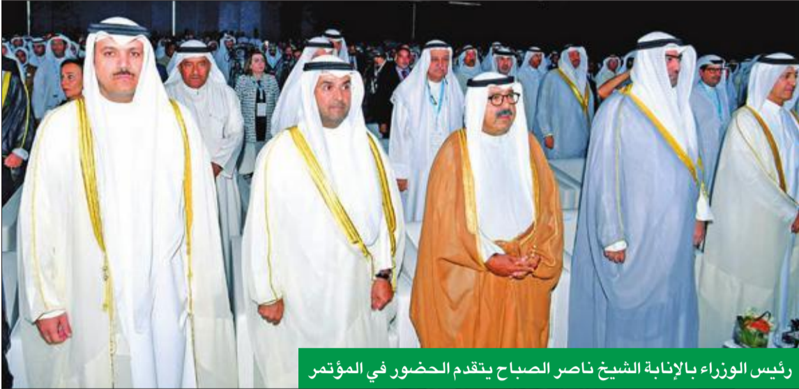
رئيس الوزراء بالإنيابة الشيخ ناصر الصباح يتقدم الحضور في المؤتمر

● على البنوك خوض 5 معارك هي «الولاء» و«القيمة المضافة» و«الكفاءة» و«المتانة» و«المواهب»