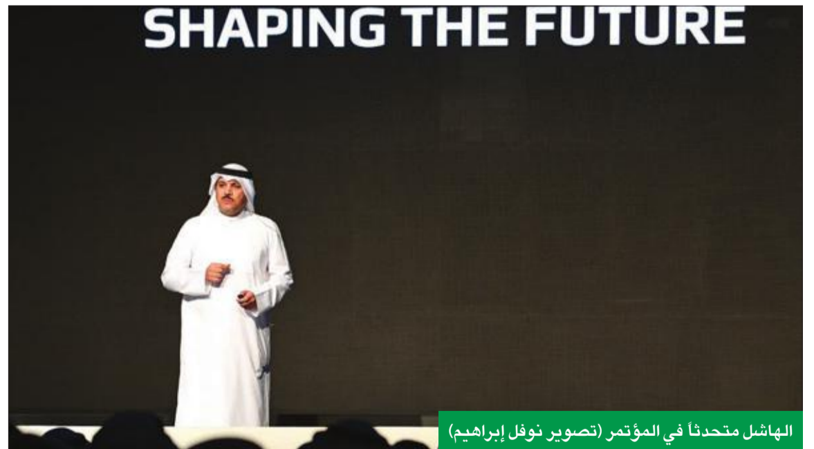
الهاشيل متحدثاً في المؤتمر

وأكد أنه في حين يشير المعهد الدولي للتمويل إلى غموض السياسات الاقتصادية كأحد مكامن المخاطر، فإن المعهد يقدر أن غموض