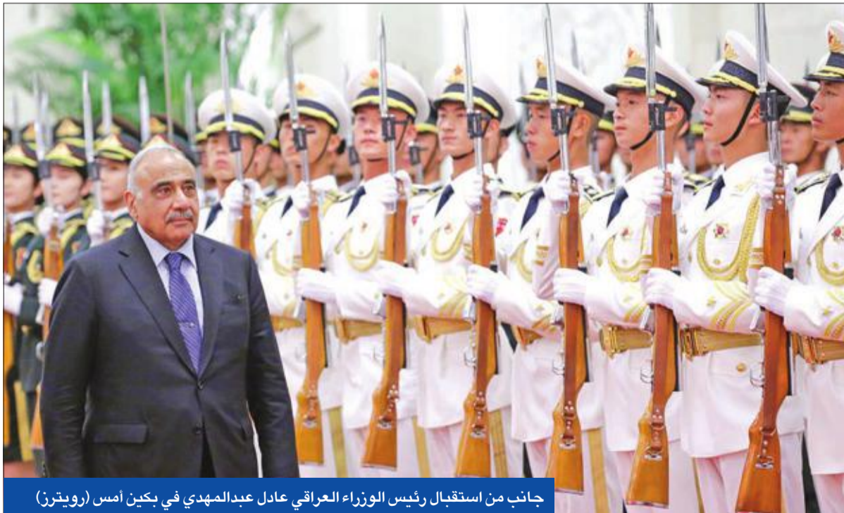
جانب من استقبال رئيس الوزراء العراقي عادل عبدالمهدي في بكين أمس

ويقول هؤلاء إن قضاياهم حين تعرضت للإهمال من قبل معتدلي الشيعة، وجدوا أنفسهم بعد انتخابات 2018، محط اهتمام من الإيرانيين، إلى جانب وعود بتلبية مطالبهم واستيعابهم أمنياً داخل الحشد الشعبي على شكل فصائل عشائرية من الأبناء غرباً حتى الموصل شمالاً. لكن الجبهة المقربة على إيران باتت تهمل مطالب السنة هي الأخرى، فضلاً عن تلك عمليات الإعمار في المدن التي تعاني ويلات الحرب، خصوصاً الموصل ونقص التمويل الحكومي، لم تحظ بالاهتمام الكافي ملفات من قبيل عشرات الجثث المجهولة التي يُعثر عليها تباعاً، ويقال إنها أدلة على مجازر تعرض لها السنة على يد ميليشيات مختلفة، فضلاً عن تعليق قضايا عشرات الآلاف من المحتجزين السنة بلا محاكمة في سجون تقع جنوب البلاد ذي الغالبية الشيعية.