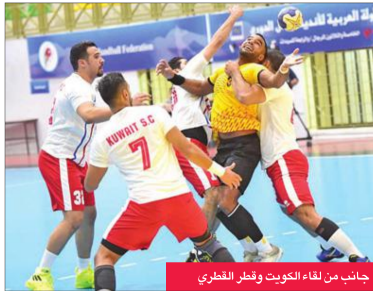
جانب من لقاء الكويت وقطر القطري

نجح الفريق الأول لكرة اليد بالكويت في تحقيق فوز مستحق على نظيره القطري بنتيجة 26-24 في افتتاح النسخة الـ 35 لبطولة الأمير فيصل بن فهد العربية للأندية أبطال الدوري، التي تستضيفها العاصمة الأردنية (عمان) حالياً على صالة الأميرة. وبذلك، اعتلى "الأبيض" قمة مجموعته الثانية بنقطتين، فيما ظل قطر بدون رصيد.