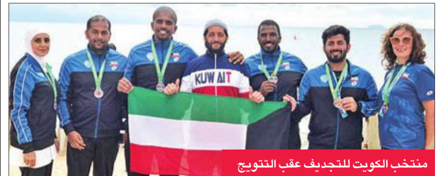
منتخب الكويت للتجديف عقب التتويج

حقق منتخب الكويت للتجديف المركز الثالث في فئة الزوجي والرباعي، ضمن منافسات بطولة آسيا للتجديف، التي ينظمها الاتحاد الآسيوي للتجديف في جزيرة باتايا التايلاندية، من 20 إلى 23 سبتمبر، وبمشاركة 12 منتخباً آسيوياً، تمثل: الكويت، البحرين، بنغلادش، كمبوديا، اليابان، الفلبين وإندونيسيا، إلى جانب الهند بمنتخبين، وتايلاند بثلاثة منتخبات.