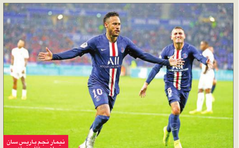
نيمار نجم باريس سان جرمان يحتفل بهدفه

ودخل سان جرمان لمواجهة منتشيا بفوز عريض 3- صفر منتصف الأسبوع على ريال مدريد الإسباني في دوري أبطال أوروبا، وكان