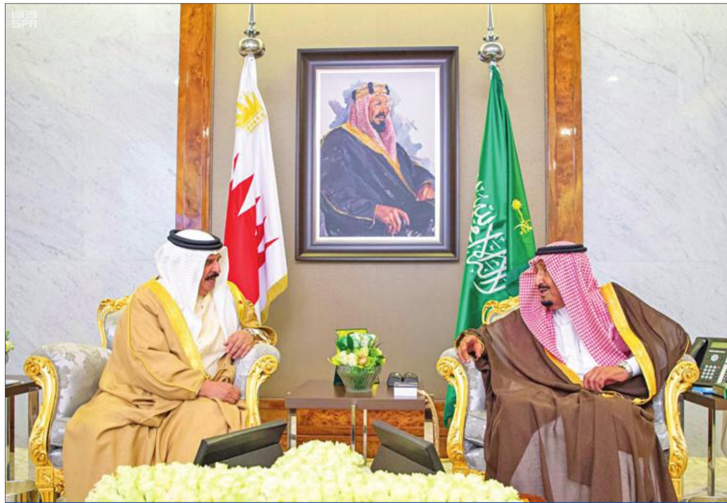
أكد العاهل السعودي الملك سلمان بن عبدالعزيز خلال استقباله ملك البحرين حمد بن عيسى آل خليفة قدرة المملكة على التعامل مع آثار الهجوم التخريبي الذي طال شركة «أرامكو» واستهدف إمدادات الطاقة العالمية. وفي الصورة سلمان مجتمعاً بحمد في قصر السلام بجدة أمس

اتهم رئيس الوزراء البريطاني بوريس جونسون إيران بالتورط في الهجوم على منشأتين لشركة أرامكو السعودية بالمنطقة الشرقية في المنطقة الشرقية أخيراً، فيما هون الرئيس الإيراني حسن روحاني من خسائر الضربة التي تبتتها جماعة «أنصار الله» الحوثية قبيل سفره لحضور اجتماعات الأمم المتحدة في نيويورك.