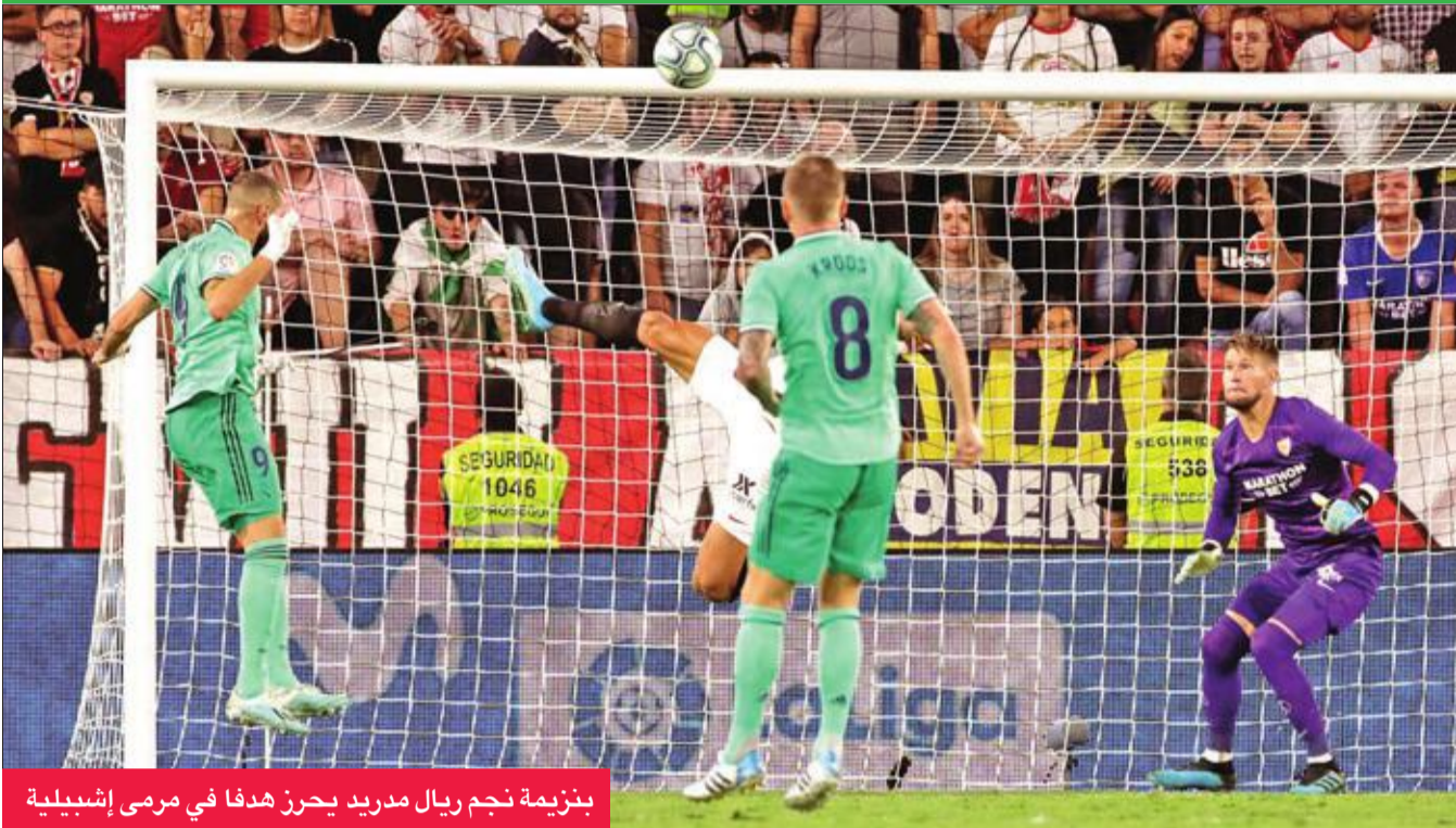
بنزيمة نجم ريال مدريد يحرز هدفا في مرمى إسبيلية

ولم ينجح برشلونة في تحقيق الفوز خارج ملعبه في مباراة رسمية منذ إبريل الماضي، ولا يزال عاجزا عن اظهار شخصيته الهجومية المعهودة منذ استخدام الفرنسي أنطوان غريزمان من أتلتيكو مدريد بصفقة ضخمة (120 مليون يورو)، وكان سجدا دون أفكار بعدما كان يتقن سابقا في تحقيق الانتصارات السهلة في مواجهاته. ويلعب اليوم أيضا بلد الوليد مع غرناطة، وريال بيتيس مع ليفانتي.