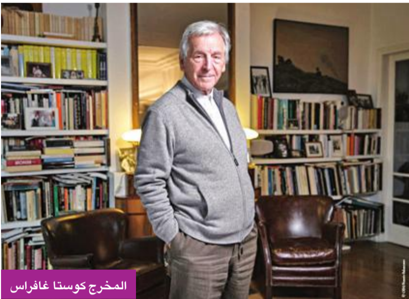
المخرج كوستا غافراس

منذ بدايتها، وتابع كل التطورات، ووجد مادة دسمة لعمله المقبل في الكتاب الذي كان يانيس فاروفاكيس يحضّره. وكشف: «كان يرسل لي الفصل تلو الآخر، وبدأنا نتناقش في السيناريو»، حيث اشترى المخرج حقوق تكييف الكتاب الذي صدر سنة 2017. يُذكر أن كوستا غافراس وُلد في بيلوبونيسوس عام 1933، وهاجر إلى باريس عندما كان في الثانية والعشرين من العمر، وبالكاد يتكلم الفرنسية. وتطرق في أعماله إلى عدة مآسٍ سياسية، كالحكم الديكتاتوري في اليونان في «زد» (1969)، وحالات الاختفاء القسري في تشيلي إثر الانقلاب الذي نفذه بينوشيه في «ميسينغ» (1982)، والنازية في «موزيك بوكس» (1989)، و«أمين» (2002)، فضلاً عن الهجرة من الشرق الأوسط إلى أوروبا في «إدن أ لويست» (2009). ونال المخرج «أوسكار» أفضل فيلم أجنبي عن «زد» سنة 1969، والسعفة الذهبية في كان عام 1982، عن «ميسينغ»، الذي حاز بفضلها أيضاً «أوسكار» أفضل سيناريو مكيف. (أ ف ب)