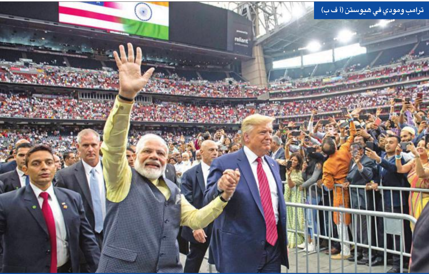
ترامب ومودي في هيوستن

تصاعدت مطالبات ديمقراطيين بعزل الرئيس الأمريكي دونالد ترامب، على خلفية معلومات عن ممارسته ضغوطاً على الرئيس الأوكراني فولوديمير زيلينسكي في اتصال هاتفي بينهما للتحقيق في مزاعم عن نجل منافسه المحتمل في «رئاسة 2020» جو بايدن.