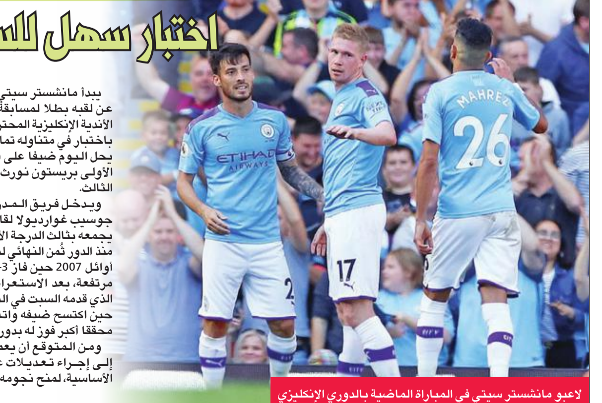
لاعبو مانشستر سيتي في المباراة الماضية بالدوري الإنكليزي

يبدأ مانشستر سيتي حملة الدفاع عن لقبه بطلا لمسابقة كأس رابطة الأندية الإنكليزية المحترفة لكرة القدم، باختيار في متناوله تماماً، وذلك حين يحل اليوم ضيفاً على فريق الدرجة الأولى بريستون نورث إند في الدور الثالث. ويدخل فريق المدرب الإسباني جوسيب غوارديولا لقاء اليوم، الذي يجمعه بثالث الدرجة الأولى لأول مرة منذ الدور ثمن النهائي لمسابقة الكأس أوائل 2007 حين فاز 1-3، بمعنويات مرتفعة، بعد الاستعراض الهجومي الذي قدمه السبت في الدوري الممتاز حين اكتسح ضيفه واتفورد 8-صفر، محققاً أكبر فوز له بدوري الأضواء. ومن المتوقع أن يعتمد غوارديولا إلى إجراء تعديلات على تشكيلته الأساسية، لمنح نجومه فرصة التقاط