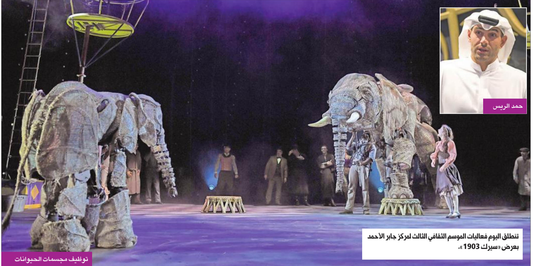
تنتقل اليوم فعاليات الموسم الثقافي الثالث لمركز جابر الأحمد بعرض «سيرك 1903».