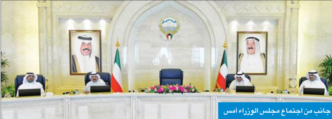
جانب من اجتماع مجلس الوزراء أمس

ظل الأوضاع والظروف التي تمر بها المنطقة، وحث القوات العسكرية على بذل المزيد من الجهد والاجتهاد والعطاء المتواصل، سائلاً المولى عز وجل أن يديم على وطننا نعمة الأمن والأمان في ظل قيادة صاحب السمو الأمير القائد الأعلى للقوات المسلحة الشيخ صباح الأحمد، وسمو ولي