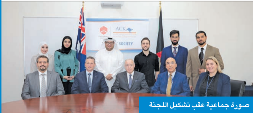
صورة جماعية عقب تشكيل اللجنة