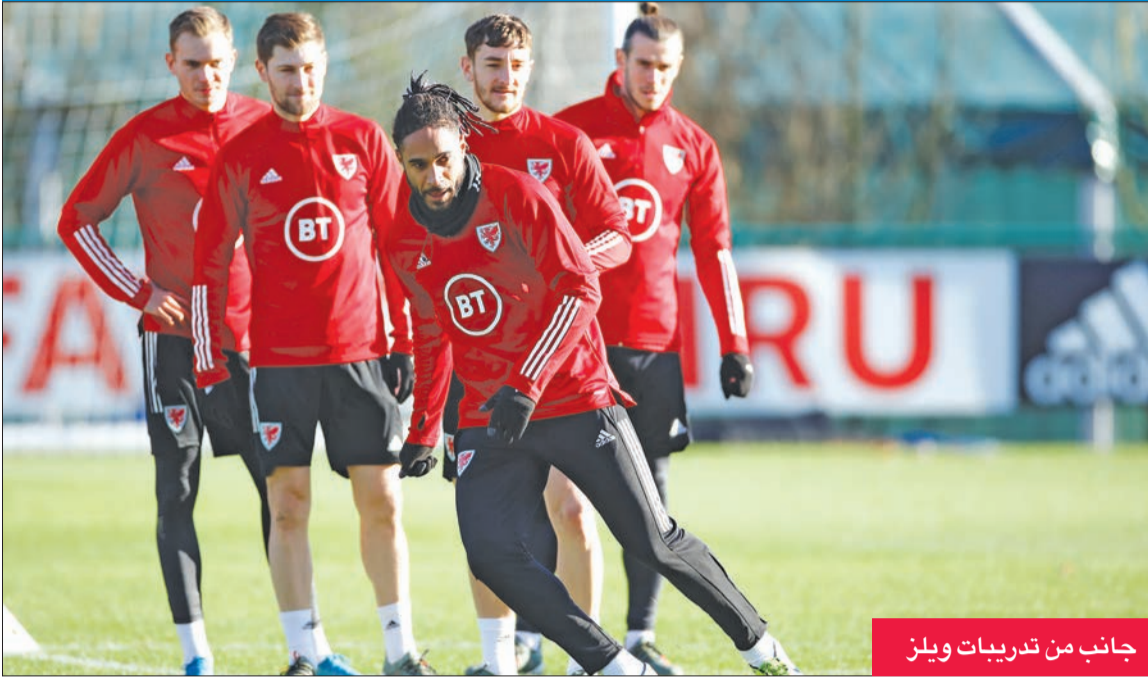
جانب من تدريبات ويلز