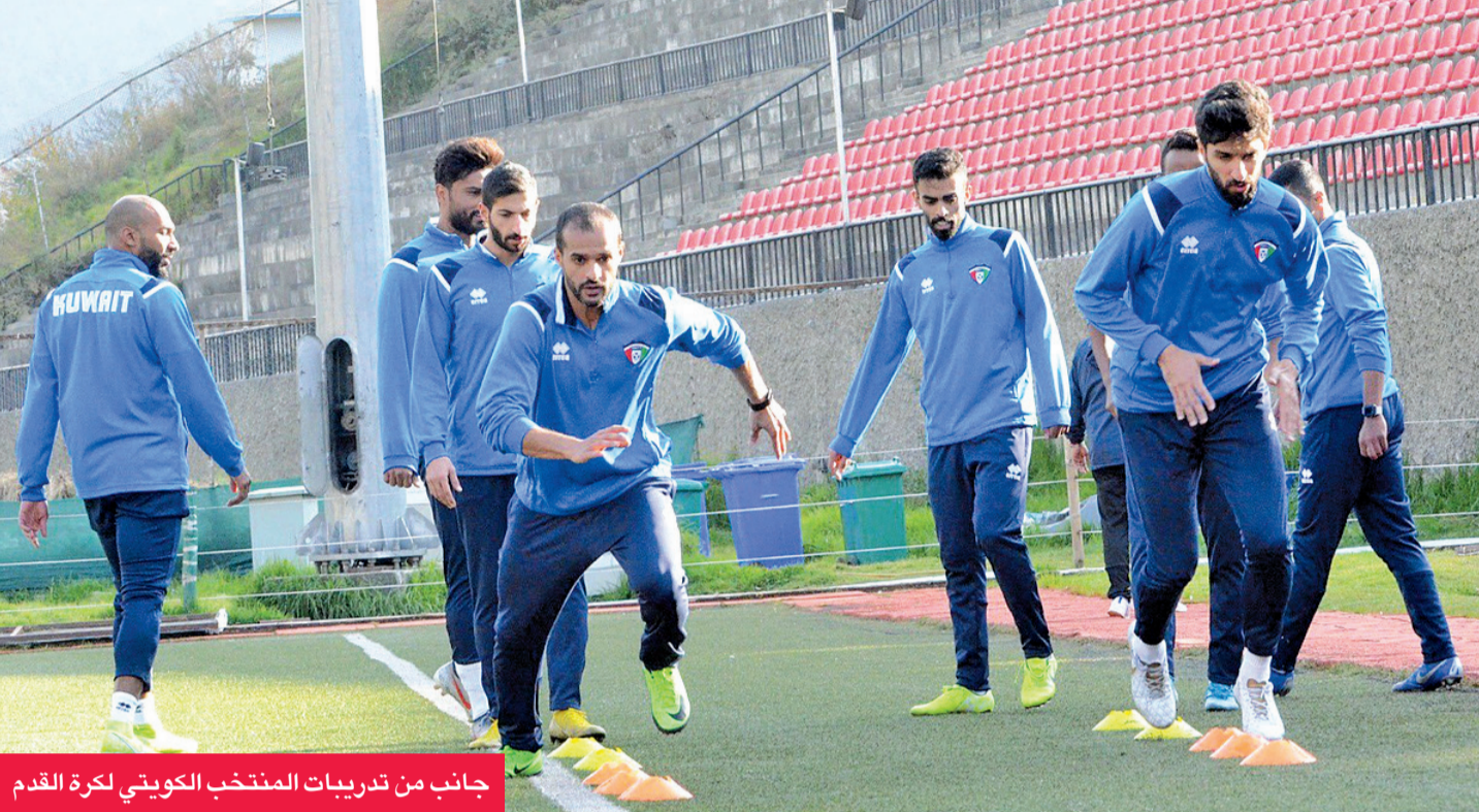
جانب من تدريبات المنتخب الكويتي لكرة القدم