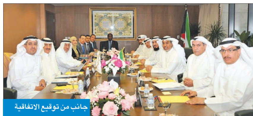
جانب من توقيع الاتفاقية

وأردف أن «مجالات التعاون بين بيت الزكاة والبنك بناء على البروتوكول، ستشمل