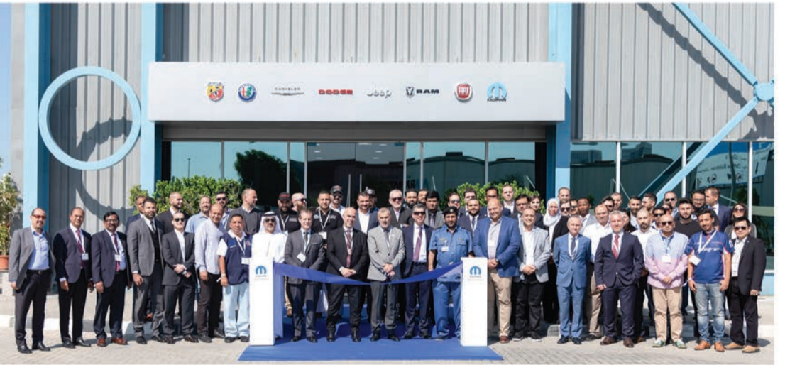
صورة جماعية اثناء الافتتاح

عززت مجموعة فيات كرايسلر للسيارات شبكتها لدعم خدمة ما بعد البيع في أرجاء المنطقة بشكل ملموس، مع الكشف عن مركز توزيع إقليمي وأكاديمية تدريب جديدين يمتدان على مساحة 18 ألف متر مربع في المنطقة الحرة في جبل علي بدبي (جافزا). وتدير هذه المنشأة المتطورة موبار، الشركة التي تختص بالعناية بالعملاء وقطع الغيار والخدمة لمركبات مجموعة فيات كرايسلر للسيارات حول العالم، ومن شأنها أن تغطي نطاقاً جغرافياً كبيراً، يشمل دول مجلس التعاون الخليجي والأردن والعراق واليمن.