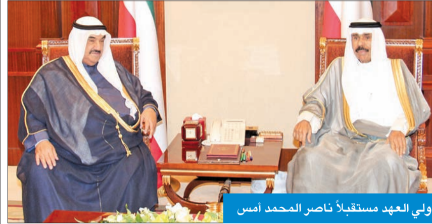
ولي العهد مستقبلاً ناصر المحمد أمس

استقبل سمو ولي العهد الشيخ نواف الأحمد بقصر بيان صباح أمس سمو الشيخ ناصر المحمد. كما استقبل سموه الشيخ الدكتور إبراهيم الدعيج. ولي العهد يرعاه سموه الدولي السابع لأبحاث وتطوير الطاقة، الذي تنظمه كلية الهندسة والبتترول بجامعة الكويت من اليوم إلى 21 نوفمبر الجاري.