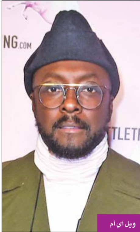
ويل أي أم

وفيما يلي ترتيب أفضل عشرة أفلام: 6 - «دكتور سليب» (6.2 ملايين دولار)