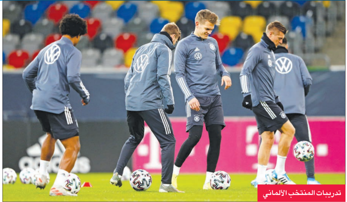
تدريبات المنتخب الألماني

لشبونة برونو فرنانديز في الدقيقة 39 إثر تمريرة بسيطة طويلة من برناردو سيلفا تسلمها صاحب الـ25 عاماً بطريقة رائعة قبل أن يسد كرة أرضية قوية سكنت الشباك. وقبل دقيقة من نهاية الوقت ضيافة لاتفيا.