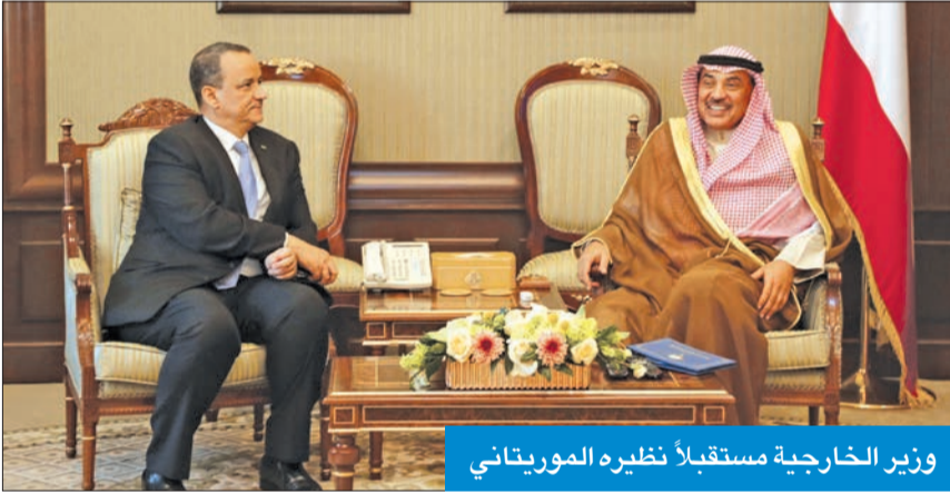
وزير الخارجية مستقبلاً نظيره الموريتاني

استعرضا أوجه التعاون بين البلدين على مختلف المستويات