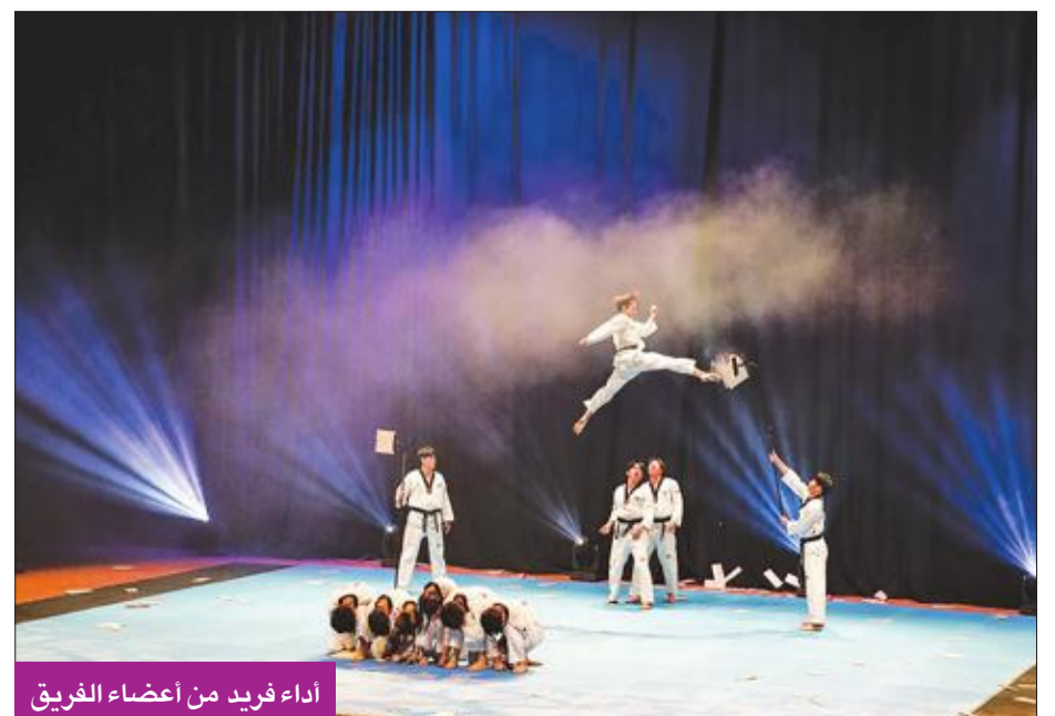
أداء فريد من أعضاء الفريق

اعتبرت جامعة الشرق الأوسط الأميركية أن استضافتها لفرقة الـ «كوكي وون» الكوري يأتي ضمن رسالة الجامعة الثقافية في تعزيز التنوع الثقافي ونشر الوعي حول الانفتاح على حضارات الشعوب الأخرى، إضافة إلى مواكبة المركز الثقافي للنهضة الثقافية المعاصرة التي تاخذ الكويت والمنطقة إلى مراحل جديدة من التقدم والتنمية. كما يأتي دور المركز في تعزيز المشاركة الطلابية بالنشاطات الثقافية التي تنجح لهم فرصة الاطلاع عن كثب على الحضارات الإنسانية والشعوب الأخرى، لا سيما أنهم عنصر القوة لترجمة العلاقات الثقافية وطموح وأمال المجتمع الكويتي في المستقبل.