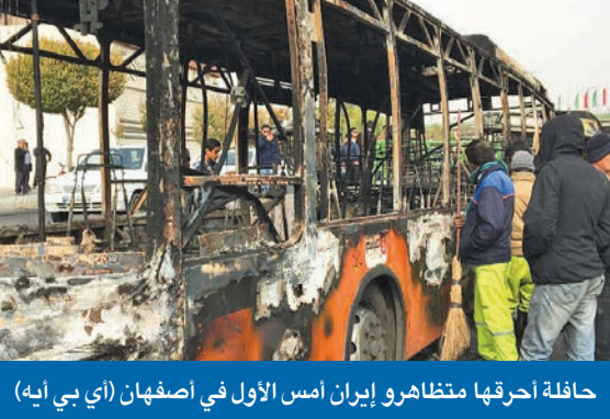
حافلة أحرقتها متظاهرو إيران أمس الأول في أصفهان

حكومة روحاني تتوقع انتهاء «انتفاضة البنزين» خلال يومين لليوم الرابع على التوالي، شهدت إيران، أمس، تظاهرات عنيفة؛ احتجاجاً على قرار حكومة الرئيس حسن روحاني رفع أسعار الوقود وتقنين الدعم، وشارك فيها الآلاف، في وقت تصاعدت حصيللة القتلى لتتجاوز 40 قتيلاً، وتواصلت حملة الاعتقالات، وسط تمديد قرار قطع الإنترنت، وإغلاق عدد كبير من المدارس والجامعات.