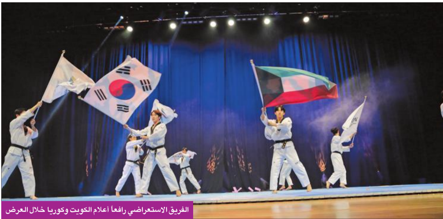
الفريق الاستعراضى رافعا أعلام الكويت وكوريا خلال العرض

التعاون بين السفارة والجامعة. وأمل السفير أن يكون هناك المزيد من التعاون الثقافي والأكاديمي في المستقبل بين السفارة وجامعة الشرق الأوسط الأميركية، بهدف تعزيز التنوع الثقافي، وأن يكون هناك العديد من الفرص لتحضير زيارات أكاديمية يستطيع من خلالها طلاب «AUM» التعرف على كوريا.