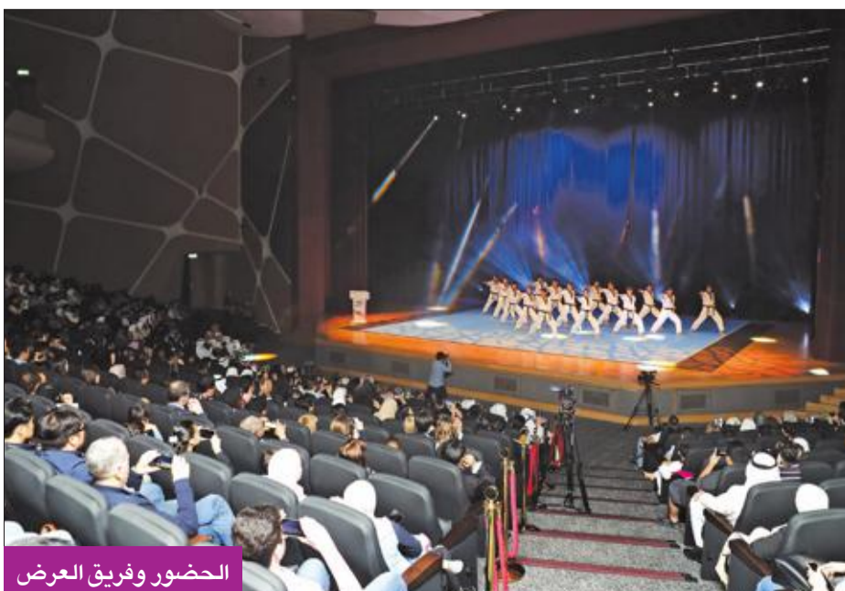
الحضور وفريق العرض