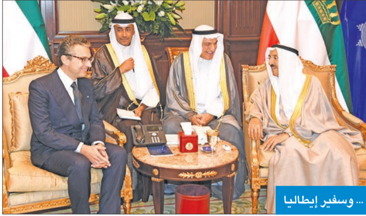
... وسفير إيطاليا