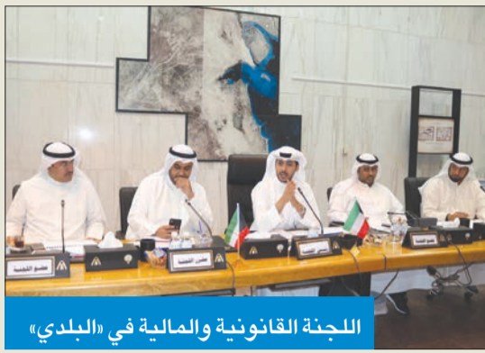
اللجنة القانونية والمالية في البلدي

وافقت اللجنة القانونية والمالية في المجلس البلدي على التعديلات على مشروع القرار الوزاري بشأن لائحة تنظيم الجناز ونقل الموتى والدفن والإشراف على المقابر، في ضوء أحكام القانون رقم 33 لسنة 2016 بشأن لائحة بلدية الكويت ولائحتها التنفيذية.