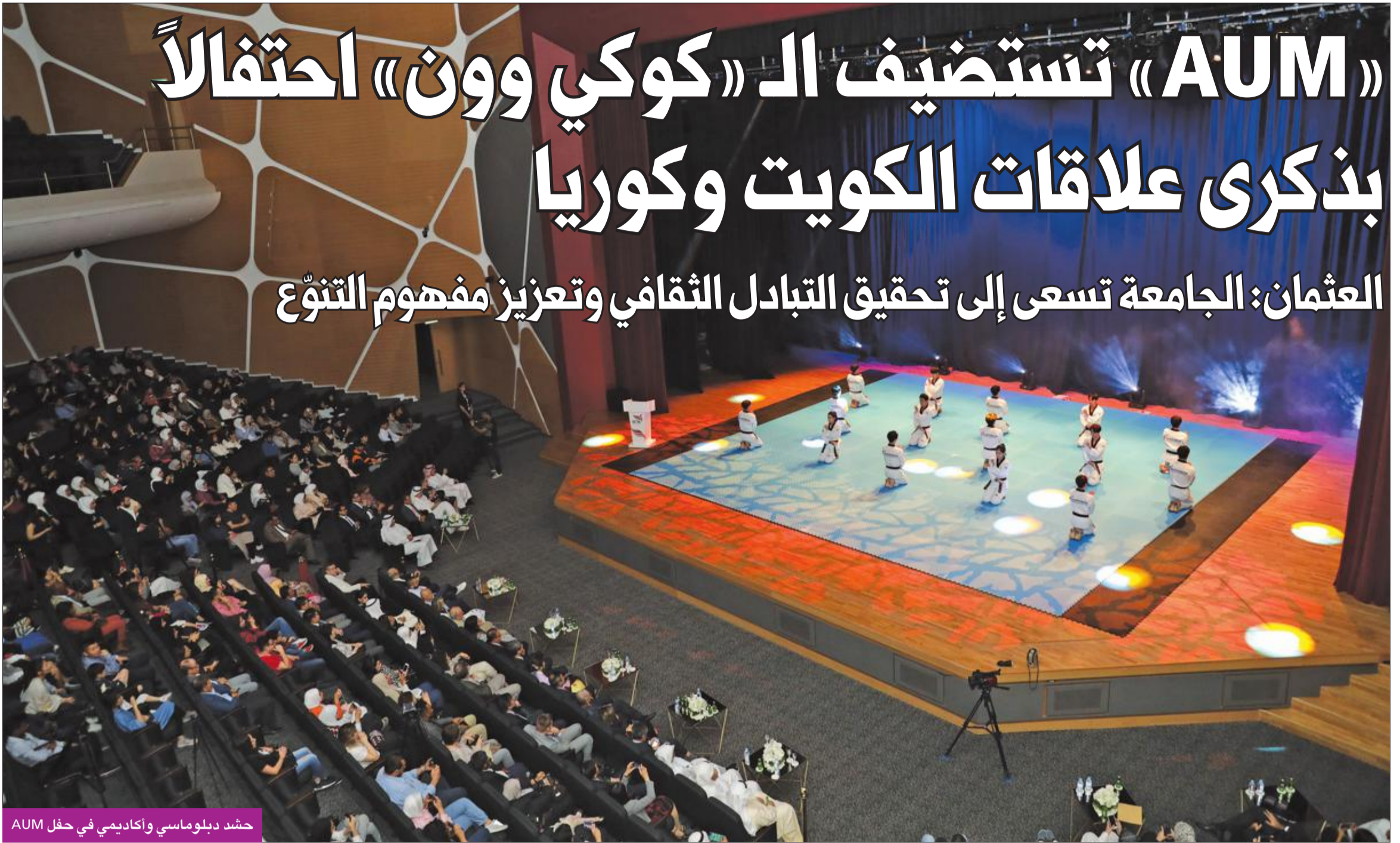
حشد دبلوماسي وأكاديمي في حفل AUM

العثمان: الجامعة تسعى إلى تحقيق التبادل الثقافي وتعزيز مفهوم التنوع