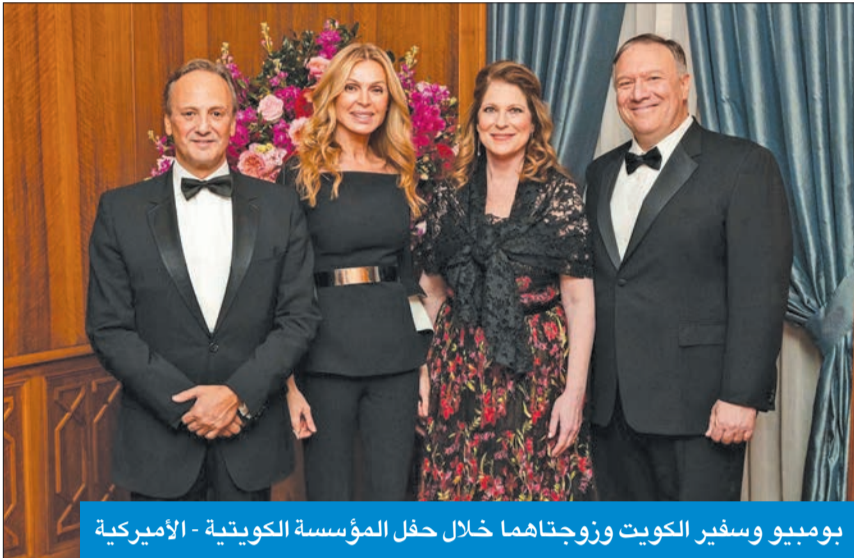
بومبيو وسفير الكويت وزوجتهما خلال حفل المؤسسة الكويتية - الأميركية

وأضاف أنه "نتيجة لهذه المبادرات والدعم السخي وتقديراً لدورنا الخيري الإقليمي والدولي فقد تم تصنيف الكويت كمركز إنساني عالمي، مؤكداً أن سمو أمير البلاد الشيخ صباح الأحمد يجسد هذا الالتزام. وأشار إلى أنه "في الكويت وجدت الولايات المتحدة شريكاً موثقاً به للغاية في التزامنا بالسلام والأمن في جميع أنحاء العالم".