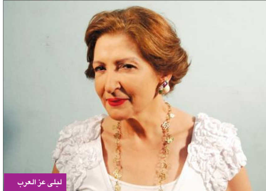
ليلى عز العرب

-انتهيت من تصوير المسلسل أخيراً، واتربق عرضه خلال الأيام القليلة المقبلة، وأجسد فيه