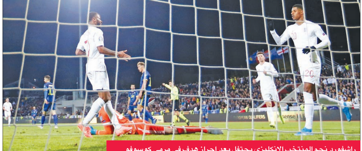
راشفورود نجم المنتخب الإنكليزي يحتفل بعد إحراز هدف في رمى كوسوفو

أسدل منتخب إنكلترا مشواره بالتصفيات المؤهلة لبطولة الأمم الأوروبية كوسوفو برعاية نظيفة،