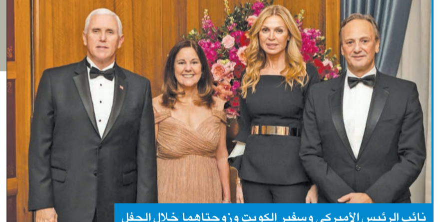
نائب الرئيس الأميركي وسفير الكويت وزوجتهما خلال الحفل

وشكر بنس "القادة المذهلين" الذين أبدوا سخاء كبيراً في مد يد العون للمحتاجين في العالم، مشيداً بدور المؤسسة الكويتية - الأميركية في المجال الإنساني، مؤكداً أن "ما قدمته خلال السنوات الـ 13 الماضية أمر لافت للنظر".