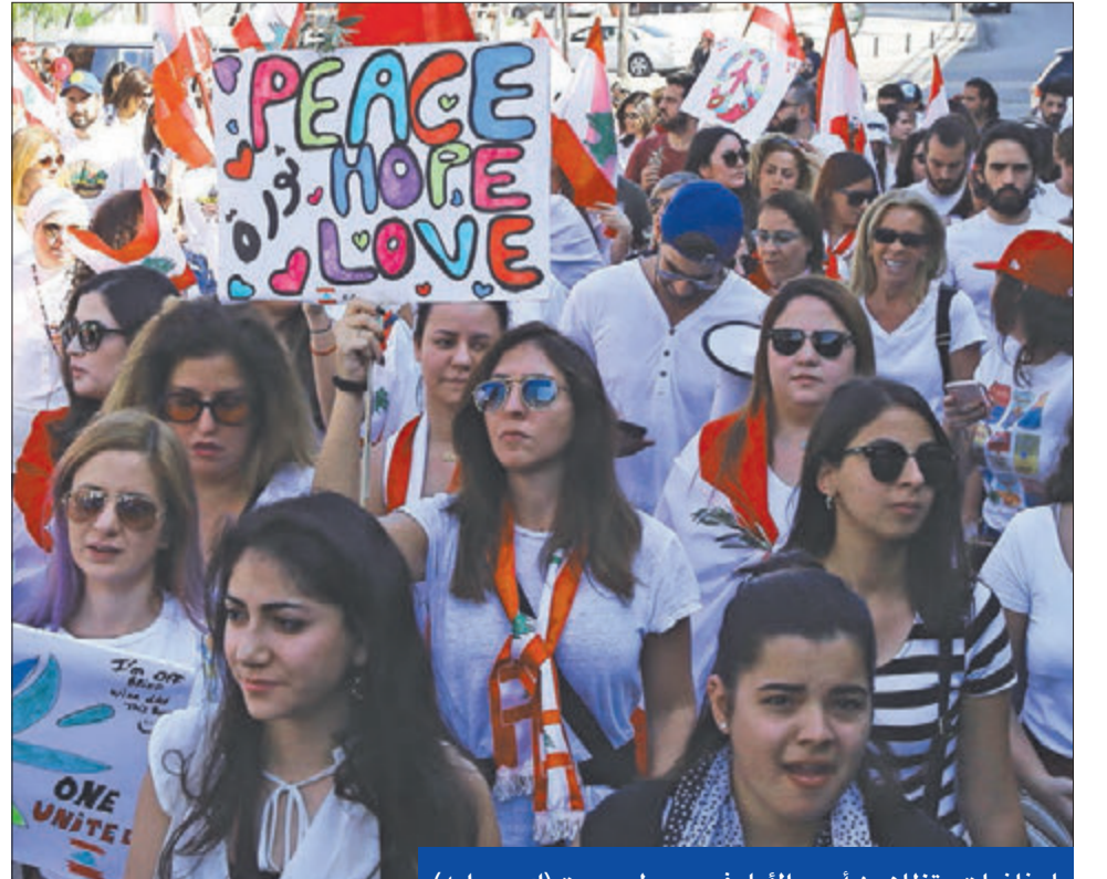
لبنانيات يتظاهرن أمس الأول في وسط بيروت

وكرست تطورات الساعات القليلة الماضية أيضاً اقتسام السلطة فريقيين: الأول يمثلته رئيس حكومة تصريف الأعمال سعد الحريري الراضف العودة إلى السراي (مقر رئاسة الحكومة) إلا على رأس حكومة