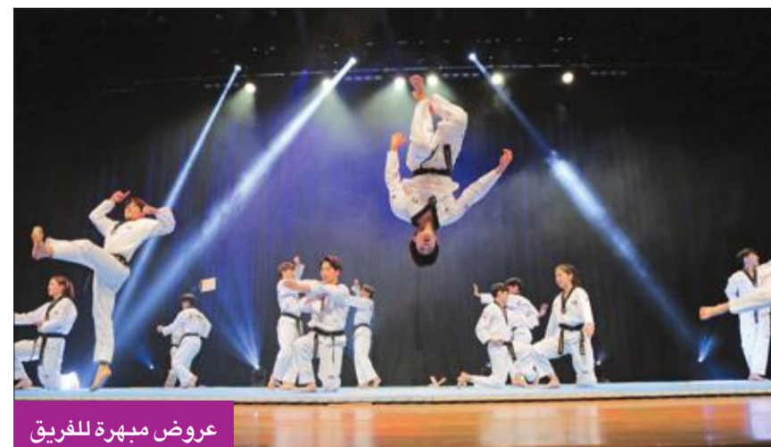
عروض مبهرة للفريق