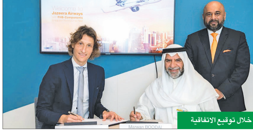
خلال توقيع الاتفاقية

مع إيرباص لتوفير الدعم لأجزاء طائرات A320neo و A320ceo