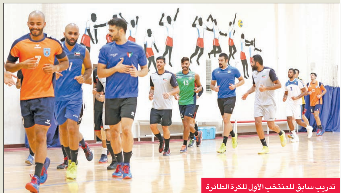
تدريب سابق للمنتخب الأول لكرة الطائرة