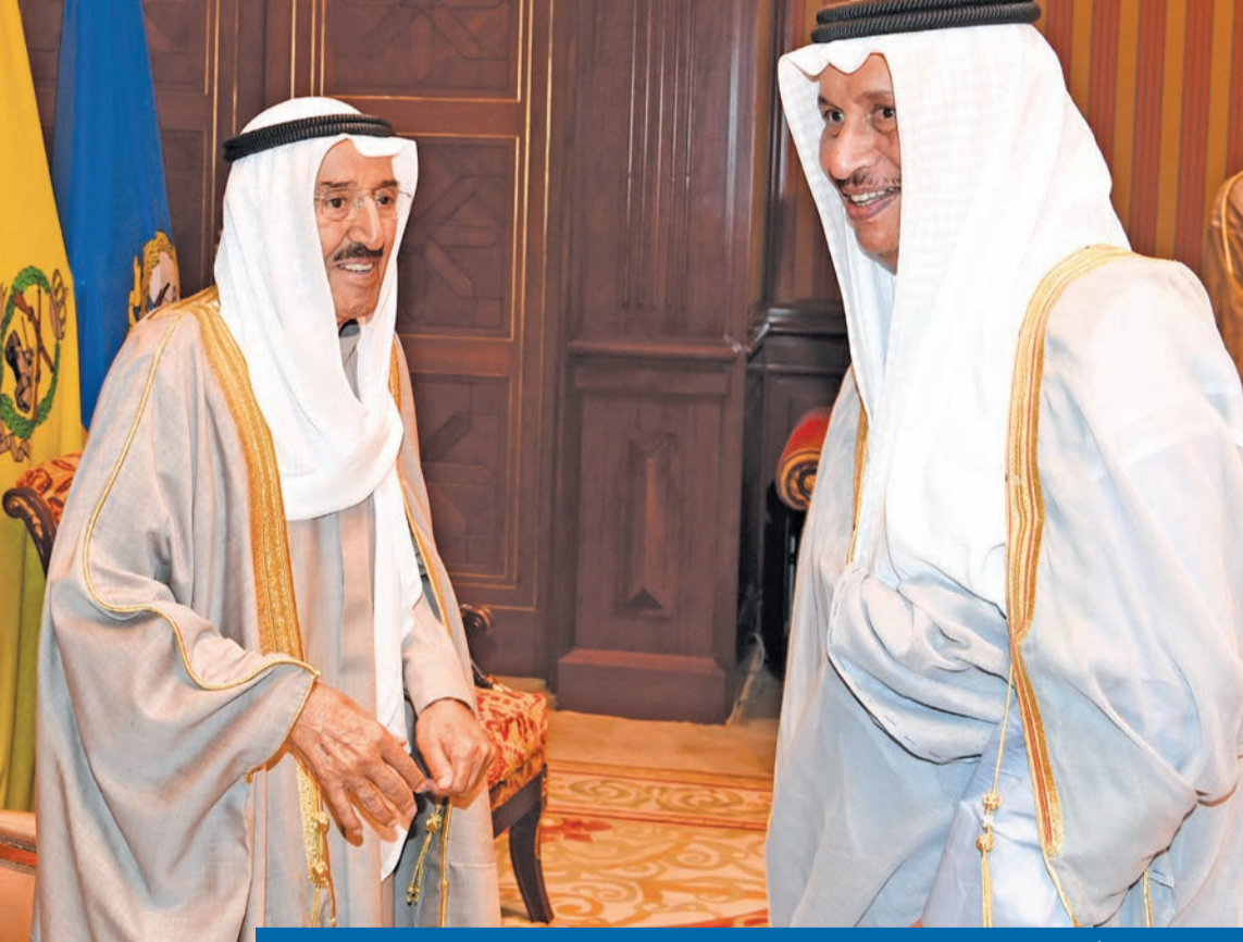
الأمير مستقبلاً المبارك الذي قدم له أمس كتاب اعتذاره عن عدم توليه رئاسة مجلس الوزراء

● الأمير لرئيس الوزراء: خدمت وتحملت البلاوي ● المبارك: الأولوية لإثبات براءتي من الافتراءات