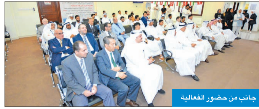
جانب من حضور الفعالية

نظمت كلية القانون الكويتية العالمية (KiLAW) احتفالية يوم الدستور بمناسبة حلول الذكرى السابعة والخمسين على إصدار دستور دولة الكويت، وذلك بتضافر جهود كل من إدارة المسابقات والتطوير الطلابي، وإدارة العلاقات العامة والتسويق، والهيئة الإدارية لرابطة الطلبة، والمشرفين على المرسوم الحر، لتأكيد معاني هذه المناسبة الوطنية التي ترمز إلى ميلاد دولة الكويت الحديثة، لتبدأ بعدها تجربة ديمقراطية ترسخت عاماً بعد عام.