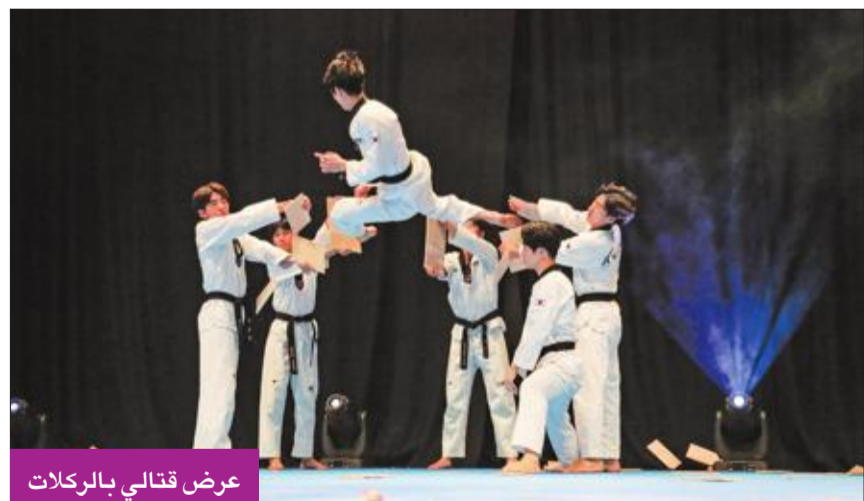
عرض قتالي بالكرات