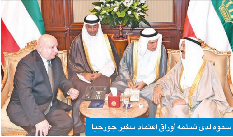
سموه لدى تسلمه أوراق اعتماد سفير جورجيا

احتفل في قصر بيان، صباح أمس، بتسلم صاحب السمو أمير البلاد الشيخ