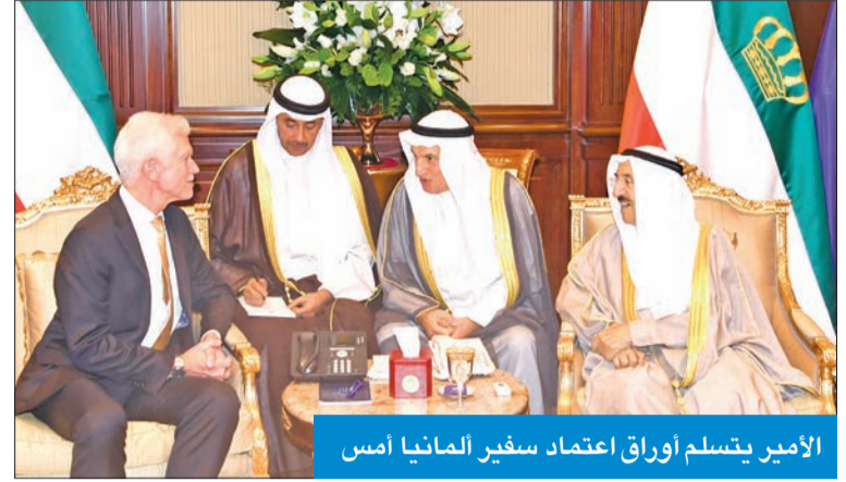
الأمير يتسلم أوراق اعتماد سفير ألمانيا أمس

هنا المغرب وموناكو بالعيد الوطني ورئيس سريلانكا بانتخابه