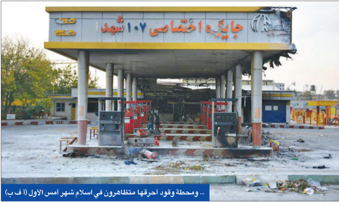
... ومحطة وقود أحرقها متظاهرون في اسلام شهر امس الاول (ا ف ب)

بعد أن أعلن وزير الخارجية الأميركي مايك بومبيو، حمايته العلنية والمخبرة للاشمئزاز لاعمال الشغب وحرق ممتلكات الناس، الذي يعتبره دفاعاً عن الشعب الإيراني، مما يفضح سلوكه المخادع والمناقض تجاه الشعب الإيراني.