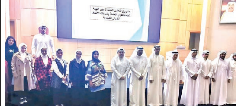
جانب من اليوم الوظيفي لشركات الصيرفة

أدواتها كافة، مشيراً إلى أن أبرز هذه الأدوات التوظيف المباشر، من خلال قدوم الباحث عن عمل إلى مقر الهيئة حاملاً معه سيرته الذاتية وعمل مقابلة شخصية مباشرة مع الجهة الراغبة في التوظيف، مضيفاً أنه «يتم إعلان نتائج المقابلات بذات يوم التقديم، اختصاراً للوقت والجهد المبذولين من الباحثين عن عمل».