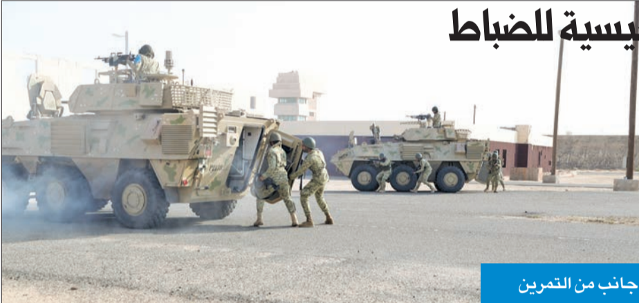
جانب من التمرين

احتفل معهد تدريب قوات الحرس الوطني بتخريج دورة المشاة التأسيسية للضباط، والتي عكست ما شهدته المنظومة التعليمية والتدريبية للحرس من تطور وتحديث. وأقيم الحفل برعاية وكيل الحرس الوطني الفريق الركن هاشم الرفاعي، وحضور معاوني للعمليات والتدريب اللواء الركن فالح شجاع، الذي حرص على نقل تهنئة سمو رئيس الحرس الشيخ سالم العلي، ونائب الرئيس الشيخ مشعل الأحمد. وتضمنت دورة المشاة التأسيسية مناهج نظرية وتطبيقات عملية تبلورت في التمرين النهائي للدورة (صقر 6)، الذي اشتمل على