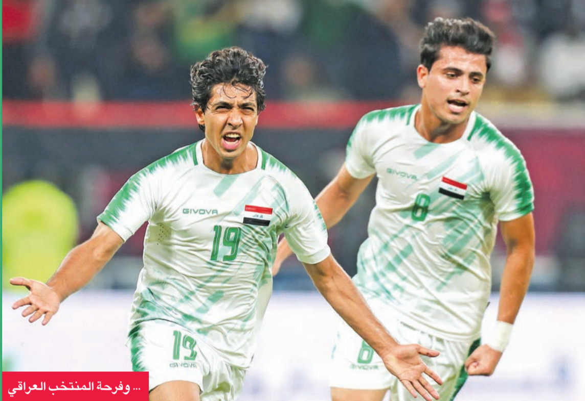
... وفرحة المنتخب العراقي