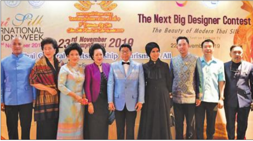
صورة جماعية للمصممين المشاركين