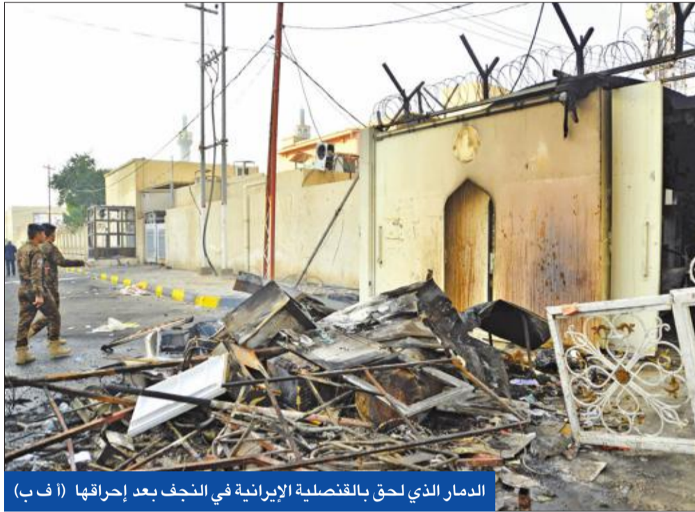
الدمار الذي لحق بالقنصلية الإيرانية في النجف بعد إحقاقها

● أكثر من 30 قتيلاً في محافظة ذي قار ● تشكيل «خلايا أزمة» بالمحافظات الساخنة ● طهران تحتج بعد حرق قنصليتها... وعبداللهيان يتهم 3 دول بـ «هتك حرمة» كربلاء