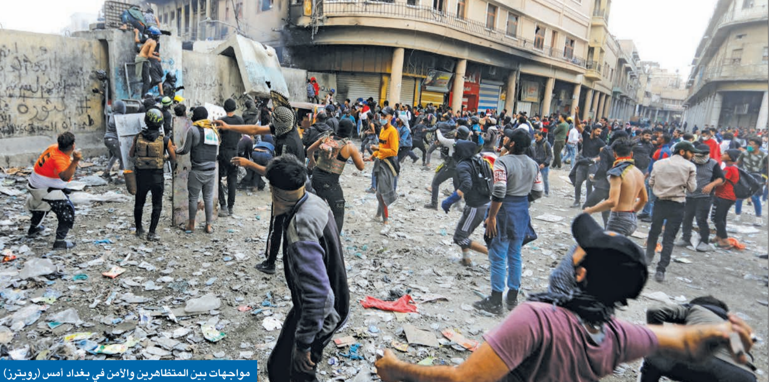
مواجهات بين المتظاهرين والأمن في بغداد أمس

ويعد هوءة نسبي في البصرة منذ ليل الأربعاء - الخميس، شهدت محافظة ذي قار الجنوبية المحاذية لخط تقسيم آمني منذ شهرين، حين اتسعت المواجهات بين المحتجين وقوات الأمن وعناصر