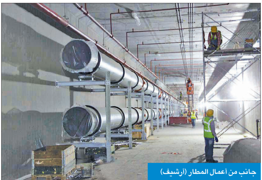
جانب من أعمال المطار (أرشيف)