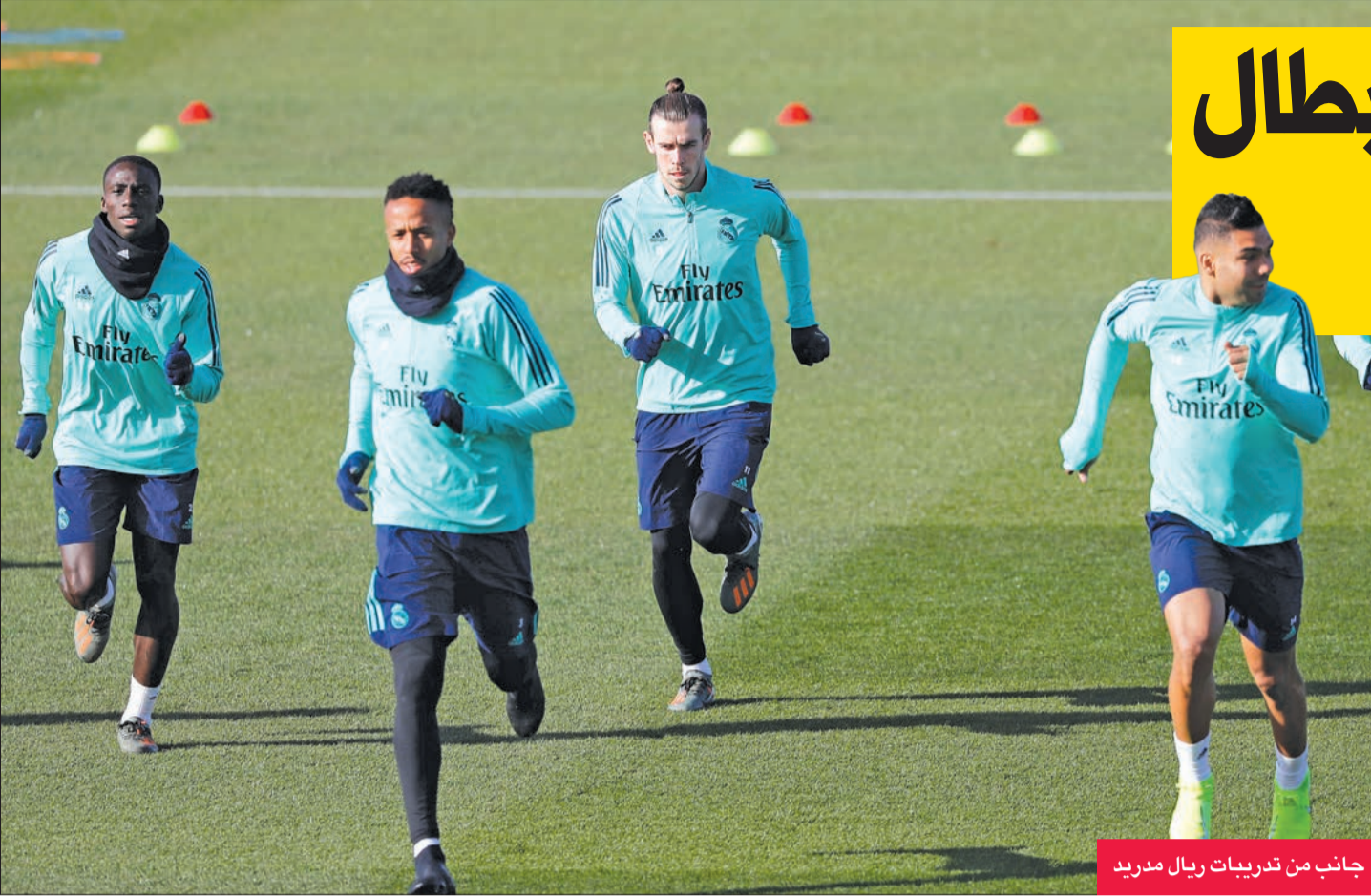
جانب من تدريبات ريال مدريد

طوى ريال مدريد صفحة مباراة باريس سان جرمان التي تعادل فيها مع الفريق الباريسي (2-2) في دوري أبطال أوروبا، وحجز بطاقة التأهل لدور الـ 16، وبدأ الاستعداد لمواجهة الأفيس غدا في الجولة الخامسة عشرة بالدوري الإسباني لكرة القدم.