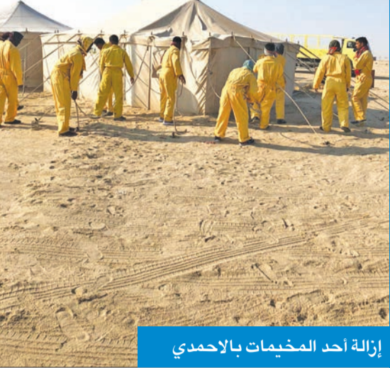
إزالة أحد المخيمات بالأحمدي

كشفت إدارة العلاقات العامة في بلدية الكويت عن تواصل الحملات التفتيشية التي تنفذها الأجهزة الرقابية على المخيمات الربيعية للتأكد من التزام أصحاب المخيمات الربيعية بالتعميم الإداري رقم 2019/32 بشأن تنظيم المخيمات الربيعية الموسمية لترخيص مخيماتها.