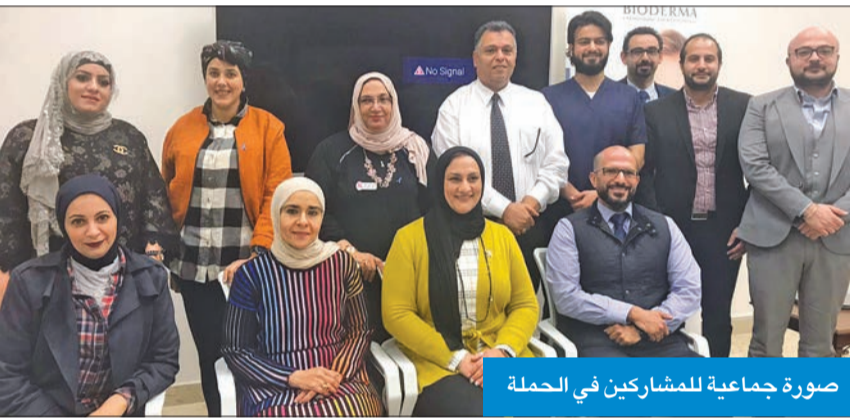
صورة جماعية للمشاركين في الحملة

المهم إدراك أنه ليس كل ارتفاع في هذا المعامل دلالة على الإصابة بسرطان البروستاتا، فهناك أسباب حميدة تسبب ارتفاعه أيضاً، لافتاً إلى أنه «المعرفة سبب هذا الارتفاع وعلاجه، من الضروري عدم اللجوء إلى استشارة الانترنت أو الأصدقاء، حتى لا يصاب الإنسان بالفزع من دون داع، بل عليه الإسراع إلى استشارة أخصائي المسالك البولية».