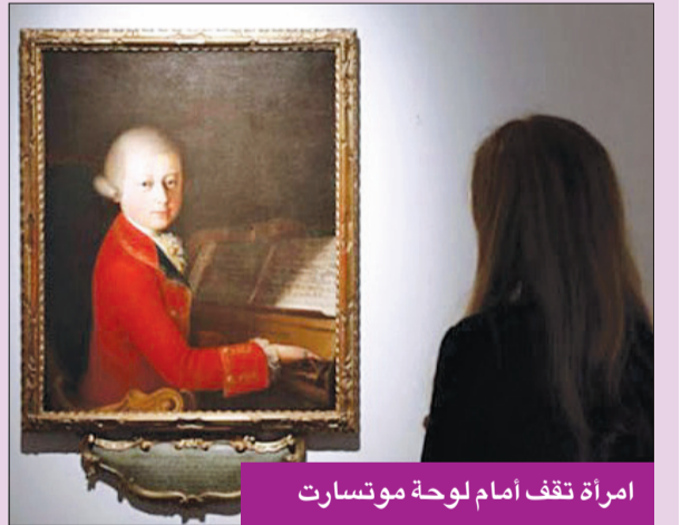
امرأة تقف أمام لوحة موتسارت

بيعت لوحة فنية نادرة لفولفغانغ موتسارت مقابل أربعة ملايين يورو، في مزاد بفرع دار كريستيز في باريس، لتفوق بفارق كبير تقديرات الدار قبل البيع، والتي تراوحت بين 800 ألف و1.2 مليون يورو. وُرسمت اللوحة الفنية عام 1770، وهي واحدة من أربع لوحات فنية للموسيقار النمساوي رُسمت أثناء حياته، ولا تزال جزءاً من مجموعة خاصة، وهي منسوبة للرسم الإيطالي جيامبيتينو تشينارولي. وتصور اللوحة الزيتية المرسومة على قماش موتسارت في سن الثالثة عشرة بشعر مستعار ومعطف أحمر وهو يعزف على القيثارة، فيما تظهر النوتة الموسيقية بتفاصيلها عند حافة إطار اللوحة فحسب. وقالت أستريد سنختر، رئيسة قسم (رويتز)