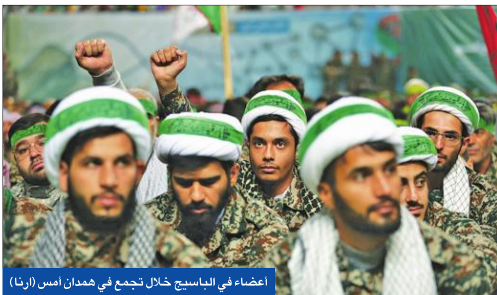
أعضاء في الباسيج خلال تجمع في همدان أمس

متطورة للغاية قادرة على التحليق لمسافات بعيدة جداً، سننضم في الأيام القادمة إلى أسطول بحرية الجيش. وقال خانزادي في كلمة بمناسبة اليوم الوطني للقوة البحرية للجيش الإيراني إن "أسطول بحرية الجيش يمتلك حالياً طائرات مسيرة يبلغ مداها ما بين 200 و1000 كم، مضيفاً: "لكن بانضمام الطائرات المسيرة الحديثة سيتم إزالة كافة القيود الموجودة في مجال مدى التحليق".