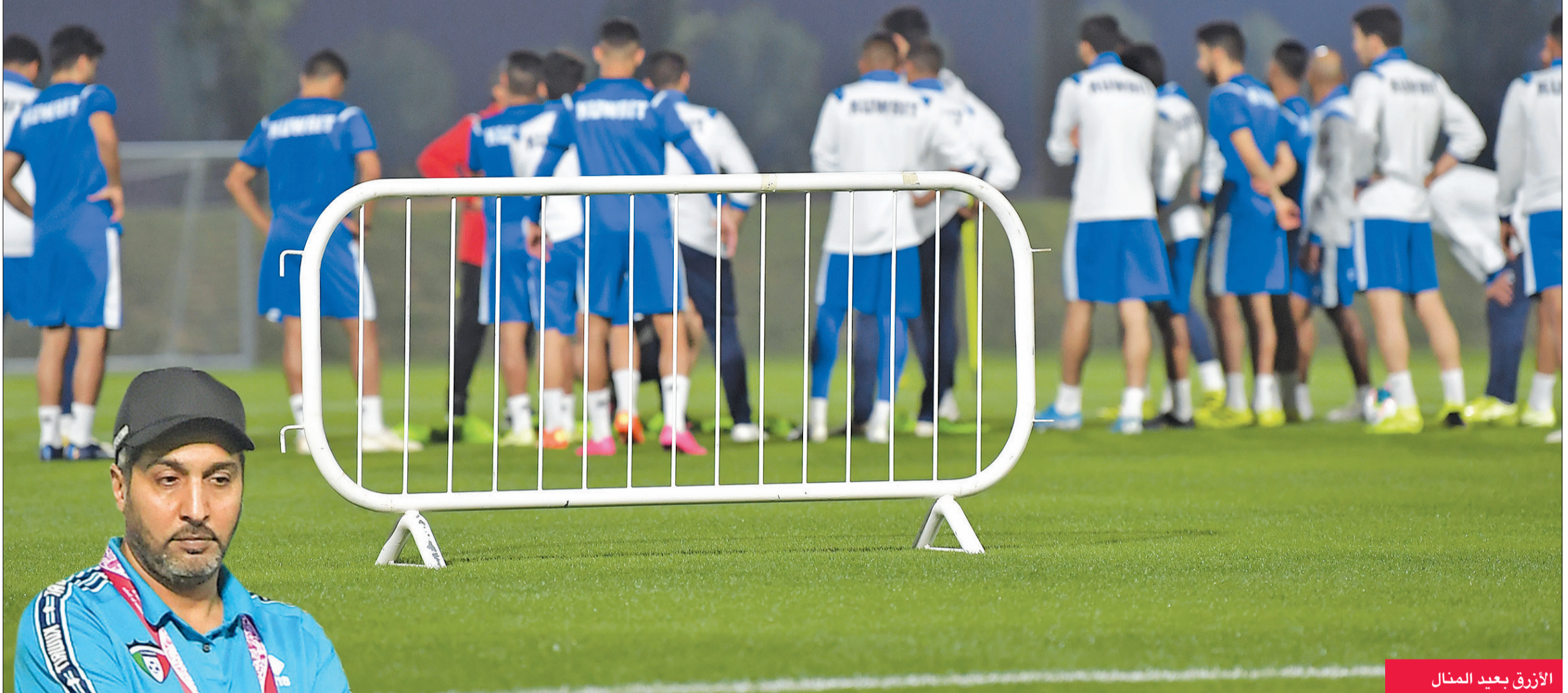
الأزرق بعيد المنال