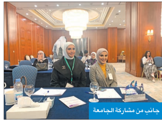
جانب من مشاركة الجامعة

وتنميتها في مختلف المجالات وعلى المستويات كافة، من خلال تخرجهم بمؤهلات تعليمية كبيرة. كما تقدمت بمجموعة من التوصيات التي سيتم تطبيقها في المستقبل القريب، ومنها إنشاء مكتبة إلكترونية كبيرة للطلبة من ذوي الإعاقة ليسهل الرجوع إليها.