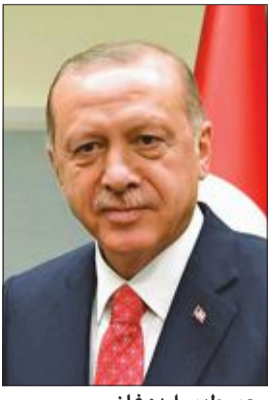
رجب طيب إردوغان

على عكس أسلافه يشرع إردوغان بأنه يتمتع بالسلطة لمتابعة مصالح تركيا من جانب واحد حتى على حساب عزلتها الإقليمية