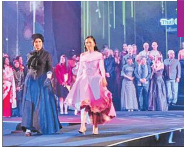
العجيل في عرض الأزياء العالمي تقدم إحدى تصاميمها