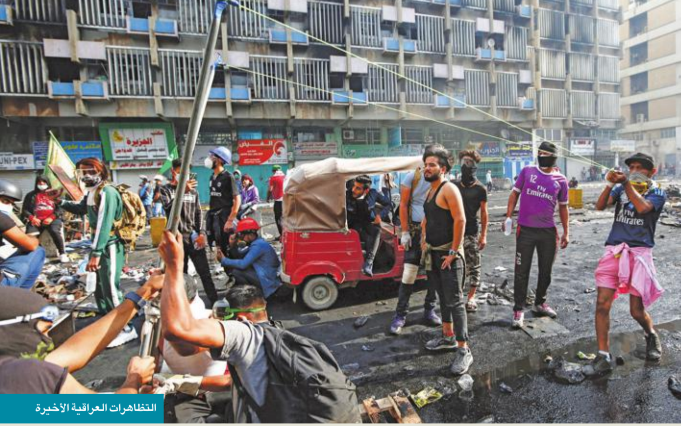
التظاهرات العراقية الأخيرة

وقد أظهر الملايين من العراقيين الذين نزلوا إلى الشوارع في الأسابيع القليلة الماضية وبجلاء