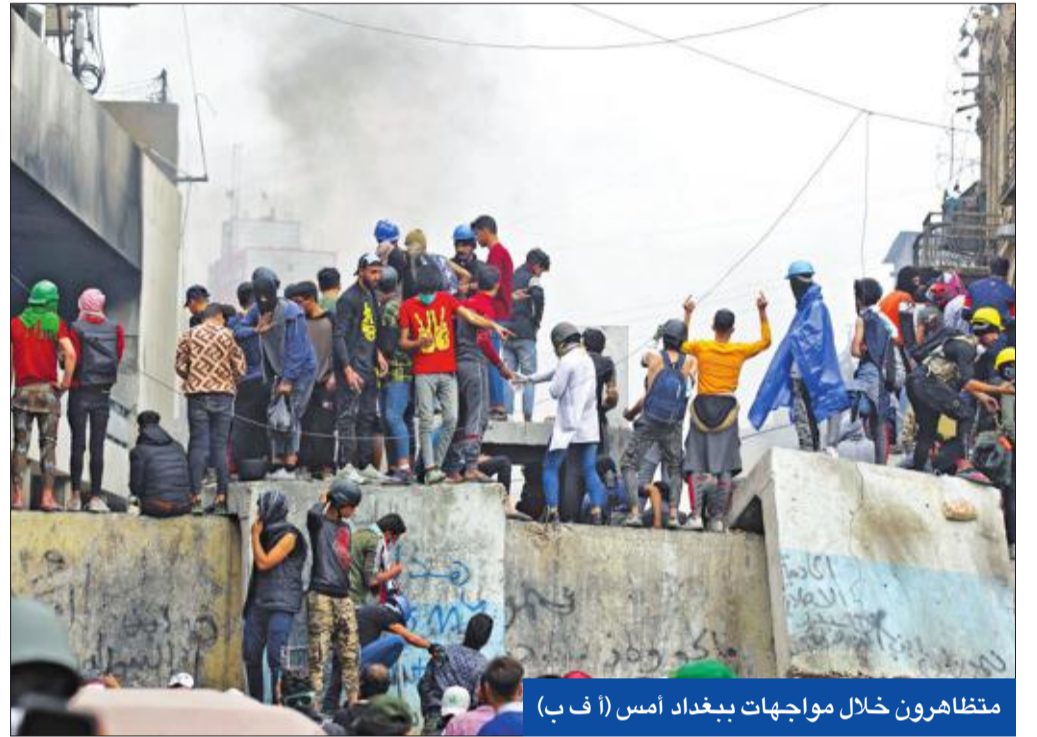
متظاهرون خلال مواجهات ببغداد أمس

لحماية بقدر ما يحتاج لتنفيذ مطالب الشعب"، داعياً إلى عدم التنصل من تنفيذ هذه المطالب.