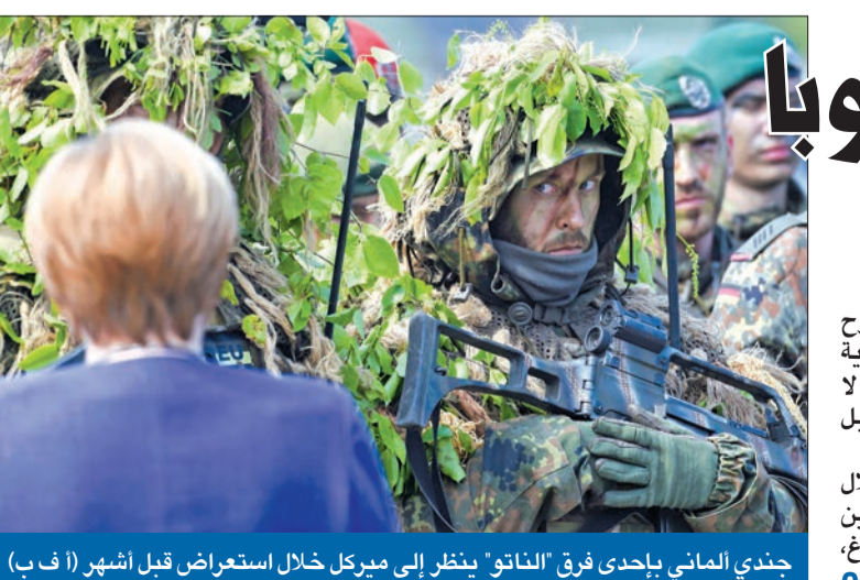
جندي ألماني يبادي فرق 'الناتو' ينظر إلى ميركل خلال استعراض قبل أشهر

تصاعدت وتيرة العنف الذي بدأت احتجاجات العراق تدخله منذ أيام، إلى درجة فقدت فيها النجف، وهي العاصمة الدينية لشيعنة العالم،