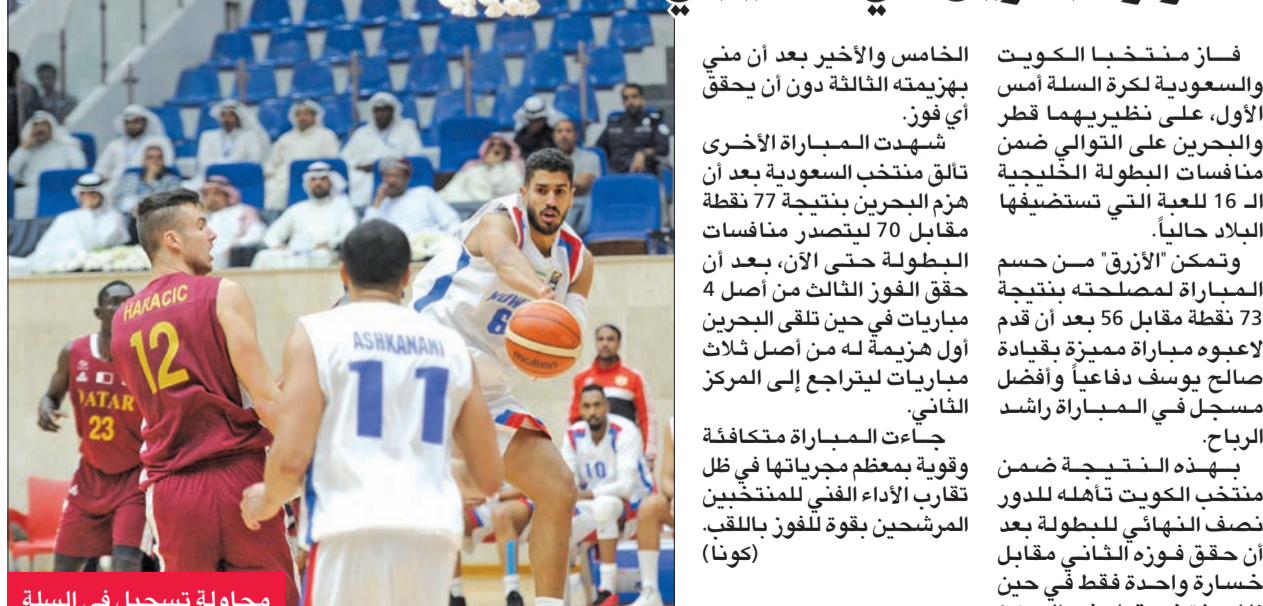
محاولة تسجيل في السلة

فاز منتخب الكويت والسعودية لكرة السلة أمس الأول، على نظيريهما قطر والبحرين على التوالي ضمن منافسات البطولة الخليجية الـ 16 للعبة التي تستضيفها البلاد حالياً.