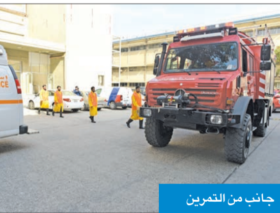
جانب من التمرين

نفذت الإدارة العامة للإطفاء، ممثلة في قطاع مكافحة، صباح أمس، تمريناً عملياً بالتعاون مع شركة مطاحن الدقيق والمخابز الكويتية في المقر الرئيسي لها، وذلك لزيادة الجاهزية وتعزيز التنسيق في حالات الطوارئ.