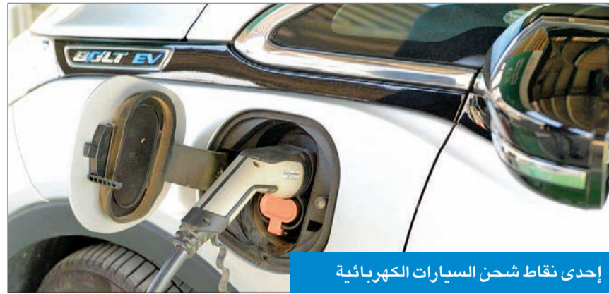
إحدى نقاط شحن السيارات الكهربائية

المشروع يهدف إلى تحديد العناصر والإجراءات اللازمة لتحويل الكويت إلى بيئة جاهزة لتسيير السيارات الكهربائية، مشيرة إلى أن الدراسة الناتجة عن هذا المشروع تشمل على توصيات تتعلق بالضوابط والإجراءات ذات العلاقة، والمواقع المثلى لنقاط محطات الشحن.