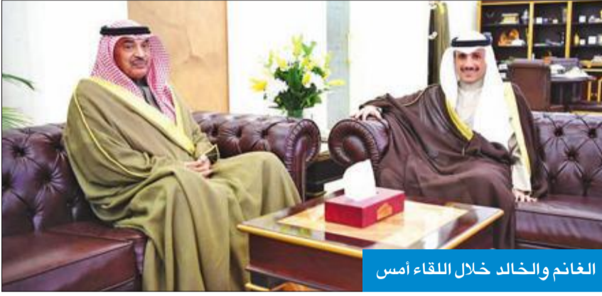
الغانم والخالد خلال اللقاء أمس

شهد لقاء رئيسي السلطتين التشريعية والتنفيذية مرزوق الغانم وسمو الشيخ صباح الخالد، أمس، عرضاً لعلاقات التعاون بين مجلس الأمة والحكومة المرتقبة، استناداً إلى مواد الدستور وتوجيهات سمو أمير البلاد الشيخ صباح الأحمد في هذا السياق. وعد الغانم والخالد، أمس، أول اجتماع ثنائي لهما في المجلس، عقب تعيين الخالد رئيساً للحكومة الجديدة، وركز اللقاء على تأكيد تعاون السلطتين وتفعيل المادة 50 من الدستور. وقال الغانم: "تشرفت بلقاء سمو رئيس الوزراء الشيخ صباح الخالد، وجددت التهنية لسموه بثقة سمو أمير البلاد وتكليفه تشكيل الحكومة الجديدة". وأضاف الغانم، في تصريحه إلى الصحافيين أمس: "تحدثنا خلال اللقاء الممتاز عن أمور عديدة تتعلق بعلاقة السلطتين التشريعية والتنفيذية في المستقبل، وذلك بناء على توجيه من سمو أمير البلاد عندما جمع رؤساء السلطات التشريعية والتنفيذية والقضائية، حيث أكد سمو الأمير على تفعيل المادة 50 من الدستور التي تنص على الفصل بين السلطات مع تعاونها". وأكد أن زيارة رئيس الحكومة بداية جيدة وتأكيد لتعاون السلطتين، لافتاً إلى أن شهادته في سمو الرئيس مجردة، حيث تربطني به علاقة قديمة داخل وخارج البرلمان". وأوضح أنه أبلغ رئيس