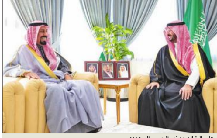
علي الخالد وزير الحرس السعودي

أكد سفير الكويت لدى السعودية الشيخ علي الخالد وزير الحرس الوطني السعودي الأمير عبدالله بن بندر عمق العلاقات الكويتية - السعودية والتعاون المثمر بين البلدين. وتطرق الخالد وبين بندر خلال اللقاء بينهما إلى أهمية التواصل المستمر بين مسؤولي البلدين في تعزيز العمل المشترك