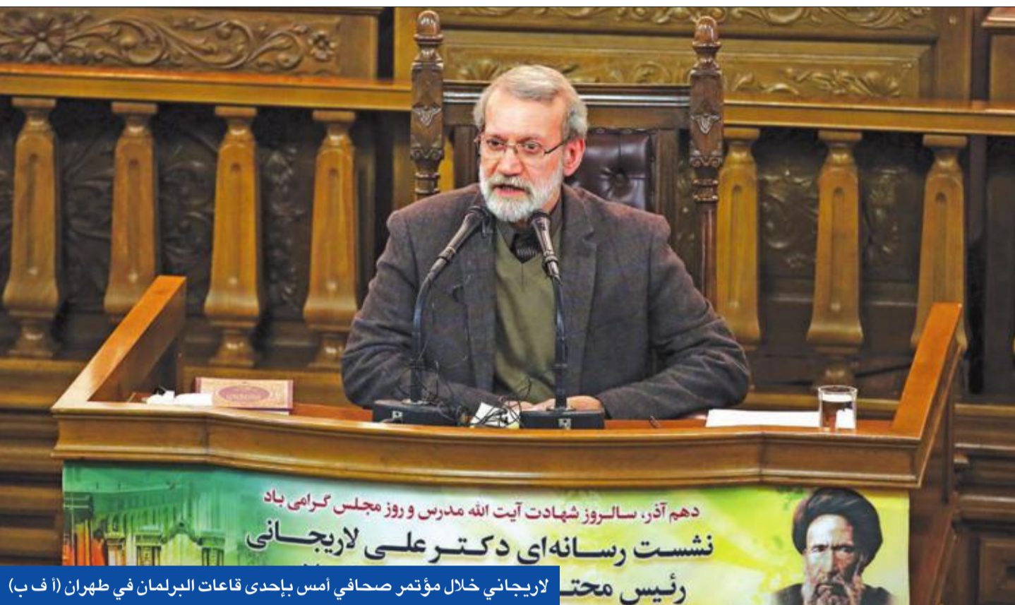
دعم آذر، سالروز شهادت آيت الله مدرس وروز مجلس كرامى باد نشست رسانه‌اي دكتر علي لاريجاني رئيس محتب لاريجاني خلال مؤتمر صحافي أمس بإحدى قاعات البرلمان في طهران

وقال كدخدائي «لا نعتبر أنفسنا بمنى عن الانتقادات، علينا القبول بأنه تم ارتكاب أخطاء في الماضي». وأضاف: «لكننا نحاول في الانتخابات