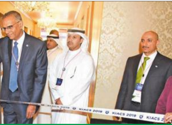
هاشم ونمر الصباح يفتتحان المعرض المصاحب للمؤتمر

من جانبه، أكد وكيل وزارة النفط الشيخ نمر الصباح أن الكويت حققت في السنوات الماضية تقدماً ملحوظاً في مجال الأمن السيبراني، موضحاً أن التحديات التي واجهتها كانت كبيرة جداً متمثلة بالتهديدات الإلكترونية على البنية التحتية والعمليات المتبادلة وعلى أمن المعلومات. وذكر أن المتسللين استهدفوا معلومات قيمة