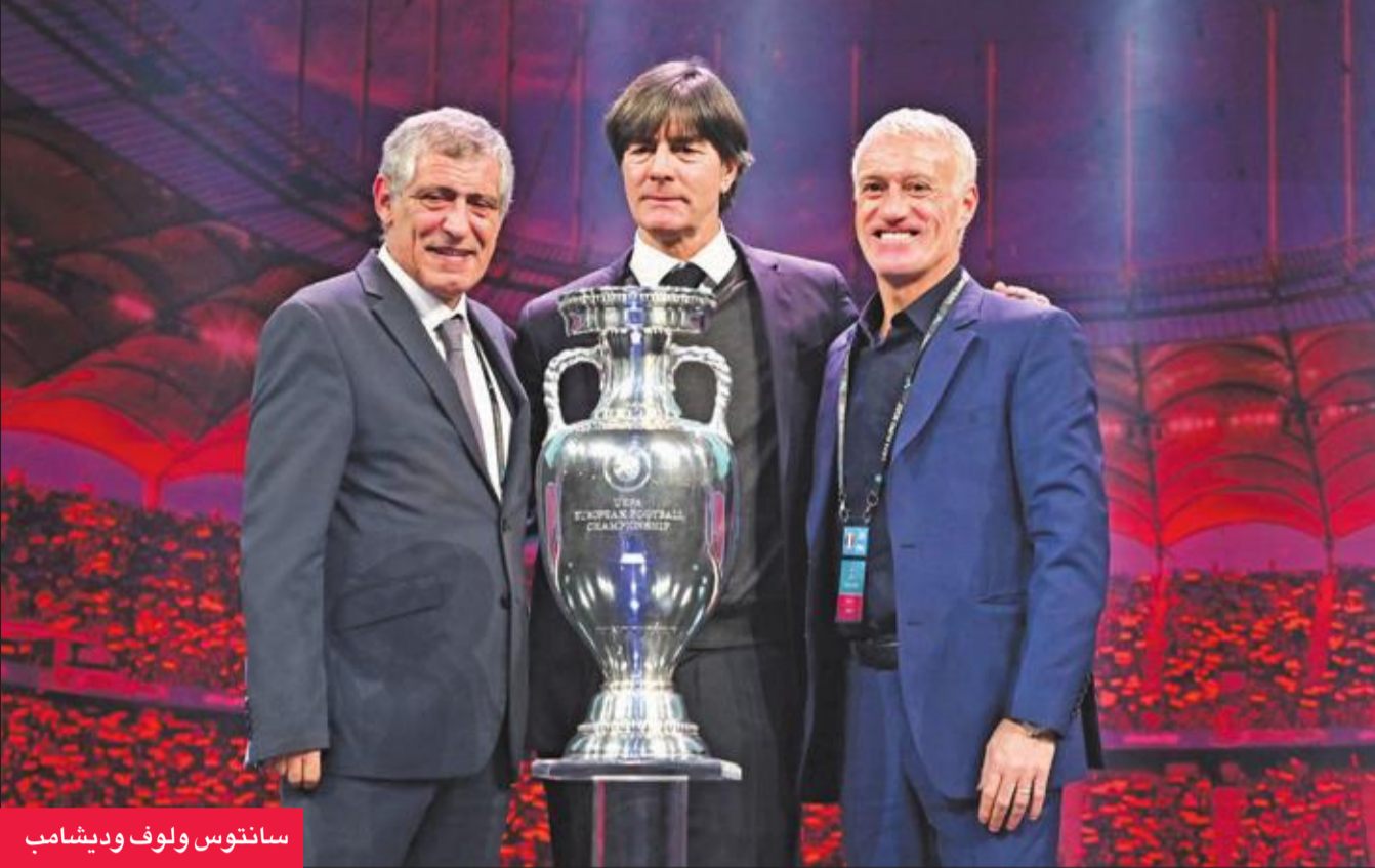
سانتوس ولوف وديشامب

ضمن المجموعة الأولى التي تضم أيضا سويسرا وويلز. وتقام النهائيات بين 12 يونيو و12 يوليو 2016 في 12 مدينة وذلك للمرة الأولى. وستعقد المباريات من العاصمة الإيرلندية دبلن مروراً بمديني بلاو الإسبانية وسان بطرسبرغ الروسية وصولاً إلى باكو عاصمة أذربيجان، على أن يستضيف ملعب ويمبلي في العاصمة الإنكليزية لندن مباريات الدور نصف النهائي، ثم النهائي في 12 يوليو. كما تستضيف ميونخ الألمانية، وروما وبوخارست الرومانية ويوفايسست المجرية وأستردام الهولندية وغلاسكو الإسكتلندية وكوبنهاغن الدنماركية المباريات. وضمن 20 منتخباً التاهل من خلال التصفيات العادية، فيما تبقى أربع بطاقات لاستكمال لائحة المنتخبات الـ24 التي ستشارك في النهائيات.