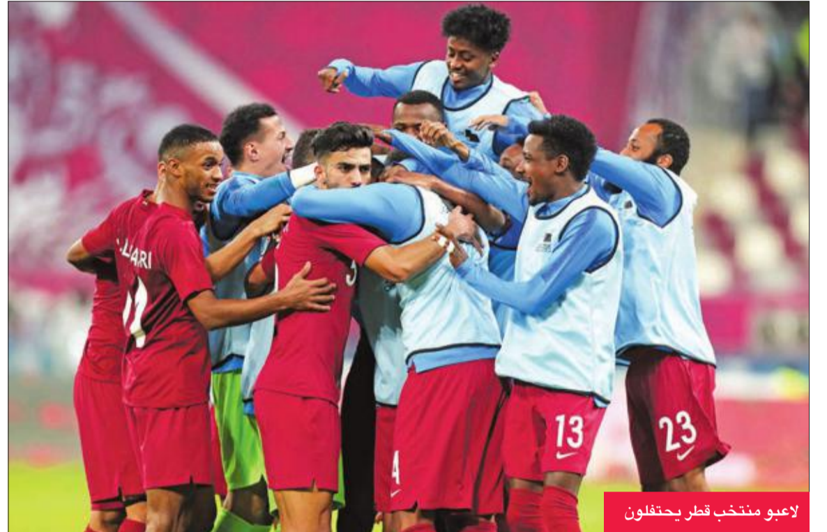
لاعبو منتخب قطر يحتفلون

صدرته للمجموعة برصيد ست نقاط، في حين تحتل قطر المركز الثاني بثلاث نقاط وبفارق الأهداف عن الإمارات. وودع اليمن رسمياً البطولة بعد خسارته في مباراته الأولى أمام الإمارات صفر-3، وقطر صفر-6.