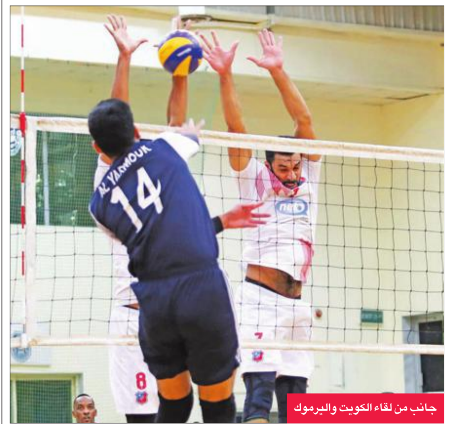
جانب من لقاء الكويت والبرموك