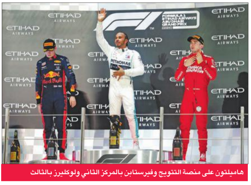
هاميلتون على منصة التتويج وفيرستابن بالمركز الثاني ولوكليزر بالثالث

السائقين إلى 413 نقطة، متقدماً بفارق 87 نقطة عن زميله الفنلندي فالتييري بوتاس الذي حل رابعاً بعدما انطلق من المركز الأخير برغم تسجيله ثاني أسرع توقيت خلال التجارب التأهيلية إثر تعديل محرك سيارته، فيما ضمن فيرستابن المركز الثالث برصيد 278 نقطة. ولدى الصانعين رفع فريق «الأسهم الفضية» رصيده في الصدارة إلى 739 نقطة، أمام فيراري (504) وريد بول (417).