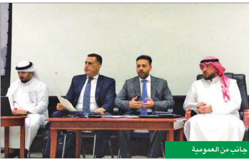
جانب من العمومية

جدول الأعمال والمتعلق بانتخاب مجلس إدارة الشركة للسنوات الثلاث المقبلة إلى جانب ما يستجد من أعمال.