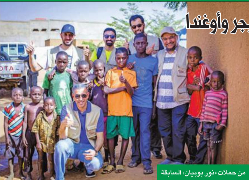
من حملات «نور بويان» السابقة

استمراراً للحملات السابقة التي نجحت بإعادة البصر لـ 8 آلاف شخص في النيجر وأوغندا أعلن بنك بويان إطلاق حملة «نور بويان 4» يوم الجمعة المقبل التي ينظمها البنك بالتعاون مع الهيئة الخيرية الإسلامية العالمية وفريق ادفن دينارين واكسب الدارين التطوعي، وستتولى مجموعة من الأطباء الاستشاريين الكويتيين إجراء عمليات المنح البهضاء «كتاركت» في النيجر. وقال البنك، في بيان صحافي أمس، إن هذه الحملة تأتي استمراراً لنجاح الحملات الثلاث السابقة التي نجحت في إعادة البصر لأكثر من 8 آلاف شخص في النيجر وأوغندا من مختلف الأعمار. ويضم الوفد المشارك في «نور بويان 4» مجموعة من الأطباء الاستشاريين المتطوعين وعدد من موظفي بنك بويان المتطوعين وموظفي الهيئة ومتطوعي فريق الدارين إلى جانب مجموعة من مشاهير وسائل التواصل الاجتماعي. وقال المدير العام للبنك وليد الياقوت، إن أبرز ما يميز هذه الحملة أنها ستكون بمشاركة مجموعة من الأطباء الكويتيين