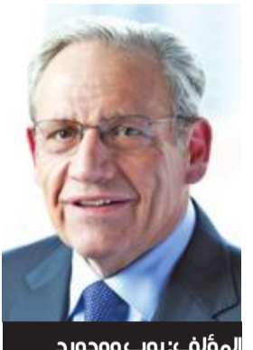
المؤلف: بوب وودورد

قبل 85 يوماً من موعد الانتخابات الرئاسية، توجه بانون في زيارته الأولى إلى مقر الحملة في برج ترامب بمدينة نيويورك، ولما دخل توقع وجود ألف من الأشخاص المتسائلين: ماذا يفعل بانون هنا؟ ولكن لم يكن فيها غير شخص واحد بدا صعباً ينظر بانون، فساله من أنت، وأين الأخرين؟ أنا أندي سورابيان، لسنت ادري، فهذه هي الحال دائماً هنا، مثل كل يوم أحد.