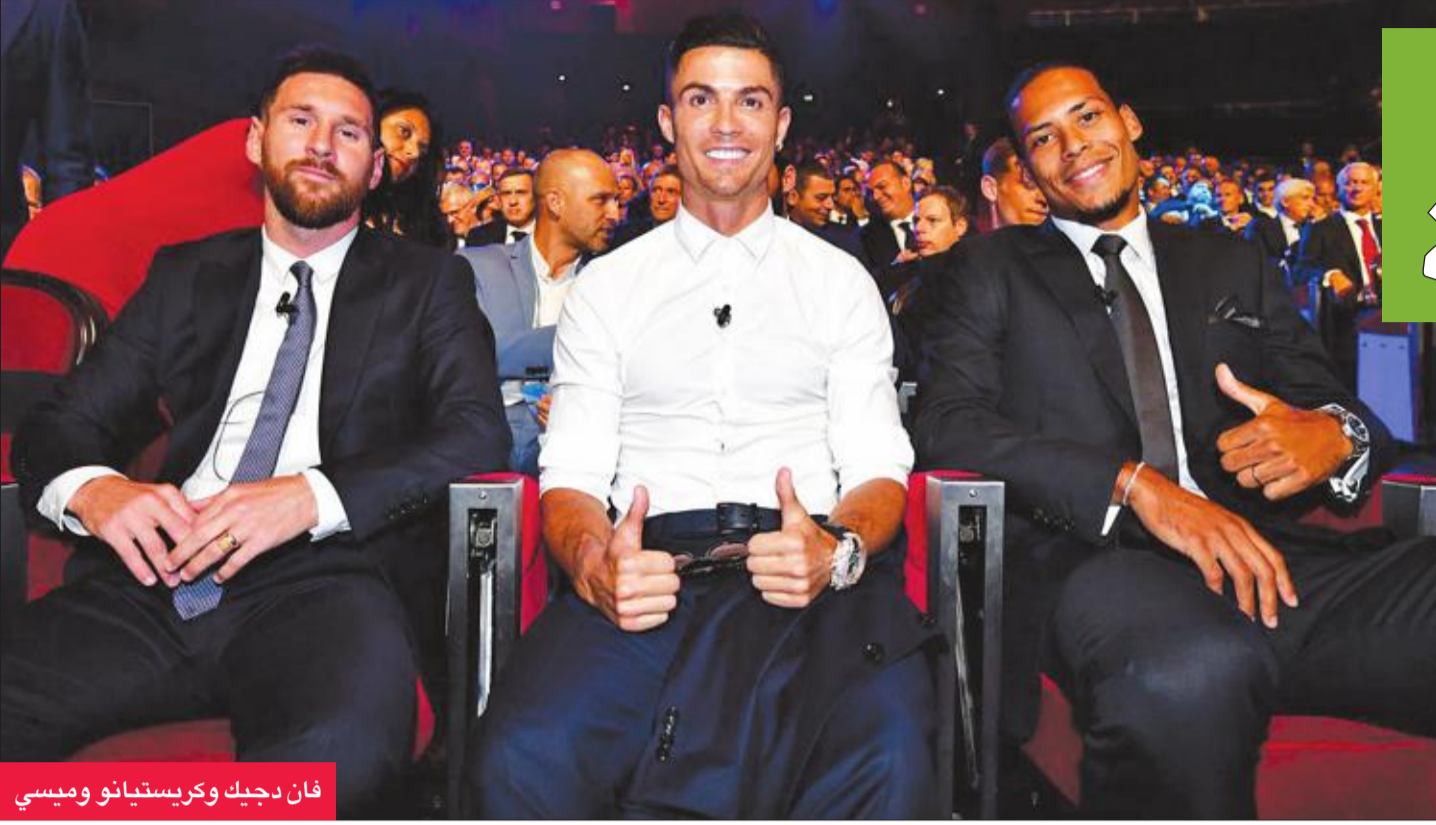
فان دجيك وكريستيانو وميسي

«إذا أردت أن تمنح الكرة الذهبية لأفضل لاعب في جيله، فيجب أن تكون من نصيب ليونيل ميسي على الدوام». لكنه استنكر قائلًا: «إذا أردت أن تمنحها لأفضل لاعب الموسم الماضي، فحينها ستكون لفرجيل فان دايك، لا أعلم بالضبط كيف تتم الأمور، لكني أراها من هذا المنظور».