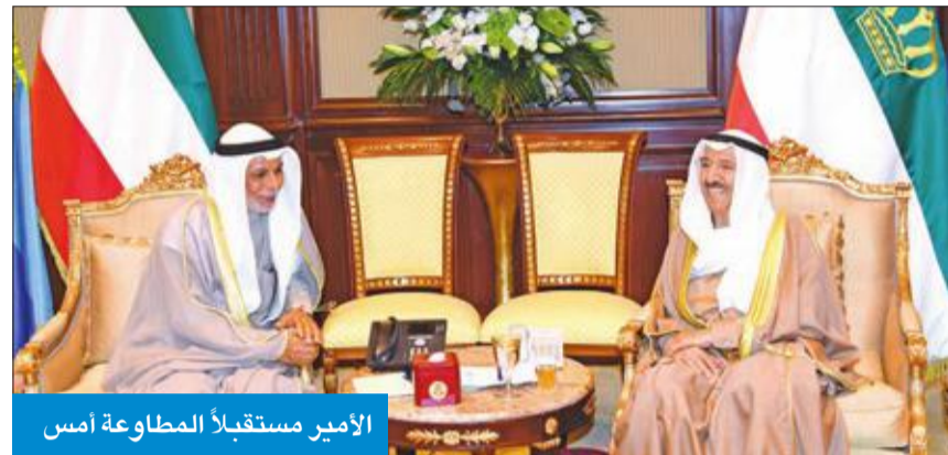
الأمير مستقبلاً المطاوعة أمس

وأشاد سموه بعمق أواصر العلاقات الأخوية والتاريخية الراسخة التي تربط الكويت بالسعودية وتشعبيهما. كما عبر سموه في بريقة التهئة عن بالغ فخره واعتزازه بما تشهده المملكة العربية السعودية الشقيقة في عهد خادم الحرمين الشريفين من استمرار لمسيرة البناء ومن ازدهار وتنمية شملت مجالات عديدة وأصبحت محل فخر واعتزاز الجميع، سائلاً سموه المولى جل وعلا أن يديم على خادم الحرمين الشريفين موفور الصحة وتنام العافية لمواصلة قيادة مسيرة الخير والنماء