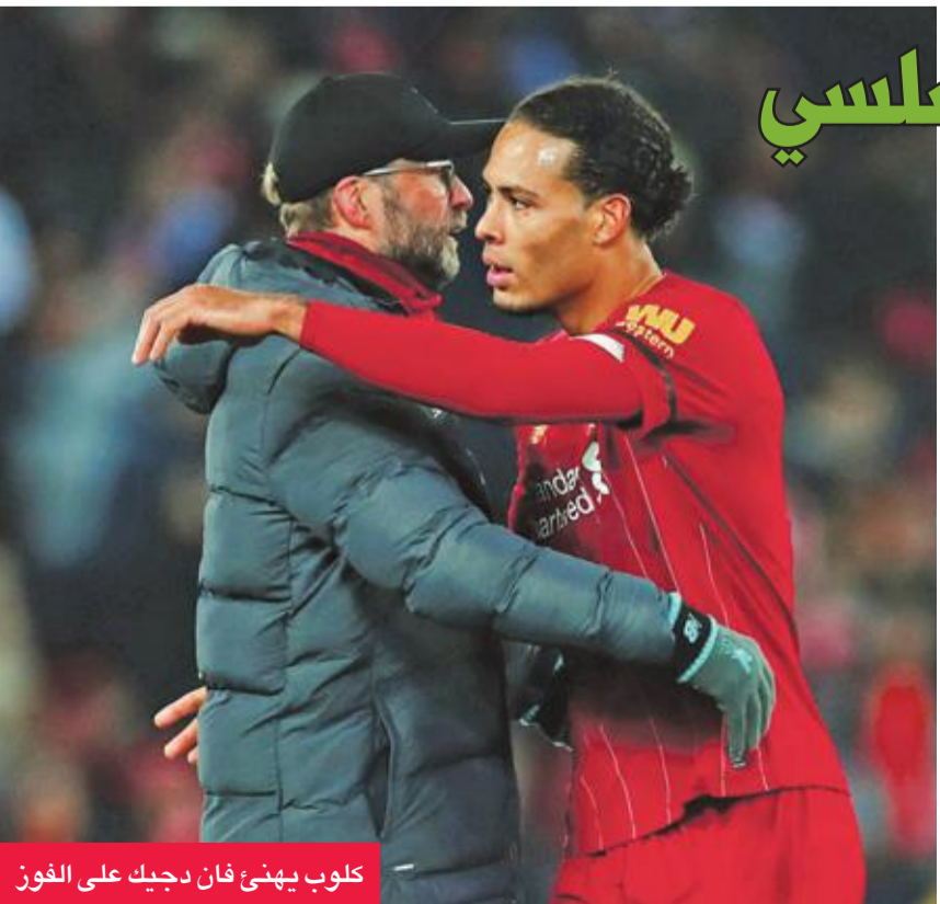
كلوب يهنئ فان دجيك على الفوز

وكانت الفرص التي اتحت ليفربول في ربع الساعة الأولى كافية لحصول كارثة في شباك الضيوف، لكنها لم تهتز إلا بعد 19 دقيقة بعد ركلة حرة انبرى لها ترنت الكسندر-أرنولد وتباجها فان دايك برأسه ساقطة داخل المرمى.