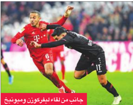
جانب من لقاء ليفركوزن وميونخ

المنطقة في الشباك البافارية، وعائد الحظ لاعبي بايرن، خصوصًا هدفه البولندي روبرت ليفاندوفسكي، صاحب رباعية في ربع ساعة ضد النجم الأحمر الصربي بدوري أبطال أوروبا، وأهدر ليفا الفرص والمرمي تحت رحمته، ليبق على رصيده الرائع، البالغ 27 هدفًا في 20 مباراة هذا الموسم بمختلف المسابقات.