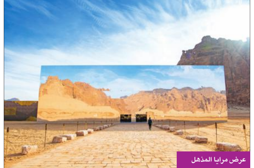
عرض مرايا المذهل

من جهة أخرى، تم تحديد أسعار باقات عطلة نهاية الأسبوع، وتنقسم إلى 3 فئات متفاوتة التكلفة: الذهبية، مستوحى من أبعاد العُلا التاريخية بعنوان «جميل بئينة»، تقدمه فرقة كركلا الاستعراضية على مسرح مرايا في 14 فبراير 2020.