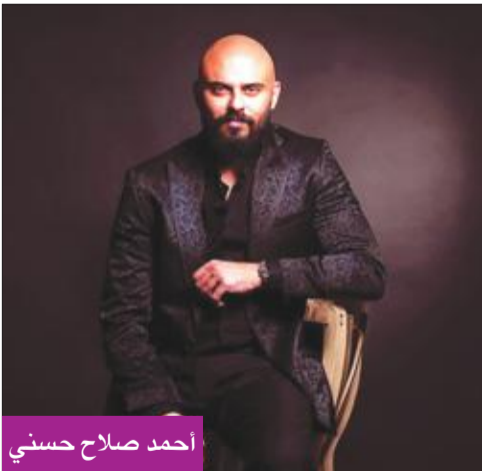
أحمد صلاح حسني

ينطلق اليوم تصوير أول مشاهد مسلسل «ختم النمر» الذي يلعب بطولته النجم أحمد صلاح حسني، من إنتاج «سينرجي»، حيث تجمع المشاهد الأولى بين حسني وعفاف شعيب وإسلام جمال في الديكور الأول للعمل، وذلك بمدينة 6 أكتوبر.