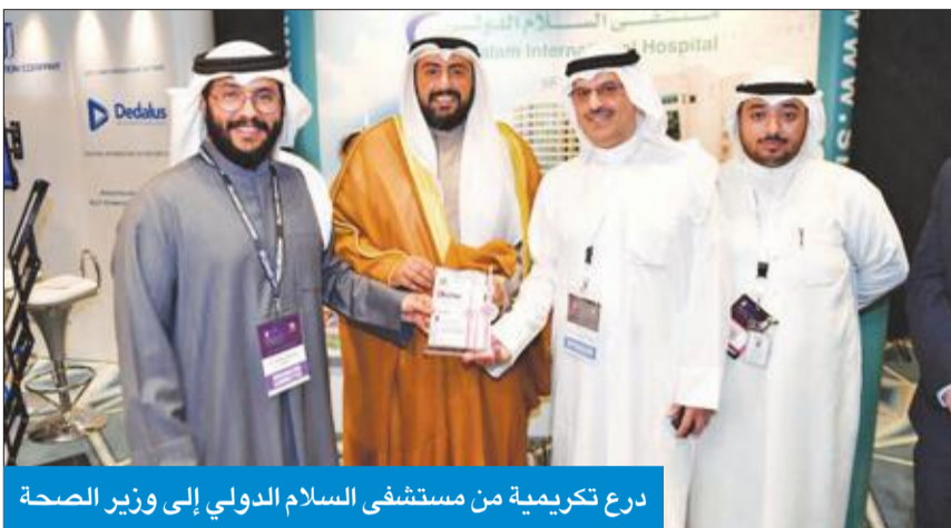
دفع ترقية من مستشفى السلام الدولي إلى وزير الصحة