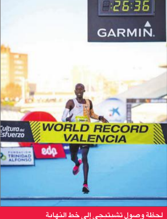
لحظة وصول تشتبيجي إلى خط النهاية

حطم العداء الأوغندي جوشوا تشبتيجي الرقم القياسي العالمي لمسافة 10 آلاف متر في ماراتون فالنسيا، شرقي إسبانيا، مسجلاً 26:38 دقيقة. وقدم العداء الإفريقي سباقاً مذهلاً كلفه بتحطيم الرقم القياسي العالمي السابق، الذي كان يحمله الكيني ليووارد باتريك كومون منذ عام 2010، حين قطع مسافة 10 آلاف متر في 26:44 دقيقة بسباق أوترخت. وتوجه تشبتيجي بالشكر إلى فريقه ومدريه على «العمل الجيد»، وقال: «إنها واحدة من أهم اللحظات في حياتي». وفي ماراتون فالنسيا، فونداثيون ترينداد الفونسو-إي دي بي، الذي يقام بالتوازي مع ماراتون فالنسيا، فاز الإثيوبيان كيندي آتاناو في فئة الرجال، وروزا ديرجي في فئة النساء، في النسخة 39 من هذا الحدث الرياضي.