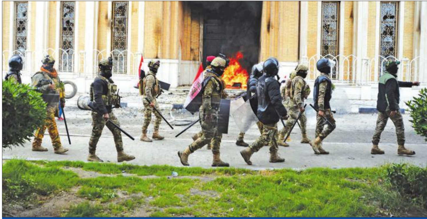
قوات أمن بمحيط مرقد محمد باقر الحكيم بعد إضرام النار بأحد بواباته من قبل مجهولين خلال احتجاجات في النجف أمس

● الصدر يرفض العنف ويتعهد بإبعاد الأحزاب والتيارات عن تشكيل الحكومة الجديدة ● أمر توقيف قائد عسكري في الناصرية... وحكم غير مسبوق بإعدام شرطين قتلًا متظاهرين