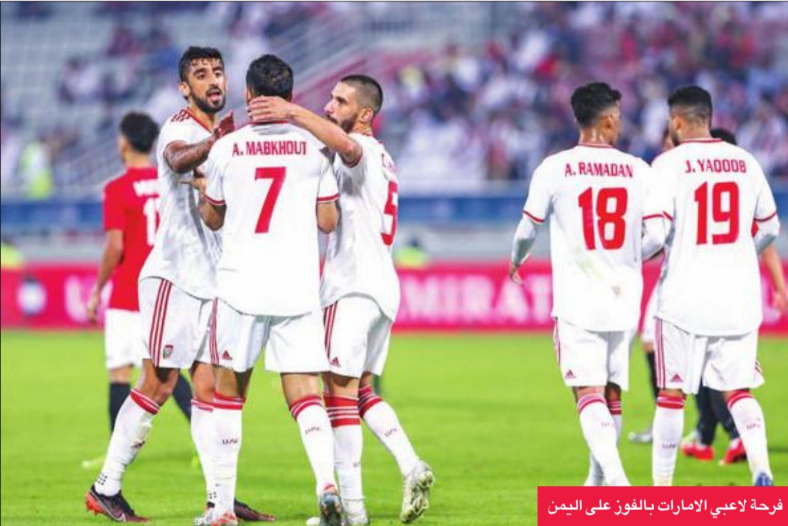
فرحة لاعبي الإمارات بالفوز على اليمن