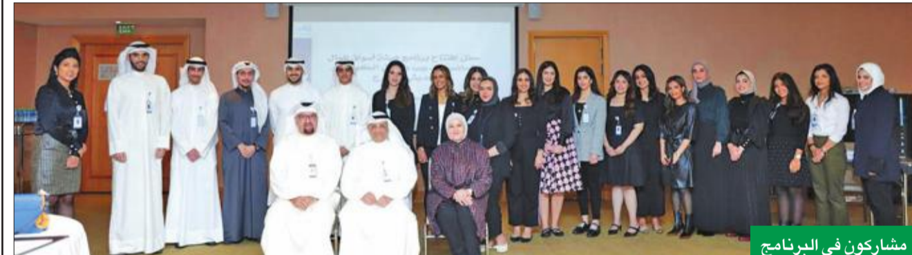
مشاركين في البرنامج

دشنت هيئة أسواق المال أمس برنامجها التدريبي السادس لتدريب وتأهيل الكويتيين الحديثي التخرج من الكوادر الوطنية المتميزة، استكمالاً لدورها في تنمية المجتمع والاستثمار في العنصر البشري الوطني، وتهيئته للانخراط في سوق العمل.