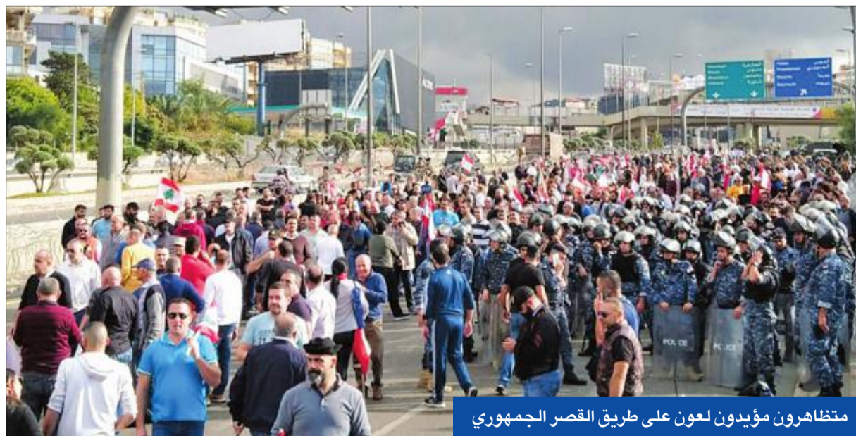
متظاهرون مؤيدون لعون على طريق القصر الجمهورى

● الوقود يعود إلى المحطات اليوم ● الراعي يدعو إلى طاولة حوار