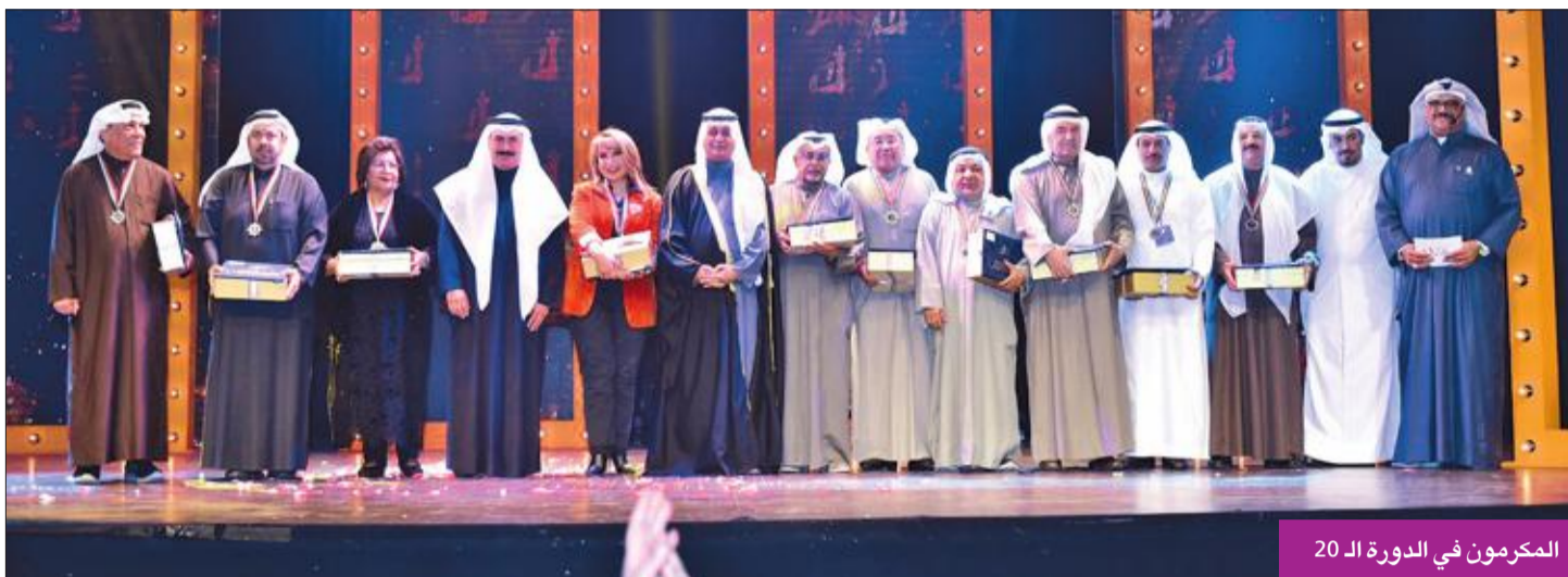
المكرمون في الدورة الـ 20

حضور كبير من نجوم الساحة الفنية المحلية والخليجية والعربية في «الدسة»