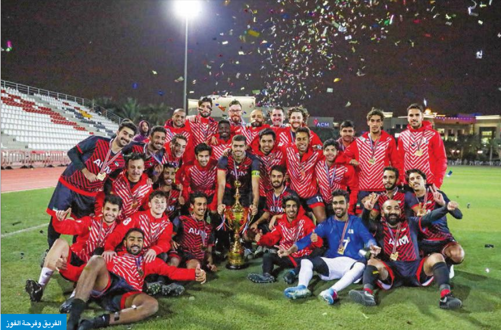
الفريق وفرحة الفوز

أوبرين: جامعتنا تقف في مقدمة الجامعات الخاصة بمجال النشاط الرياضي