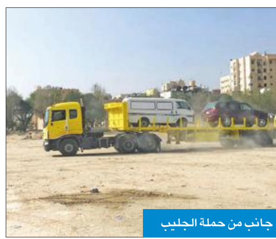
جانب من حملة الجليب

لموقع الإطارات بالسالمي، إلى جانب تحرير مخالفتين كراجات متخلفة بعد ضبطهما بعمليات التصليح ورمي الإطارات المستعملة بالساحة، لافتاً إلى أنه جار الآن تنظيف ساحة أخرى بعد تحرير مخالفات ووضع ملصقات على الشاحنات والمعدات الثقيلة.