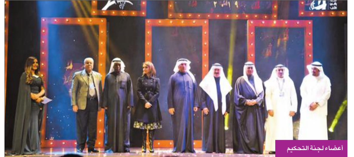
أعضاء لجنة التحكيم