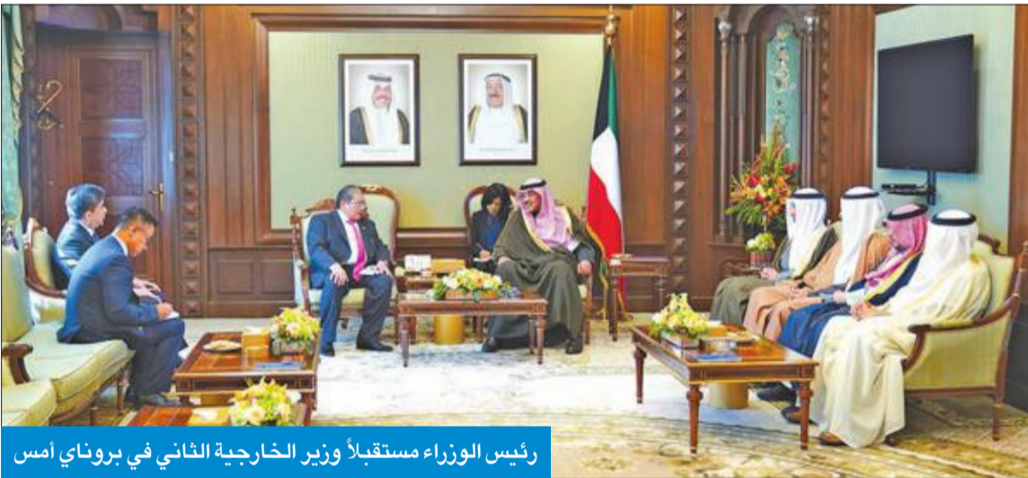
رئيس الوزراء مستقبلاً وزير الخارجية الثاني في بروناي أمس

استقبل رئيس مجلس الوزراء سمو الشيخ صباح الخالد، في قصر بيان أمس، وزير الخارجية الثاني في بروناي دار السلام ايروان بهين يوسف، والوفد المرافق له، وذلك بمناسبة زيارته للبلاد.