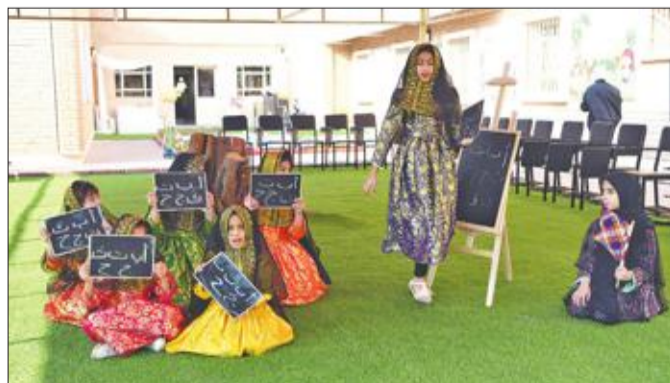
الطالبات خلال مشاركتهن في «الفصل الحر»