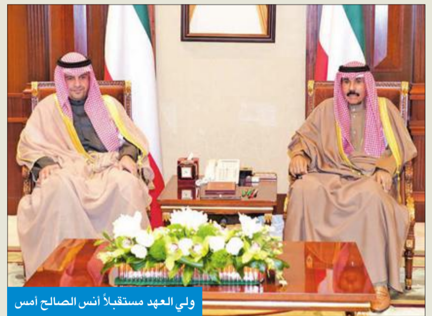
ولي العهد مستقبلاً أنس الصالح أمس

استقبل سمو ولي العهد الشيخ نواف الأحمد، بقصر بيان، صباح أمس، رئيس مجلس الوزراء سمو الشيخ صباح الخالد.