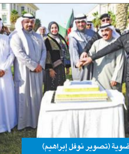
قص كيكة الاحتفال بفوز العضوية

كما ثمنت جهود وزارة الخارجية والتعاون الملحوظ والمسعاه التي أبداها جميع العاملين بالسفارة الكويتية في لندن وعدد من الجهات بالكويت، والدعم المقدم من دول مجلس التعاون الخليجي والدول العربية والصديقة، والذي كان له الأثر البالغ في حصول الكويت على عضوية IMO".