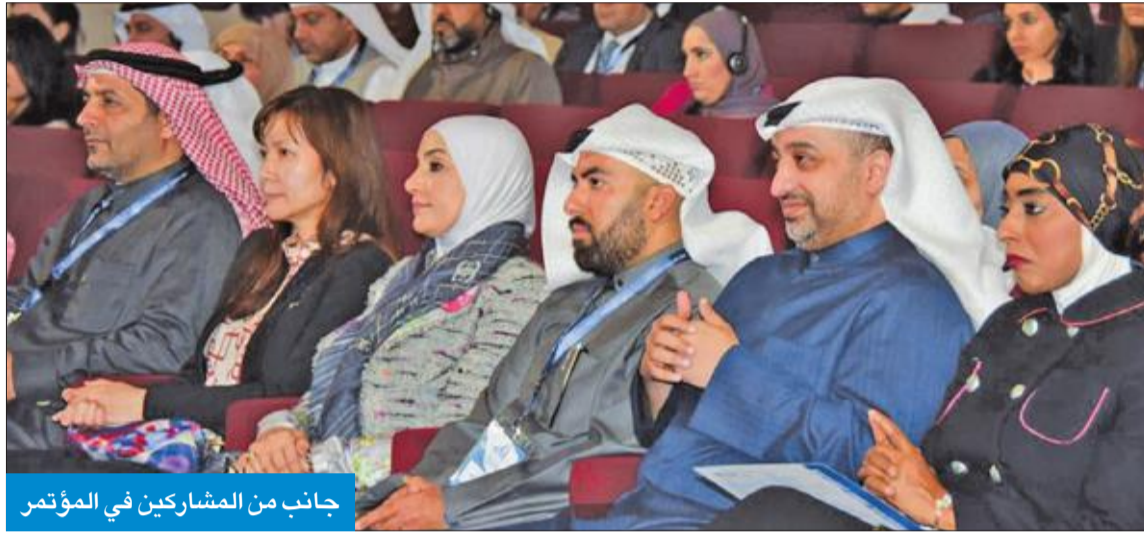
جانب من المشاركين في المؤتمر

التي تهدف إليها الحكومة، وطرح المعوقات والتحديات التي تواجه الدولة من أجل تصافر الجهود، وتحقيق الركائز التنموية والاستدامة التي ننشدها في مجالات البيئة والاقتصاد والرعاية الصحية والبيئة المعيشية وغيرها.