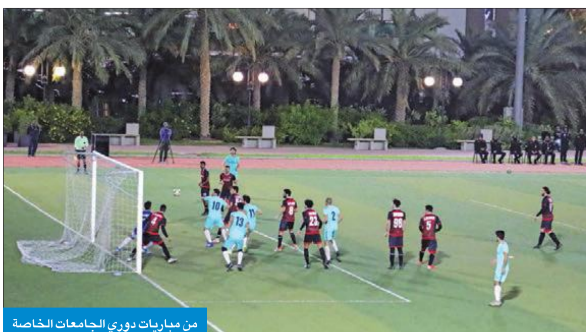
من مباريات دوري الجامعات الخاصة