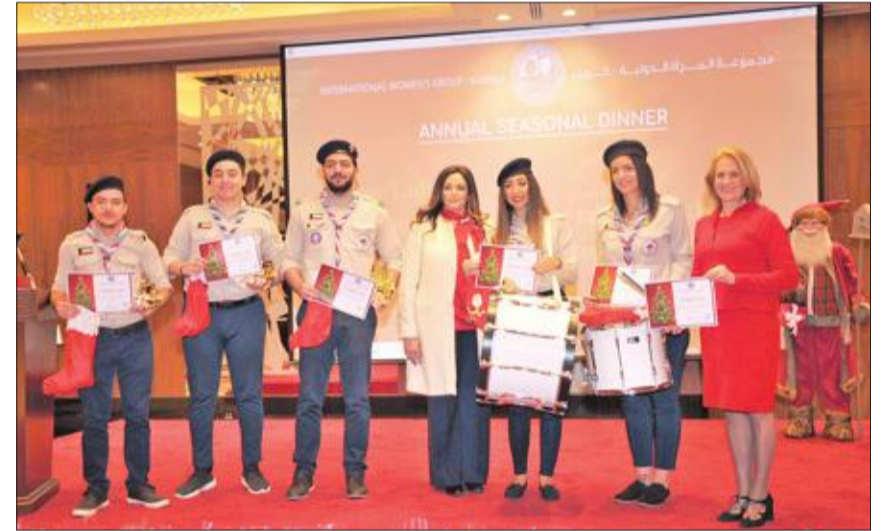
فريق الكشافة يتسلمون شهادات التقدير لمشاركتهم في الحفل