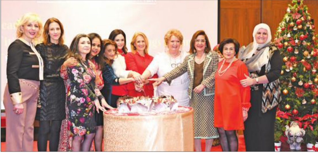
قطع كعكة الحفل