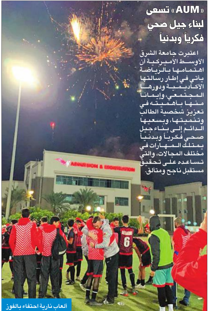
العاب نارية احتفاء بالفوز