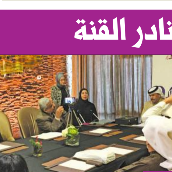
جانب من جلسة التالين

وأصدر الجبل بعنوان «السجل الوثائقي لمهرجان الكويت المسرحي» من الدورة الأولى 1989م وحتى الآن، ويتضمن الافتتاح والختام ولجنة التحكيم والمكرمين والفائزين، ومعلومات أخرى، وصوراً عامة عن كل دورة من المهرجان، وطرح الكتاب لرواد المهرجان خلال حفل الافتتاح، والحصول عليه متاح في مقر إقامة الضيوف والمركز الإعلامي، إذ يعتبر وثيقة مهمة لتاريخ مسيرة المهرجان.