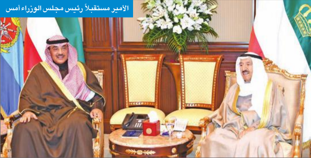
الأمير مستقبلاً رئيس مجلس الوزراء أمس

سموه استقبل ولي العهد والخالد وعزى ترامب وحاكم نيوزيلندا وهنأ رئيس بوركينا فاسو