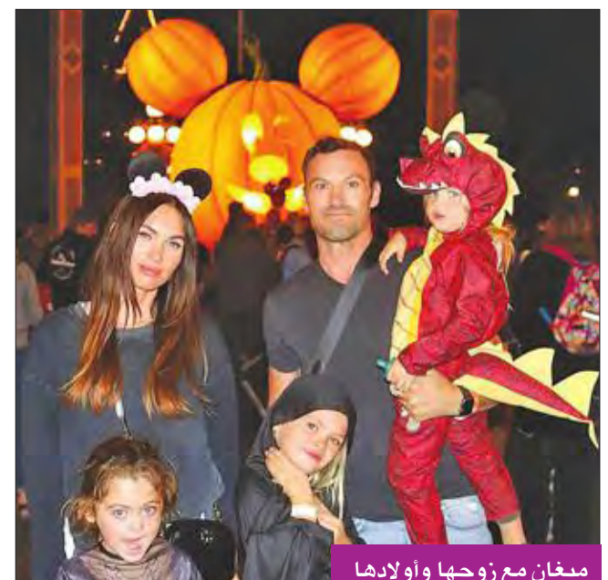
ميغان مع زوجها وأولادها

كشفت الممثلة وعارضة الأزياء الأميركية الحسنة، ميغان فوكس، أنها ترسل أبنائها إلى مدرسة خاصة بالنباتيين. والفيلم الإلكتروني بان فوكس مصممة على السماح لأطفالها الثلاثة بأن يكونوا وفق ما يريدون أن يصبحوا عليه، ولكنها تريد أن تعلمهم أن يكونوا لطفاء مع الحيوانات، وألا «يقطفوا الأزهار من الأرض»، لأنها مقتنعة بأن للأزهار «مشاعر وخواطر وعواطف». وذكرت تقارير إعلامية أن الموقع الإلكتروني المعني بأخبار المشاهير نقل عن فوكس قولها: «نرسلهم إلى مدرسة نباتية عضوية ومستدامة، فيزرعون طعامهم ويحصونه ويأخذونه إلى مطاعم محلية ليبيع، حتى يفهموا كيف يحدث كل ذلك». وأضافت الممثلة الحسنة: «أنا محددة جداً بشأن عدم إيذاء الحيوانات فنحن لا ندوس النمل ولا نفعّل أنشياء من هذا القبيل، ولا نمرق الزهور لأننا نعتقد أنها جميلة، ولعلمهم أن النباتات كائنات