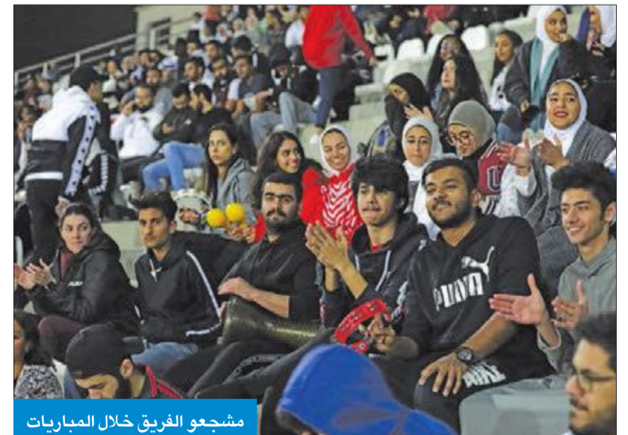
مشجعو الفريق خلال المباريات

استضافت جامعة الشرق الأوسط الأميركية جميع مباريات بطولة كرة القدم التي امتدت على مدار 3 أشهر من أكتوبر إلى ديسمبر في ملعبها الذي يُعدّ الملعب الجامعي الوحيد في الكويت الحائز شهادة أعلى مقاييس الاعتماد والجودة العالمية (FIFA Certificate) من منظمة الاتحاد الدولي لكرة القدم FIFA. وشارك في البطولة 7 فرق من جامعات وكليات، هي: الجامعة الأميركية في الكويت (AUK)، والكلية الاسترالية في الكويت (ACK)، والجامعة العربية المفتوحة (AOU)، وجامعة الخليج للعلوم والتكنولوجيا (GUST)، وكلية الكويت للعلوم والتكنولوجيا (KCST)، وكلية الشرق الأوسط الأميركية (ACM)، وجامعة الشرق الأوسط الأميركية (AUM). وقد فاز فريق AUM بكل المباريات التي خاضها من دون أي خسارة.