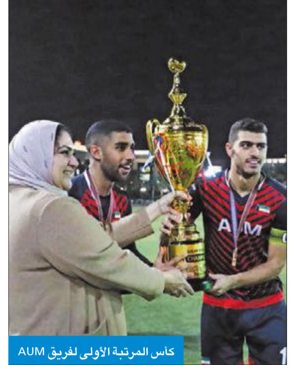
كأس المرتبة الأولى لفريق AUM

تواصل مسيرة الإنجازات التي يحققها طلاب جامعة الشرق الأوسط الأميركية (AUM) على المستوى الرياضي، فقد توج فريق الجامعة لكرة القدم، للمرة الثانية على التوالي ومن دون تسجيل أي خسارة، بطلاً لدوري الجامعات الخاصة في الكويت (UAAK)، بعد مباراة حماسية جمعه بنظيره من الجامعة العربية المفتوحة (AOU)، التي انتهت بنتيجة 2-0، أمس الأول في حرم الجامعة بالعقيلة.