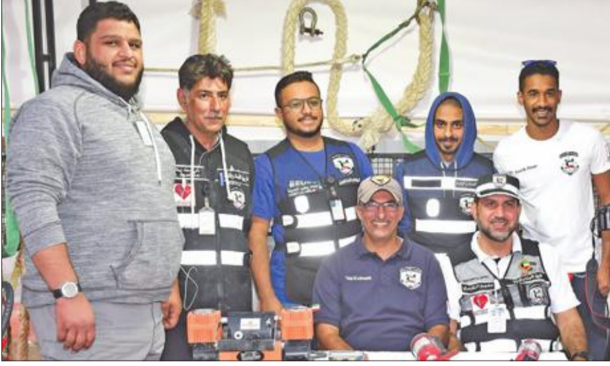
فريق الإسناد والإنقاذ