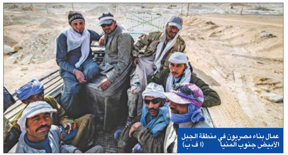
عمال بناء مصريون في منطقة الجبل الأبيض جنوب ليبيا

وقال الرئيس المصري عبدالفتاح السيسي أمس إن «الدولة المصرية كانت تواجه تحديات كثيرة في 2013، بما فيها الإرهاب والحرب الأهلية، مطالباً بـ «رد جماعي حاسم في التعامل مع الإرهاب والدول الداعمة له». وأكد السيسي، في كلمة خلال الجلسة الأولى لمنتدى أسوان للسلام والتنمية المستدامة في مدينة أسوان عاصمة الشباب الإفريقي، بحضور السياسي وعدد من رؤساء الدول والحكومات والمسؤولين الأفارقة، ويستمر المنتدى يومين، ويستهدف فتح آفاق جديدة نحو تحقيق السلام والتنمية المستدامة بالقارة السمرق في إطار رئاسة مصر للاتحاد الإفريقي 2019. في سياق متصل، وقع وزير الخارجية المصري سامح شكري، ورئيس مفوضية الاتحاد الإفريقي، موسى فكي، خلال الجلسة الأولى للمنتدى، اتفاقية استضافة مصر لمركز الاتحاد الإفريقي لإعادة الإعمار والتنمية في مرحلة ما بعد النزاعات. على صعيد آخر، أعلن المركز الإعلامي لمجلس الوزراء، أن الشبكة الوطنية للكهرباء على استعداد تام لاستقبال الطاقة الكهربائية من مجمع «بنبان» في أسوان» مؤكداً أن الأخير هو أكبر تجمع لمحطات الطاقة الشمسية في أفريقيا والشرق الأوسط.