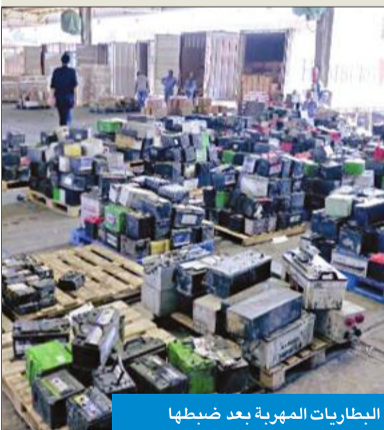
البطاريات المهترئة بعد ضبطها