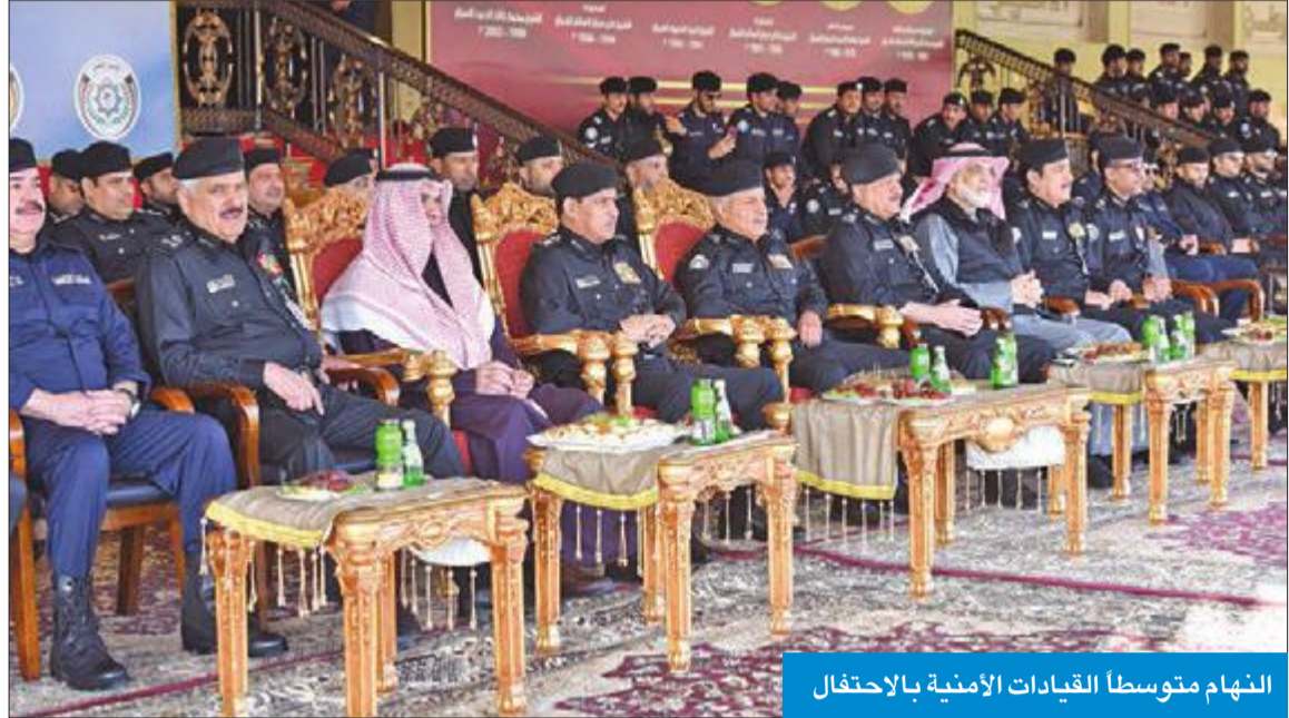
النهام متوسطا القيادات الأمنية بالاحتفال

متيقظون للتحديات وقادرون على مجابهة الصعاب لإعلاء مكانة الكويت