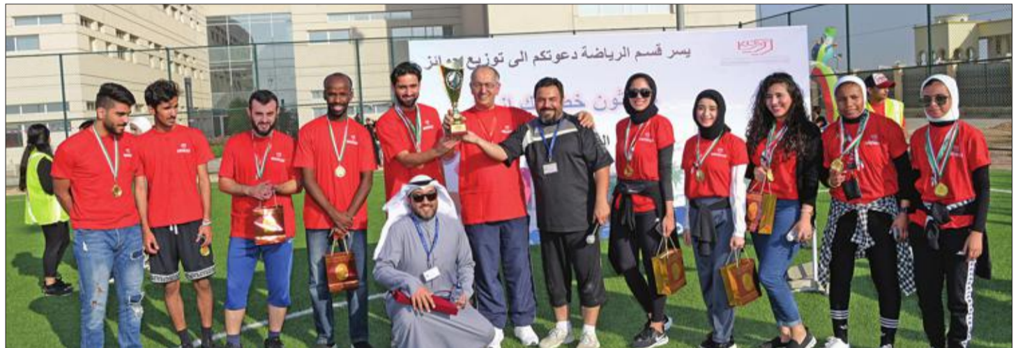
تسليم الكأس للفريق الفائز