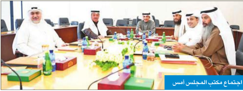
اجتماع مكتب المجلس أمس

عقد مكتب المجلس اجتماعه، أمس، برئاسة رئيس مجلس الأمة مرزوق الغانم وحضور أعضاء المكتب.