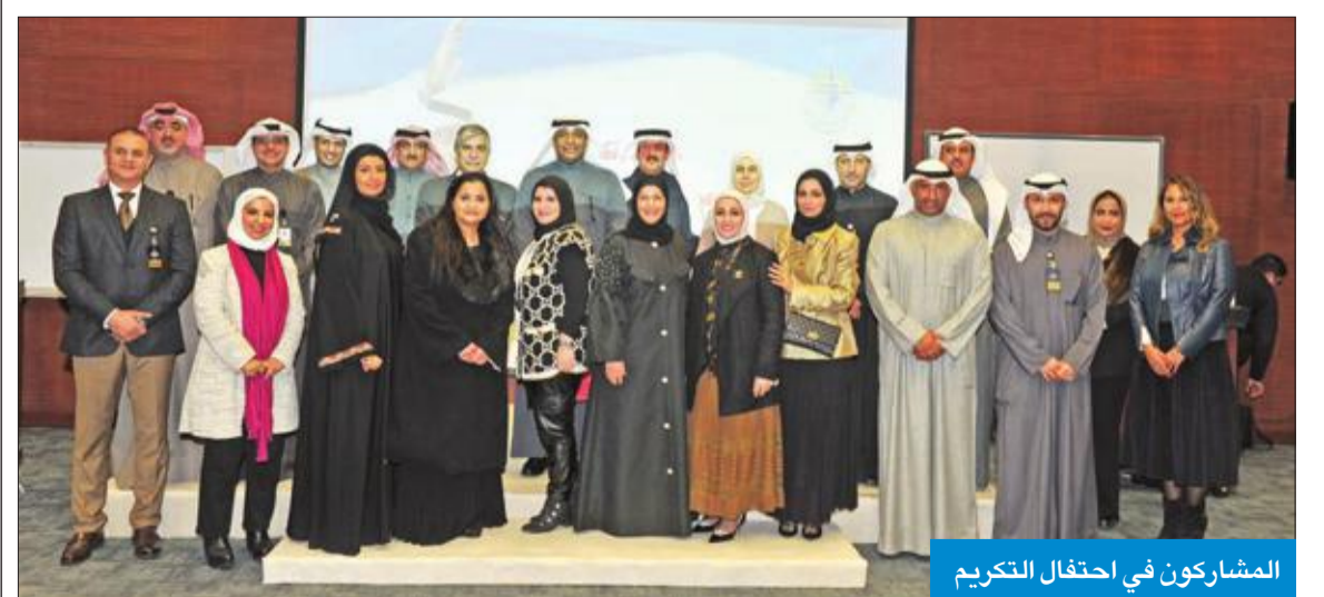
المشاركون في احتفال التكريم

الأمين بحفلات تكريم الخريجين التي تنظمها العمادة سنوياً، والتي بينت الوجه المشرق للهيئة. بدوره، أكد المحترفي به د. المكيمي أن العمادة تمتلك كفاءات مميزة تستحق التشجيع لتقديم المزيد، شاكرراً مدير الهيئة ونوابه الكرام على الدعم الذي قدموه له خلال عمله عمادته لشؤون الطلبة.