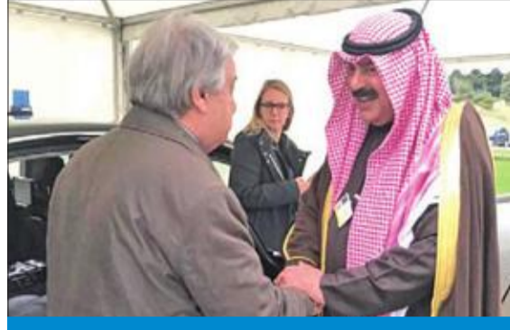
الأمين العام للأمم المتحدة مستقبلاً نائب وزير الخارجية

أكد متابعة الكويت لمخرجات منتدى جنيف ودعا إلى الالتزام بالتعهدات