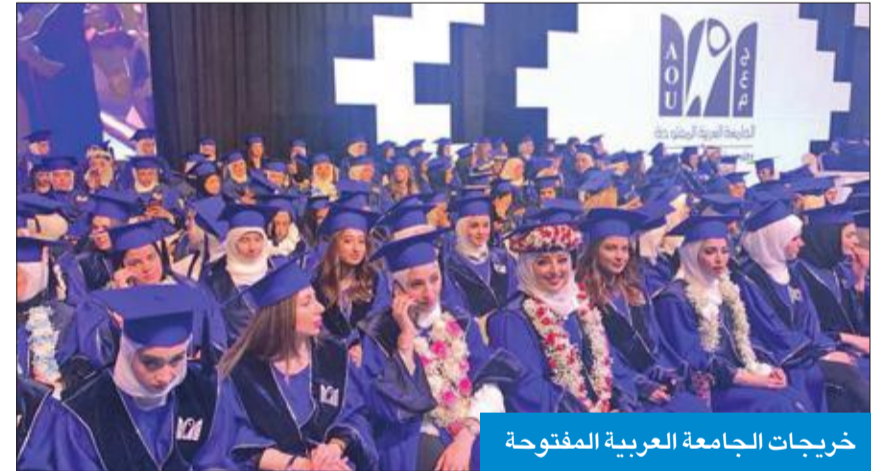
خريجات الجامعة العربية المفتوحة

المعرفة وتسلحتم بالمعارف والمهارات للانخراط في عالم العمل والإنتاج الفعال، لرفد