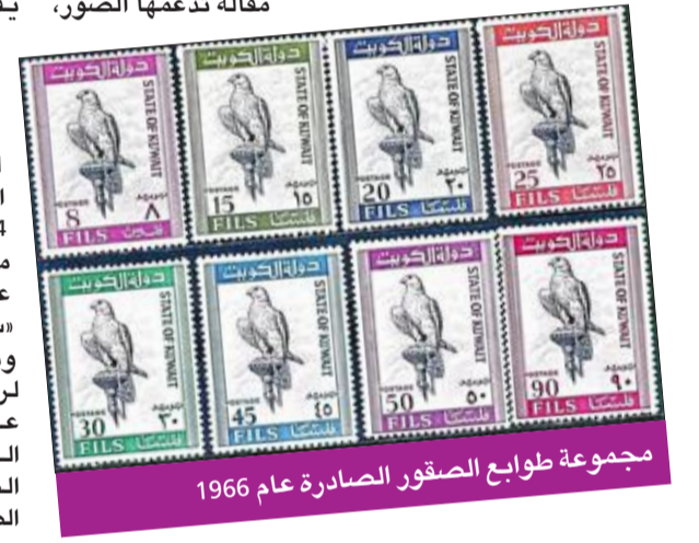
مجموعة طوابع الصقور الصادرة عام 1966