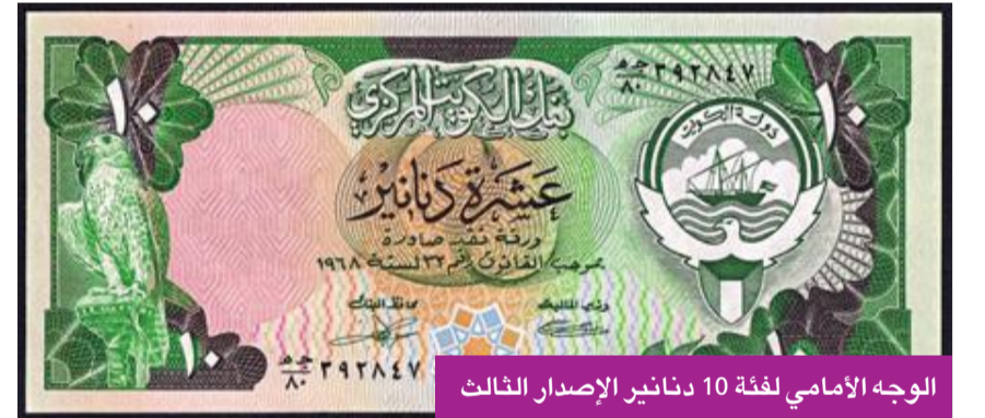
الوجه الأممي لفئة 10 دنانير الإصدار الثالث