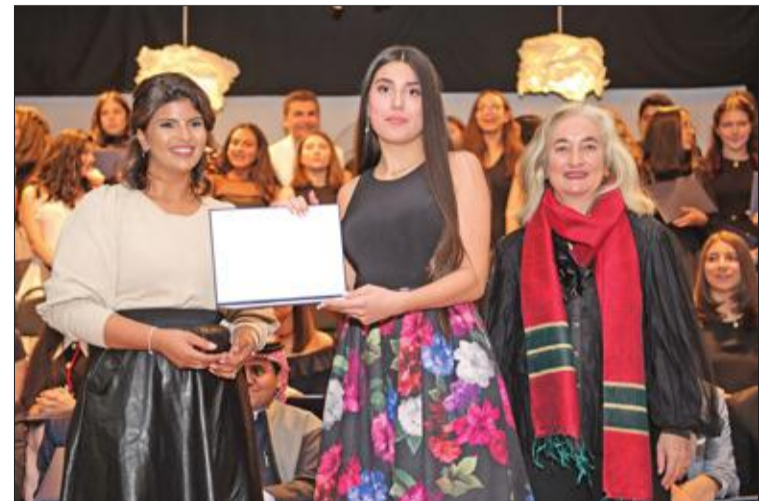
إحدى الطالبات المكرمات تتسلم شهادتها