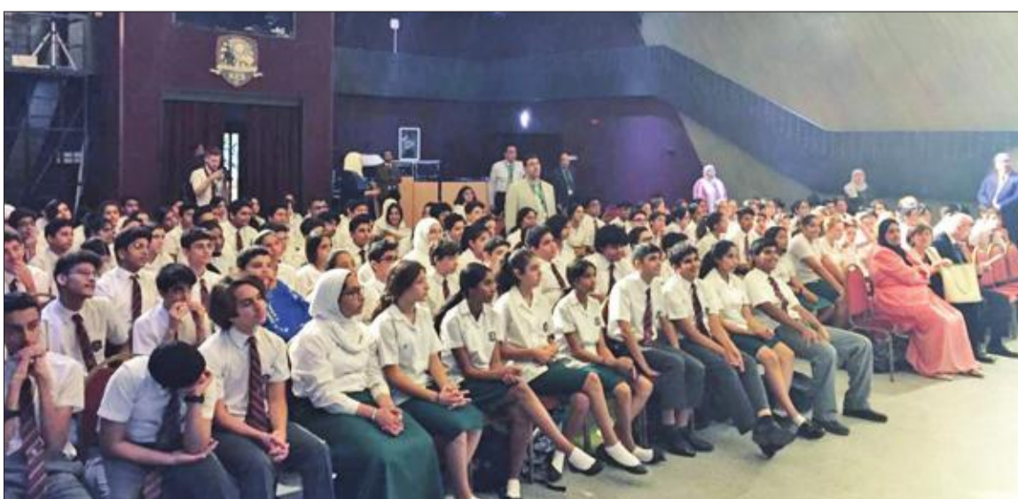
عدد من الطلاب المشاركين