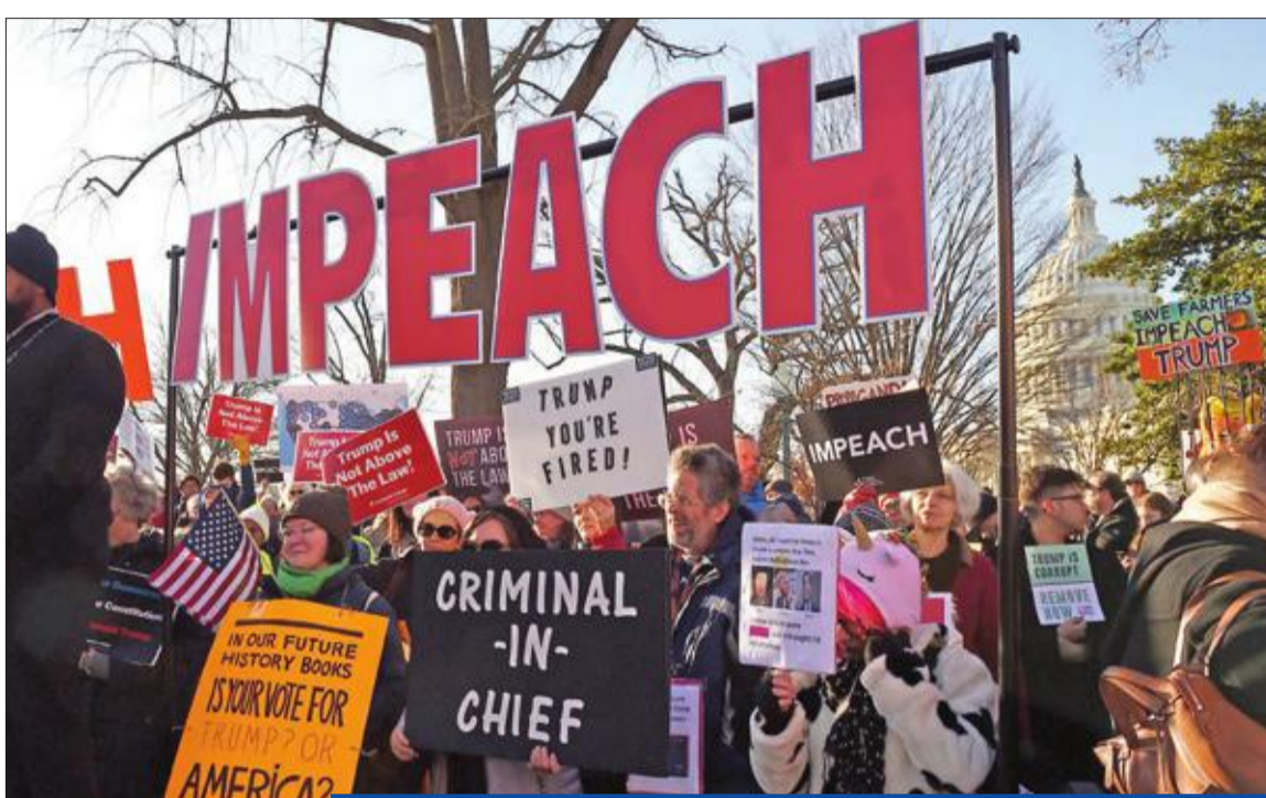
تظاهرة مؤيدة لعزل ترامب قرب البيت الأبيض بواشنطن

ويطالب السيناتور الديمقراطي تشاك شومر، بان يدلي كبير موظفي البيت الأبيض ومستشار الأمن القومي ومسؤولين اثنين آخرين بشهاداتهم. لكن زعيم الجمهوريين في مجلس الشيوخ ميتش ماكونيل، القادر بشكل كبير على تحديد القواعد، رفض ذلك، وأصر على أن المحاكمة سياسية بحتة.