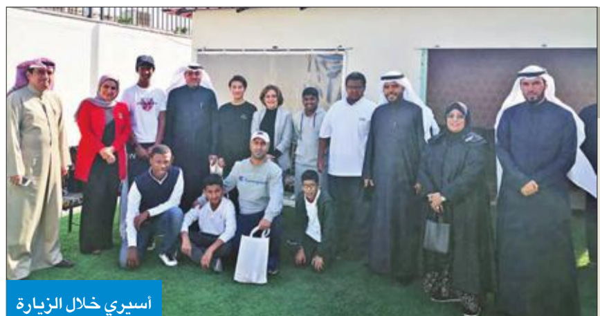
أسيري خلال الزيارة

قامت وزيرة الشؤون الاجتماعية د. غدير أسيري، أمس، بجولة مفاجئة إلى مجمع دور الرعاية الاجتماعية، زارت خلالها دار الأطفال في إدارة الحضنة العائلية وقسم برامج الأنشطة في إدارة رعاية المعاقين، حيث أبدت ارتياحها للخدمات التي تقدمها هاتان الإدارتان، من