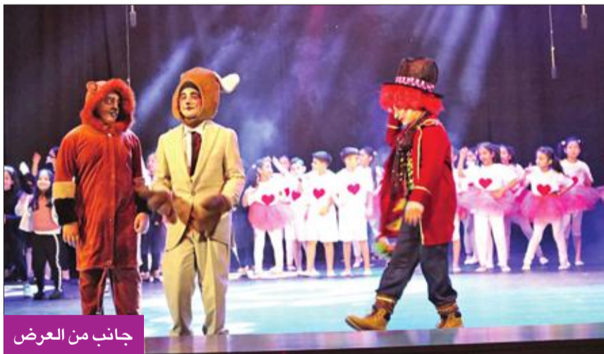
جانب من العرض