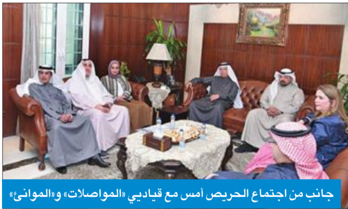
جانب من اجتماع الحريص أمس مع قياديي «المواصلات» و«المواني»

وجه وزير الدولة لشؤون الخدمات وزير الدولة لشؤون مجلس الأمة مبارك الحريص قياديي في متابعة تنفيذ خطط وأهداف الوزارة، وفقاً للفرات الزمنية المعتمدة، لتحقيق رؤية سمو الأمير الشيخ صباح الأحمد لتحويل الكويت إلى مركز مالي وتجاري. وثن الحريص، في تصريح أمس، لدى وصوله إلى مبنى الوزارة، الثقة السامية التي أولاها إياه سمو أمير البلاد، وسمو رئيس مجلس الوزراء، بتكليفه بحقيقتي وزارة المواصلات ووزارة الدولة لشؤون مجلس الأمة، مؤكداً حرصه التام على استمرار تنفيذ خطة التنمية وإنجاز المشاريع المقررة في موعدها، إضافة إلى تطبيق استراتيجيات الوزارة وتحقيق أهدافها دون تأخير.