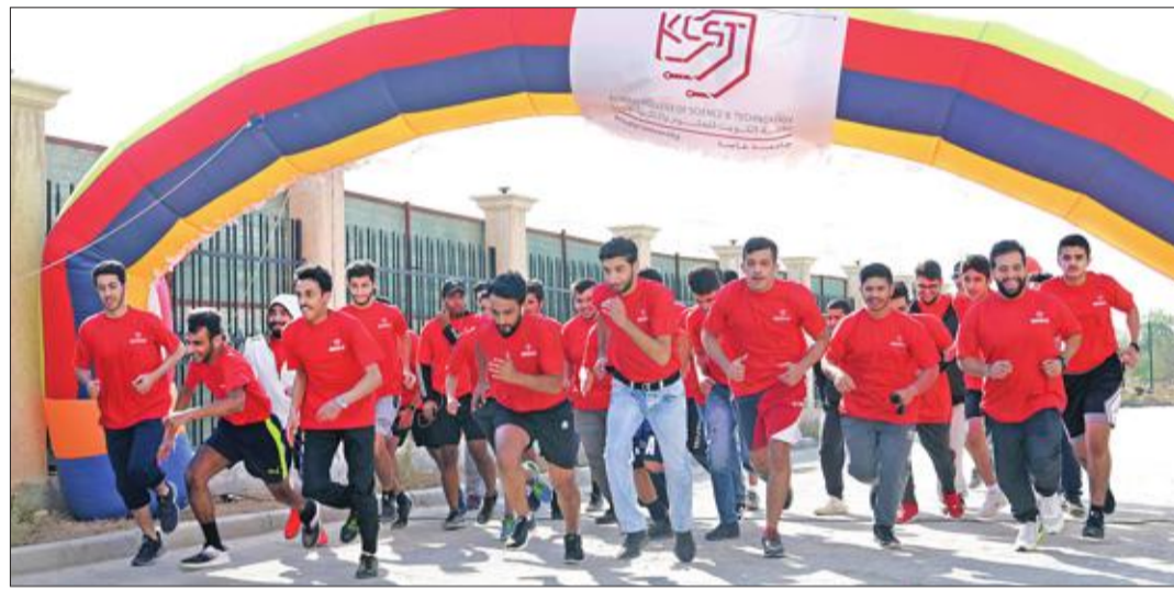
لحظة انطلاق الماراثون