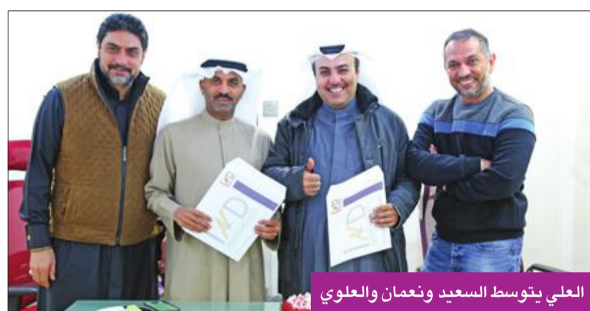
العلي بتوسط السعيد ونعمان والعلوي

وكشف العلي انه كان يصد انتاج عملين من خلال شركته، ولكنه قرر تأجيلهما للمشاركة في «آل ديسمبر»، الذي أكد أنه اجتماعي حديث يلامس جميع شرائح المجتمع الكويتي، وأن مسألة الأجر تبقى سرية ولا يجوز ان يصرح بها الفنان ولا المنتج.