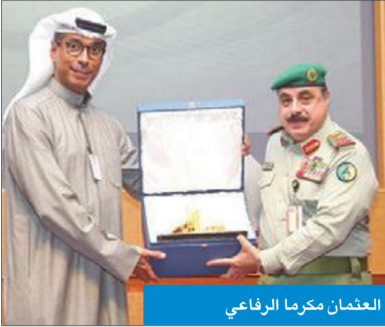
العثمان مكرما الرفاعي

أكد وكيل الحرس الوطني، الفريق الركن هاشم الرفاعي، أن الوثيقة الاستراتيجية للحرس 2020 تحت شعار «الأمن أولاً»، نصت على تفعيل واجب المسؤولية الاجتماعية، من خلال تسخير كافة إمكانيات الحرس في تقديم الدعم للجهات الحكومية والمجتمع في جميع المجالات. وقال خلال احتفال «الحرس» بترخيص 4 دورات للإسعافات الأولية لموظفي وموظفات المؤسسة العامة للتأمينات الاجتماعية، بحضور المدير العام للمؤسسة، مشعل العثمان، أن مبادرة الحرس لمحو أمية الإسعافات الأولية للعاملين في القطاع الحكومي تأتي بتوجيهات من القيادة العليا للحرس، مضيفاً أنه تم عقد العديد من الدورات التي انخرط فيها المئات من العاملين بالقطاع الحكومي من وزارات وهيئات حكومية، إضافة إلى شباب الكويت لتدريبهم على القيام بالإسعافات الأولية في حالات الطوارئ، متمنياً أن يكون المتدربون قد حققوا الاستفادة المرجوة من برنامج التدريب الذي أعد على أسس علمية متقدمة. وفي ختام الحفل، كرم المدير العام للتأمينات وكييل الحرس الوطني على جهوده في دعم الدورات.