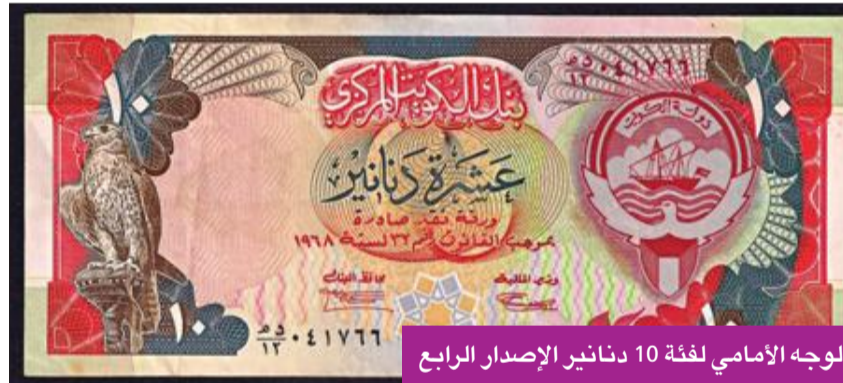
الوجه الأممي لفئة 10 دنانير الإصدار الرابع

للمرة الثانية، لتكون ضمن نقش وصور الوجه الأممي للعملة الورقية الكويتية لفئة 10 دنانير للإصدار الثالث الرسمي لدولة الكويت، والذي بدأ تداوله منذ عام 1980 حتى عام 1990، وبعد تحرير دولة الكويت من الغزو العراقي عام 1991 تم استخدام العملات الورقية السابقة نفسها، لكن بتغيير ألوانها، ليكون صقر الشيخ عبدالله المبارك، ولقطة المصور عبدالرزاق بدران يتم استخدامها للمرة الثالثة على العملة الورقية من فئة 10 دنانير، للإصدار الرابع مع عملات دولة الكويت، الذي بدأ باستخدامه منذ عام 1991 حتى عام 1994.