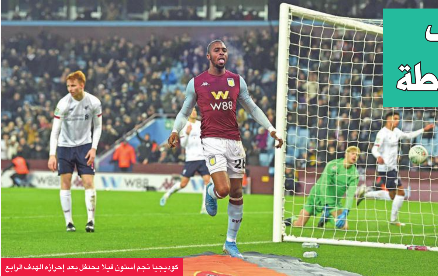
كوديجا نجم أستون فيلا يحتفل بعد إحرازه الهدف الرابع

فسدها قوية في المرمى (45)، واختتم ويسلي الخامسة بعدما انقرد بالحارس وسد الكرة بعيدا عن متناوله (2+90).