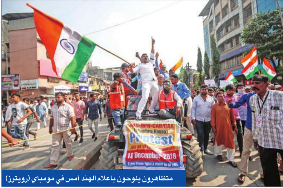
متظاهرون يلوحون بأعلام الهند أمس في مومباي

الاحتجاجات تتواصل رغم منع التجمع في أحياء نيودلهي الإسلامية