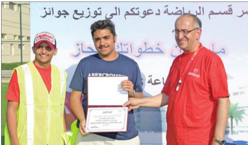
تكريم نادي العلاقات العامة