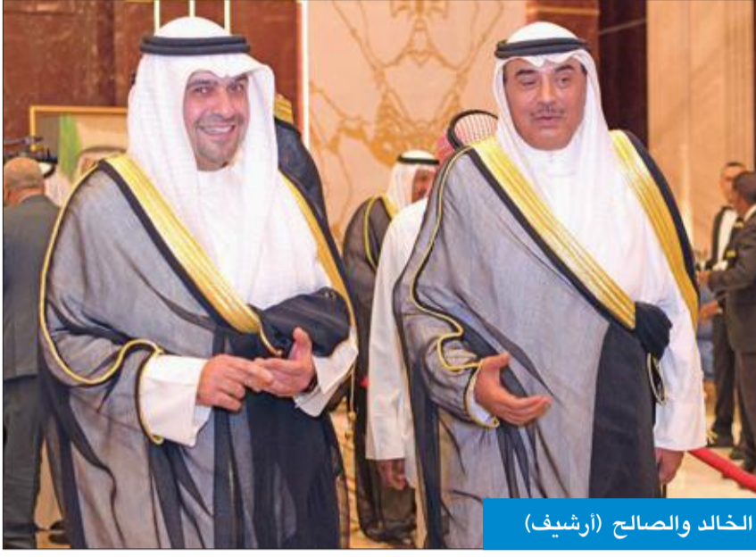
الخالص والصالح (أرشيف)

2- أصدرت المحكمة الإنكليزية العليا في لندن حكماً برفض حجز في جميع أنحاء العالم مبلغ 847 مليون دولار على أصول المدير العام السابق للمؤسسة العامة