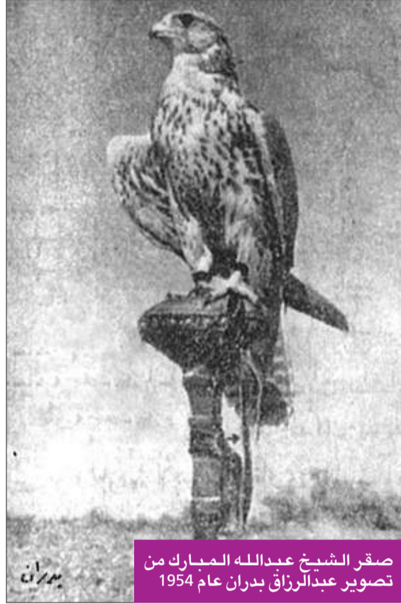
صقر الشيخ عبدالله المبارك عام 1954

والتي صدرت في عام 1966، وتحتوي تلك المجموعة على 8 طوابع بريدية من فئات مختلفة، وهي 90 فلساً - 50 فلساً - 45 فلساً - 30 فلساً - 25 فلساً - 20 فلساً - 15 فلساً - 8 فلساً - وجميع تلك الطوابع يتوسطها الصقر ويحيط بها إطار بسيط، ولكل فئة لون معين مختلف عن الأخر.