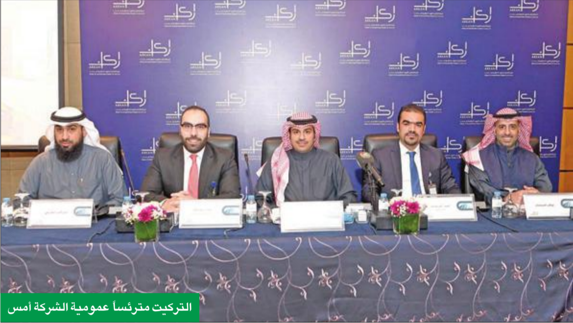
التركيت مترئساً عمومية الشركة أمس

عقارات من أصل 4 خلال سنة 2019، وهذه الصفقات جاءت نتيجة خطة مدروسة وبرنامج متكامل للاستحواذ على عدة عقارات استثمارية مدرة للدخل، بما يتناسب مع التطورات الراهنة لسوق العقار الكويتي ويتماشى مع طموحات المساهمين.