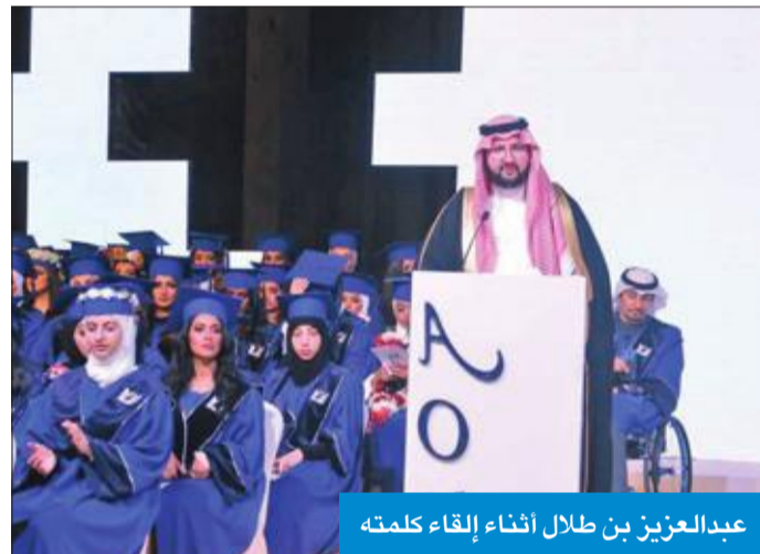
عبدالعزیز بن طلال أثناء إلقاء كلمته

احتفلت الجامعة العربية المفتوحة في دولة الكويت بتخريج الدفعة الرابعة عشرة للعام الجامعي 2019/2018، تحت رعاية وحضور الأمير عبدالعزیز بن طلال آل سعود رئيس مجلس أمناء الجامعة، وبحضور أعضاء مجلس الأمناء ورئيس الجامعة د. محمد بن إبراهيم الزكري ومديرها د. نايف المطيري ونواب الرئيس ومساعدي مدير الجامعة والسادة الشيوخ والسفراء وأعضاء السلك الدبلوماسي وضيوف الجامعة وأهالي الطلبة المحترفي بهم. وبهذه المناسبة، قال بن طلال إن هذا المشروع الجليل استطاع أن يرسم البسمة على وجوه طال بعدها عن العلم