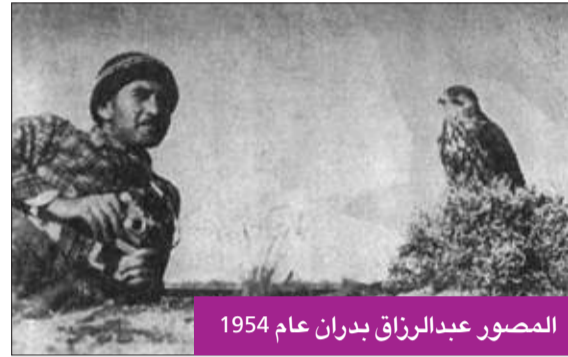
المصور عبدالرزاق بدران عام 1954

عن تاريخ الصيد بالصقور وأنواع الصقور ومعلومات عنها من حيث التغذية والتربية والصيد وغيرها، وقد حالف الحظ إحدى اللقطات الجميلة التي تظهر الصقر الخاص بالشيخ عبدالله المبارك وهو يقف على «الوكر»؛ تظهره بشكل جمالي كبير، وتظهر ملامح قوته، حيث وفق المصور عبدالرزاق بدران بالتقاط لقطة جميلة جداً للصقر ونشرت في مجلة الإيمان العدد 13 - مارس 1954 - السنة الثانية، ضمن مقالة من جزئين كتبها عبدالرزاق بدران، تحت عنوان «سر الصقر» (الجزء الثاني)، ويحكي فيها تفاصيل رحلته لرحلة القنص برفقة الشيخ عبدالله المبارك، وبعض المعلومات التاريخية عن الصقر ومعلومات عامة عن الصيد بالصقور، وأعجب بهذه