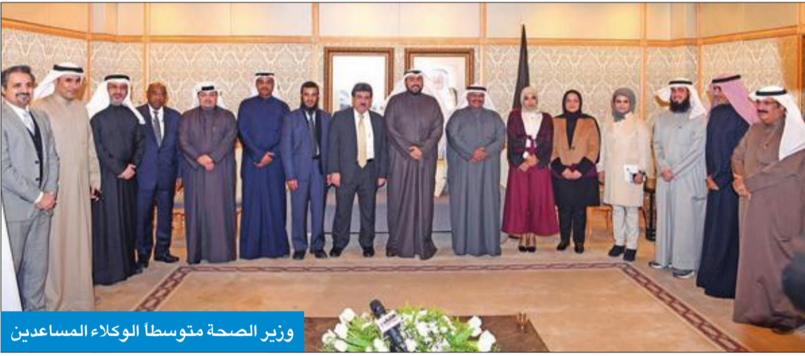
وزير الصحة متوسط الوكلاء المساعدين