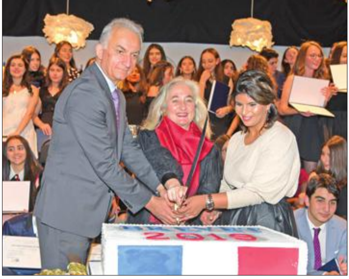
قطع كعكة الاحتفال