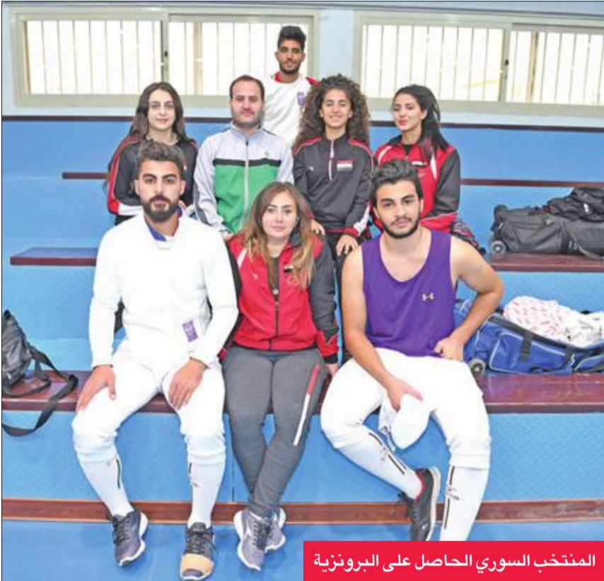
المنتخب السوري الحاصل على البرونزية