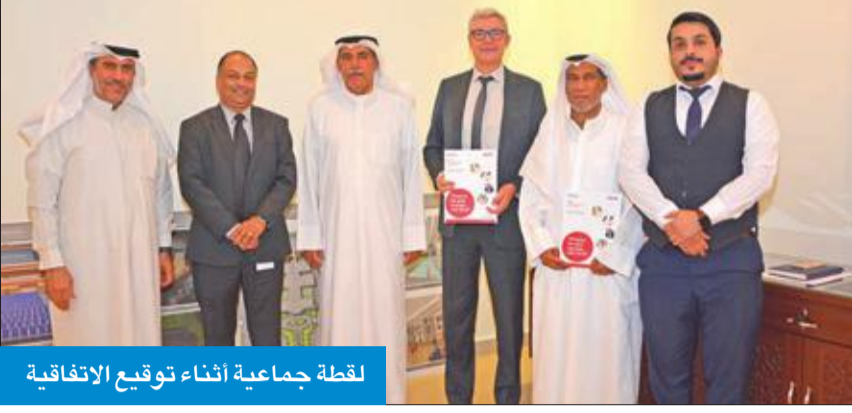
لقطة جماعية أثناء توقيع الاتفاقية