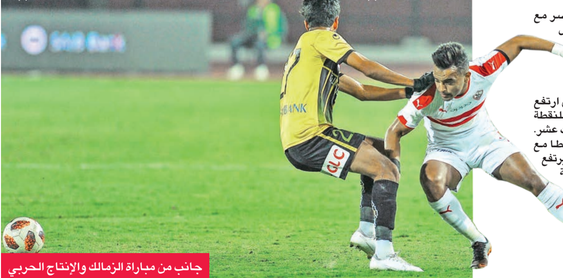
جانب من مباراة الزمالك والإنتاج الحربي

ذاتها، تعادل نادي مصر مع المقاصة بهدفين لكل فريق، ليرتفع رصيد الفريق القاهري للنقطة 8 في المركز الخامس، في حين ارتفع رصيد الفريق القوي للنقطة التاسعة في المركز الثالث عشر. كما تعادل فريق طنطا مع أسوان بهدفين لكل فريق، ليرتفع رصيد أبناء الغربية للنقطة العاشرة في المركز العاشر، وارتفع رصيد أبناء الجنوب إلى 6 نقاط في المركز الأخير.