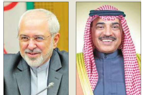
محمد جواد ظريف