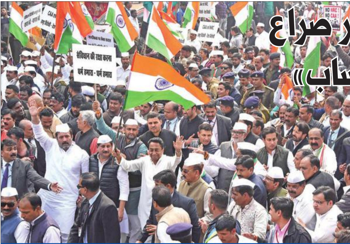
رئيس ولاية ماهاراشا باراداش المعارض يقود تظاهرة ضد قانون التجنيس والتعداد السكاني أمس