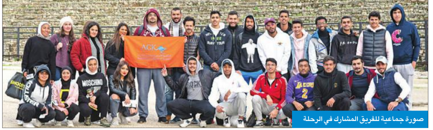
صورة جماعية للفريق المشارك في الرحلة