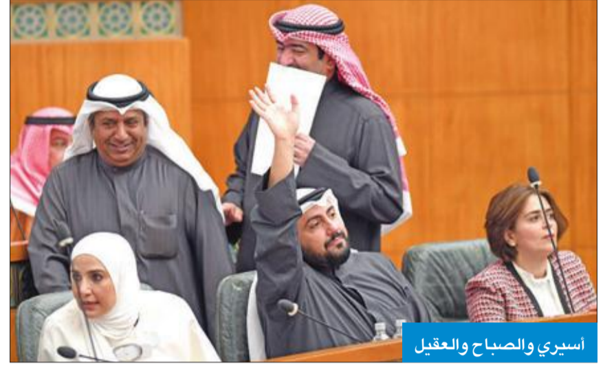
أسيري والصباح والعقيل