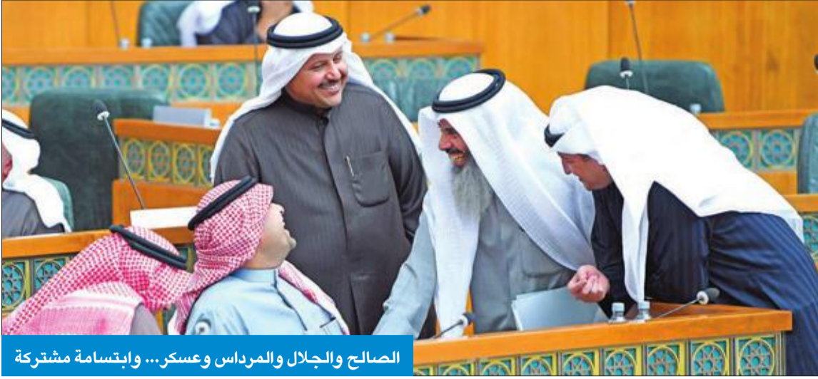
الصالح والجلال والمرداس وعسكر... وابتسامة مشتركة