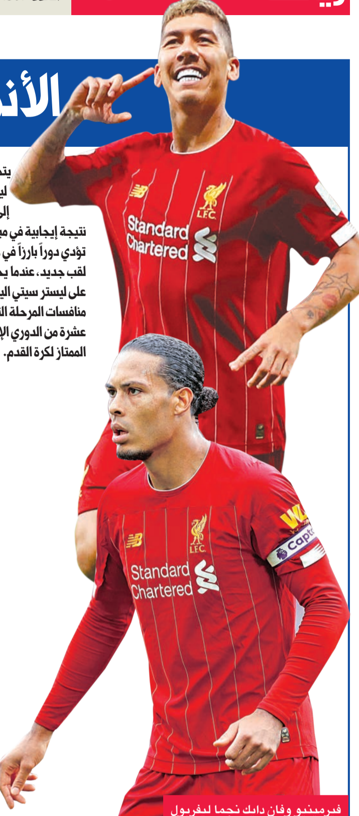
فيرمينيو وفان دايك نجما ليفربول

ويتعد "الريدز" بفارق 10 نقاط عن ليستر سيتي، و11 نقطة عن مانشستر سيتي، و17 نقطة عن تشلسي الرابع و23 نقطة عن توتنهام السابع، وسيخوض مباراتين في