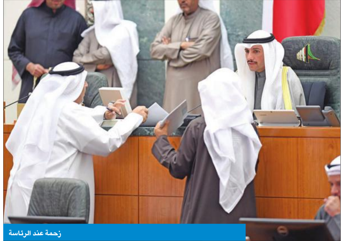
زخمة عند الرئاسة

● انتقادات وفتح ملفات تزوير الجناسي و«البدون»