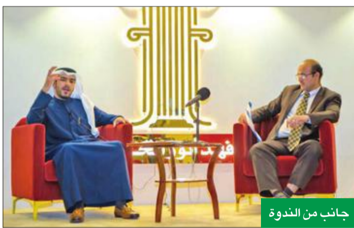
جانب من الندوة

جميعاً إلى فتح هذا الملف، لوقف نزيف الخسائر واستنزاف أموال المواطنين والمقيمين، محذراً من تلك الأوهام التي قد تدمي الاقتصاد الوطني مستقبلاً. ولفت إلى أن هناك قصوراً في رقابة البنوك المركزية بالمنطقة، نتيجة لما يحدث من عمليات احتيال مالية تتم عبر المصارف والبنوك، داعياً في الوقت ذاته إلى ضرورة تشديد الرقابة من قبل هيئات أسواق المال، والبنوك المركزية، ومعاينة الشركات المتلاعنة.