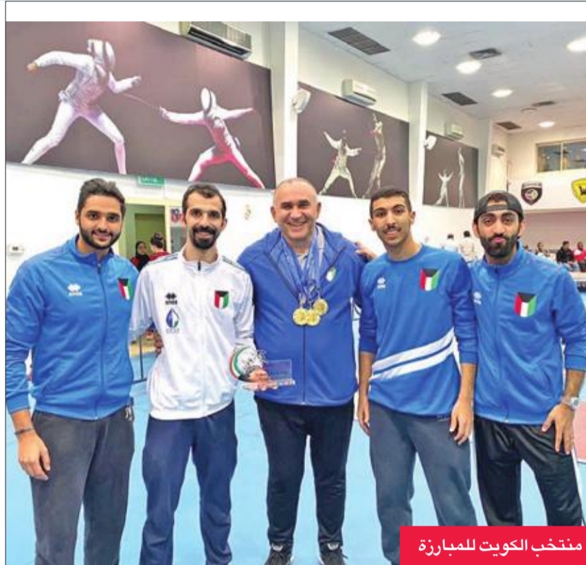
منتخب الكويت للمبارزة

واصل منتخب الكويت للمبارزة أمس الأول تصدره للبطولة العربية للعمومي للرجال والسيدات، التي تستضيفها البلاد، برصيد 6 ذهبيات وفضيتين وبرونزيتين. وحقق منتخب الكويت في منافسات الرجال في سلاح الإيبه الميدالية الذهبية للفرق، بينما حقق المنتخب السعودي الميدالية الفضية، واحتل المنتخبان الإماراتي والعراقي في المركز الثالث. وفي منافسات سلاح السابر حقق منتخب الكويت الميدالية الذهبية، وتلاه المنتخب العراقي بالميدالية الفضية، في حين ذهبت الميدالية البرونزية للمنتخب السوري. ونالت سيدات الإمارات الميدالية الذهبية في سلاح السابر فرق، على حساب المنتخب السوري الذي حصد الميدالية الفضية، ونال العراق الميدالية البرونزية.