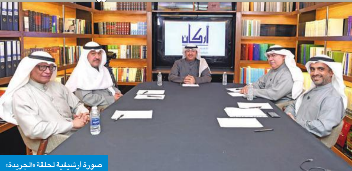
صورة أرشيفية لجلسة «الجريدة»