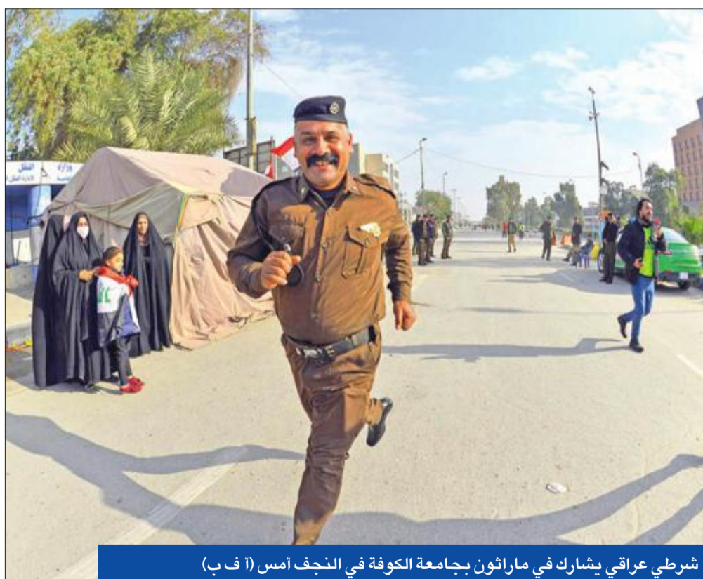
شرطي عراقي يشارك في ماراثون بجامعة الكوفة في النجف أمس

• انتقادات لقانون الانتخاب الجديد • ممثل ساخر ينجو من اغتيال