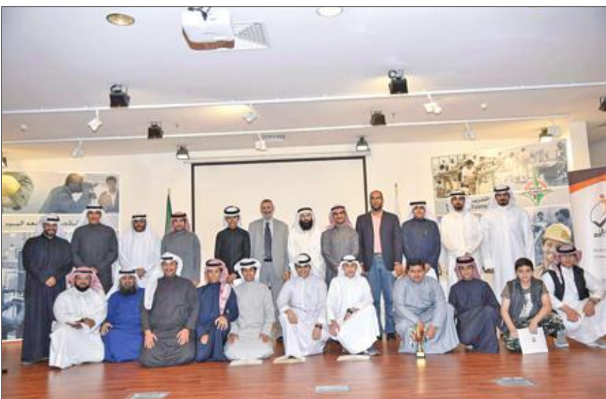
المكرمون في صورة جماعية