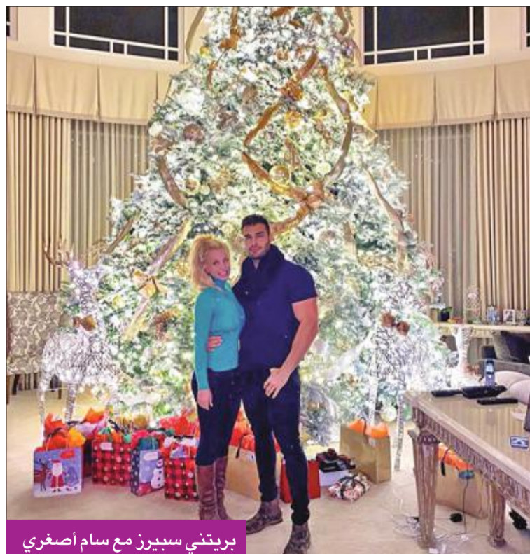
بريتني سبيرز مع سام أصغري

بدأت المغنية العالمية بريتني سبيرز تخرج شيئاً فشيئاً من عزلتها التي فرضتها عليها الظروف النفسية والعائلية والعملية الصعبة التي مرت بها، بتكوين جزء جديد من حياتها مع صديقها الإيراني سام أصغري، حيث احتفلت بعيد الميلاد الحالي برفقته في منزلها، وتصورا أمام شجرة الميلاد.