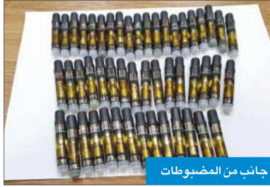
جانب من المضبوطات