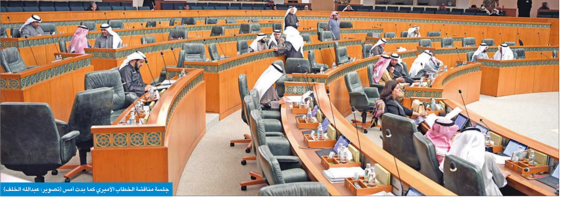
جلسة مناقشة الخطاب الأميري كما بدت أمس

النواب لم يتقدموا بطلب تمديد الجلسة حتى الانتهاء من مناقشته