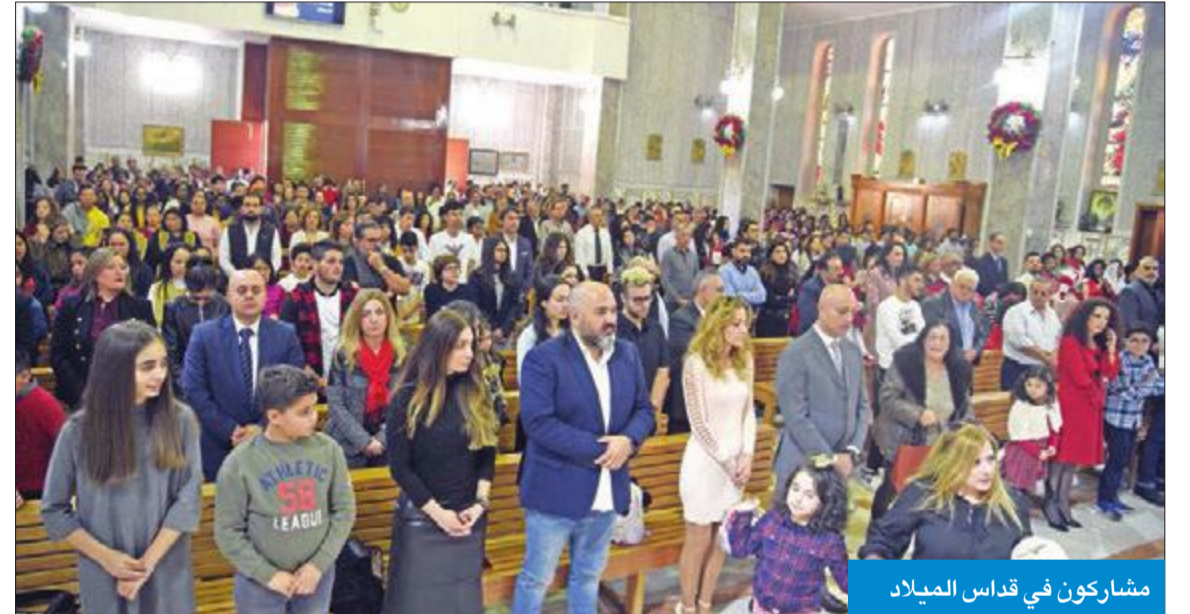
مشاركون في قداس الميلاد