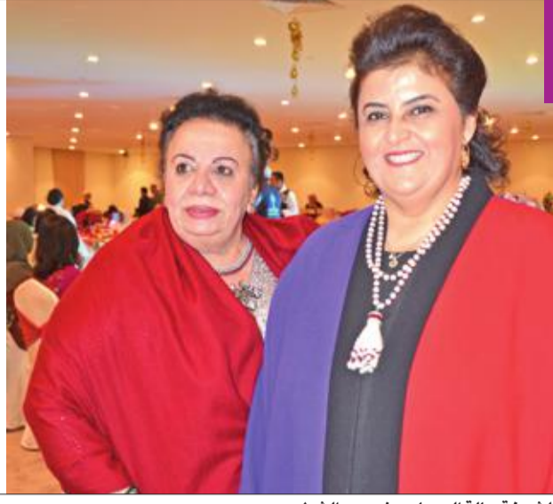
الشيخة هالة الصباح ونرجس الشطي