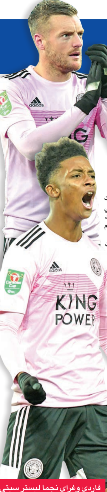
فاردي وغراي نجما ليستر سيتي

ويخوض تشلسي الرابع اختبارة سهلا نسبيا أمام ضيفه ساوثهامبتون السابع عشر، منتشبا بفوزه الخمين 2-صفر على حجاره الساعي التعويض عندما يستضيف برايتون برایتون الرابع عشر، في حين يأمل مانشستر يونايتد وقف زيف النقاط وتحقيق فوزه الأول بعد تعادل وخسارة عندما يستضيف نيوكاسل شريكه في المركز الثامن.