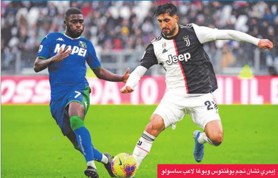
إيمري تشان نجم يوفنتوس ويوغا لاعب ساسولو

وان علاقته بالمدرّب ساري على أحسن ما يرام. الجدير بالذكر أن دي ليخت لعب 17 مباراة مع يوفنتوس منذ انطلاق الموسم لحساب جميع المسابقات وسجل خلالها هدفاً واحداً.