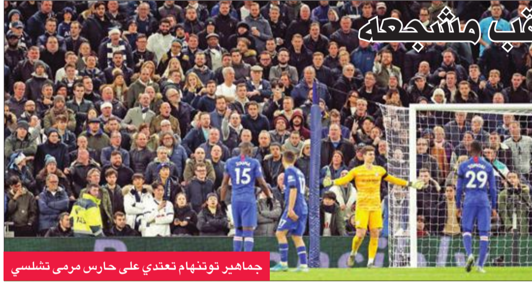
جماهير توتنهام تعدي على حارس مرمى تشلسي

وسقط كوب بالقرب من كيبا، الذي القي به خارج الملعب، في منتصف الشوط الثاني من اللقاء الذي فاز به تشلسي بهدفين نظيفين حملا توقيع البرازيلي ويليان.