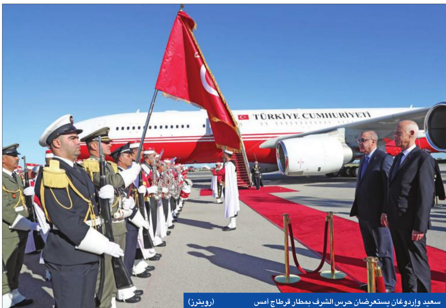
سعيد وإردوغان يستعرضان حرس الشرف بمطار قرطاج أمس (رويترز)

في خضم التوتر المتصاعد في ليبيا، قام الرئيس التركي رجب طيب أردوغان بزيارة مفاجئة للعاصمة التونسية، التقى خلالها نظيره الجديد سعيد عبيد، ودعا إلى وقف فوري لإطلاق النار في طرابلس، ووضع حد للنزاع المسلح المتفاقم في البلد المجاور.