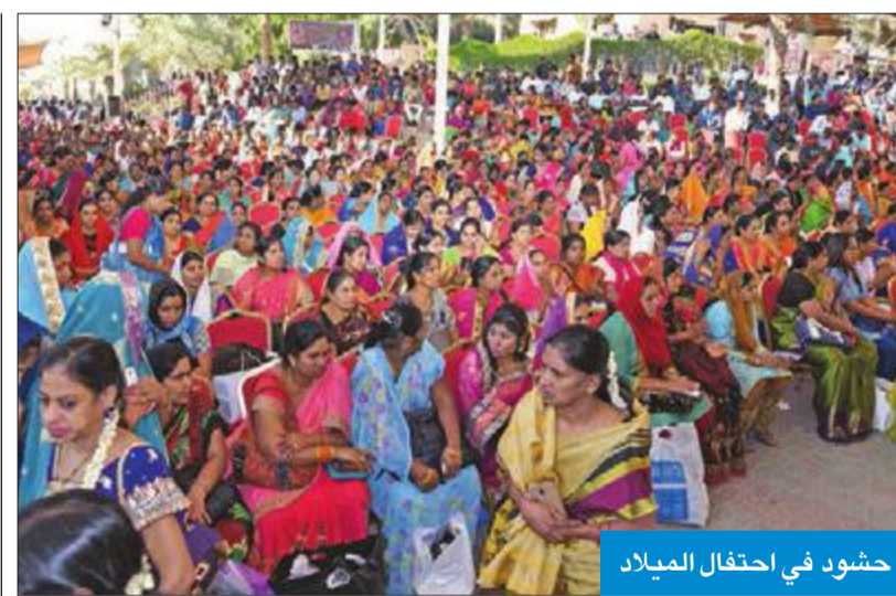
حشود في احتفال الميلاد