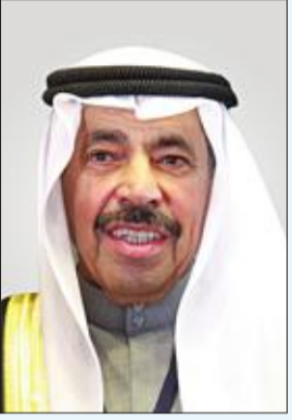
عبدالعزيز سعود البابطين

أعلنت مؤسسة عبدالعزيز سعود البابطين الثقافية تشكيل مجلس أمنائها الجديد، ويضم نخبة من الأكاديميين والمفكرين من داخل الوطن العربي وخارجه، ويأتي هذا المجلس في دورته العاشرة عقب انتهاء أعمال المجلس السابق.