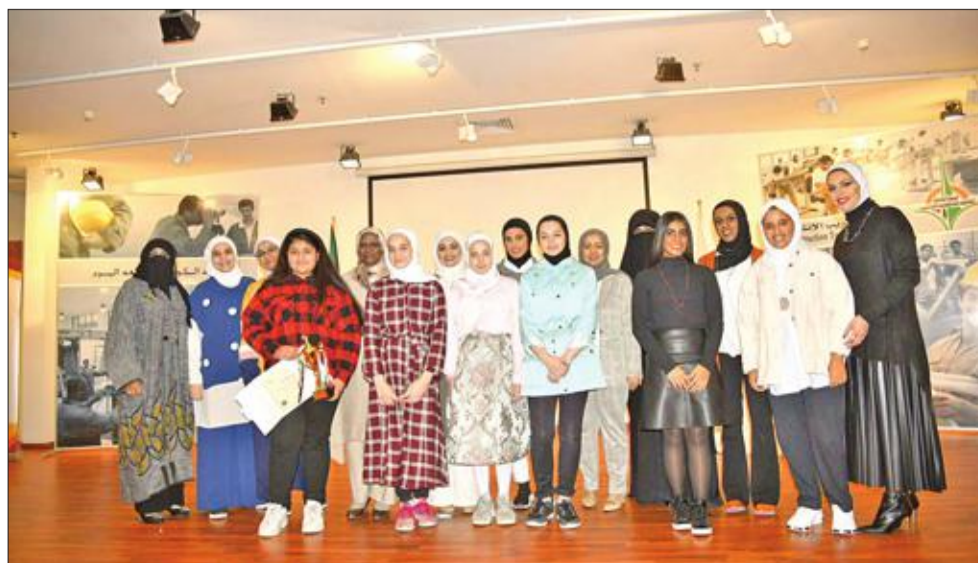
صورة جماعية للمكرمات