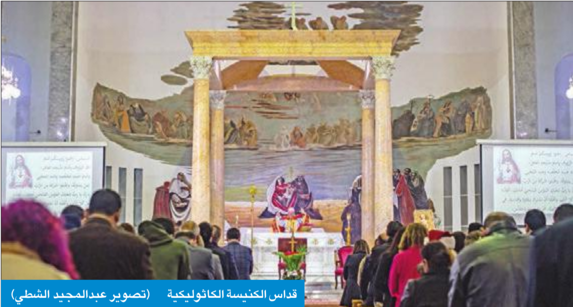
قداس الكنيسة الكاثوليكية

أبناء الطائفة الكاثوليكية والكنيسة الإنجيلية من مختلف الجنسيات. وأقامت تلك الكنائس، صباح أمس، حفلات استقبال في كنائسها بمناسبة الأعياد،