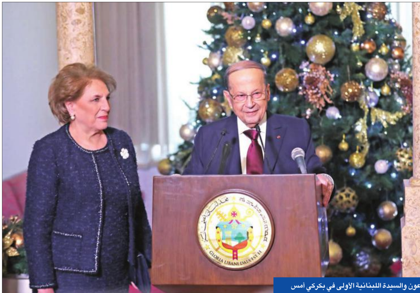
عون والسيدة اللبنانية الأولى في بكركي أمس

• نواب «المستقبل»: تصريحاته مخالفة للدستور • «أمل»: لا يمكن لدياب تجاهل القوى الأساسية