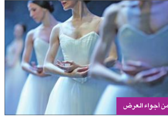
من أجواء العرض

أحد المصادر التي تُمد الفرقة بالأعضاء الجدد. كما يهتم أوليفيري، إضافة إلى رصيد الفرقة الأكاديمي، من خلال إبداعات جديدة تصمم خصيصا لفرقة مسرح لاسكالا للباليه، حيث تتميز