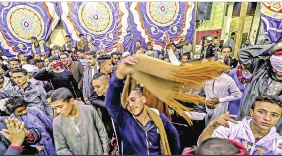
مصريون يشاركون في حلقات الذكر بمناسبة مولد الحسين في القاهرة مساء أمس الأول (أ ب ف)

وزير البترول المصري طارق الملا 4 اتفاقيات جديدة للبحث عن البترول والغاز الطبيعي وإنتاجهما بمناطق الصحراء الغربية وخليج السويس ووادي النيل، باستثمارات قيمتها 155 مليون دولار. ولفت وزير البترول إلى أن إجمالي عدد الاتفاقيات البترولية التي أبرمتها وزارة البترول مع المستثمرين الأجنبيين منذ 30 يونيو 2013 حتى الآن وصل إلى 103، مضيفاً أنه سيتم لاحقاً توقيع 4 اتفاقيات أخرى، فضلاً عن 9 اتفاقيات جديدة وافق عليها مجلس النواب وجار استصدار مشاريع القوانين الخاصة بها.