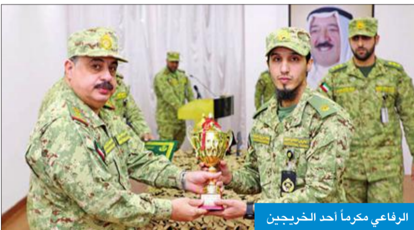
الرفاعي مكرماً أحد الخريجين

● الرفاعي: إعداد القوات لأداء مهامها القتالية بكفاءة واحتراف ومواكبة التقدم العسكري