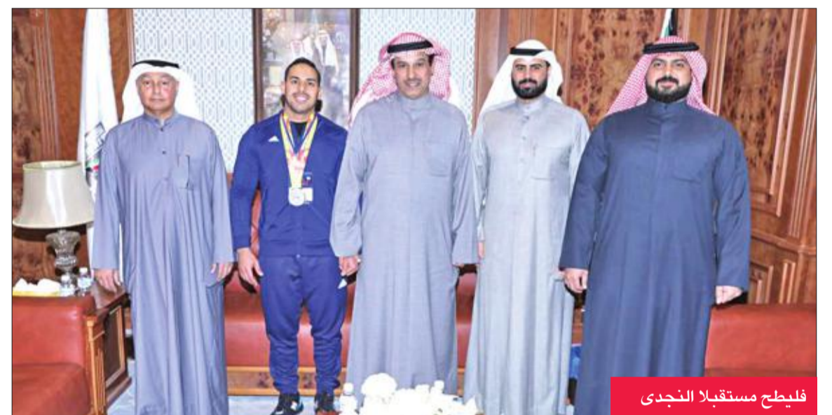
فليطح مستقبلاً النجدي

الحديثة، وأعرب عن سعادته بما اللاعب من مستوى مشرف للشباب الرياضي الكويتي في هذا المحفل الآسيوي.