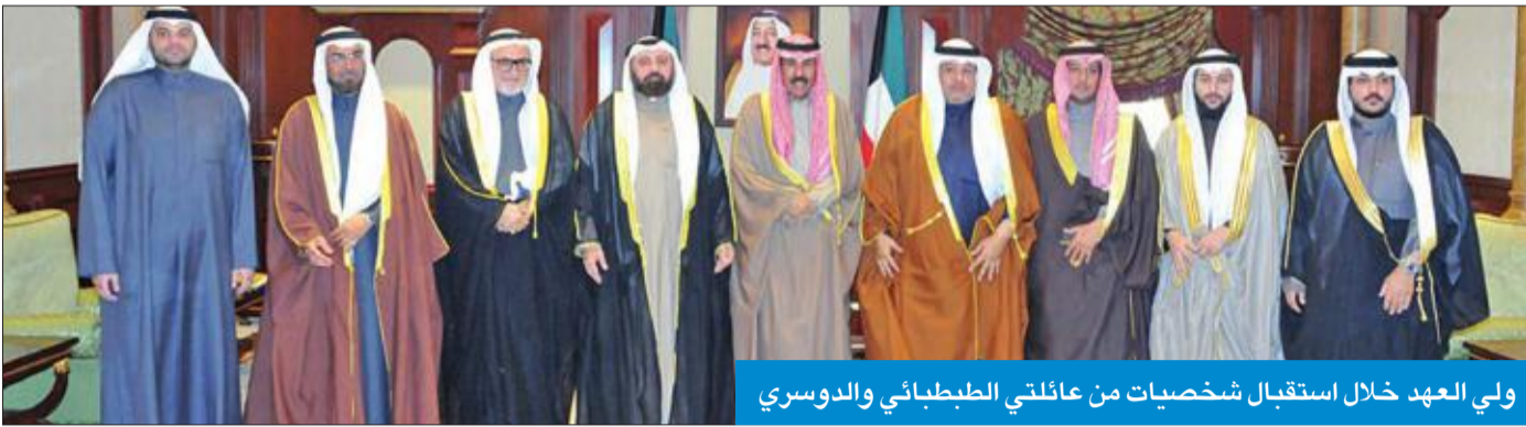
ولي العهد خلال استقبال شخصيات من عائلتي الطبطيني والدوسري

امتنانهم على تفضل صاحب السمو أمير البلاد الشيخ صباح الأحمد في إصدار العفو الأميري عن ابنهينها الدكتور وليد الطبطيني ومحمد الدوسري.