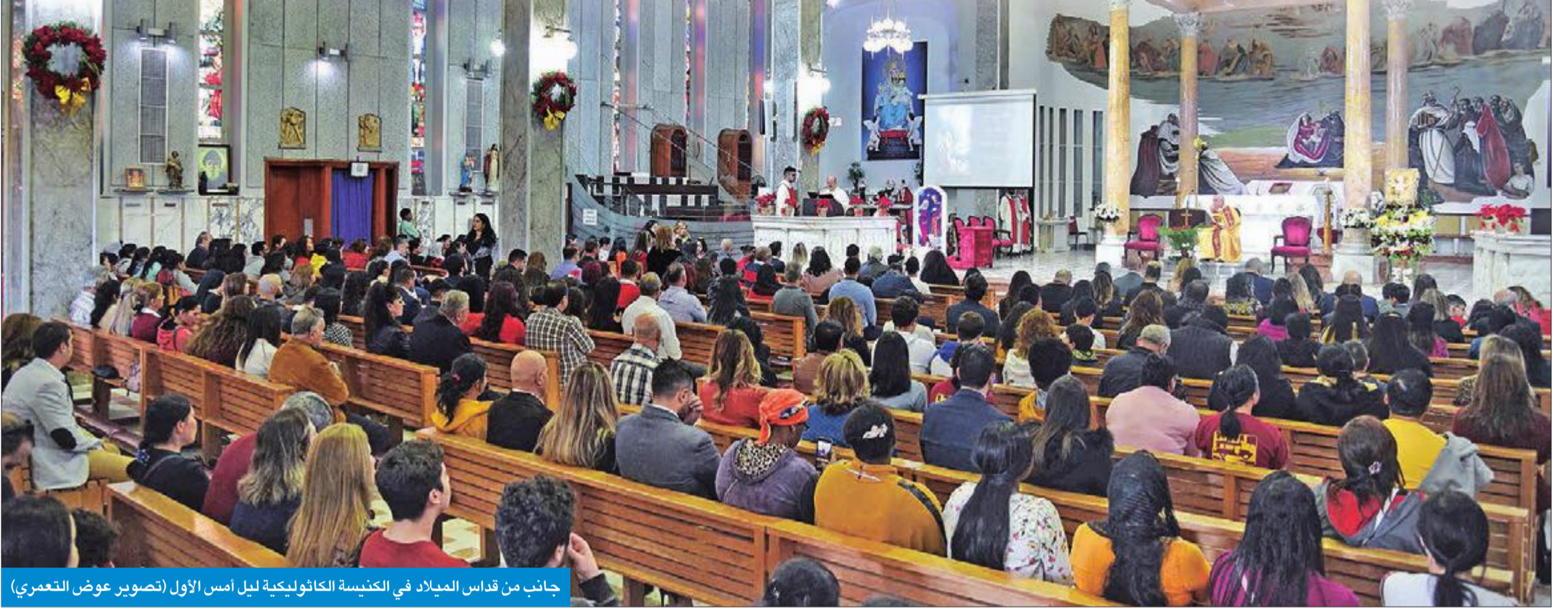
جانب من قداس الميلاد في الكنيسة الكاثوليكية ليل أمس الأول

غريب لـ الجريدة : الكويت بلد الإنسانية ونعيش في أجواء الحرية والتسامح