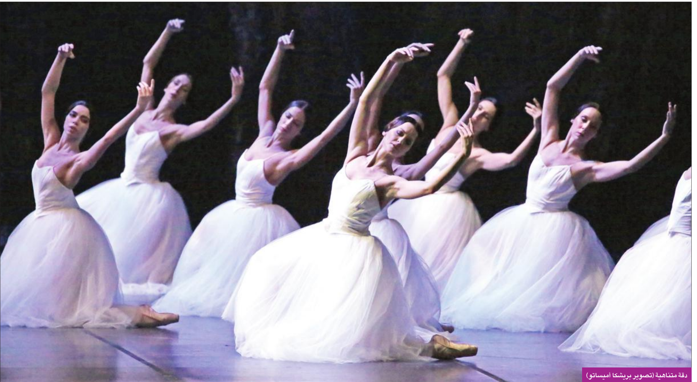
دقة متناهية

تاريخ فرقة مسرح لاسكالا يعود إلى قرون عدة قبل افتتاح أحد أهم دور الأوبرا بالعالم في عام 1778