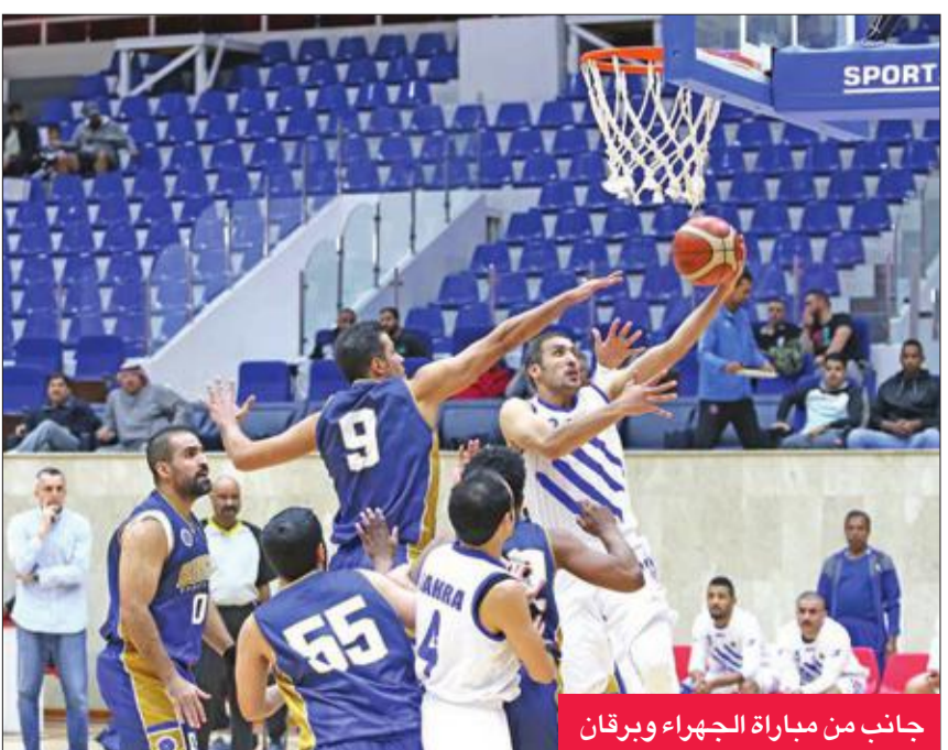
جانب من مباراة الجهراء وبرقان

أما المباراة الأخيرة التي تجمع برقان مع النصر فيجب فيها الفوز لبرقان، إذا أراد المنافسة على التأهل، حيث إن فوزه سيجعل صوره مرتعطا بمباراة اليرموك أمام النصر في الجولة الأخيرة، إذ في حالة خسارة اليرموك سيتأهل، وهو أمر صعب بعد الأداء الذي قدمه اليرموك هذا الموسم.