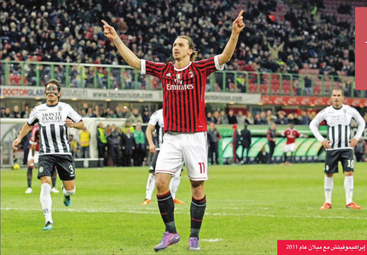
إبراهيموفيتش مع ميلان عام 2011