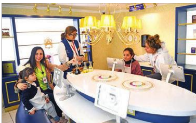
أنشطة علمية وتجارب للأطفال