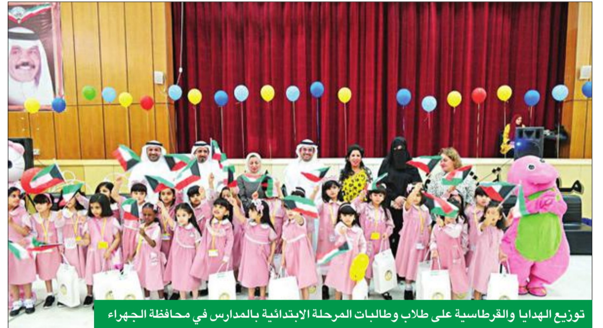
توزيع الهدايا والقرطاسية على طلاب وطالبات المرحلة الابتدائية بالمدارس في محافظة الجھراء