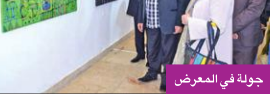
جولة في المعرض

دعت جمعية الفنانين التشكيليين العراقيين، أعضاءها العاملين للمشاركة في المعرض السنوي الشامل للفن التشكيلي، الذي تقيمه الجمعية بداية كل عام.