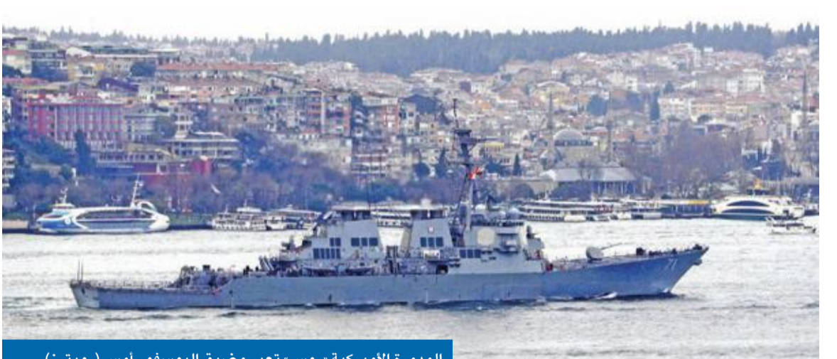
الدمرة الأميركية «روس» تعبر مضيق البوسفور أمس

عبر إرسال قوات بحرية وبرية... والبرلمان يمرر «التفويض» الخميس