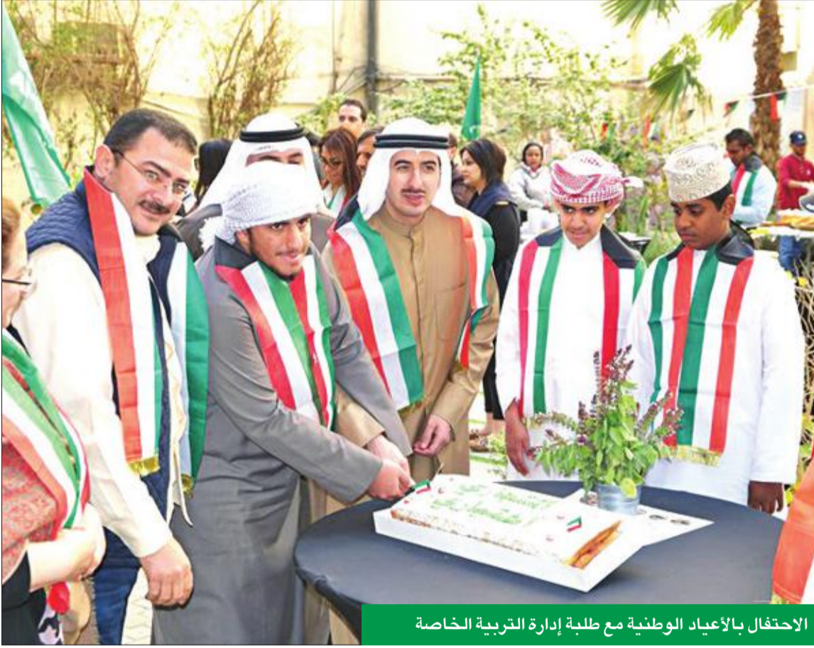
الاحتفال بالاعياد الوطنية مع طلبة إدارة التربية الخاصة

قطاع التواصل المؤسسي رسخ مكانة البنك عبر رعايته الفعاليات المختلفة خلال 2019