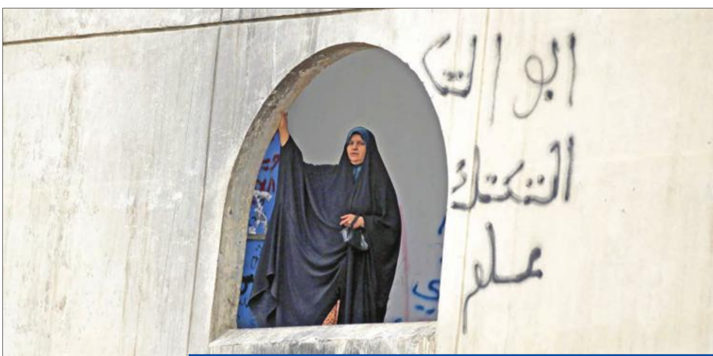
عراقية أمس الأول تطل من إحدى نوافذ «المطعم التركي» معقل الاحتجاجات في «ساحة التحرير» وسط بغداد

قام وزير الخارجية الأميركي مايك بوميو بزيارة مفاجئة إلى قاعدة عين الأسد بالأنبار، غداة مقتل متعاقد أميركي في هجوم صاروخي على قاعدة عسكرية عراقية قرب مدينة كركوك، تفقد وزير الخارجية الأميركي مايك بوميو القوات الأميركية في قاعدة عين الأسد الجوية في ناحية البغدادي بمحافظة الأنبار غربي بغداد، بعد أيام من مطالبة واشنطن السلطات العراقية بضرورة وقف هجمات صاروخية تستهدف منشآت تتواجد بها قوات أميركية، ويعتقد أن فصائل موالية لطهران تشنها.