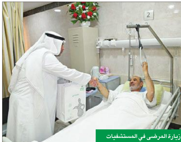
زيارة المرضى في المستشفيات