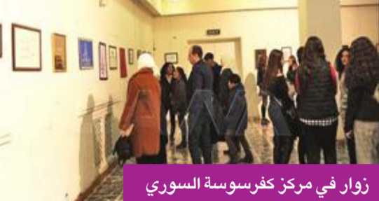
زوار في مركز كفسوسة السوري

استضاف المركز الثقافي في منطقة كفسوسة في العاصمة السورية دمشق معرضاً فنياً ضم لوحات توزعت بين الخط العربي والرسم، تحت عنوان «مجموعة حروف»، وقدّ عدد اللوحات بـ 45 لوحة، لمجموعة من الباحثين، توزعت بين الطبيعة ولوحات الخط العربي بخطوط الرقعة والكوفي.