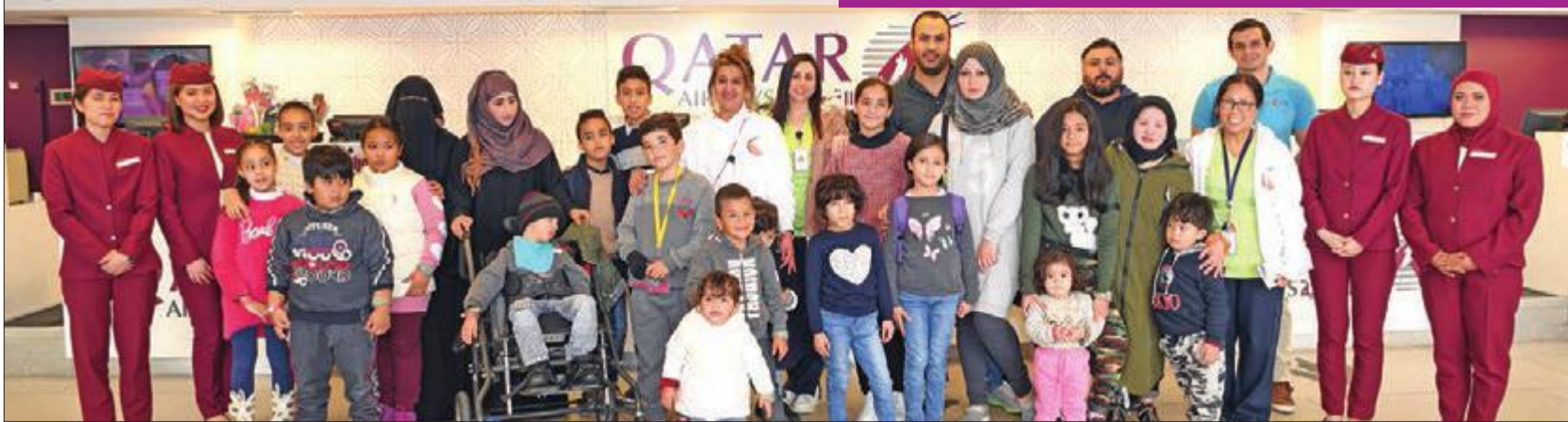
صورة جماعية لعدد من الأطفال المدعوين مع أسرهم وفريق الخطوط الجوية القطرية