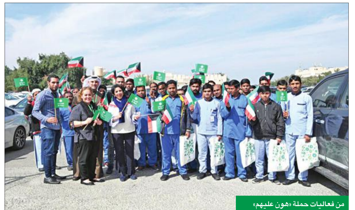
من فعاليات حملة «هون عليهم»