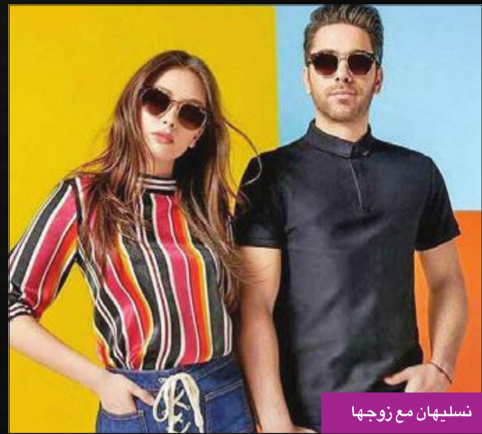
نسليهان مع زوجها

الأحداث أكثر إثارة للاهتمام وغامضة. ويتمحور المسلسل حول قصة الحب الملتهبة التي وقعت بين ابنة السفير ناراي والشاب التركي البسيط سانغر إيفه، حيث يجمع الشابان قصة حب عنيفة حتى يأتي الزواج، وفي يوم الزفاف يختفي ناراي خارج البلاد. ثم تعود ناراي مرة أخرى مع فتاة صغيرة ستفاجئ سنجار بأنها ابنته، لكن ناراي التي قررت العودة إلى القرية التي فرت منها قبل 10 سنوات ستعود في يوم حفل زفاف سانغر لتصادمه مع مسالة ابنته، ومن ثم تبدأ الأحداث الثارية بين البطلين. وبعد الانتقادات التي وجهت إلى نسليهان أتاغول بسبب رفع أجرها في «ابنة السفير»، قالت إن النجوم في أوروبا يأخذون أكثر من ذلك بكثير، وأن أجرها لا يساوي شيئاً مع أجرهم، متسائلة عما إذا كانت تأخذ راتبها من جيوب منتقديها.