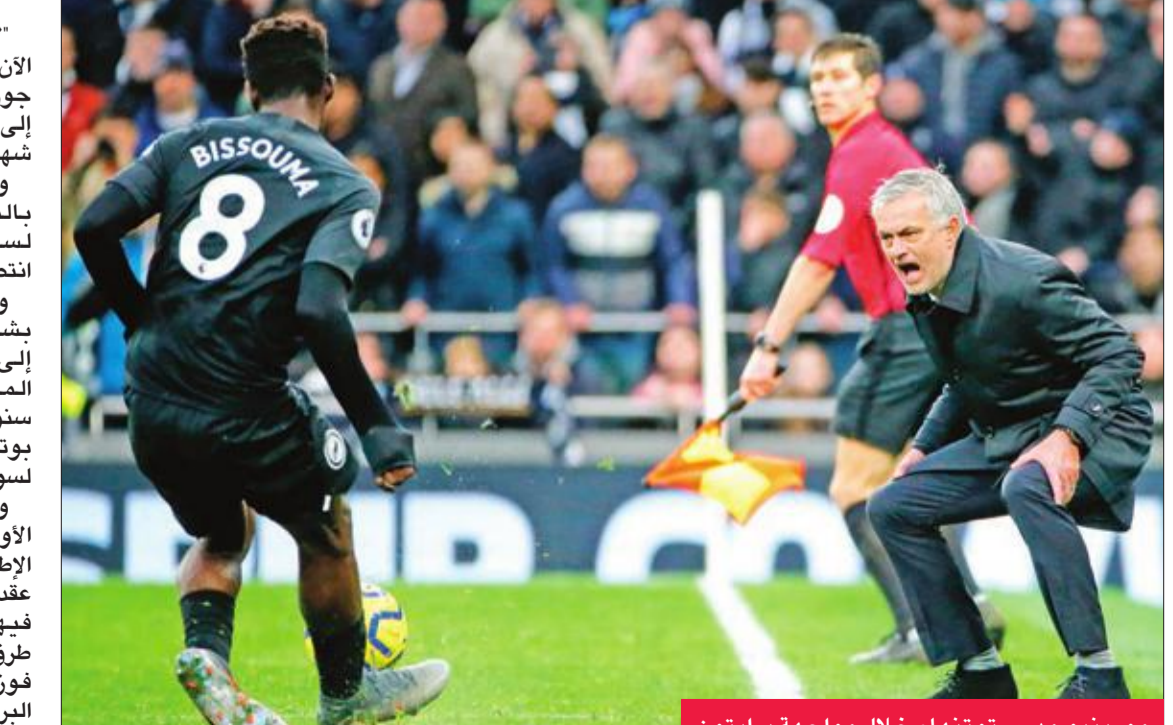
مورينيو مدرب توتنهام خلال مواجهة برايتون

لا يمكن أن أكون أكثر سعادة مما أنا عليه الآن... هكذا كشف المدرب البرتغالي الشهير جوزيه مورينيو عن مدى سعادته بالعودة إلى ممارسة عمله في عالم التدريب بعد 11 شهراً في الظل. وكان مانشستر يونايتد الإنجليزي أطاح بالمدرّب البرتغالي في 18 ديسمبر 2018 لسوء النتائج بعدما حقق الفريق سبعة انتصارات فقط في أول مباراة له بالموسم. ومنذ ذلك الحين، تورى نجم مورينيو بشكل غير مسبوق حتى أعاده توتنهام إلى الأضواء بالتعاقد معه في 20 نوفمبر الماضي ليقود الفريق بعقد يمتد أربع سنوات خلفاً للمدرّب الأرجنتيني ماوريسيو بوتشيتينو الذي أقبل من تدريب الفريق لسوء النتائج. ولم تكن فترة الغياب عن الملاعب هي الأولى لمورينيو ولكنها كانت الأطول على الإطلاق منذ بدء مسيرته التدريبية قبل نحو عقدين كما أنها المرة الأولى التي يخفي فيها نجم مورينيو بهذا الشكل منذ أن طرق باب الشهرة وعالم النجومية من خلال فوزه بلقب دوري أبطال أوروبا مع بورنمو البرتغالي. وخلال الشهور الـ 11 التي قضاها بعيداً عن