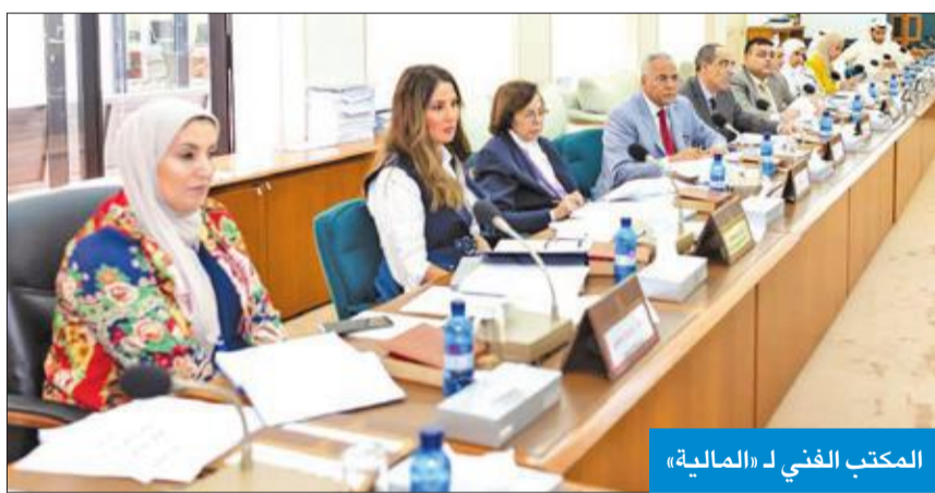
المكتب الفني لـ«المالية»

وعن الجديد الذي جاء به مشروع القانون، قال: فمن حيث الهيكل، ينص المشروع على إنشاء دائرة الإفلاس، وإدارة إفلاس، ولجنة إفلاس، مع اختصاصات كل منها وتشكيلها من حيث التسلسل التشريعي للمواد وأحكام المشروع.