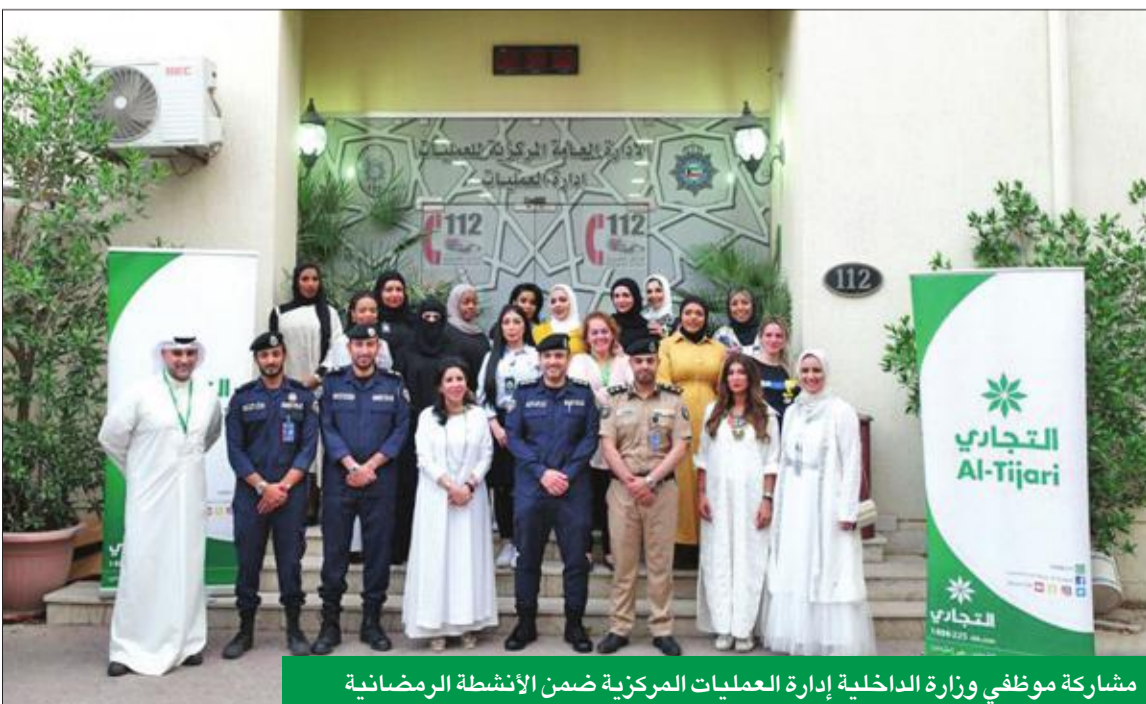
مشاركة موظفي وزارة الداخلية إدارة العمليات المركزية ضمن الأنشطة الرمضانية