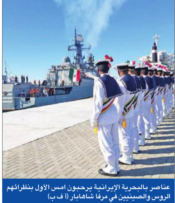
عناصر بالبحرية الإيرانية يرحبون أمس الأول بنظرانهم الروس والصينيين في مرفأ شاهابار

وجاءت التغريدات بالتزامن من بدء إيران وروسيا والصين 4 أيام من التدريبات البحرية المشتركة، التي أطلق