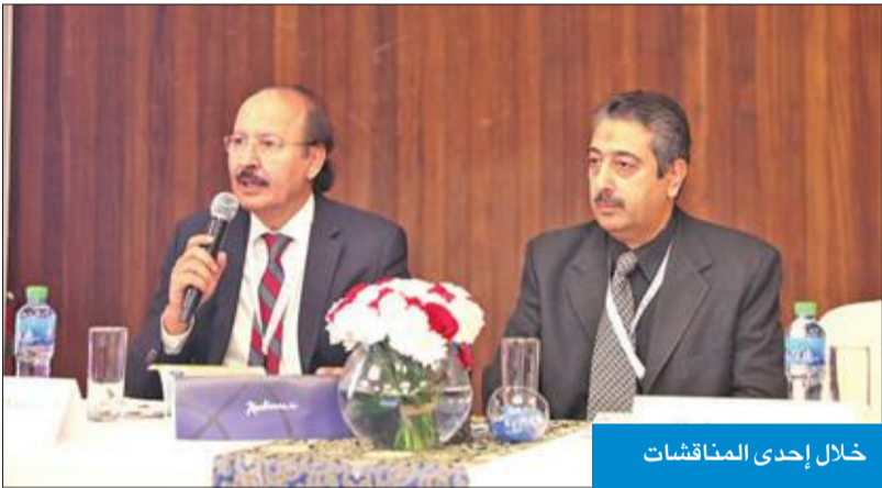
خلال إحدى المناقشات

مثال حي للتعاون المثمر بين «الحكومي» و«الأهلي» لتقديم خدمة طبية أفضل