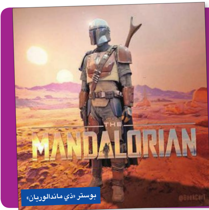
بوستر «ذي ماندالوريان»

وأعمالاً لأبطال خارقين جدد من عالم «مارفل»، ستعرضها على منصتها للفيديو التي ستنافس «نتفليكس». ومن بين المفاجآت التي حضرتها المجموعة، الرائدة عالميا في مجال الترفيه، لمحبيها وللصحافيين الذين شاركوا في حديثها «دي 23»، الذي تنظمه كل عامين، كانت أعمال «ستار وورز» (حرب النجوم) الجديدة الأكثر إثارة للاهتمام الحاضرين. (أ ف ب)