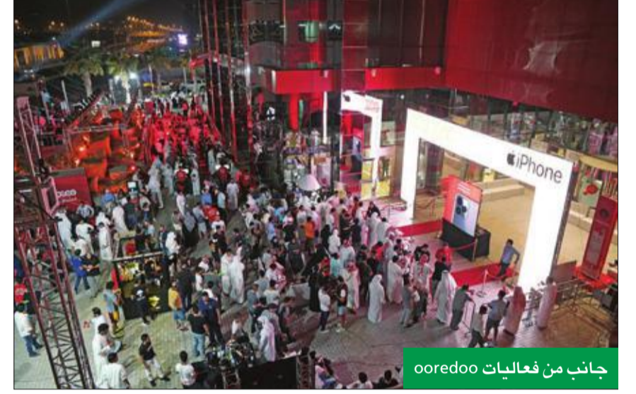
جانب من فعاليات ooredoo

تماشياً مع سياسة الشركة وقيمتها الأساسية، أقامت Ooredoo عدداً من المبادرات الداخلية المعنية بالتواصل وتعزيز أواصر الترابط بين الموظفين والإدارة العليا في الشركة، حيث أقامت احتفالات قريش، كما أقامت غبقتها الرضائية السنوية، ليستمتع الموظفون وأسرهم بأجواء الرضائية، كما أقامت اللقاء السنوي بين أفراد الإدارة العليا وجميع الموظفين، وهو لقاء لإطلاع كافة الموظفين بأهم الإنجازات التي أنجزتها أقسام الشركة، إضافة إلى مناقشة التحديات في القطاع.