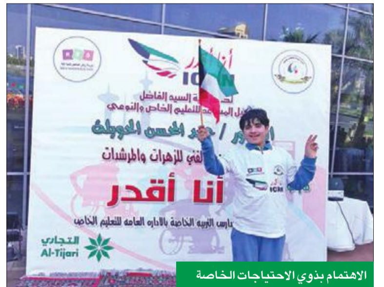
الاهتمام بذوي الاحتياجات الخاصة