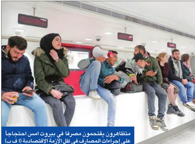
مظاهرون يقتحمون مصرفاً في بيروت أمس احتجاجاً على إجراءات المصارف في ظل الأزمة الاقتصادية

بيروت - الجريدة. تتجه الأنظار في لبنان إلى حركة اتصالات رئيس الحكومة المكلف حسان دياب لتشكيل حكومة إنقاذ في وقت البلاد غارقة بالانهيار على مختلف المستويات. وأشارت مصادر متابعة إلى تباين في صفوف «الترويكا» التي تدعم دياب، إذ يصير رئيس الجمهورية ميشال عون على أن تنصر الحكومة النور قبيل عطلة رأس السنة، في حين يفضل الثنائي الشيعي، وخصوصاً «حزب الله»، القيام بالمزيد من المشاورات قبل إعلان التشكيلة. ولغقت المصادر إلى أن