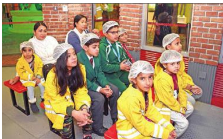
عدد من الأطفال أثناء استماعهم لشرح عن عمل رجال الإطفاء