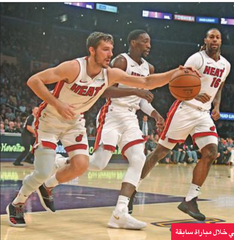
لاعبو ميامي خلال مباراة سابقة

للفائز. ونجح براون بلذات في تسجيل 30 نقطة للمرة الثانية بقوله "أعتقد أن الأسلوب البدني الذي اعتمده أورلاندو كان مفتاح فوزه. لم تتمكن من الرد على ذلك".