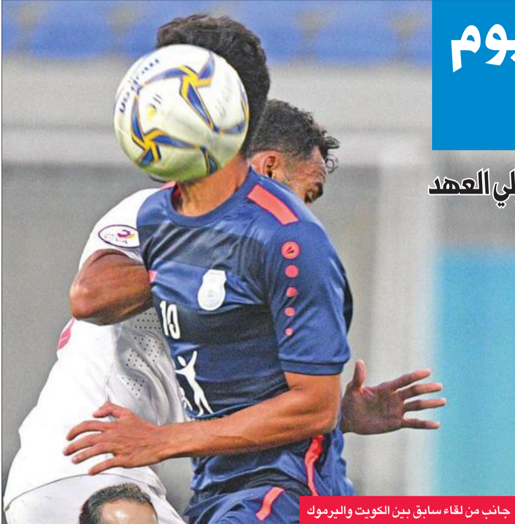
جانب من لقاء سابق بين الكويت واليرموك