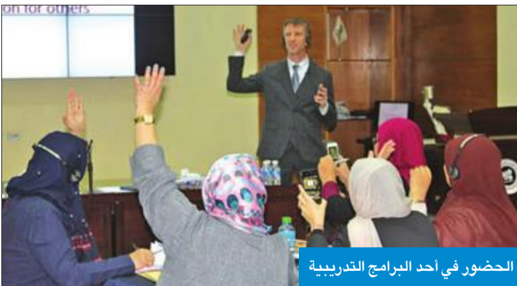
الحضور في أحد البرامج التدريبية

البحث من خلال المحتوى العلمي، ووزارة بيئة ديناميكية للتعليم المتعدد التخصصات والأنشطة التعليمية القيمة. وذكرت أن «البرنامج التدريبي من البرامج المعتمدة في أميركا والاتحاد الأوروبي لتطوير التعليم»، مؤكداً أن مركز تقويم وتعليم الطفل سينظم خلال 2020 دورات تدريبية مشابهة لهذا المستوى العالي مع المؤسسات التربوية الرائدة من مجلس مدارس إلينوي والاتحاد الأوروبي.