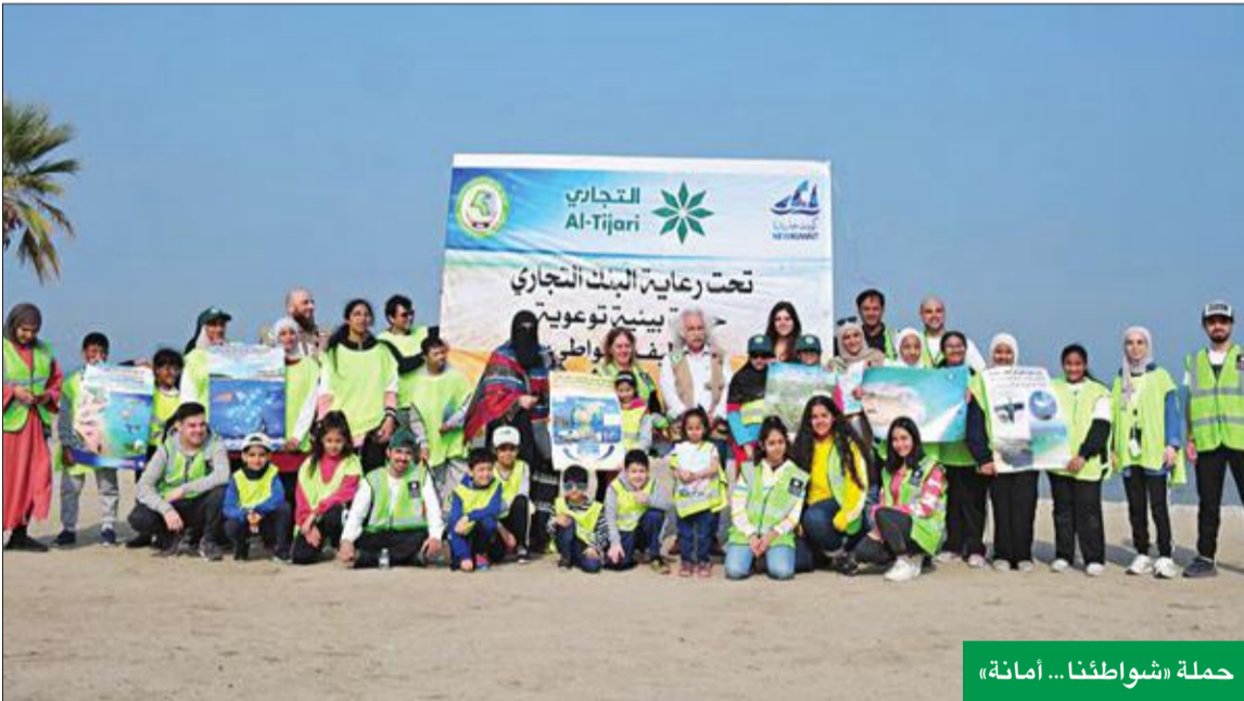
حملة «شواطئنا... أمانة»

كان عام 2019 حافلاً بالنشاطات الاجتماعية بالنسبة للبنك التجاري الكويتي، حيث عمد قطاع التواصل المؤسسي الى ترسيخ مكانة البنك في مجال المسؤولية الاجتماعية، من خلال تقديم الرعاية والمشاركة في الفعاليات الاجتماعية المختلفة، والأنشطة المتنوعة في شتى مجالات العمل الإنساني والخيري التي تؤكد اهتمام البنك بخلق قيمة اجتماعية مضافة، والمساهمة في عملية التنمية المستدامة، وتحقيق أثر إيجابي يترك بصمته على فئات المجتمع