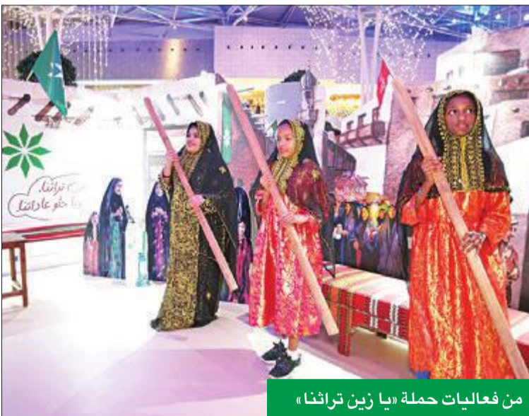
من فعاليات حملة «يا زين تراثنا»