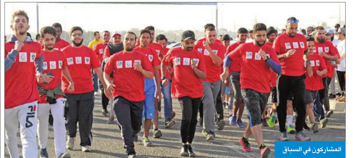
المشاركون في السباق

الصحي من خلال ممارسة رياضة المشي، وتغيير السلوكيات والمفاهيم الصحية الخاطئة، ونشر الوعي الصحي بين أفراد المجتمع.