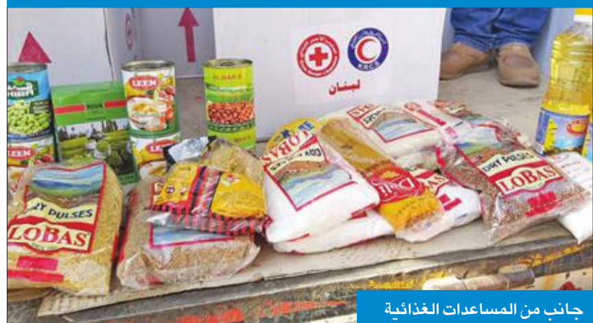
جانب من المساعدات الغذائية

وأشار إلى أن الحملة الإنسانية تتضمن أيضا توزيع 6000 رغيف يوميا خلال شهر في إطار مشروع الرغيف على الأسر اللبنانية في مدينة طرابلس بالإضافة إلى أسر اللاجئين الفلسطينيين في مخيم البداوي شمالي لبنان. وأوضح الرشدي أن المساعدات وزعتها الجمعية بالتعاون مع الصليب الأحمر اللبناني وبالتنسيق مع سفارة الكويت لدى لبنان. كما أعلنت جمعية الهلال الأحمر الكويتي عن تسيير 5 شاحنات محملة بمواد غذائية ومطابخ وملابس للاجئين السوريين في الأردن ولبنان إلى الدعم والمؤازرة مشيراً إلى استمرار تقديم المساعدات الإنسانية للاجئين على مدار العام والتي تشمل الغذاء والكساء وأدوات النظافة والرعاية الصحية.