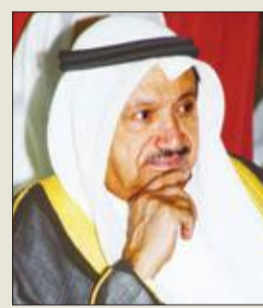
ويلهم أهله وذويه الصبر والسلوان... وإنا لله وإنا إليه راجعون» 04+