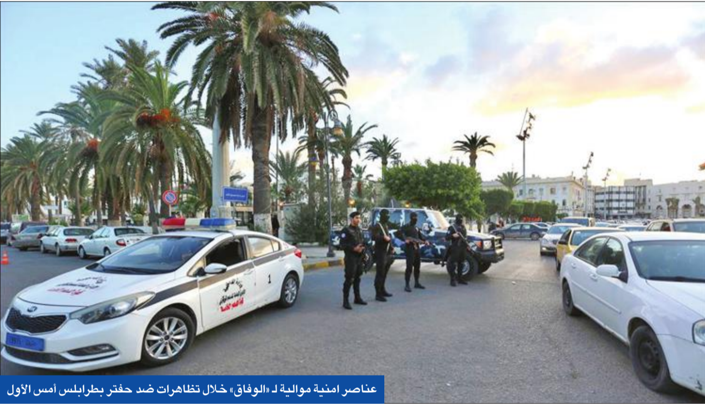
عناصر أمنية موالية لـ «الوفاق» خلال تظاهرات ضد حفتر بطرابلس أمس الأول

● خطة أنقرة تشمل حماية بحرية لطرابلس وحكومتها قبلت ميليشيات تركمانية تحت ضغط حفتر ● صالح يحصل على دعم قبرص لسحب الاعتراف بالسراج... وروما تدعو إلى فرض حظر جوي