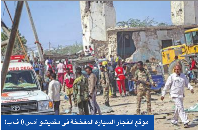
موقع انفجار السيارة المفخخة في مقديشو أمس

100 قتيل بانفجار سيارة مفخخة في نقطة لتحصيل الرسوم