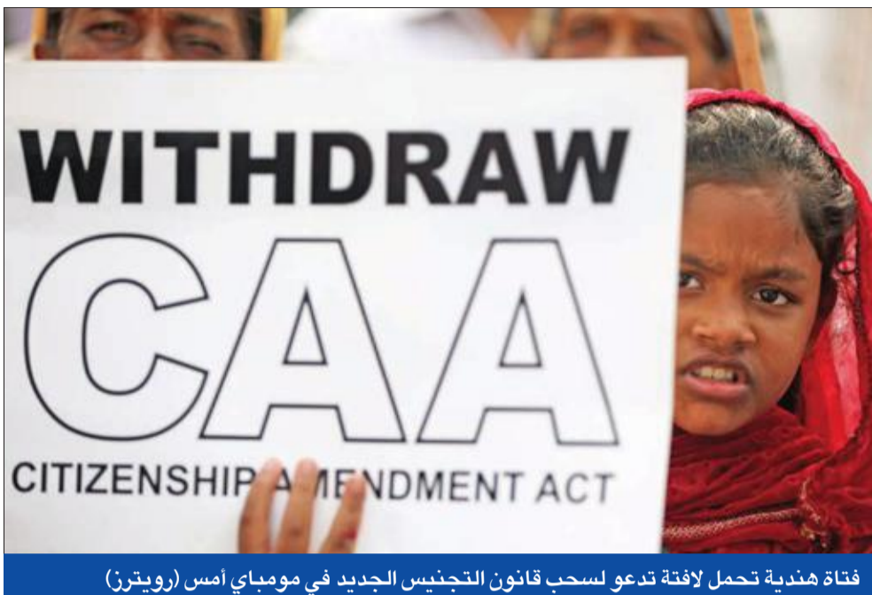
فتاة هندية تحمل لافتة تدعو لسحب قانون التجنيس الجديد في مومباي أمس

● كاهن هندوسي متطرف يحكم ولاية يدافع عن القمع ● ضابط شرطة رفيع يدعو المتظاهرين إلى الرحيل لباكستان