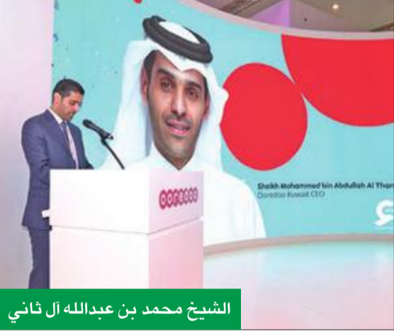
الشيخ محمد بن عبدالله آل ثاني