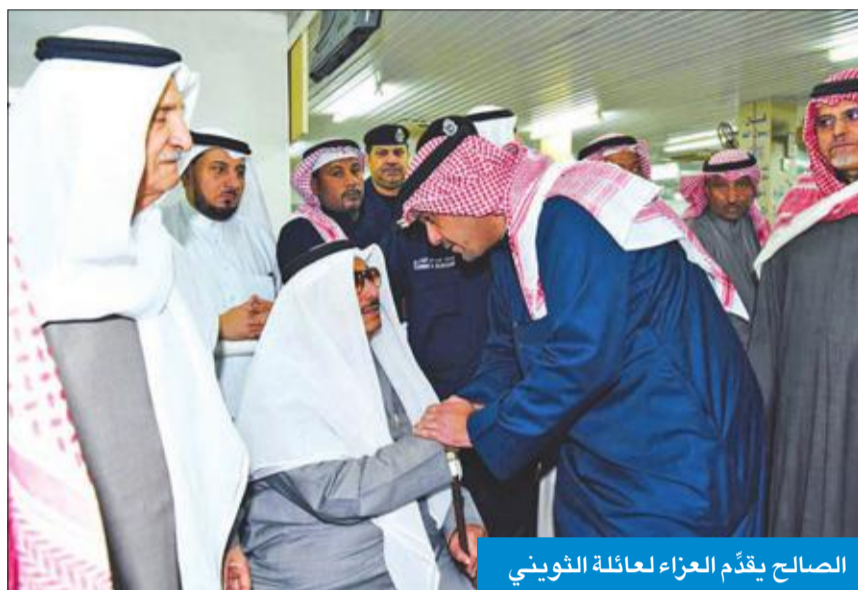
الصالح يقدّم العزاء لعائلة الثويني

سجل حافل بالإنجازات... ومواجهة العابثين بالأمن هاجسه طوال حياته الوظيفية