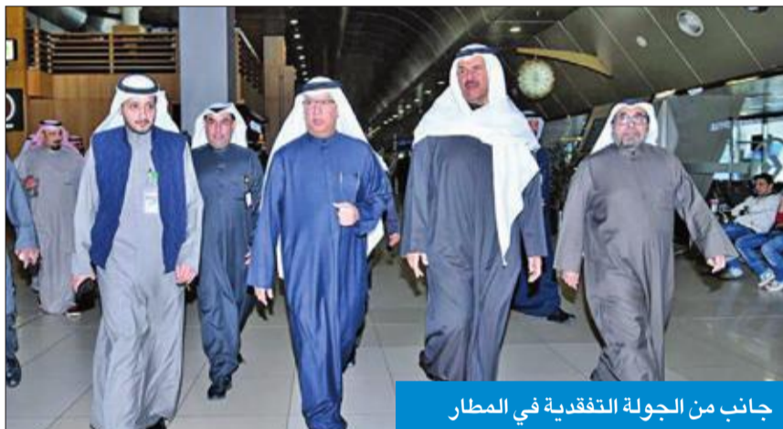
جانب من الجولة التفقدية في المطار

وأشار الحريص إلى أنه اجتمع مع رئيس الإدارة العامة للطيران المدني وعدد من قياديي الإدارة واستمع إلى شرح مفصل عن آلية عمل الإدارة وكذلك الملاحظات التي تعيق العمل لديهم، ووعد بتذليل كافة المعوقات التي من شأنها عرقلة سير العمل في هذا المرفق الحيوي. وأكد الحريص أن مطار الكويت الدولي يعتبر البوابة الأولى لضيق الكويت واجهتها الحضارية التي تضعهم أمام مسؤوليات كبيرة، مبيناً أن مشروع العمل لخدمة الكويت في هذا المرفق الحيوي يتطلب من الجميع التقاني في العمل لعكس الوجهة المشرق للبلاد وحسن