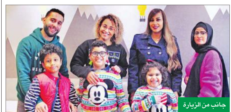
جانب من الزيارة

تماشياً مع مبادئ بنك برقان، كمؤسسة مالية كويتية رائدة، بحيث ينسجم أسلوب سياساته مع احتياجات ومصالح المجتمع.