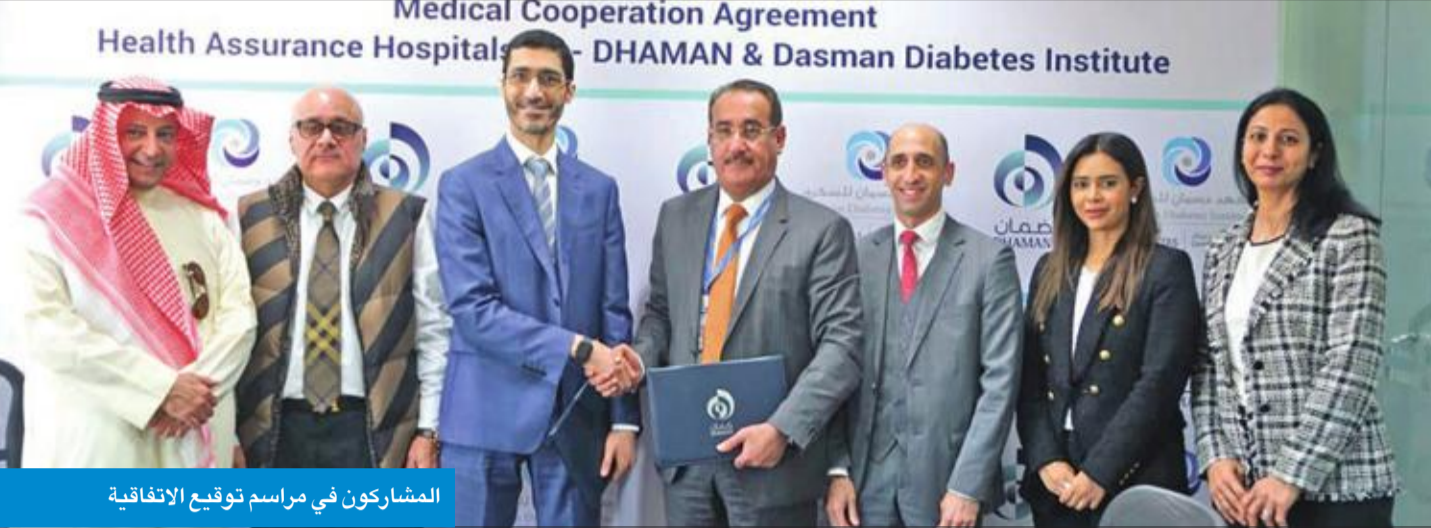
المشاركون في مراسم توقيع الاتفاقية

لتقديم خدمات طبية وتدريبية مميزة لمرضاها ومراجعيها