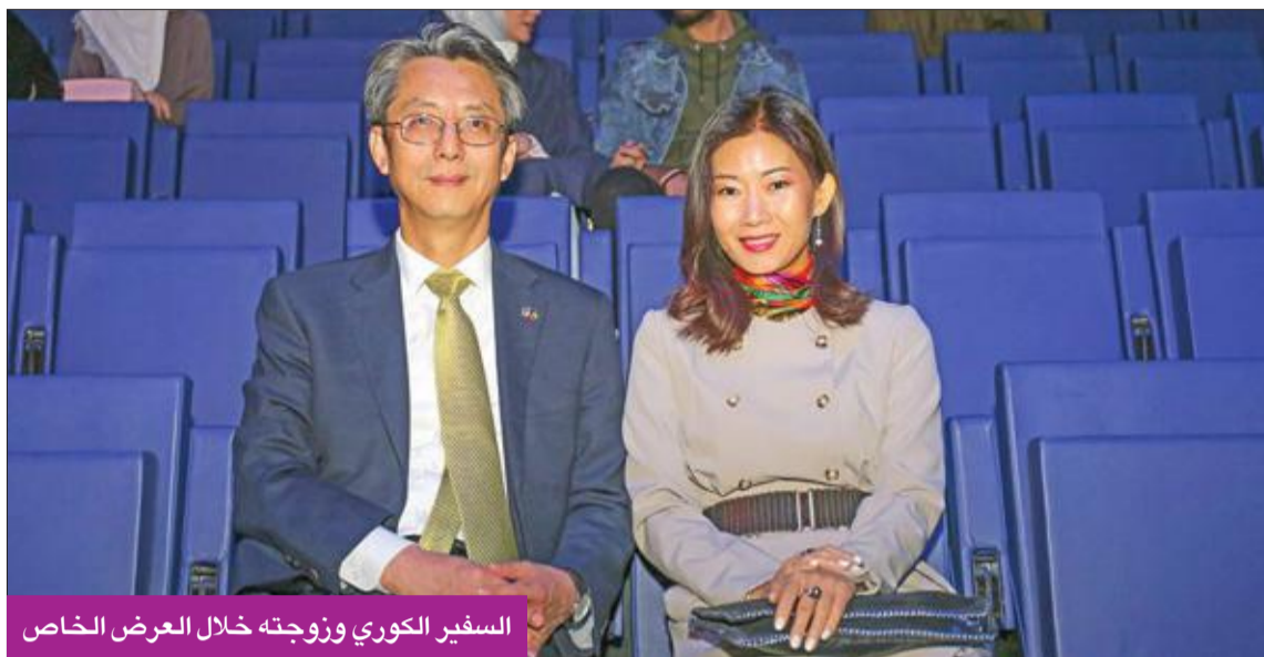
السفير الكوري وزوجته خلال العرض الخاص

وتأتي هذه المناسبة جزءاً من الاحتفال بالذكرى الأربعين لبدء العلاقات الدبلوماسية بين كوريا الجنوبية، والكويت. ويحتفل مركز الشيخ عبدالله