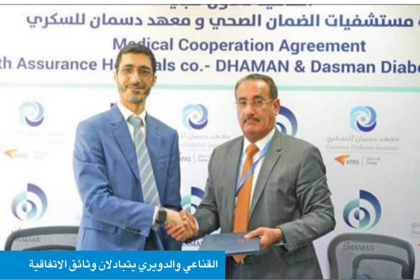
القناعي والدوري يتبادلان وثائق الاتفاقية

العلمية، من خلال التعاون مع الطاقم الطبي في ضمان، وتقديم خدمات تدريبية وفرص بحثية لهم.