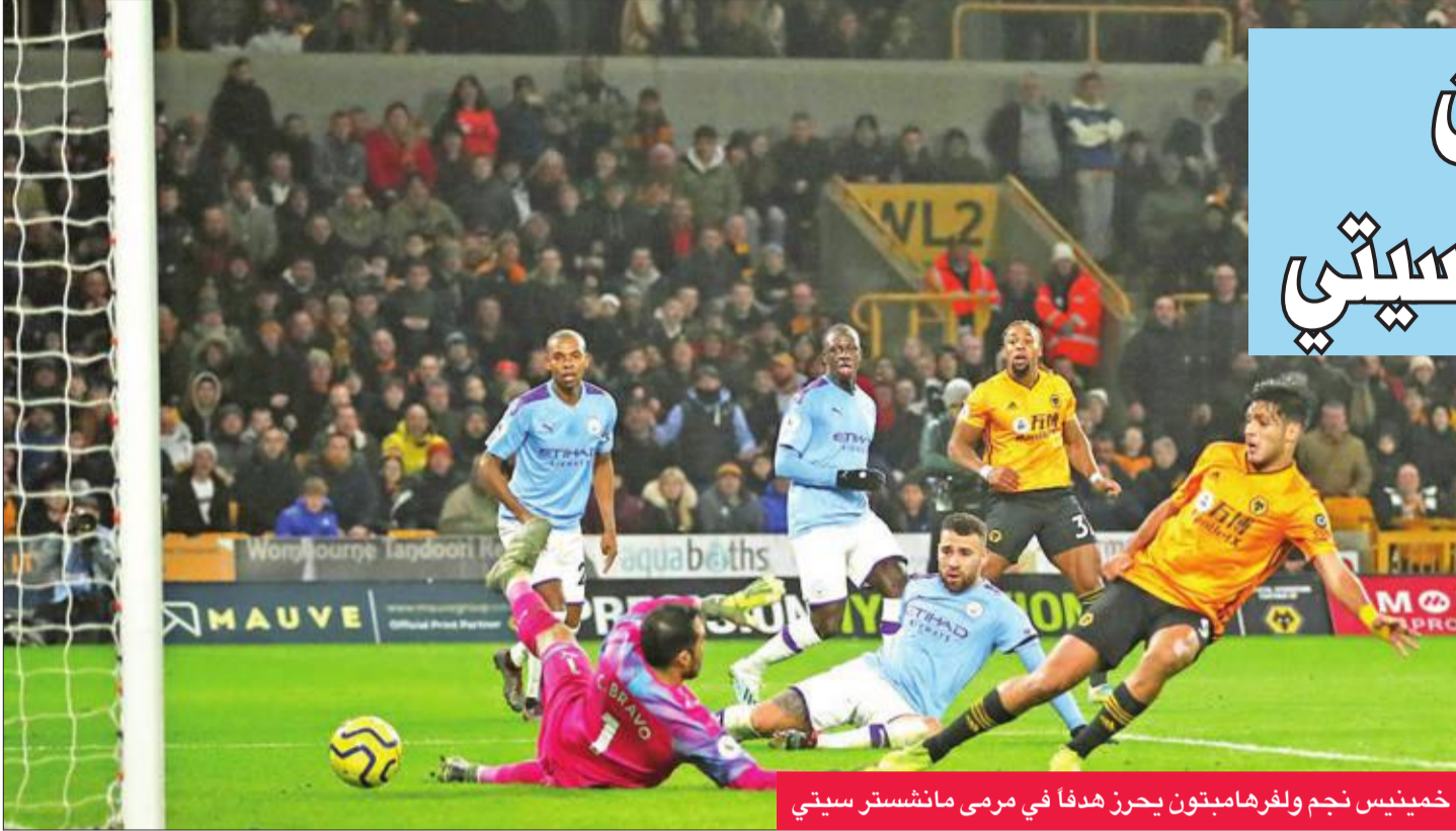
خمينيس نجم ولفرهامبتون يحرز هدفا في مرمى مانشستر سيتي

أحرز مات دوهرتي هدفا رائعا في الدقيقة قبل الأخيرة ليقود ولفرهامبتون واندرارز إلى فوز مثير 2-3 على 10 لاعبين من مانشستر سيتي، حامل لقب الدوري الإنجليزي الممتاز لكرة القدم، أمس الأول. قلب ولفرهامبتون تأخره صفر-2 أمام ضيفه مانشستر سيتي في فوز 2-3، في ختام المرحلة التاسعة عشرة من الدوري الإنجليزي الممتاز لكرة القدم، ليصعب كثيرا مهمة الخاسر في الاحتفاظ بلقبه موسما ثالثا تواليا. ويعود الفضل في هذه «الريمونتادا» إلى الثلاثي المالي أداما تراوري (55) والمكسيكي راوول خمينيس (82) والأيروني مات دوهرتي (89) أصحاب الأهداف الثلاثة، بعدما كان الضيوف تقدموا بهدفين عن طريق رديم ستيرلينغ (25 و50). وهي الخسارة الخامسة للسيتي في الموسم الحالي، ليتجمد رصيده عند 38 نقطة في المركز الثالث، بفارق نقطة خلف ليستر الثاني، وبعيدا 14 نقطة عن ليفربول المتصدر، علما أن الأخير يملك مباراة مؤجلة، في حين ارتقى ولفرهامبتون إلى المركز الخامس برصيد 30 نقطة. وخاض السيتي المباراة في غياب مهاجمه البرازيلي