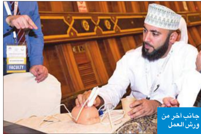
جانب آخر من ورش العمل