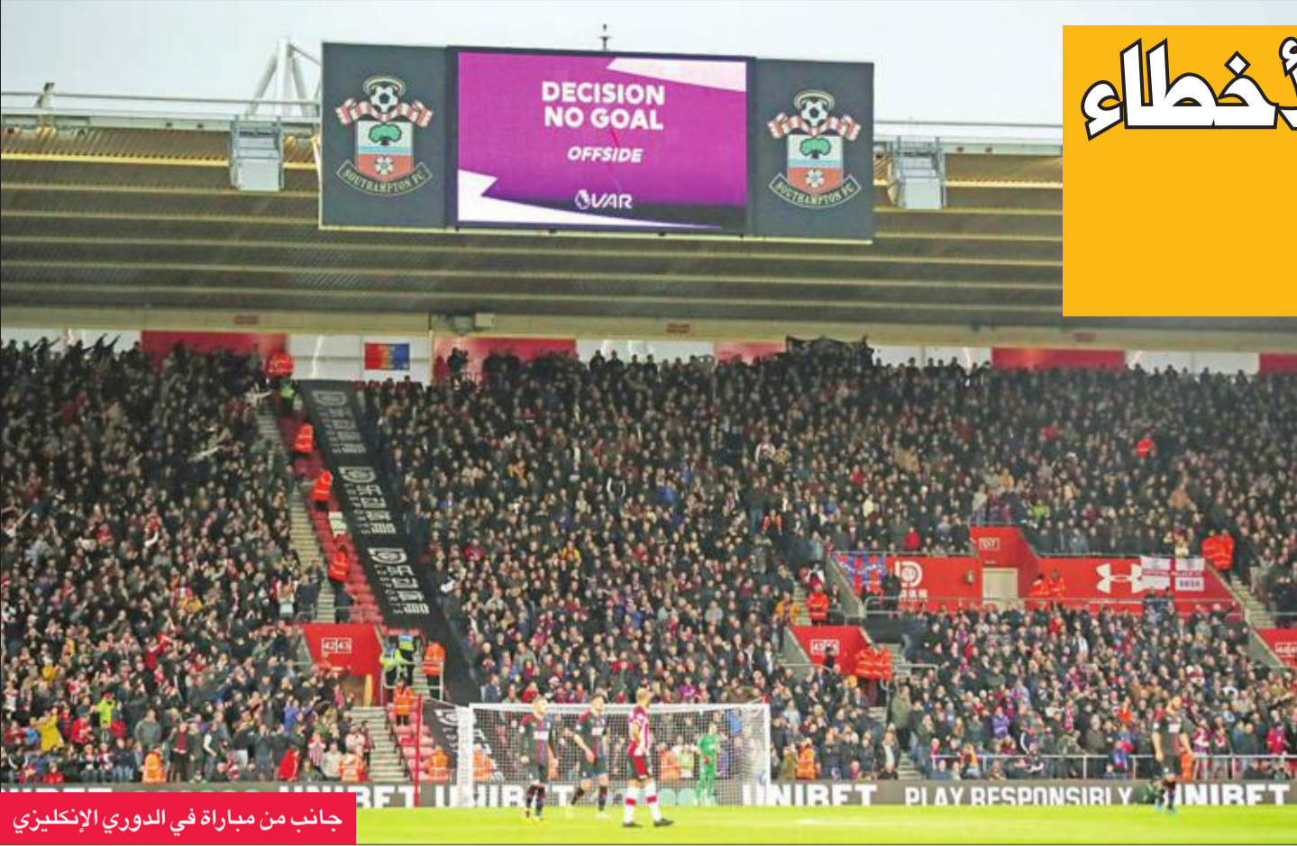
جانبا من مباراة في الدوري الإنجليزي