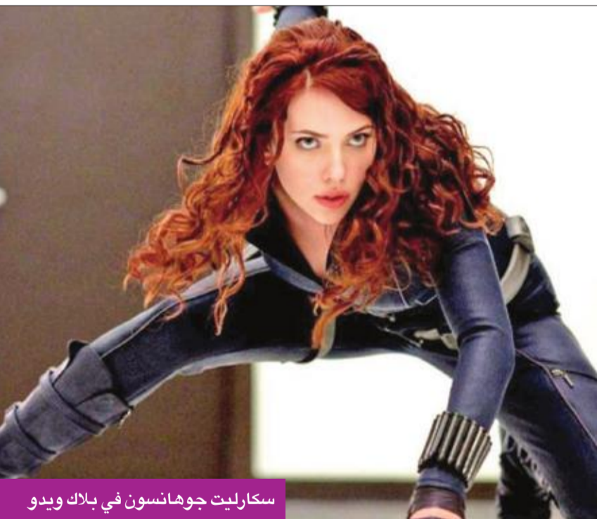
سكارليت جوهانسون في بلاك ويدو

المالك الثري لسلسلة متاجر أزياء راقية، وهو على وشك الاحتفال بعيد ميلاده الستين في جزيرة ميكونوس اليونانية. ويتخذ الفيلم، من خلال مقارنات مع الحياة الواقعية، التباهي المبالغ فيه بالثروة، والفكر الاستهلاكي الواضح وعولمة العمل. وتصدر الفيلم عواضين الصحف في وقت سابق من هذا العام، عندما أصيب ممثل بديل، أثناء التصوير في استوديوهات وارنر برونز في مقاطعة هيوستون بولاية تكساس. وتعمل أنجلينا جولي في فيلم «إيترنالز» على قيادة مجموعة من الكائنات الخارقة الخالدة من إنتاج شركة مارفل سينماتيك يونيفرس، ويشارك في الفيلم، الذي تخرجه كلوي تشاو، سلمى حايك وريتشارد مادن وكوميل نانجانجني. وفي نوفمبر الماضي أجلبت أنجلينا جولي وريتشارد مادن ومجموعة من طاقم العمل من إحدى جزر الكاريبي، حيث كان يجري تصوير الفيلم، بعد العثور على قنبلة غير منفجرة.