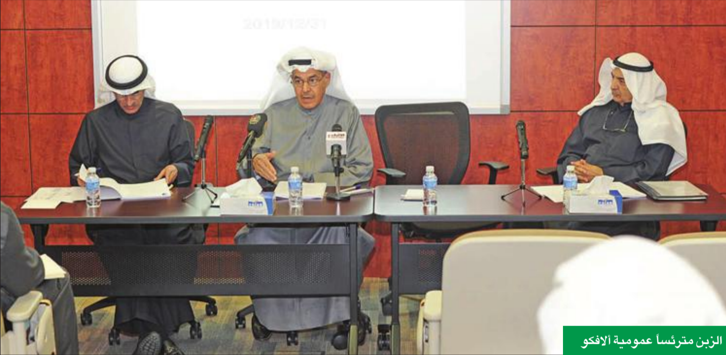
الزبن مترئساً عمومية ألفكو

الزبن: وفق استراتيجيتها مع بداية العقد القادم • عموميتها وزعت أرباحاً نقدية بواقع 8%