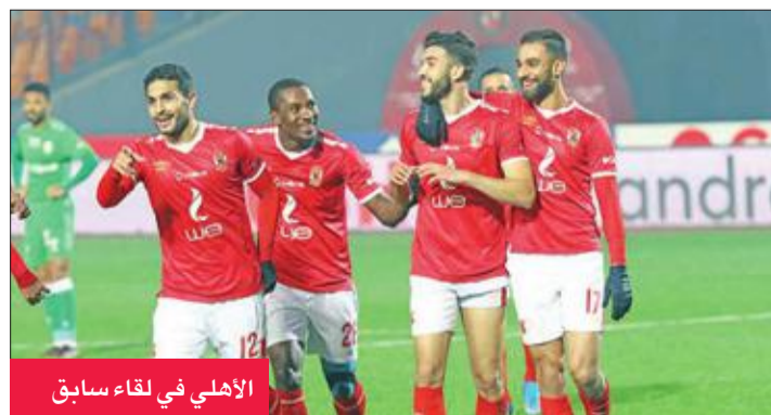
الأهلي في لقاء سابق

النفسية مع اللاعبين، وطالبهم بضرورة نسيان الفترة الماضية، والتركيز في مواجهة الأهلي التي يعتبرها طوق النجاة من سلسلة النتائج السلبية التي يحققها الفريق والتي وضعت في المركز الـ 13 برصيد 9 نقاط فقط.