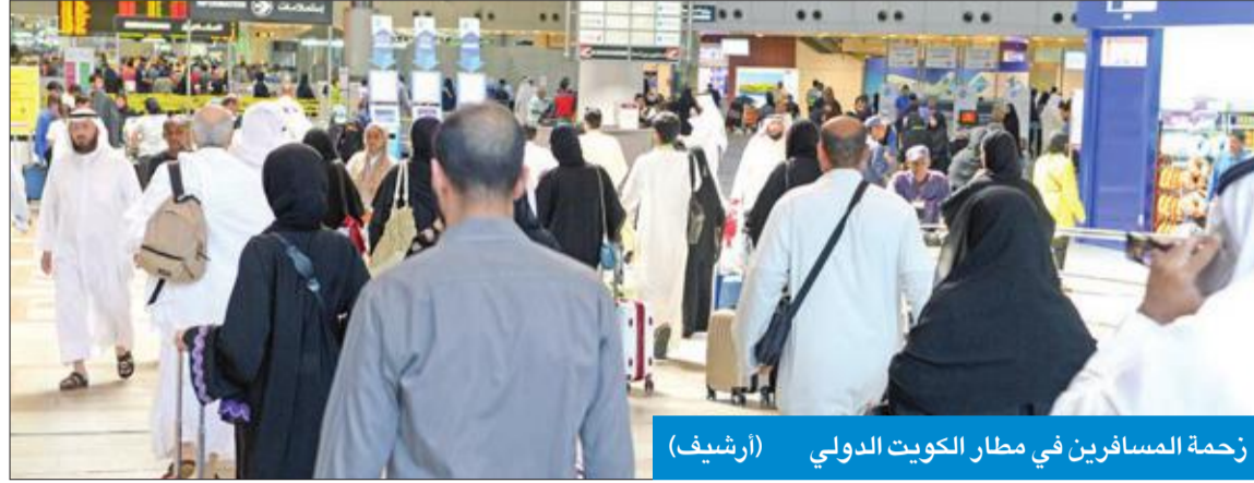
زحمة المسافرين في مطار الكويت الدولي (أرشيف)

فالقبرين ثم إسطنبول ثم عمان ثم الرياض ثم لندن، في الوقت الذي اختار 112455 مسافرا وجهات أخرى لقضاء الإجازة في دول أخرى. وإستأثر مبنى الركاب T1 بنصيب الأسد من عدد الرحلات خلال إجازة العام الجديد بإجمالي 883 رحلة تضم 126238 مسافرا، يليه