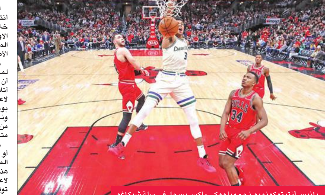
يانيس أنتيتوكونيمو نجم ميلووكي باكس يسجل في سلة شيكاغو

أنهى ميلووكي باكس ونجمه اليوناني يانيس أنتيتوكونيمو 2019 بأفضل طريقة، وذلك من خلال الفوز على شيكاغو بولز 123-102، أمس الأول، في المباراة الأخيرة لهذا العام لمتصدر المنطقة الشرقية وترتيب دوري كرة السلة الأميركي للمحترفين. وبعد ان غاب عن المباراتين الأخيرتين لميلووكي بسبب أوجاع في ظهره من دون أن يجمع ذلك فريقه من الخروج منتصرا على أتلانتا هوكس ثم أورلاندو ماجيك، عاد أفضل لاعب الموسم الماضي إلى كتبة المدرب مايك بودنهولتس في مباراتها الأخيرة لهذا العام، ونجح في قيادتها للفوز الثالث تواليا والثلاثين من أصل 35 مباراة، بتسجيله 23 نقطة مع 10 متابعات في غضون 27 دقيقة فقط. ووصل اليوناني إلى حاجز العشرين نقطة أو أكثر مع 10 متابعات أو أكثر للمرة الـ11 هذا الموسم بمشاركة مدة 30 دقيقة أو أقل في هذه المباريات الـ11، وهو إنجاز لم يسبق لأي لاعب أن حققه في الدوري منذ اعتماد ساعة توقيت الهجمة (30 ثانية منذ 1967 حتى 1975