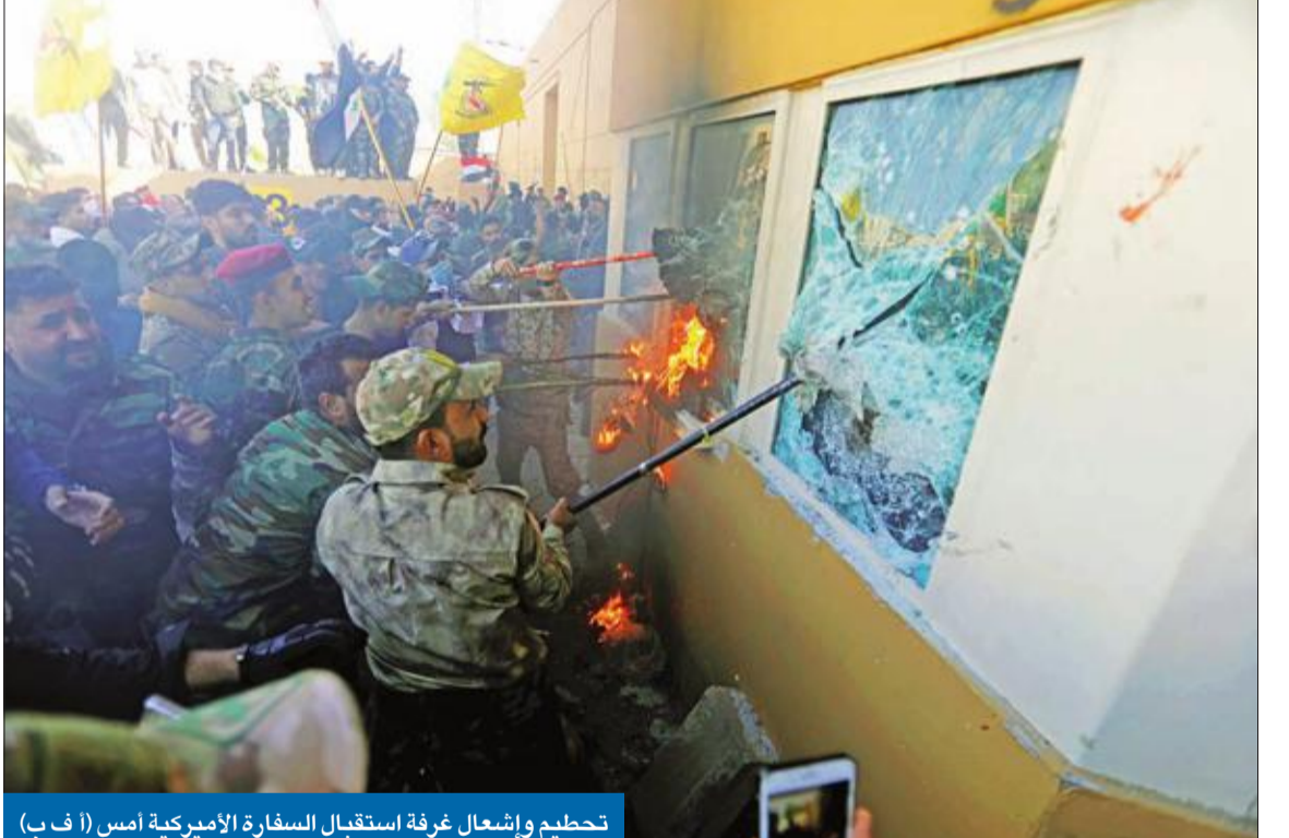
تحطيم وإشعال غرفة استقبال السفارة الأميركية أمس (أ ف ب)

حاصر سفارة واشنطن في بغداد وأحرق محيطها بحضور العامري والخزعلي ترامب يتهم طهران ويحملها المسؤولية... وبومبيو يتعهد بحماية الأميركيين