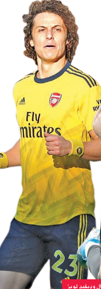
مارسيال وديفيد لويز

وهذا ما شدد عليه المدرب الإسباني بالقول "فريق بارقام مماثلة لليفربول، لماذا نتكبد مشقة التفكير في الأمر حين تكون بعيداً عنه بهذا العدد من النقاط. كل ما عليك فعله (الآن) هو اللقب بشكل جيد، وأن تكون قريباً قدر