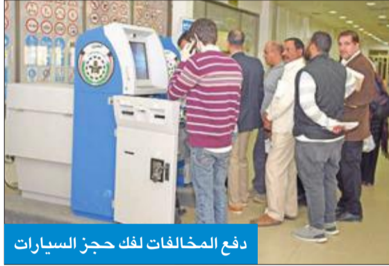
دفع المخالفات لفك حجز السيارات

أوضح السهلي أن عدد الأشخاص الذين تم حجزهم في نظارة المرور خلال عام 2019 بلغ 3088 شخصاً، في حين بلغ عدد رخص القيادة المسحوبة 86 ألفاً و215 رخصة قيادة، وبلغ عدد رخص القيادة المسحوبة وفقاً لنظام النقاط 2083 رخصة، مشيراً إلى أن عدد كاميرات الضبط المروري الموزعة على الطرق الدائرية والرئيسية والداخلية بلغ 373 كاميرا، منها 203 كاميرات لضبط السرعة و152 كاميرا لضبط الإشارة الضوئية الحمراء، و18 كاميرا سيارة متنقلة.