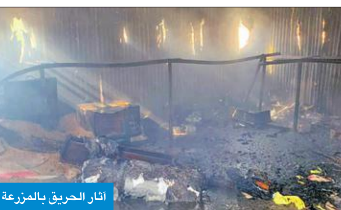
آثار الحريق بالمزرعة

تبلغ مساحته 100 متر مربع، وبأشرف رجال الإطفاء مكافحة النيران، وتمكنوا من محاصرتها وإخمادها في وقت قياسي، وحالوا دون وصولها إلى مواقع أخرى بالمزرعة.