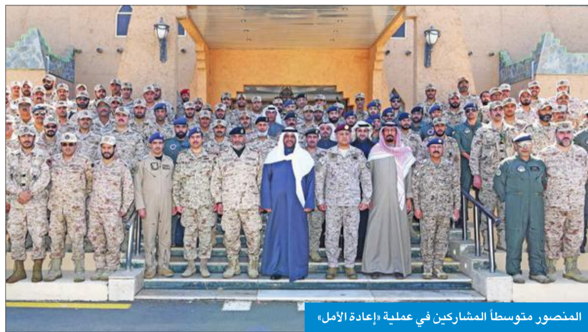
المنصور متوسلاً المشاركين في عملية «إعادة الأمل»

وعاد نائب رئيس مجلس الوزراء وزير الدفاع والوفد المرافق له إلى البلاد، مساء أمس، حيث كان في استقباله، لحظة وصوله، رئيس الأركان العامة