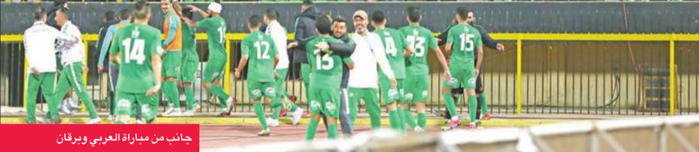
جانب من مباراة العربي وبرقان

من العرق والجهد مع محالفة التوفيق لهما، أو لاي منهما. والمهمة بالنسبة لهما صعبة جداً، لكنها غير مستحيلة، خصوصاً أن خيطان لعب في الموسم الرياضي 2010-2011 المباراة النهائية أمام الكويت!