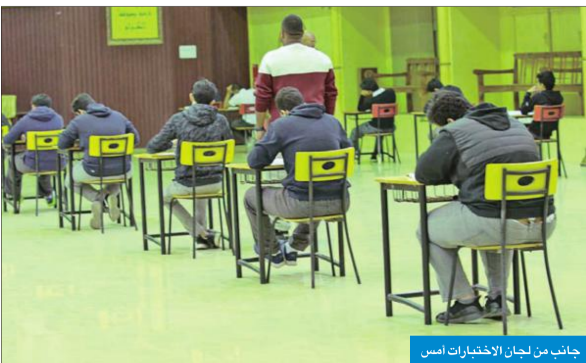
جانب من لجان الاختبارات أمس