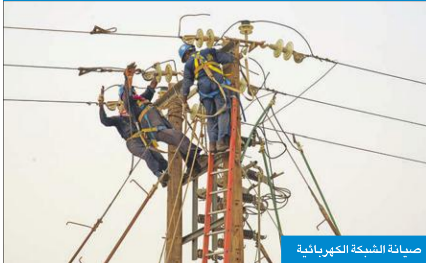
صيانة الشبكة الكهربائية

وذكرت مصادر "الكهرباء"، لـ "الجريدة"، أن