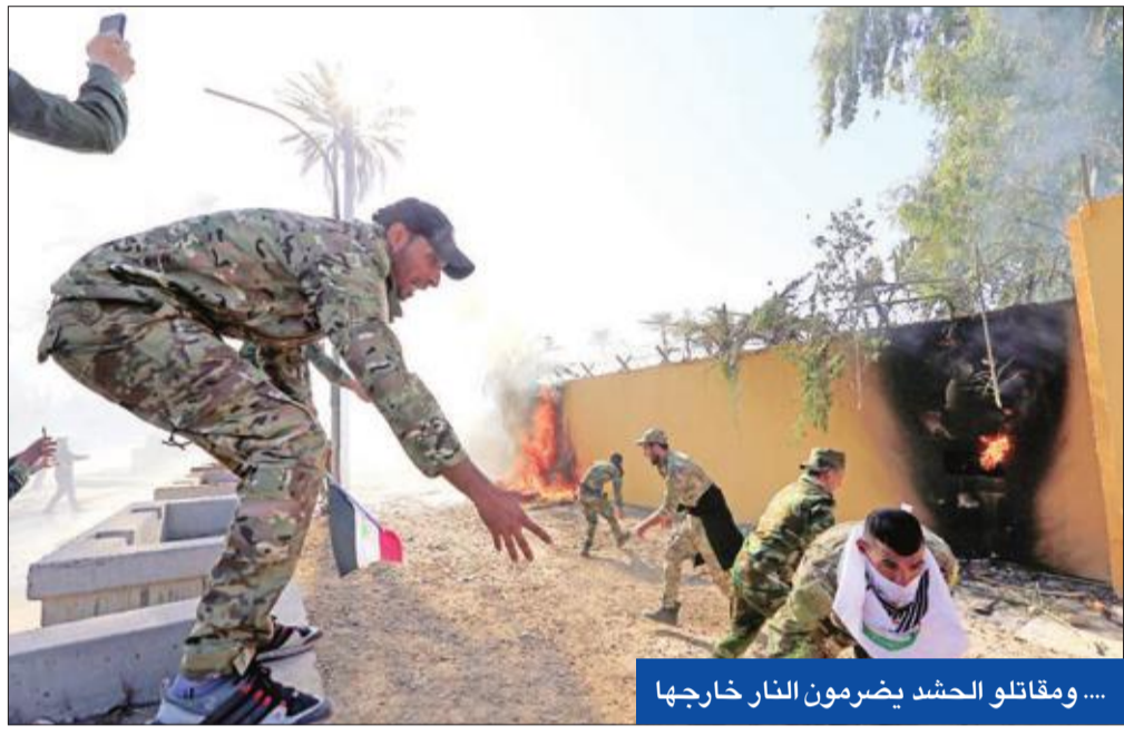
... ومقاتلو الحشد يضرمون النار خارجها