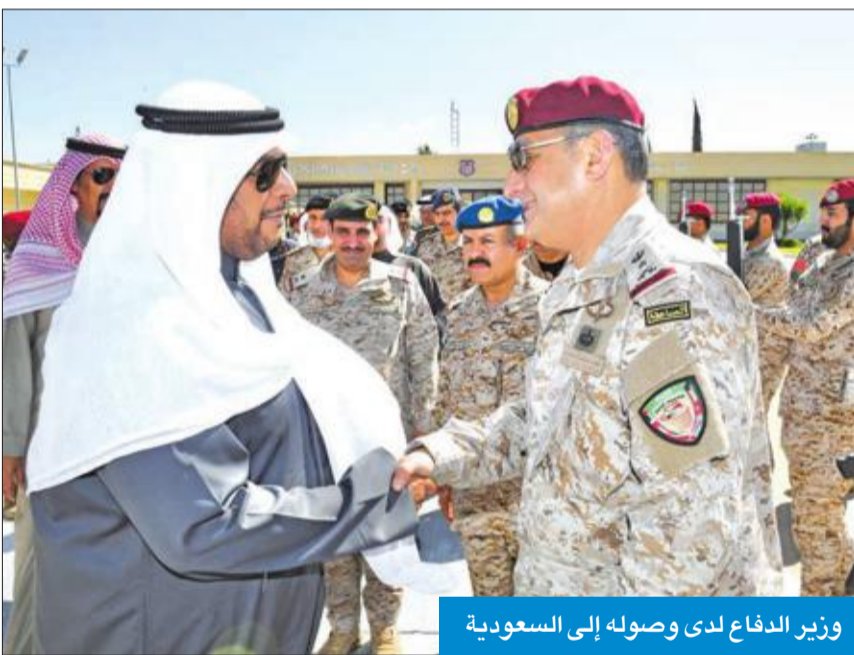
وزير الدفاع لدى وصوله إلى السعودية