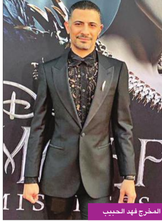
المخرج فهد الحبيب