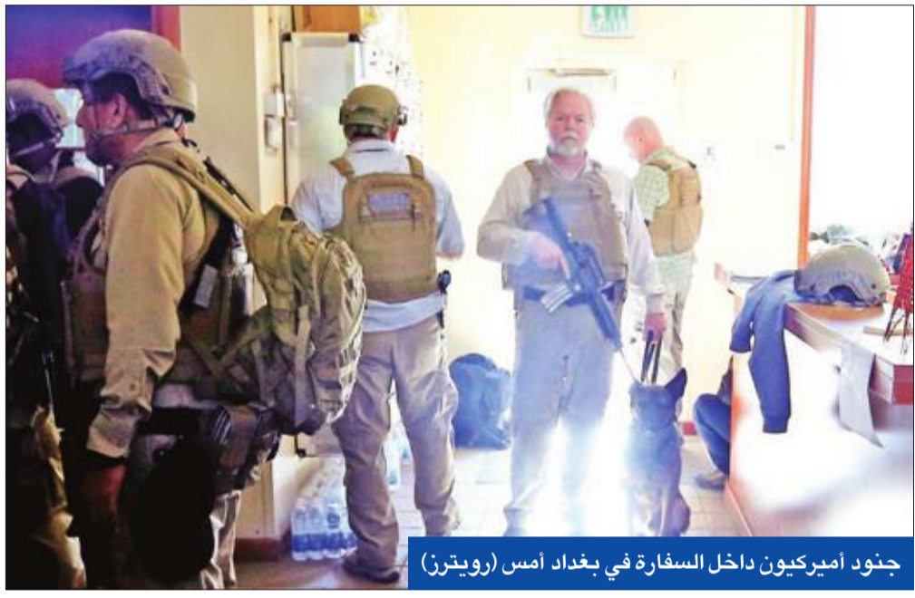
جنود أميركيون داخل السفارة في بغداد أمس

المحادثات السياسية في العراق، المتعلقة باختيار شخصية رئيس الوزراء المقبل، إثر الغارة الأميركية وسط انشغال تحالف «الفتح»، الذي يضم فصائل الحشد بالرد على الهجوم الأميركي غير المسبوق. وبعد استقالة رئيس الوزراء العراقي، عادل عبدالمهدي، مطلع الشهر الجاري، إثر الاحتجاجات الشعبية، أضح السجال بين الكتل السياسية، بشأن ترشيح شخصية أخرى للمنصب، وسط خلافات حول الكتلة الكبرى التي يحق لها تقديم مرشحها، في حين يقول تحالف «ساترون» التابع لمقتدى الصدر، بأنه هو الكتلة الكبرى، يرى تحالف «البناء»، الذي يضم قوى موالية لإيران، وسنة، بأنه الأكبر ويحق له تقديم المرشح.