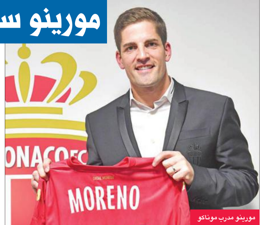
مورينو مدرب موناكو

فشل خليفته النجم الفرنسي السابق تيري هنري في تحسين نتائجه. ويحتل موناكو حالياً المركز السابع، وهو أنهى العام بفوز كبير على ضيفه ليل 5-1 في المرحلة التاسعة عشرة من الدوري، على أن يبدأ مشواره مع مدربه الجديد اعتباراً من السبت حين يلتقي رينس على أرضه في الدور الـ32 من مسابقة كأس فرنسا قبل أن يخوض اختباراً صعباً جداً في مباراته التالية في الدوري ضد باريس سان جرمان حامل اللقب والمتصدر في 15 الشهر المقبل.