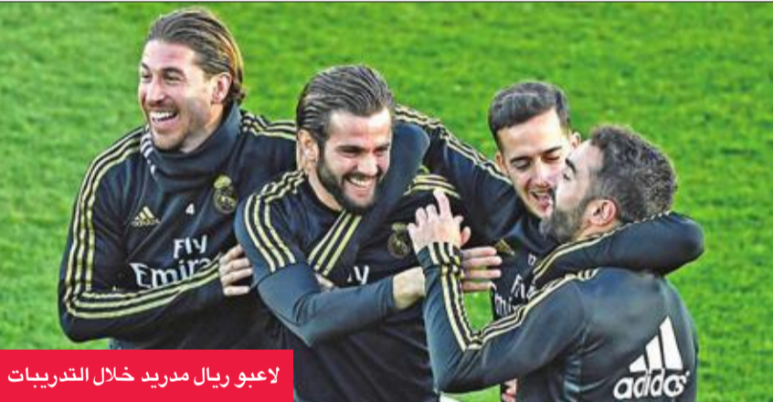
لاعبو ريال مدريد خلال التدريبات

خروج المغلوب من نصف النهائي، وسيلتقي "الميرينغي" في 8 يناير المقبل بالفنسيا، بطل كأس الملك، على ملعب مدينة الملك عبد الله الرياضية في