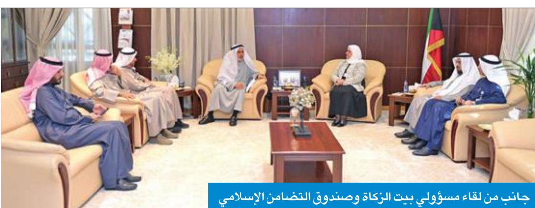
جانب من لقاء مسؤولي بيت الزكاة وصندوق التضامن الإسلامي

المجتمعات الفقيرة من خلال نشر الثقافة والتعليم، وفقاً للوائح والنظم التي تحكم عمل البيت وبما يتوافق مع رغبات المتبرعين وبالتنسيق والتعاون مع وزارة الخارجية.