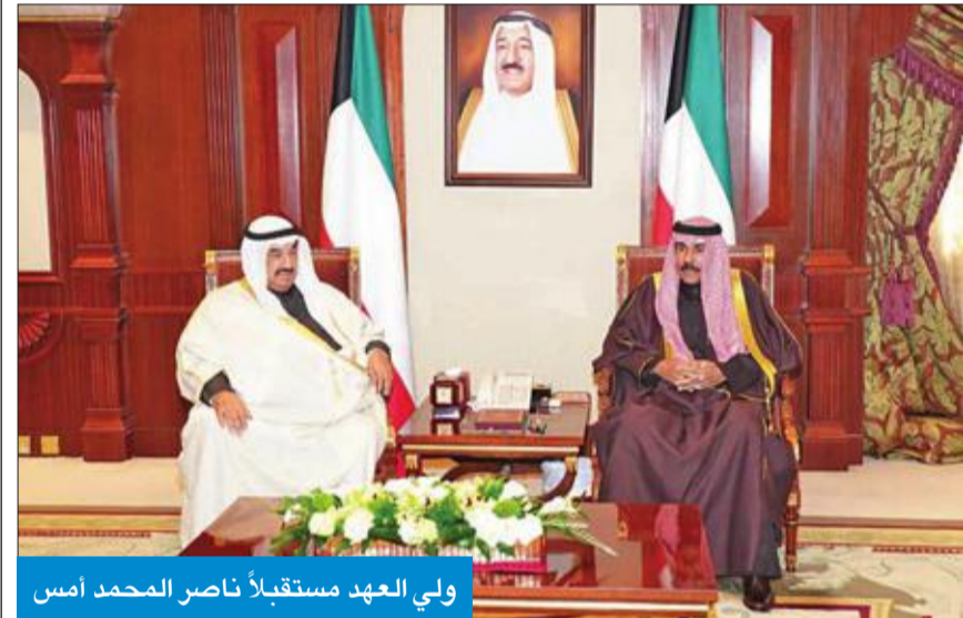
ولي العهد مستقبلاً ناصر المحمد أمس

استقبل سمو ولي العهد الشيخ نواف الأحمد، بقرص بيان، صباح أمس، سمو الشيخ ناصر المحمد.