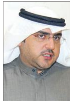
عبد الكريم الكندري

طالب النائب د. عبد الكريم الكندري وزير الصحة د. باسل الصباح بتشكيل لجنة تحقيق للوقوف على حالة وفاة إحدى المدرسات. وقال الكندري: بسبب الإهمال والتفرقة بين المواطنين في توفير الخدمات والاستهتار بارواح الناس على وزير الصحة تشكيل لجنة تحقيق للوقوف على حالة وفاة المدرسة نوال الكندري واتخاذ كافة الإجراءات بحق المتسببين وإحالتهم إلى النيابة.