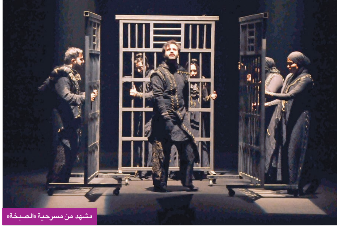
مشهد من مسرحية «الصبخة»

المجتمع الذكوري، بتعقيداته، والمعاناة التي يخلفها على شكل علاقات اجتماعية مشوّهة لا أحد يريد الاعتراف بها، وتتناقلها الأجيال من خلال