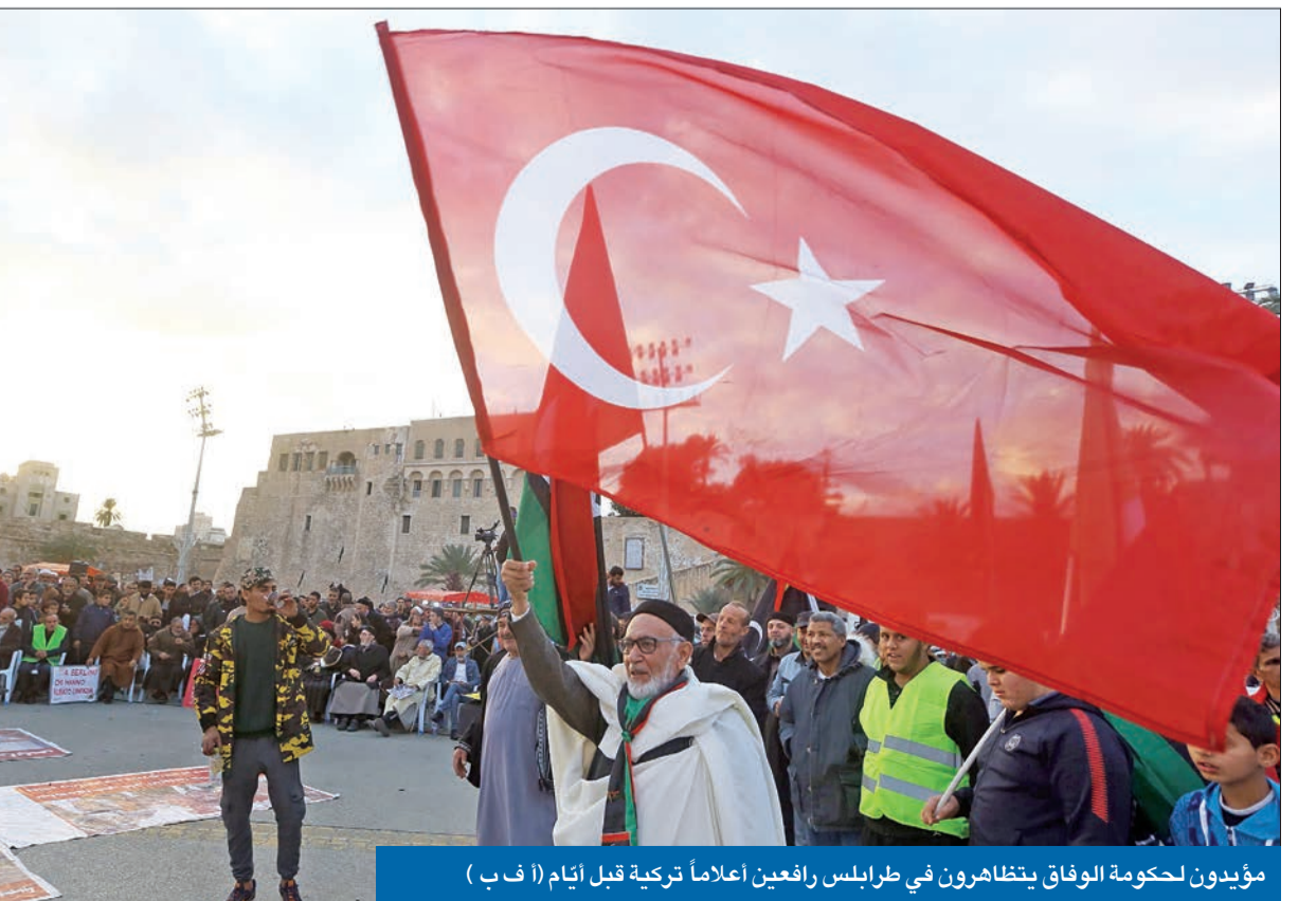
مؤيدون لحكومة الوفاق يتظاهرون في طرابلس رافعين أعلاماً تركية قبل أيام

من أنقرة وموسكو ومباحثات دبلوماسية مكثفة فرضتها الخشية من تدويل إضافي للنزاع. وأعلن رجل شرق ليبيا النافذ المشير خليفة حفتر، الذي يسعى منذ أبريل الماضي إلى السيطرة على طرابلس، الاتفاق قبل دخوله حين التنفيذ، منتصف ليل السبت - الأحد. وبعد عدة ساعات، أعلن السراج موافقته كذلك على وقف إطلاق النار، لكنه شدد على «الحق المشروع» لقوات حكومته في «الرد على أي هجوم أو عدوان». ومساء أمس الأول، نددت الولايات المتحدة، التي لا تستسيغ الإنخراط الروسي المتنامي في ليبيا، بد النشر المرتزقة الروس (..) والمقاتلين السوريين المدعومين من