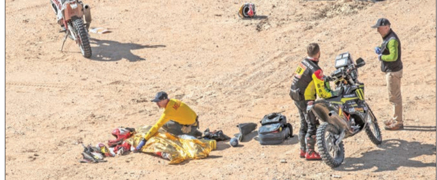
الدراج البرتغالي باولو بعد أن لقي حتفه

أعلن منظمو رالي دكار الصحراوي المقام في السعودية، وفاة الدراج البرتغالي باولو غونسالفيس، بعد سقوطه في المرحلة السابعة بين الرياض ووادي الدواسر، أمس. وأشار المنظمون إلى أن غونسالفيس (40 عاماً)، الذي كان يشارك في الرالي للمرة الثالثة عشرة وحل ثانياً في فئة الدراجات الثابتة عام 2015، سقط عند الكيلومتر 276 من المرحلة.