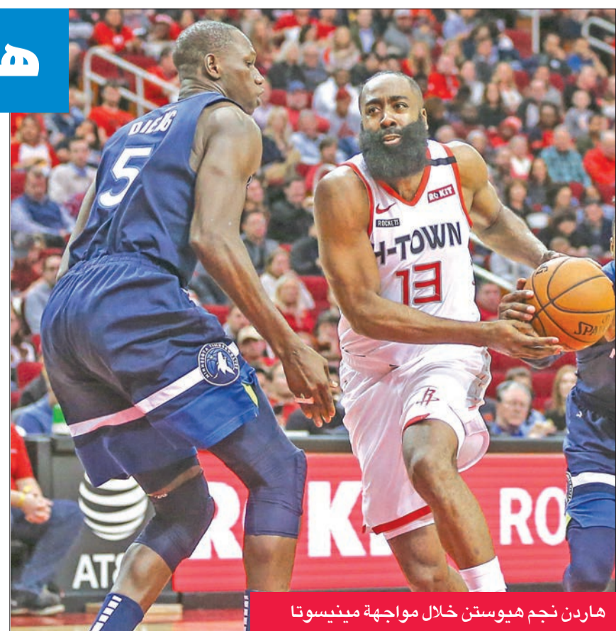
هاردن نجم هيوستن خلال مواجهة مينيسوتا

وبلغ اللاعب عتبة الـ 20 ألف نقطة بتسجيله رمية ثلاثية مع تبقي 6:30 دقائق في الربع الثاني من المباراة التي هيمن عليها هيوستن بشكل كامل. وفي أبرز المباريات الأخرى، قاد اليوناني