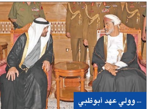
... وولي عهد أبوظبي