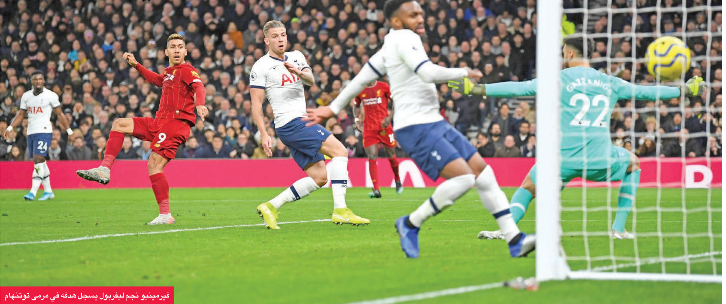
فيريمنو نجم ليفربول يسجل هدفة في مرمى توتنهام

تواليا، واكتفى بالتعادل على أرض كريستال 1-1. ضيفه نوريتش سيتي متذيل الشوط الأول وهز شبك مضيفه بكرة متقنة من الغابوني بيار اميريك أوباميانغ (12)، لكن في الثاني عادل بالاس عبر الغاني جوردان أيوو (54). وبعد أقل من ربع ساعة، وجد أرسنال نفسه أمام بطاقة حمراء مباشرة لأوباميانغ بعد خطأ قاس على الألماني ماكس ماير.