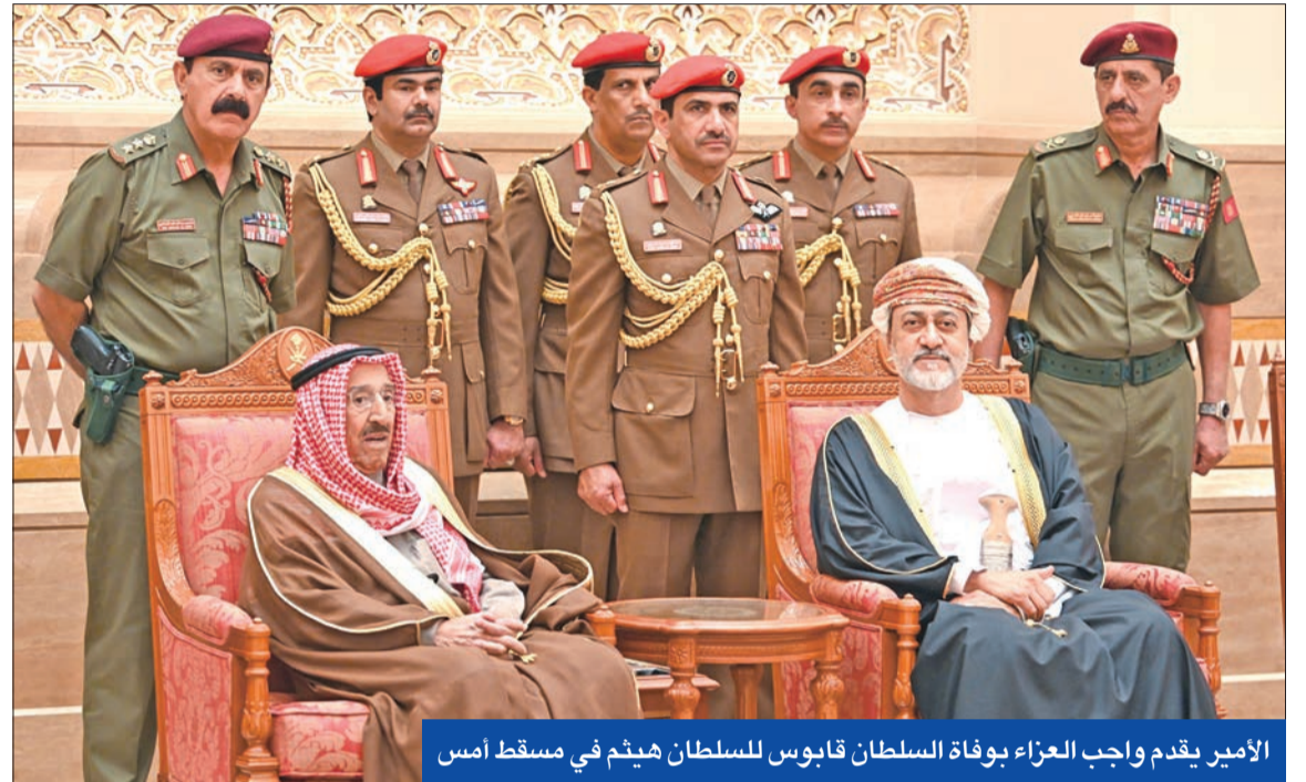
الأمير يقدم واجب العزاء بوفاة السلطان قابوس للسلطان هيثم في مسقط أمس