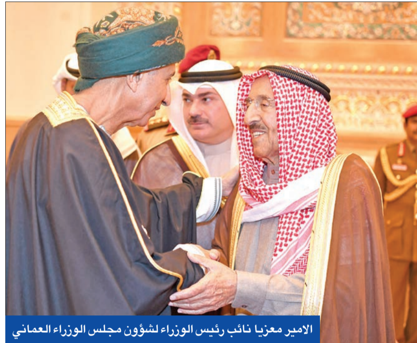
الأمير معزياً نائب رئيس الوزراء لشؤون مجلس الوزراء العماني

ملكا البحرين والأردن وأمير قطر وولي عهد أبوظبي وولي عهد بريطانيا ووزير شؤون الخارجية