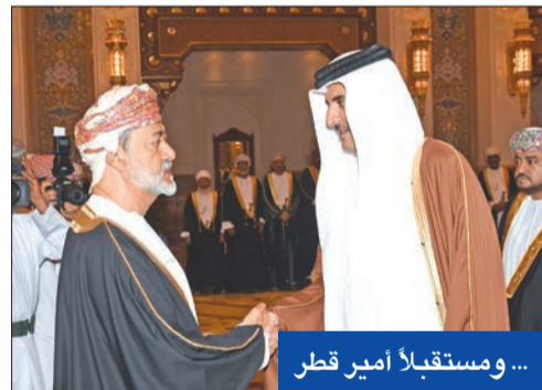
... ومستقبلاً أمير قطر