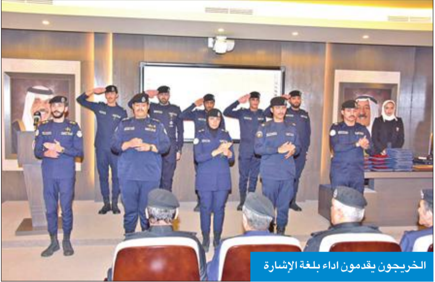
الخريجون يقدمون أداء بلغة الإشارة

كالجواز والبطاقة المدنية المرور وشؤون الإقامة وأنواع الطيران، وغيرها من المفاهيم المتعلقة بالسفر.