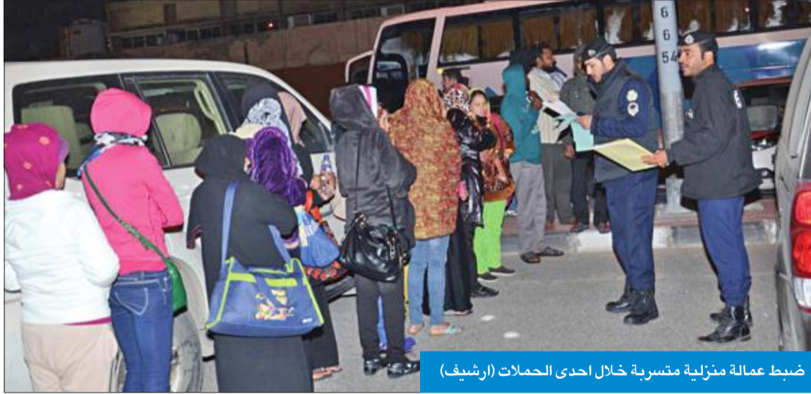
ضبط عمالة منزلية متسربة خلال إحدى الحملات (ارشيف)

كشفت مصادر أن لجنة متابعة أصحاب الأعمال وتراخيص المحال المغلقة ستستعين بوزارة الكهرباء لقطع التيار عن المنازل التي يتحایل أصحاب محالها المغلقة ويستمررون في مزاوله أعمالهم المخالفة وغير المرخصة داخلها.