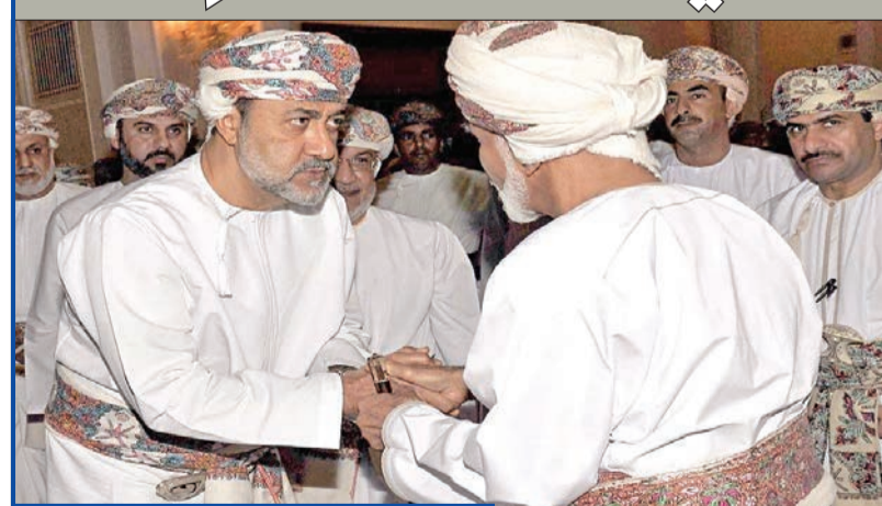
الراحل والسلطان هيثم في صورة أرشيفية

● خبراء: الضمان الأفضل للاستمرار بنهج قابوس هو إعادة هيكلة الاقتصاد ● بن طارق عليه الإسراع بتكوين علاقاته مع الشركاء الأجانب وتوضيح موقفه