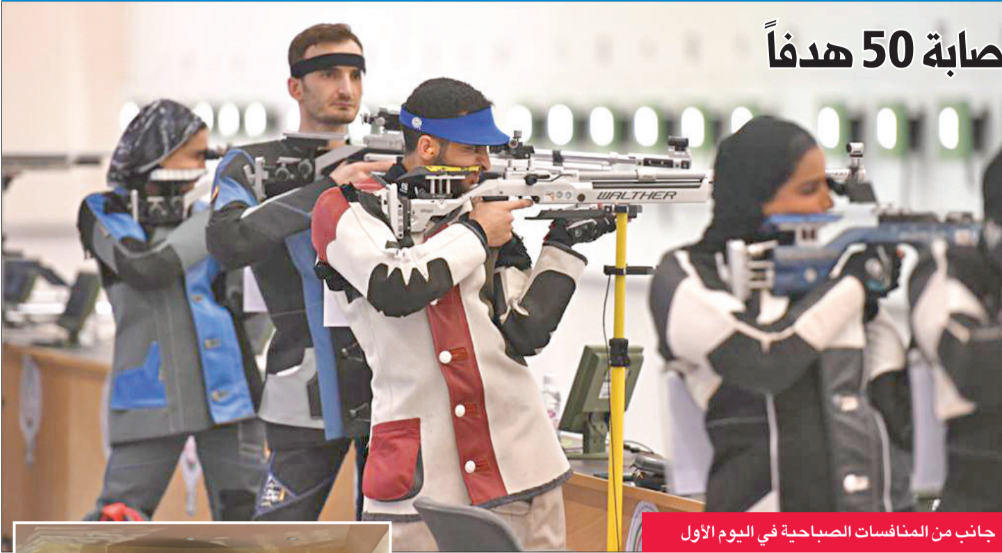
جانب من المنافسات الصباحية في اليوم الأول

تبدأ صباح اليوم منافسات الأدوار التمهيديّة والنهائيّة لمسابقات البندقية 10 أمتار للرجال، والتصفيات الحاسمة لمسلس 10 أمتار في البطولة الكبرى للرمية.