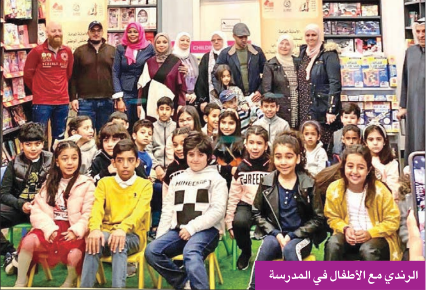
الرندي مع الأطفال في المدرسة

العربية والعالمية في أدب الطفل، وكل هذا بدأ يؤكد الحضور الأكبر لكتاب الطفل، وتعزيز أهمية هذا المجال، حيث كان المجال في المراحل السابقة شبه مهمل، ولا ينظر له بهذه الأهمية من المجتمع والساحة الأدبية.