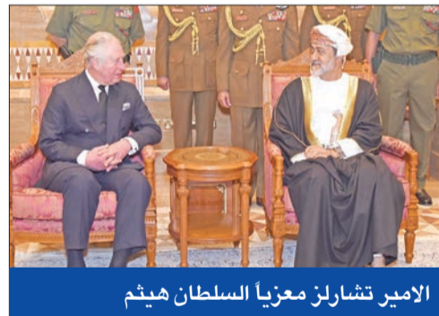
الامير تشارلز معزياً السلطان هيثم

عبر الرئيس الأمريكي دونالد ترامب أمس الأول عن «حزنه الشديد» بوفاة السلطان قابوس، مشيداً ب«شريك حقيقي وصديق للولايات المتحدة».