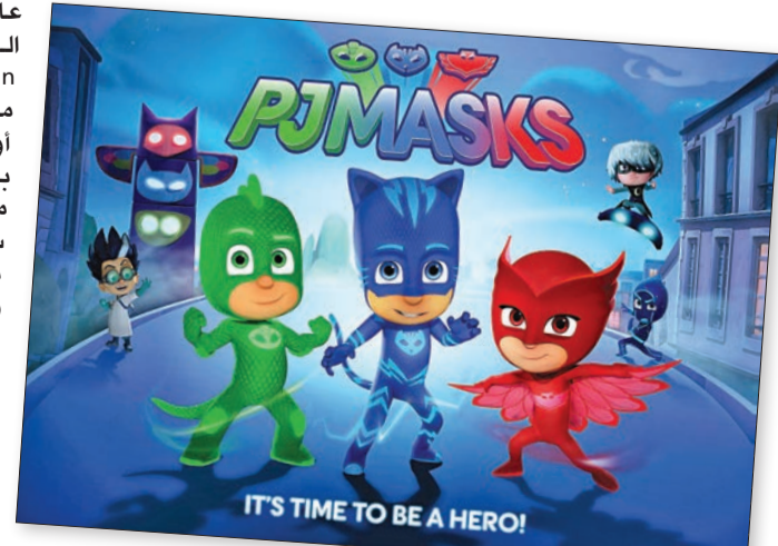
IT'S TIME TO BE A HERO!

توفر OSN حصرياً عبر شبكتها مجموعة كبيرة من أفلام ديزني وبيسكار الشيقة والمحبة للأطفال، كما تستعرض مجموعة واسعة من البرامج التلفزيونية والأفلام التعليمية والترفيهية الهادفة ذات المحتوى الملائم والمصمم خصيصاً للأطفال؛ وما على الآباء إلا تفعيل ميزة «الرقابة الأبوية» لتقييد أو حظر قنوات أو محتوى معين لضمان متابعة أطفالهم لبرامج ممتعة ومناسبة، ومن أبرز هذه الأعمال: - 1 - Disney XD تقدم محتوى ترفيهي خاصاً للأطفال ممن تتراوح أعمارهم بين 6 و9 سنوات يضم برامج رسوم متحركة مثل «سبايدرمان» الشهير و«بيغ هيرو 6» و«دك تيلز» - 2 - Disney HD تخصص هذه القناة في تقديم محتوى ترفيهي عائلي بدقة عالية موجه للأطفال ممن تتراوح أعمارهم بين 6 و9 سنوات، تتيح لهم