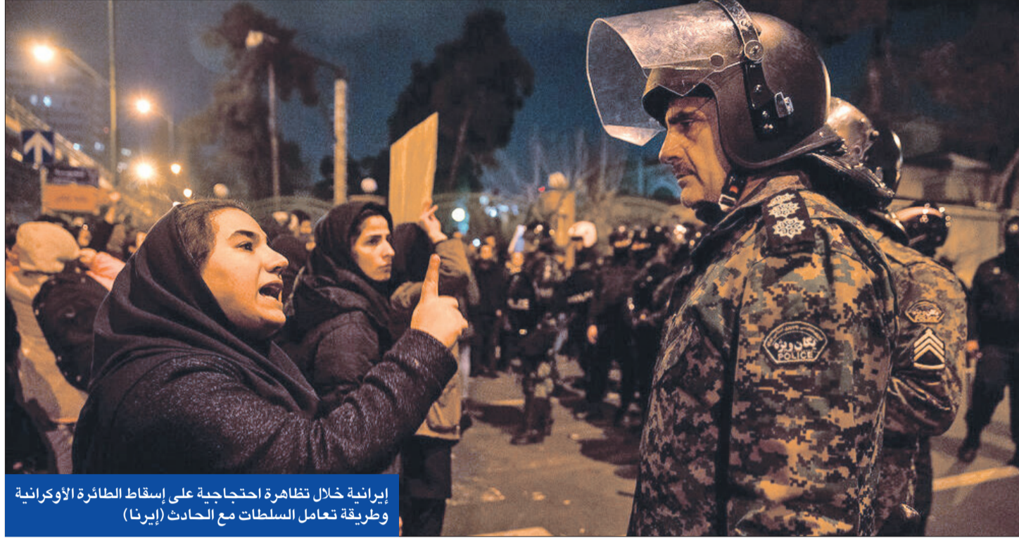
إيرانية خلال تظاهرة احتجاجية على إسقاط الطائرة الأوكرانية وطريقة تعامل السلطات مع الحادث (إيرنا)

● أمير قطر يلتقي خامنئي وروحاني... وقريشي يبدأ مهمة وأبي يستهل بالرياض جولة خليجية ● السفير البريطاني يكذب طهران بشأن سبب اعتقاله وترامب يدعم الاحتجاجات بـ «الفارسية»