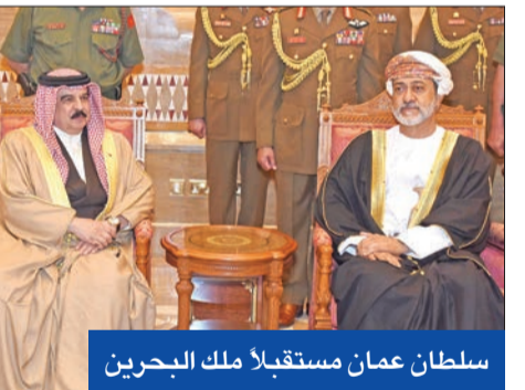
سلطان عمان مستقبلاً ملك البحرين