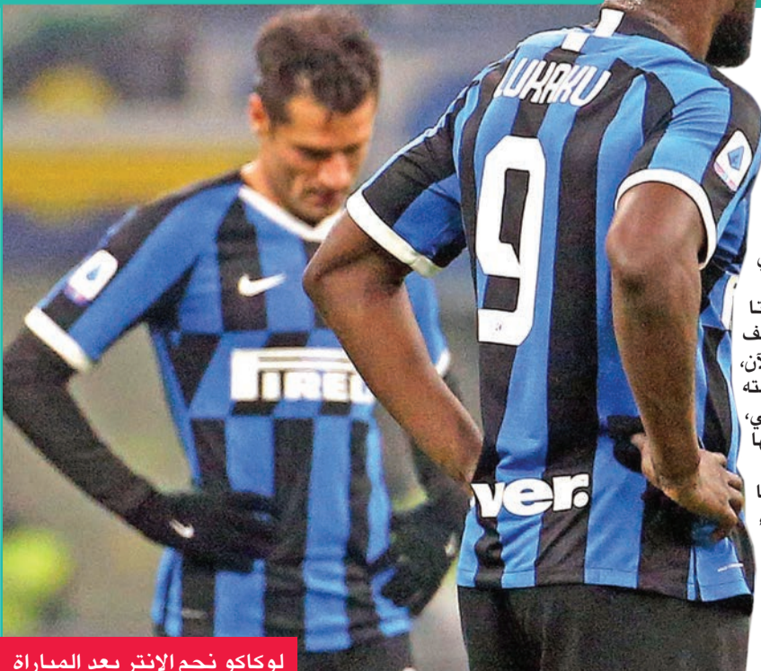
لوكاكو نجم الإنتر بعد المباراة

تطورنا، بما أننا نعمل مع المدرب لقرابة أربعة أعوام. نحن نطقت الآن ثمار الجهود الذي بدأناه منذ هذه الفترة الطويلة". واستمرت محن نابولي، رغم الاستعانة بجينارو غاتوزو لخلافة المدرب ألفد كارلو أنشيلوتي، إذ اكتفى النادي الجنوبي بفوز يتيم في المراحل الـ11 الأخيرة، وتجدد رصيده عند 24 نقطة في منتصف الترتيب.