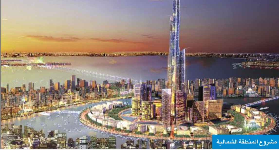
مشروع المنطقة الشمالية

التطور الهائل والسريع في التكنولوجيا المعلوماتية في كافة أعمال الهيئات الحكومية والخاصة، لافتاً إلى المدة الزمنية لطرح وتخصيص وإدراج شركة أرامكو السعودية.