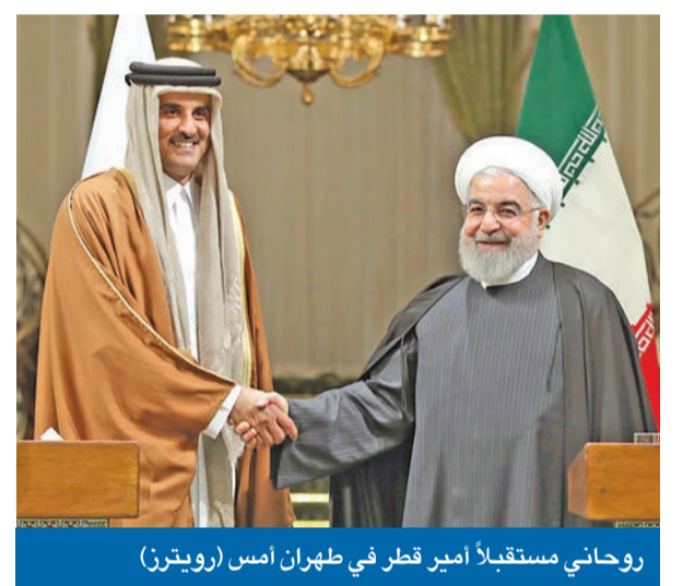
روحاني مستقبلاً أمير قطر في طهران أمس

لليوم الثاني على التوالي، شهدت إيران أمس تظاهرات طلابية كبيرة، احتجاجاً على إسقاط الطائرة الأوكرانية المدنية، خلال قصف «الحرس الثوري» قاعدتين أميركيتين بالعراق الأسبوع الماضي، رداً على تصفية واشنطن القائد العسكري الإيراني قاسم سليماني. ووسط حالة من الارتباك سادت أوساط النظام الإيراني، بعد الإقرار بإسقاط الطائرة عقب أيام من الإنكار، تظاهر الطلاب في جامعة شهيد بهشتي بطهران وفي أصفهان، عشية ليلة من التظاهرات التي امتدت من العاصمة إلى معظم المدن الرئيسية. والمختلف هذه المرة، أن السلطات لم تبادر إلى قطع الإنترنت حتى اللحظة، علماً أن اتخاذ قرار مماثل غير مستبعد في حالة اشتد الحراك الشعبي.