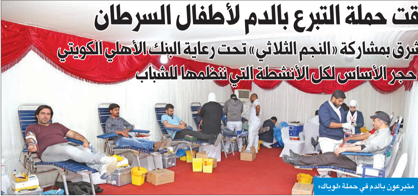
متبرعون بالدم في حملة «لويك»

معنا اليوم بقمصان لويك الخضراء، يتطوعون لتنظيم هذه الحملة مع فريق العمل في لويك، ولولا جهودهم لما تمكنا من تحقيق أهدافنا اليوم.