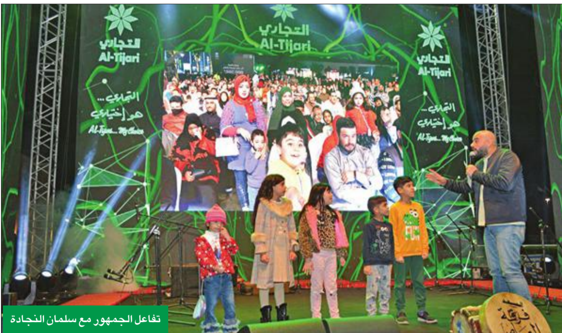
تفاعل الجمهور مع سلمان النجادة