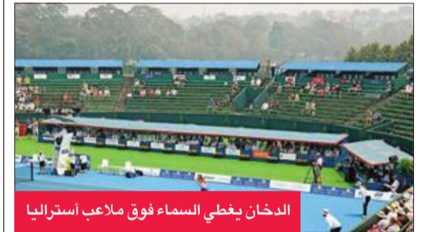
الدخان يغطي السماء فوق ملاعب أستراليا

اضطر منظمو بطولة أستراليا المفتوحة، أولى البطولات الأربع الكبرى في كرة المضرب، إلى إلغاء الحصص التدريبية المقررة، أمس، استعدادا لانطلاق البطولة في 20 الشهر الجاري، بسبب دخان الحرائق الهائلة التي اجتاحت البلاد.