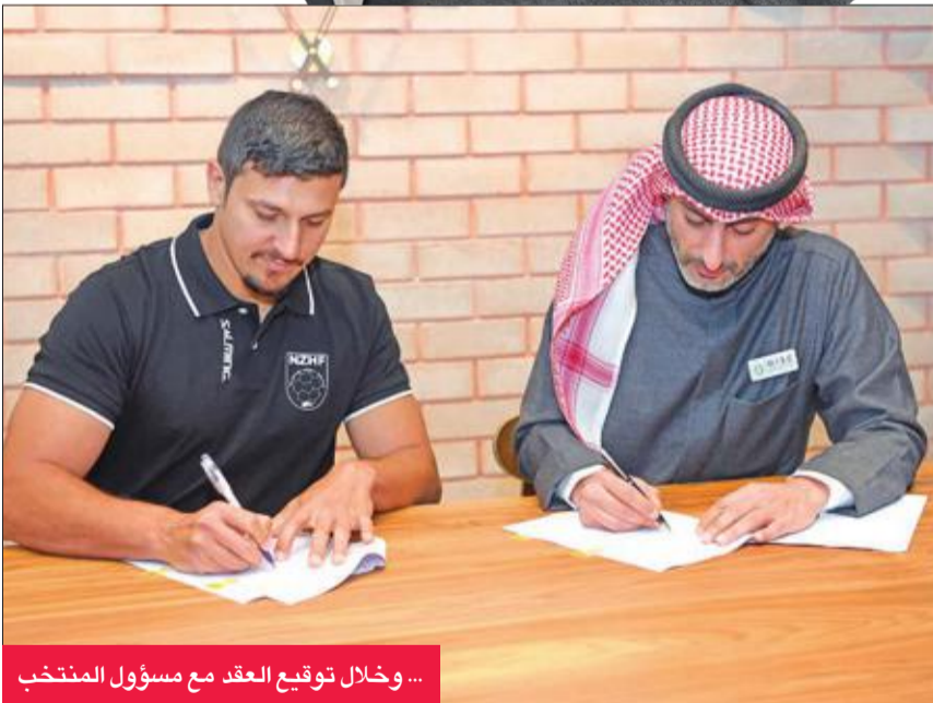
... وخلال توقيع العقد مع مسؤول المنتخب