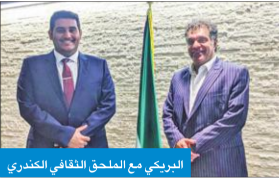
البريكي مع الملحق الثقافي الكندري

تسير في المسار الصحيح، خاصة بعد موافقة وزارة التعليم العالي على الزيادة مؤخرًا، مؤكداً أنه حريص على الالتقاء بالمسؤولين في الملاحق الثقافية، لنقل مشاكل ومطالبات الطلبة إليهم، وإيجاد حلول عاجلة لها.