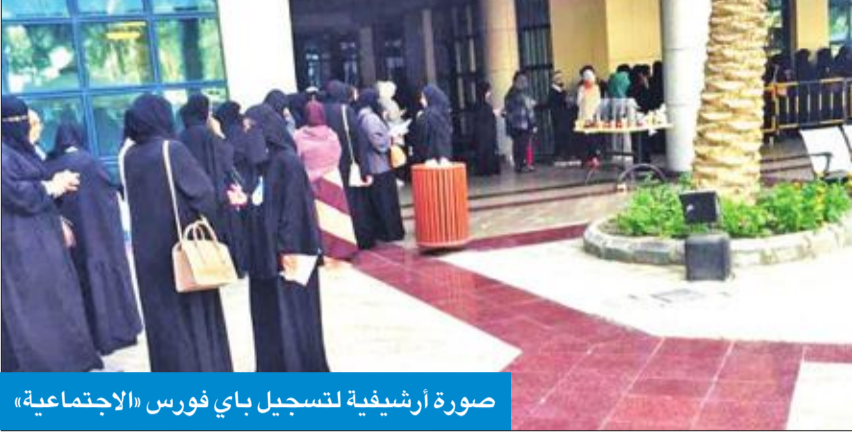
صورة أرشيفية لتسجيل باي فورس «الاجتماعية»

الطلبة بسبب استمرار عملية «الباي فورس» خلال أول يومين من الفصل الدراسي الثاني، وقد تم إبلاغنا أنه سيتم إصدار تعميم على الكليات من جانب عمادة القبول والتسجيل لمرعاة الطلبة في مسألة الغياب، لحين الانتهاء من عملية تسجيل «الباي فورس».