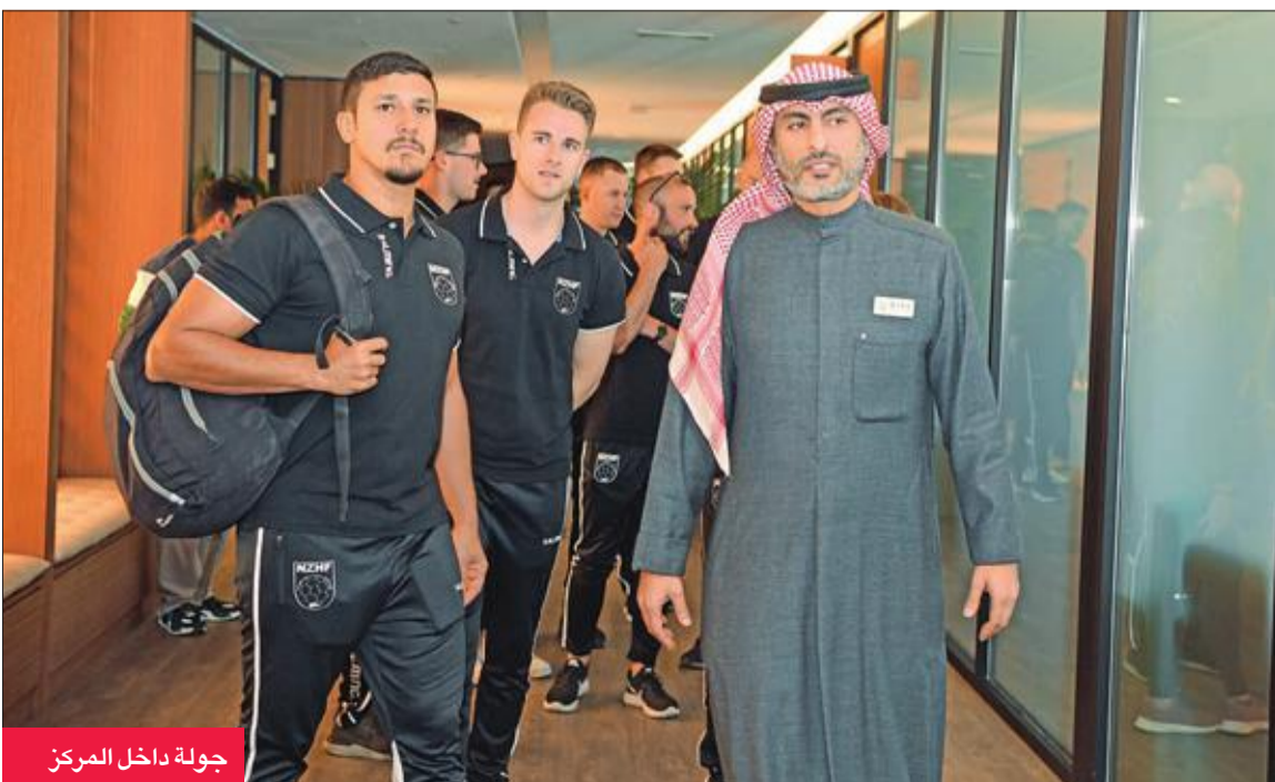
جولة داخل المركز