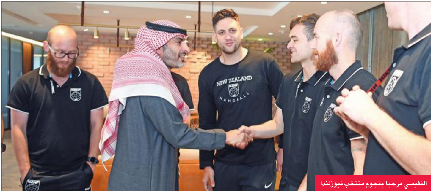
النفيسي مرحبا بنجوم منتخب نيوزلندا