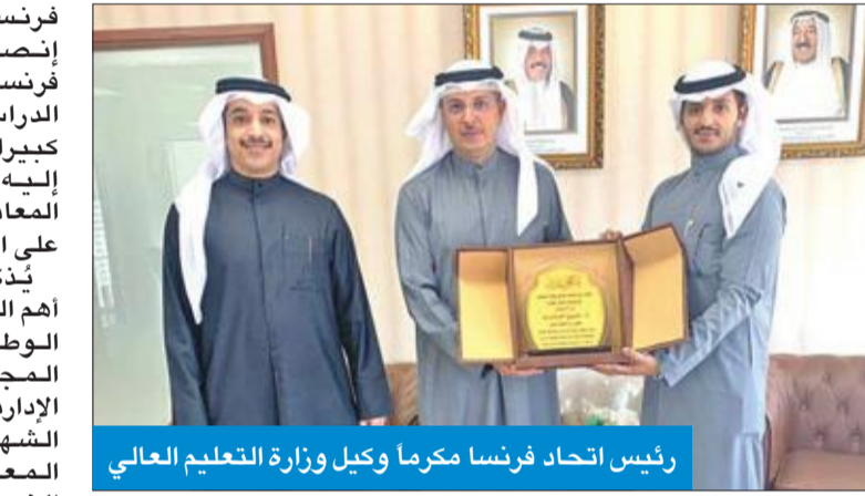
رئيس اتحاد فرنسا مكرماً وكيل وزارة التعليم العالي

والطالبات الراغبين بالحصول عليها، مبينا أن أعضاء الهيئات الإدارية السابقة في اتحاد طلبة