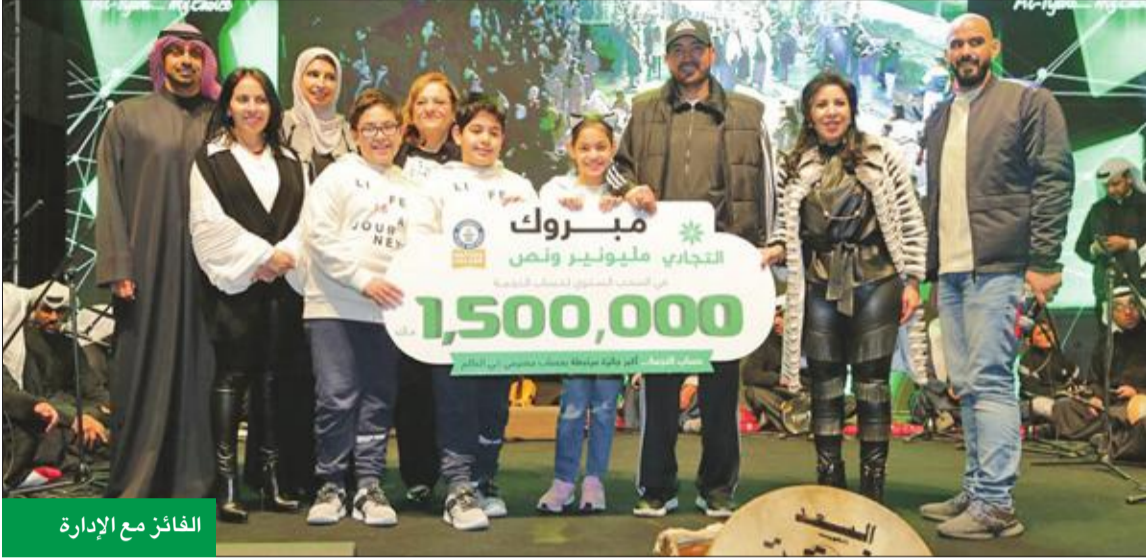
الفائز مع الإدارة

«بتصير مليونير ونص»... أكبر جائزة مرتبطة بحساب مصرفي وقدرها 1.5 مليون دينار