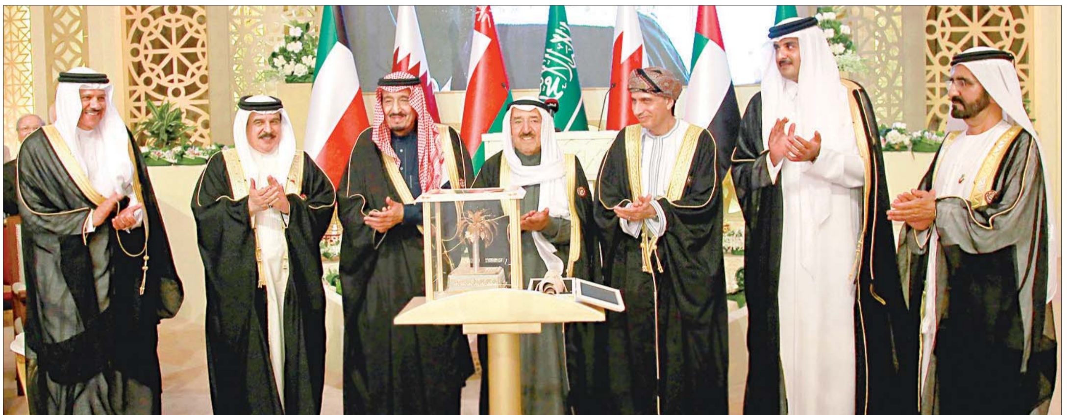
قادة «التعاون» خلال تكريمهم سمو الأمير بمناسبة منح الأمم المتحدة سموه لقب «قائد للعمل الإنساني» وتسمية دولة الكويت «مركزاً للعمل الإنساني» بعد الجلسة الافتتاحية لقمة الدوحة أمس

● الأمير: يجب تشكيل لجنة عليا تتولى استكمال دراسة موضوع «الاتحاد» بكل تأن وروية ● تميم: على المجلس تحديد موقعه في الإقليم... فالدول الكبرى تتعامل وفق لغة المصالح