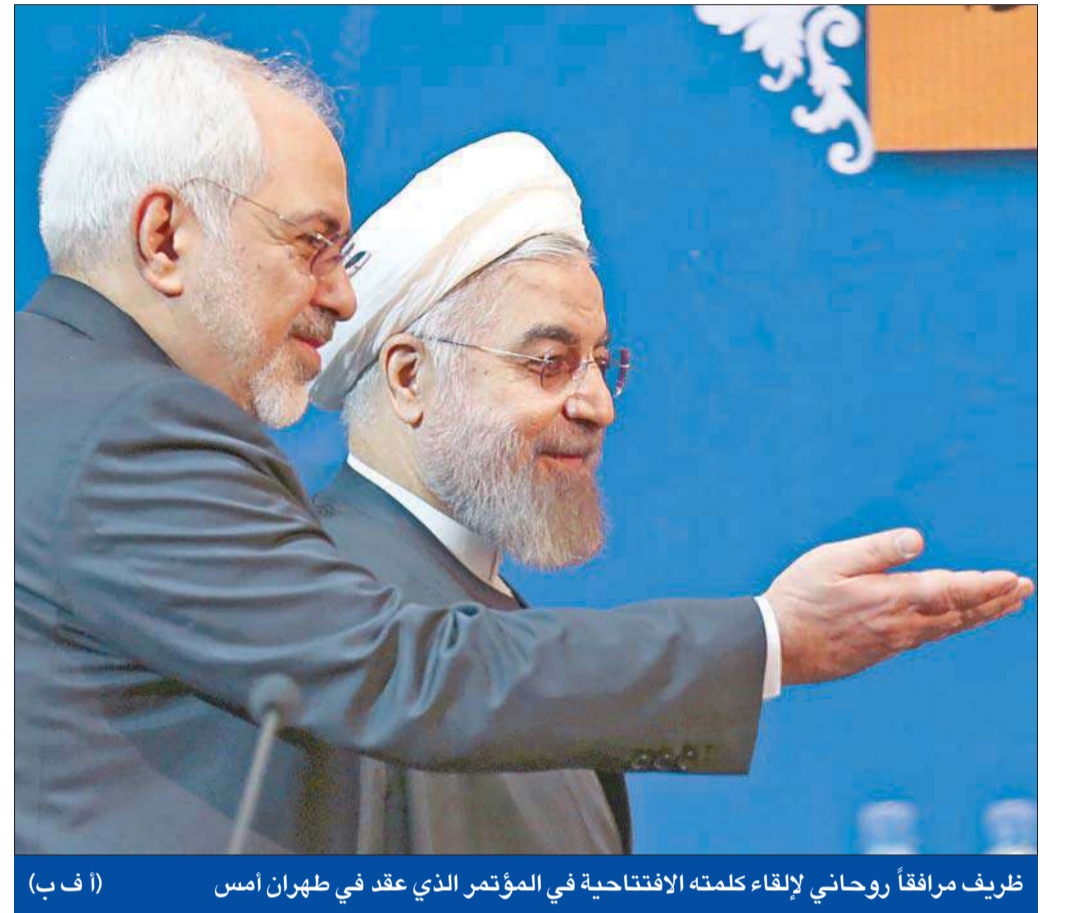
ظريف مرافقاً روحاني لإلقاء كلمته الافتتاحية في المؤتمر الذي عقد في طهران أمس