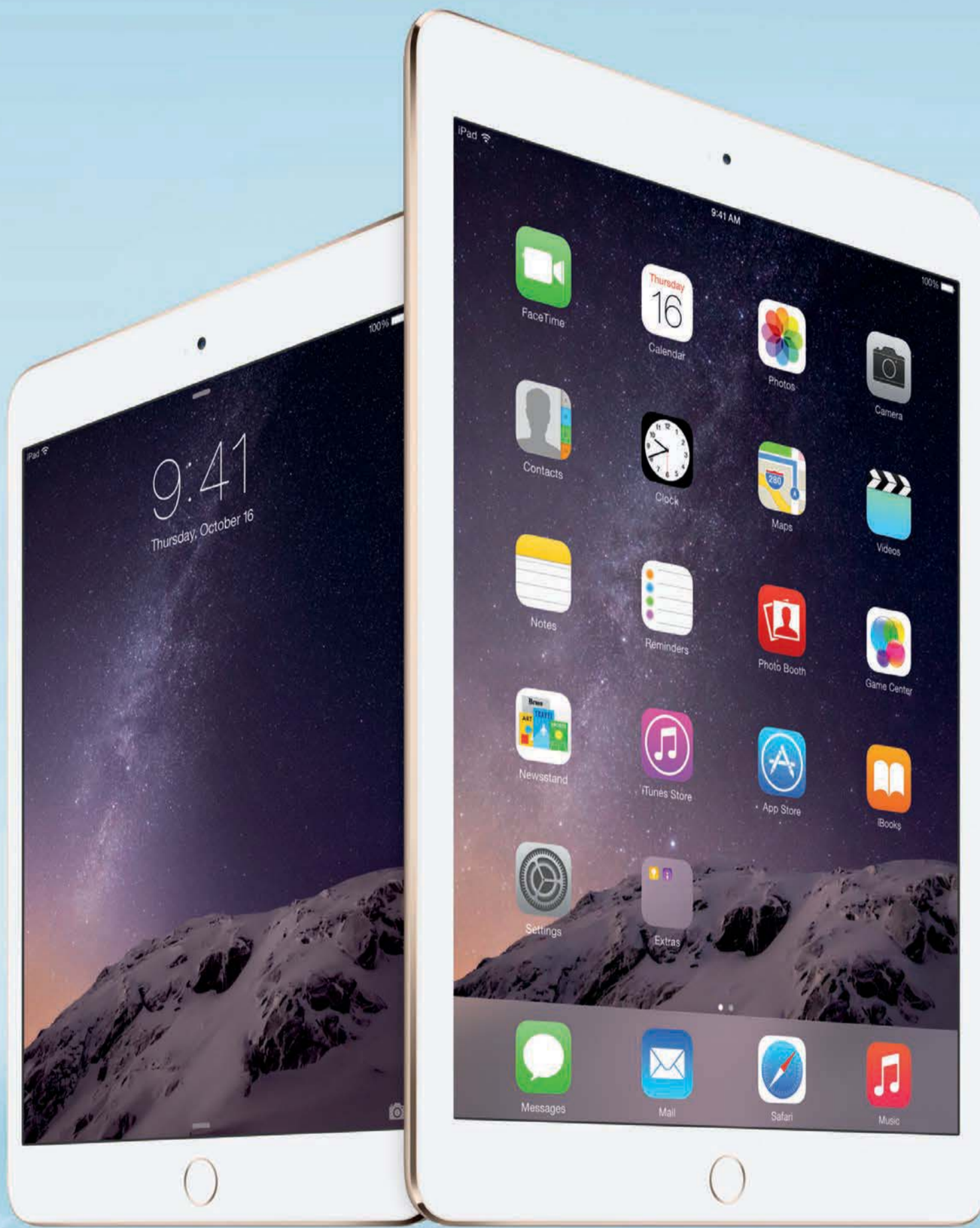
iPad mini 3