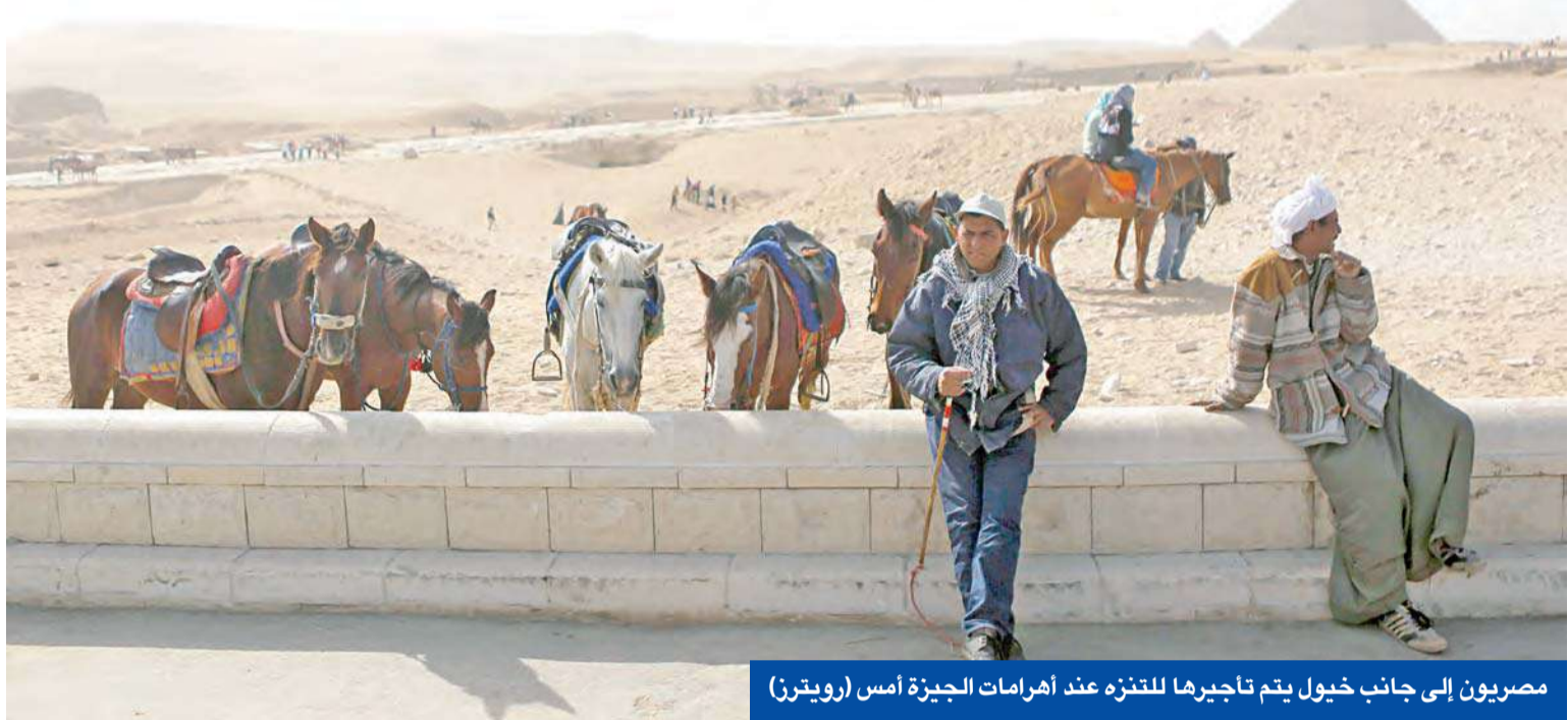
مصريون إلى جانب خيول يتم تاجيرها للتزده عند أهرامات الجيزة أمس