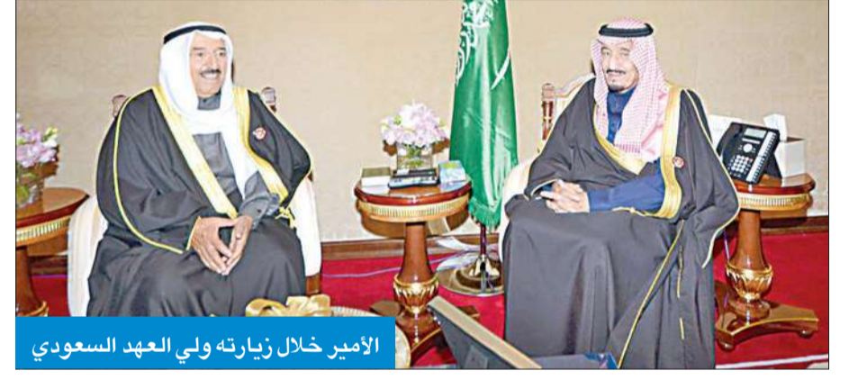
الأمير خلال زيارته ولي العهد السعودي

قام سمو أمير البلاد الشيخ صباح الأحمد مساء أمس بزيارة إلى ولي العهد نائب رئيس مجلس الوزراء وزير الدفاع بالملكة العربية السعودية الشقيقة الأمير سلمان بن عبدالعزيز آل سعود، وذلك بمقر إقامته بالعاصمة الدوحة. واستقبل سمو أمير البلاد مساء أمس نائب رئيس الدولة رئيس مجلس الوزراء حاكم دبي بدولة الإمارات العربية المتحدة الشقيقة الشيخ محمد بن راشد آل مكتوم، وذلك بمقر