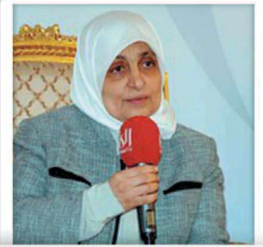
هند الصبيح وزيرة الشؤون الاجتماعية والعمل ووزيرة الدولة لشؤون التخطيط والتنمية