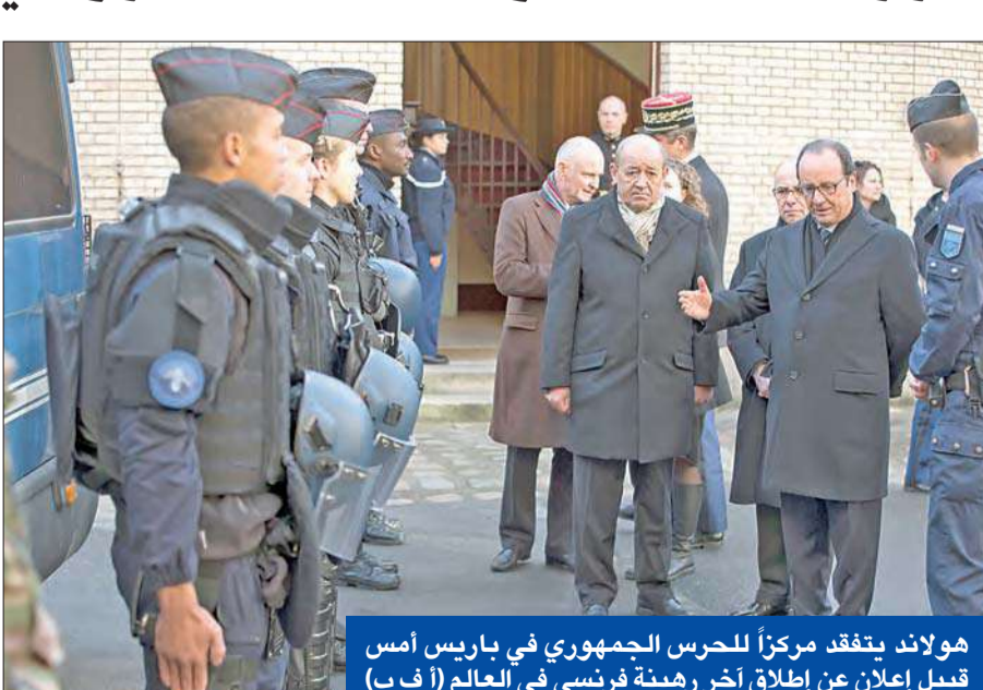
هولاند يتفقد مركزاً للحرس الجمهوري في باريس أمس قبيل إعلان عن إطلاق آخر رهينة فرنسي في العالم

أعلن الرئيس الفرنسي فرنسيس هولاند أمس في باريس أن سيرج لازاريفيتش آخر رهينة فرنسي في العالم بات حراً بعد ثلاث سنوات من اختطافه في منطقة الساحل في 2011. كما أعلنت الرئاسة النيجرية أمس أن الإفراج عن لازاريفيتش آخر رهينة فرنسي في العالم جاء نتيجة جهود مكثفة من النيجر ومالي بعد احتجازه أكثر من ثلاث سنوات في منطقة الساحل الإفريقية. وفي بيان، عبرت نيامي عن ارتياحها، وقالت إن «هذا الإفراج جاء نتيجة جهود مكثفة تابعتها كل من سلطات النيجر ومالي». وأشاد رئيس النيجر محمدو إيسوفو بالالتزام والمهنية اللذين تحلت بهما الأجهزة النيجرية والمالية. وأكدت الرئاسة ان النيجر ستلبي دوما في كل مرة يطلب منها الإساهم في الدفاع عن الحرية والكرامة البشرية. وكانت نيامي لعبت دورا كبيرا في الإفراج عن اربعة رهائن فرنسيين في أكتوبر 2013. وأقرج عن الرجال الاربعة الذين كانوا يعملون لشركة اريفا وفرع لمجموعة فانسفي في النيجر بعد ثلاث سنوات من الاحتجاز. وفي 23 نوفمبر الماضي، عبر الرئيس اسوفو عن تفاؤله آراء مصر لآزاريفيتش، وقال أنذاك على هامش زيارة لرئيس الوزراء الفرنسي مانويل فالس للنيجر: «أعبر عن الامل باننا سنتوصل الى توفير الظروف للإفراج عنه قريباً». وفي 17 نوفمبر، بث تنظيم القاعدة في بلاد المغرب الإسلامي، شريطاً مصوراً