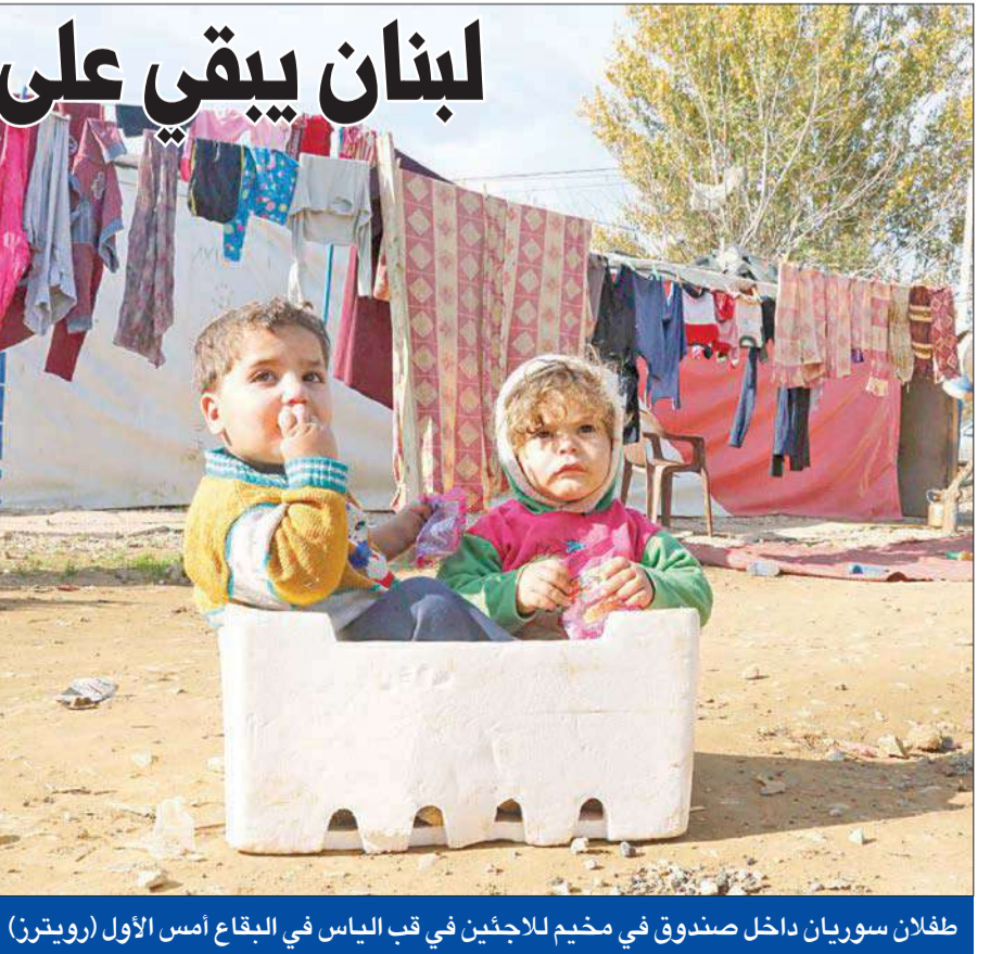
طفلان سوريان داخل صندوق في مخيم للاجئين في قب الياس في البقاع أمس الأول

أثار خبر إخلاء سبيل كل من سجي الدليمي، الزوجة السابقة لزعيم تنظيم «الدولة الإسلامية» أبو بكر البغدادي وطفليها، وعلا على زوجها المسؤول في «جبهة النصرة» أسس شريكس المعروف بـ«بو» على الشيشاني وتسلميمهم للأمن العام اللبناني، ببلبة وسط الأزمة التي تعصف بملف المخطوفين لدى «النصرة» و«داعش».