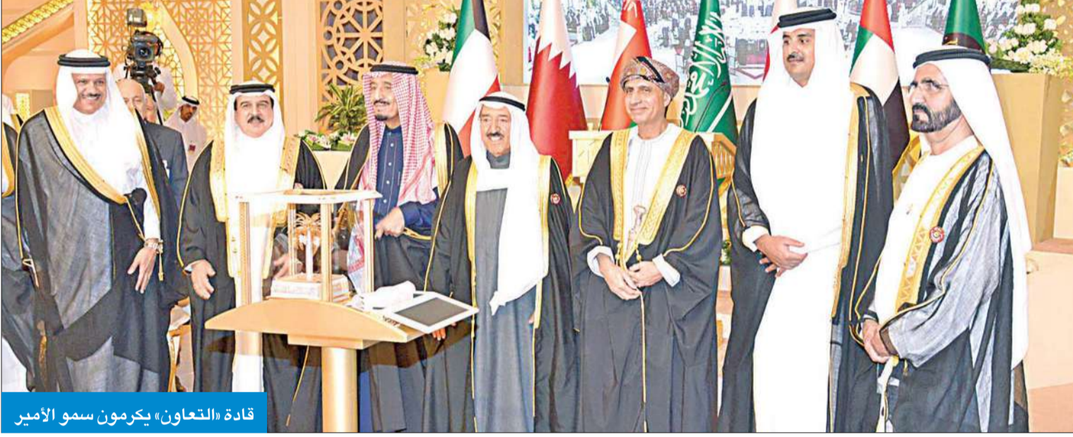
قادة «التعاون» يكرمون سمو الأمير

سموه: مسراتنا واحدة والتكريم تكريم لدول المجلس