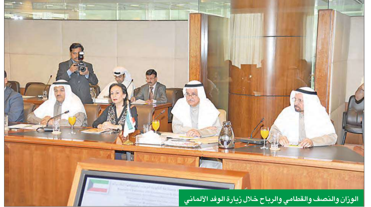
الوزن والنصف والقطامي والرياح خلال زيارة الوفد الألماني

بحث في «الغرفة» مع وفد ألماني سبل تعزيز التعاون الاقتصادي بين البلدين