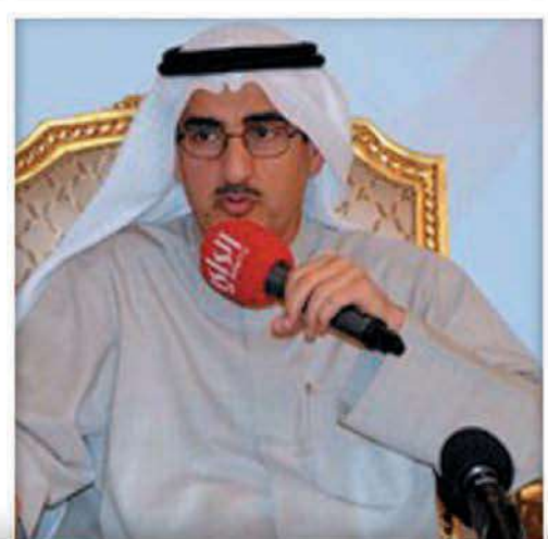
عبدالعزیز الإبراهيم وزير الأشغال العامة ووزير الكهرباء والماء