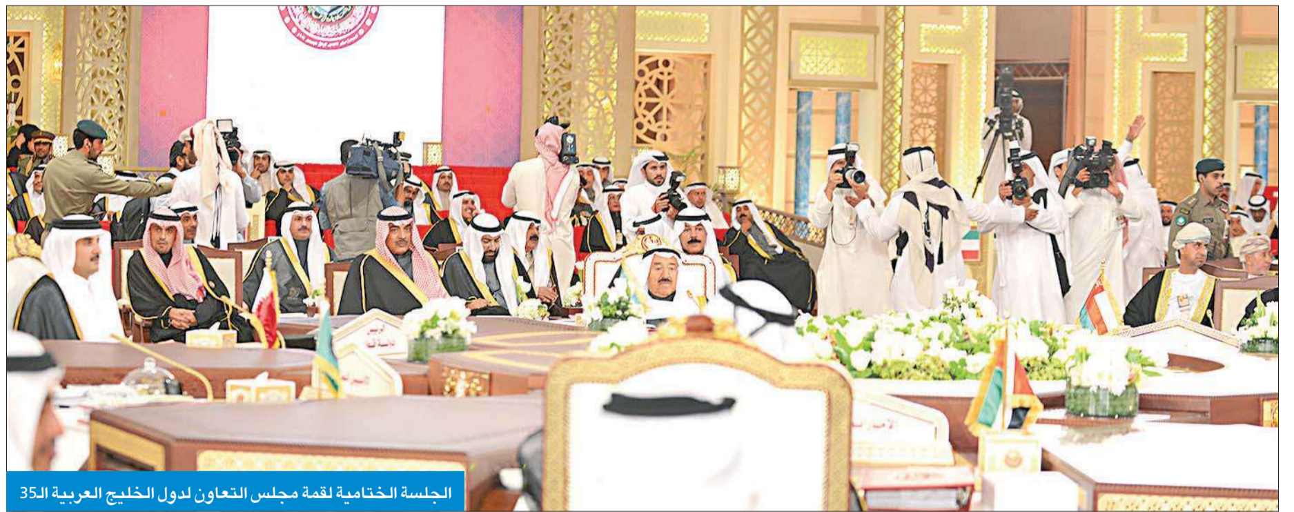
الجلسة الختامية لقمة مجلس التعاون لدول الخليج العربية الـ35

الوطني الشامل في اليمن، داعياً جميع الأطراف إلى حل الخلافات بالطرق السلمية، وشجب أعمال العنف التي تمارس هناك. وفي الملف الليبي، طالب البيان بالوقف الفوري لأعمال العنف في ليبيا، مشدداً على وجوب اعتراف جميع الأطراف بشرعية مجلس النواب المنتخب.