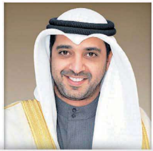
الشيخ محمد عبدالله وزير الدولة لشؤون مجلس الوزراء