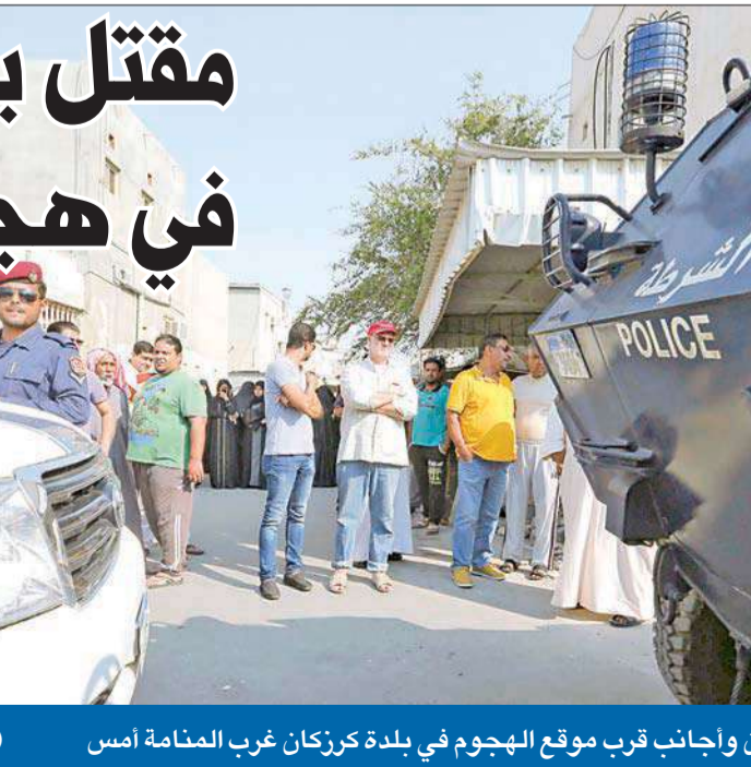
بحرينيون وأجانب قرب موقع الهجوم في بلدة كرزكان غرب المنامة أمس (رويترز)

مقتل بحريني وشرطي أردني في هجومين غرب المنامة اتهام «حزب الله» بالوقوف وراء أحدهما أكدت وزارة الداخلية البحرينية مقتل مواطن بحريني وإصابة أسويي بجروح في «تفجير إرهابي» وقع في قرية كرزكان غرب المنامة، وذلك بعد ساعات من مقتل شرطي أردني تعرض - وفق السلطات - لعمل إرهابي في قرية دمسحان المجاورة. وكشف رئيس الأمن العام، اللواء طارق الحسن، في بيان أمس، أن الشرطي القتيل هو العريف علي محمد علي، وهو أردني كان يعمل ضمن الفريق التدريبي المنتدب عن الانتفاضة الأمنية الموقعة بين الجانبين البحريني والأردني في مجال تبادل الخبرات. وفي العاصمة الأردنية، أكد مصدر أمني مسؤول في المديرية العامة لقوات الدرك «استشهاد العريف علي محمد علي زريقات، الذي كان يعمل ضمن المهمة التدريبية المشتركة مع قوات الأمن البحرينية، والتي تاتي في إطار التعاون الأمني والتدريبي 02