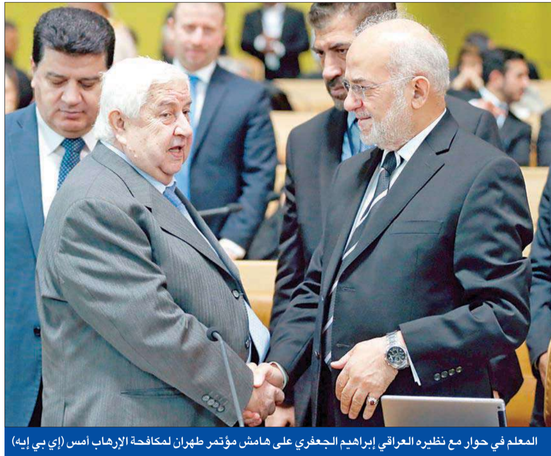
المعلم في حوار مع نظيره العراقي إبراهيم الجعفري على هامش مؤتمر طهران لمكافحة الإرهاب أمس