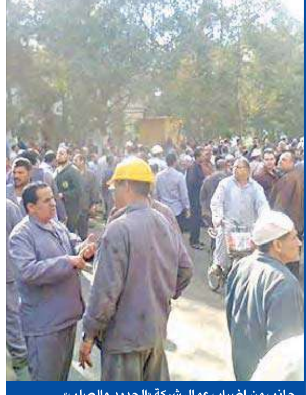
جانب من إضراب عمال شركة «الحديد والصلب»