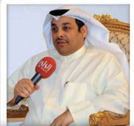
يعقوب الصانع وزير العدل ووزير الأوقاف والشؤون الإسلامية