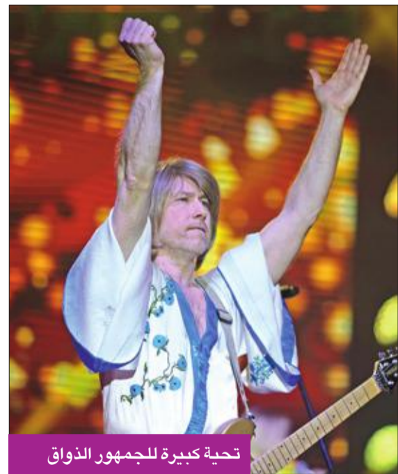
تحية كبيرة للجمهور الذواق

الجدير بالذكر، أن فرقة «ABBA Tribute» واحدة من أشهر فرق البوب في العالم إذ ضمت أكثر من 200 مليون ألبوم تم بيعها حول العالم. وظهرت الفرقة عام 2013، بهدف إحياء الإرث الموسيقي لمجموعة أبا الأسطورية والأصليّة التي ظهرت في السبعينيات وسعت إلى مطابقة «أبا» الأصل من حيث مستوى الموسيقى قدر الإمكان إذ لاقت نجاحاً كبيراً واعترافاً بمطابقتها وقربها من «أبا» الأصليّة وفق ما ذكرته الصحف الهولندية والأجنبية إذ تم اعتبارها إحدى أفضل فرق «ABBA Tribute» في