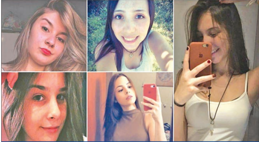
صورة نشرها المتحدث باسم الجيش الإسرائيلي افياخي ادري للصور المستخدمة في هجوم «حماس» السببراني

طائرة إسرائيلية تعبر السودان و«لجنة الضم» تبشر أعمالها