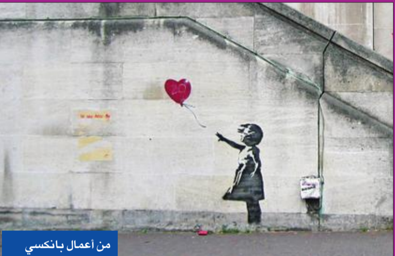
من أعمال بانكسي

ربع قرن، وإن لم يخل الأمر من كل أنواع الإشاعات حول شخصية الفنان البريطاني؛ هل هو عضو في فريق غنائي؟ أم شخصية نسائية تتخفي خلف شخصية رجل؟ كل ما يعرف هو أن بانكسي وصل إلى لندن عام 1990، واشتهر بأعماله المثيرة للجدل لما تتضمنه من نقد اجتماعي صريح فضلاً عن إرثه للحروب والنزاعات الفاشية ومجتمع الاستهلاك، وحصار غزة وغيرها من القضايا الإنسانية. ومن أشهر رسوماته الجرافيتي التي لا تزال باقية في لندن بالقرب من هاند بارك تحمل شعار «تسوق حتى تسقط» ويصور سيدة تسقط في الفراغ مع عربة جز للتسوق. كما اعتقد الكثيرون أن بانكسي رجل في الأربعين من عمره من بريستول ومنذ عام يؤكدون أن اسمه الحقيقي روب، وذلك بعد الحملة الترويجية التي دشنتها منسق الأسطوانات (الذي جي) الشهير جولدي في إحدى الحفلات حينما قال: «اعتقد أنه فنان رائع، ليفتح بذلك الباب أمام تخمينات أخرى أن اسمه قد يكون روب ديل ناجا أو روبين جاتينجام». والأول من بريستول وهو مطرب بفرقة ماسيف اتاك (أو هجوم عنيف). وفي عام 2016 قام الصحافي الفني كريج ويليامز بعمل ريبورتاج صحافي نشره على مدونته جمع فيه البراهين المزعومة التي تؤكد فرضية أن ديل ناجا هو بانكسي، زاعماً وجود رابط بين توارينج جولات فريق (هجوم عنيف)، وظهور جداريات بانكسي في جميع أنحاء العالم. كما شهد عام 2010، تقديم فيلم وثائقي عن بانكسي بعنوان «الخروج عبر محل الهدايا»، ورشح للحصول على الأوسكار، والعمل محاكاة ساخرة تدور حول إعادة نسخ الأعمال الفنية وتدني الإبداع لمصلحة الربح التجاري.