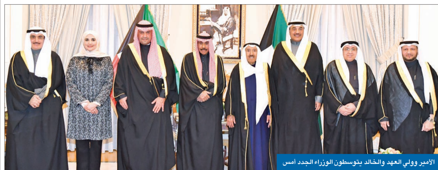
الأمير وولي العهد والخالد يتوسطون الوزراء الجدد أمس

● الخالد: الحكومة عازمة على العمل الدؤوب لترجمة التوجيهات السامية