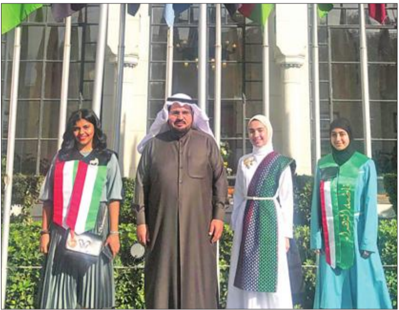
الطالبات المشاركات في المسابقة باسم الكويت مع مشرفهن