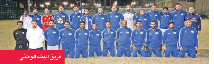
فريق البنك الوطني

ينطلق اليوم المربع الذهبي لدوري المصارف، إذ يلتقي فريق البنك الأهلي المتحد مع فريق بنك الكويت الوطني، في حين تقام المباراة الثانية بعد غد إذ يلعب فريق بيت التمويل الكويتي «بيتك» مع فريق بنك بوبيان. واستحقت الفرق الأربعة الوصول إلى المربع الذهبي بعد الأداء القوي لها من بداية المشوار، وكان البرتغالي اختتم معسكره الصربي مساء أمس بمباراة تجريبية قوية مع أحد الفرق الصربية، وقبلها لعب 4 مباريات متدرجة المستوى مع منتخب صربيا للشباب وفرنك ريد ستار وزلتنشر ومالدي رادنيك.