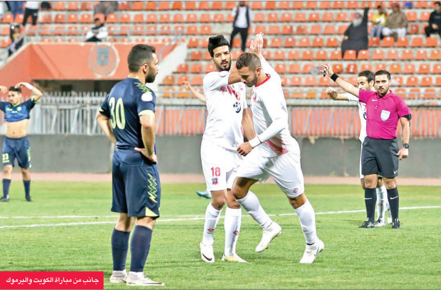
جانبا من مباراة الكويت واليرموك