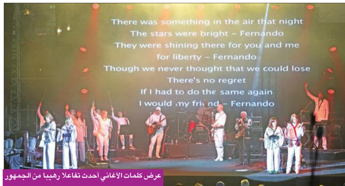
عرض كلمات الأغاني أحدث تفاعلاً رهيباً من الجمهور

في نشر قيم المحبة والسلام والرخاء وهو ما يتفق مع رؤية مؤسسة «لويك». وفرق البوب