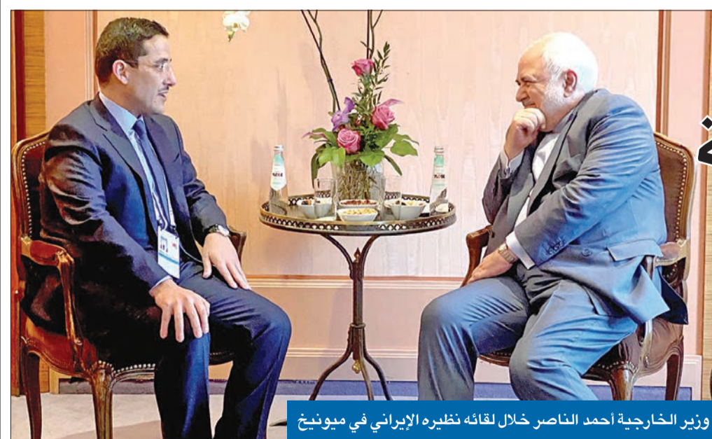
وزير الخارجية أحمد الناصر خلال لقائه نظيره الإيراني في ميونيخ