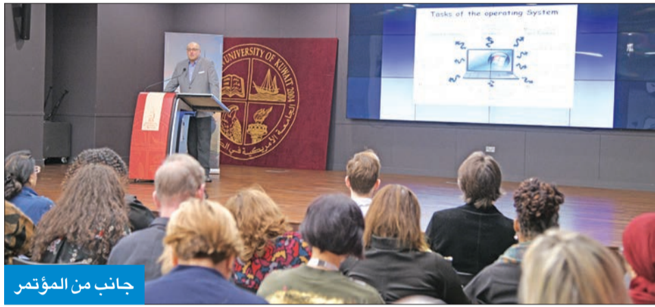
جانب من المؤتمر

مع متغيرات البيئة التعليمية والمنح الدراسية؟ أنا لا أعرف سوى AMICAL، خاصة أن AMICAL 2020 يركز على التحول الرقمي، لقد كانت الطاقة الجماعية للأفكار التعاونية التي تم توليدها خلال المؤتمر عبر الخطوط المؤسسية وغير الأدوار المهنية واضحة.