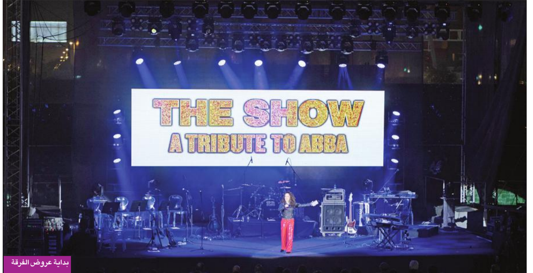
بداية عروض الفرقة