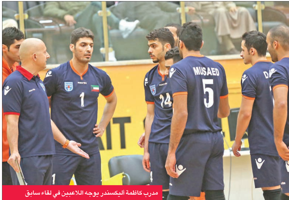
مدرب كاظمة اليكسندر يوجه اللاعبين في لقاء سابق

تغادر وفد الفريق الأول لكرة الطائرة بنادي كاظمة مساء اليوم صربيا، بعدما أنهى معسكره التدريبي الذي أقيم هناك متجهاً إلى القاهرة المصرية استعداداً للمشاركة في النسخة الـ 28 من البطولة العربية للاندية المقرر إقامتها هناك خلال الفترة من 19 إلى 28 الجاري. وكان البرتغالي اختتم معسكره الصربي مساء أمس بمباراة تجريبية قوية مع أحد الفرق الصربية، وقبلها لعب 4 مباريات متدرجة المستوى مع منتخب صربيا للشباب وفرنك ريد ستار وزلتنشر ومالدي رادنيك.