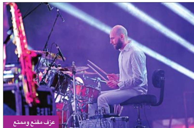
عزف ممتع وممتع

وعنتها أيضاً النجمة ميريل سترينج في أحد أفلامها عام 2008، وأغنية «Take A Chance On Me» وأغنية «Gimmie Gimmie» أماندا سيفريد في فيلم «Mia» عام 2008، واحتلت المركز الأول وقت صدورها في العديد من البلدان أبرزها أستراليا وأوروبا واليابان.