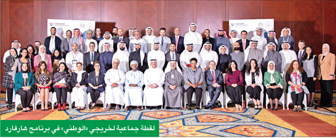
لقطة جماعية لخريجي «الوطني» في برنامج هارفارد

وقام المتدربون بالعديد من الأنشطة التفاعلية من خلال مجموعات، كما حصل المشاركون في نهاية البرنامج على شهادة من كلية هارفارد.