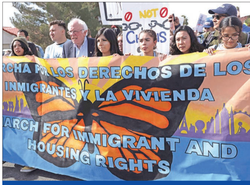
ساندرز خلال مسيرة مع أنصاره في مدينة نيفادا بلاس فيغاس أمس الأول

بيلوسي: مزقت «خطاب الاتحاد» للفت انتباه الصحافة