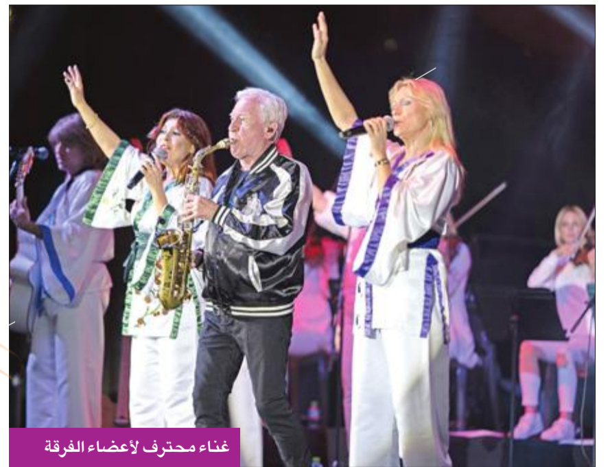
غناء محترف لأعضاء الفرقة

وأغنية ملكة الرقص «Dancing Queen» وأغنية «Chiquitita» شيكيتيتا الحزينة أن الإحزان تذهب وتأتي، «وأغنية «Fernando» وأغنية «I Do I Do» وأغنية «waterloo» التي صدرت عام 1974، وأغنية «Money, Money, Money» التي احتلت المركز الأول في Australian Singles Chart،