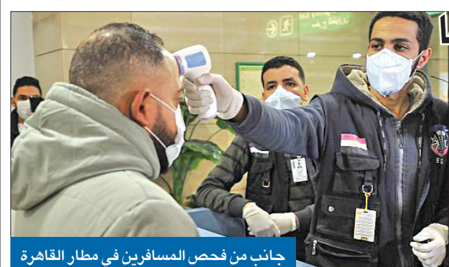
جانب من فحص المسافرين في مطار القاهرة

بكين رصدت مريضة تعمل بمدينة نصر نقلت العدوى لزميلها