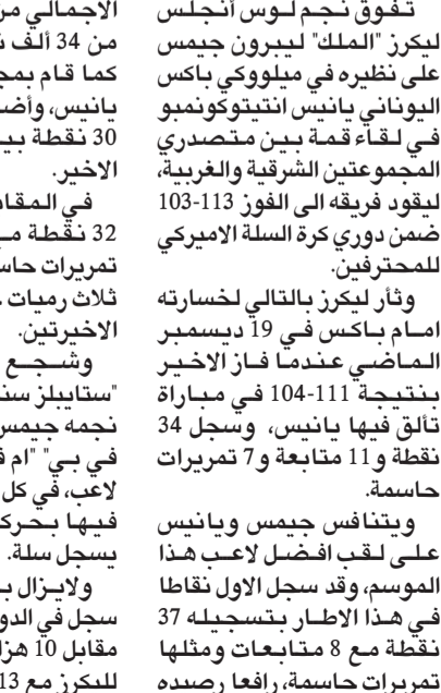
ليبرون جيمس نجم ليكرز يسجل في سلة ميلووكي باكس