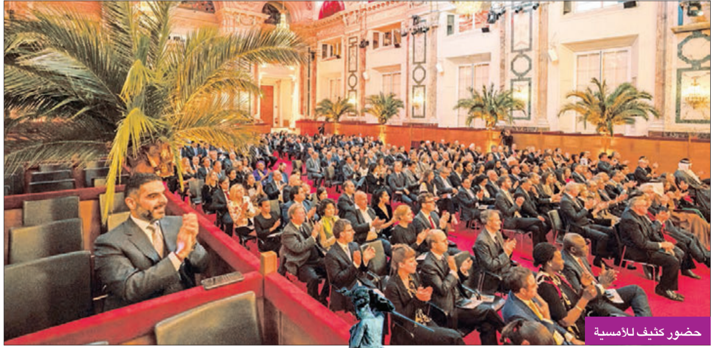
حضور كثيف للأمسية

قدمت فرقة «مركز جابر»، المكونة من 60 عازفا ومؤديا، أمسية كلاسيكية بعنوان «موسيقى من الكويت»، في أول فعالية فنية موسيقية عربية في قصر الهوفبورغ بفيينا، مع انطلاق فعاليات العام العربي النمساوي، والمتران مع أعياد الكويت الوطنية، بحضور عدد كبير تجاوز 400 شخص، على رأسهم الشيخ محمد العبدالله، نائب وزير الديوان الأميري، ممثلا عن سمو أمير البلاد الشيخ صباح الأحمد، وهاينز فيشر رئيس جمهورية النمسا السابق (2004-2016)، والسفير صادق معرفي سفير الكويت في النمسا، كما شهد الحفل حضور نخبة من السياسيين والسفراء المعتمدين في النمسا.