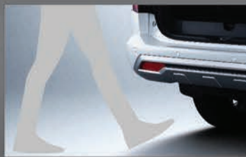
باب خلفي كهربائي - تحكم بدون مفتاح