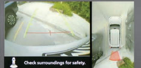
مشهد عين الطائر

نستقبلكم بمعرض الري من 8:30 صباحاً الى 8:30 مساءً وبشكل متواصل.