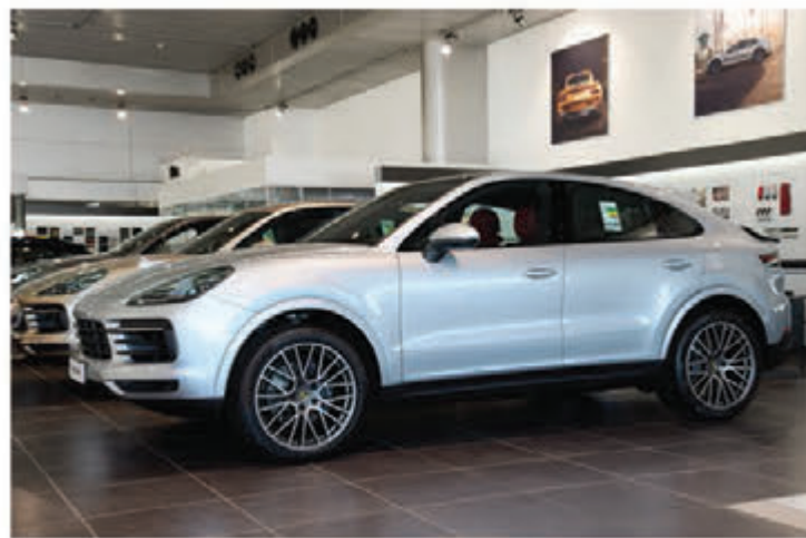
عرض سيارة كاين كوبيه في مركز بورشه الكويت