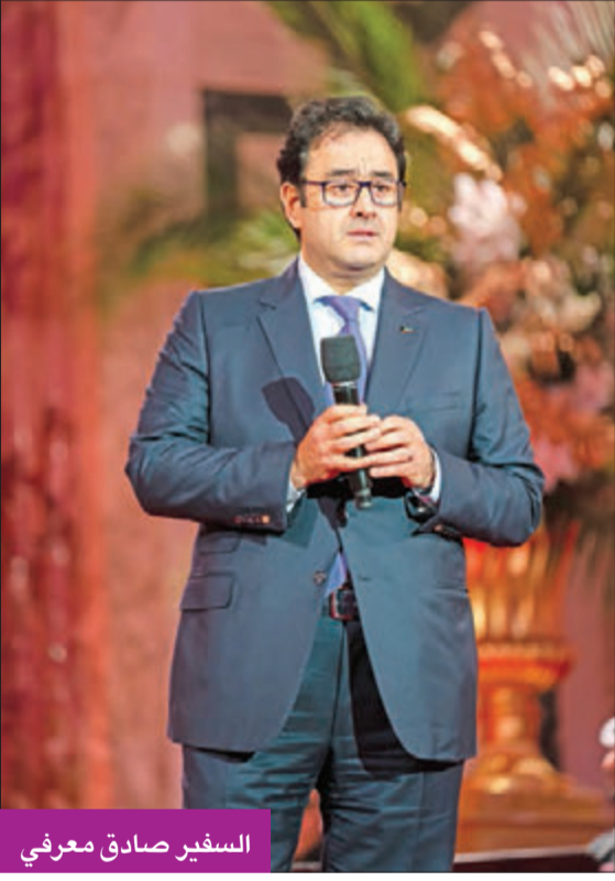
السفير صادق معرفي

«لكوننا» عن سعادته بهذا الحفل الموسيقي الذي وصفه بالراقي، مشيدا بالأداء الفني لفرقة مركز الشيخ جابر الأحمد الثقافي، وأكد عمق العلاقات بين النمسا والكويت وتميزها على مختلف الصعد، مشيرا إلى أهمية تعزيز العلاقات الثقافية والفنية لما لها من دور كبير في تعزيز التواصل بين الشعوب.