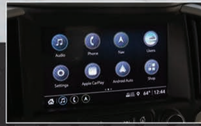
شاشة كبيرة 8 إنش مم كاميرا خلفية و Navigation ونظام ترفيه (Android Auto و Apple Carplay)