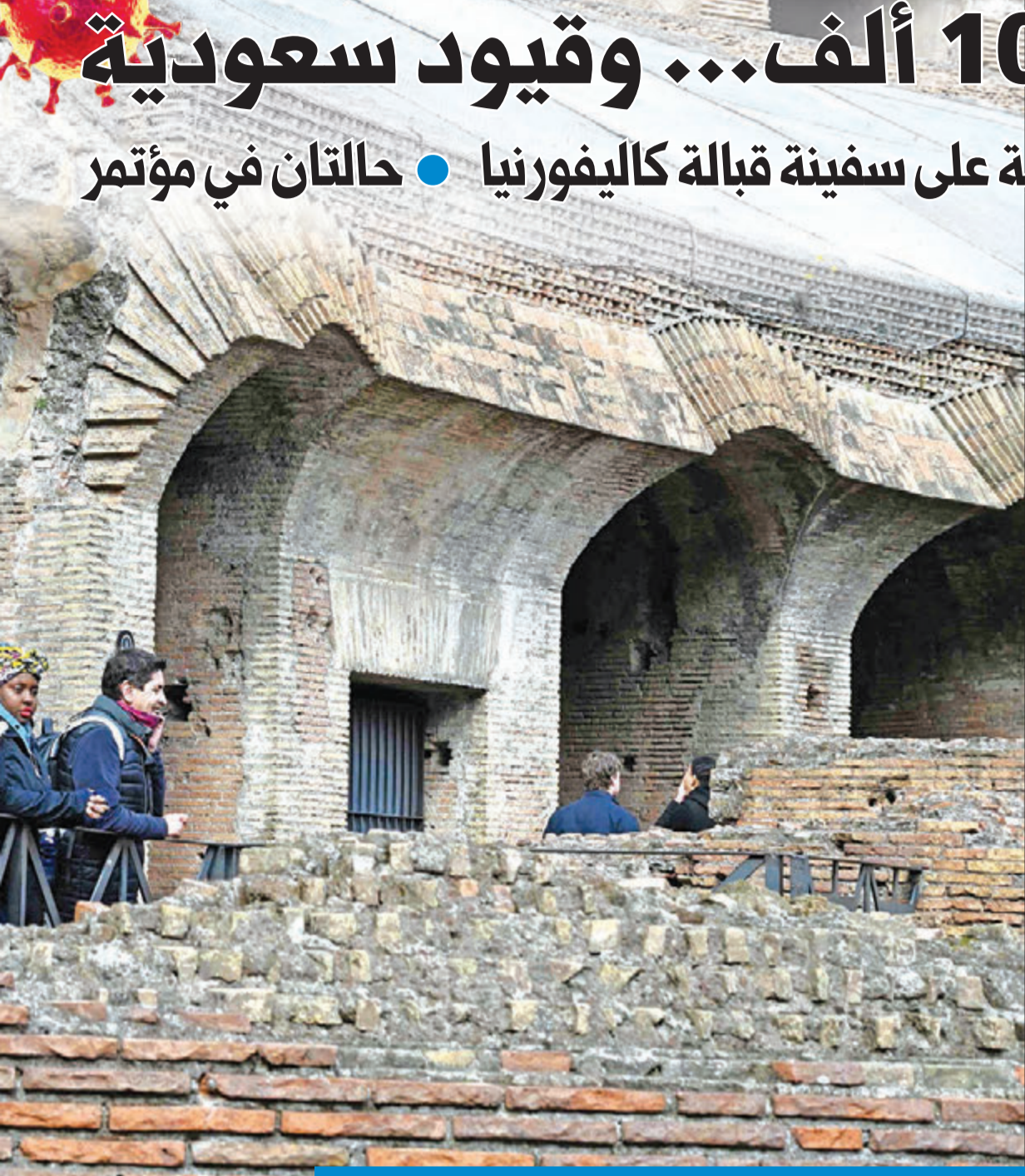
سياح يتحدون كورونا ويزورون الكوليسيوم بالكامات أمس

وكان الرئيس الأميركي دونالد ترامب قال من البيت الأبيض «أنها سفينة كبيرة، علينا اتخاذ قرار مهم».