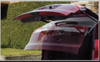
باب الصندوق يعمل كهربائياً