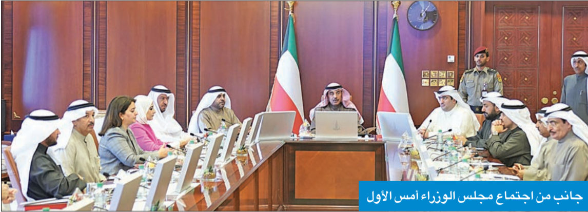
جانب من اجتماع مجلس الوزراء أمس الأول

في اجتماع استثنائي نوقشت خلاله مستجدات «كورونا» والتدابير الاحترازية للوقاية من تفشيه