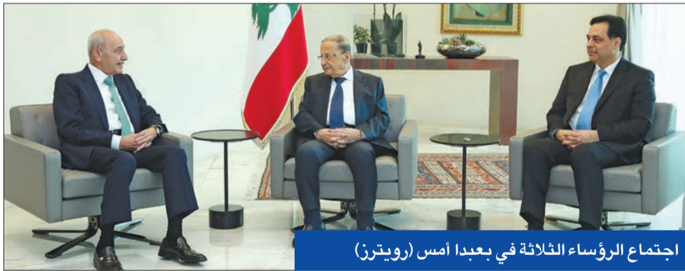
اجتماع الرؤساء الثلاثة في عبيدا أمس

كل المخزون... لا ينفع البكاء على الأطلال، ما يفيد هو وضع وبدء الخطة الإنقاذية للخروج من قعر الهاوية كما فعلت اليونان». وتشير تقديرات صندوق النقد الدولي إلى وصول دين لبنان العام إلى نحو 155 في المئة من الناتج المحلي الإجمالي بحلول نهاية 2019، بقيمة تبلغ حوالي 89.5 مليار دولار، مع حوالي 37 في المئة من الدين بالعملة الأجنبية. وقال نك إزنجير مدير الأسواق وحمل السندات منع أي اتفاق... ليس من الواضح مدى السرعة التي يمكن أن يسبروا بها في طريق إعادة الهيكلة أو تأمين صفقة، لأنهم يحتاجون إلى إصلاحات أولاً أو حتى إصلاحات موكبة».