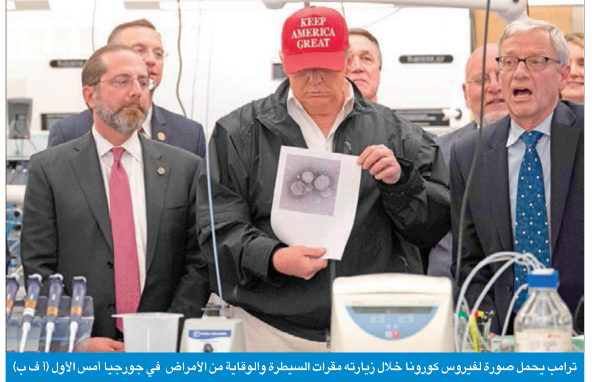
ترامب يحمل صورة لفيروس كورونا خلال زيارته مقرات السيطرة والوقاية من الأمراض في جورجيا أمس الأول (أ ف ب)