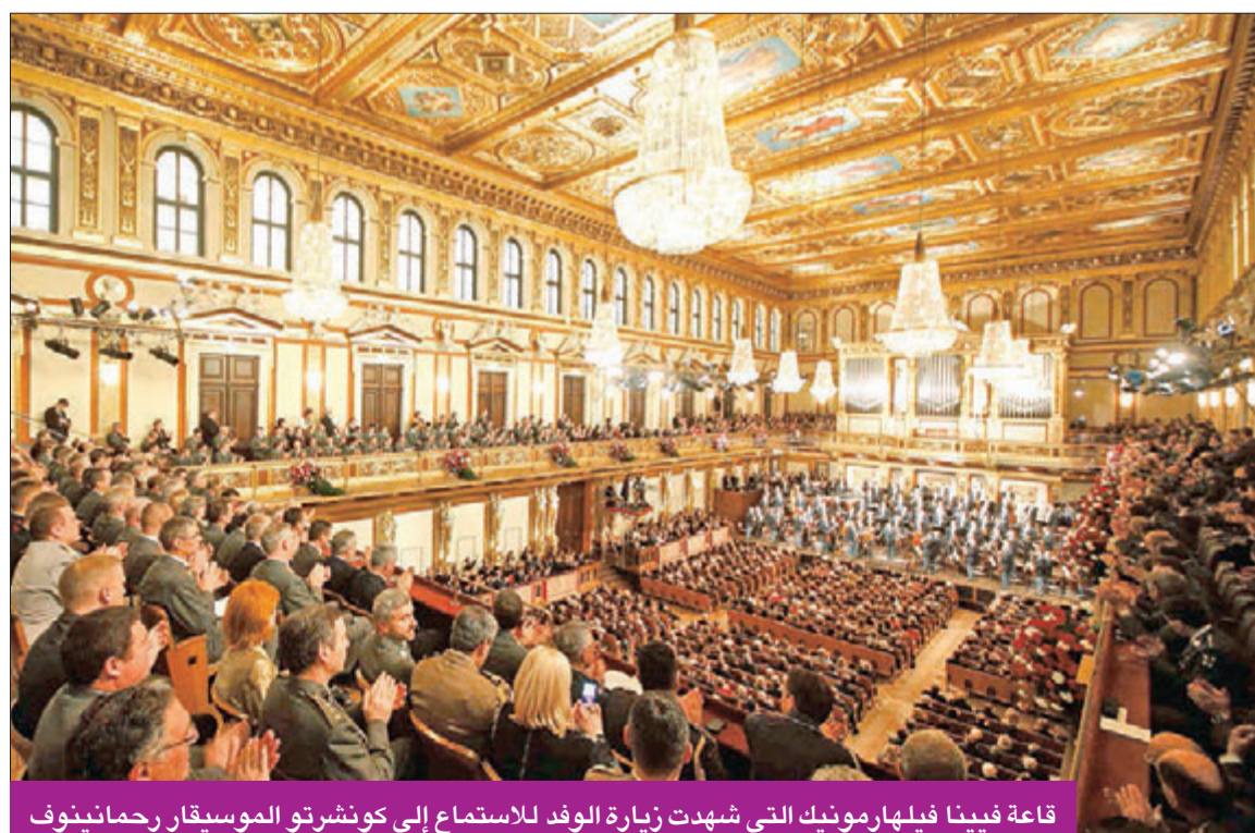
قاعة فيينا فيلهارمونيك التي شهدت زيارة الوفد للاستماع إلى كونشرتو الموسيقار رحمانينوف