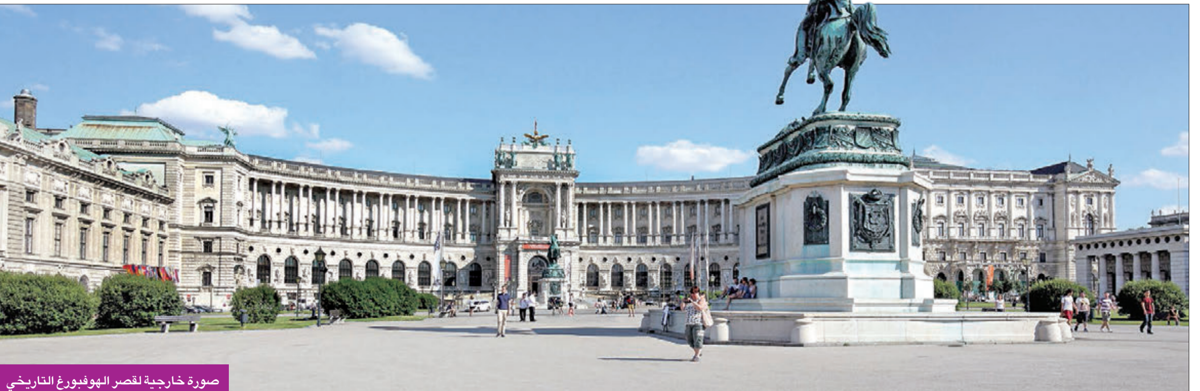
صورة خارجية لقصر الهوفبورغ التاريخي

يعتبر قصر الهوفبورغ من أهم المباني التاريخية، وتم بناؤه في العصور الوسطى عام 1279، ومعنى التسمية باللغة الألمانية «قصر المحكمة»، وكان في الأصل مقر الأسرة الحاكمة في فيينا منذ إنشائه حتى عام 1918 بعد خسارة إمبراطورية النمسا العالمية الأولى. وبعد نهاية الحرب العالمية الثانية أصبح القصر مقرا لرئيس