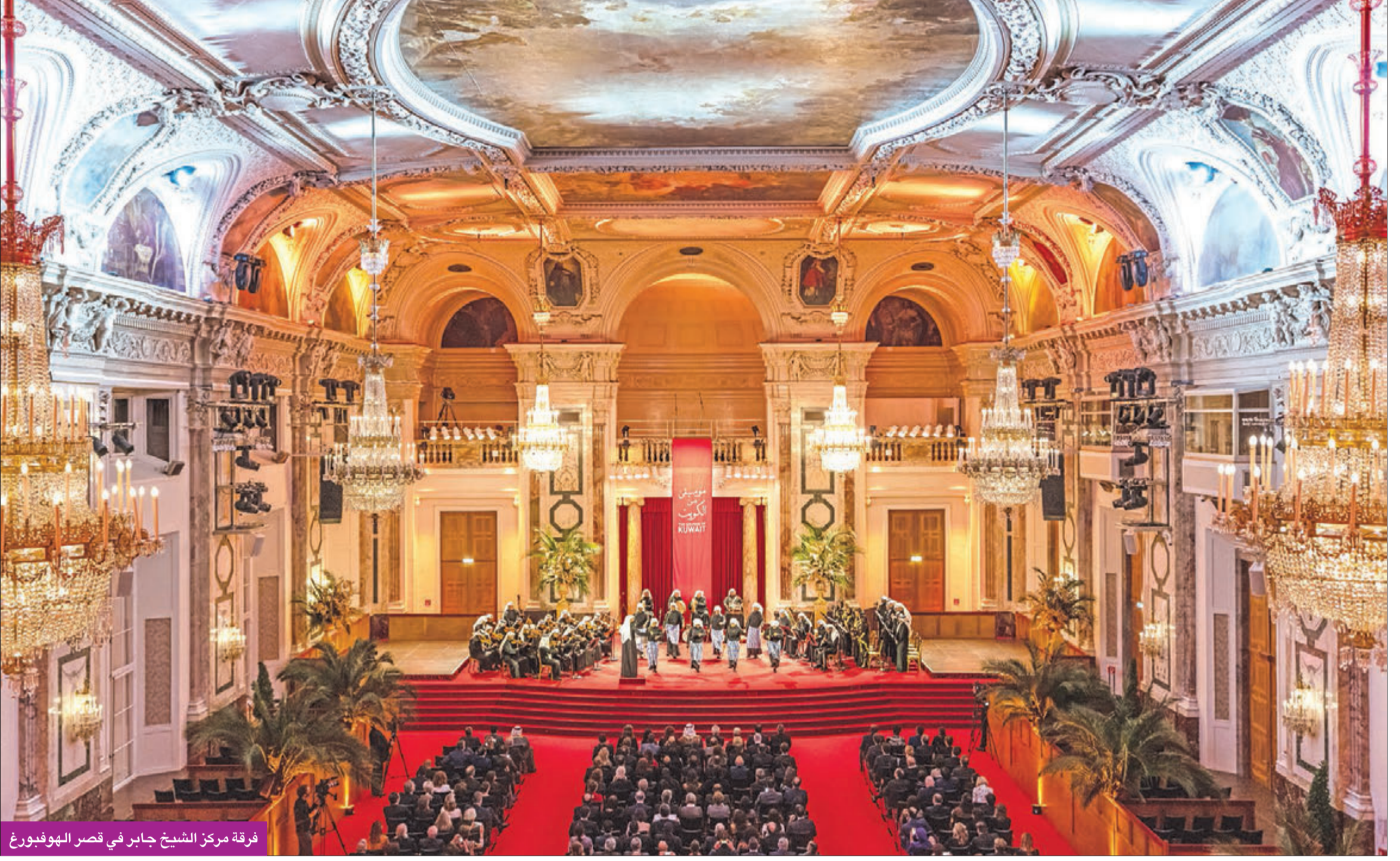
فرقة مركز الشيخ جابر في قصر الهوفبورغ

فرقة مركز الشيخ جابر الأحمد الثقافي تحيي الأمسية في قصر الهوفبورغ التاريخي