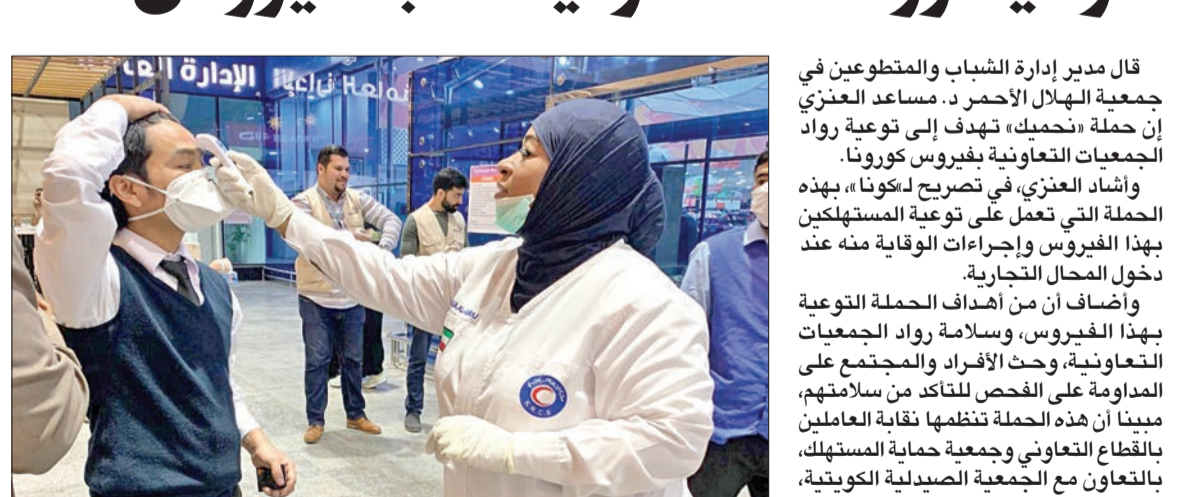
جانب من حملة الهلال الأحمر