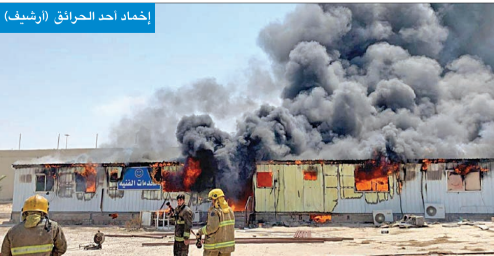
إخماد أحد الحرائق (أرشيف)

4492 حريقاً تجاوزت قيمة خسائرها 5.1 ملايين دينار