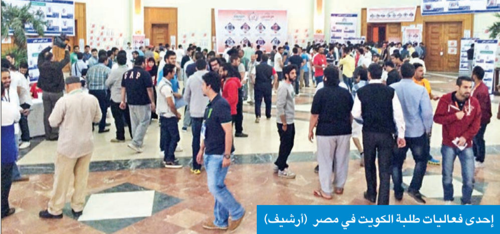
إحدى فعاليات طلبة الكويت في مصر (أرشيف)

«اتحاد الطلبة» لـ الجريدة : من إجمالي 15 ألف كويتي يدرسون في مختلف الجامعات