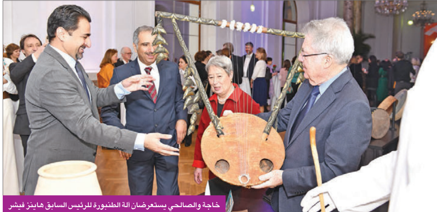
خاجة والصالحي يستعرضان آلة الطنبورة للرئيس السابق هاينز فيشر

هاينز فيشر أشاد بفرقة مركز الشيخ جابر الأحمد الثقافي وأكد عمق العلاقات بين النمسا والكويت