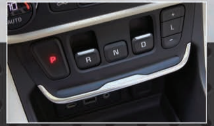
ناقل حركة إلكتروني متطور عالي الدقة بـ 9 سرعات