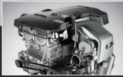
مُحَرِّك قوي مزوّد بتيربو مزدوج