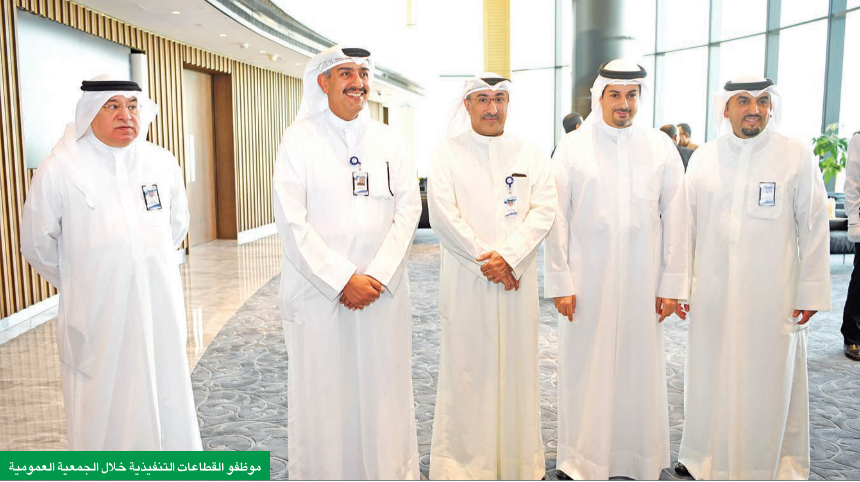
موظفو القطاعات التنفيذية خلال الجمعية العمومية

البنك المجتمعية بنحو 11 في المئة خلال عام 2019 بما فيها مساهماتنا في مستشفى بنك الكويت الوطني للأطفال، وكذلك عدد من المبادرات التي تضم مختلف القطاعات من الصحة، والتعليم، والشباب، والبيئة، والرياضة، والثقافة.