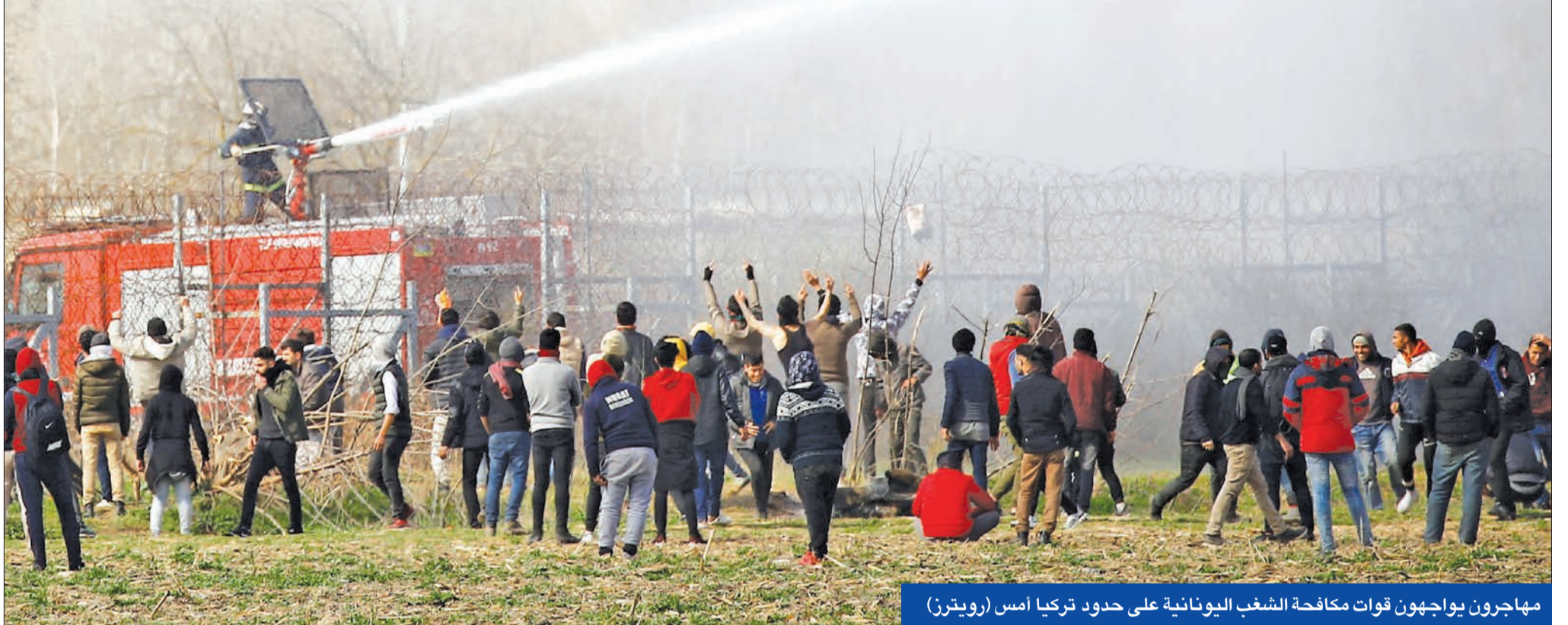
مهاجرون يواجهون قوات مكافحة الشغب اليونانية على حدود تركيا أمس

الطائرات تغيب عن سماء إدلب مرة لأول منذ 3 أشهر... وواشنطن عرقلت اتفاق موسكو أمياً