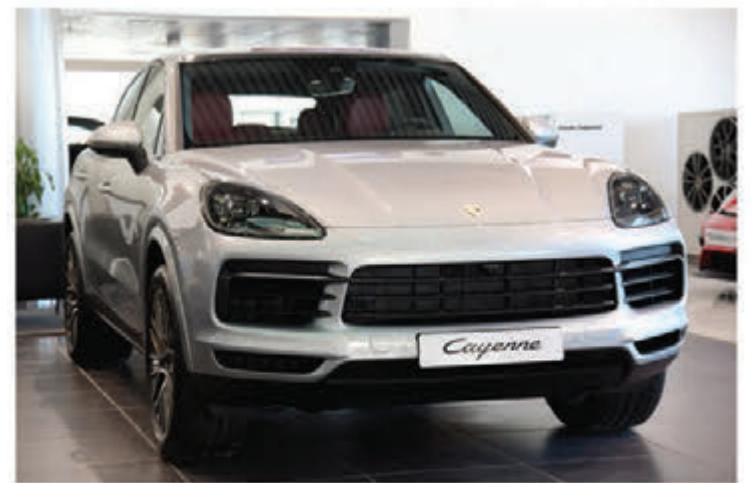
كاين كوبيه الجديدة كلياً