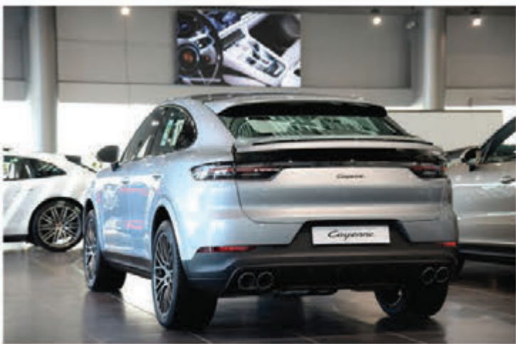
تميز كاين كوبيه بتصميم خلفي جديد كلياً

ومن المتوقع أن يحظى وصول بورشه تايبان الجديدة كلياً، التي ستطرح في ثلاث طرازات هي توربو، وتوربو إس، و4 إس، باهتمام كبير من عشاق سيارات بورشه ومحبي السيارات