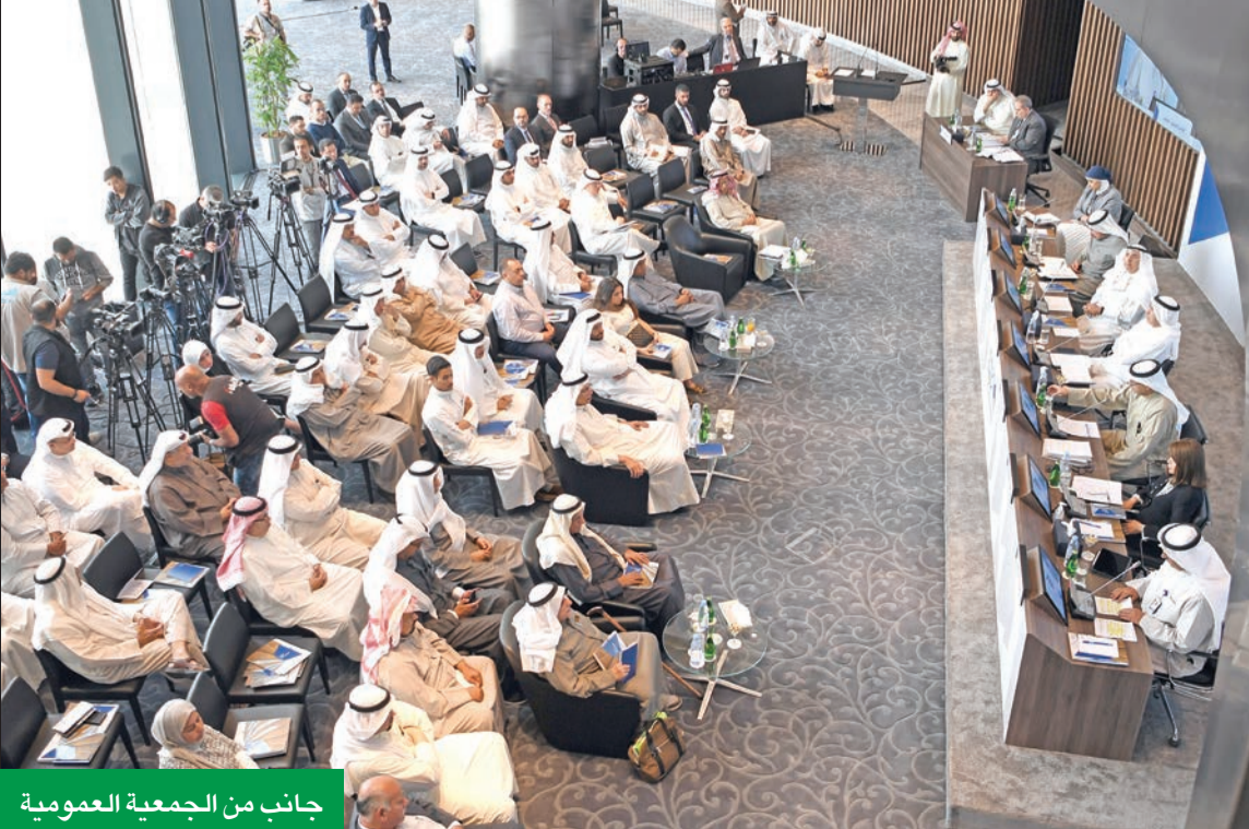
جانب من الجمعية العمومية