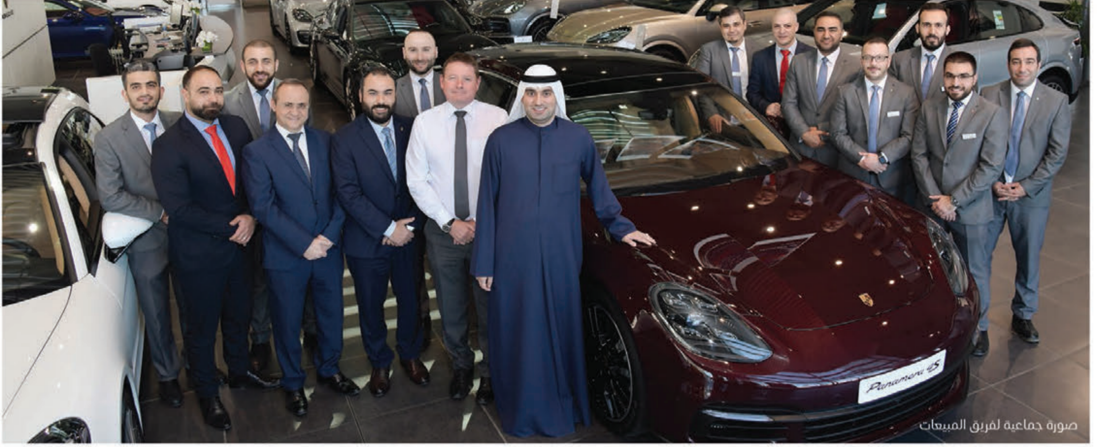
صورة جماعية لفريق المبيعات