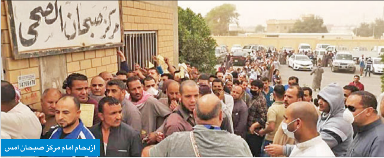
ازدحام امام مركز صباح امس

طالب النائب ناصر الدوسري بإجلاء الطلبة الكويتيين من مصر، قائلاً: تابعنا باهتمام رسالة الطلبة الكويتيين المتبعثين للدراسة في جمهورية مصر الشقيقة، ويجب أن تأخذها الحكومة بمحمل الجد وتقوم بإجلائهم من هناك فوراً.