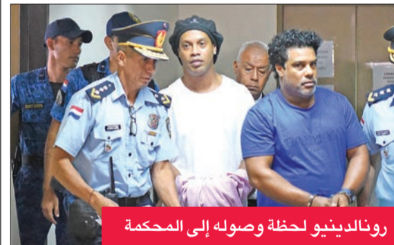
رونالدينو لحظة وصوله إلى المحكمة

باكتشاف عصابة لتزوير وثائق ثم أخرجاً من القضية، مضيقاً الشقيقين تصرفاً «بحسن نية» في قضية تلقي وثائق الباراغواي المزورة.