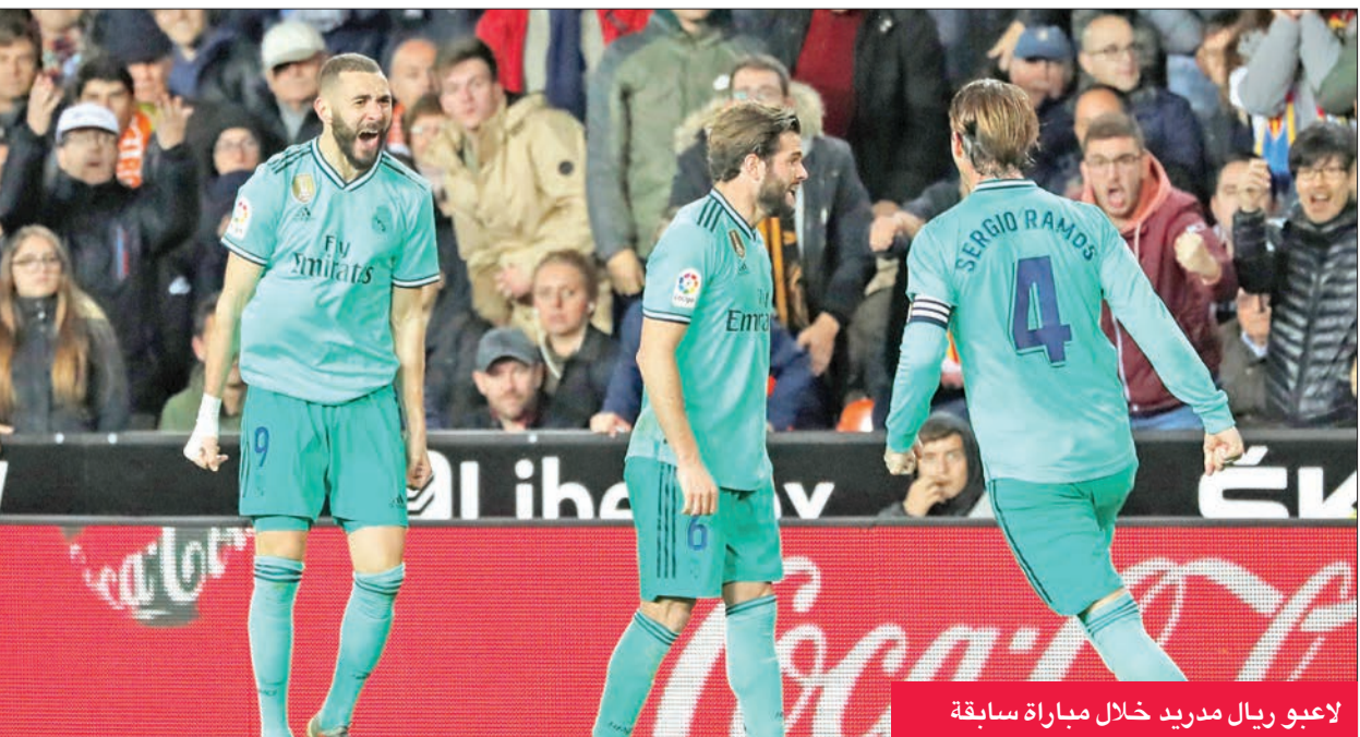
لاعبو ريال مدريد خلال مباراة سابقة

يسعى ريال مدريد للحفاظ على صدارة الدوري الإسباني لكرة القدم، عندما يحل اليوم ضيفاً على ريال بيتيس ضمن المرحلة السابعة والعشرين. وعلى الرغم من ابتعاد ريال عن بيتيس بفارق 26 نقطة في الترتيب، ورغم أن المضيف لم يفر في آخر عشر مباريات سوى مرة واحدة، بالإضافة إلى خمسة تعادلات وأربع خسارات، فإن «المرينغي» لم يفر على خصمه الأندلسي في آخر مباراتين بينهما وكانت في مدريد (فاز بيتيس 2- صفر، وتعادلا سلباً).