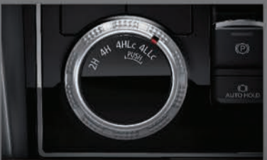
نظام Super Select للدفع الرباعي / ناقل حركة أوتوماتيكي 8 سرعات