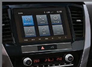
شاشة عرض ذكية