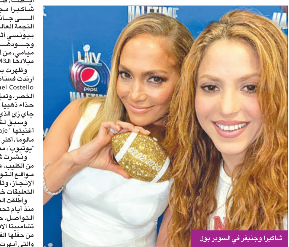
شاكيرا وجينيفر في السوبر بول

أصدرت النجمة العالمية شاكيرا فيديو كليب لأغنيها الجديدة «Me Gusta»، على قناتها الرسمية في «يوتيوب»، وبدأت الأغنية تحقق رواجاً كبيراً بين الجمهور رغم مرور وقت قصير على طرحها، فقد اقتربت من النصف مليون مشاهدة خلال ساعتين فقط. الجدير بالذكر أن وكالة الاتصالات الفدرالية الأمريكية كانت تلقت مؤخراً أكثر من 1300 بلاغ يصف أداء النجمتين شاكيرا وجينيفر لوبيز بأنه «عرض خادش»، وذكرت الوكالة لشبكة NBC أنها بصدد نشر شكاوى المشاهدين في 49 ولاية، معظمهم لم يوافقوا على أداء الفنانيتين، عبر موقعها الرسمي على الإنترنت.