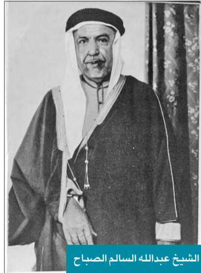
الشيخ عبدالله السالم الصباح

1- تحرير كتاب إلى رئيس المحكمة الشيخ عبدالله الجابر يبلغ فيه بخصوص قضية ..... سينتهي إليه المجلس براهيه في اختيار الوصي على أموال الوارثين القصر عندما تصفى جميع الموجودات. 2- تحرير كتاب إلى ..... يبلغ فيه أنه يمكن ل ..... من الإطلاع على دفاتر المرحوم ..... للتحقق عن تنازل المذكور للطلب الذي له على أخيه. 3- تحرير كتاب إلى عبدالوهاب بن