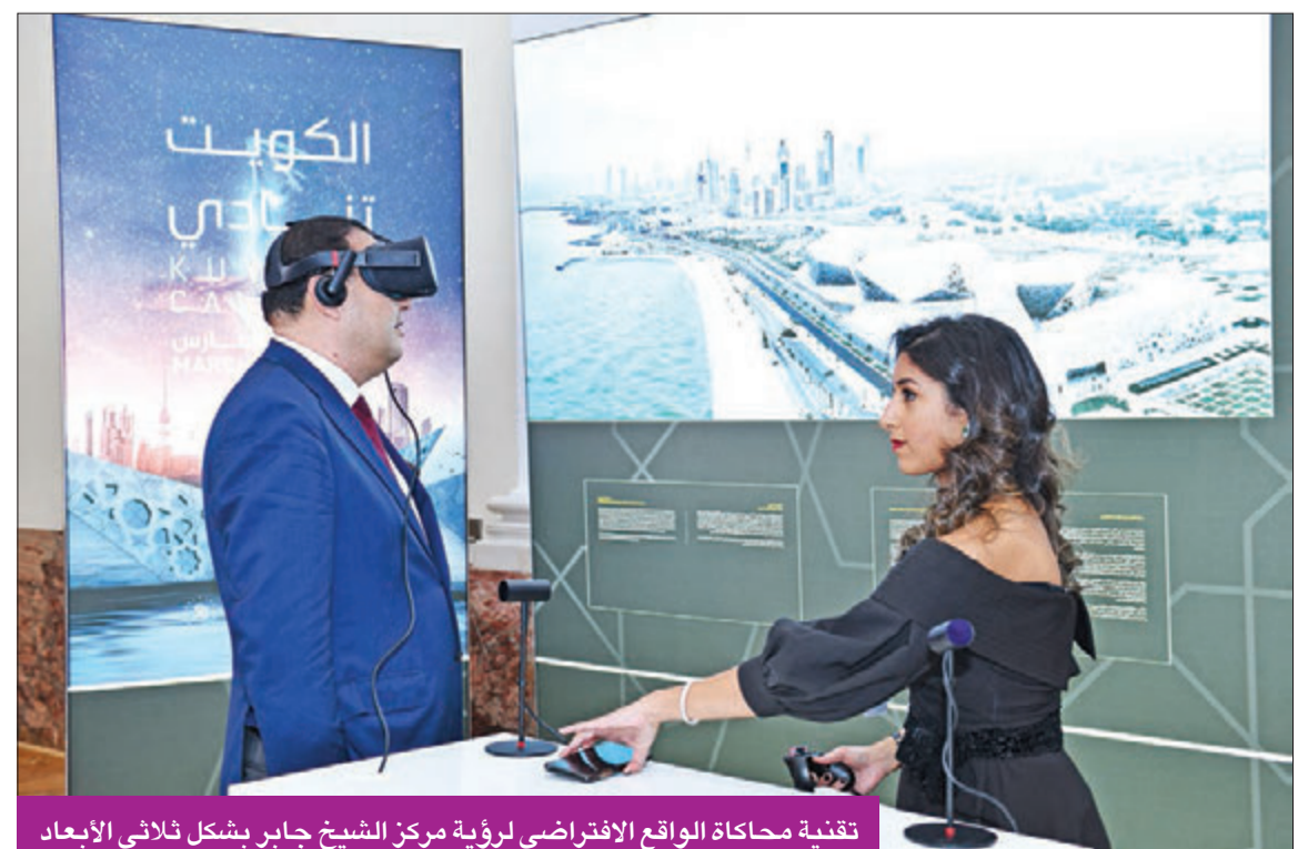
تقنية محاكاة الواقع الافتراضي لرؤية مركز الشيخ جابر بشكل ثلاثي الأبعاد