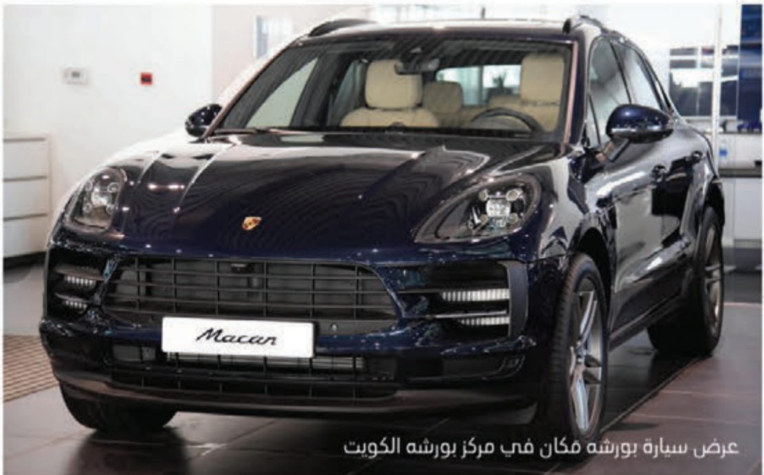
عرض سيارة بورشه مكان في مركز بورشه الكويت

وسيتم تجهيز مركز بورشه الشويخ، الذي من المقرر افتتاحه في عام 2021، بألواح شمسية تزيد مساحتها عن 20,000 متر مربع وتولّد 1000 كيلو واط من الكهرباء، وسيحظى الزائرون باستقبال حافل بمجرد وصولهم إلى طابق الميزانين في المعرض حيث يمكنهم الاختيار ما بين مشاهدة أكثر من 20 تشكيلة مختلفة من السيارات المعروضة، أو القيام بجولة في متحف يضم مجموعة متنوعة من سيارات بورشه الكلاسيكية وسيارات السباقات أو الاستمتاع بتناول كوب من القهوة في مقهى بورشه كاريرا.