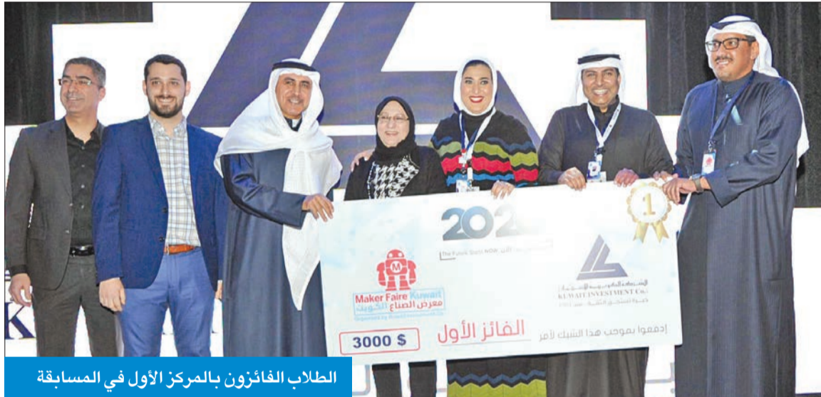
الطلاب الفائزون بالمركز الأول في المسابقة

وأعربت الكلية عن فخرها بإنجازات طلابها، مخمئة جهود معرض الصناع Maker Faire، ومنح طلابها فرصة رائعة لتحدي أنفسهم وإظهار مهاراتهم وقدراتهم.