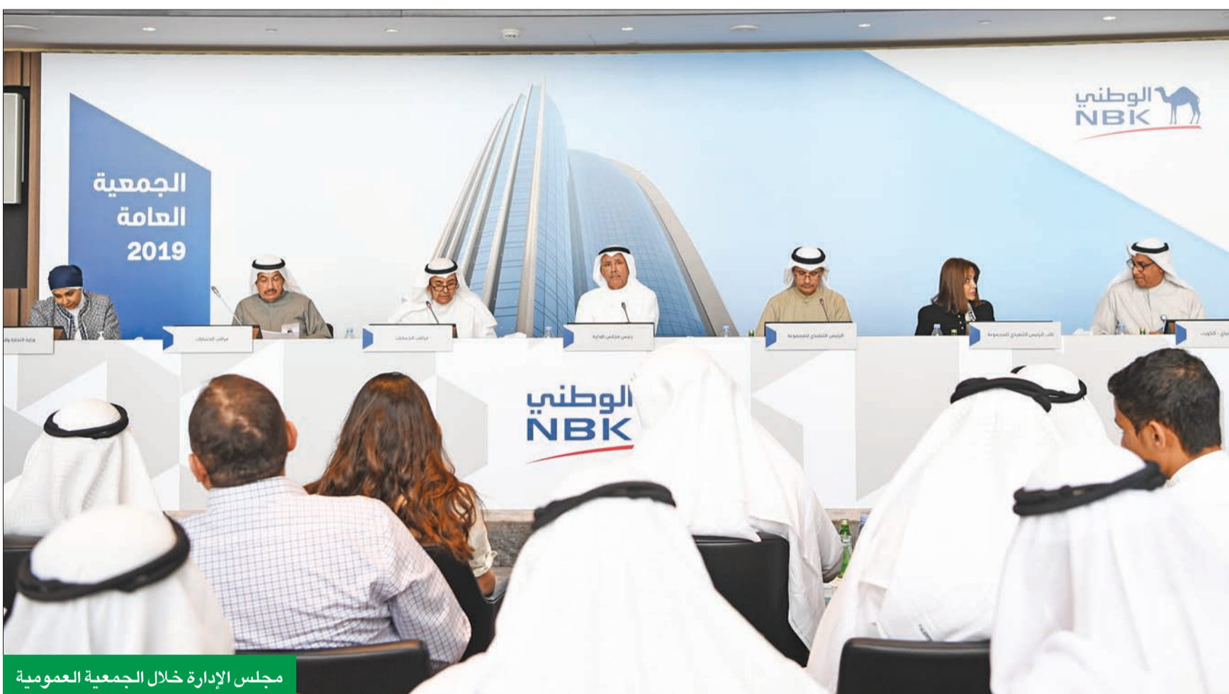
مجلس الإدارة خلال الجمعية العمومية

الجمعية انعقدت بنسبة حضور 77.86% ووافقت على توصيات مجلس الإدارة