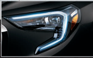
إضاءة نهارية LED مميزة