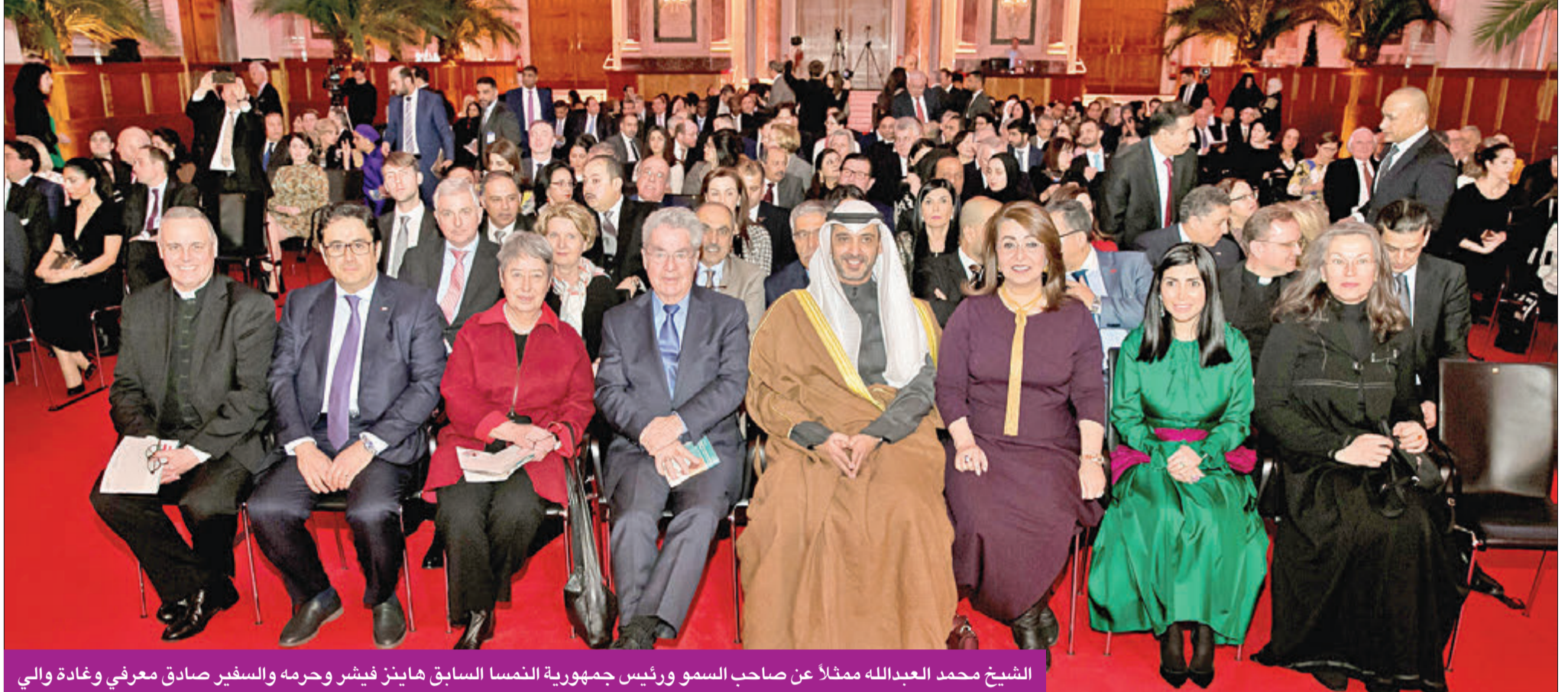
الشيخ محمد عبدالله ممثلاً عن صاحب السمو ورئيس جمهورية النمسا السابق هاينز فيشر ورحمه والسفير صادق معرفي وغادة والي