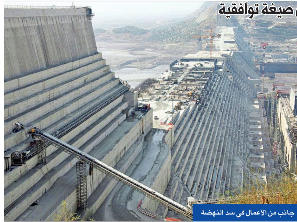
جانب من الأعمال في سد النهضة