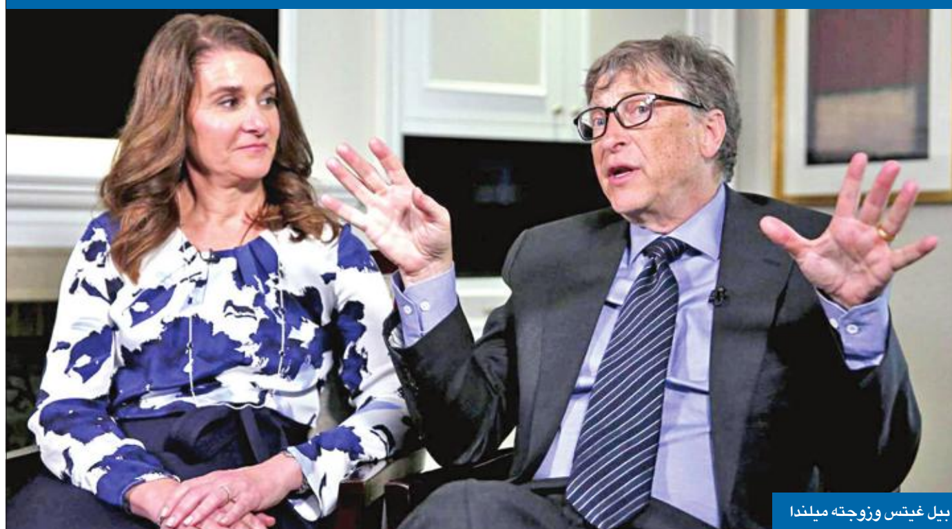
بيل غيتس وزوجته ميلندا

أعلن بيل غيتس، أحد مؤسسي شركة مايكروسوفت، تخديه عن مجلس إدارة الشركة، لكي يتمكن من التفرغ لمتابعة مشاريعه وأنشطته الخيرية.