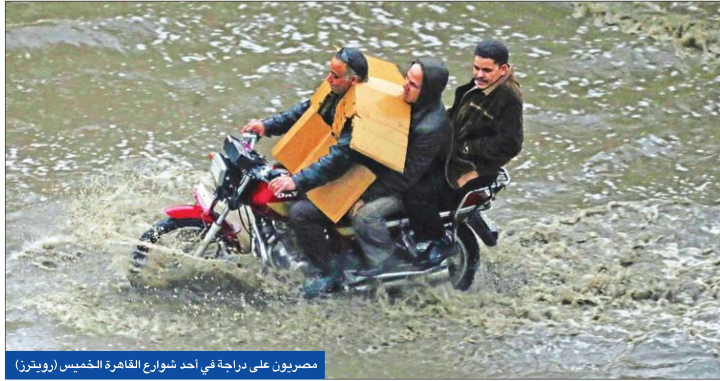
مصريون على دراجة في أحد شوارع القاهرة الخميس

وكانت الأمطار الغزيرة التي وصلت إلى حد السيول قد ضربت معظم المحافظات المصرية على مدار ساعات يوم الخميس، واستمرت في بعض المناطق ليوم الجمعة، وأدت إلى إصابة أكبر دولة عربية من حيث عدد السكان (100 مليون نسمة) بالشلل التام، إذ تأثرت سلباً حركة المرور والقطارات والموانئ والمطارات، فضلاً عن لجوء السلطات المصرية لمنح إجازة رسمية لجميع المدارس والجامعات والعاملين بالدولة، وقطع المياه عن معظم أنحاء القاهرة الكبرى لإتاحة الفرصة لشبكة الصرف الصحي المتهاككة من أجل تصريف