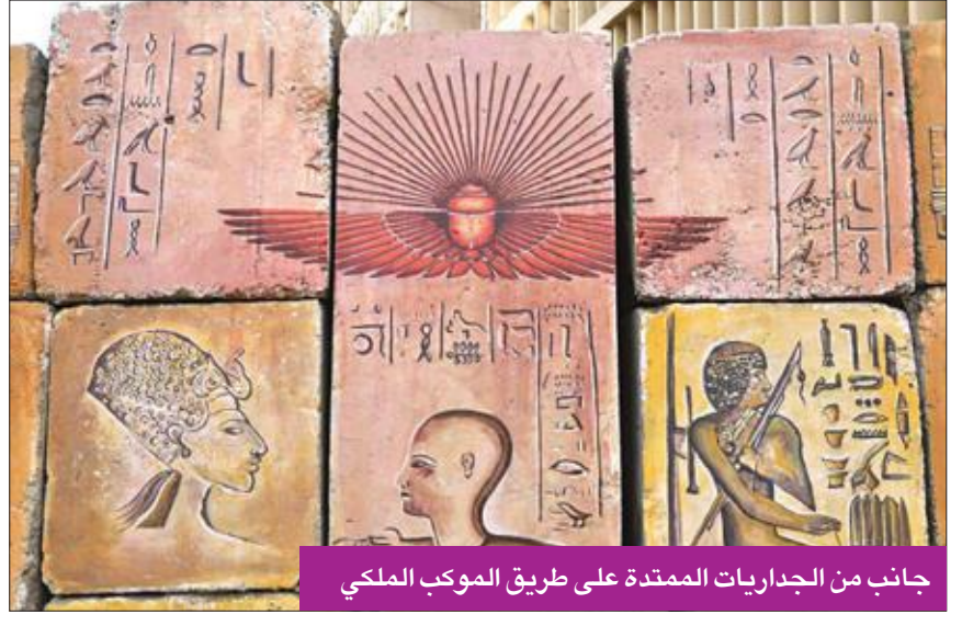
جانب من الجداريات الممتدة على طريق الموكب الملكي