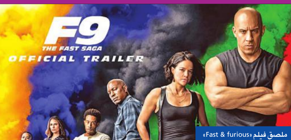
ملصق فيلم «Fast & furious»

في حادث سيارة مروّع وهو في طريقه لحضور حفل خيري، والذي وقع أثناء تصوير الجزء السابع من السلسلة، كما حققت الموسيقى التصويرية للفيلم نجاحاً عالمياً. وكانت الشركة المنتجة استوديوهات يونيفرسال قدمت عرضاً خاصاً للفيلم في فبراير الماضي في إطار حفل غنائي كبير، أحياه عدد من نجوم الغناء العالمي، وهم «كاردي بي، أورزونا، لوداكريس، ويز خليفة، تشارلي بوث»، وكان العرض يهدف إلى التشويق وجذب الانتظار للفيلم.