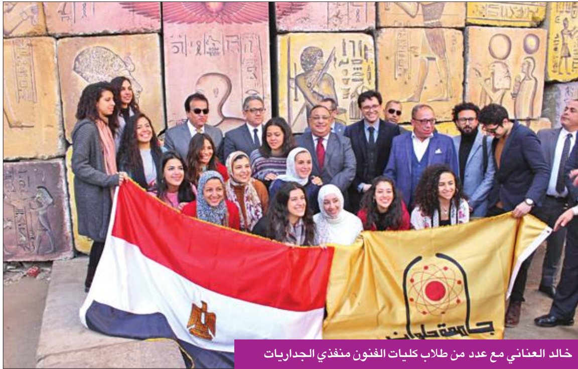
خالد العناني مع عدد من طلاب كليات الفنون منغدي الجداريات

رغم عدم تحديد موعد بعينه لنقل عدد من المومياءات الفرعونية الملكية من المتحف المصري في ميدان التحرير إلى المتحف القومي للحضارة بمنطقة الفسطاط، بات من المؤكد أن الموعد اقترُب، في ظل الاستعدادات الكبرى التي تجريها الحكومة المصرية حالياً لهذا الحدث العالمي المرتقب. وكانت أحدث التجهيزات تفقد وزير السياحة والآثار، خالد العناني، للجداريات التي ستزين الموكب.