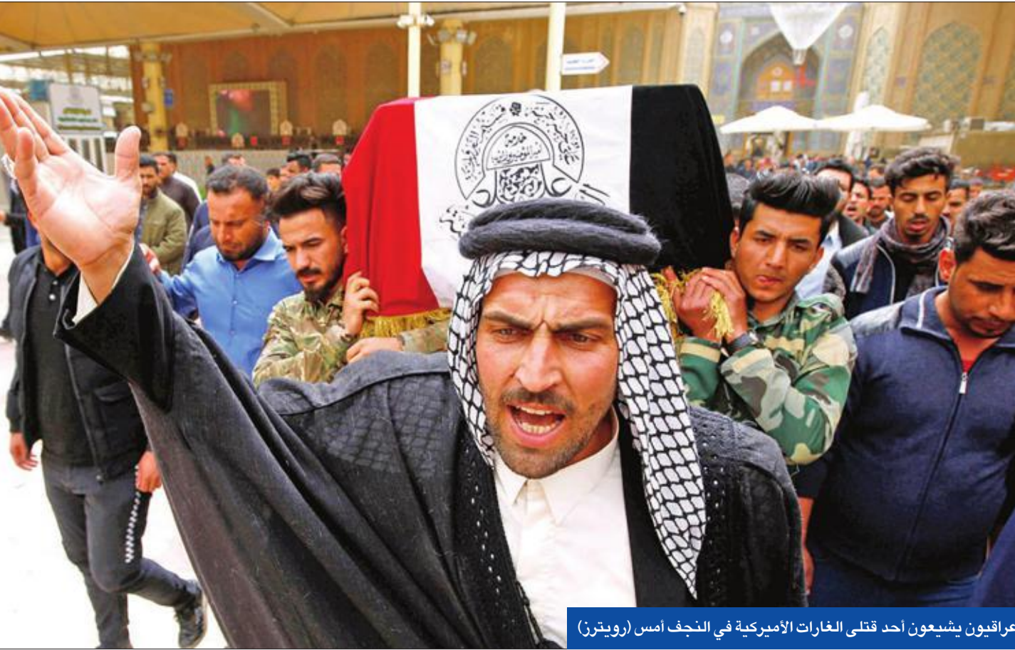
عراقيون يشيعون أحد قتلى الغارات الأميركية في النجف أمس

طهران ترفض اتهامات واشنطن لها بالوقوف وراء الهجوم الأول وتحذرها من الإقدام على «أفعال خطيرة»