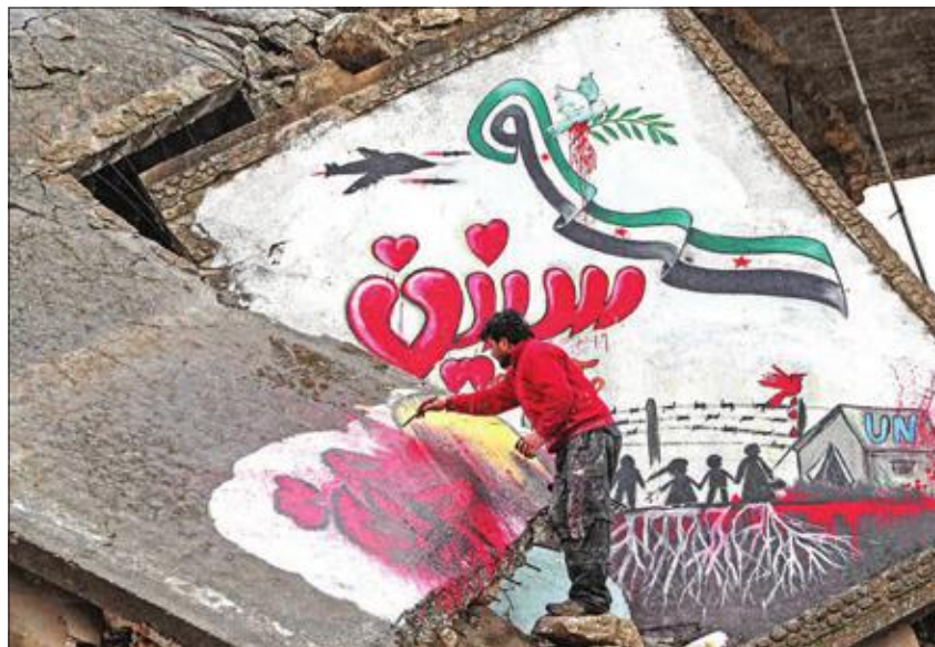
سوري يرسم على أنقاض مبنى مدمر في بنش يادلب

وكان الرئيس الروسي فلاديمير بوتين، ونظيره التركي رجب طيب أردوغان وفاقاً الأسبوع الماضي على وقف إطلاق النار في إدلب، ووافقا على مراقبة ممر أمن على طول الطريق الدولي «إم فور»، من بين إجراءات أخرى. وكان هناك وفد عسكري روسي في أنقرة هذا الأسبوع للتشسيق على الإجراءات المزمعة. وقال أكار إن بدء الدوريات المشتركة اليوم.