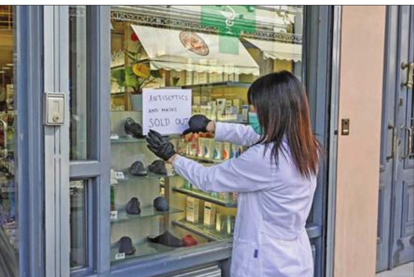
ليس لدينا كامات ولا معقمات هكذا كتب على ورقة تقوم عاملة بإحدى صيدليات أثينا بلصقتها على واجهة الصيدلية أمس

التي ذلك، تعتزم الحكومة البريطانية سنّ قوانين للطوارئ هذا الأسبوع لحظر التجمعات العامة في محاولة للحد من انتشار الفيروس، في تصعيد لخطة الأزمة التي قال منقادوها إنها شديدة التراخي. وقام رئيس الوزراء بوريس جونسون حتى الآن بصفحة لتطبيق بعض الإجراءات الصارمة المطبقة في بلدان أوروبية أخرى لإبطاء انتشار الفيروس. لكن تم أمس تعليق كافة مباريات الدوري الإنجليزي حتى الرابع من أبريل، في وقت أرجأ المنظمون أحداثاً رياضية أخرى، مثل ماراثون لندن. وقال مصدر بالحكومة «صغنا تشريعا للطوارئ لمنع الحكومة السلطات المطلوبة للتعامل مع فيروس كورونا بما في ذلك سلطات منع التجمعات العامة وتعويم المنظمين». وأضاف: «سننشر هذا التشريع خلال الأسبوع الحالي» وقالت وسائل إعلام بريطانية إن حظر التجمعات العامة قد