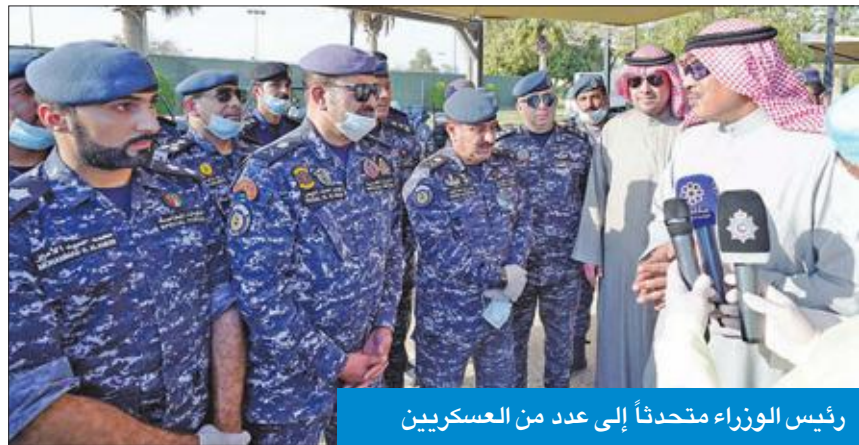
رئيس الوزراء متحدثاً إلى عدد من العسكريين

وفي ختام تصريحه، أعرب سموه عن تقديره الكبير واعتزازه البالغ للجهود التي بذلتها وزارة الصحة