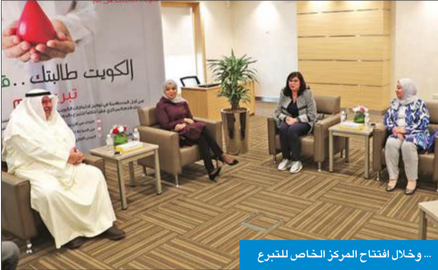
... وخلال افتتاح المركز الخاص للتبرع