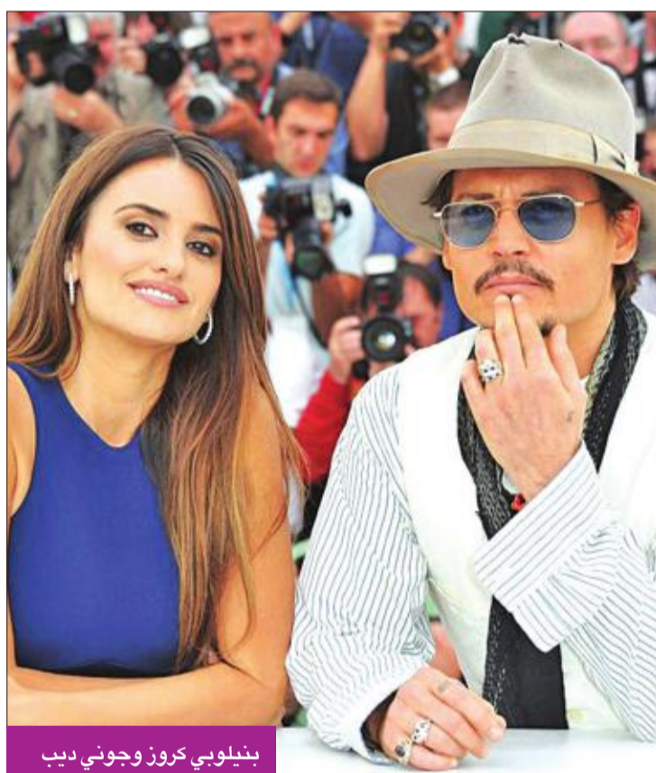
بنيلوبي كروز وجوني ديب

وصلت إيرادات فيلم الأنيميشن (Onward) إلى 101 مليون و690 ألف دولار، منذ طرحه في 6 الجاري بدور العرض حول العالم. وكان العمل حقق افتتاحية وصلت إلى 12 مليوناً و166 ألف دولار، في 4310 دور عرض. فيلم الأنيميشن من إنتاج شركتي Pixar و Disney، ويدور حول شقيقين قرمان في سن المراهقة يقعان في عالم خيالي، حيث يريدان تضيبة يومهم الأخير مع والدهما، الذي توفي عندما كانا صغارا. يُذكر أن الفيلم جاء بأصوات النجوم: توم هولاند وكريس برات وجون راتزينبرجر وجوليا لويس ديفوس وأوكتافيا سبنسر.