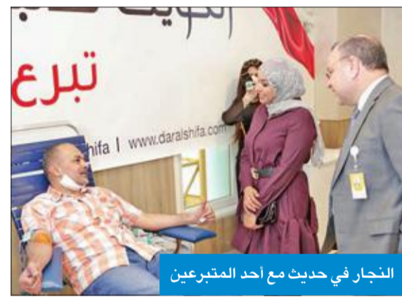
النجار في حديث مع أحد المتبرعين

افتتح مستشفى دار الشفاء، أمس، مركزاً خاصاً للتبرع بالدم، بالتعاون مع بنك الدم الكويتي، بحضور الوكيل المساعد لشؤون القطاع الصحي الأهلبي وزارة الصحة فاطمة النجار، والمديرة الطبية لبنك الدم المركزي الكويتي د. ريم الرضوان، حرصاً من المستشفى على المساهمة في سد احتياجات الكويت من مخزون الدم، في ظل الظروف الصحية التي تمر بها البلاد والعالم بأسره.