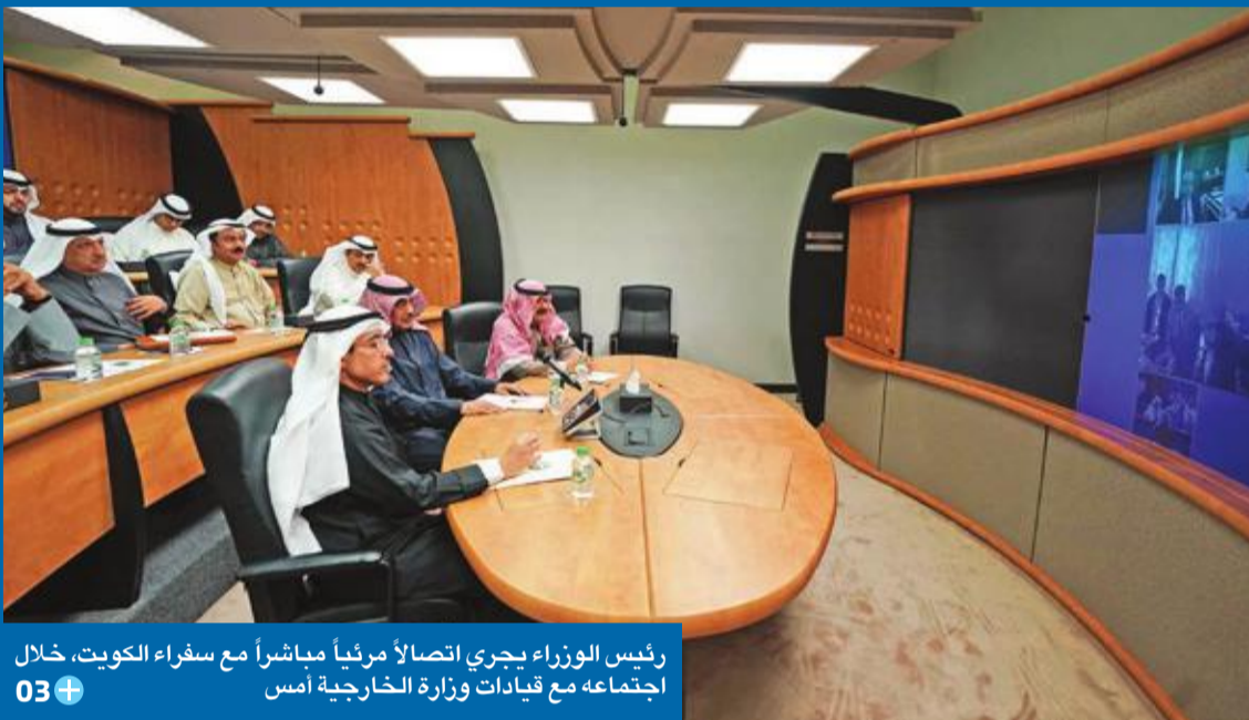
رئيس الوزراء يجري اتصالاً مرئياً مباشراً مع سفراء الكويت، خلال اجتماعه مع قيادات وزارة الخارجية أمس

وشدد على الدعم الحكومي الكامل لكل ما يسهل ويساعد قيام الوزارة والجهات التابعة لها بعملها المطلوب، لافتاً في الوقت ذاته إلى أهمية دور المنتجين المحليين في تزويد السوق بكل احتياجاته، «وعلياً مساعدتهم بأن يكونوا رافداً للدولة في توفير السلع والمنتجات الأساسية».