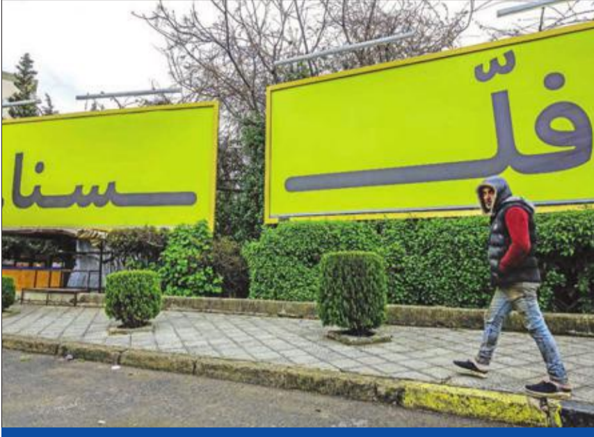
شاب يمر أمام لافتة تنتقد الوضع الاقتصادي في طرابلس

ملف التشكيلات القضائية يغيب عن طاولة الحكومة