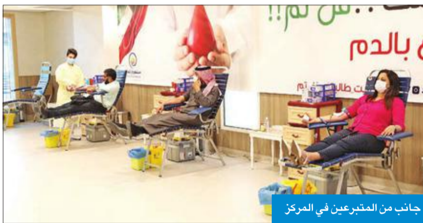
جانب من المتبرعين في المركز

كما أشاد جراق بالتنظيم المتميز في إدارة استقبال المتبرعين، تطبيقاً لجميع المعايير التي يلتزم بها