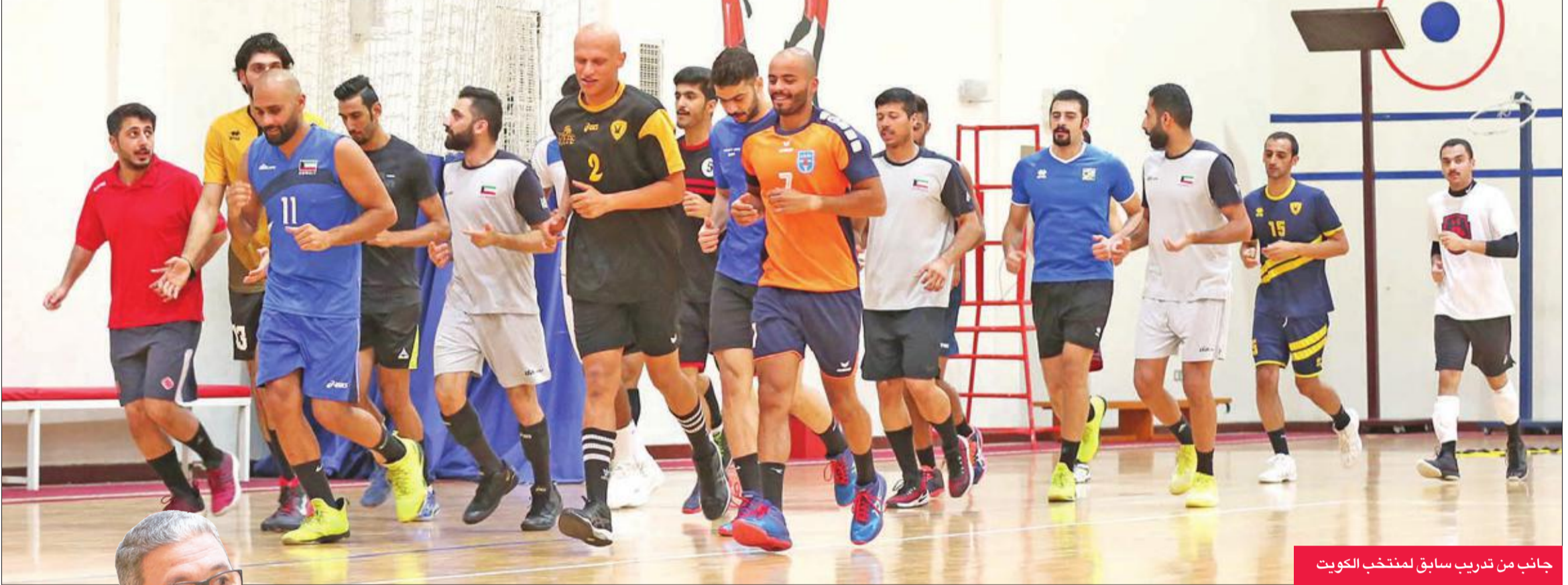
جانب من تدريب سابق لمنتخب الكويت

أكد أن هيئة تدريب المنتخب الوطنية لديها خطة طويلة الأجل