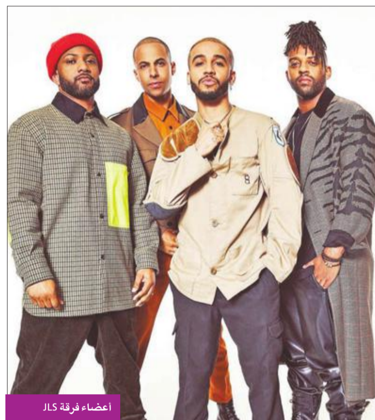
أعضاء فرقة JLS

دافعت النجمة بنيلوبي كروز عن النجم جوني ديب حول خلافه مع زوجته السابقة الممثلة امبر هيرد، ووقفت إلى جانب صديقتها ديب، ووصفته بأنه كريم ولطيف. وقالت: «قابلت جوني حينما كنتُ بعمر 19. في ذلك الوقت لم يكن بمقدوري سوى نطق جملتين باللغة الإنكليزية، هما: كيف حالك؟ وأريد العمل مع جوني ديب». وتابعت: «مُرت سنوات عديدة لم أشاركه فقط ثلاثة أفلام فحسب، بل اعتمدت عليه كصديق عظيم، فقد أعجبت دائماً بلطفه، وعقله الفذ، وموهبته، وروحته الفكاهية الغريبة، وكرمه». يُذكر أن هيرد اتهمت ديب بتعنيفها وإساءة معاملتها.