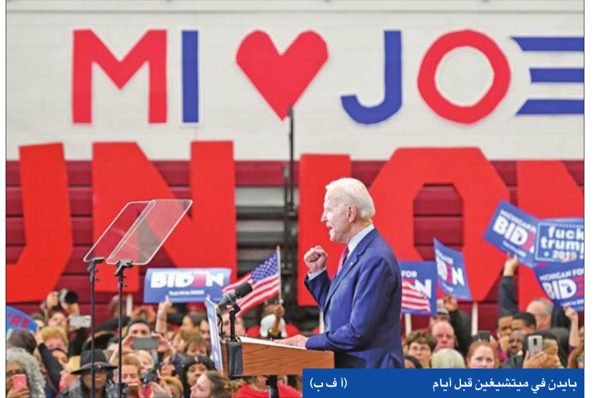
بايدن في ميتشيغن قبل أيام

فاز في 3 ولايات بالانتخابات التمهيديّة للحزب الديمقراطي