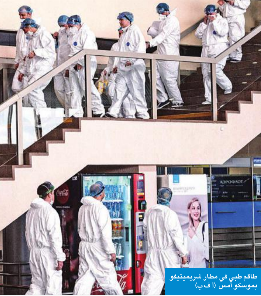
طاقم طبي في مطار شريميتيفو بموسكو أمس

التي كشف عنها على موقع الحكومة الإلكتروني، حيز التنفيذ فوراً، وتمتد على سنتين كحد أقصى. وذكرت صحيفة «ذي تايمز» أن مشروع القانون سيعتمد خلال الأسبوع الراهن دون أن يصوت عليه النواب، إن الأحزاب السياسية وافقت على الإجراءات التي يحويها، ويفترض أن يدخل القانون حيز التنفيذ قبل العطلة البرلمانية الأسبوع المقبل، وانتقد النائب العمالي كريس براينت «إجراءات الطوارئ الصارمة»، مطالباً بإشراف منظم للبرلمان خلال فترة السنتين. وأعلنت إيران أمس 147 وفاة جديدة بوباء كورونا، مما يشكل