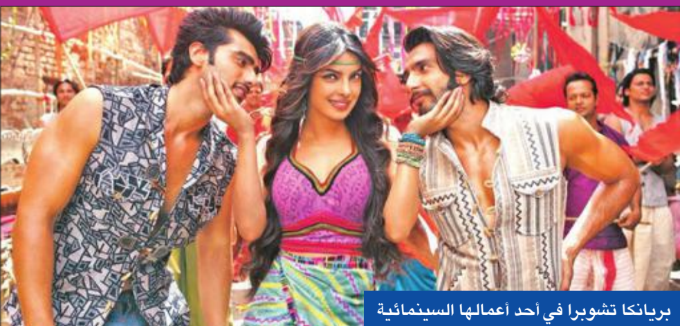
بريانكا تشوبرا في أحد أعمالها السينمائية

وهو أحد أشهر الأضرحة بالهند. ولم تشهد الهند، التي يبلغ تعداد سكانها 1.3 مليار نسمة، سوى حالتين وفاة جراء «كورونا». وبدأت العديد من الحكومات حظر التجمعات الكبيرة، وبدأت غلق المجمعات التجارية ودور السينما. لكن خبراء الصحة أعربوا عن قلقهم من أن الهند لا تمتلك البنية الطبية الملائمة للتعامل مع ارتفاع كبير في الحالات المصابة بـ«كورونا».