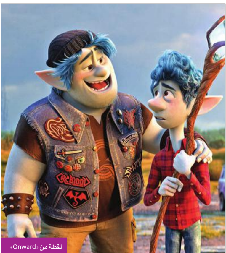
لقطة من «Onward»

هيمن فيروس كورونا على أخبار دور العرض السينمائية في العالم، وكان الأكثر تداولاً بين المؤسسات الفنية الضخمة، بعدما ساهم في تحصيل أسوأ الإيرادات خلال الأسبوع الماضي، حيث تكبدت هذه المؤسسات خسائر لم تكن بالحسبان. وأشارت تقارير إعلامية إلى أن انخفاض إيرادات السينما تقترب من الخسائر التي واكبت أحداث 11 سبتمبر 2001. وضمن هذا السياق، قالت شركة والت ديزني، في بيان صحفي، إنها ستؤجل طرح فيلم «بلاك ويدو» بسبب تفشي «كورونا»، في ظل إغلاق دور العرض السينمائية، وتوجيه النصائح للناس بتجنب التجمعات. والفيلم الذي ينتمي إلى نوعية الحركة والإثارة من بطولة الممثلة سكارليت جوهانسون، وكان من المفترض أن يفتتح موسم الصيف السينمائي ويبدأ عرضه بصالات السينما في أول مايو. ولم تعلن «ديزني» موعداً جديداً لطرح الفيلم، الذي تدور أحداثه في عالم مارفل للأبطال الخارقين ضمن سلسلة أفلام أفغرز.