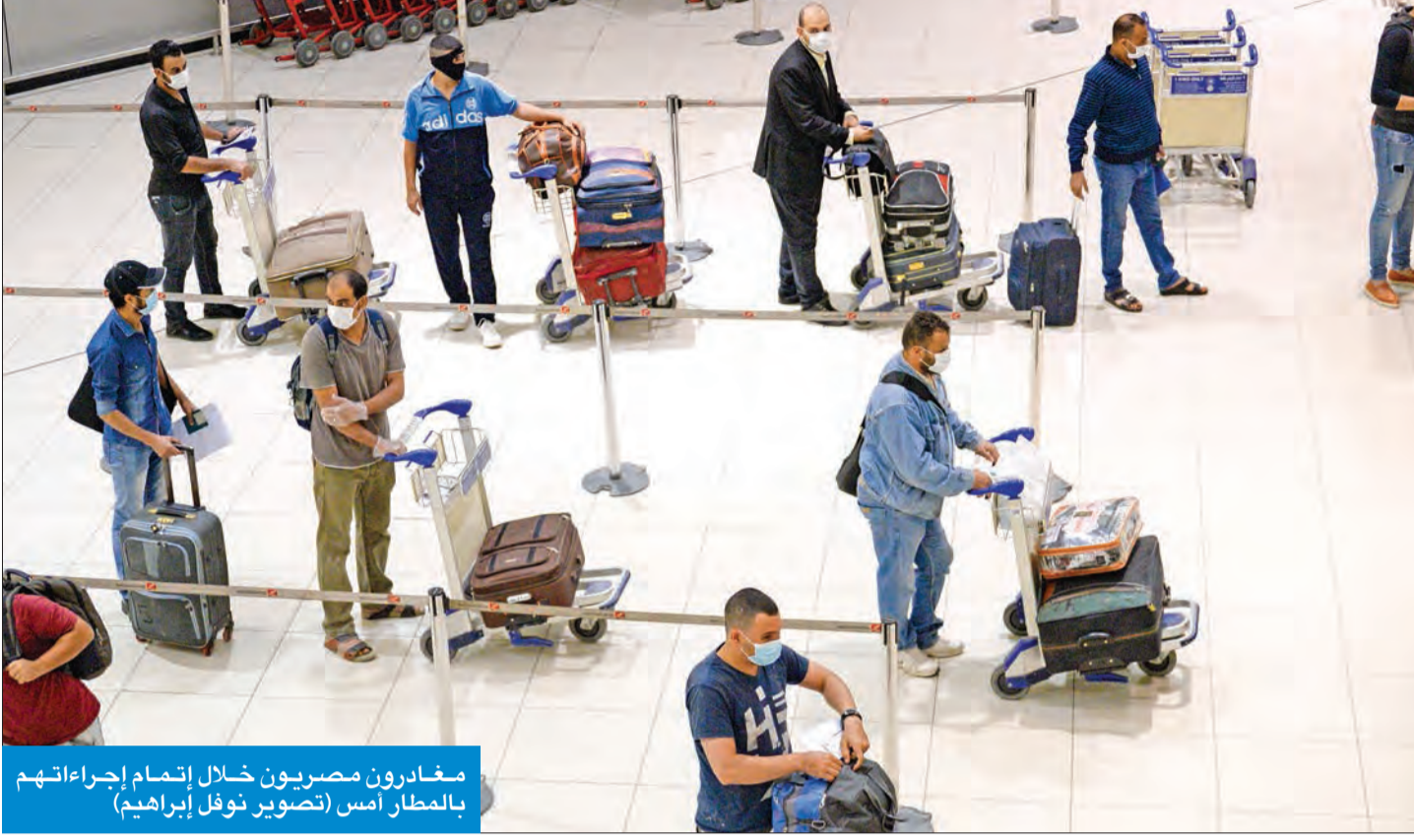
مغادرون مصريون خلال إتمام إجراءاتهم بالمطار أمس

• الفوزان لـ الجريدة: رحلتان أمس وأخريان اليوم • الفداغي لـ الجريدة: مغادرة 1200 مصري خلال يومين