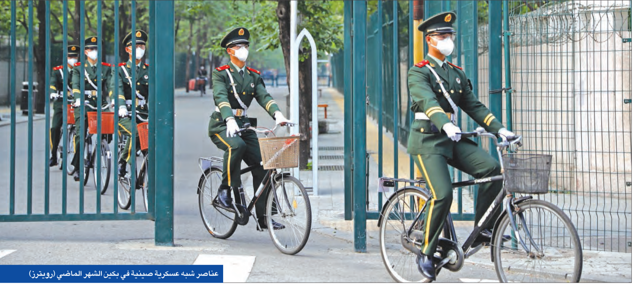
عناصر شبه عسكرية صينية في بكين الشهر الماضي

الاقتصادي والعسكري الأمريكي في أعقاب الحرب العالمية الثانية. وكانت رسالة نوبكوف رداً على برقية للدبلوماسي الأمريكي جورج كينان من موسكو قال فيها إن الاتحاد السوفياتي لا يرى إمكانية للتعايش السلمي مع الغرب، وإن الاحتواء هو أفضل استراتيجية على المدى البعيد.