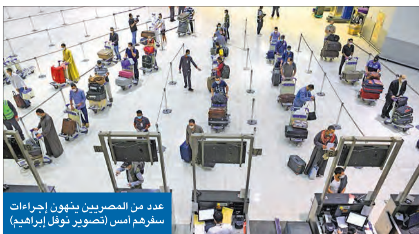
عدد من المصريين ينفون إجراءات سفرهم أمس

بعد يوم واحد من أعمال الشغب التي شهدتها مركزاً إيواء مخالفي الإقامة المصريين في كبد وجليب الشيوخ، احتجاجاً على عدم حسم أمر عودتهم إلى وطنهم، دشنت مصر أمس جسراً جويًا لإعادة مواطنيها العالقين في الكويت، بداتته برحلتين تابعتين لشركة مصر للطيران أقلتا 600 شخص.