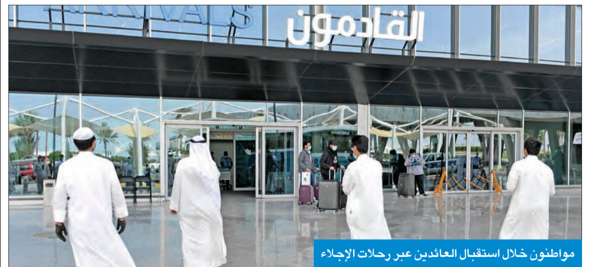
مواطنون خلال استقبال العائدين عبر رحلات الإجراء