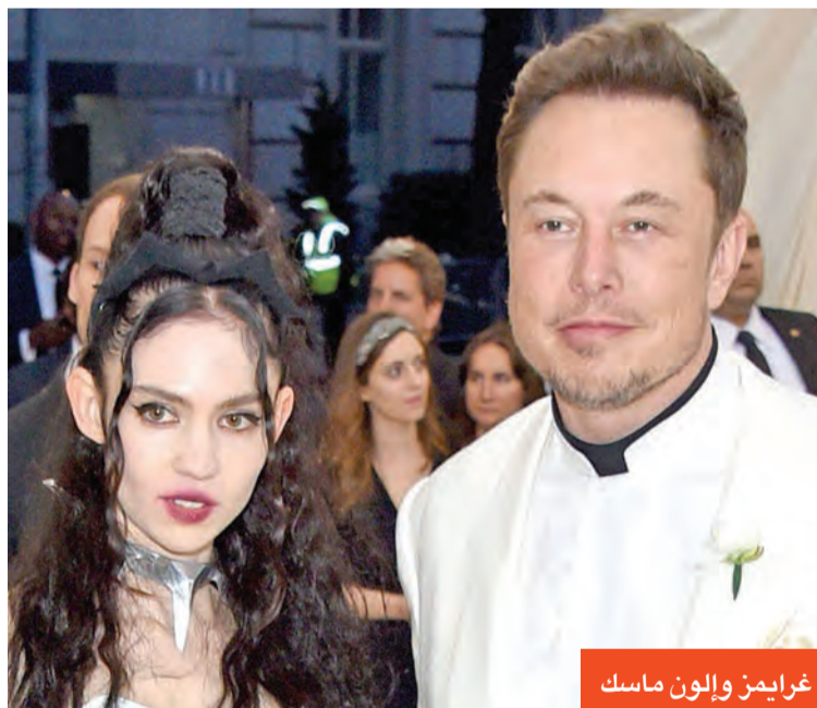
غرايمز وإلون ماسك

وجهت النجمة تايلور سويفت رسالة لإحدى الممرضات، تدعى ويتني هيلتون، التي تقوم كزملائها بمحاربة فيروس كورونا، عبّرت فيها سويفت عن امتنانها للممرضة. وكتبت تايلور: «أردت أن أرسل لك بعض الهدايا، وأخبرك بانني ممتنة جداً لك، ولا يمكنني أن أشكرك بما فيه الكفاية على المخاطرة بحياتك لمساعدة الناس». وتابعت: «أيضاً رأيت صورة لك من إحدى حفلاتي، شكراً لقدمك. وأود أن أحضنك في المرة القادمة وأشرك شخصياً... بكل الحب». جدير بالذكر، أن تايلور عبّرت أخيراً عن غضبها من شركة التسجيلات التي كانت تنتج أغانيها، ووصفت إصدار مجموعة من هذه الأغاني تعود لعام 2008، كانت مخصصة لبرنامج إذاعي، بأنه تصرف «وقح».