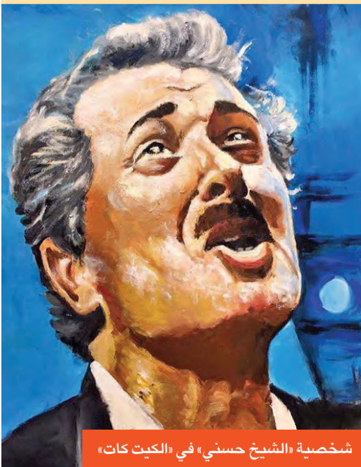
شخصية «الشيخ حسني» في «الكيت كات»

تحدث النجم محمود عبدالعزیز عن تجربته في الغناء عبر شاشة السينما، وقال في مقابلة صحافية: «لم أفكر يوماً أن أصبح مطرباً، أنا فقط مستمتع جيد، وقد آكون مؤدياً جيداً وأعشق الغناء الأصيل، ومن هنا اندهش الجميع لأدائي مجموعة الأغنيات الهابطة في فيلم (العار) مثل (يا حلو بانك ليبتك، والكيمي كيمي كا، وأه يا قفا)، كما أن العبارات التي رددتها مثل (بحبك يا سكموني مهما الناس لاموني) نالت شعبية كبيرة، ولا يزال الكثيرون يرددونها حتى اليوم».