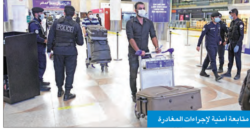
متابعة أمنية لإجراءات المغادرة