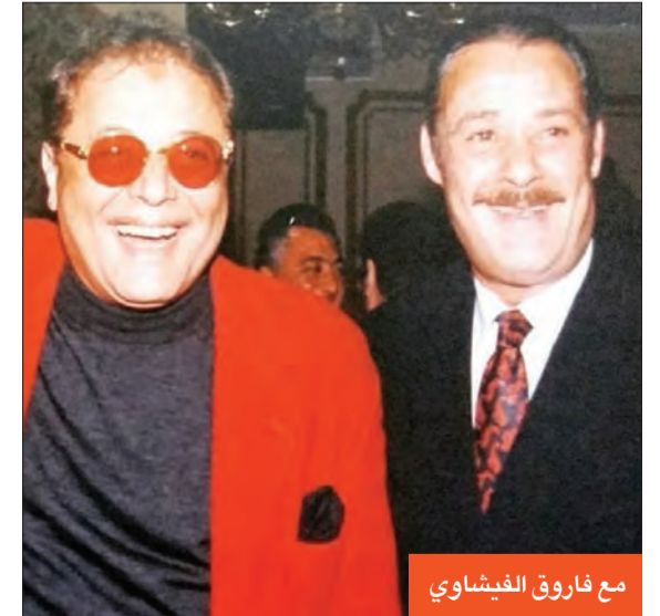
مع فاروق الفيشاوي