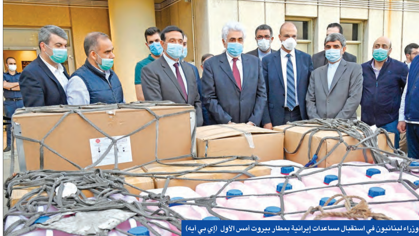
وزراء لبنانيون في استقبال مساعدات إيرانية بمطار بيروت أمس الأول

● غداة اعتراض نصرالله على قرار ألمانيا حظر «حزب الله» ● حتى: الحزب مكوّن أساسي