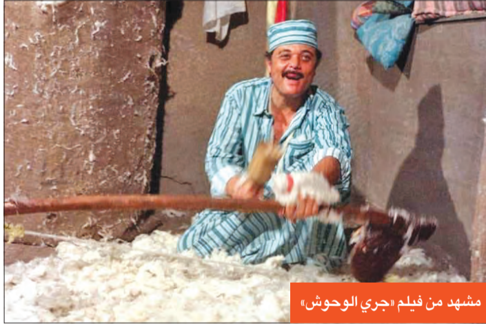
مشهد من فيلم «جري الوحوش»