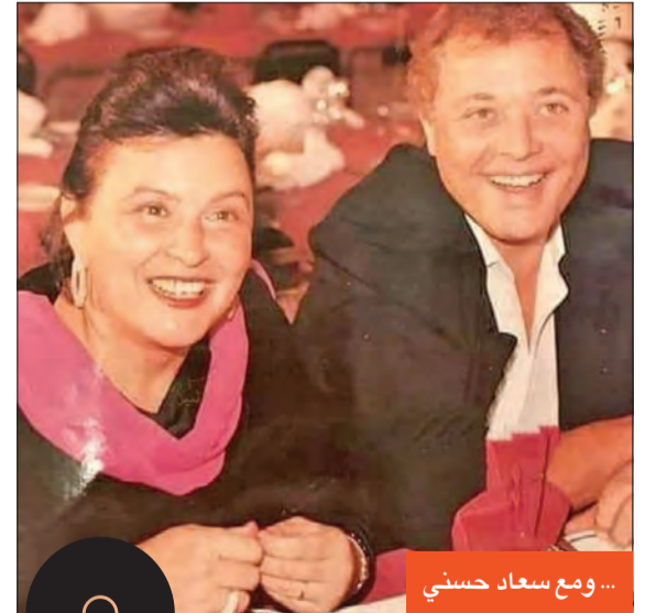
... ومع سعاد حسني

قبل رحيل الفنان محمود عبدالعزیز بأيام قليلة، نشرت الفنانة نادية الحندي عبر موقع التواصل الاجتماعي «إنستغرام» صورة أرشيفية تجمعها بالساحر، وكتبت نجمة الجماهير: «أتمنى الشفاء العاجل ودوام الصحة والعافية للنجم الكبير والصديق الغالي والأخ محمود عبدالعزیز، أشاركها في البدايات في مسلسل الدوامة، وعلمنا معاً فيلم وكالة البلح، وتمرّ هذه السنوات ولم يجمعنا سوى كل خير وصداقة واحترام، فنان بمعنى الكلمة، صادق ومخلص في شغله ولن يتكرر، قدّم أهم الأعمال في تاريخ السينما المصرية والعربية، كل يوم أدعو له في صلاتي، ربنا يكمل شغافه على خير، ويدي له (بعطيه) الصحة وطول العمر، ويمتعتنا بفته الجميل الرائع المحترم