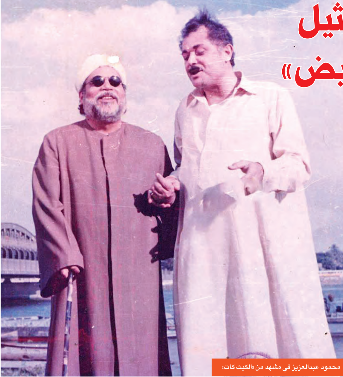
محمود عبدالعزیز في مشهد من «الكيت كات»

الساحر يتقمص شخصية عبدالحليم حافظ في فيلم «أيامنا الحلوة»