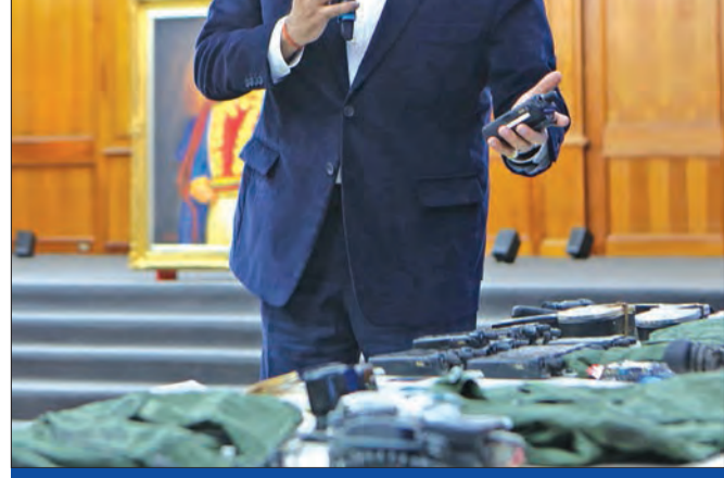
مادورو يعرض أجهزة وبطاقات يقول إنها تعود لمجموعة حاولت التسلل إلى البلاد

كراكاس تتهم واشنطن بالوقوف وراء تسلل بحري وجندي أميركي سابق يتبنى